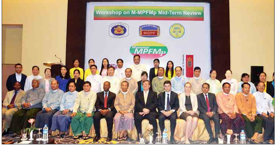
နှစ်ခွဲကာလအတွင်း အကောင်အထည်ဖော်ဆောင်ရွက်ခဲ့မှု အခြေအနေများ၊ ဖြစ်ပေါ်တိုးတက်မှုအခြေအနေများ၊ ကြုံတွေ့နေရသည့် စိန်ခေါ်မှုများနှင့်ပတ်သက်၍ သုံးသပ်ဆွေးနွေးရန်နှင့် ကျန်ရှိနေသည့် နှစ်ခွဲကာလတွင် ဆက်လက်ဆောင်ရွက်သွားမည့်လုပ်ငန်းများကို ပိုမိုထိရောက်အောင်မြင်နိုင်စေရေး အစီအစဉ်များချမှတ်ရေးဆွဲနိုင်ရန်အတွက် ရည်ရွယ်ကျင်းပခြင်းဖြစ်ကြောင်း သိရသည်။ (သတင်းစဉ်)

ဖွံ့ဖြိုးတိုးတက်ရေးစီမံကိန်း၊ စီမံကိန်းဒါရိုက်တာနှင့် အလုပ်အမှုဆောင်တို့က စီမံကိန်းအကောင်အထည်ဖော်နိုင်မှုအခြေအနေများနှင့် သက်တမ်းဝက်ကာလအတွင်း အကောင်အထည်ဖော် ဆောင်ရွက်နိုင်မှုအခြေအနေများအပေါ် ဆန်းစစ်သုံးသပ်ခြင်းမှ တွေ့ရှိချက်များကို ရှင်းလင်းတင်ပြကြသည်။