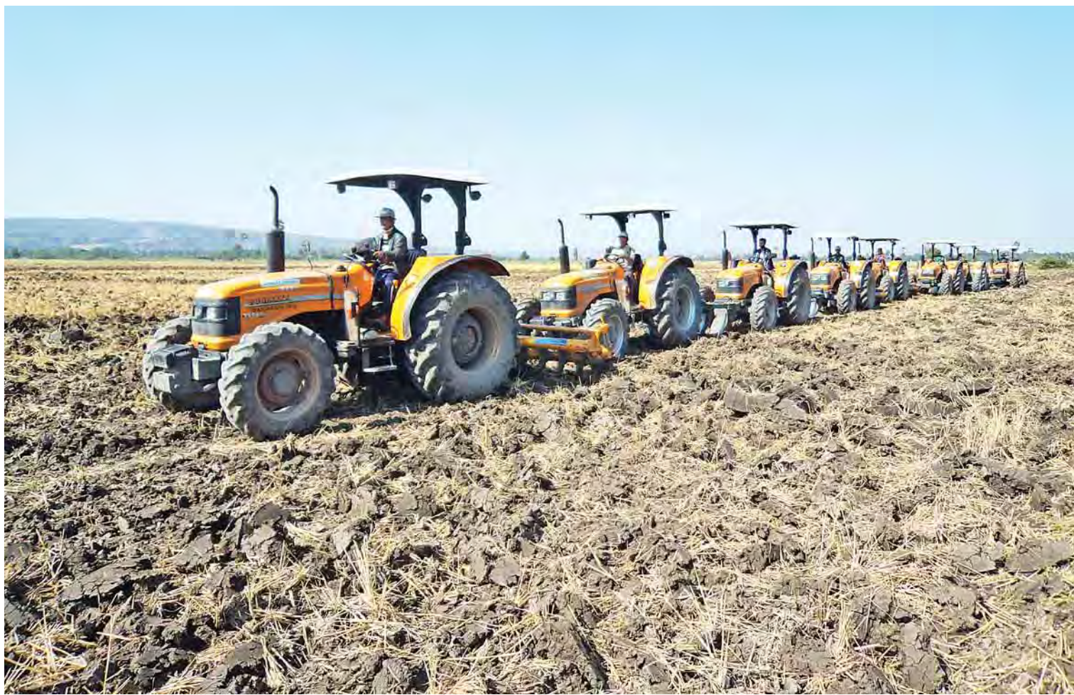
သမားရိုးကျ လက်မှုလယ်ယာစနစ်မှ စက်မှုလယ်ယာစနစ်သို့ ကူးပြောင်းရောက်ရှိရေး ဆောင်ရွက်လျက်ရှိသည်။

စစ်ကိုင်းတိုင်းဒေသကြီးအတွင်းရှိ အရာတော် (၂) နှင့် မြစ်ပေါက်မြစ်ရေတင်စီမံကိန်းများနှင့် တပ်ရွာမြစ်ရေတင်စီမံကိန်းလုပ်ငန်းကို ဒီဇယ်ဆီဖြင့် မြစ်ရေတင်ခြင်းစနစ်မှ လျှပ်စစ်မြစ်ရေတင်စနစ်သို့ အဆင့်မြှင့်တင်ခြင်း၊ မန္တလေးတိုင်းဒေသကြီးအတွင်းရှိ