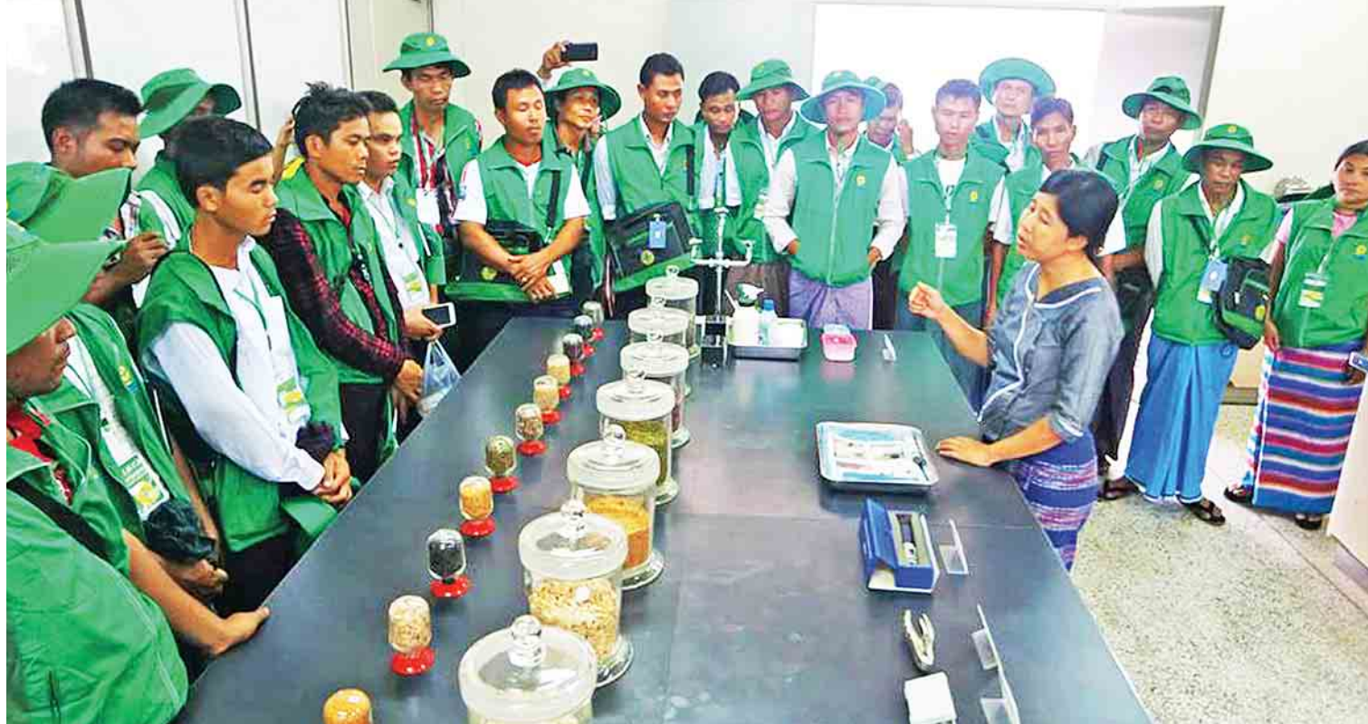
စိုက်ပျိုးရေးလုပ်ငန်းများ ဖွံ့ဖြိုးတိုးတက်စေရန် တောင်သူများအား အသိပညာပေးလုပ်ငန်းများကို ဆောင်ရွက်လျက်ရှိသည်။