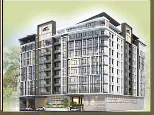
Location : No. 84 (E,G), Sayarsan Road, Bahan Township, Yangon.

Hot Line : 01-399479 09-73194475 09-73194476.