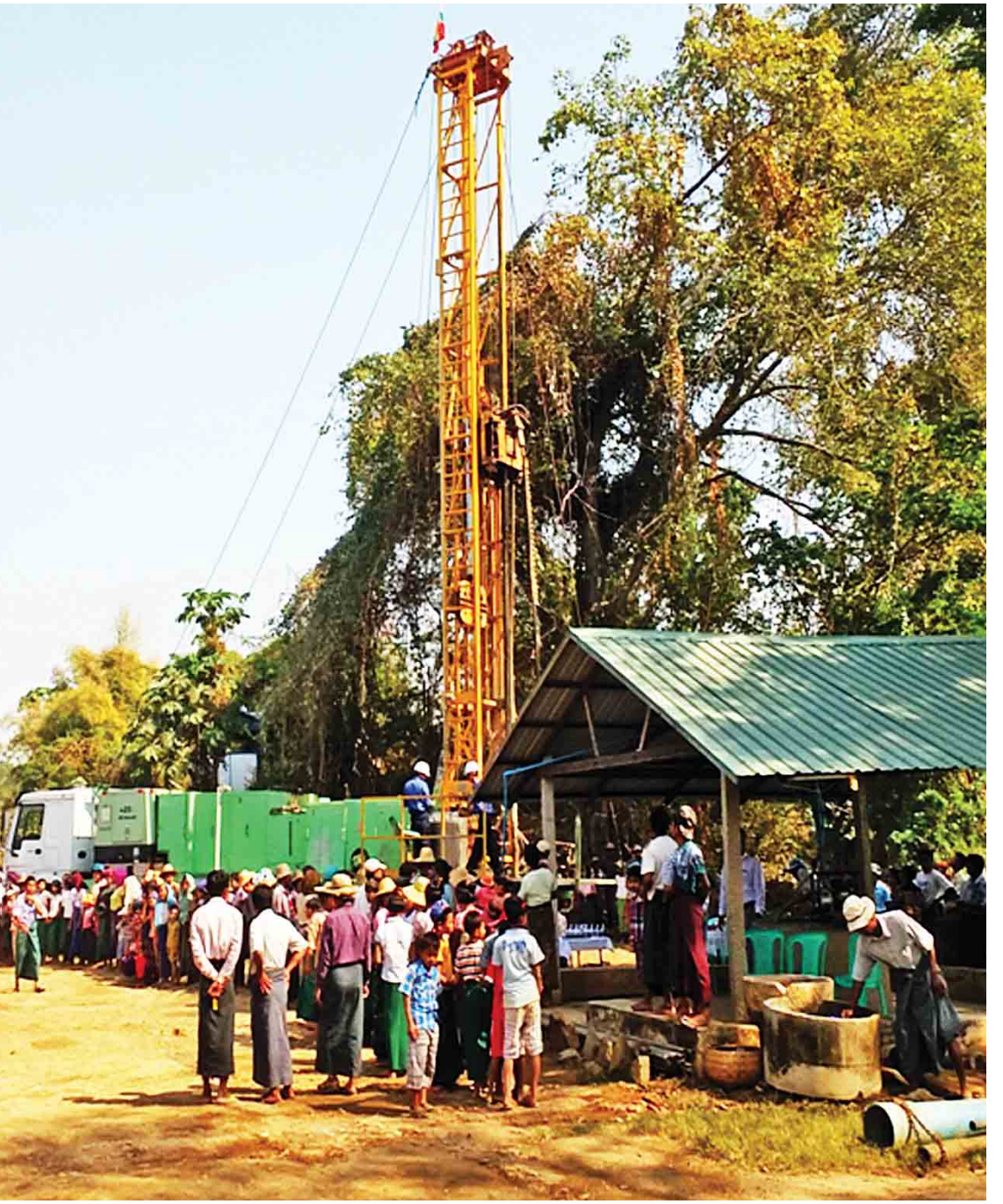
ကျေးလက်ရေရရှိရေးလုပ်ငန်းများအဖြစ် အပီစီတွင်းများကိုလည်း တူးဖော်ပေးလျက်ရှိသည်။

လက်ရှိပြဋ္ဌာန်းထားသော ဥပဒေ ၂၅ ခု ရှိပြီး ၁၆ ခုကို ပြင်ဆင်ရေးဆွဲဆောင်ရွက် လျက်ရှိသည်။ ဥပဒေတစ်ခုရေးဆွဲရာတွင် အချိန်ယူရေးဆွဲရပြီး အများအကျိုးမျှော်ကိုး ကာ ဘက်ပေါင်းစုံ၊ ထောင့်ပေါင်းစုံမှစစ်ပြီး ရေးဆွဲရသည်။ ရေးဆွဲပြီးဥပဒေများကိုလည်း တိတိကျကျ