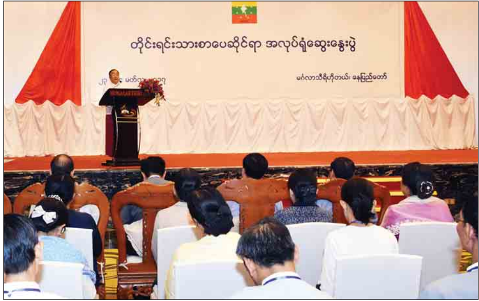
တိုင်းရင်းသားစာပေဆိုင်ရာ အလုပ်ရုံဆွေးနွေးပွဲ