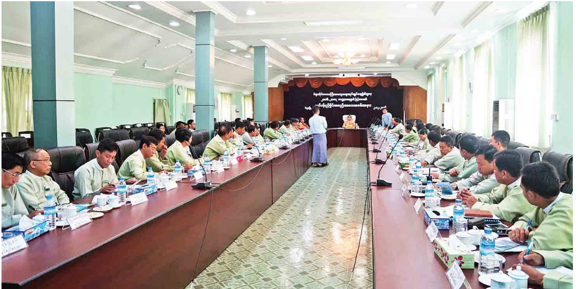
ပဲခူးတိုင်းဒေသကြီးဝန်ကြီးချုပ် ဦးဝင်းသိန်း တိုင်းဒေသကြီးအထွေထွေအုပ်ချုပ်ရေးဦးစီးဌာန လုပ်ငန်းညှိနှိုင်းအစည်းအဝေးသို့ တက်ရောက်စဉ်။

အုပ်ချုပ်ရေးမဏ္ဍိုင်၏ ပြုပြင်ပြောင်းလဲရေးအတွက် အခြေခံကျသော ရပ်ကွက်၊ ကျေးရွာအုပ်ချုပ်ရေးမှူးများအား စွမ်းဆောင်ရည်မြှင့်သင်တန်းများကို မြို့နယ်အသီးသီးတွင် ပို့ချနိုင်ခဲ့သည်။ ဒီမိုကရေစီနှင့်ပတ်သက်သော အလေ့အကျင့်များလိုက်နာကျင့်သုံးရန် ဒေသဖွံ့ဖြိုးရေးခရီးစဉ်များတွင်လည်းကောင်း၊ ဌာနဆိုင်ရာ အစည်းအဝေးများတွင်လည်းကောင်း ဆွေးနွေးပြောကြားနိုင်ခဲ့