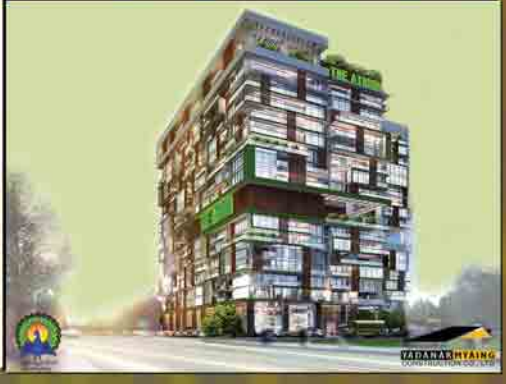
Location : No. (17-A), Corner of Upper Pansodan Road & Bo Min Kaung Street, Mingalar Taung Nyunt Township.