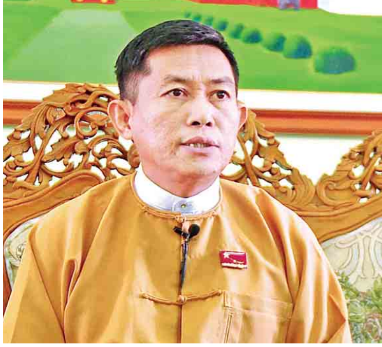
ပဲခူးတိုင်းဒေသကြီးဝန်ကြီးချုပ် ဦးဝင်းသိန်း။

ပဲခူးတိုင်းဒေသကြီးဝန်ကြီးချုပ် ဦးဝင်းသိန်းက “ဒေသအတွင်း အလုပ်အကိုင် အခွင့်အလမ်း တိုးပွားနိုင်ဖို့ ခရိုင်မြို့ကြီးဖြစ်တဲ့ ပဲခူးနဲ့ ပြည်ခရိုင်တို့အတွင်းမှာရှိတဲ့ စက်မှုဇုန်တွေမှာ ပြည်တွင်းနဲ့ နိုင်ငံတကာလုပ်ငန်းရှင်တွေအနေနဲ့ ရင်းနှီးမြှုပ်နှံရေးလုပ်ငန်းတွေ လည်ပတ်နိုင်ဖို့ ဆောင်ရွက်ပေးနိုင်ခဲ့ပါတယ်။ ဟံသာဝတီအပြည်ပြည်ဆိုင်ရာလေဆိပ်စီမံကိန်းကို ပြည်ထောင်စုအစိုးရအဖွဲ့နဲ့ ပဲခူးတိုင်းဒေသကြီး အစိုးရအဖွဲ့တို့ပူးပေါင်းပြီး စနစ်တကျ စီမံခန့်ခွဲလျက်ရှိပါတယ်။ အဲဒီလေဆိပ်ကြီး ပြီးစီးသွားရင် ပြည်သူတွေ အလုပ်အကိုင် အခွင့်အလမ်း ပိုမိုရရှိလာမှာဖြစ်ပါတယ်”ဟု