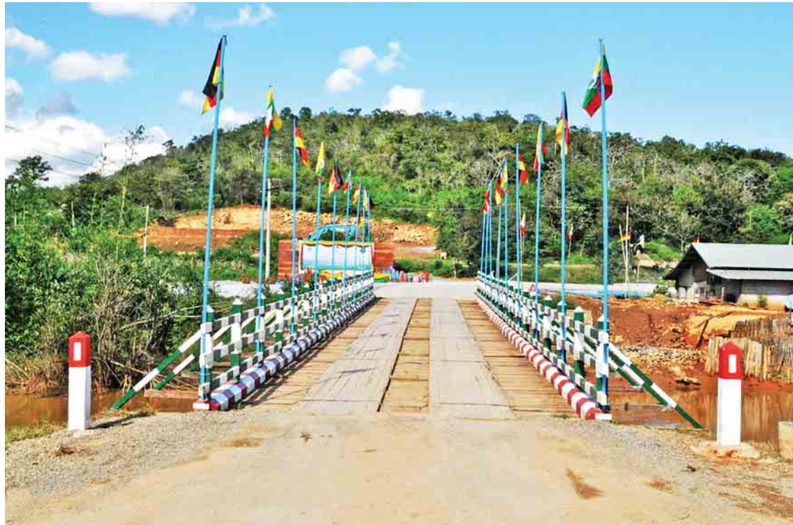
ကျေးရွာများဖွံ့ဖြိုးရေးအတွက် ကျေးလက်လမ်း၊ တံတားလုပ်ငန်းများကို ဆောင်ရွက်လျက်ရှိသည်။

ချက်ကို မျက်ခြည်မပြတ်စောင့်ကြည့်ပြီး နည်း ပညာအား၊ စက်မှုအား၊ ဉာဏအား၊ ဓနအား တို့ဖြင့် ပံ့ပိုးပြည့်ဆည်းပေးလျက်ရှိရာ တောင်သူ ဦးကြီးတို့ကလည်း ဟန်ချက်ညီညီ ကြိုးပမ်း ဆောင်ရွက်ခြင်းဖြင့် လာမည့်အနာဂတ်တွင် လယ်ယာကဏ္ဍ တစ်ခေတ်ဆန်းသစ်လာ တော့မည်ဖြစ်ပါကြောင်း ရေးသားလိုက်ရပါ သည်။ ။