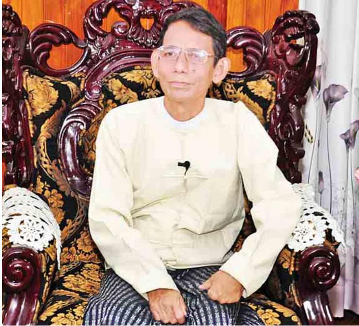
စိုက်ပျိုးရေး၊ မွေးမြူရေးနှင့် ဆည်မြောင်းဝန်ကြီးဌာန ပြည်ထောင်စုဝန်ကြီး ဒေါက်တာအောင်သူ

မြန်မာနိုင်ငံလူဦးရေ၏ ၇၀ ရာခိုင်နှုန်းသည် ကျေးလက်ဒေသတွင် နေထိုင်လျက်ရှိပြီး အဓိကစီးပွားရေးလုပ်ငန်းမှာ လယ်ယာ