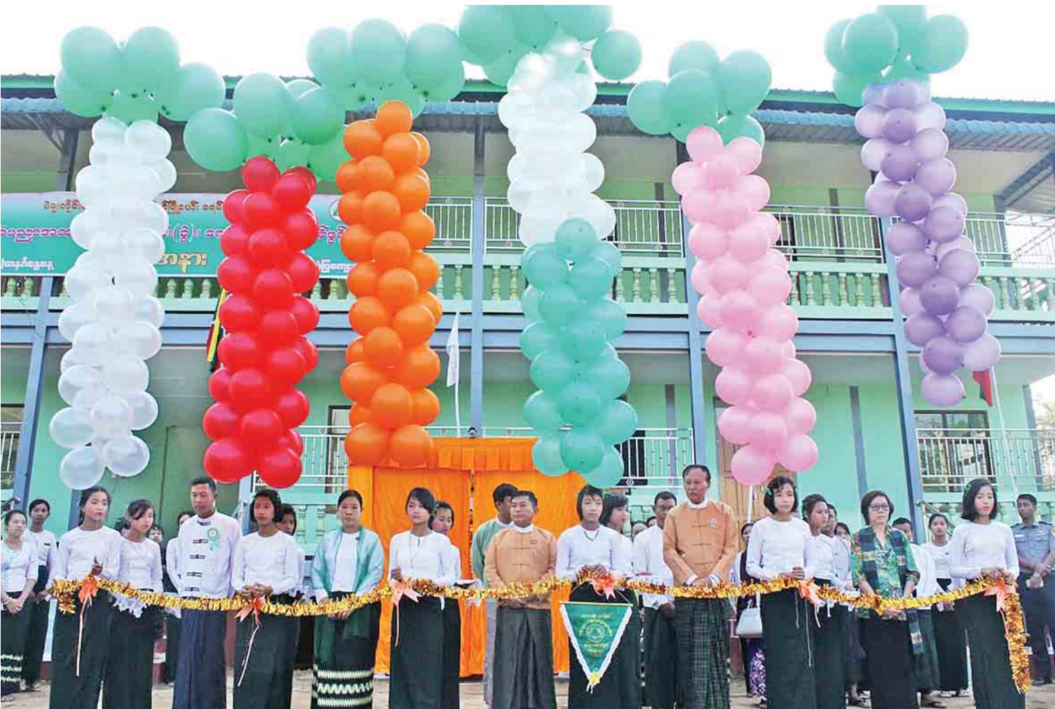
ပဲခူးတိုင်းဒေသကြီးအတွင်း ကျောင်းဆောင်သစ်ဖွင့်ပွဲအခမ်းအနား ကျင်းပစဉ်။

တောင်သူများအတွက် တရားမဝင် ပိုးသတ်ဆေး၊ မြေဆီမြေဩဇာများ ဖမ်းဆီးတားမြစ်ခြင်း၊ တောင်သူများအကျိုးအမြတ် ပေါ်လာရေးရည်မျှော်၍ ကိုယ်ပိုင်စိုက်ခင်းများအား မျိုးစေ့အဖြစ် သန့်စင်ပေး နိုင်ရေးအတွက် နည်းပညာ အထောက်အကူပြု ပစ္စည်းများဖြင့် တောင်သူ များကို အသိပညာပေး လုပ်ငန်းများ ထောက်ပံ့ ပေးခဲ့ပြီးဖြစ်