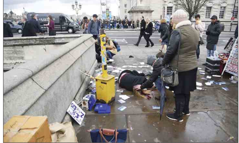
ဗြိတိန်နိုင်ငံ မြို့တော်လန်ဒန်၌ ဖြစ်ပွားခဲ့သော အကြမ်းဖက်တိုက်ခိုက်မှု၏ ဖြစ်ရပ်ပုံရိပ်။ ရိုက်တာ။

ယခုစစ်သုံးယာဉ်များ ထောက်ပံ့မှုသည် တောင်ကိုရီးယားနိုင်ငံမှ ကမ္ဘော ဒီးယားနိုင်ငံသို့ တတိယအကြိမ်မြောက်ဖြစ်ပြီး ယခုနှစ် ဇူလိုင်လတွင် စတုတ္ထ အကြိမ်အဖြစ် ထောက်ပံ့ပေးအပ်မှု ပြုပြီးမည်ဖြစ်ကြောင်း၊ စတုတ္ထအကြိမ် ထောက်ပံ့မှုတွင် စစ်သုံးထရပ်ကား ၁၃၄ စီး၊ အင်ဂျင်နီယာလုပ်ငန်းသုံးယာဉ် ရှစ်စီးနှင့် မြစ်တွင်းသွား ကင်းလှည့် ရေယာဉ်နှစ်စင်းတို့ ပါဝင်မည်ဖြစ်ကြောင်း သတင်းတွင် ဖော်ပြသည်။ ဆင်ဟွာ။