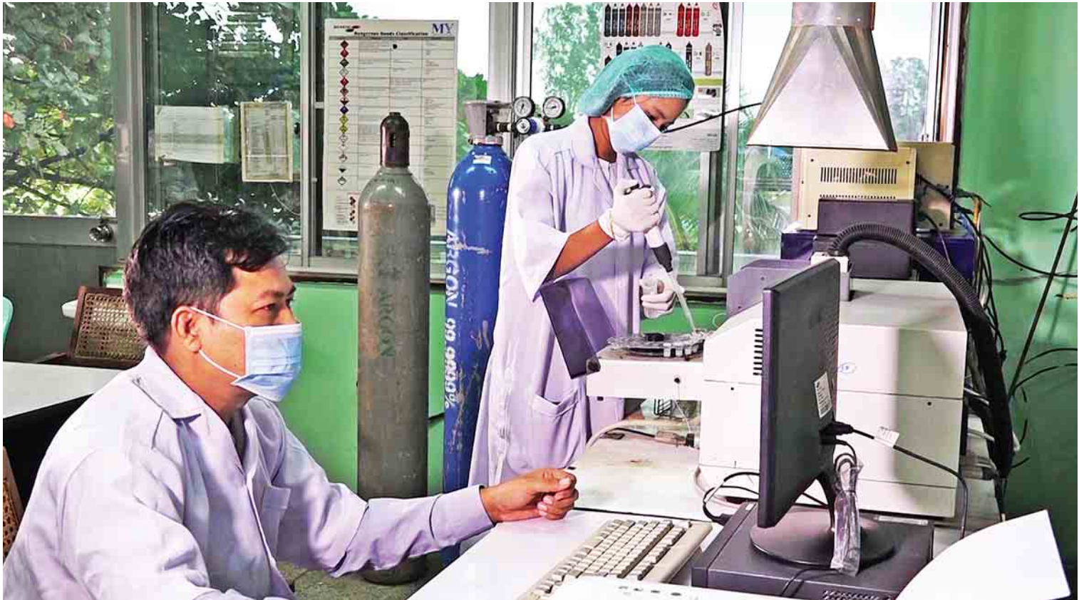
စိုက်ပျိုးရေး၊ မွေးမြူရေးလုပ်ငန်းများ ဖွံ့ဖြိုးတိုးတက်စေရန် ခေတ်မီဓာတ်ခွဲခန်းများအသုံးပြု၍ ဆောင်ရွက်လျက်ရှိသည်။

သရက်သီးနှံအပြင် အခြားသီးနှံ ၁၄ မျိုး ကိုလည်း GAP အသိအမှတ်ပြုလက်မှတ် ထုတ်ပေးနိုင်ရေးအတွက် စိုက်ပျိုးရေးဦးစီးဌာန က ကြိုးပမ်းဆောင်ရွက်လျက်ရှိသည်။