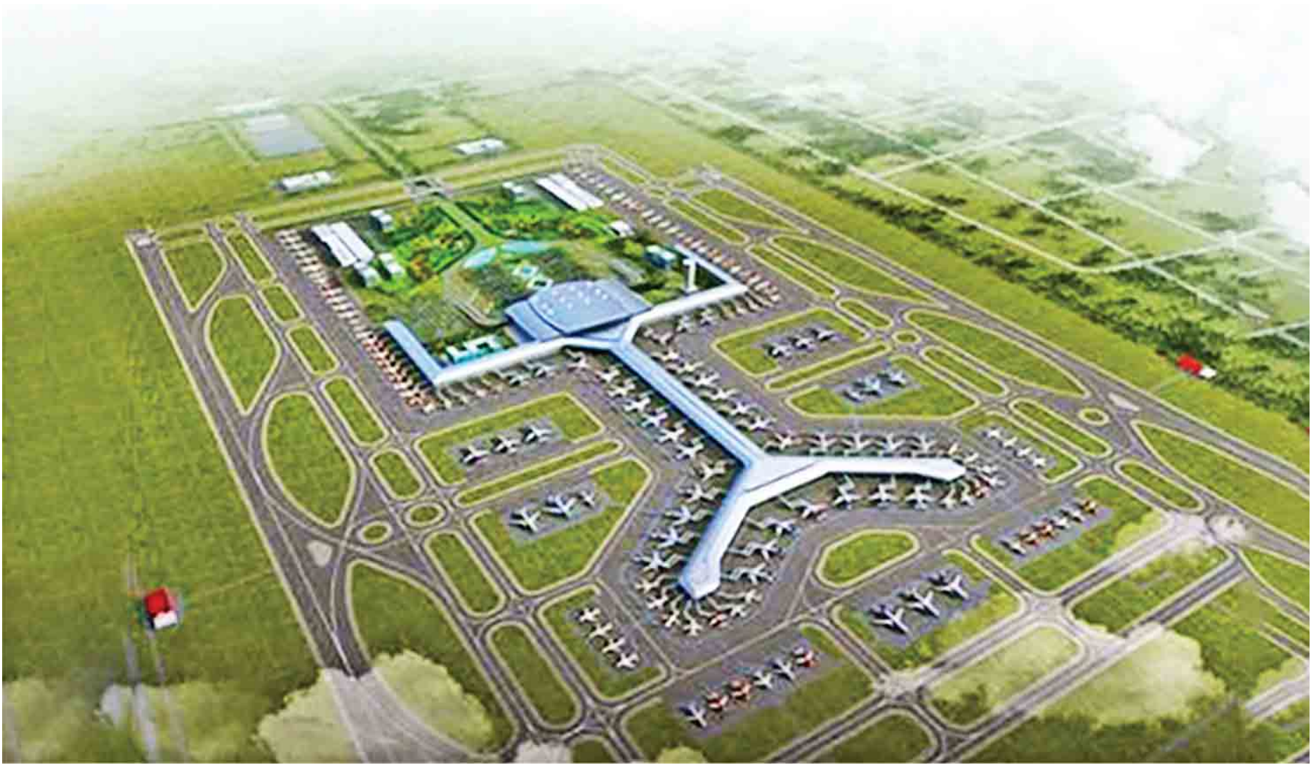
ဟံသာဝတီအပြည်ပြည်ဆိုင်ရာလေဆိပ် ပုံစံငယ်ကို တွေ့ရစဉ်။

ရွက်နေပြီဖြစ်သည်။ ပိုလျှံငွေ ကျပ် ၃၃၁၃၉ သန်း လုပ်ကွက်ငယ်တောင်သူများအား နိုင်ငံတကာအဖွဲ့အစည်းများမှ စိုက်ပျိုးရေးစနစ် ဘဏ္ဍာငွေနှင့် ဈေးကွက်ခိုင်မာရေးကိစ္စများ ဆက်သွယ်ဆောင်ရွက်နေပြီဖြစ်သည်။ စိုက်ပျိုးရေး၊ မွေးမြူရေးအနေဖြင့် အသုံးစရိတ်များကို အထူးကဏ္ဍ (၈) သို့ >>>