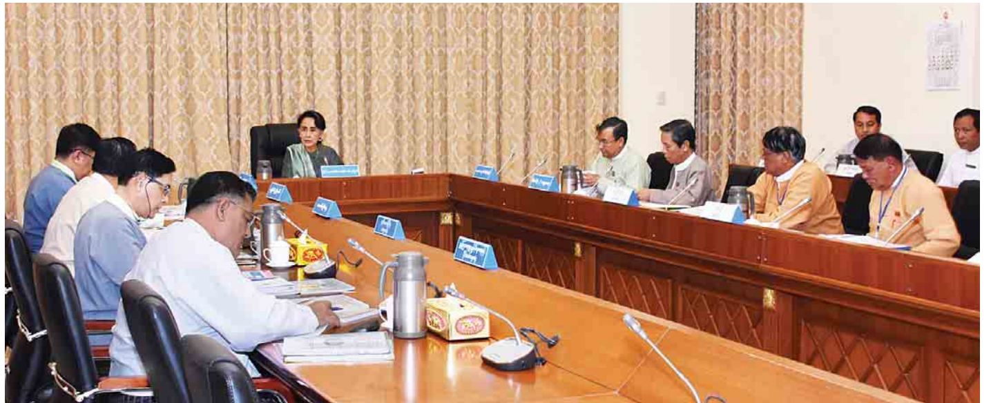
စစ်ကိုင်းတိုင်းဒေသကြီးအတွင်း အသေးစားရေအားလျှပ်စစ်ဓာတ်အား ထုတ်လုပ်မည့်စီမံကိန်း အကောင်အထည်ဖော်ဆောင်ရွက်ရန်နှင့် လမ်းပန်းဆက်သွယ်ရေးဆိုင်ရာများနှင့်စပ်လျဉ်းသည့် ညှိနှိုင်းအစည်းအဝေးတွင် နိုင်ငံတော်၏အတိုင်ပင်ခံပုဂ္ဂိုလ် ဒေါ်အောင်ဆန်းစုကြည် အမှာစကားပြောကြားစဉ်။

ရှေးဦးစွာ နိုင်ငံတော်၏အတိုင်ပင်ခံပုဂ္ဂိုလ် ဒေါ်အောင်ဆန်းစုကြည်က စစ်ကိုင်းတိုင်းဒေသကြီးအတွင်း စာမျက်နှာ ၃ ကော်လံ ၁ သို့