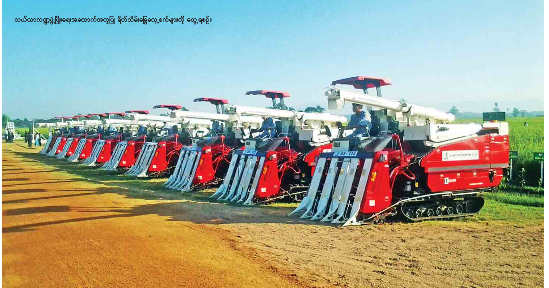
လယ်ယာကဏ္ဍဖွံ့ဖြိုးရေးအထောက်အကူပြု ရိတ်သိမ်းခြွေလှေ့စက်များကို တွေ့ရစဉ်။