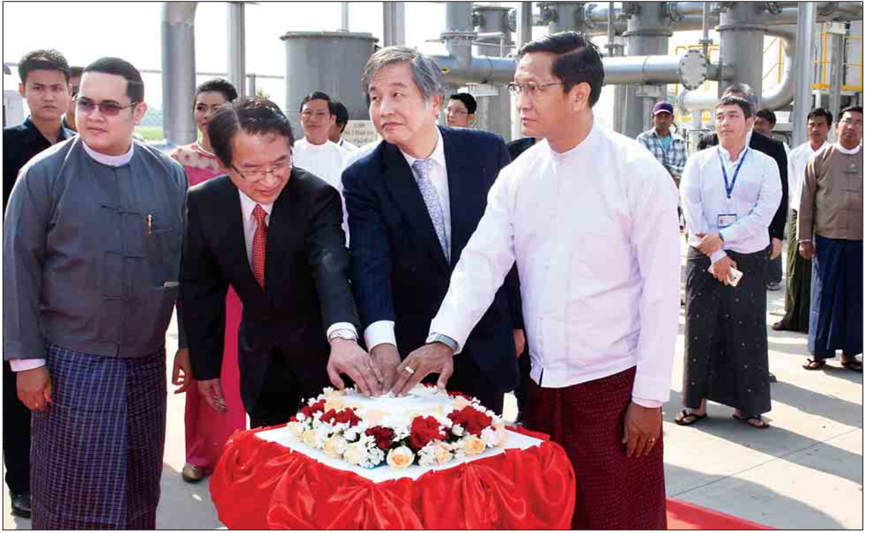
ပျဉ်းမနားမြို့နယ် မယ်လီကုန်းကျေးရွာရှိ မြန်မာနိုင်ငံလယ်ယာစီးပွားရေးအများပိုင်ကော်ပိုရေးရှင်းလီမိတက် ဝင်းအတွင်း၌ စပါးခွဲလောင်စာသုံး လျှပ်စစ်ဓာတ်အားပေးစက်ရုံကို ဒုတိယသမ္မတ ဦးဟင်နရီဗန်ထီးယူ တက်ရောက် ဖွင့်လှစ်ပေးစဉ်။

ယင်းနောက် ဒုတိယသမ္မတနှင့် တာဝန်ရှိသူများက စပါးခွဲလောင်စာသုံး