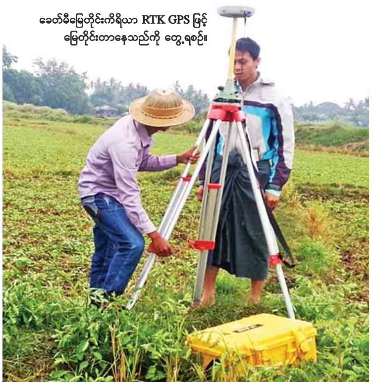
ခေတ်မီမြေတိုင်းကိရိယာ RTK GPS ဖြင့် မြေတိုင်းတာနေသည်ကို တွေ့ရစဉ်။