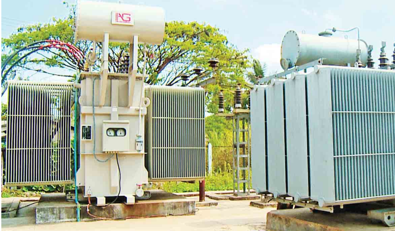
လျှပ်စစ်ဓာတ်အားဖြန့်ဖြူးရေးလုပ်ငန်းများအတွက် ထရန်စဖော်မာများ တပ်ဆင်ပေးခဲ့သည်။

တောင်ငူမြို့ ပညာရေးကောလိပ်မှာ အောင် မြင်စွာ ကျင်းပနိုင်ခဲ့ပါတယ်”ဟု ပြောသည်။ “ကျွန်တော်တို့တိုင်းဒေသကြီးအစိုးရအနေ နဲ့ ပြည်သူ့အတွက် ပထမတစ်နှစ်တာကာလ အတွင်းမှာ အုပ်ချုပ်ရေး၊ တရားဥပဒေစိုးမိုးရေး၊ ဥပဒေပြုရေးနဲ့ လုပ်ထုံးလုပ်နည်းများ ဖြေလျှော့ ပေးတာ၊ လူမှုစီးပွားဘဝဖြေလျှော့ပေးတာတွေ ကို အကောင်းဆုံးဆောင်ရွက်ပေးနိုင်ခဲ့ပါ တယ်။ ဒါ့အပြင် တွေ့ကြုံခဲ့ရတဲ့အခက်အခဲ၊ အားနည်းချက်တွေကို သင်ခန်းစာယူပြီး လာမယ့် နှစ်တွေမှာ ပြည်သူ့အတွက် ပိုမိုအကျိုးပြုနိုင်ဖို့ ဆက်လက်ဆောင်ရွက်ပေးသွားမှာ ဖြစ်ပါ တယ်”ဟု ပဲခူးတိုင်းဒေသ ကြီးဝန်ကြီးချုပ်က ပြောကြားခဲ့ပါကြောင်း ရေးသားတင်ပြလိုက် ရပါသည်။ ။