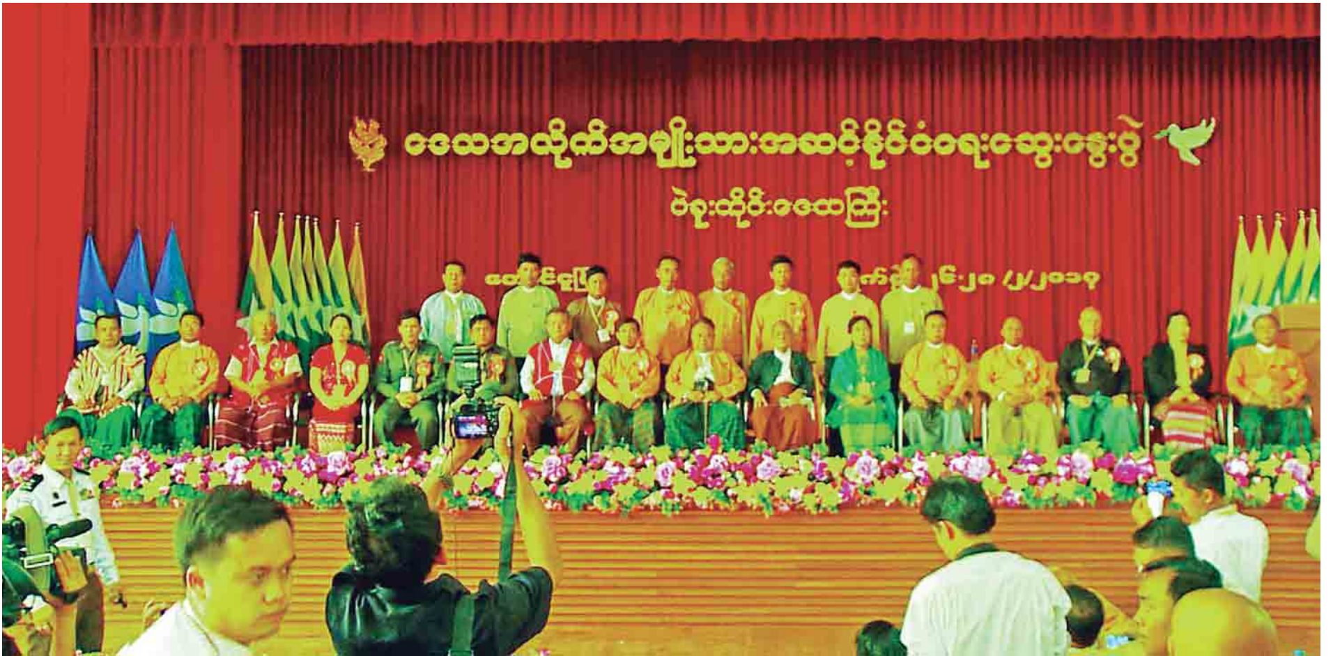
ပြည်ထောင်စုငြိမ်းချမ်းရေးညီလာခံ-(၂၁) ရာစု ပင်လုံသို့ တင်ပြနိုင်ရန် ဒေသအလိုက် အမျိုးသားအဆင့်နိုင်ငံရေးဆွေးနွေးပွဲကို ပဲခူးတိုင်းဒေသကြီး တောင်ငူမြို့တွင် ကျင်းပနိုင်ခဲ့သည်။