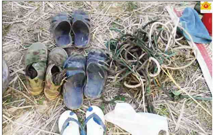
တင်းမကျေးရွာအနီး အကြမ်းဖက်သင်တန်းလေ့ကျင့်သူများ၏ အသုံးအဆောင်ပစ္စည်းများ။