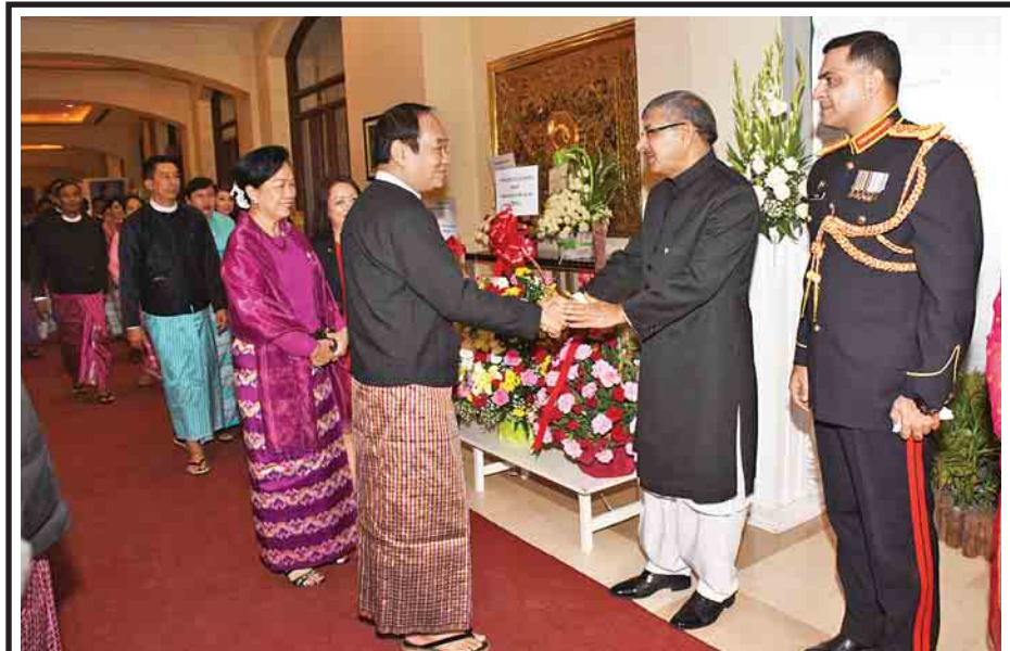
မတ် ၂၃ ရက်က မြန်မာနိုင်ငံဆိုင်ရာ ပါကစ္စတန်နိုင်ငံ၏ အမျိုးသားနေ့အထိမ်းအမှတ်ဧည့်ခံပွဲအခမ်း အနား တက်ရောက်လာသည့် ကျန်းမာရေးနှင့် အားကစားဝန်ကြီးဌာန ပြည်ထောင်စုဝန်ကြီး ဒေါက်တာမြင့်ထွေးနှင့် ဇနီး ဒေါက်တာဒေါ်နန်းခမ်းမိုင်တို့အား မြန်မာနိုင်ငံဆိုင်ရာ ပါကစ္စတန်နိုင်ငံ သံအမတ်ကြီး H.E.Mr. Ehsan Ullah Batth ကြိုဆို နှုတ်ဆက်စဉ်။ (သတင်းစဉ်)