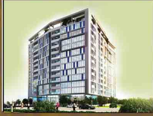
Location : No. 37, U Tun Myat Road, Tamwe Township, Yangon.