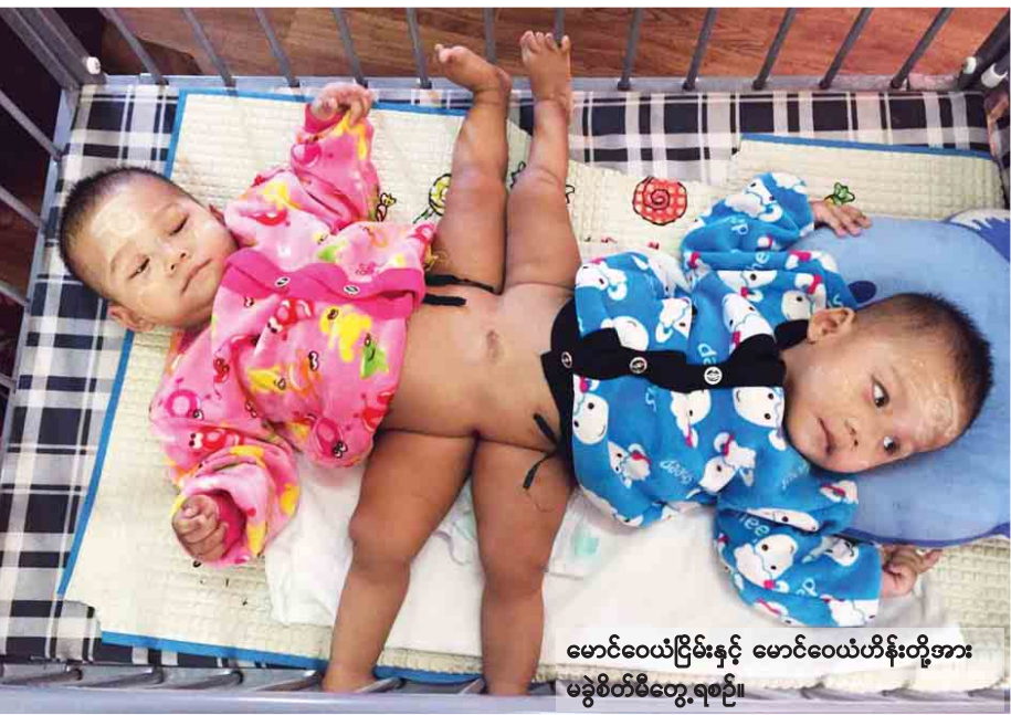
မောင်ဝေယံငြိမ်းနှင့် မောင်ဝေယံဟိန်းတို့အား မခွဲစိတ်မီတွေ့ရစဉ်။