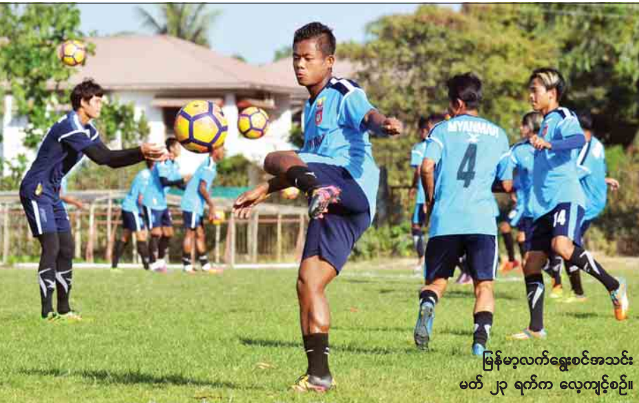
မြန်မာ့လက်ရွေးစင်အသင်း မတ် ၂၃ ရက်က လေ့ကျင့်စဉ်။

မောင်တောခရိုင်အတွင်း အကြမ်းဖက်စီးနင်းတိုက်ခိုက်မှုပြုလုပ်ရန် ထပ်မံကြံစည်မှုအား ဖော်ထုတ်တားဆီးနိုင်ခဲ့ကြောင်း သိရသည်။ စာမျက်နှာ ၁၁ ကော်လံ ၁ သို့