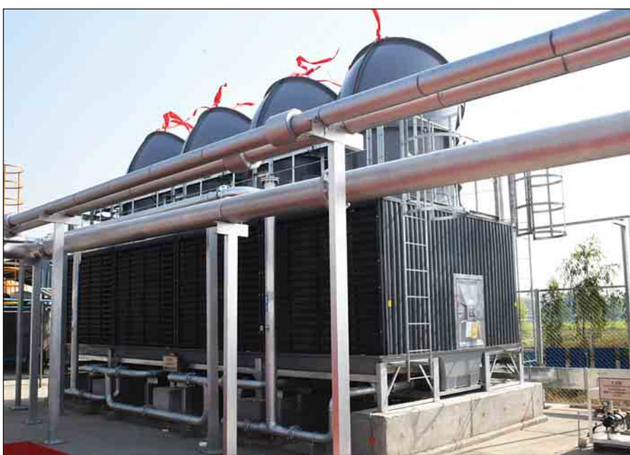
ပျဉ်းမနားမြို့နယ် မယ်ဇလီကုန်းကျေးရွာရှိ မြန်မာနိုင်ငံလယ်ယာစီးပွားရေးအများပိုင်ကော်ပိုရေးရှင်းလီမိတက် ဝင်းအတွင်း၌ မတ် ၂၃ ရက်တွင် ဖွင့်လှစ်လိုက်သည့် စပါးခွံလောင်စာသုံး လျှပ်စစ်ဓာတ်အားပေးစက်ရုံကို တွေ့ရစဉ်။

စပါးခွံလျှပ်စစ်ဓာတ်အားပေးစက်ရုံများကို ဆန်စက်ရုံရာဒေသများတွင် တည်ဆောက်နိုင်ပါက ကျေးလက်လျှပ်စစ်မီးရရှိလာနိုင် ရောဝတီ၊ ပဲခူး၊ စစ်ကိုင်းနှင့် ရန်ကုန်တိုင်းဒေသကြီးတို့တွင်လည်း စပါးခွံလျှပ်စစ်ဓာတ်အားပေးစက်ရုံများ တိုးချဲ့ရေးစီစဉ် သတင်း စာမျက်နှာ >> ၉