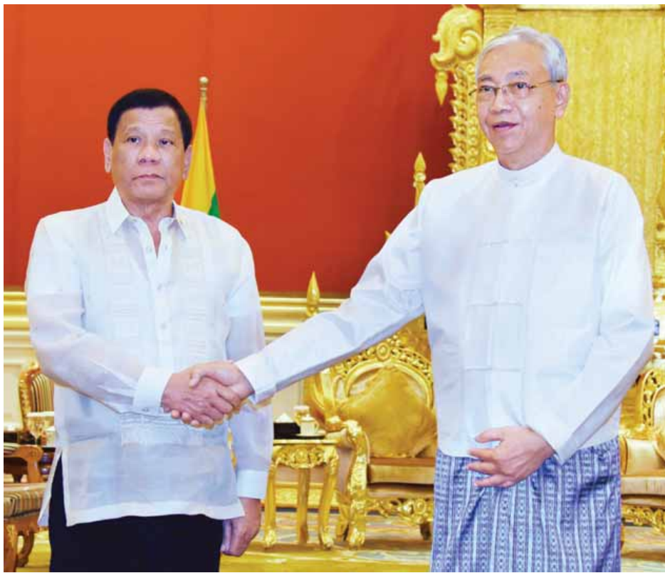
နိုင်ငံတော်သမ္မတ ဦးထင်ကျော် ဖိလစ်ပိုင်သမ္မတ မစ္စတာ ရီဒရိုရိုဝါ ဒူတာတေးအား ရင်းနှီးနှီးနှီးနှုတ်ဆက်စဉ်။

မြန်မာနိုင်ငံသည် ဖိလစ်ပိုင်နိုင်ငံနှင့် ဆက်ဆံရေးအပေါ် အမြဲတမ်း အလေးအနက်ထားရှိပါကြောင်း၊ ယမန်နှစ်က နှစ်နိုင်ငံစလုံးသည် နှစ် (၆၀)မြောက် သံတမန်ဆက်ဆံရေး