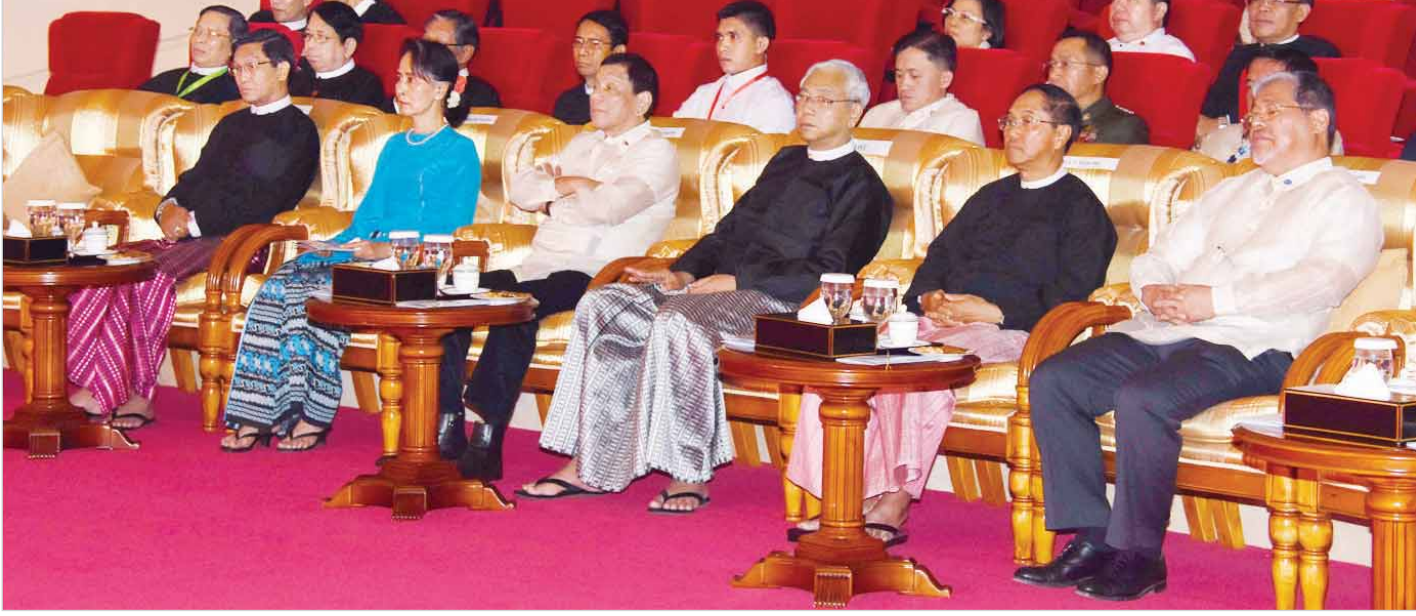
နိုင်ငံတော်သမ္မတ ဦးထင်ကျော်၊ နိုင်ငံတော်၏အတိုင်ပင်ခံပုဂ္ဂိုလ် ဒေါ်အောင်ဆန်းစုကြည်၊ ဒုတိယသမ္မတ ဦးမြင့်ဆွေ၊ ဒုတိယသမ္မတ ဦးဟင်နရီပန်ထီးယူနှင့် ဖိလစ်ပိုင်သမ္မတ မစ္စတာ ရီဒရို ရိုဝါ ဒူတာတေးတို့က အနုပညာရှင်များ၏ဖျော်ဖြေတင်ဆက်မှုကို ကြည့်ရှုအားပေးကြစဉ်။ (သတင်းစဉ်)