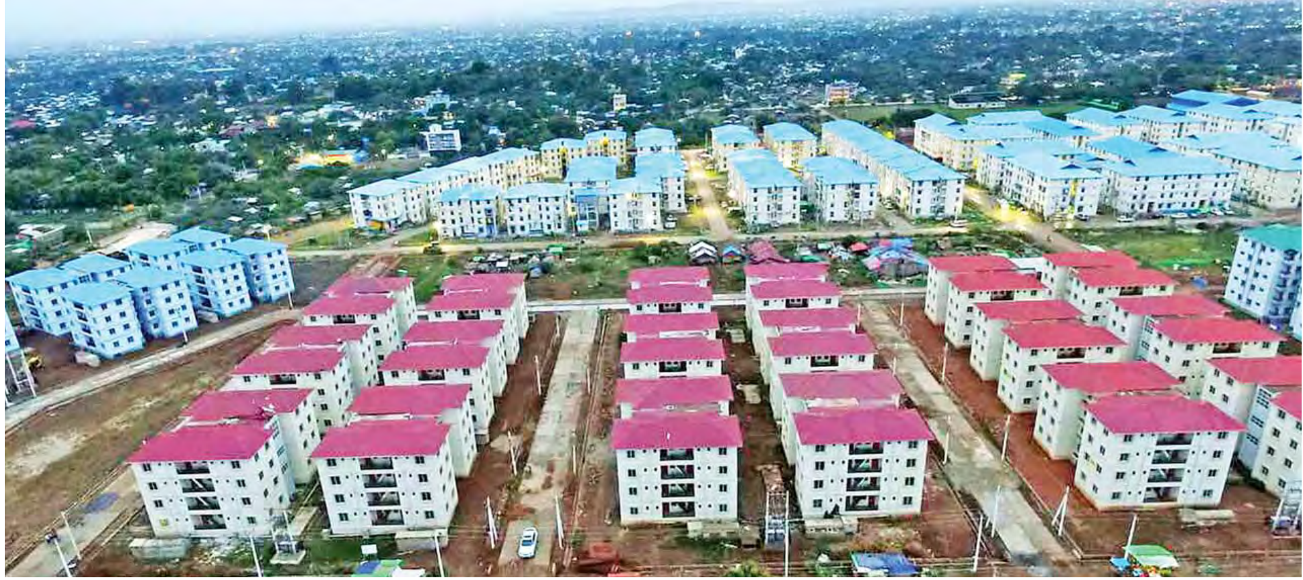
ပြည်သူများ အဆင့်အတန်းမီနေထိုင်နိုင်ရေးအတွက် မန္တလေးမြို့ရှိ မြရည်နန္ဒာအိမ်ရာ တည်ဆောက်ထားရှိမှုကို တွေ့ရစဉ်။

လုပ်ခတ်မှုကြောင့် ပုဂံရှေးဟောင်းယဉ်ကျေးမှု နယ်မြေရှိ စေတီပုထိုးအချို့ ပျက်စီးယိုယွင်းခဲ့ ပြီး အဆောက်အအုံဦးစီးဌာနနဲ့ လမ်းတံတား ဦးစီးဌာနက အဓိကဘုရားတွေဖြစ်တဲ့ စူဠာမဏိ ဘုရား၊ ပြာသာဒ်ကြီးဘုရား၊ တရုတ်ပြေးဘုရား၊ ဝက်ကြီးအင်း၊ ဂူပြောက်ကြီးဘုရား၊ စေတနာ ကြီးဘုရားနဲ့ ဗူးလည်သီးဘုရားတို့ကို မိုးကာ ပုံးအုပ်နိုင်ရေး ချက်ချင်းဆောင်ရွက်ခဲ့ပါတယ်။ အခု အဆောက်အအုံဦးစီးဌာနကနေ အဆောက် အအုံအထူးအဖွဲ့အသစ်တစ်ခုကို ဖွဲ့စည်း တာဝန်ပေးပြီး ပြုပြင်ထိန်းသိမ်းခြင်းလုပ်ငန်း တွေ ဆောင်ရွက်လျက်ရှိပါတယ်။ ဒါ့အပြင် အဆောက်အအုံဦးစီးဌာနအနေ နဲ့ ၂၀၁၆-၂၀၁၇ ဘဏ္ဍာနှစ်တွင် ဗဟိုအဆင့် အစိုးရအဖွဲ့တွေ၊ ကျန်းမာရေးနဲ့ အားကစား ဝန်ကြီးဌာန၊ ပညာရေးဝန်ကြီးဌာနနဲ့ အခြား ဝန်ကြီးဌာနတွေ စုစုပေါင်း ၁၃ ဖွဲ့က အပ်နှံတဲ့ အထူးကဏ္ဍ (ဃ) သို့ >>>