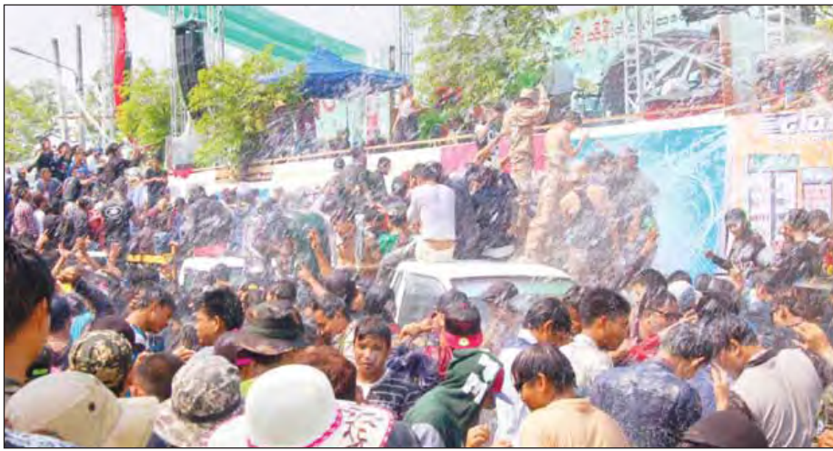
ယခင်နှစ်က မန္တလေးကျေးပတ်လည်ရှိ သင်္ကြန်မဏ္ဍပ်၌ ရေကစားနေကြသည့် မြင်ကွင်း။