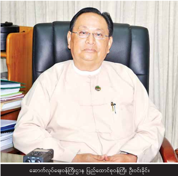
ဆောက်လုပ်ရေးဝန်ကြီးဌာန ပြည်ထောင်စုဝန်ကြီး ဦးဝင်းခိုင်။

ဖြေ။ ။ ၂၀၁၀ ခုနှစ်မှာ လက်ရှိ ၄၂၁၂ ကီလိုမီတာရှိ လမ်းတွေကို ASEAN Class III (၁၈ ပေအကျယ် ကတ္တရာလမ်း/ကွန်ကရစ် လမ်း)အဆင့်အနည်းဆုံးရောက်ရှိရေး၊ ၂၀၃၀ ခုနှစ်တွင် တံတားများအားလုံး ၂၄ ပေအကျယ် နှစ်လမ်းသွား RC တံတား/PCတံတား/ သံပေါင်တံတားအဆင့် အနည်းဆုံးရောက်ရှိ