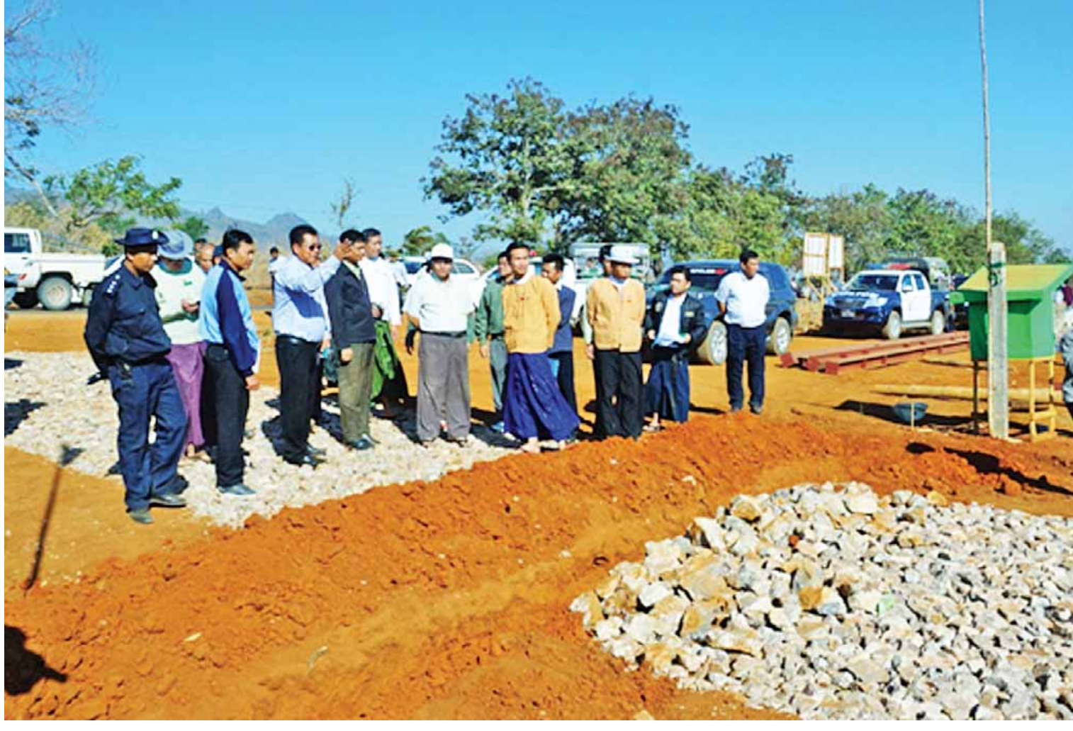
ကယားပြည်နယ်ဝန်ကြီးချုပ် ဦးအယ်လ်ဖောင်းရှိနှင့်အဖွဲ့ဝင်များ ထီးကလုဒေါ-ဆိုလျားကုရွာ(၂/၁. ၅)မိုင် ကျောက်ချောလမ်းခင်းခြင်းလုပ်ငန်း ဆောင်ရွက်နေမှုအား ကြည့်ရှုစစ်ဆေးစဉ်။

အခွင့်အလမ်းဆိုင်ရာ တွေ့ဆုံဆွေးနွေးပွဲများ ကျင်းပနိုင်ခဲ့ပြီး ဒေသတွင်းကုမ္ပဏီများနှင့် ချိတ်ဆက်၍ အလုပ်အကိုင်အခွင့်အလမ်းများ ရှာဖွေပေးနိုင်ခဲ့သည်။ လှိုင်ကော်မြို့ရှိ ပြည်နယ်ပြည်သူ့ဆေးရုံ ကြီးကို ခုတင်(၅၀၀)ဆုံ အထွေထွေရောဂါကု ဆေးရုံကြီးသို့ တိုးမြှင့်ဖွင့်လှစ်ခဲ့ပြီး ဂျပန်အစိုးရ ၏ အထောက်အပံ့ဖြင့် ဆေးရုံအဆောက်အအုံ သစ် ဆောက်လုပ်ခြင်းနှင့် ဆေးရုံသုံးပစ္စည်း များ ဖြည့်ဆည်းပေးခြင်းကို ဂျပန်ယန်းငွေသန်း ၁၉၀၀ ကျော်ဖြင့် ဆောင်ရွက်ပြီးစီးခဲ့သည်။ အထူးကဏ္ဍ (ဆ) သို့ >>>