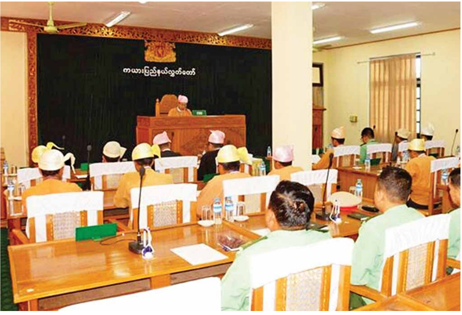
ကယားပြည်နယ်လွှတ်တော်အစည်းအဝေးသို့ ပြည်နယ်အစိုးရအဖွဲ့ဝင်များ တက်ရောက်ဆွေးနွေးစဉ်။

မြို့နယ်အတွင်း ရပ်ရွာအခြေပြုခရီးသွား လုပ်ငန်းဆောင်ရွက်နေသော တန်းလာလဲ၊ ပန်ပက်၊ ဒေါကလော်ခူ၊ ငွေတောင်ကျေးရွာ နှင့် နယ်စပ်လမ်းကြောင်းဖွင့်လှစ်ခဲ့ပြီးဖြစ်၍ ဘောလခဲမြို့၊ ဖားဆောင်းမြို့နှင့် မယ်စုံမြို့များ မှ မြို့ပေါ်ရပ်ကွက်များကို နိုင်ငံခြားသားများ သွားလာနိုင်ရန် ကန့်သတ်နယ်မြေမှ ပြေလျော့ ပေးနိုင်ရေး ဆောင်ရွက်လျက်ရှိသည်။