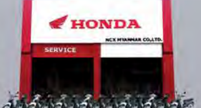
လက်ခံ၊ သင့်အထောက်အကူပြုနိုင်မည့် ဝန်ဆောင်မှုတစ်ခု