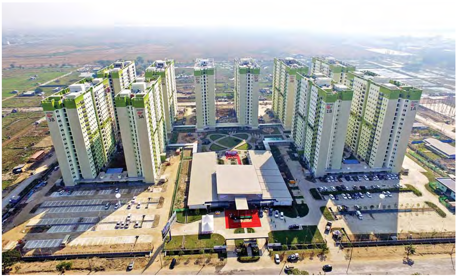
ရန်ကုန်မြို့ ဒဂုံဆိပ်ကမ်းမြို့နယ် ရောဝတီ-ရတနာအိမ်ရာစီမံကိန်းရှိ ရတနာနှင့်ဆီအဆင့်မြင့်အိမ်ရာကို တွေ့ရစဉ်။

အတွင်း တစ်နိုင်ငံလုံးအတိုင်းအတာအနေနဲ့ စုစုပေါင်း AC လမ်း ၁၀၂ မိုင် ၆ ဖာလုံကို ခင်းပေးနိုင်ခဲ့ပြီး နှစ်စဉ် AC လမ်းတွေခင်းနိုင် ရေးကိုလည်း ဆက်လက်ဆောင်ရွက်သွားမှာ ဖြစ်ပါတယ်။ ၂၀၁၆ ခုနှစ် ဇူလိုင်လနဲ့ ဩဂုတ် လအတွင်း မိုးသည်ထန်စွာရွာသွန်းပြီး ထူးကဲ ရေကြီးရေလျှံမှုများကြောင့် တိုင်းဒေသကြီးနဲ့ ပြည်နယ်ရှစ်ခုမှာ ပျက်စီးခဲ့တဲ့ တံတား ၁၂ စင်းကို လမ်းပန်းဆက်သွယ်မှု မပြတ်တောက် စေဖို့ ယာယီတံတားတွေ ဆောင်ရွက်ခဲ့ပြီး ပြည်ထောင်စုသီးသန့်ရန်ပုံငွေနဲ့ သံကွန်ကရစ် တံတားတွေကို မတ်လအတွင်း ပြန်လည်တည် ဆောက်ခဲ့ပါတယ်။ တိုင်းဒေသကြီးနဲ့ ပြည်နယ် တွေအတွင်းမှာရှိတဲ့ လမ်း/တံတားတွေ အဆင့် မြှင့်တင် တည်ဆောက်ခဲ့တာကြောင့် ပြည်သူ တွေရဲ့ လူမှုစီးပွားရေးဖွံ့ဖြိုးတိုးတက်လာပြီး တိုင်းဒေသကြီးနဲ့ ပြည်နယ်တွေအကြား ဘက်ညီ မှုတစ္ဆာ ဖွံ့ဖြိုးတိုးတက်လာမှာဖြစ်သလို မြန်မာ