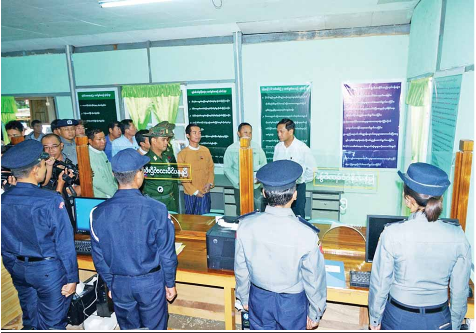
ဒုတိယသမ္မတ ဦးဟင်နရီဗိုလ်ထီးလှနှင့် ကယားပြည်နယ်ဝန်ကြီးချုပ်တို့ လွိုင်ကော်မြို့နယ် ပြည်သူ့ဆောင်ရွက်မှုမှူးမှ ပြည်သူ့အတွက်ဝန်ဆောင်မှုပေးသည့်အခြေအနေများကို ကြည့်ရှုစစ်ဆေးစဉ်။

လွိုင်ကော်မြို့ရှိ ပြည်နယ်ပြည်သူ့ဆေးရုံကြီးကို ၃တင်(၅၀၀)ဆံ့ အထွေထွေရောဂါကုဆေးရုံကြီးသို့ တိုးမြှင့်ဖွင့်လှစ်ခဲ့ပြီး ဂျပန်အစိုးရ၏ အထောက်အပံ့ဖြင့် ဆေးရုံအဆောက်အအုံသစ် ဆောက်လုပ်ခြင်းနှင့် ဆေးရုံသုံးပစ္စည်းများ ဖြည့်ဆည်းပေးခြင်းကို ဂျပန်ယန်းငွေသန်း ၁၉၀၀ ကျော်ဖြင့် ဆောင်ရွက် ပြီးစီးခဲ့