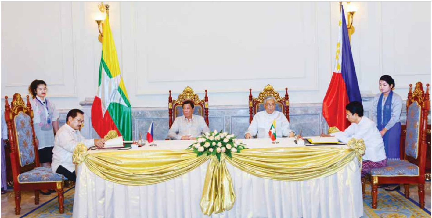
ပြည်ထောင်စုသမ္မတမြန်မာနိုင်ငံ စိုက်ပျိုးရေး၊ မွေးမြူရေးနှင့် ဆည်မြောင်းဝန်ကြီးဌာနနှင့် ဖိလစ်ပိုင်သမ္မတနိုင်ငံ စိုက်ပျိုးရေးဌာနတို့အကြား အစားအစာဖူလုံရေးနှင့် စိုက်ပျိုးရေးကဏ္ဍ ပူးပေါင်းဆောင်ရွက်မှုနားလည်မှုစာချွန်လွှာ လက်မှတ်ရေးထိုးကြစဉ်။ (သတင်းစဉ်)

ထို့နောက် ညစာကို အတူတကွသုံးဆောင်ကြသည်။ ညစာစားပွဲအပြီးတွင် ဖိလစ်ပိုင်သမ္မတ မစ္စတာ ရီဒရို ရိုဝါ ဒူတာတေး ဦးဆောင်သည့် ကိုယ်စားလှယ်အဖွဲ့အား သဘင်ဆောင်၌ သာသနာရေးနှင့် ယဉ်ကျေးမှုဝန်ကြီးဌာန အနုပညာဦးစီးဌာနမှ အနုပညာရှင်များက တေးသံသာများ၊ အကအလှများဖြင့် ဖျော်ဖြေတင်ဆက်ကြသည်။ (သတင်းစဉ်)