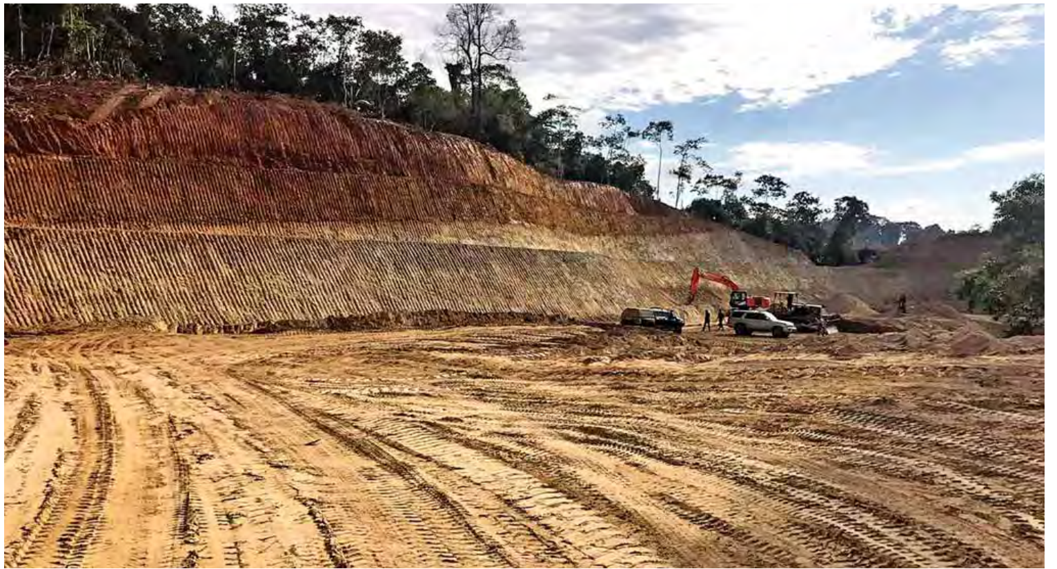
ကချင်ပြည်နယ် မြစ်ကြီးနား-ဆွမ်ပရာဘွမ်လမ်းရှိ အဆိုးဆုံးဗွတ်တန်းနေရာ ခြောက်မိုင်ကျော်ကို ပြင်ဆင်ဆောင်ရွက်နေသည့်ကို တွေ့ရစဉ်။

ရှမ်းပြည်နယ်(တောင်ပိုင်း) နမ့်စန်မြို့နယ် အတွင်းမှာရှိတဲ့ တာဆိုင်းတံတားဟောင်းဟာ တစ်လမ်းသွား သံပေါင်တံတားဖြစ်ပြီး ခံနိုင် ရည် ကျဆင်းနေ၍ နှစ်လမ်းသွား သံကူ ကွန်ကရစ်တံတားအဖြစ် တည်ဆောက်ပေး နိုင်ခဲ့တယ်။ မန္တလေး-လားရှိုး-မူဆယ်လမ်းဟာ အကွေ့အကောက် အတက်အဆင်းများပြီး အရေးကြီးသောလမ်းဖြစ်လို့ နောင်ချိုမြို့နယ်နဲ့ ကျောက်မဲမြို့နယ်ကိုဆက်သွယ်ထားတဲ့ ဂုတ်ထိပ် တံတားအသစ်ကို မကြာမီတည်ဆောက်မှာ ဖြစ်ပါတယ်။ စစ်ကိုင်းတိုင်းဒေသကြီးအတွင်း ရှိ ရွှေဘို-မြစ်ကြီးနားလမ်းနဲ့ ရေး-ကလေးဝ လမ်းရဲ့ မြို့တွင်းလမ်းနဲ့ ဂန့်ဂေါ-ကလေးလမ်း၊ ကလေးဝ-ကျိုက်ထို-တမူလမ်း၊ ကျိုက်ထို-ကလေး လမ်း၊ ပြင်သာဆိပ်-ကလေးတက္ကသိုလ်လမ်း