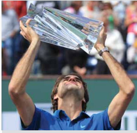
ဆွစ်ကစားသမားနှစ်ဦး ထိပ်တိုက်တွေ့ဆုံနေသည့် ဘီအင်နိုပီ ပရီဘတ်စ်အိုးပင်းဖလားပွဲလုပ်ပွဲတွင် ဖက်ဒရာက စတန်းဝေါ်ရင်ကာကို ၆-၄၊ ၇-၅ ဖြင့် အနိုင်ယူပြီး သူ့အတွက် ပဉ္စမမြောက် အင်ဒီယန်ဝဲလ်ဖလားအဖြစ် သိမ်းပိုက်ရယူ

သွားခဲ့ပြီဖြစ်သည်။ လက်ရှိ ကမ္ဘာ့အဆင့်(၃)စတန်း ဝေါ်ရင်ကာက ပထမပွဲဝယ်စတင်ချိန်တွင် ဖက်ဒရာအား အသာရအောင်ကစားနိုင်ခဲ့သော်လည်း နောက်ပိုင်းတွင် အမှားများလာပြီး နှစ်ပွဲပြတ်ဖြင့် အရေးနိမ့်သွားရခြင်းဖြစ်သည်။ ဖက်ဒရာမှာ ဝေါ်ရင်ကာနှင့် နောက်ဆုံးတွေ့ဆုံခဲ့သည့် သုံးကြိမ်စလုံး အနိုင်ရခဲ့သလို ၂၃ ကြိမ်ထိပ်တိုက်တွေ့ဆုံမှုတွင် အကြိမ် ၂၀ အထိ အနိုင်ရအောင်ကစားနိုင်ခဲ့သည်။