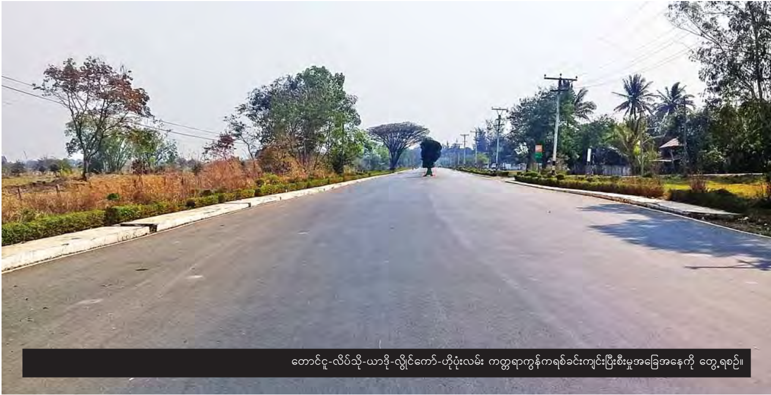
တောင်ငူ-လိပ်သို-ယာဒို-လှိုင်ကော်-ဟိုပုံးလမ်း ကတ္တရာကွန်ကရစ်ခင်းကျင်းပြီးစီးမှုအခြေအနေကို တွေ့ရစဉ်။

(ကလေး-ဖလမ်း-ဟားခါးလမ်း)တို့ကို AC လမ်းခင်းခြင်းလုပ်ငန်းတွေ ဆောင်ရွက်ထားရှိ ပြီးဖြစ်လို့ အရင်က မိုးတွင်းကာလမှာ ရွှံ့ဗွတ် ထူထပ်တဲ့ ကလေးဝမြို့တွင်း စည်ပင်သာယာ ပိုင် စက်ရုံလမ်းကို ဒေသခံပြည်သူတွေ သွား လာမှုအဆင်ပြေစေဖို့ ၁၈ ပေအကျယ် ကွန်ကရစ်လမ်းအဆင့် ဆောင်ရွက်ပေးခဲ့တဲ့ အတွက် ကလေးမြို့တွင်းလမ်းကနေ ချင်းတွင်း တံတားကို သွားလာရာမှာ အတိုဆုံးလမ်းဖြစ် လာခဲ့ပါတယ်။