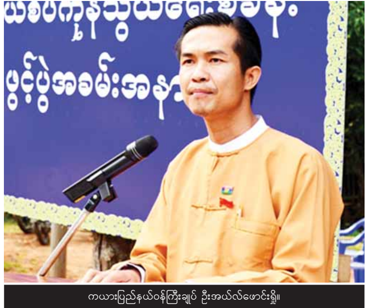
ကယားပြည်နယ်ဝန်ကြီးချုပ် ဦးအယ်လ်ဖောင်းရှီ။ အစည်းများနှင့် ခြောက်ကြိမ် တွေ့ဆုံခဲ့သည်။ ဒေသနှင့် လုံခြုံရေးအခြေအနေအရ နိုင်ငံခြား ကန့်သတ်နယ်မြေ ပြေလျော့ သားများ ခရီးသွားလာခွင့်ကို ကန့်သတ်နယ်မြေ ကယားပြည်နယ်တွင် ယခင်က နယ်မြေ သတ်မှတ်ခဲ့ရာမှ ယခုအခါတွင် ဒီးမော့ဆို

ကယားပြည်နယ်၏ တစ်နှစ်တာကာလ အတွင်း ပြုပြင်ပြောင်းလဲတိုးတက်မှုများကို တင်ပြလိုပါသည်။ လက်မှတ်ရေးထိုး ငြိမ်းချမ်းသောနည်းဖြင့် ထူထောင်ရမည့် ဒီမိုကရေစီဖက်ဒရယ်ပြည်ထောင်စု ဖြစ်ပေါ် ရေးအတွက် ကယားပြည်နယ်အတွင်းရှိသော တိုင်းရင်းသားလက်နက်ကိုင်အဖွဲ့အစည်း ခုနစ် ဖွဲ့အနက် ကရင်နီအမျိုးသားတိုးတက်ရေး ပါတီ(KNPP)မှလွဲ၍ ကျန်အဖွဲ့များသည် ပြည်ထောင်စုအစိုးရနှင့် အပစ်အခတ်ရပ်စဲ ရေးသဘောတူစာချုပ် လက်မှတ်ရေးထိုးပြီး ဖြစ်သည်။ ကရင်နီ အမျိုးသားတိုးတက်ရေးပါတီ နှင့်လည်း အပြီးသတ်သဘောတူညီမှုရရှိရေး အတွက် အစိုးရသစ်လက်ထက်ကာလအတွင်း တွင် တိုင်းရင်းသားလက်နက်ကိုင် အဖွဲ့