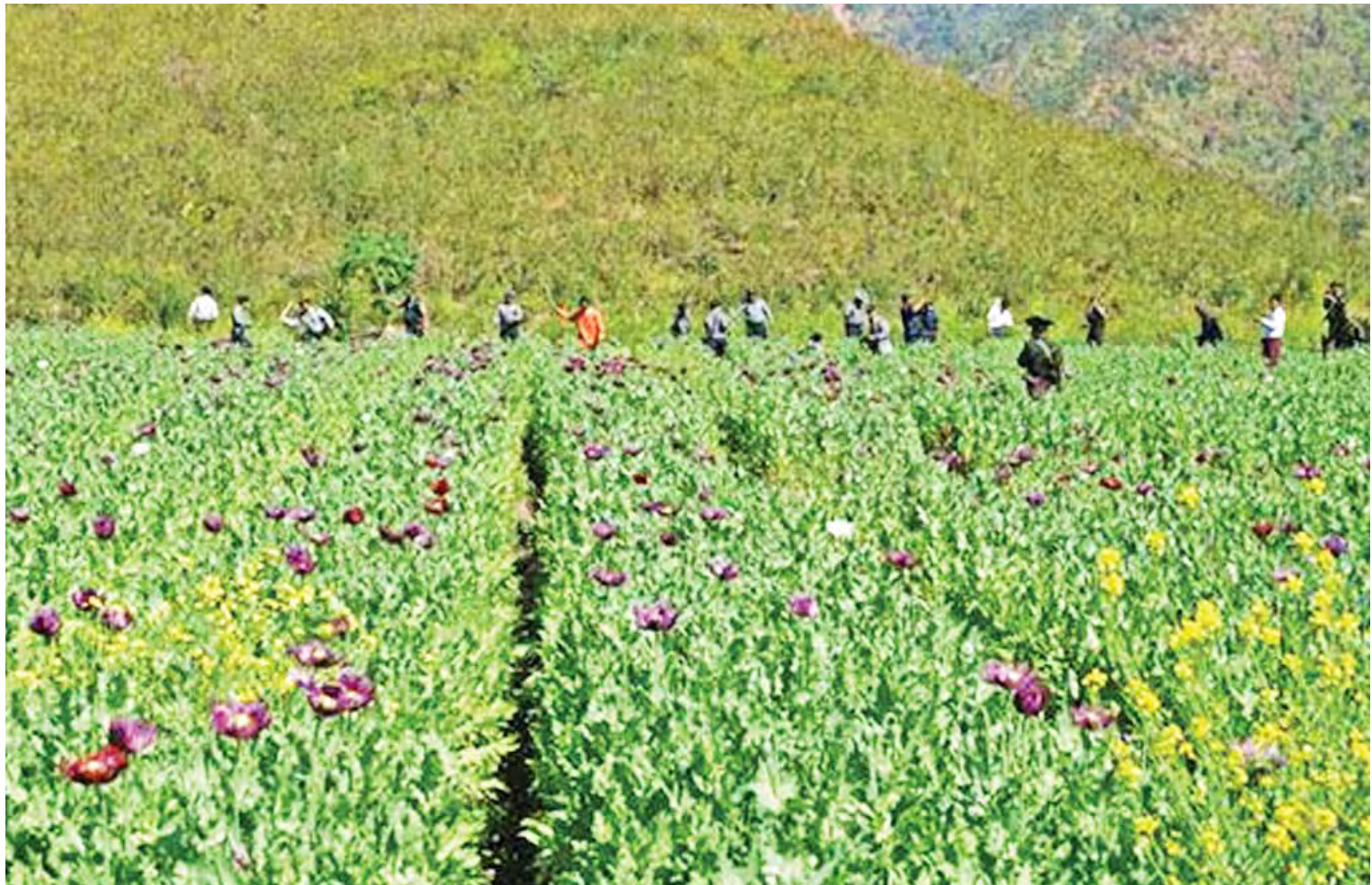
လွိုင်ကော်မြို့နယ်အတွင်းရှိ ဘိန်းစိုက်ခင်းများဖျက်ဆီးနေသည်ကို တွေ့ရစဉ်။

သမိုင်းတွင်စေမည့် အခွင့်အလမ်းကောင်းများကို အိမ်အရဆုတ်ကိုင်ရယူကြမှသာ ပြည်နယ်ငြိမ်းချမ်းရေး ထာဝရတည်တံ့ပြီး တိုင်းရင်းသားများ၏ လူမှုစီးပွားဘဝများလည်း မြင့်မားတိုးတက်လာမည်ပင်ဖြစ်သည်ဟု ယုံကြည်ပါကြောင်း ရေးသားတင်ပြလိုက်ရပါသည်။