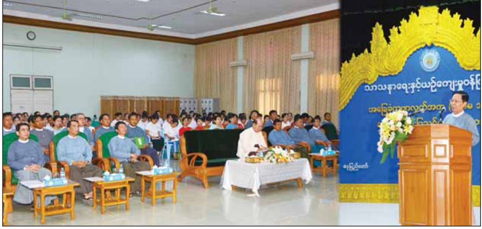
သင်တန်းသို့ တနင်္သာရီတိုင်းဒေသကြီး၊ ပဲခူးတိုင်းဒေသကြီး၊ ရန်ကုန်တိုင်းဒေသကြီး၊ ကရင်ပြည်နယ်၊ မွန်ပြည်နယ်၊ ရခိုင်ပြည်နယ်တို့မှ အခြေခံပညာ ကျောင်းဆရာ ဆရာမ စုစုပေါင်း ၁၀၀ တက်ရောက်ပြီး သင်တန်းကာလမှာ မတ် ၂၀ ရက်မှ ၂၉ ရက်အထိဖြစ်ကြောင်း သိရသည်။ (သတင်းစဉ်)

နေပြည်တော် မတ် ၂၀ သာသနာရေးနှင့် ယဉ်ကျေးမှုဝန်ကြီးဌာနနှင့် ပညာရေးဝန်ကြီးဌာနတို့ ပူးပေါင်းဖွင့်လှစ်သော မြန်မာအကအခြေခံကဗျာလွတ်အက (ပထမအဆင့်) ဆင့်ပွားနည်းပြသင်တန်းအမှတ်စဉ် (၁/၂၀၁၇) ဖွင့်ပွဲအခမ်းအနားကို ယနေ့ နံနက် ၁၀ နာရီတွင် သာသနာရေးနှင့် ယဉ်ကျေးမှုဝန်ကြီးဌာန ယဉ်ကျေးမှုရောကစာခန်းမ၌ ကျင်းပရာ သာသနာရေးနှင့် ယဉ်ကျေးမှုဝန်ကြီးဌာန ပြည်ထောင်စုဝန်ကြီး သူရဦးအောင်ကို တက်ရောက်အမှာစကားပြောကြားသည်။ ပြည်ထောင်စုဝန်ကြီးက မြန်မာနိုင်ငံအတွင်း စုစည်းနေထိုင်ကြသည့် ကချင်၊ ကယား၊ ကရင်၊ ချင်း၊ ဗမာ၊ မွန်၊ ရခိုင်၊ ရှမ်း၊ အစရှိသော မြန်မာနိုင်ငံသား တိုင်းရင်းသားအားလုံး၏ ရိုးရာအကများမှာ သံစဉ်၊ ဘာသာစကား၊ ဟန်ပန်ကွဲပြားသော်လည်း ကဗျာလွတ်သင်ရိုးများ၌ပါသည့် “ခေါင်း၊ ခါး၊ ခြေ လက်” ထဲမှာ တစ်စုတစ်စည်းတည်း ရှိနေကြောင်း၊ ကဗျာလွတ်အခြေခံကကွက်များကို ပိုင်နိုင်ကျွမ်းကျင်ပါက သင်္ကြန်ယိမ်းအကမှအစပြု၍ အခြားမည်သည့်အကကိုမဆို လွယ်ကူစွာ သင်ယူတတ်မြောက်နိုင်မည်ဖြစ်ကြောင်း၊ ကဗျာလွတ်၏ အဓိပ္ပာယ်မှာ ဗုံနှင့်စည်းဝါးတီးချက်ကိုသာ အားပြုသင်ကြားခြင်းနှင့် တေးကဗျာစာသားမပါဘဲ တေးကဗျာစာသား လွတ်ကင်းနေခြင်းတို့ကိုအကြောင်းပြု၍ အမည်ပေးတင်စားခေါ်ဆိုခဲ့ခြင်းဖြစ်ကြောင်း၊ အခြေခံကဗျာလွတ်အကကို တတ်မြောက်ခြင်းသည် အကအားလုံး၏ အခြေခံကို သိရှိနားလည်ခြင်းဖြစ်ကြောင်း မှာကြားသည်။