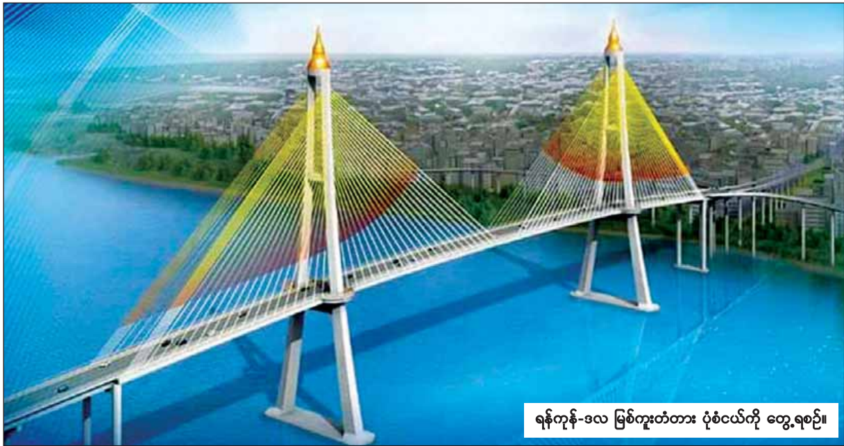
ရန်ကုန်-ဒလ မြစ်ကူးတံတား ပုံစံငယ်ကို တွေ့ရစဉ်။

ကိုရီးယား-မြန်မာချစ်ကြည်ရေး (ဒလ)တံတား တည်ဆောက်ရေး စီမံကိန်းကို ပြေလကုန်တွင် စတင်နိုင်ရန် စီစဉ် ဆောင်ရွက်ထားကြောင်း၊ တံတားဧရိယာနှင့် မလွတ်ကင်းသော နေအိမ်နှင့် ဈေးဆိုင်ခန်းများ အပြီး သတ် မြေယာလျော်ကြေးပေးအပ်ခြင်း ကို ကမာကဆစ်အနောက် ဘုန်းတော် ကြီးကျောင်း နွယ်နီဗိမာန်တော်ကြီး၌ မတ် ၁၆ ရက် မှ ၁၇ ရက်ထိ စီမံကိန်း ဧရိယာအတွင်း ပါဝင်သော ကမာကဆစ်ရပ်ကွက် ဝိုင်းပန်းရောင် လမ်းမတစ်လျှောက်ရှိ ရန်ကုန်-ဒလ မြစ်ကူးတံတားတည်ဆောက်ရန် မလွတ် ကင်းသည့် နေအိမ်အဆောက်အအုံ များ၊ ဈေးဆိုင်ခန်းများအတွက် စာမျက်နှာ ၆ ကော်လံ ၁ သို့ ○