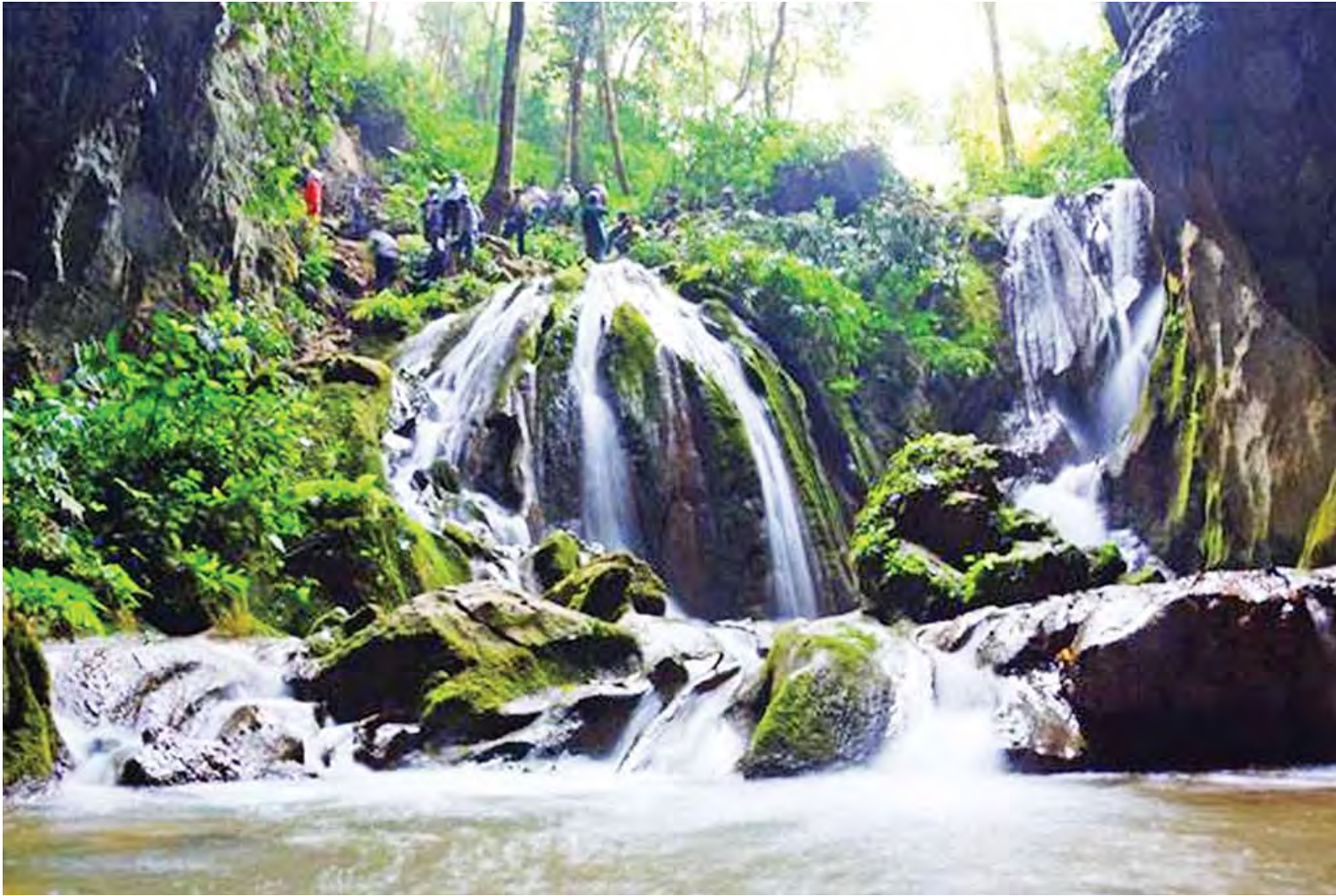
ကယားပြည်နယ်ဝန်ကြီးချုပ် ဦးအယ်လ်ဖောင်းရှိနှင့်အဖွဲ့ ဖရူဆိုမြို့နယ် မော်သီဒိုကျေးရွာအနီးရှိ ထီးပရူလူလိုက်သို့ သွားရောက်ကြည့်ရှုစဉ်။

ကယားပြည်နယ်နှင့် ထိုင်းနိုင်ငံတို့အကြား နှစ်နိုင်ငံ ကုန်သွယ်မှုပြုပါက အခွန်နှင့်ပတ်သက်သော အတားအဆီးများ ဖယ်ရှားရေး၊ တရားမဝင်ကုန်သွယ်မှု တားဆီးရေး၊ ဒေသခံ ပြည်သူများ အလုပ်အကိုင် အခွင့်အလမ်းရရှိရေးတို့အတွက် ဘောလခဲခရိုင်၊ မယ်စွဲမြို့နယ် အဝင်/အထွက်နေရာတွင် နယ်စပ်ကုန်သွယ်ရေးစခန်း ကို ၂၀၁၇ ခုနှစ် အောက်တိုဘာ ၂၇ ရက်တွင် ဖွင့်လှစ်ဆောင်ရွက်ခဲ့ပြီး သက်ဆိုင်ရာဌာနများလည်း တာဝန်ချထားပြီးဖြစ်သည်။ မယ်စွဲနယ်စပ် ကုန်သွယ်ရေး စခန်း တည်ဆောက်ရေး လုပ်ငန်းကို ၂၀၁၆-၂၀၁၇ ဘဏ္ဍာနှစ်အတွင်း အပြီးဆောင်ရွက်သွားမည် အပြီးဆောင်ရွက်သွားမည်