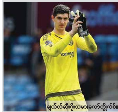
ချယ်လ်ဆီးသမားကော်တိုက်စ်။

ဆိုလိုက်သည်။ နာမည်ကြီး ကလပ်အသင်းများ၏ အဓိကကစားသမားအများစုမှာ နိုင်ငံလက်ရွေးစင်အသင်းတွင်လည်း ရွေးချယ်ခံရလေ့ရှိသဖြင့် ပွဲပန်းမှု၊ ဒဏ်ရာရရှိမှုနှင့် ခရီးပန်းမှု စသည့်အကျိုးဆက်များကြောင့် နိုင်ငံတကာပွဲစဉ်များအပြီးတွင် ကလပ်အသင်းကြီးများ၏ ရလဒ်ပိုင်း ကျဆင်းသွားလေ့ရှိသည်။ သို့သော် ကော်တိုက်စ်က ချယ်လ်ဆီးအသင်း၏ ခြေစွမ်းနှင့် ရလဒ်ပိုင်းကျဆင်းမှုကို မြင်တွေ့ရဖွယ်မရှိဘဲ ပရီမီယာလိဂ် ချန်ပီယံခရီးကို ချယ်လ်ဆီး အကောင်းဆုံးပုံစံဖြင့် ဆက်လက်ခရီးနှင့် ဦးမည်ဟု ပြောကြားခဲ့ရာ ချယ်လ်ဆီးပရိသတ်များအတွက် ကျေနပ်ဖွယ်ရာပင်ဖြစ်သည်။