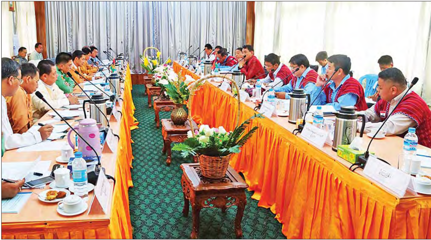
ကယားပြည်နယ်အစိုးရအဖွဲ့နှင့် ကရင်နီအမျိုးသားတိုးတက်ရေးပါတီ(KNPP)တို့ တွေ့ဆုံဆွေးနွေးစဉ်။

စက်မှုလယ်ယာ စနစ်တကျ ဖော်ထုတ်ပြုပြင်ခြင်းလုပ်ငန်း အား လှိုင်ကော်မြို့နယ် ဒေါပေါ်ကလဲကျေးရွာ၊ ပန်ကန်း ကျေးရွာ၊ ဒီးမော့ဆိုမြို့နယ် ဘုရားဖြူကျေးရွာ၊ ထီးပိုးကလိုး ကျေးရွာတို့တွင် ဖော်ထုတ်ပြုပြင် ခြင်းလုပ်ငန်းဆောင်ရွက်ခဲ့ပြီး မကြာမီကာလတွင် လုပ်ငန်းများ ပြီးစီးမည်ဖြစ်ရာ မူလပိုင်ရှင် များထံသို့ မူလပိုင်ဆိုင်မှု အတိုင်း ခွဲဝေဆောင်ရွက် သွားမည်ဖြစ်