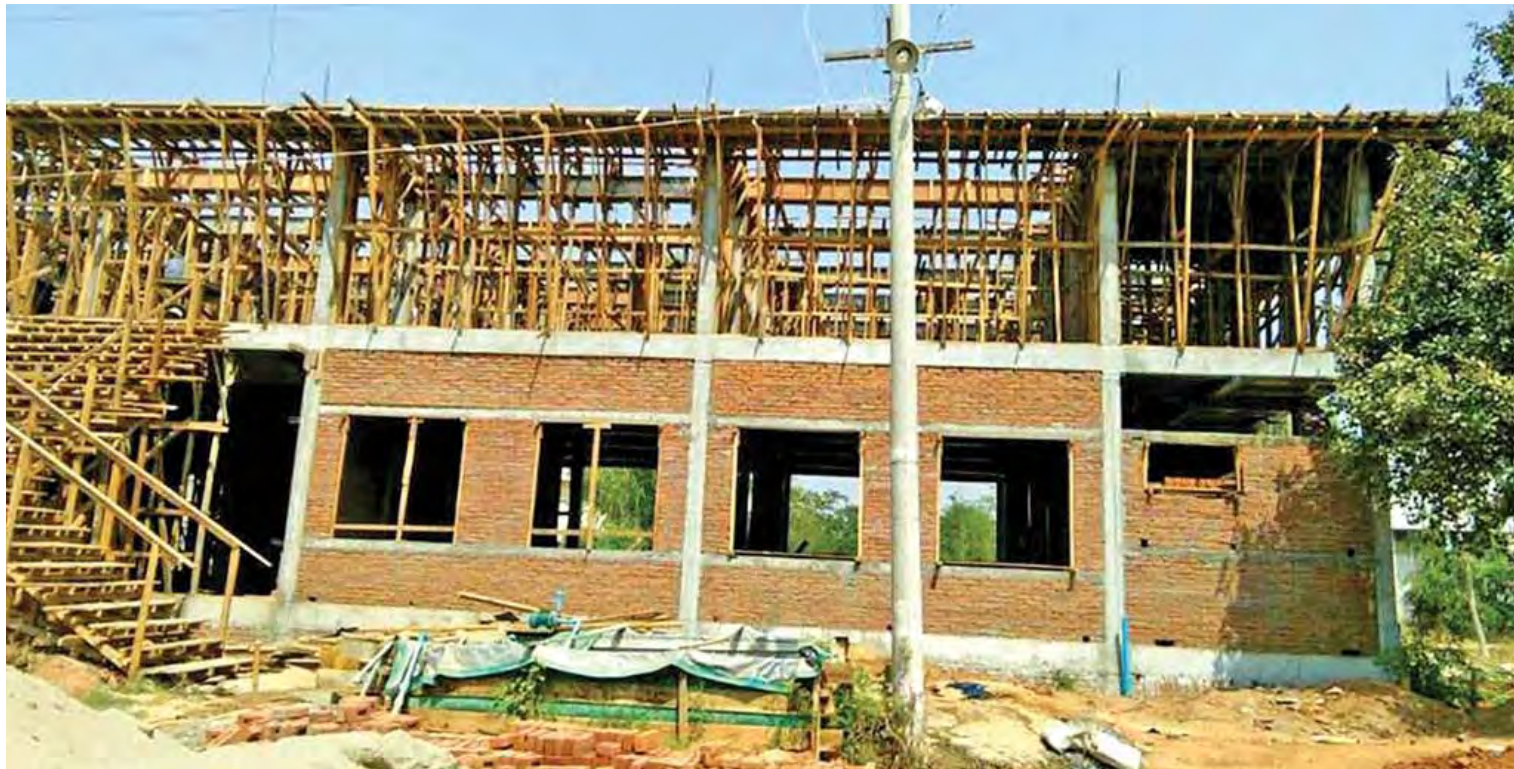
မကွေးမြို့ ခုတင် (၂၀၀)ဆံ့ သင်ကြားရေးဆေးရုံကြီး အထပ်မြင့်တိုးချဲ့ဆောင်ဆောက်လုပ်နေမှုကို တွေ့ရစဉ်။

အခုလို ဖြေကြားပေးတဲ့အတွက် ကျေးဇူး အများကြီးတင်ပါတယ်ခင်ဗျာ။ ။