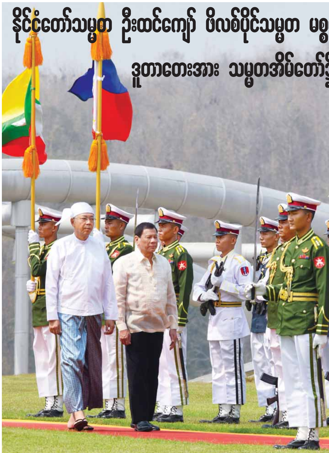
နိုင်ငံတော်သမ္မတ ဦးထင်ကျော်နှင့် ဖိလစ်ပိုင်သမ္မတ မစ္စတာ ရီဒရို ရိုဝါ ခူတာတေးတို့ ဂုဏ်ပြုတပ်ဖွဲ့ကို စစ်ဆေးကြစဉ်။