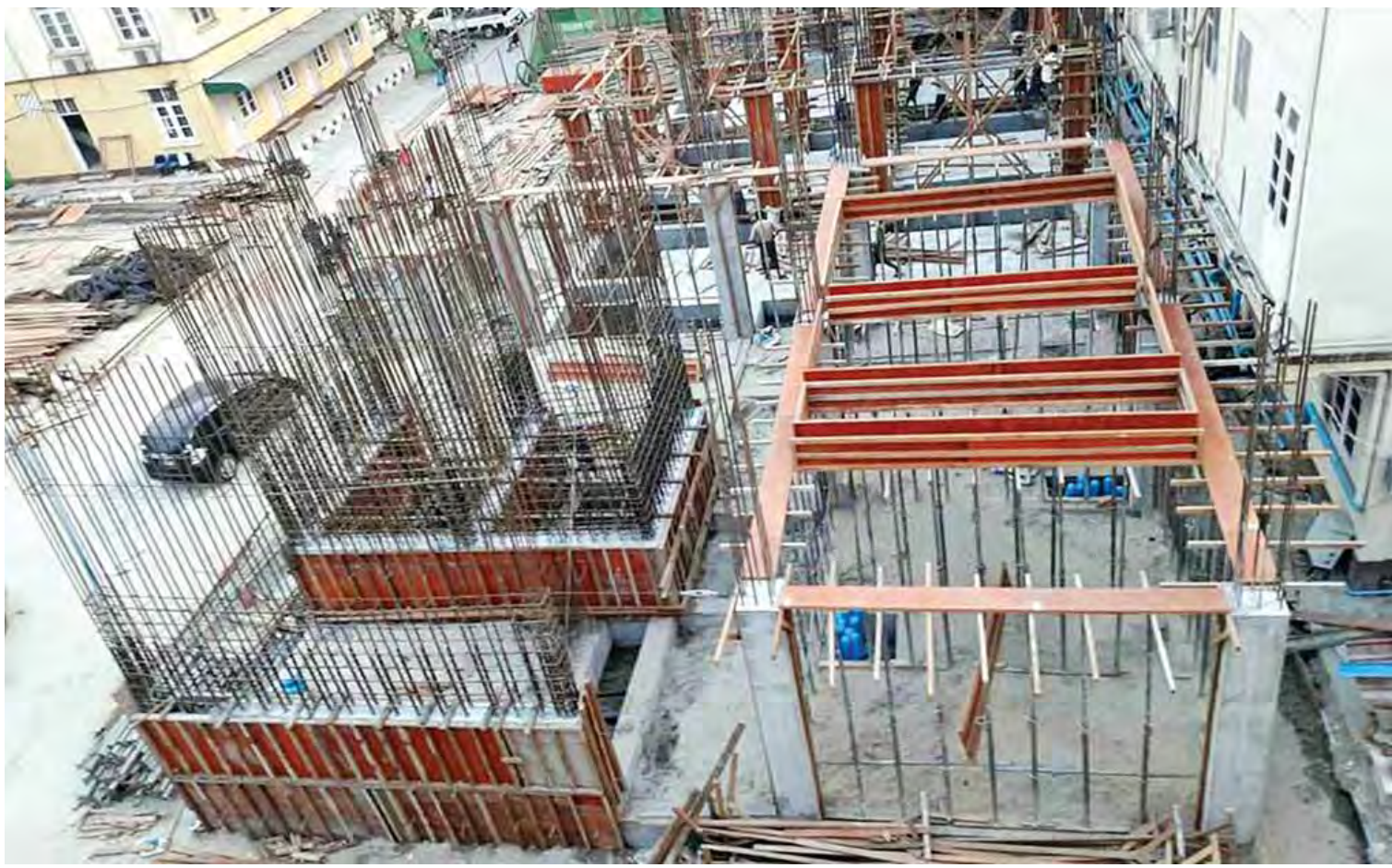
မန္တလေးအထွေထွေရောဂါကုဆေးရုံကြီး အရေးပေါ်ကုသဌာန (၁၀) ထပ် ဆောက်လုပ်နေမှုကို တွေ့ရစဉ်။