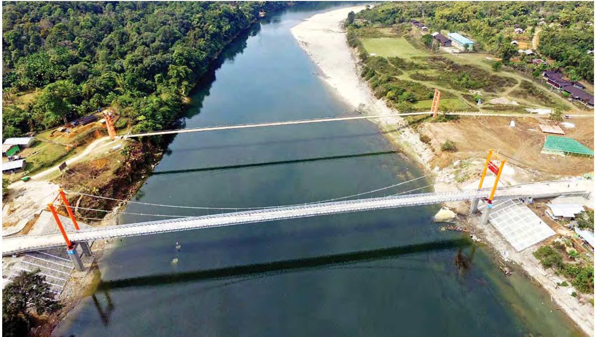
အစိုးရသစ်လက်ထက် ကချင်ပြည်နယ်အတွင်း ပထမဆုံးဖွင့်လှစ်ခဲ့သော မလိခတံတား(မချမ်းဘော)ကို တွေ့ရစဉ်။

ကယားပြည်နယ်မှာရှိတဲ့ တောင်ငူ- လိပ်သို-ယာဒို-လွိုင်ကော်-ဟိုပုံးလမ်း၊ လွိုင်ကော် မြို့တွင်းပိုင်းကို AC လမ်းခင်းခြင်းလုပ်ငန်းတွေ ဆောင်ရွက်နိုင်ခဲ့ပြီး လက်ရှိ ဘီလူးချောင်းမြတ် ကူးတံတားကိုလည်း ခဲနိုင်ဝန်ကျဆင်းနေတဲ့ အတွက် အခုတည်ဆောက်လျက်ရှိတဲ့ တံတား ကို ခေတ်ကာလနဲ့အညီ ယာဉ်+ကုန် (တန် ၆၀) ဖြတ်သန်းအသုံးပြုနိုင်မယ့် အရှည်ပေ အထူးကဏ္ဍ (ခ) သို့ >>>