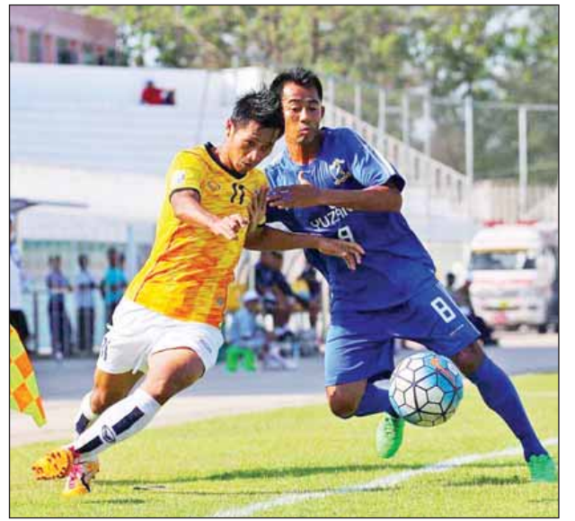
Southern နှင့် မကွေးတို့ ယှဉ်ပြိုင်နေစဉ်။

နှစ်သင်းစလုံး အမာခံကစားသမား အစုံအလင်ဖြင့် ပွဲထွက်ခဲ့ပြီး အပြန် အလှန်ကစားနိုင်ခဲ့သည်။ နှစ်သင်း စလုံး ဝိုးရနိုင်သည့် အခွင့်အရေးများ ရခဲ့သော်လည်း အသုံးမချနိုင်ခဲ့သော ကြောင့် နိုင်ပွဲနှင့် ဝေးခဲ့ခြင်းဖြစ်သည်။