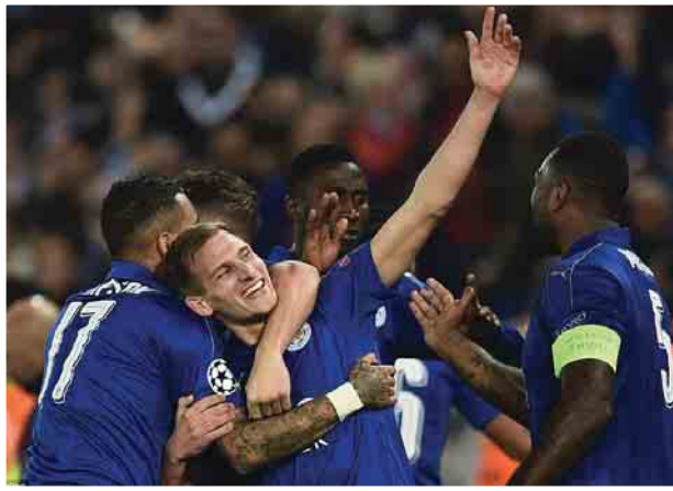
လေးဂိုးသွင်းယူထားကာ နှစ်ဂိုးဖန်တီးပေးနိုင်ခဲ့သူဖြစ်သည်။ အခြားသောပွဲစဉ်တစ်ပွဲဖြစ်သည့် ဂျူဗင်တပ်အသင်းနှင့် ပေါ်တိုအသင်းတို့၏ ဒုတိယအကျောပွဲစဉ်တွင် ဒိုင် ဘာလာ၏ ပွဲကစားချိန် ၄၂ မိနစ်တွင်

လက်စတာစီးတီးအသင်း၏ ချန်ပီယံလိဂ်သွင်းဂိုး ၁၀ ဂိုးအနက် သွင်းဂိုးခြောက်ဂိုးမှာ မာရက်စ်နှင့် တိုက်ရိုက်ပတ်သက်နေပြီး မာရက်စ်သည်