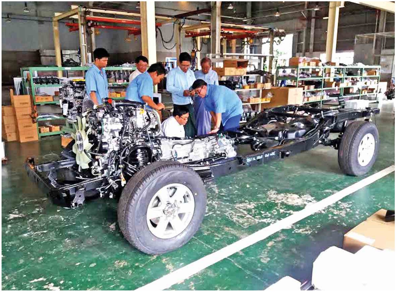
မော်တော်ယာဉ်ထုတ်လုပ်ရေးလုပ်ငန်းခွင်ကို တွေ့ရစဉ်။

သတ်မှတ်ထားသော ထုတ်လုပ်မှုနည်းစနစ် အတိုင်း သင့်လျော်သောစက်ပစ္စည်းများ အသုံး ပြု၍ ထုတ်လုပ်ထားခြင်း ရှိ/မရှိနှင့် စံချိန် စံညွှန်းများအတိုင်း လုံခြုံစိတ်ချရ၍ အန္တရာယ် ကင်းစွာ အသုံးပြုနိုင်မှု ရှိ/မရှိတို့ကို စနစ် တကျ စစ်ဆေးပြီးနောက် စံသတ်မှတ်ချက်များ