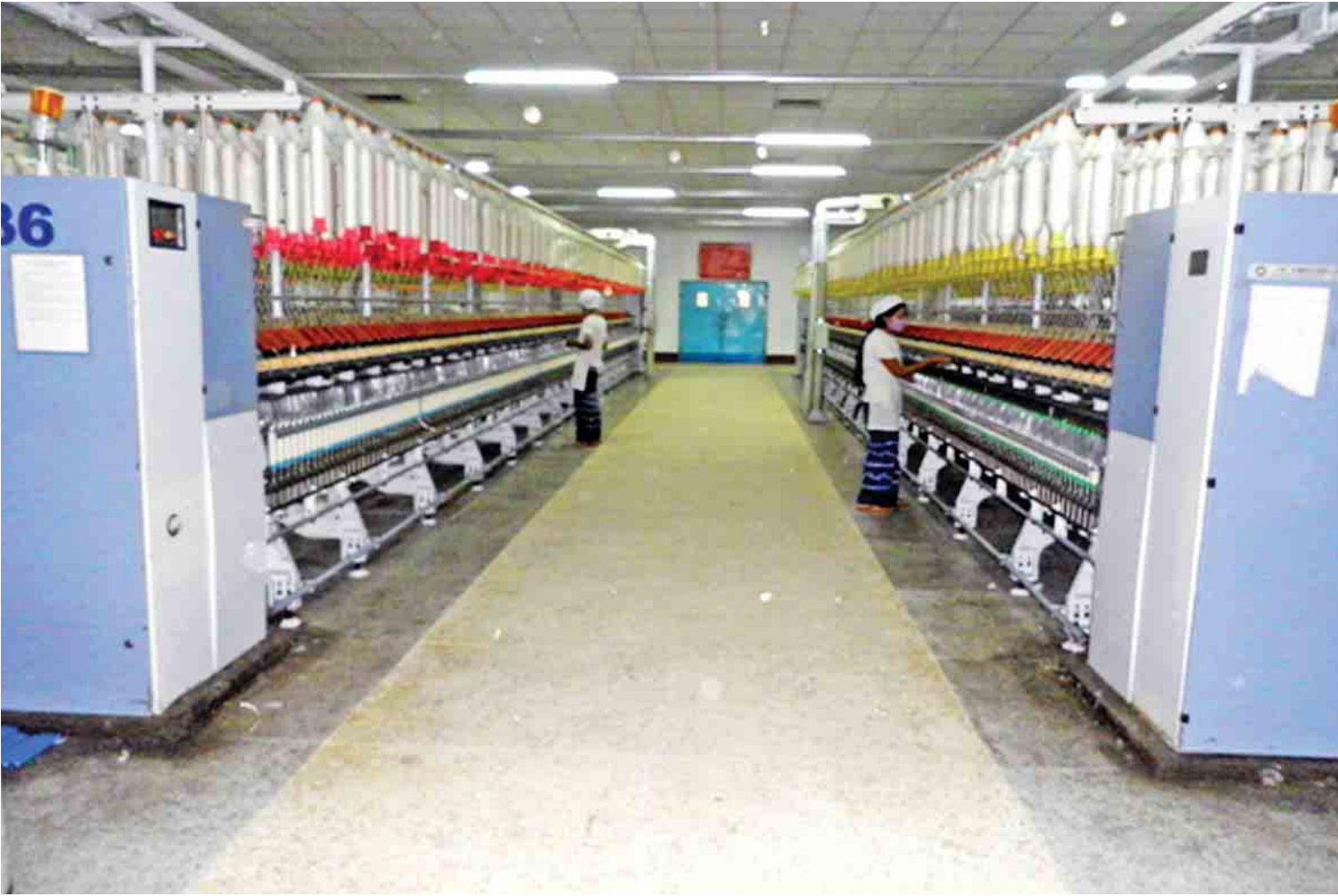
စက်မှုဝန်ကြီးဌာန အမှတ် (၇) အထည်စက်ရုံ(မြစ်သား)၌ ဈေးကွက်ဝင် အဆင့်မြင့် ၁/၄၀ ချည် ထုတ်လုပ်နေမှုကို တွေ့ရစဉ်။

နှင့် ကိုက်ညီမှုရှိလျှင် စစ်ဆေးပြီး လယ်ယာသုံး ယာဉ်နှင့် မော်တော်ယာဉ်များကို Certificate of Approval ထုတ်ပေးခြင်းလုပ်ငန်းများ ဆောင်ရွက်လျက်ရှိသည်။