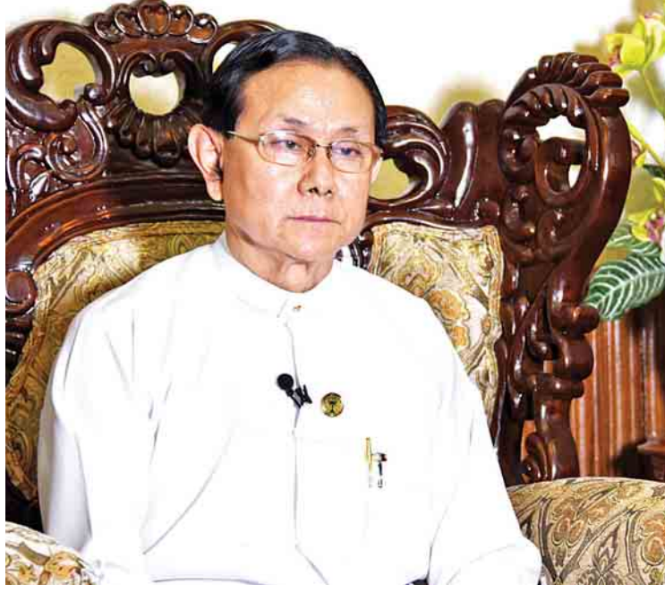
ပြည်ထောင်စုရာထူးဝန်အဖွဲ့ဥက္ကဋ္ဌ ဒေါက်တာဝင်းသိမ်း

ပြည်ထောင်စုရာထူးဝန်အဖွဲ့သည် နိုင်ငံ ဝန်ထမ်းများ ရွေးချယ်ပေးခြင်း၊ ရာထူးတိုးမြှင့် ပေးခြင်း၊ လေ့ကျင့်ပေးခြင်း၊ ဝန်ထမ်းစည်းမျဉ်း စည်းကမ်းများသတ်မှတ်ခြင်း၊ ပြည်ထောင်စု အစိုးရအဖွဲ့အတွက် ဝန်ထမ်းရေးရာကိစ္စရပ် များနှင့် ပတ်သက်၍ အထောက်အကူပြုခြင်း