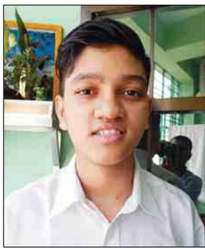
မောင်ကောင်းမင်းခန့်

စာမေးပွဲအခန်းမှာလည်း တာဝန်ကျ ဆရာ ဆရာမတွေ ကအစ ဂရုစိုက်မှုတွေရှိပါတယ်။ သောက်ရေသောက်ချင် တာကအစ ကူညီပေးပါတယ်။ တက္ကသိုလ်ဝင်စာမေးပွဲ