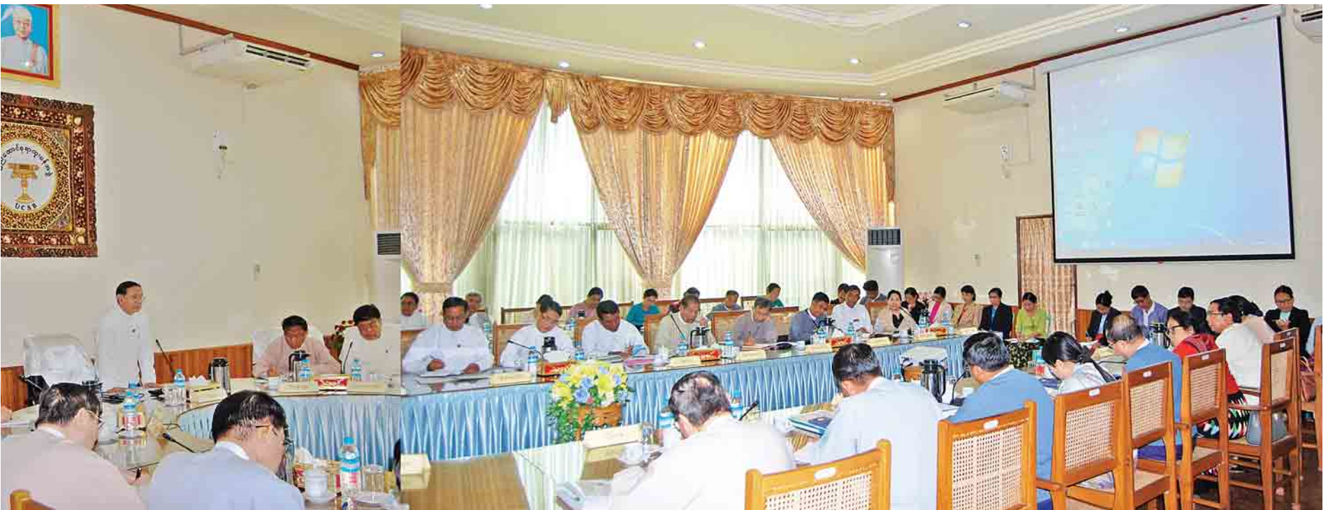
ပြည်ထောင်စုရာထူးဝန်အဖွဲ့ဥက္ကဋ္ဌ ဒေါက်တာဝင်းသိမ်း ဗဟိုဝန်ထမ်းတက္ကသိုလ်များ၏ တက္ကသိုလ်ပညာရပ်အဖွဲ့၊ တက္ကသိုလ်အကြံပေးအဖွဲ့များနှင့် တွေ့ဆုံညှိနှိုင်းအစည်းအဝေးတွင် အမှာစကားပြောကြားစဉ်။