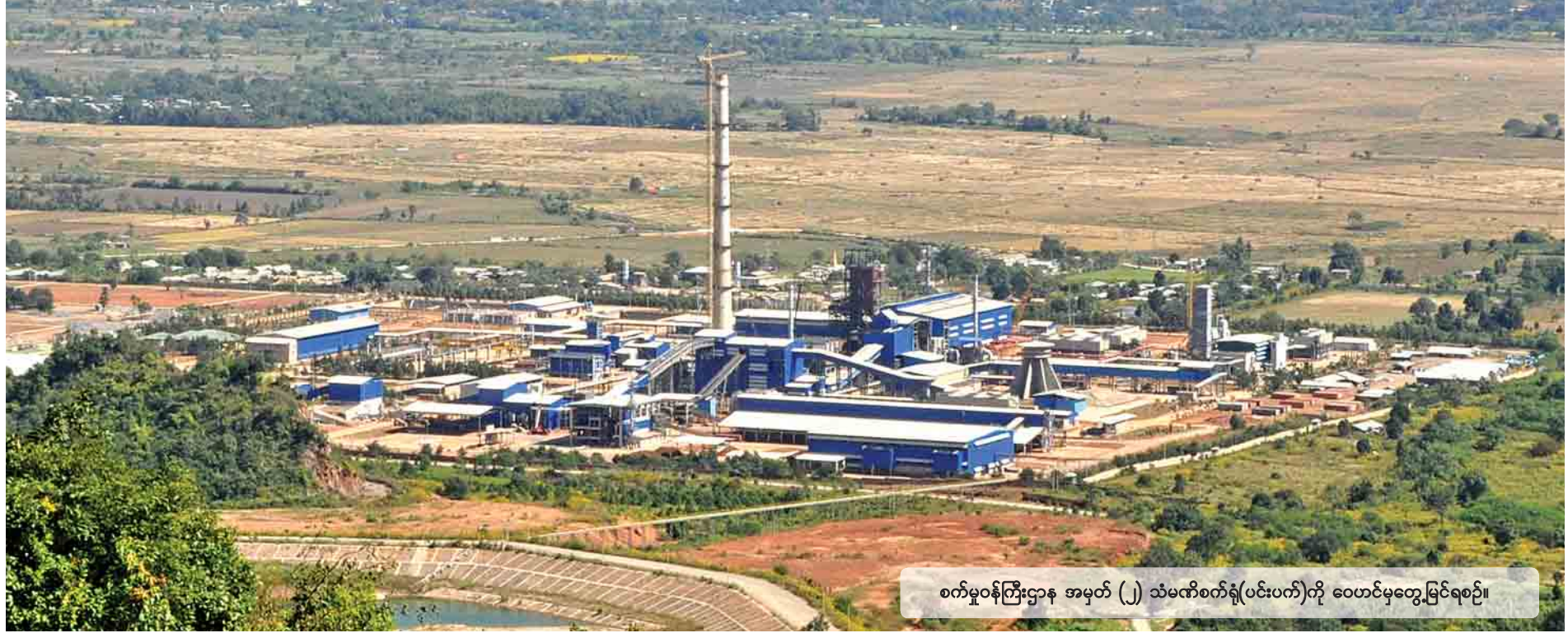
စက်မှုဝန်ကြီးဌာန အမှတ် (၂) သံမဏိစက်ရုံ(ပင်းပက်)ကို ဝေဟင်မှတွေ့မြင်ရစဉ်။