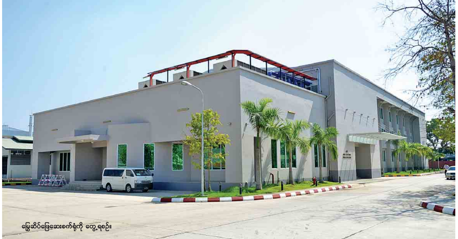
မြွေဆိပ်ဖြေဆေးစက်ရုံကို တွေ့ရစဉ်။