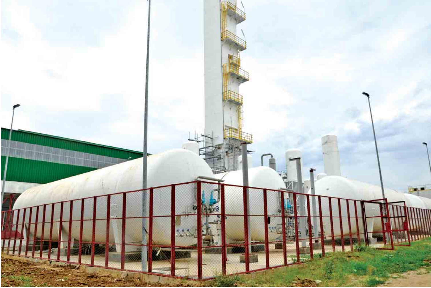
စက်မှုဝန်ကြီးဌာန အမှတ် (၁) သံမဏိစက်ရုံ (မြင်းခြံ)ကို တွေ့ရစဉ်။