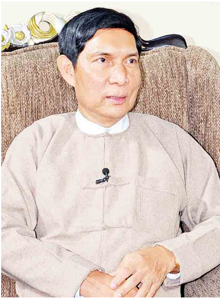
စက်မှုဝန်ကြီးဌာန ပြည်ထောင်စုဝန်ကြီး ဦးခင်မောင်ချို

စက်မှုဝန်ကြီးဌာန ပြည်ထောင်စုဝန်ကြီး ဦးခင်မောင်ချိုက “စက်မှုဝန်ကြီးဌာနရဲ့ အကြီးမားဆုံးစိန်ခေါ်မှုကတော့ အများပြည်သူ တွေ စိတ်ဝင်စားနေကြတဲ့ ကျွန်တော်တို့ ဝန်ကြီးဌာနက အကောင်အထည်ဖော်ရတဲ့