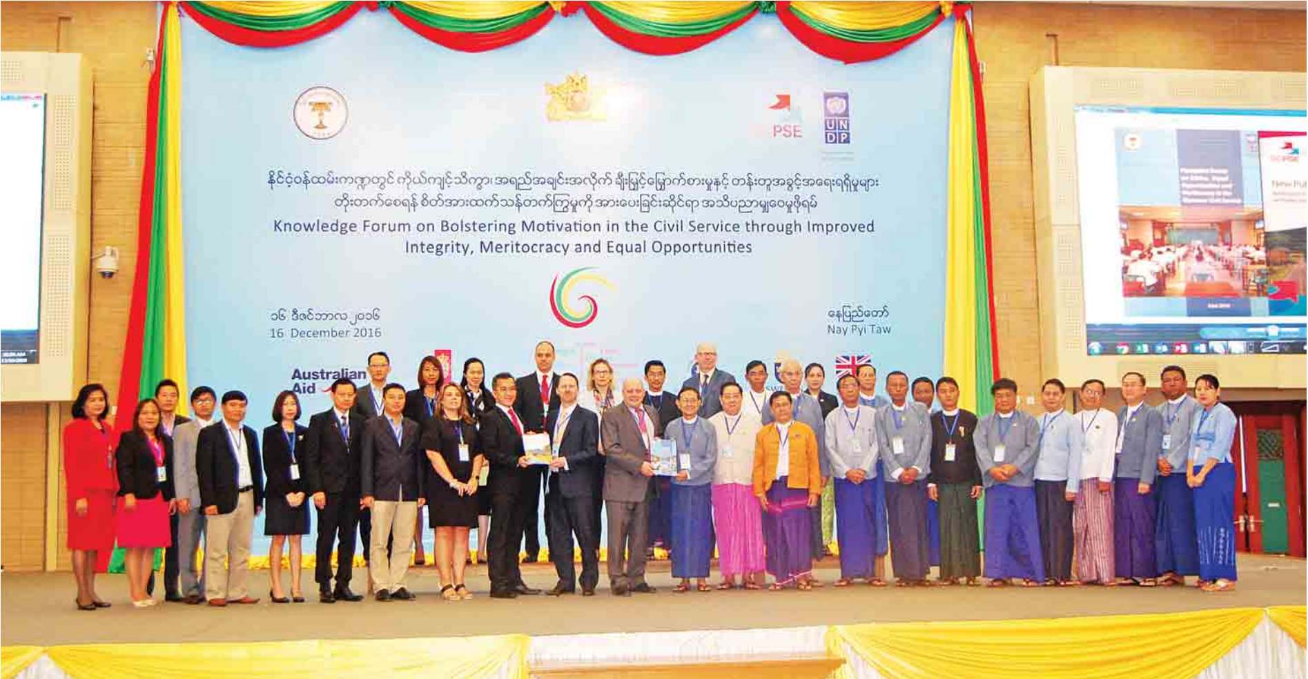
နေပြည်တော်တွင် ၂၀၁၆ ခုနှစ် ဒီဇင်ဘာ ၁၆ ရက်က ကျင်းပသည့် နိုင်ငံဝန်ထမ်းကဏ္ဍတွင် ကိုယ်ကျင့်သိက္ခာ၊ အရည်အချင်းအလိုက် ချီးမြှင့်မြှောက်စားမှုနှင့် တန်းတူအခွင့်အရေးရရှိမှုများ တိုးတက်စေရန် စိတ်အားထက်သန်တက်ကြွမှုကို အားပေးခြင်းဆိုင်ရာ အသိပညာမျှဝေပွဲစဉ်တွင် စုပေါင်းမှတ်တမ်းတင်ဓာတ်ပုံရိုက်ကြစဉ်။

အစည်းအားလုံး တစ်ပြေးညီလိုက်နာကျင့်သုံး ဆောင်ရွက်လာနိုင်ခြင်း စသည့် အကျိုးရလဒ် များလည်း ခံစားရရှိနိုင်တော့မည်ဖြစ်သည်။ “ရာထူးတိုးမြှင့်ခန့်ထားဖို့ အကဲဖြတ် အမှတ်ပေးရာမှာလည်း တစ်ပြေးညီ လိုက်နာ ကျင့်သုံးဖို့ အမိန့်ကြော်ငြာစာထုတ်ပြန်ခဲ့ပါ တယ်။ ဝန်ထမ်းကျင့်ဝတ်စာစောင်အသစ် ပုံနှိပ်ပြီး နိုင်ငံဝန်ထမ်းတွေထံကို အခမဲ့ဖြန့်ဝေ နိုင်ဖို့နဲ့ ပြင်ဆင်ဖြည့်စွက်နိုင်ဖို့၊ အစားထိုး ပြဋ္ဌာန်းဖို့လိုအပ်လာတဲ့ ပြည်ထောင်စု