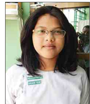
မဟန်စုယဉ်

ဖြေဆိုအောင်မြင်ပြီးရင်တော့ (UFL)နိုင်ငံခြားဘာသာ တက္ကသိုလ်တက်ဖို့မျှော်မှန်းထားပါတယ်။