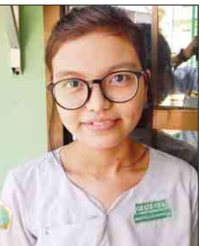
မာဆူအောင်