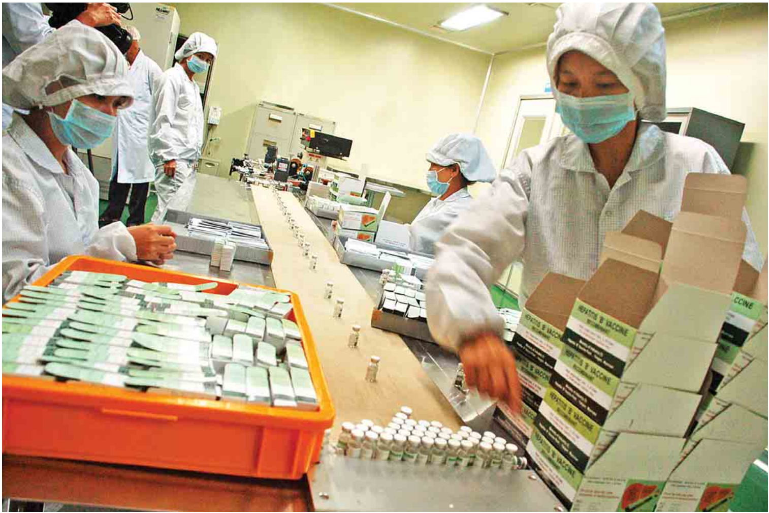
အသည်းရောင်ရောဂါဆေးဝါးများ ထုတ်ပိုးနေသည်ကို တွေ့ရစဉ်။

အရောင်းမြှင့်တင်ရေးလုပ်ငန်းများအတွက် လယ်ယာသုံးစက်နှင့် စက်ကိရိယာပစ္စည်းများကို ကျေးရွာဒေသအသီးသီးသို့ နှစ်နှစ်ဆိုင် အရစ်ကျစနစ်ဖြင့် အရောက်ပို့ပြီး ရောင်းချခြင်း၊ အရောင်းပြခန်းများ၊ အရောင်းကိုယ်စားလှယ်များ ထားရှိရောင်းချခြင်း၊ After Sale Service ဆောင်ရွက်ပေးခြင်းတို့ဖြင့် အစိုးရသစ်လက်ထက်တွင် လယ်ယာသုံးပစ္စည်းတန်ဖိုးငွေကျပ် ၂၈၀ ဒသမ ၄၁၁ သန်း ရောင်းချပေးနိုင်ခဲ့သည်။ ထို့အတူ မြန်မာနိုင်ငံတွင် လာရောက် ကျင်းပသည့် နိုင်ငံတကာနည်းပညာပြပွဲနှင့် စက်မှုပြပွဲများတွင်လည်း စက်မှုဝန်ကြီးဌာန၏ ထုတ်ကုန်များကို ဝင်ရောက်ပြသရောင်းချခဲ့သည်။