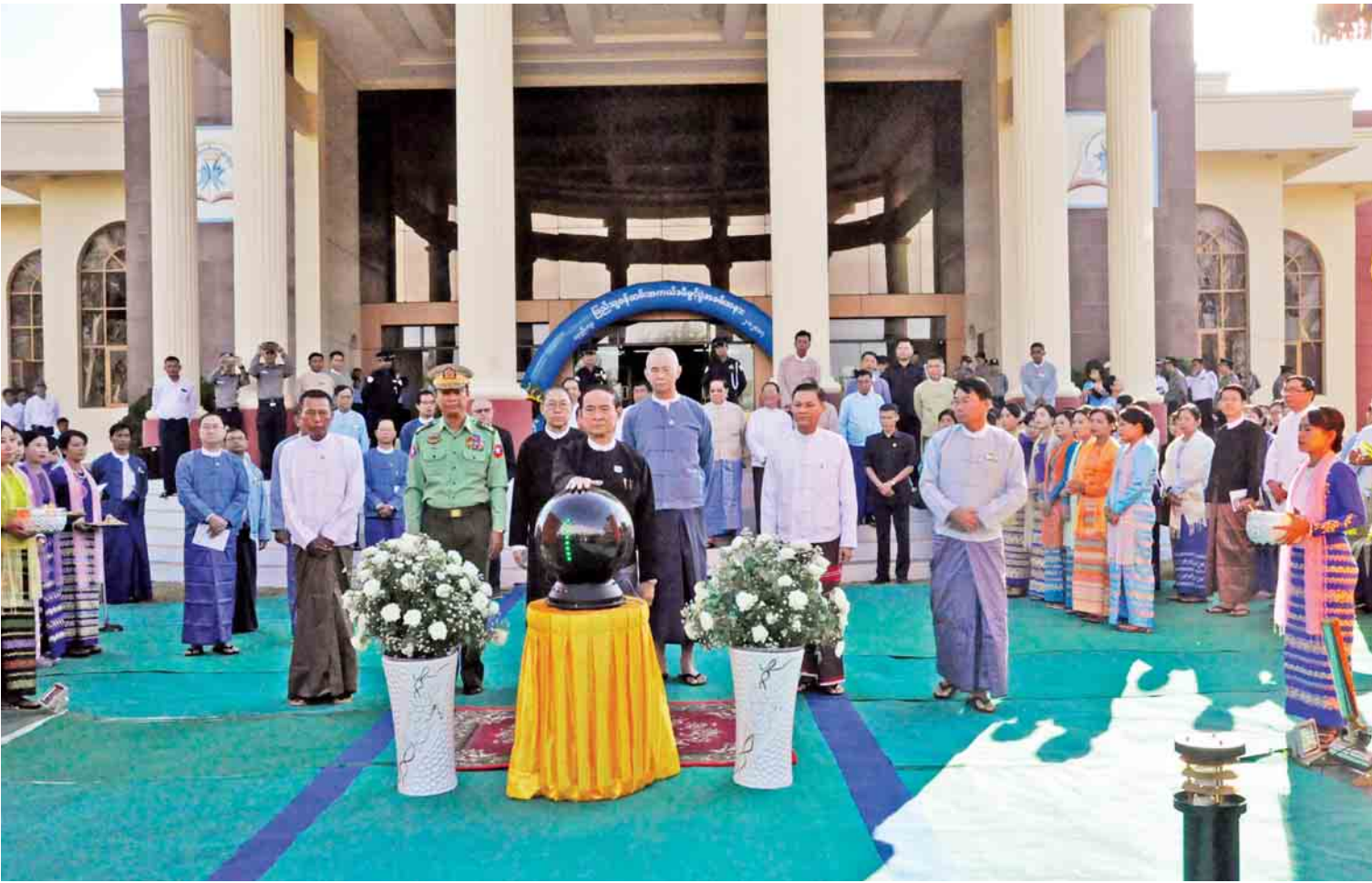
ပြည်သူ့လွတ်တော်ဥက္ကဋ္ဌ ဦးဝင်းမြင့် ရန်ကုန်တိုင်းဒေသကြီး လှည်းကူးမြို့နယ် ဗဟိုဝန်ထမ်းတက္ကသိုလ်(အောက်မြန်မာပြည်)ရှိ ပြည်သူ့ဝန်ထမ်းအကယ်ဒမီ ကမ္ဘာ့ပေးပို့မှုကို စက်ခလုတ်နှိပ်ဖွင့်လှစ်ပေးစဉ်။

ရာထူးဝန်အဖွဲ့ဥပဒေကို ပြင်ဆင်ဖို့ကိုလည်း ဆောင်ရွက်လျက်ရှိပါတယ်”ဟု ဒေါက်တာ ဝင်းသိမ်းက ပြောသည်။