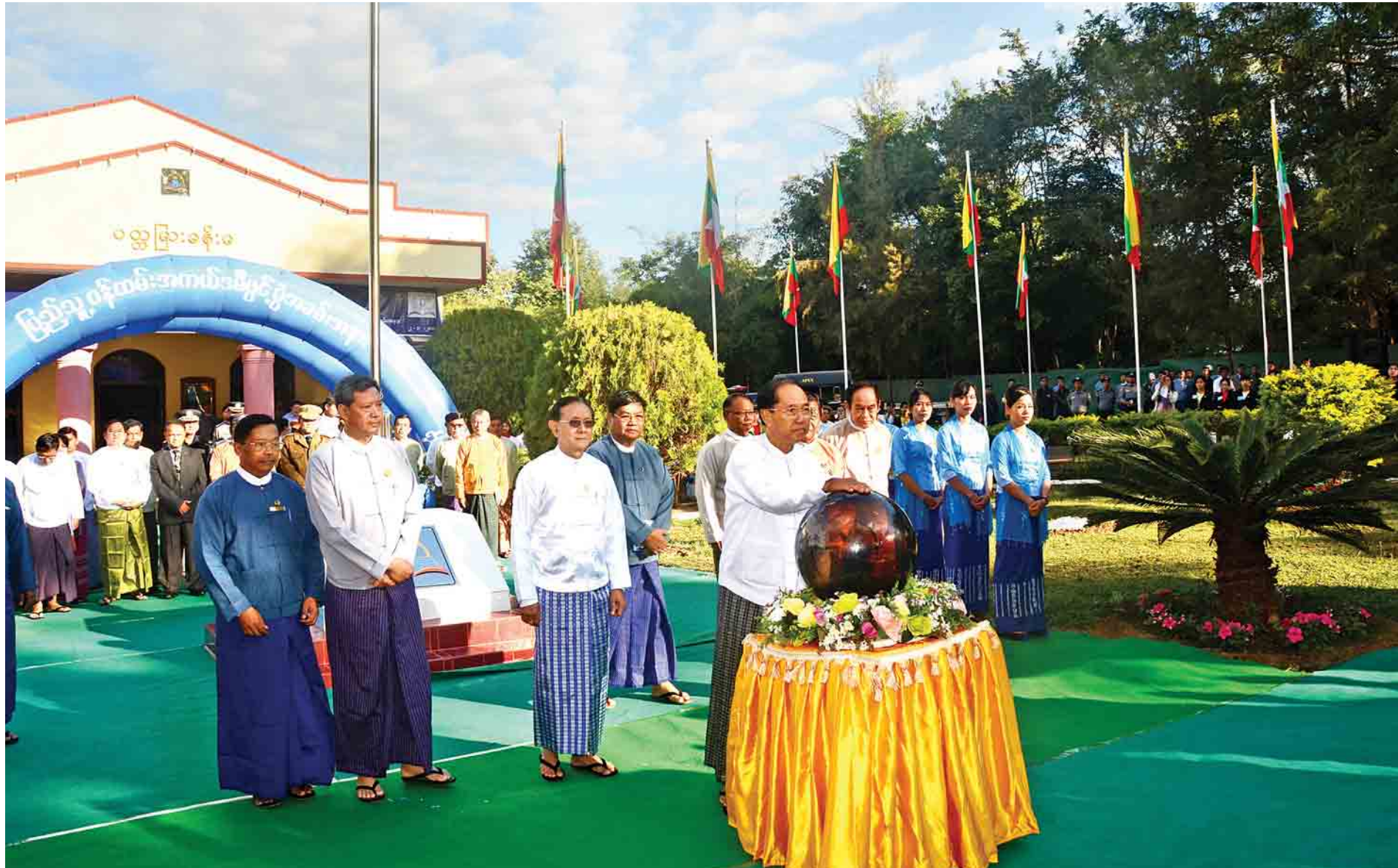
ဒုတိယသမ္မတဦးမြင့်ဆွေ မန္တလေးတိုင်းဒေသကြီး ပြင်ဦးလွင်မြို့နယ် ဗဟိုဝန်ထမ်းတက္ကသိုလ်(အထက်မြန်မာပြည်)ရှိ ပြည်သူ့ဝန်ထမ်းအကယ်ဒမီ ကမ္ပည်းမော်ကွန်းကို စက်ခလုတ်နှိပ်ဖွင့်လှစ်ပေးစဉ်။