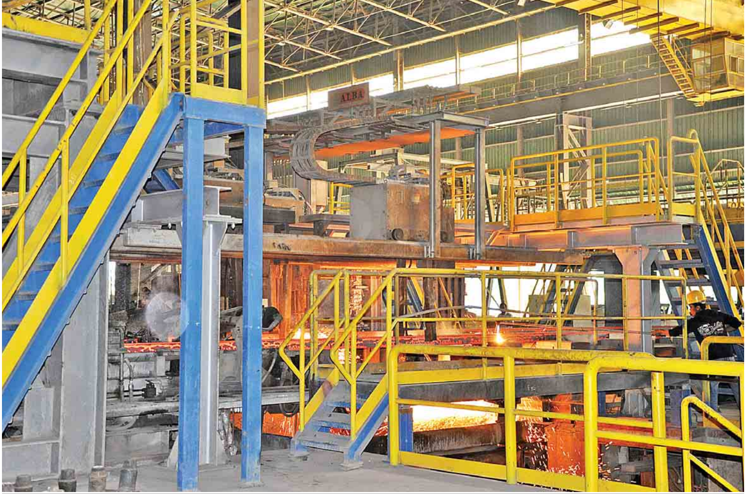
စက်မှုဝန်ကြီးဌာန အမှတ် (၁) သံမဏိစက်ရုံ (မြင်းခြံ)တွင် သံမဏိထုတ်လုပ်နေသည်ကို တွေ့ရစဉ်။

ပြည့်မီစွာနဲ့ တိုးချဲ့ထုတ်လုပ်ရောင်းချပေးနိုင်ခဲ့ တဲ့အတွက် တစ်ဖက်မှာ ပြည်သူလူထုရဲ့ ကျန်း မာရေးလိုအပ်ချက်ကို ဖြည့်ဆည်းနိုင်ခဲ့သလို ဝန်ကြီးဌာနအနေနဲ့လည်း ဝင်ငွေတိုးတက် ရရှိတဲ့အတွက် မြန်မာ့ဆေးဝါးလုပ်ငန်းက အရင်က အရှုံးအချို့နဲ့ ရင်ဆိုင်ရပေမယ့် အခု အချိန်မှာ အကျိုးအမြတ်ရရှိပြီး စီးပွားရေးအရ အောင်မြင်စွာ လည်ပတ်ထုတ်လုပ်နိုင်ခဲ့ပြီ ဖြစ် ပါတယ်”ဟု ပြည်ထောင်စုဝန်ကြီး ဦးခင်မောင်ချို က ပြောသည်။