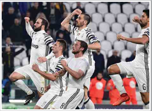
သွင်းယူခဲ့သည့် သွင်းဂိုးဖြင့် အနိုင်ရရှိခဲ့ပြီး နှစ်ကျောပေါင်းရလဒ် သုံးဂိုးပြတ်ဖြင့် အနိုင်ရရှိကာ ချန်ပီယံလိဂ်ကွာတားဖိုင်နယ်အဆင့်သို့ တက်လှမ်းလာခဲ့ခြင်းဖြစ်သည်။ (ဓမ္မကြွယ်)