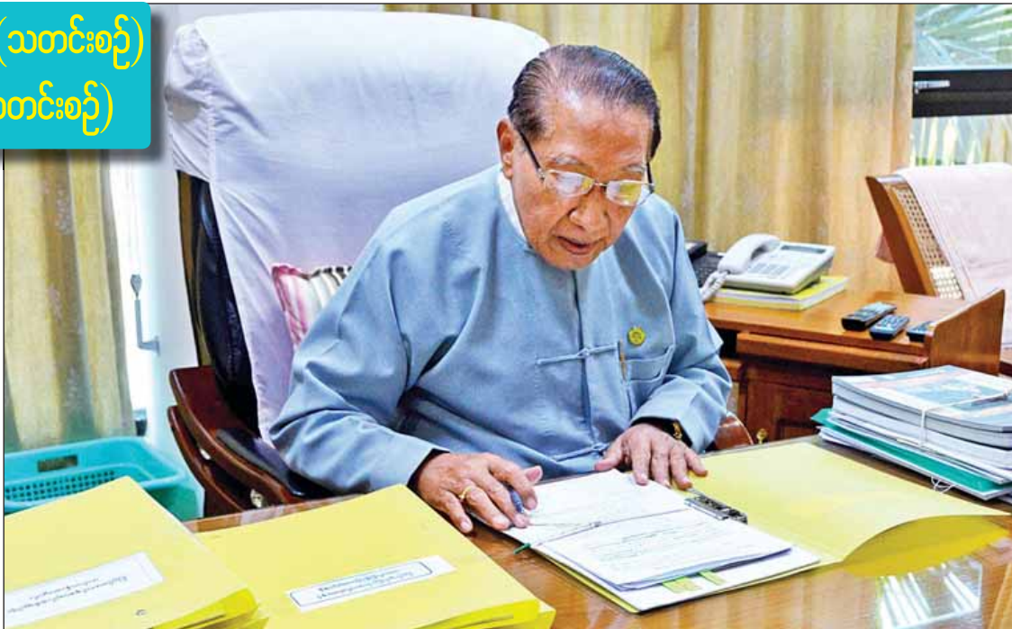
ပြည်ထောင်စုစာရင်းစစ်ချုပ် ဦးမော်သန်း

သတင်းဆောင်းပါး - သူရဇော်(သတင်းစဉ်)