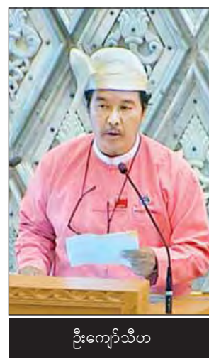
ဦးကျော်သီဟ

ပေးပို့ပြီး ၎င်းတို့ထံမှ အသေးစိတ် စိစစ်ပြန်ကြားချက်များကို အမျိုးသား လွှတ်တော်ဥက္ကဋ္ဌထံ တင်ပြလမ်းညွှန်မှုခံယူ၍ ကာယကံရှင်ပြည်သူများထံသို့ ပြန်ကြားခဲ့သည့်အမှုတွဲပေါင်း ၁၄၁ စောင်အနက် တရားရုံးတွင် ရင်ဆိုင်နေဆဲ အမှုမပြီးပြတ်သေးသောတိုင်ကြားစာ၊ ကာယကံရှင်က ဥပဒေနှင့်အညီ ကိုယ်တိုင်တရားစွဲဆိုရမည့် တိုင်ကြားစာနှင့် တိကျခိုင်မာသော အချက်အလက် များ ပြည့်စုံမှုမရှိသည့် တိုင်ကြားစာများကို ကော်မတီ၏ ဆုံးဖြတ်ချက်ဖြင့် ကာယကံရှင် ပြည်သူများထံသို့ အမှုတွဲပေါင်း ၉၉ စောင်အား ပြန်ကြားပေးခဲ့ ပြီးဖြစ်ပါကြောင်း။