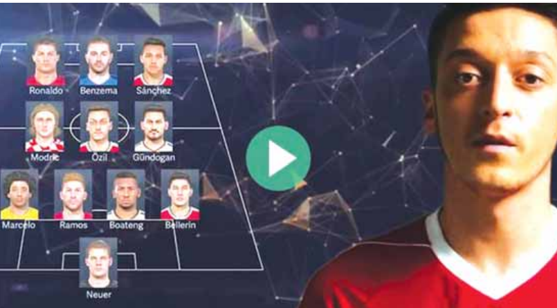
မေလဲ့သင်း ရေးသားသည်။

ဂန်၊ တိုက်စစ်မှာတော့ ရီးယဲလ်အသင်းဖော်တွေဖြစ်ခဲ့ဖူးတဲ့ စီရိုနယ်လ်ဒိုနဲ့ ဘင်ဇီမာ၊ အာဆင်နယ်ရဲ့ ဆန်းချက်ရဲ့ဖြစ်ပါတယ်။ ဒါ့ကြောင့် အိုဇေးလ်ရဲ့ အနှစ်သက်ဆုံးကစားဖော်စာရင်းကို ပြန်လည်ဆန်းစစ်ကြည့်ရင် အာဆင်နယ်ကစားဖော်နှစ်ဦး၊ ဂျာမနီအသင်းဖော်သုံးဦးနဲ့ ရီးယဲလ်မက်ဒရစ်ကစားသမား ငါးဦးတို့ဖြစ်ကြပါတယ်။ အိုဇေးလ်က ဒီကစားသမားတွေဟာ ဘာလို့ သူ့ရဲ့ အကြိုက်ဆုံးအသင်းဖော်အဖြစ် ရွေးချယ်ခံခဲ့ရတာလဲဆိုတဲ့ အကြောင်းကို ရှင်းလင်းခဲ့ရမှာ ဘယ်လာရင်လို အင်မတန်လျင်မြန်လွန်းတဲ့တောင်ပံခံစစ်မျိုးမျိုး တစ်ခါမှ မမြင်တွေ့ခဲ့မိဘူးလို့ ချီးကျူးစကားဆိုခဲ့ပါတယ်။