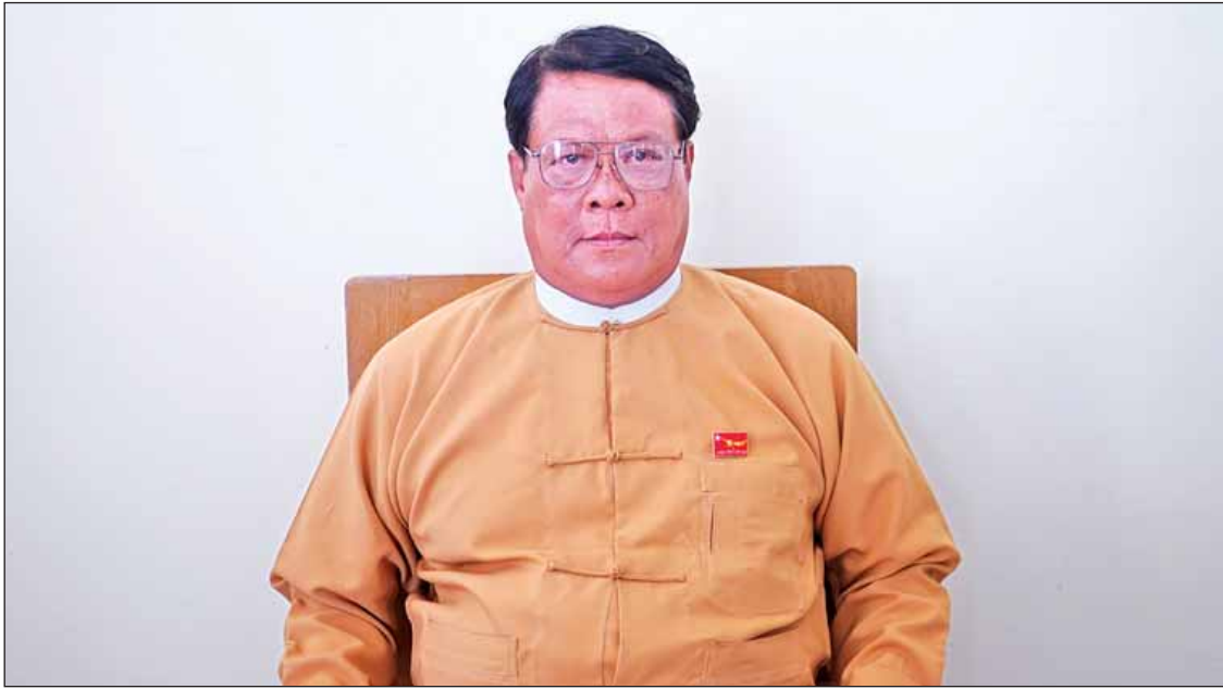
စစ်ကိုင်းတိုင်းဒေသကြီး ဝန်ကြီးချုပ် ဒေါက်တာမြင့်နိုင်

နာဂဒေသမှာဖြစ်ပွားခဲ့တဲ့ ပြင်းထန်ဝက်သက်ရောဂါဟာလည်း ကျွန်တော်တို့အတွက် စိန်ခေါ်မှုတစ်ရပ်ဖြစ်တယ်လို့ဆိုရမှာ ဖြစ်ပါတယ်။ အဲဒီနောက် ချင်းတွင်းမြစ်ကြောင်းမှာ ပြေးဆွဲနေတဲ့ ခရီးသည်တင်