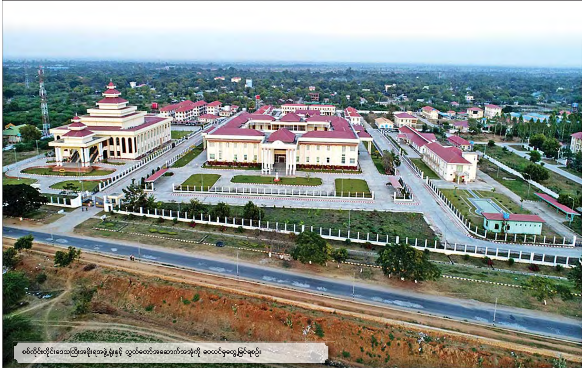
စစ်ကိုင်းတိုင်းဒေသကြီးအစိုးရအဖွဲ့ရုံးနှင့် လွှတ်တော်အဆောက်အအုံကို ဝေဟင်မှတွေ့မြင်ရစဉ်။

ဖြေ။ ။ ဘေးထွက်ဆိုးကျိုးဆိုတာက ကျွန်တော်တို့အစိုးရက သဘာဝပတ်ဝန်းကျင်ကို ထိန်းသိမ်းချင်တယ်။ ပြည်သူလူထုရဲ့ အထူးကဏ္ဍ (၈) သို့ >>>