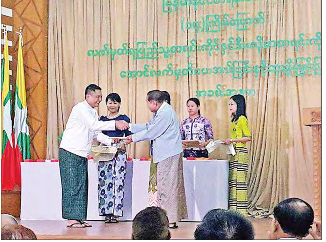
လက်မှတ်ရပြည်သူ့စာရင်းကိုင်နှင့် ဒီပလိုမာစာရင်းကိုင် အောင်လက်မှတ်ပေးအပ်ခြင်းနှင့် ဆုချီးမြှင့်ခြင်းအခမ်းအနား ကျင်းပစဉ်။

ဌာနအဖွဲ့အစည်းများ၏ ငွေကြေးစီမံခန့်ခွဲသုံးစွဲမှု၊ လုပ်ငန်းဆောင်ရွက်မှုများကို ထိထိရောက်ရောက် စစ်ဆေးနိုင်ရန်အတွက် စစ်ဆေးရေးအမျိုးအစားများ တိုးချဲ့ဆောင်ရွက်ခြင်း၊ အရည်အသွေးပြည့်မီသည့် စစ်ဆေးတွေ့ရှိချက်များ ဖော်ထုတ်နိုင်ရန်ဆောင်ရွက်ခြင်းတို့ကိုလည်း ပြုပြင်ပြောင်းလဲဆောင်ရွက်လျက် ရှိသည်။ နိုင်ငံပိုင်ကဏ္ဍနှင့် ပုဂ္ဂလိကကဏ္ဍတို့အနက် ပြည်ထောင်စုစာရင်းစစ်ချုပ်ရုံးသည် နိုင်ငံပိုင်ကဏ္ဍစာရင်းများကို စစ်ဆေးရသည့် အဖွဲ့အစည်းဖြစ်၍ နိုင်ငံတကာစာရင်းစစ်ချုပ်ရုံးများ လိုက်နာဆောင်ရွက်သည့် လီမာကြေညာချက်၊ မက္ကဆီကိုကြေညာချက်နှင့်အညီ စစ်ဆေးရာ၌ ဘဏ္ဍာရေးစာရင်းစစ်ဆေးခြင်း (Financial Audit)၊ စည်းမျဉ်းစည်းကမ်းလိုက်နာမှုစစ်ဆေးခြင်း (Compliance Audit)၊ လုပ်ငန်းဆောင်ရွက်မှုစစ်ဆေးခြင်း (Performance Audit)များကို အဓိကထားဆောင်ရွက်လျက်ရှိသည်။ လုပ်ငန်းဆောင်ရွက်မှု စစ်ဆေးခြင်း၌ ပြည်သူများထံမှကောက်ခံရရှိသည့် အခွန်အကောက်ဖြင့် သုံးစွဲသည့် အစိုးရဌာနများ၏ သုံးစွဲငွေများသည် တန်ရာတန်ဖိုးရရှိမှု ရှုထောင့် (Value for Money) ဖြင့် စစ်ဆေး