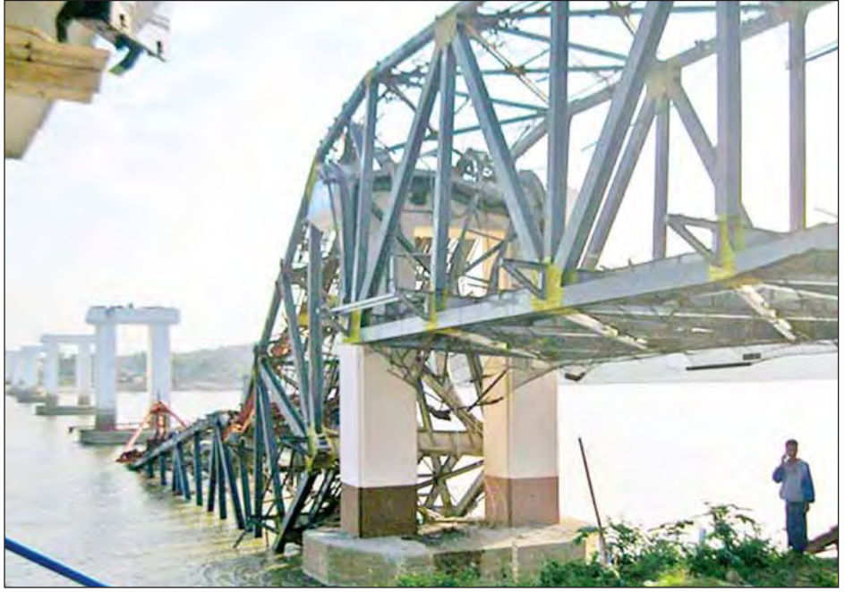
သပိတ်ကျင်းမြို့၌ ၂၀၁၂ ခုနှစ်တွင် အင်အား ရစ်(ချိ)တာစကေး ၆ ဒသမ ၈ လှုပ်ကြီး လှုပ်ခတ်မှုကြောင့် ဧရာဝတီမြစ်ကူး ရတနာသင်္ဘောတန်း ပြိုကျပျက်စီးမှုကို တွေ့ရစဉ်။

ထူးခြားမှုအနေဖြင့် ကမ္ဘာ့မြေငလျင်များလှုပ်ခဲ့သည့် သမိုင်းတွင် ၁၉၇၅ ခုနှစ် ဖေဖော်ဝါရီလ ၄ ရက်က တရုတ် ပြည်သူ့သမ္မတနိုင်ငံ မန်ချူးရီးယားပြည်နယ်တွင် လှုပ်ကြီး လှုပ်မည်ကို လှုပ်ခတ်မှုပညာရှင်များက ကြိုတင်သတိပေးမှု များ ပြုလုပ်နိုင်ခဲ့ကြောင်း သုတေသနလှုပ်ခတ်မှုတမ်းများ အရ သိရသည်။ ။