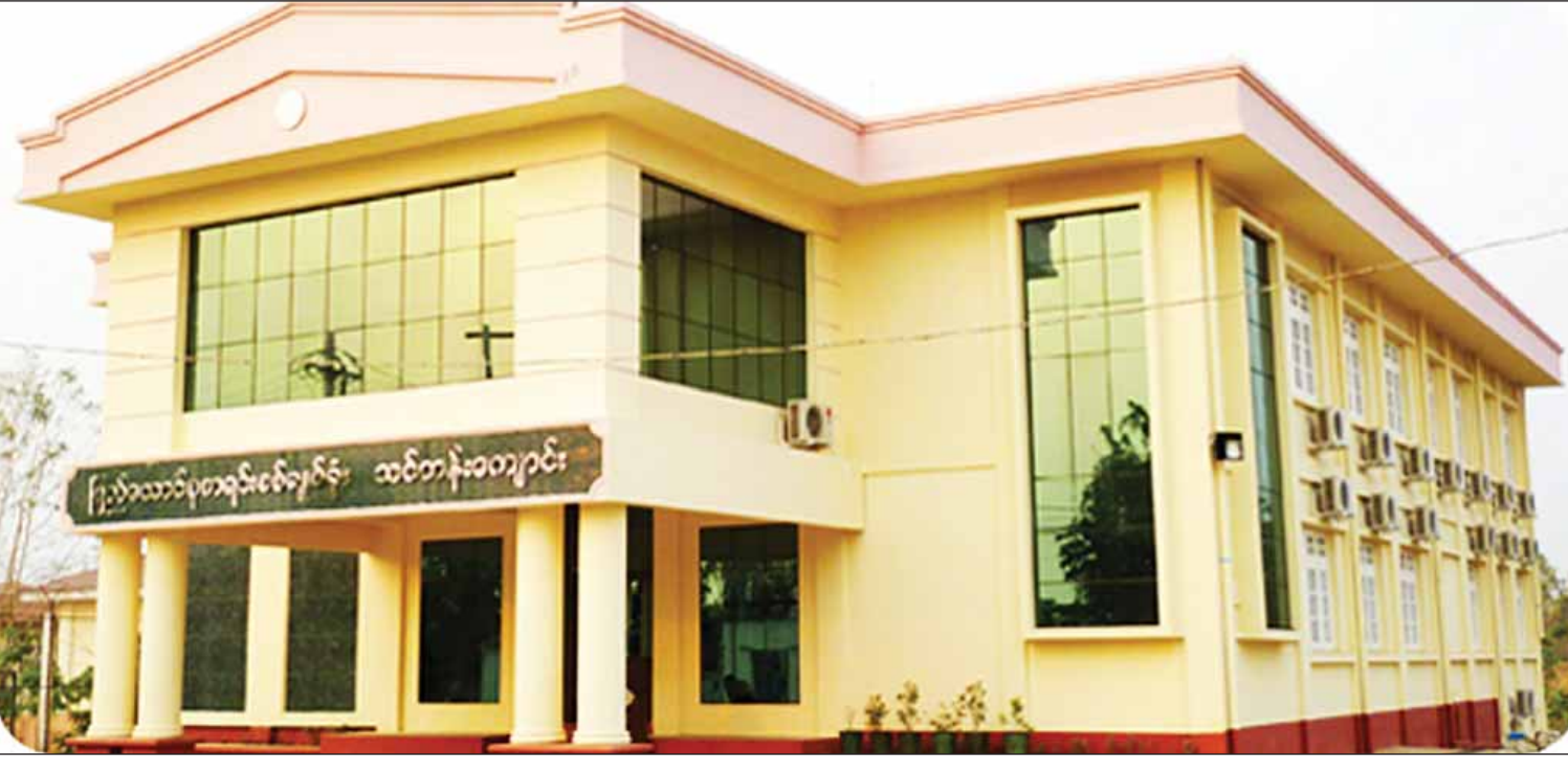
နေပြည်တော်ရှိ ပြည်ထောင်စုစာရင်းစစ်ချုပ်ရုံး သင်တန်းကျောင်း အဆောက်အအုံ။

ရန် ရည်ရွယ်၍ နော်ဝေနိုင်ငံ စာရင်းစစ်ချုပ်ရုံးနှင့် နားလည်မှုစာချွန်လွှာကို နော်ဝေနိုင်ငံ အော်စလိုမြို့၌ ၂၀၁၆ ခုနှစ် အောက်တိုဘာ ၃ ရက်တွင် လက်မှတ်ရေးထိုးခဲ့သည်။ ထိုပြင် နော်ဝေနိုင်ငံ စာရင်းစစ်ချုပ်ရုံးနှင့်ပူးပေါင်း၍ ရေနံကဏ္ဍစစ်ဆေးခြင်းဆိုင်ရာ အလုပ်ရုံဆွေးနွေးပွဲကို ပြည်ထောင်စုစာရင်းစစ်ချုပ်ရုံး နေပြည်တော်၌ ၂၀၁၆ ခုနှစ် စက်တင်ဘာ ၂၆ ရက်မှ ၂၉ ရက်အထိ ကျင်းပခဲ့သည်။ အဆိုပါ အလုပ်ရုံဆွေးနွေးပွဲတွင် ရေနံနှင့် သဘာဝဓာတ်ငွေ့ကဏ္ဍ၌ အဓိကပါဝင်ပတ်သက်သူများ၏အခန်းကဏ္ဍနှင့် တာဝန်ရှိမှုများ၊ ထုတ်လုပ်မှုပေါ် ခွဲဝေခံစားသည့် သဘောတူစာချုပ်ဆိုင်ရာ ကိစ္စရပ်များ၊ အန္တရာယ် နယ်ပယ်ဆိုင်ရာဆန်းစစ်မှု စသည့် အကြောင်းအရာများကို ဆွေးနွေးခဲ့ကြသည်။ နိုင်ငံ၏ အမွေအနှစ် သဘာဝသယံဇာတများအနက် ရေနံနှင့် သဘာဝဓာတ်ငွေ့ ထုတ်လုပ်သုံးစွဲရာ၌ ခွဲဝေခံစားသည့် သဘောတူစာချုပ်များ ရေးထိုးရာတွင်လည်း နိုင်ငံအတွက် နှစ်နှစ်စာရင်းမရှိစေရန်နှင့် နိုင်ငံတကာ လုပ်ထုံးလုပ်နည်းများနှင့်အညီဖြစ်စေရန် ရေနံနှင့် သဘာဝဓာတ်ငွေ့ထုတ်လုပ်မှုပေါ် ခွဲဝေခံစားသည့် သဘောတူစာချုပ်ဆိုင်ရာ အလုပ်ရုံဆွေးနွေးပွဲကိုလည်း ပြည်ထောင်စုစာရင်းစစ်ချုပ်ရုံး နေပြည်တော်၌ ၂၀၁၇ ခုနှစ် ဇန်နဝါရီ ၁၆ ရက်မှ ၂၀ ရက်အထိ ကျင်းပခဲ့သည်။