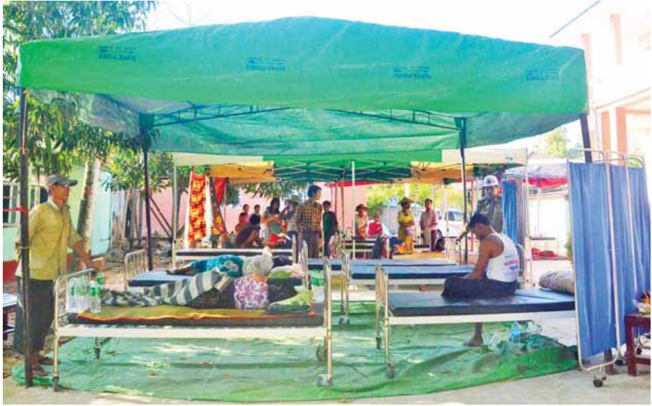
တိုက်ကြီးမြို့ ပြည်သူ့ဆေးရုံကြီးရှိ လူနာများ အဆင်ပြေစေရန် ယာယီရွက်ဖျင်တဲ ထိုးပေးထားစဉ်။