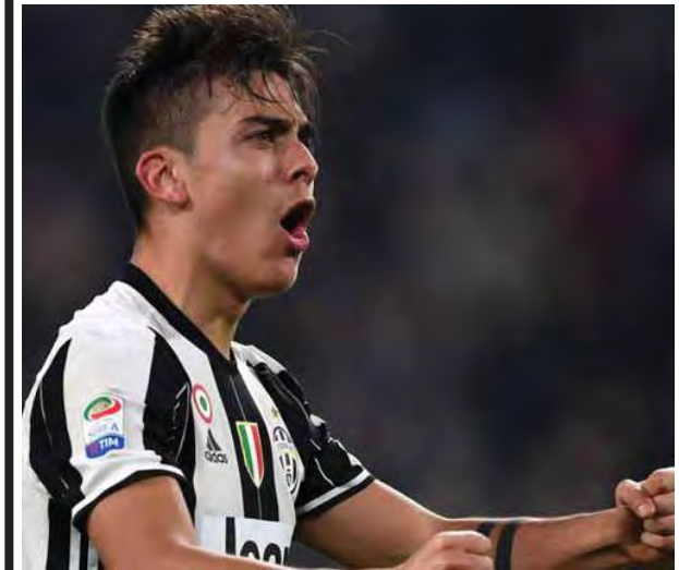
မေရူးဝင်း-စုစည်းသည်