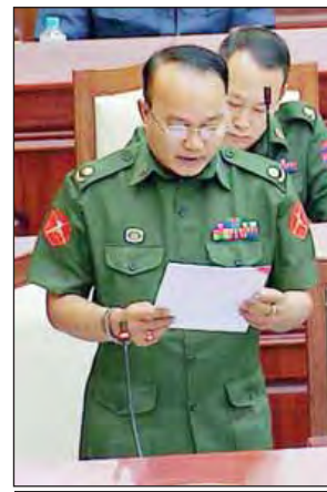
ဗိုလ်မှူးဇော်ဇော်မိုး

လွှတ်တော်ကိုယ်စားလှယ်များ၏ ဆန္ဒမဲ့ အနည်း၊ အများ အပေါ်မူတည်၍ အတည်ပြုသတ်မှတ်ခြင်းထက် အဓိကနှင့် သာမည့်ခွဲခြားကာ လွှတ်တော်၏ ဆောင်ပုဒ်များနှင့်အညီ ဒေသပြည်သူများ၏ ဆန္ဒနှင့် အသံများကိုသာ အလေး ထားဆောင်ရွက်သင့်ပါကြောင်း အကြံပြုဆွေးနွေးသည်။ ရှားတောမဲဆန္ဒနယ်မှ ဒေါ်ဝင်းဝင်းက အဆိုတွင် ဗိုလ်ချုပ်အောင်ဆန်းသည် တိုင်းပြည်လွတ်လပ်ရေးရရန် အောင်ဆန်း-အက်တလီစာချုပ်ကြီး ပေါ်ပေါက်လာရန် ကြိုးပမ်းခဲ့ပြီး တိုင်းရင်းသား သွေးစည်းညီညွတ်ရေး အတွက် ပင်လုံစာချုပ်ကို အောင်မြင်စွာ ချုပ်ဆိုနိုင်ခဲ့သည့် လူထုခေါင်းဆောင်၊ တိုင်းရင်းသားအားလုံး၏ ခေါင်းဆောင် တပ်မတော်၏ ဖခင်ဖြစ်ခဲ့သည်ကို အမှတ်ရစေလိုသည့် ရည်ရွယ်ချက်ကြောင့်ဟု အတိအလင်းဆိုထားသည့် အတွက် လေးနက်ကျယ်ပြန့်စွာ တွေးတောကြည့်ပါက သာမန်အဆိုတစ်ရပ် မဟုတ်ဘဲ နိုင်ငံရေးအခြေအနေ အရပ်ရပ်များကြောင့် နိုင်ငံရေးအရ အဆိုသည် ထောက်ခံ ရမည်အဆိုဖြစ်ကြောင်း ဆွေးနွေးသည်။