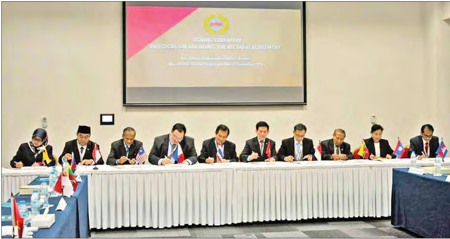
ပြည်ထောင်စုစာရင်းစစ်ချုပ် ဦးမော်သန်း ၂၀၁၆ ခုနှစ် ဒီဇင်ဘာလက အာရှစာရင်းစစ်ချုပ်များပြည်ထောင်စု အဘူဒါဘီမြို့တွင် အာဆီယံစာရင်းစစ်ချုပ်ရုံးများ သဘောတူညီချက်ပြင်ဆင်ရေး ညှိနှိုင်းချက်အခမ်းအနားတွင် လက်မှတ်ရေးထိုးစဉ်။

အစည်းအဝေး၊ ဆွေးနွေးပွဲနှင့် အလုပ်ရုံဆွေးနွေးပွဲများအပြင် သင်တန်းများသို့ပါ စဉ်ဆက်မပြတ် စေလွှတ်လျက်ရှိပါသည်။ ဝန်ထမ်းသုံးဦးတို့အား ပြည်ပတက္ကသိုလ် နှစ်ခုသို့ ဘွဲ့လွန်သင်တန်းများတက်ရောက်ရန် စေလွှတ်ထားရှိပါသည်။