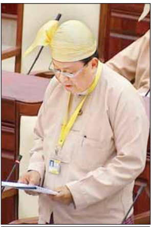
ပြည်ထောင်စုဝန်ကြီး ဦးဝင်းခိုင်

တပ်မတော်သားလွှတ်တော်ကိုယ်စားလှယ် ဗိုလ်မှူး ဇော်ဇော်မိုးက လွှတ်တော်၏ဆောင်ပုဒ်သည် ပြည်သူ့ အသံ-လွှတ်တော်အသံ၊ ပြည်သူ့ဆန္ဒ-လွှတ်တော်ဆန္ဒ၊ ပြည်သူတို့၏ မှော်လင့်ချက်-လွှတ်တော်က ဖော်ဆောင်ရွက် တို့ဖြစ်ပါကြောင်း၊ ထို့အတူ ယခင် အစိုးရလက်ထက်က တိုင်းဒေသကြီးနှင့် ပြည်နယ်အသီးသီး၌ တည်ဆောက် ဖွင့်လှစ်ခဲ့သည့် တံတားများ၏ အမည်ပေးမှုများ အပေါ် ဒေသပြည်သူများ၏ သဘောထားတုံ့ပြန်မှု များကိုလည်း နမူနာကောင်းအဖြစ် လေ့လာဆောင် ရွက်သင့်ပါကြောင်း၊ သို့ဖြစ်ပါ၍ ပြည်သူ့လွှတ်တော်သို့ တင်ပြ၍ ပြည်ထောင်စုအစိုးရအား တိုက်တွန်းရသည် အထိ ဖြစ်ပေါ်လာခဲ့သည့် အဆိုတွင်ပါရှိသည့် တံတား အမည်သတ်မှတ်ပေးရေးနှင့်စပ်လျဉ်း၍ ပြည်သူ့