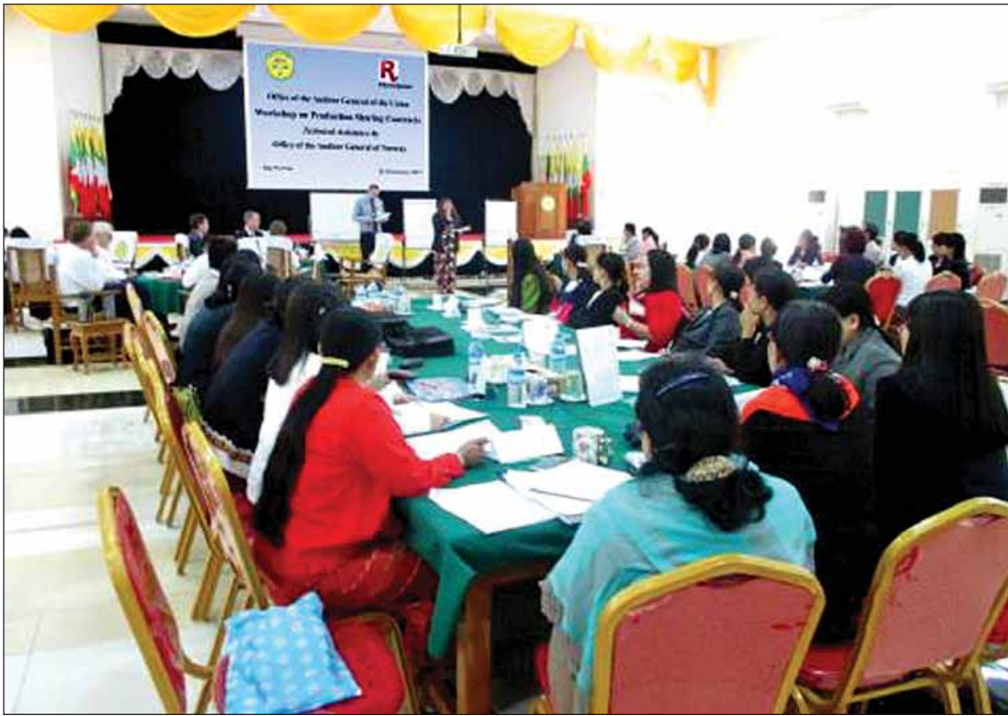
ပြည်ထောင်စုစာရင်းစစ်ချုပ်ရုံးနှင့် နော်ဝေနိုင်ငံ စာရင်းစစ်ချုပ်ရုံးတို့ပူးပေါင်း၍ Production Sharing Contract ဆိုင်ရာ အလုပ်ရုံဆွေးနွေးပွဲကျင်းပစဉ်။

ပြည်ထောင်စုစာရင်းစစ်ချုပ်ရုံး၏ လုပ်ငန်းစွမ်းဆောင်ရည်တိုးမြှင့်စေရန် အာရှဖွံ့ဖြိုးရေးဘဏ်(ADB) နှင့်ပူးပေါင်း၍ ဘဏ္ဍာရေးစာရင်းစစ်ဆေးခြင်း အလုပ်ရုံဆွေးနွေးပွဲကို ပြည်ထောင်စုစာရင်းစစ်ချုပ်ရုံး နေပြည်တော်၌ ၂၀၁၆ ခုနှစ် ဇူလိုင် ၂၀ ရက်မှ ဩဂုတ် ၅ ရက်အထိ ပြုလုပ်ခဲ့ပြီး လျှပ်စစ်နှင့်စွမ်းအင်ဝန်ကြီးဌာန၊ ဆောက်လုပ်ရေးဝန်ကြီးဌာနတို့၌ ADB အထောက်အပံ့ဖြင့် ဆောင်ရွက်နေသည့် လုပ်ငန်းစီမံကိန်းနှစ်ခုကို လက်တွေ့စမ်းသပ်စစ်ဆေးမှုများ ပြုလုပ်ခဲ့သည်။