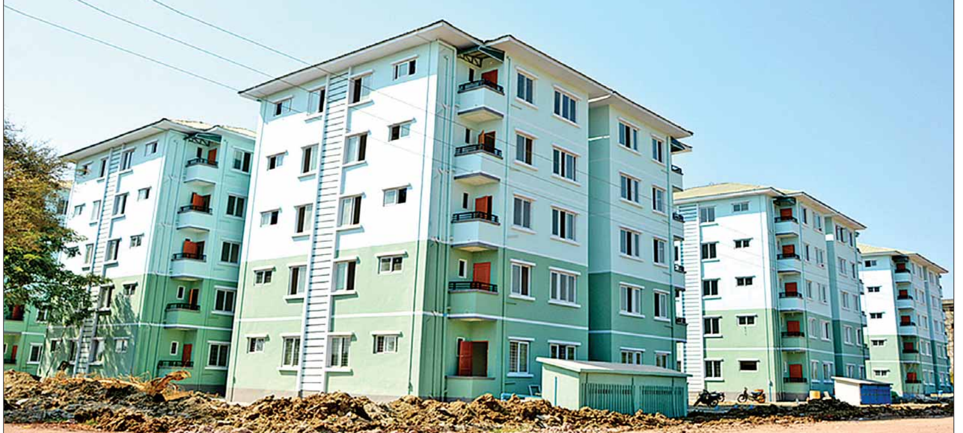
စစ်ကိုင်းတိုင်းဒေသကြီးအစိုးရအဖွဲ့၏ စီစဉ်ကြီးကြပ်မှုဖြင့် တည်ဆောက်နေသော နန္ဒဝန်အိမ်ရာစီမံကိန်း။