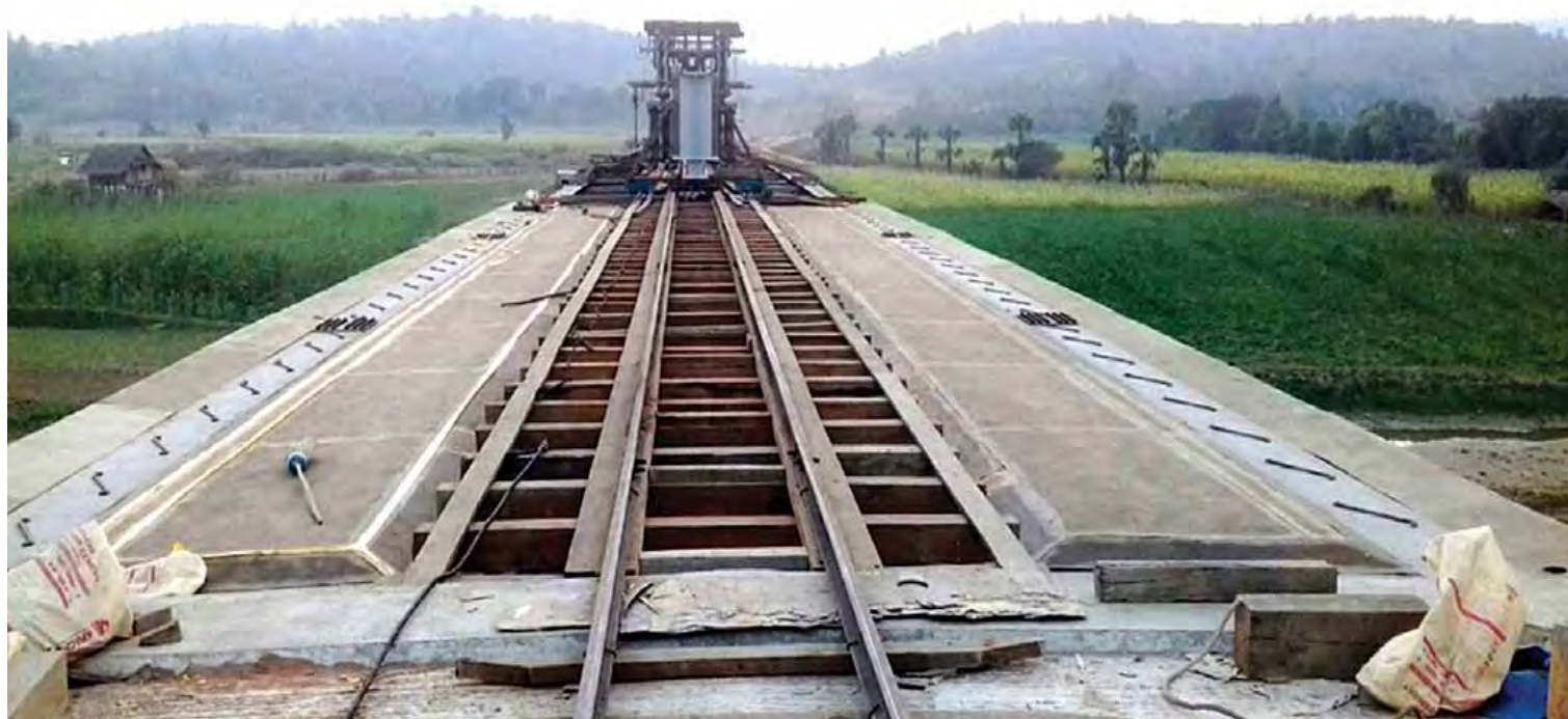
ဝန်းသို-အင်းတော်လမ်းပေါ်ရှိ မဲဇာချောင်းတံတား တည်ဆောက်နေမှုကို တွေ့ရစဉ်။ အထူးကဏ္ဍ (၈) သို့ >>>

အဆင့်မြှင့်လယ်ဧက ၅၀၀ နှင့် မြေလွတ်မြေရိုင်း လယ်ဧက ၁၀၀၀ ဖော်ထုတ် ဒီလိုဆောင်ရွက်ခဲ့တဲ့ စီမံကိန်းတွေထဲမှာ စိုက်ပျိုးရေးကဏ္ဍဘက်စုံဖွံ့ဖြိုးတိုးတက်ဖို့ ပြည်ထောင်စုမှရန်ပုံငွေကျပ် ၁ ဒသမ ၇၈၈ ဘီလီယံနဲ့ တိုင်းဒေသကြီး ရန်ပုံငွေ ကျပ် ၅ ဒသမ ၆၃၉ ဘီလီယံ၊ စုစုပေါင်း ကျပ် ၇ ဒသမ ၄၂၇ ဘီလီယံသုံးစွဲပြီး ဆောင်ရွက်ပေးနိုင်ခဲ့ပါတယ်။ ဒီနေရာမှာ အဆင့်မြှင့်လယ်ဧက ၅၀၀ နဲ့ မြေလွတ်မြေရိုင်းမှ လယ်ဧက ၁၀၀၀ ကို ဖော်ထုတ်ပေးနိုင်ခဲ့ပါတယ်။