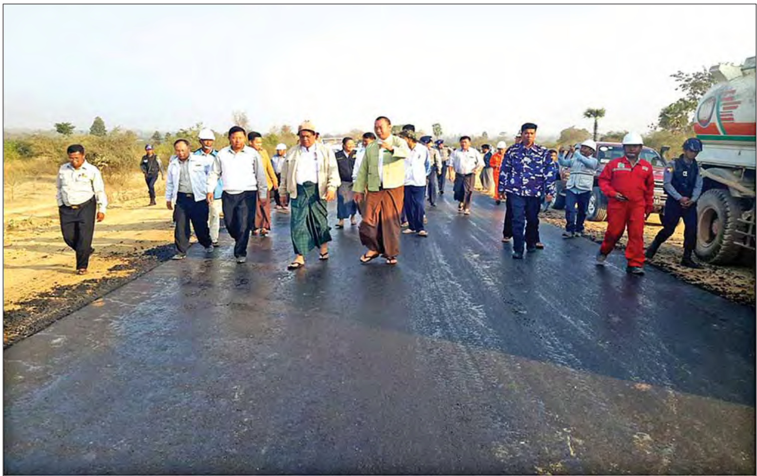
စစ်ကိုင်းတိုင်းဒေသကြီး ဝန်ကြီးချုပ် ဒေါက်တာမြင့်နိုင် နိုင်လွန်ကတ္တရာလမ်းခင်းနေမှုကို ကြည့်ရှုစစ်ဆေးစဉ်။

ဒီလို သဘာဝဘေးအန္တရာယ်ဆိုင်ရာ စီမံခန့်ခွဲမှုကိစ္စရပ်တွေကို ဆောင်ရွက်နေသလို သဘာဝပတ်ဝန်းကျင် ထိန်းသိမ်းရေးလုပ်ငန်းတွေကိုလည်း ဦးတည်ကြိုးပမ်းဆောင်ရွက်လျက်ရှိပါတယ်။ ထမံသီ၊ ပင်လည်ဘူး၊ မဟာမြိုင်၊ ချပ်သင်း၊ အလောင်းတော်ကဿပ စတဲ့ သစ်တောကြီးများနဲ့ တောရိုင်းတိရစ္ဆာန်ထိန်း