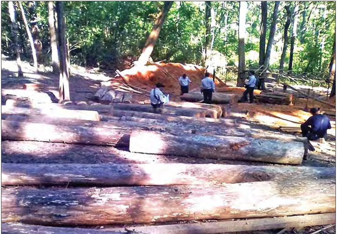
သိမ်းဆည်းရမိထားသည့် တရားမဝင်သစ်များ။

ဖြေ။ ။ ဒီမိုကရေစီရေချိန်နဲ့အတူ မီဒီယာကလည်း ထောက်ပြဝေဖန်မှုတွေ ပိုမိုရှိလာတဲ့အတွက် ပွင့်လင်းမြင်သာမှု၊ တာဝန်ယူမှု၊ တာဝန်ခံမှုစတဲ့ ဒီမိုကရေစီကျင့်စဉ်များ ရှင်သန်ရင့်ကျက်ပြီး ကျွန်တော်တို့ရဲ့ ပြောင်းလဲမှုတွေကို ဆက်လက်ဆောင်ရွက်သွားမှာဖြစ်ပါတယ်။ ဖြည့်စွက်ပြောကြားလိုပါတယ်။ ကျေးဇူးတင်ပါတယ်ခင်ဗျာ။