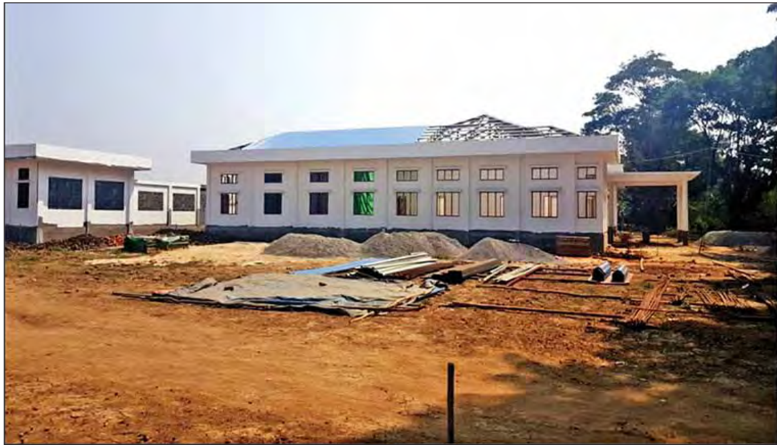
စစ်ကိုင်းတိုင်းဒေသကြီး ရွှေဘိုမြို့နယ်ရှိ ဆင်အင်တိုက်နယ်ဆေးရုံဆောက်လုပ်နေမှုကို တွေ့ရစဉ်။

ဖြေ။ ။ တိုင်ကြားစာတွေထဲမှာ အများဆုံး တိုင်ကြားတဲ့ အကြောင်းအရာကတော့ မြေယာကိစ္စတွေပဲဖြစ်ပါတယ်။ ပြီးခဲ့တဲ့ ခေတ်စနစ်တစ်ခုမှာ မြေဧရိယာမြောက်မြားစွာကို လက်ဦးမှုရယူသိမ်းပိုက်ထားပြီး ဘယ်လုပ်ငန်းကိုမှ အကောင်အထည်ဖော်ဆောင်ရွက်ခြင်း မရှိတာကြောင့် နိုင်ငံတော်အတွက်သော်လည်းကောင်း၊ မူလပိုင်ရှင်များ အတွက်သော်