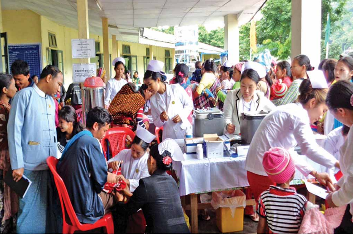
နာဂဒေသတွင် ဝက်သက်ရောဂါကာကွယ်ဆေးထိုးနှံပေးနေသည်ကို တွေ့ရစဉ်။

ပြီး ရေဝပ်ဒေသတွေ ပြန်ပေးရပါမယ်။ သစ်တောတွေ ထိန်းသိမ်းရေးကိုဆောင်ရွက်ဖို့အတွက် နိုင်ငံတော်ရဲ့မူဝါဒအရ သစ်ထုတ်လုပ်မှုတွေကို ရပ်ဆိုင်းထားပါတယ်။ လက်ကိုင်စက်လွှဲထိန်းချုပ်ရေးအဖွဲ့တွေကို ဖွဲ့စည်းပြီး စစ်ဆေးအရေးယူမှုတွေ ဆောင်ရွက်လျက်ရှိပါတယ်။ တရားမဝင်သစ် သယ်ယူပို့ဆောင်မှုတွေကို ထိထိရောက်ရောက်ဖမ်းဆီးအရေးယူဆောင်ရွက်လျက်ရှိပါတယ်။ ဒီနေရာမှာ ပြည်သူ့လူထုက သတင်းပေးတိုင်ကြားမှုတွေလည်း ပိုမိုများပြားလာသလို ဖမ်းဆီးရမိမှုတွေလည်း ရှိခဲ့ပါတယ်။ တရားမဝင်သစ်ဖမ်းဆီးမှုမှာ ဝန်ထမ်းတွေ အသက်ဆုံးရှုံးမှုရှိခဲ့ကြောင်း ဝမ်းနည်းဖွယ်တွေ့ရှိရပါတယ်။ ဒီလို အသက်စွန့်လွှတ်ပြီး တာဝန်ထမ်းဆောင်ခဲ့တဲ့ ဝန်ထမ်းတွေရှိသလို မှောင်ခိုစိုးပွားရေးသမားတွေနဲ့ ပေါင်းပြီး သစ္စာမဲ့စွာဆောင်ရွက်နေသူတွေလည်း ရှိနေသေးတာကြောင့် သတင်းအတိအကျ ပေးသော်လည်း ဖမ်းဆီးရမိနိုင်ခြင်းမရှိတဲ့ အခြေအနေတွေလည်း တွေ့နေရပါတယ်။