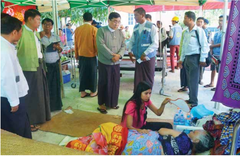
ပြည်ထောင်စုဝန်ကြီး ဒေါက်တာဝင်းမြတ်အေး ငလျင်လှုပ်ခတ်မှုကြောင့် ထိခိုက်ဒဏ်ရာရရှိသူများအား ကြည့်ရှုအားပေးစဉ်။