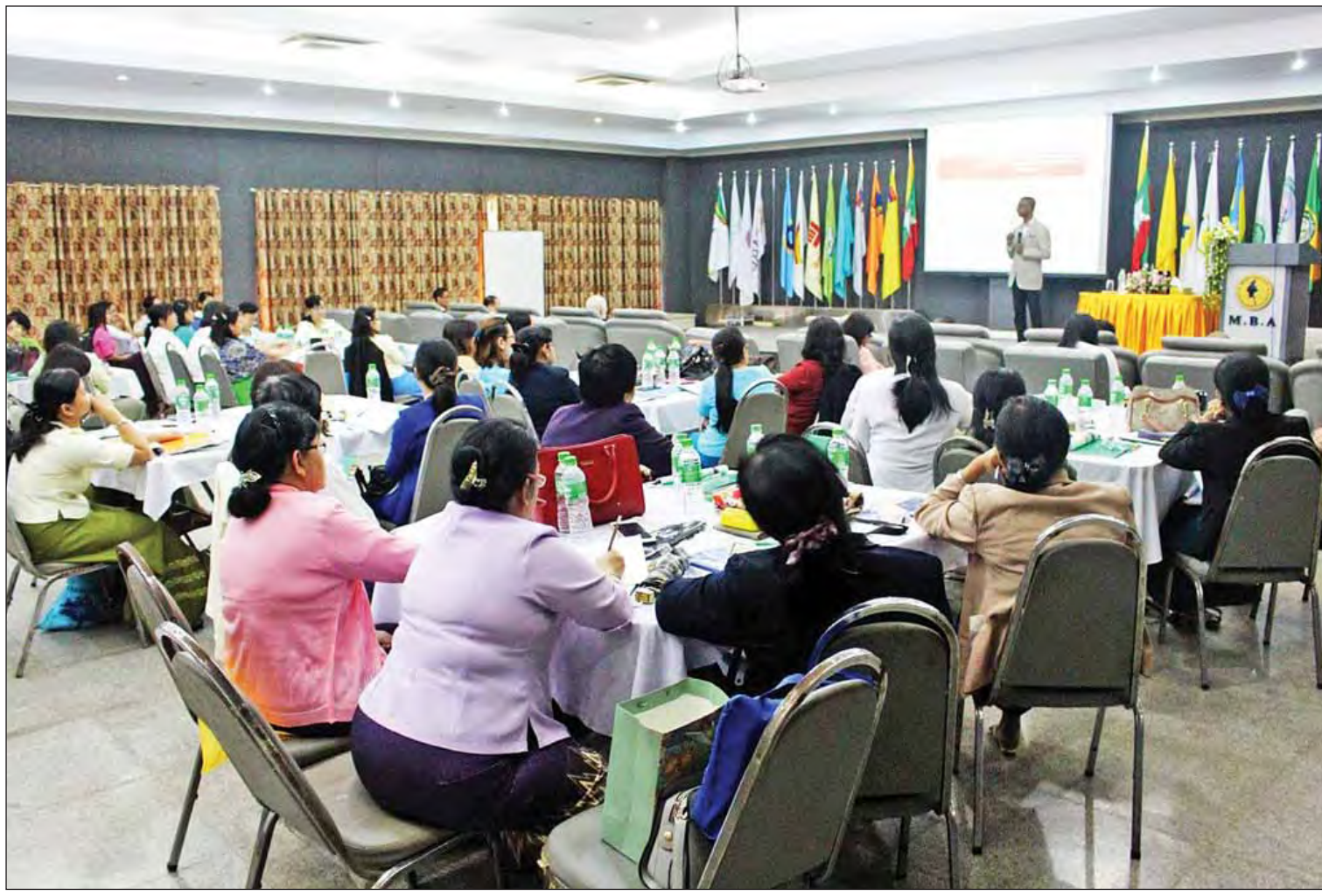
ဘဏ်များတွင် နိုင်ငံတကာစာရင်းစံပြောင်းလဲကျင့်သုံးရေး အလုပ်ရုံဆွေးနွေးပွဲ- ၂၀၁၆ ကျင်းပစဉ်။

“ဒီသင်တန်းတွေကို အရင်က မြန်မာနိုင်ငံစာရင်းကောင်စီကဖွင့်လှစ်တဲ့ သင်တန်းကျောင်းတွေမှာပဲ တက်ရောက်ခွင့်ရရှိခဲ့ပေမယ့် အခု မြန်မာနိုင်ငံစာရင်းကောင်စီက ဖွင့်လှစ်အထူးကဏ္ဍ (ဃ) သို့ >>>