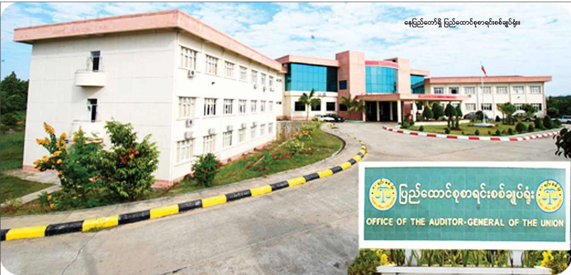
နေပြည်တော်ရှိ ပြည်ထောင်စုစာရင်းစစ်ချုပ်ရုံး။

နိုင်ငံတကာတွင် ဘဏ္ဍာရေး စာရင်းစစ်ဆေးခြင်းကို တစ်နှစ်လျှင် တစ်ကြိမ်သာ ပြုလုပ်ပြီး ကောင်းမွန်သောအလေ့အထအဖြစ် လက်ခံကျင့်သုံးလျက်ရှိခြင်းကြောင့် လည်းကောင်း၊ ပြည်ထောင်စုစာရင်းစစ်ချုပ်ရုံးအနေဖြင့် ဖွဲ့စည်းပုံအရ ဝန်ထမ်းအင်အားပြည့်ဆောင်ရွက်ရန် ဘဏ္ဍာငွေကြေးခွင့်မြှင့်တင်မှု အထူးကဏ္ဍ (ခ) သို့ >>>