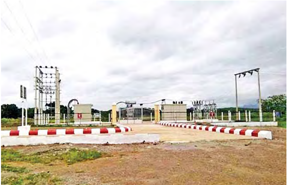
ဆီဆိုင်မြို့နယ် ဘန်းယဉ်ကျေးရွာနှင့် အနီးပတ်ဝန်းကျင်ကျေးရွာများ လျှပ်စစ်ဓာတ်အားရရှိရေးဆောင်ရွက်ထားသည်ကို တွေ့ရစဉ်။

လျှပ်စစ်ဓာတ်အားပြန်ဖြူးမှုကောင်းမွန်စေရေးနှင့် ကျေးရွာမီးလင်းရေးလုပ်ငန်းများကို ဆောင်ရွက်ပေးခဲ့ရာ ၂၀၁၆-၂၀၁၇ ဘဏ္ဍာနှစ်အတွင်း ပြည်နယ်အစိုးရ၏ မူလခွင့်ပြုရန်ပုံငွေ၊ ဗြည့်စွက်ရန်ပုံငွေ၊ အထွေထွေရန်ပုံငွေ စုစုပေါင်း ငွေကျပ် ၁၈၁၆၈ ဒသမ ၇၅၈ သန်းဖြင့် ၁၁ ကေပီလိုင်း ၆၁ ဒသမ ၉၃ မိုင်၊ ၄၀၀ ပို့လိုင်း ၆၆ ဒသမ ၅၉ မိုင်နှင့် ၁၁/သုည ဒသမ ၄ ကေပီ ထရန်စဖော်မာ ၆၆ လုံး၊ ၁၁၉၀၅ ကေပီ တိုးချဲ့တည်ဆောက်ပေးနိုင်ခဲ့သည်။ ကျေးရွာပေါင်း ၁၇၄ ရွာတွင် အိမ်ခြေ ၂၃၄၃၀၊ အိမ်ထောင်စု ၂၄၅၅၂ စုနှင့် မီးသုံးစွဲသူ ၆၆၃၈၂ ဦးခန့်အား လျှပ်စစ်ဓာတ်အား သုံးစွဲနိုင်ရေး ဆောင်ရွက်ပေးနိုင်ခဲ့