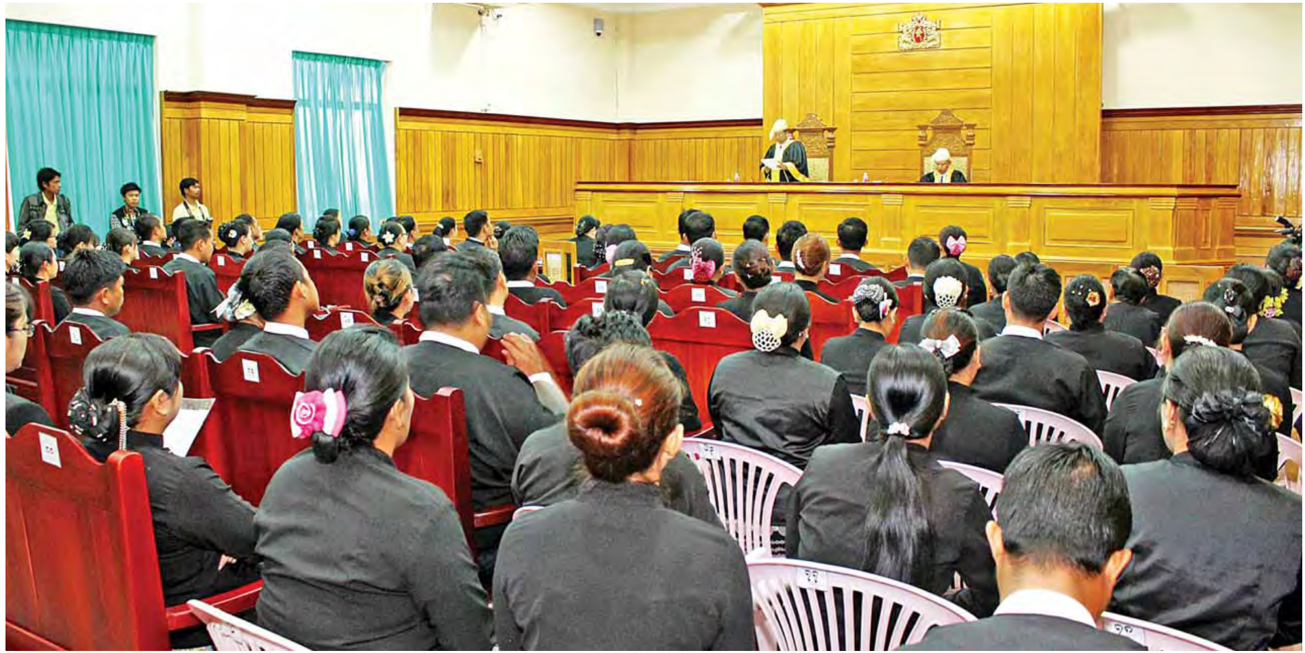
တရားလွှတ်တော်ရှေ့နေ အသိအမှတ်ပြုလက်မှတ်ပေးအပ်ပွဲအခမ်းအနားကျင်းပနေမှုမြင်ကွင်း။