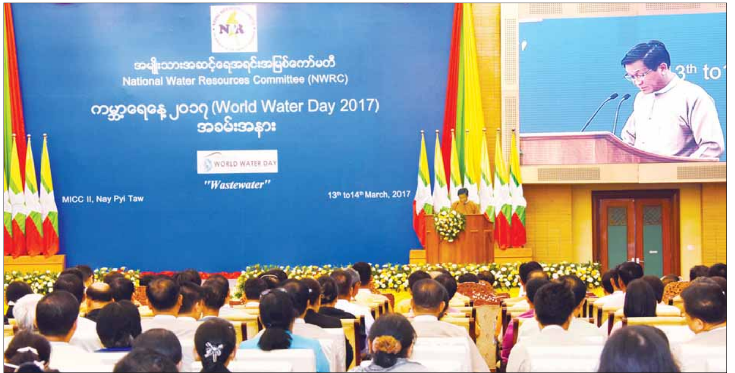
ဒုတိယသမ္မတ ဦးဟင်နရီဗန်ထီးယူ ၂၀၁၇ ခုနှစ် ကမ္ဘာ့ရေနေ့ အထိမ်းအမှတ်အခမ်းအနားတွင် အမှာစကားပြောကြားစဉ်။ (သတင်းစဉ်)

ဒုတိယသမ္မတက ယခုနှစ်အတွက် ကမ္ဘာ့ရေနေ့၏ အထူးပြုအကြောင်းအရာမှာ စွန့်ပစ်ပစ္စည်းတူးနေသည့် ရေ (Wastewater) ဖြစ်ပါကြောင်း၊ ၂၀၁၇ ခုနှစ် ကမ္ဘာ့ ရေနေ့ အကြောင်းအရာဖြစ်သည့် Wastewater မှတစ်ဆင့် စွန့်ပစ်ရေကို စာမျက်နှာ ၃ ကော်လံ ၁ သို့