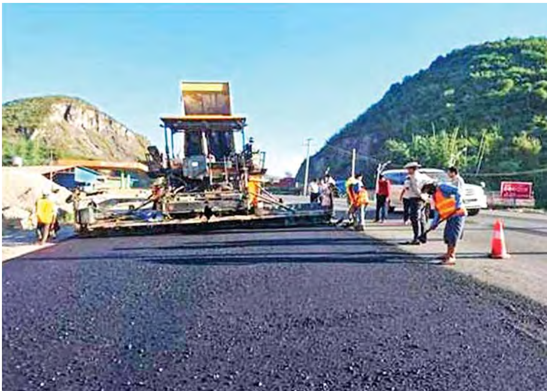
မန္တလေး-လားရှိုး-မူဆယ်လမ်း(၂၆၁/၂-၂၈၅/၀)ကြား ၄၈ ပေ လေးလမ်းသွားချဲ့ခြင်းလုပ်ငန်းဆောင်ရွက်နေသည်ကို တွေ့ရစဉ်။

နှုန်းမြစ်ရာ ပြည်နယ်အတွင်း စာတတ်မြောက်မှုနှုန်း တိုးတက်လာစေရန် တောင်ကြီးခရိုင် စာတတ်မြောက်ရေးလုပ်ငန်းကို ယခုနှစ် ဇန်နဝါရီ ၁၂ ရက်မှစတင်၍ မြို့နယ် ကိုး မြို့နယ်တွင် ဆောင်ရွက်ခဲ့သည်။ စာကျက်ပိုင်း ၂၅၀၄ ပိုင်း၊ စာသင်သား ၁၆၉၇၂ ဦးကို ဆရာ ဆရာမ ၂၆၈၅ ဦးက တစ်ရက်လျှင် သုံးနာရီဖြင့် ရက်ပေါင်း ၄၀ သင်ကြားပေးခဲ့သည်။ စာဖတ်ရွှိန်မြှင့်တင်ရေးနှင့် သက်မွေးလုပ်ငန်းသင်တန်းများ ဖွင့်လှစ်ခြင်းကိုလည်း ဆက်လက်ဆောင်ရွက်သွားမည်ဖြစ်ကြောင်း သိရသည်။