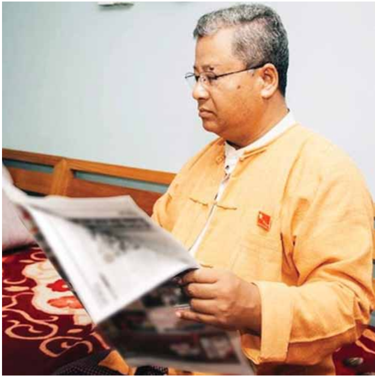
ရှမ်းပြည်နယ်ဝန်ကြီးချုပ် ဒေါက်တာလင်းထွဋ်

စီမံချက်အရ ၂၀၁၆-၂၀၁၇ ဘဏ္ဍာနှစ်တွင် ရှမ်းပြည်နယ်အတွင်းရှိ မြို့နယ်ပေါင်း ၄၇ မြို့နယ် ကျေးရွာပေါင်း ၄၇ ရွာတွင် ကျေးရွာ ဂရန် ၄၃၆၄ ခုကို ကျေးလက်နေပြည်သူများ