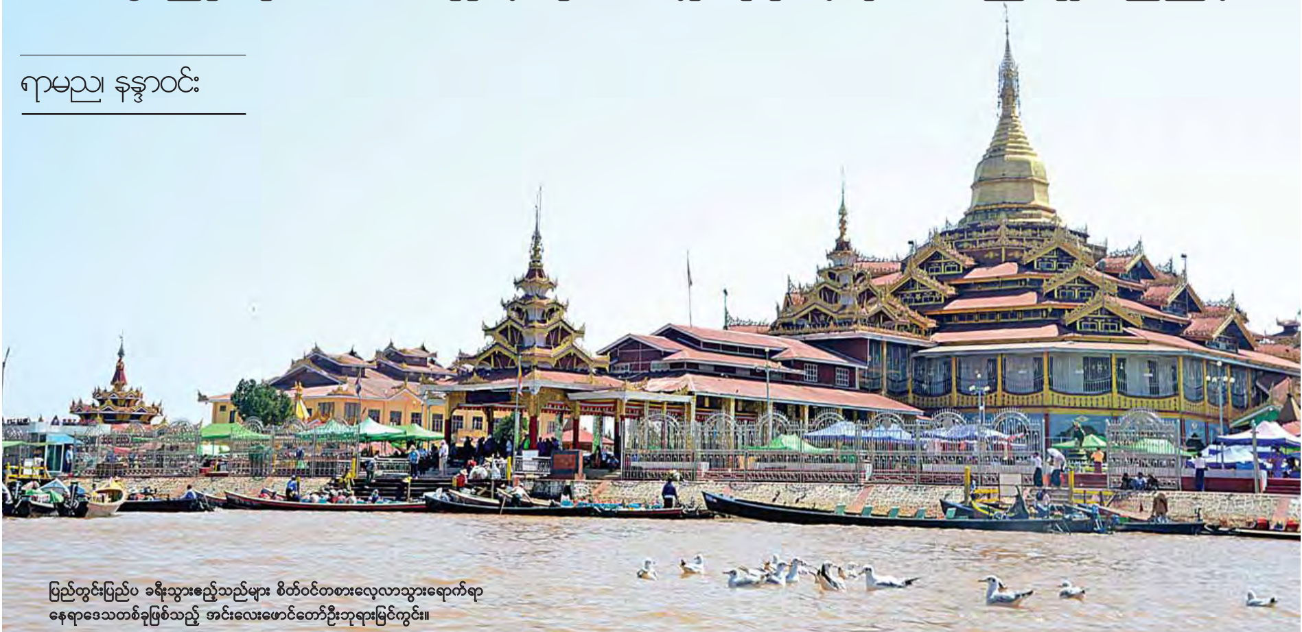
ပြည်တွင်းပြည်ပ ခရီးသွားဧည့်သည်များ စိတ်ဝင်တစားလေ့လာသွားရောက်ရာ နေရာဒေသတစ်ခုဖြစ်သည့် အင်းလေးဖောင်တော်ဦးဘုရားမြင်ကွင်း။

မြန်မာရာဇဝင်သမိုင်းများ၊ ကုန်းဘောင် သီပေါ ရာဇဝင်များအရ ရှမ်းပြည်ကို စတင် တည်ထောင်သူမှာ ဘိန္နကမင်းဖြစ်သည်ဟု ဆိုကြပြီး “ရှမ်းမင်းအစ ဘိန္နက”ဟုပင် ဆိုခဲ့ ကြသည်။ တောင်ပေါ်ဒေသဖြစ်ပြီး ချမ်းအေး သည့် ရာသီဥတုရှိသော ရှမ်းပြည်နယ်သည် မြန်မာနိုင်ငံရှိ တိုင်းဒေသကြီးနှင့် ပြည်နယ်များ အနက် အကြီးဆုံးဖြစ်သည်။