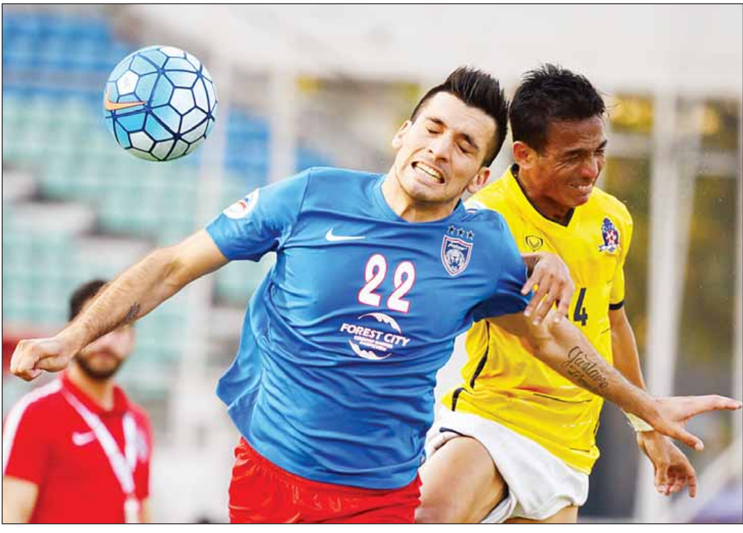
၂၀၁၇ AFC Cup ပြိုင်ပွဲယှဉ်ပြိုင်နေသည့် မကွေးအသင်း။