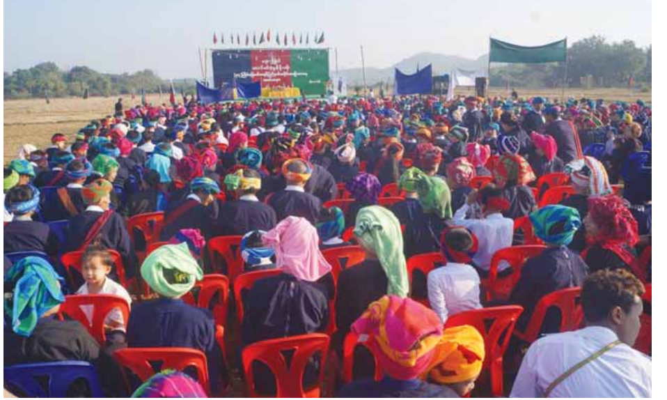
ဆွေးနွေးပွဲဆိုင်ရာ ပအိုဝ်းအမျိုးသားနိုင်ငံရေးဆွေးနွေးပွဲသို့ ကိုယ်စားလှယ်များတက်ရောက်ခဲ့ကာ ပြည်ထောင်စုဖွဲ့စည်းရေးတိုင်းရင်းသားအားလုံး နိုင်ငံရေးဆွေးနွေးပွဲအဆင့်ဆင့်တွင် ပါဝင်လာစေရေးနှင့် ဗီဒီကရေစီဖက်ဒရယ် ပြည်ထောင်စုဆီသို့ အရောက်ချီတက်သွားနိုင်ရေး အစဉ်တစိုက်ကြိုးပမ်းဆောင်ရွက်သွားမည်ဖြစ်ကြောင်း သိရသည်။

ကရင်ပြည်နယ်ရှိ ပအိုဝ်းတိုင်းရင်းသားများအနေဖြင့် ဇန်နဝါရီ ၂၂ ရက်တွင် ပအိုဝ်းတစ်မျိုးသားလုံးဆိုင်ရာ အမျိုးသားအဆင့် နိုင်ငံရေးဆွေးနွေးပွဲ (အကြံ) ကရင်ပြည်နယ် ပအိုဝ်းလူထုတွေ့ဆုံပွဲကို ဘားအံမြို့၊ ဇွဲကပင်ခန်းမ၌ ကျင်းပခဲ့ပြီး ပအိုဝ်းကိုယ်ပိုင်အုပ်ချုပ်ခွင့်ရဒေသ တိုင်းပြည်တွင် မေဖော်ဝါရီ ၁၆ ရက်မှ ၂၀ ရက်ထိ ကျင်းပခဲ့သော ပထမအကြိမ် လူမျိုးအလိုက် အမျိုးသားအဆင့် နိုင်ငံရေး