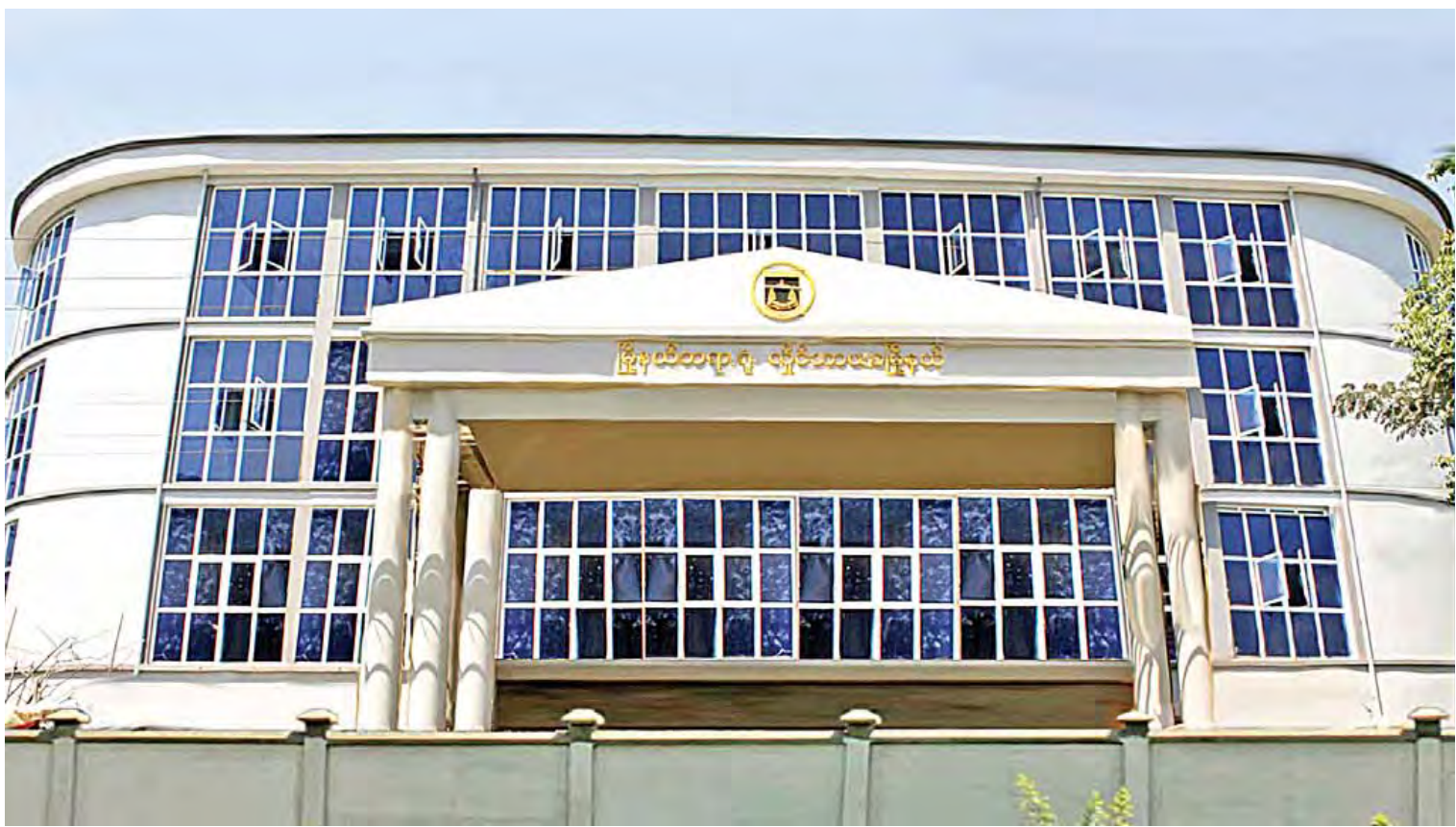
ရန်ကုန်မြို့၊ လှိုင်သာယာမြို့နယ်ရှိ မြို့နယ်တရားရုံးအဆောက်အအုံ။