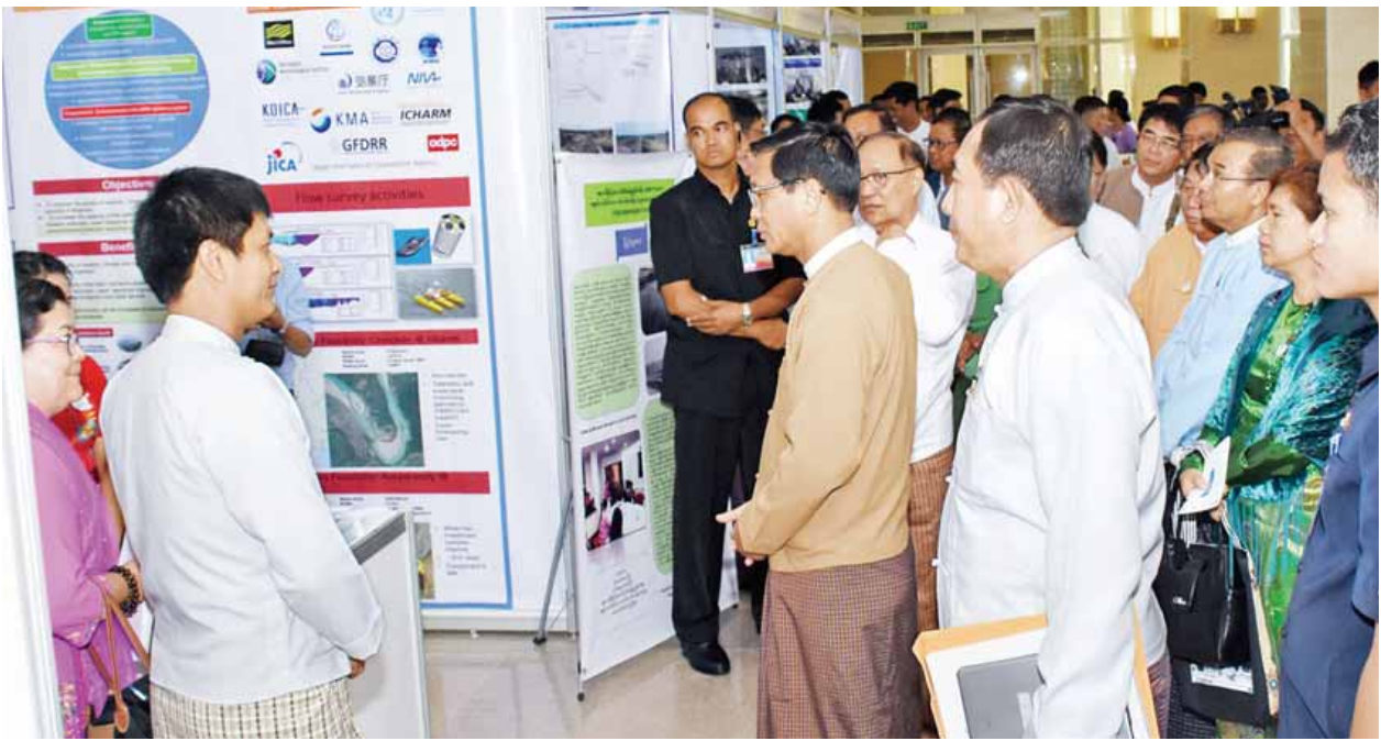
ဒုတိယသမ္မတ ဦးဟင်နရီနီထီးယူ ရေအရင်းအမြစ်အသုံးချရေးဆိုင်ရာ ပြခန်းများကို လှည့်လည်ကြည့်ရှုစဉ်။ (သတင်းစဉ်)

အနာဂတ်ရေဆိုင်ရာ မျှော်မှန်းချက်များအတွက် အမျိုးသားအဆင့် ရေမူဝါဒကို အမျိုးသားအဆင့် ရေအရင်းအမြစ်ကော်မတီ၏ အကြံပေးအဖွဲ့၏