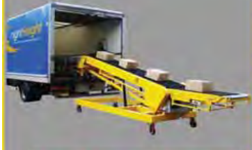
Truck Loading Conveyor