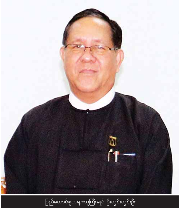
ပြည်ထောင်စုတရားသူကြီးချုပ် ဦးထွန်းထွန်းဦး

လူထု၏ ယုံကြည်ကိုးစားမှုဖြင့်တင် မေး။ ။ ပြည်ထောင်စုတရားလွှတ်တော် ချုပ်အနေနဲ့ တရားစီရင်ရေးဆိုင်ရာမှာ နိုင်ငံတကာနဲ့ ပူးပေါင်းဆောင်ရွက်မှုတွေကို