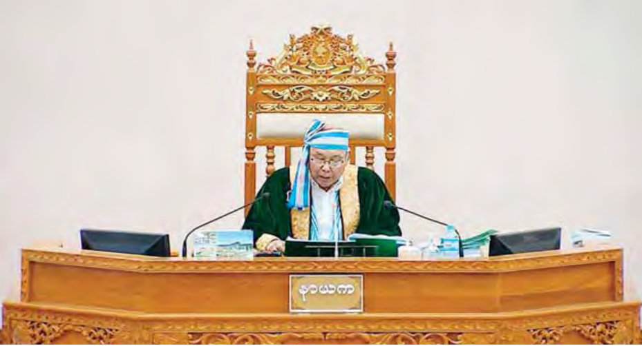
ပြည်ထောင်စုလွှတ်တော်နာယက မန်းဝင်းခိုင်သန်း။

လုံလောက်အောင်ဖြည့်ဆည်းပေးနိုင်မူမရှိပါကြောင်း၊ သို့ဖြစ်ပါ၍ ပြည်ပမှသက်သာသောဆေးဝါးများကို ရယူအကောင်အထည်ဖော်ဆောင်ရွက်ခြင်းသည် စနစ်တကျ အသုံးပြုနိုင်ပါက လျော်ကန်သင့်မြတ်ပါကြောင်း၊ နိုင်ငံတော်၏ စီးပွားရေးဖွံ့ဖြိုးမှုနှုန်းက ရည်မှန်းထားသည့် အတိုင်းရရှိစေရန်နှင့် စဉ်ဆက်မပြတ်ဖွံ့ဖြိုးတိုးတက်စေရန်အတွက် ပြည်တွင်းအား ပြည်ပအားတို့ကို ရယူကြိုးပမ်းဆောင်ရွက်ရမည်ဖြစ်ပါကြောင်း၊ နှစ်ရှည်ဆေးဝါးများကို ရယူပြီးသည့်အခါတွင်လည်း တာဝန်သိစွာ အချိန်မှန်ပြန်လည်ပေးဆပ်နိုင်ရန်လည်း အလေးထားဆောင်ရွက်သွားရမည်ဖြစ်ပါကြောင်း။