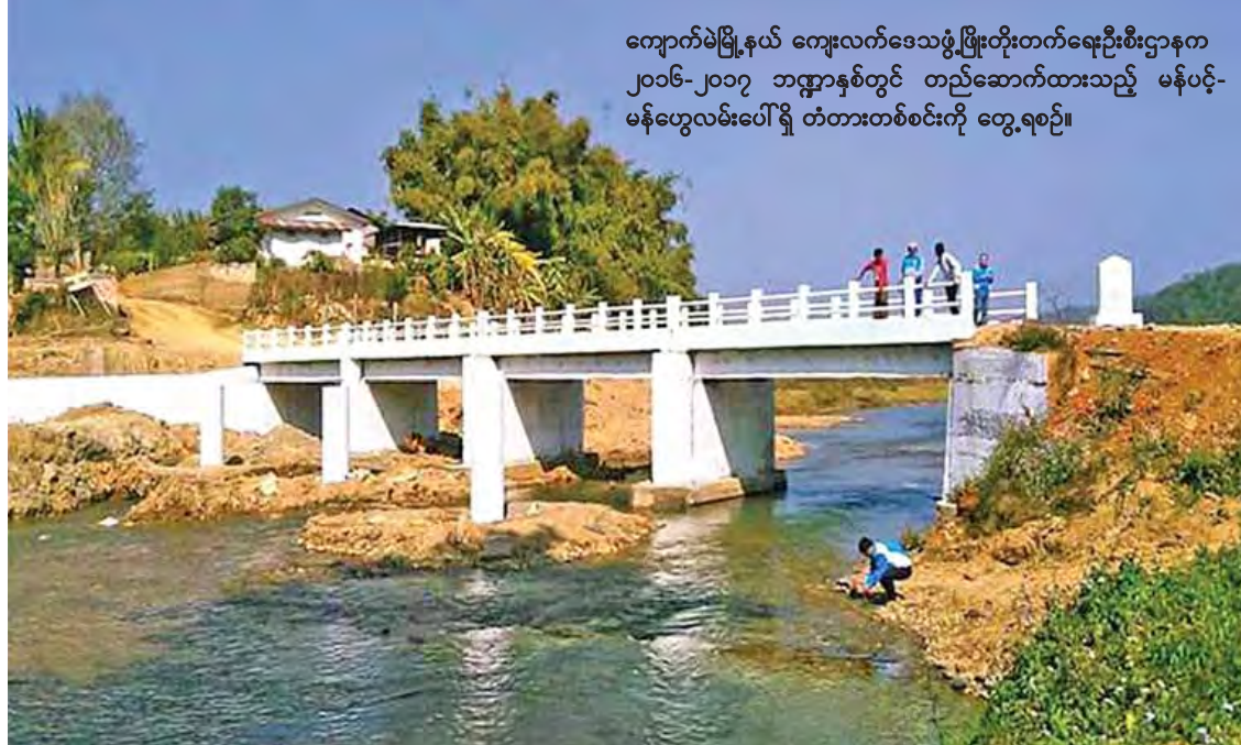
ကျောက်မဲမြို့နယ် ကျေးလက်ဒေသဖွံ့ဖြိုးတိုးတက်ရေးဦးစီးဌာနက ၂၀၁၆-၂၀၁၇ ဘဏ္ဍာနှစ်တွင် တည်ဆောက်ထားသည့် မန်ပင့်-မန်ပွေလမ်းပေါ်ရှိ တံတားတစ်စင်းကို တွေ့ရစဉ်။

ငွေကျပ် ၂၅၆၇ သိန်းကျော် ရှမ်းပြည်နယ် လူမှုဝန်ထမ်းဦးစီးဌာန