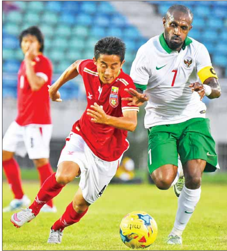
မြန်မာနှင့် အင်ဒိုနီးရှားအသင်း ဆူဇူကီးဖလားပြိုင်ပွဲမတိုင်မီက ခြေစမ်းကစားစဉ်။