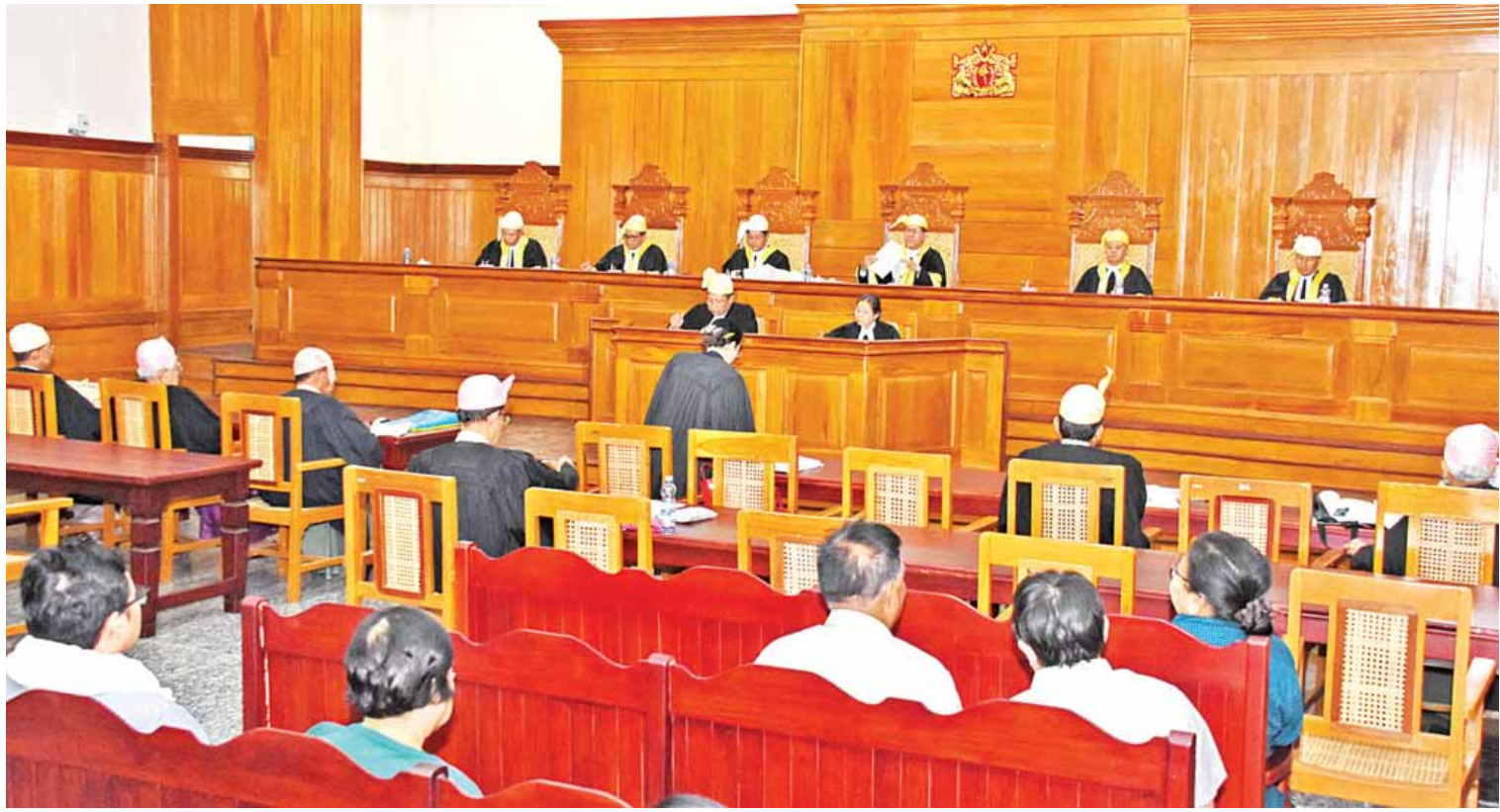
ပြည်ထောင်စုတရားလွှတ်တော်ချုပ်တွင် တရားစီရင်ရေးလုပ်ငန်းများ ဆောင်ရွက်နေစဉ်။

မေး။ ။ ပြည်ထောင်စုတရားလွှတ်တော် ချုပ်ရဲ့ တရားစီရင်ရေးလုပ်ငန်းဆောင်ရွက် နိုင်မှုတွေကိုလည်း သိချင်ပါတယ်။