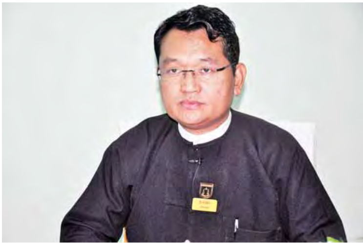
ညွှန်ကြားရေးမှူးချုပ် ဦးကိုကိုနိုင်

ဖြေ။ ။ ပြည်သူလူထုရဲ့ တရားမျှတမှုလက်လှမ်းမီရေးအတွက် အမှုတွေရဲ့ အမိန့်ချမှတ်မယ့်နေ့ရက်တွေ၊ အမှုကြားနာမယ့် နေ့ရက်တွေကို ပြည်ထောင်စုတရားလွှတ်တော်ချုပ်ရဲ့ အင်တာနက်စာမျက်နှာဖြစ်တဲ့ www.unionsupremecourt.gov.mm နဲ့ ပြည်ထောင်စုတရားလွှတ်တော်ချုပ်ရုံး၊ ပြည်သူ့ဆက်ဆံရေးဌာနခွဲ လူမှုကွန်ရက်စာမျက်နှာ