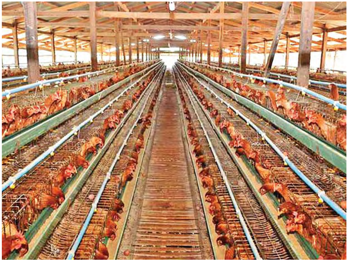
ရှမ်းပြည်နယ်၌ ဒေသတွင်း စားသုံးမှုလုံလုံစေရေးအတွက် တစ်ပိုင်တစ်နိုင် ကြက်မွေးမြူရေးလုပ်ငန်းကို မြင်တွေ့ရစဉ်။