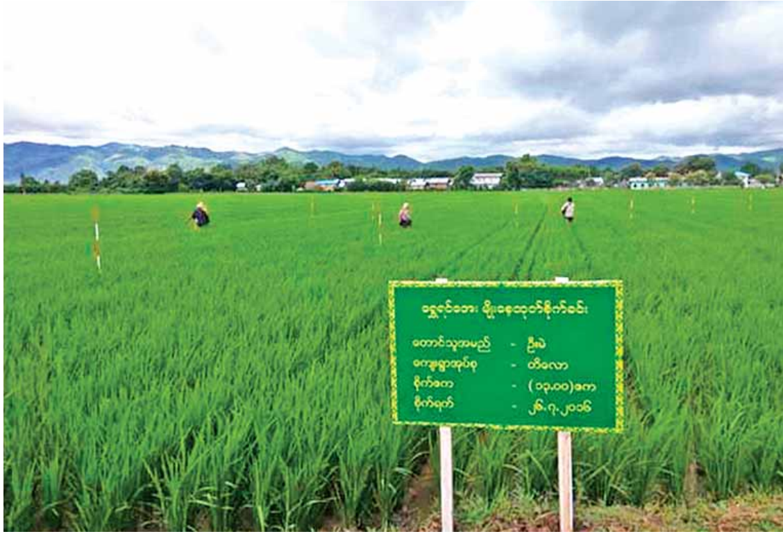
ညောင်ရွှေမြို့နယ်ရှိ မျိုးစေ့ထုတ်စပါးစိုက်ခင်းကို တွေ့ရစဉ်။