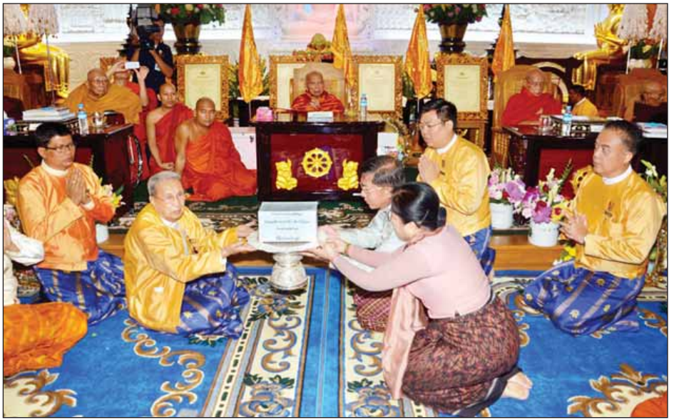
ကာကွယ်ရေးဦးစီးချုပ်၊ တပ်မတော်အရာရှိကြီးများနှင့် ကြပြီး လှူဒါန်းမှုအစုစုအတွက် ရေစက်သွန်းချအမျှပေးဝေ အလှူရှင်များက လှူဖွယ်ပစ္စည်းများ ဆက်ကပ်လှူဒါန်း ခဲ့ကြောင်း သတင်းရရှိသည်။ (သတင်းစဉ်)