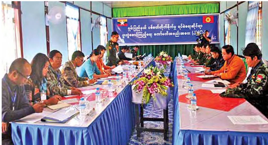
ရှမ်းပြည်နယ် ပစ်ခတ်တိုက်ခိုက်မှုရပ်စဲရေးဆိုင်ရာ ပူးတွဲစောင့်ကြည့်ရေးကော်မတီ(JMC-S) တတိယအကြိမ်အစည်းအဝေး ကျင်းပစဉ်။

များ ပြန်လည်ထောင်ရေးစီမံကိန်းအရ နိုင်ငံတော်အစိုးရသစ်လက်ထက်တွင် ရှမ်း ပြည်နယ်အတွင်း၌ စီးပွားရေးစိုက်ခင်း ဧက ၃၀၀၊ ရေဝေရေလဲစိုက်ခင်း ဧက ၄၀၀၊ သဘာဝတောတန်ဖိုးမြှင့်စိုက်ပျိုးခြင်း ဧက ၈၆၀ စုစုပေါင်းစိုက်ဧက ၁၅၆၀ ကို ရန်ပုံငွေ ကျပ် ၆၇ ဒသမ ၀၁၄ သန်းဖြင့် စိုက်ပျိုးခဲ့ပြီး ရာခိုင်နှုန်း ၉၀ ကျော် ရှင်သန်အောင်မြင်အောင် ဆောင်ရွက်နိုင်ခဲ့သည်။