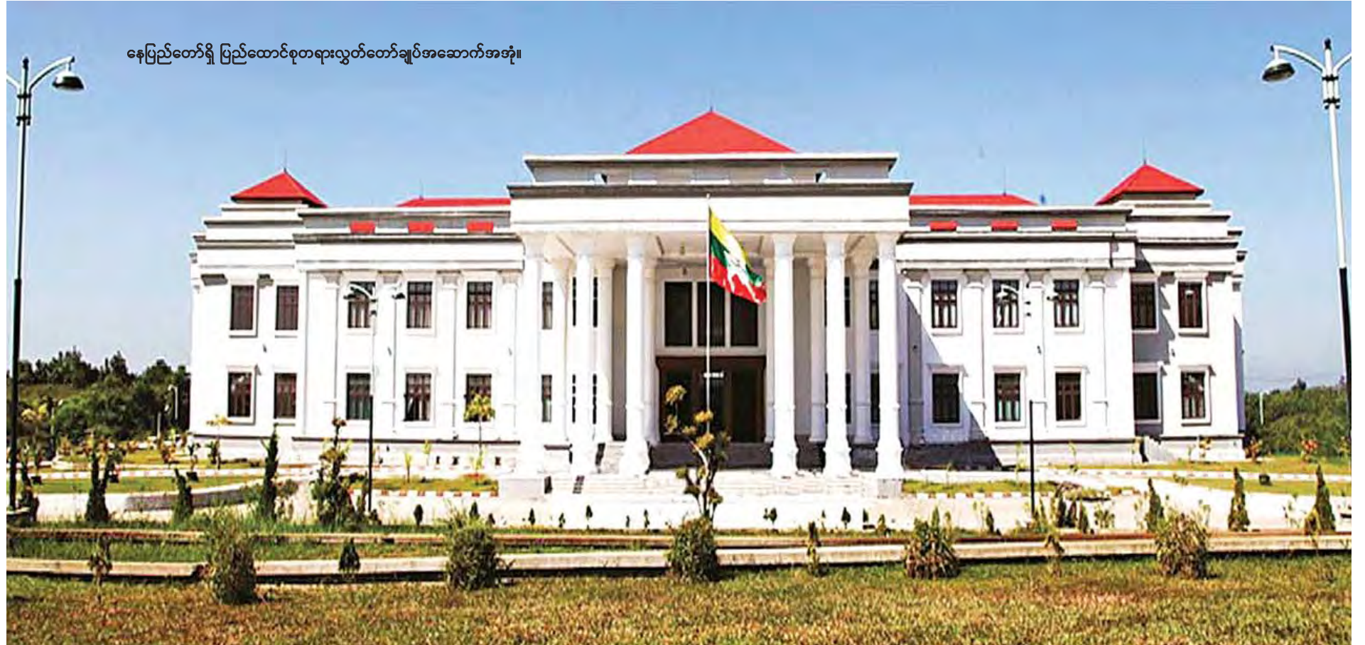
နေပြည်တော်ရှိ ပြည်ထောင်စုတရားလွှတ်တော်ချုပ်အဆောက်အအုံ။

ရေးထိုးခဲ့ပါတယ်။ ၂၀၁၆ ခုနှစ် မတ်လ ၁၈ ရက်မှာလည်း ပြည်ထောင်စု တရားလွှတ်တော်ချုပ်ရုံးနဲ့ ဂျပန် အပြည်ပြည်ဆိုင်ရာပူးပေါင်းဆောင်ရွက် ရေးအေလိုင်စီတို့ရဲ့ မြန်မာနိုင်ငံ ဥပဒေရေးရာ၊ တရားစီရင်ရေးရာနဲ့ သက်ဆိုင်တဲ့ကဏ္ဍများ အလိုက် စွမ်းရည်ဖွံ့ဖြိုးတိုးတက်မှုဆိုင်ရာ စီမံ ချက် ဆွေးနွေးချက် မှတ်တမ်းပြင်ဆင်ချက် အထူးကဏ္ဍ (ခ) သို့ >>>