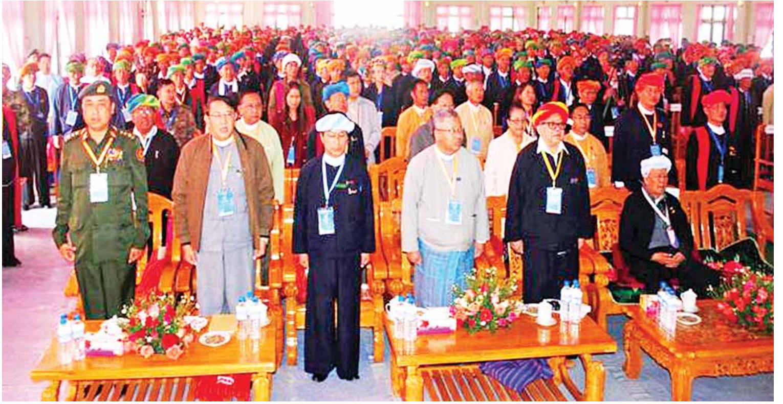
ပအိုဝ်းအမျိုးသားအဆင့် နိုင်ငံရေးဆွေးနွေးပွဲ ကျင်းပစဉ်။

သို့ ရှမ်းပြည်နယ် အထွေထွေအုပ်ချုပ်ရေး ဦးစီးဌာနအနေဖြင့်လည်း ထုတ်ပေးနိုင်ခဲ့သည်။ စီးပွားရေးစိုက်ခင်း ဧက ၃၀၀ သစ်တောကဏ္ဍအနေဖြင့် သစ်တော