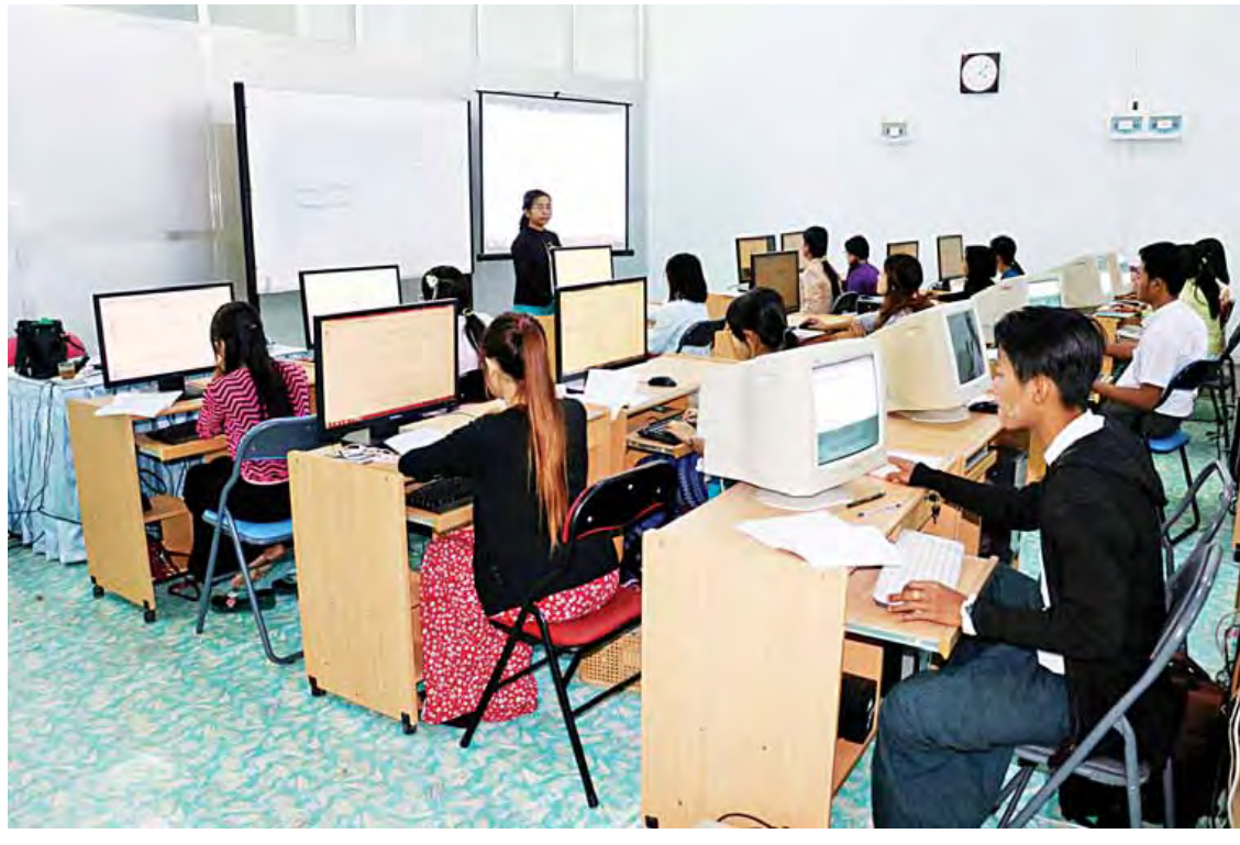
ပြည်ထောင်စုတရားလွှတ်တော်ရုံးဝန်ထမ်းများအား ကွန်ပျူတာသင်တန်းပေးနေသည်ကို တွေ့ရစဉ်။