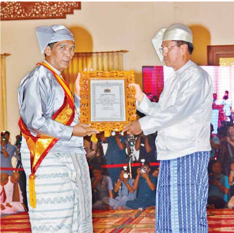
ဒုတိယသမ္မတ ဦးမြင့်ဆွေ သုဓမ္မမင်္ဂလာတရဘွဲ့တံဆိပ်ရ ဒေါက်တာဝင်းဆွေဦးအား ဘွဲ့တံဆိပ်ပေးအပ်ချီးမြှင့်စဉ်။ (သတင်းစဉ်)