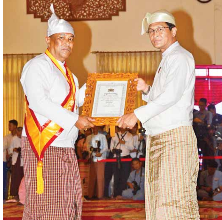
ဒုတိယသမ္မတ ဦးဟင်နရီဗန်ထီးယူ သုဓမ္မမင်္ဂလာတရဘွဲ့တံဆိပ်ရ ဦးတင်ဝင်းညိုအား ဘွဲ့တံဆိပ်ပေးအပ်ချီးမြှင့်စဉ်။ (သတင်းစဉ်)