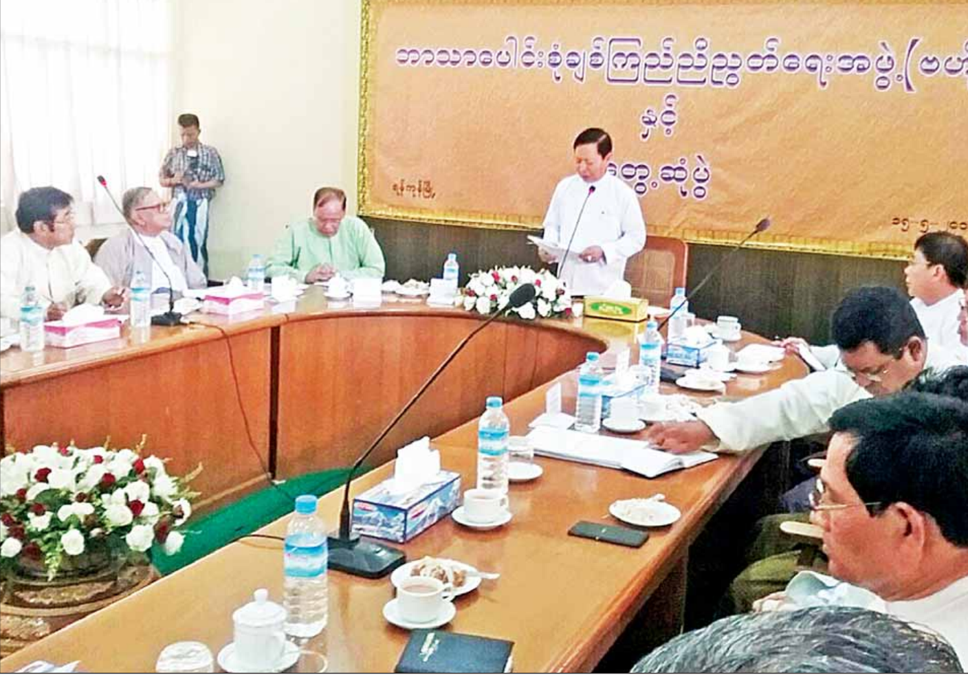
သာသနာရေးနှင့် ယဉ်ကျေးမှုဝန်ကြီးဌာန ပြည်ထောင်စုဝန်ကြီး သူရဦးအောင်ကိုနှင့် ဘာသာပေါင်းစုံချစ်ကြည်ညီညွတ်ရေးအဖွဲ့(ဗဟို)တို့ ၂၀၁၆ ခုနှစ် မေ ၁၅ ရက်က တွေ့ဆုံပွဲအခမ်းအနားကျင်းပစဉ်။

ထိုကဲ့သို့ မြန်မာတို့၏ ကိုယ်ပိုင်စာပေ၊ ယဉ်ကျေးမှု၊ အနုပညာတို့ မပျောက်ပျက်ရအောင် မြန်မာ့ရိုးရာ အမွေအနှစ်တို့ကို သိရှိလာပြီး နိုင်ငံတကာက လေးစားအားကျလာအောင်၊ ဘာသာ၊ သာသနာ ရောင်ဝါမည်းရအောင် စသဖြင့် ဘာသာရေး၊ သာသနာရေးနှင့် ယဉ်ကျေးမှုဆိုင်ရာ ကဏ္ဍရပ်များတွင် ထိန်းသိမ်းစောင့်ရှောက်နေသည့် သာသနာရေးနှင့် ယဉ်ကျေးမှုဝန်ကြီးဌာနသည် နောင်အနာဂတ်တွင်လည်း ယခုကဲ့သို့ ဆက်လက်တာဝန်ကျေနေဦးမည်သာဖြစ်ပါကြောင်း။ ။