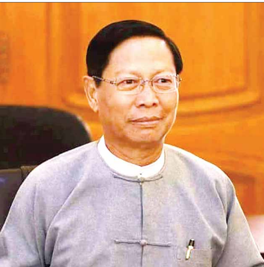
သာသနာရေးနှင့် ယဉ်ကျေးမှုဝန်ကြီးဌာန ပြည်ထောင်စုဝန်ကြီး သူရဦးအောင်ကို

အမျိုးသားယဉ်ကျေးမှုနှင့် အနုပညာတက္ကသိုလ်များတွင်လည်း မြန်မာ့ရိုးရာ အဆို၊ အက၊ အရေး၊ အတီး