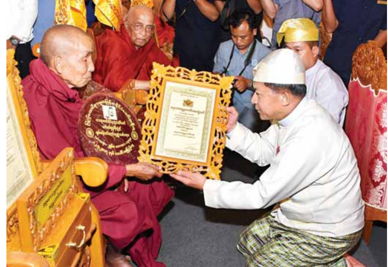
တပ်မတော်ကာကွယ်ရေးဦးစီးချုပ် ဗိုလ်ချုပ်မှူးကြီးမင်းအောင်လှိုင် အဂ္ဂမဟာသဒ္ဓမ္မဇောတိက ဇေဘွဲ့တံဆိပ်တော်ရဆရာတော်တစ်ပါးအား ဘွဲ့တံဆိပ်တော် ဆက်ကပ်လျှို့ဝှက်စဉ်။(သတင်းစဉ်)

အတိုင်ပင်ခံပုဂ္ဂိုလ် ဒေါ်အောင်ဆန်း စုကြည်က အဘိဓမ္မဟာရဋ္ဌဂုရု ဘွဲ့ တံဆိပ်တော်ရ မကွေးတိုင်းဒေသကြီး ချောက်မြို့ မဟာဝိတောရုံ ဆင်ဖြူ ကျွန်းကျောင်းတိုက် ဆရာတော် ဘဒ္ဒန္တဉာဏိန္ဒာ၊ မန္တလေးတိုင်းဒေသကြီး ချမ်းမြသာစည်မြို့နယ် အတုလကာရီ ဆင်မင်းကျောင်းဆရာတော် ဘဒ္ဒန္တ ဩဘာသာဘိဝံသနှင့် စစ်ကိုင်းမြို့