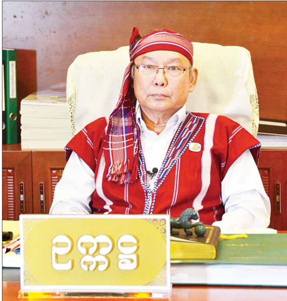
အမျိုးသားလွှတ်တော်ဥက္ကဋ္ဌ မန်းဝင်းခိုင်သန်း

နိုင်ငံတော်အစိုးရသစ်၏ တစ်နှစ်တာကာလအတွင်း အမျိုးသားလွှတ်တော်ကိုယ်စားလှယ်များသည် ပြည်သူ့