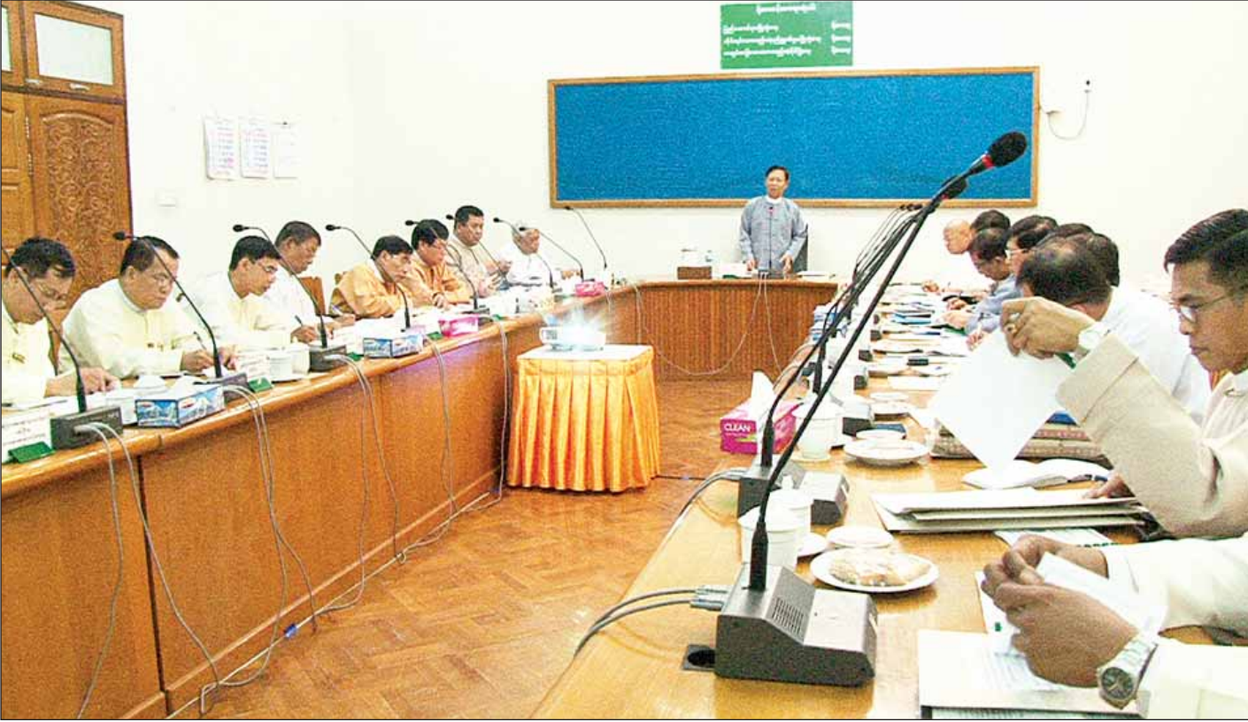
ဆံတော်ရှင်ကျိုက်ထီးရိုးစေတီတော် ပရိဝုဏ်နှင့် ဆက်စပ်ဧရိယာအတွင်း ဆောင်ရွက်လျက်ရှိသော လုပ်ငန်းအသီးသီးကို ဥပဒေနှင့်အညီဆောင်ရွက်နိုင်ရေး ညှိနှိုင်းအစည်းအဝေးကျင်းပစဉ်။ အထူးကဏ္ဍ (၈) သို့ >>>