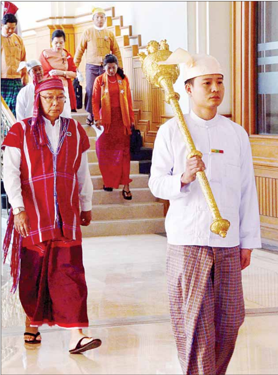
အမျိုးသားလွှတ်တော်ဥက္ကဋ္ဌ မန်းဝင်းခိုင်သန်း လွှတ်တော်အစည်းအဝေးသို့ တက်ရောက်လာစဉ်။