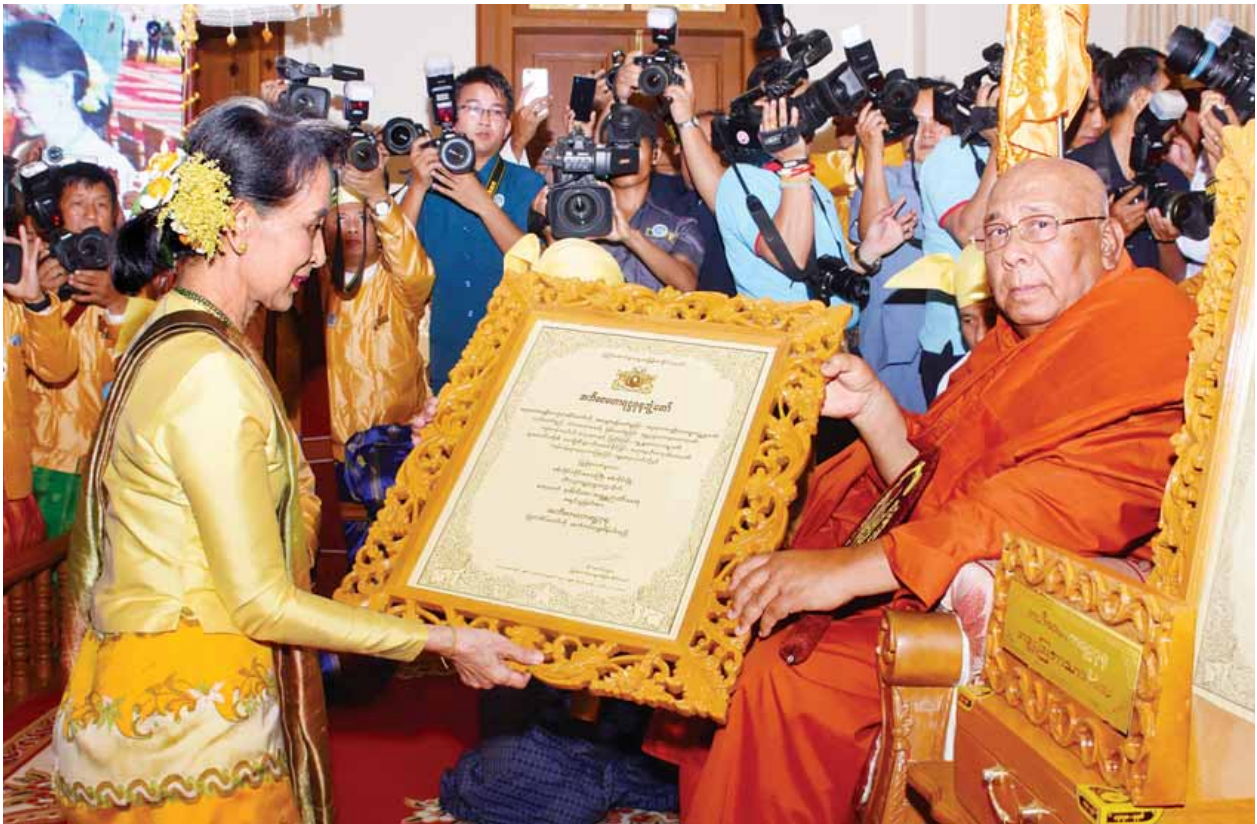
နိုင်ငံတော်၏အတိုင်ပင်ခံပုဂ္ဂိုလ် ဒေါ်အောင်ဆန်းစုကြည် အဘိဓမ္မဟာရဋ္ဌဂုရုဘွဲ့တံဆိပ်တော်ရ စစ်ကိုင်းမြို့ သီတဂူကမ္ဘာ့ဗုဒ္ဓတက္ကသိုလ်များ၏ အဓိပတိ ဆရာတော် ဒေါက်တာဘဒ္ဒန္တဉာဏိဿရအား ဘွဲ့တံဆိပ်တော် ဆက်ကပ်လျှို့ဝှက်စဉ်။ (သတင်းစဉ်)