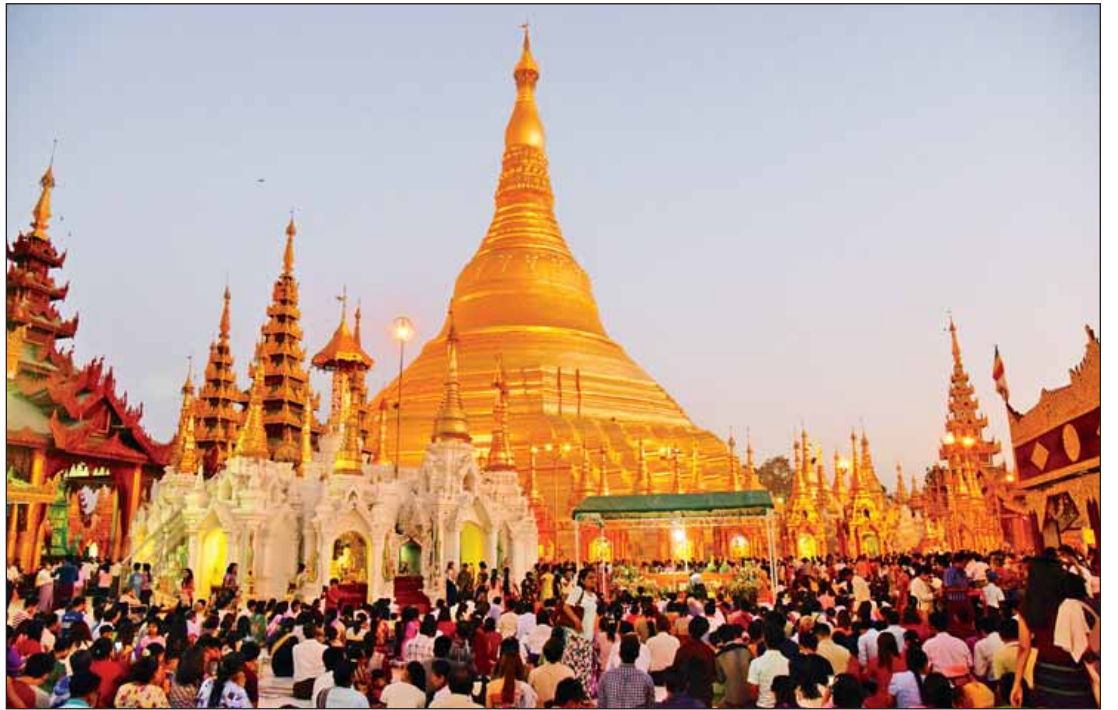
ရွှေတိဂုံဘုရား၌ ဘုရားဖူးလာပြည်သူများနှင့် စည်ကားလျက်ရှိသည်ကို တပေါင်းလပြည့်နေ့ ညနေပိုင်းက တွေ့ရစဉ်။