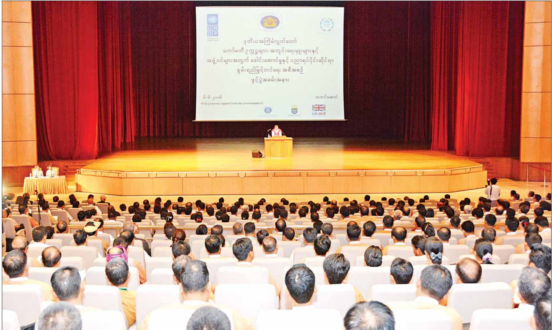
၂၀၁၆ ခုနှစ် ဇွန်လ ၆ ရက်နေ့က ဒုတိယအကြိမ် လွှတ်တော်ကော်မတီဥက္ကဋ္ဌများ၊ အတွင်းရေးမှူးများနှင့် အဖွဲ့ဝင်များအတွက် ခေါင်းဆောင်မှုနှင့် ပညာရပ်ပိုင်းဆိုင်ရာ စွမ်းရည်မြှင့်တင်ရေးအစီအစဉ် ဖွင့်ပွဲအခမ်းအနားကျင်းပစဉ်။