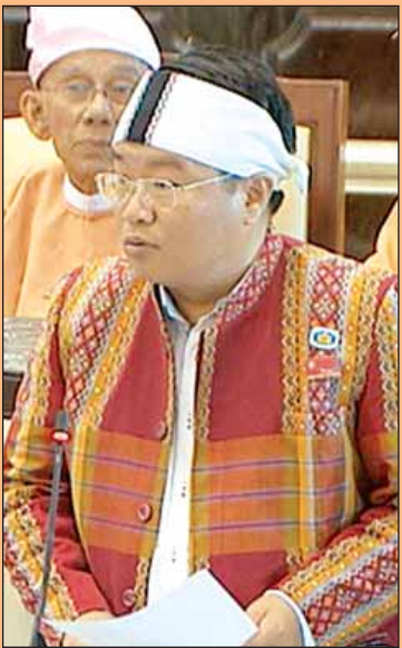
လွှတ်တော်အစည်းအဝေးများ၌ ပြည်သူတို့၏အကျိုးအတွက် မေးခွန်းများမေးမြန်းခြင်း၊ အဆိုများ တင်သွင်းခြင်းနှင့် ဥပဒေပြုခြင်းများကို လွှတ်တော်ကိုယ်စားလှယ်များက ဆောင်ရွက်လျက်ရှိသည်။