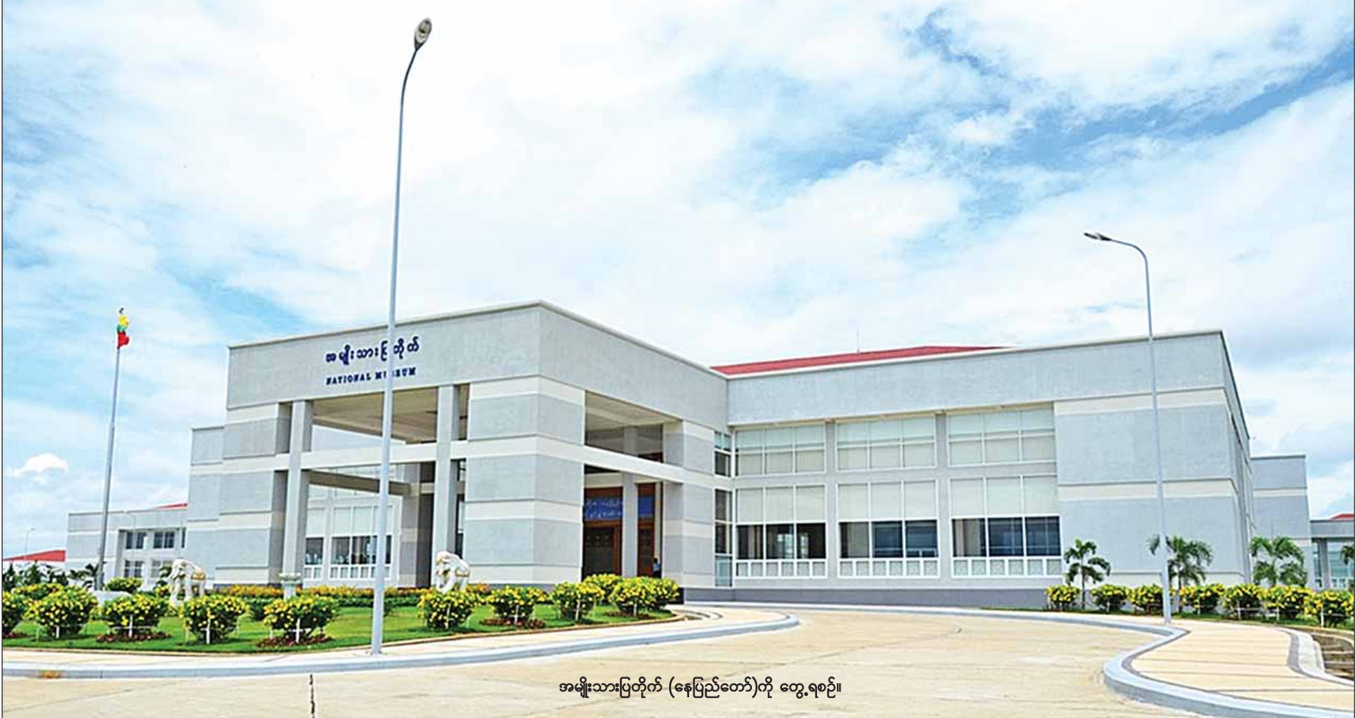
အမျိုးသားပြတိုက် (နေပြည်တော်)ကို တွေ့ရစဉ်။

တွေမှာ စုစုပေါင်း (၆၆) ကြိမ် လှုပ်ရှားဆောင်ရွက်ခဲ့ပါတယ်” ဟု ပြောသည်။ သာသနာရေးနှင့် ယဉ်ကျေးမှုဝန်ကြီးဌာနအနေဖြင့် အမုန်းစကားကာကွယ်တားဆီးရေးဥပဒေမူကြမ်းကို ဘာသာပေါင်းစုံချစ်ကြည်ညီညွတ်ရေးအဖွဲ့က ရေးဆွဲပြီး ပညာရှင်များဖြင့် စိစစ်ပြင်ဆင်ကာ ရှေ့နေချုပ်ရုံးသို့လည်းကောင်း၊ နိုင်ငံခြားရေးဝန်ကြီးဌာနမှတစ်ဆင့် နိုင်ငံတကာသဘောထားများရယူ၍လည်းကောင်း မူကြမ်းပြန်လည်ပြုစုပြီး လုံခြုံရေး၊ တည်ငြိမ်အေးချမ်းရေးနှင့် တရားဥပဒေစိုးမိုးရေးကော်မတီသို့ တင်ပြနိုင်ရေး ဆောင်ရွက်လျက် အထူးကဏ္ဍ (၉) သို့ >>>