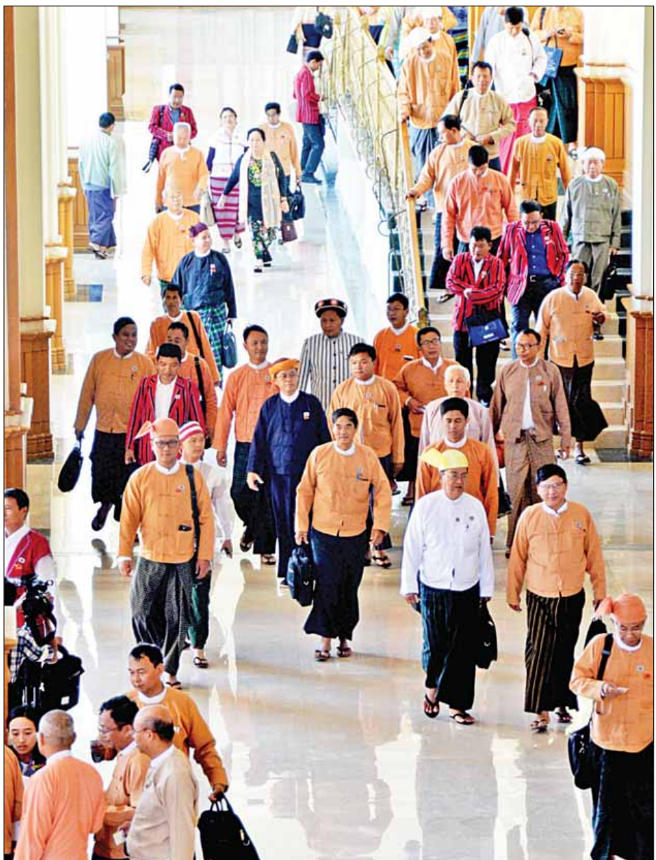
အစည်းအဝေးတက်ရောက်သူ အမျိုးသားလွှတ်တော်ကိုယ်စားလှယ်များ

ပြီးခဲ့သည့်နှစ် စက်တင်ဘာလတွင် လွှတ်တော် အခွင့် အရေးကော်မတီဥက္ကဋ္ဌဦးစီးသော အဖွဲ့ဝင်များသည် အထူးကဏ္ဍ (ဃ) သို့ >>>