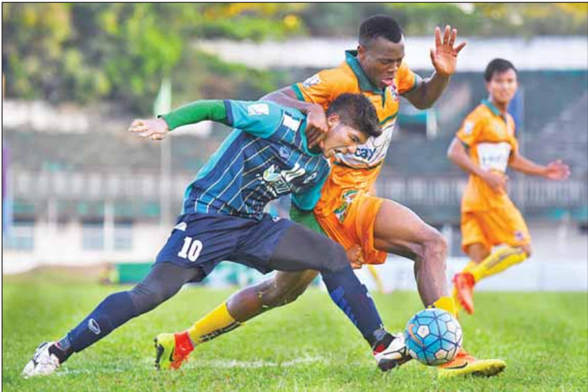
ဇွဲကပင်အသင်းနှင့် ရန်ကုန်အသင်းတို့ ယှဉ်ပြိုင်နေစဉ်။