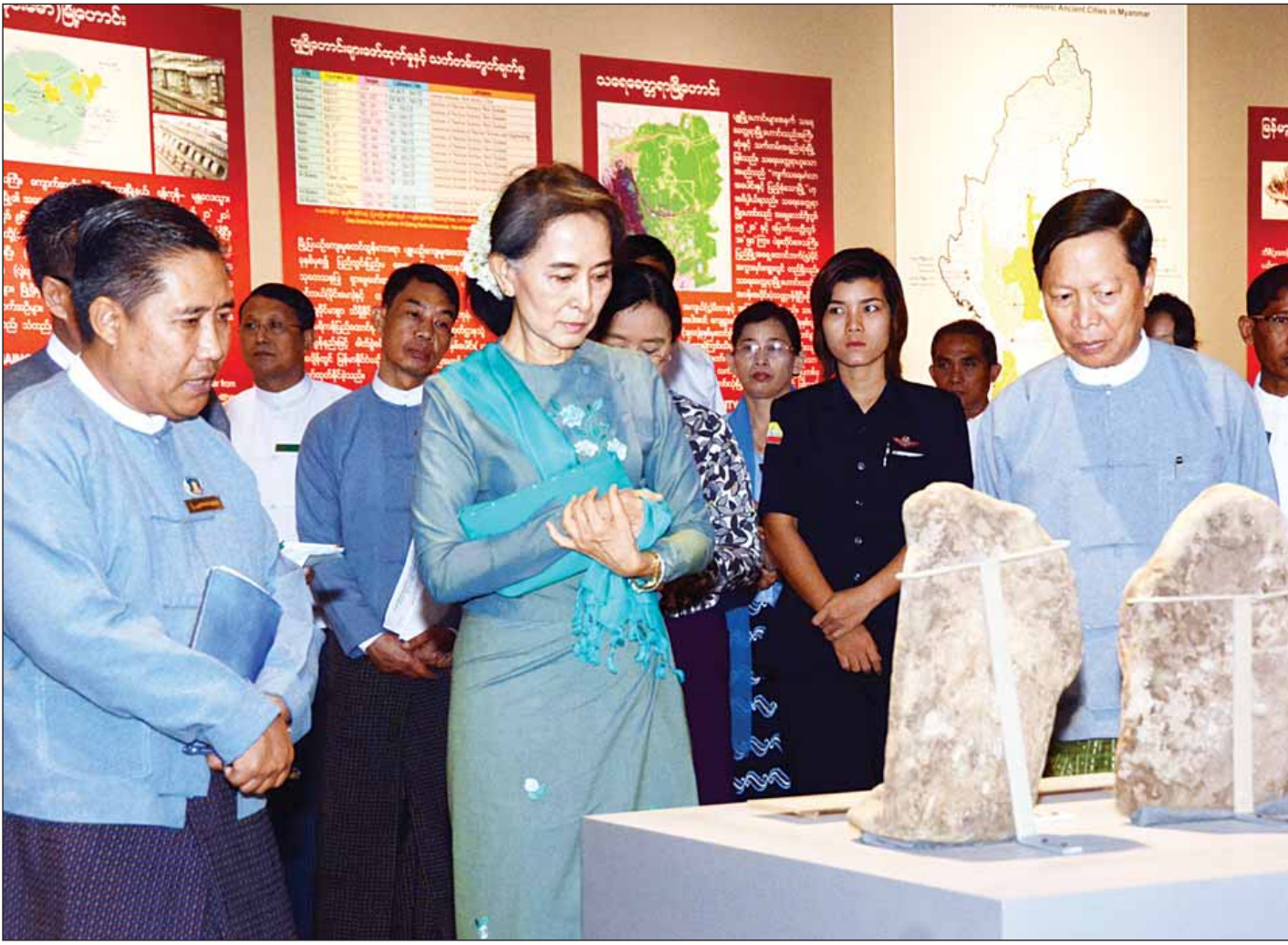
နိုင်ငံတော်၏အတိုင်ပင်ခံပုဂ္ဂိုလ် ဒေါ်အောင်ဆန်းစုကြည် ၂၀၁၆ ခုနှစ် မေ ၃၁ ရက်က အမျိုးသားပြတိုက်(နေပြည်တော်)တွင် ကြည့်ရှုလေ့လာနေစဉ်။

မြန်မာ့ယဉ်ကျေးမှု အမွေအနှစ်များ မတိမ်ကော မပပျောက်ရလေအောင် တစိုက်မတ်မတ် ထိန်းသိမ်း စောင့်ရှောက်လျက်ရှိသည့် သာသနာရေးနှင့် ယဉ်ကျေးမှုဝန်ကြီးဌာန(ယဉ်ကျေးမှု)သည် အစိုးရသစ် တစ်နှစ်တာကာလအတွင်း နေပြည်တော်ရှိ အမျိုးသားပြတိုက်ကို အသစ်ပြင်ဆင်တည်ဆောက်ကာ ခင်းကျင်းပြသပေးနိုင်ခဲ့သလို အမျိုးသားပြတိုက်(ရန်ကုန်)ကိုလည်း အဆင့်မြှင့်တင် မွမ်းမံမှုများ ပြုလုပ်နိုင်ခဲ့