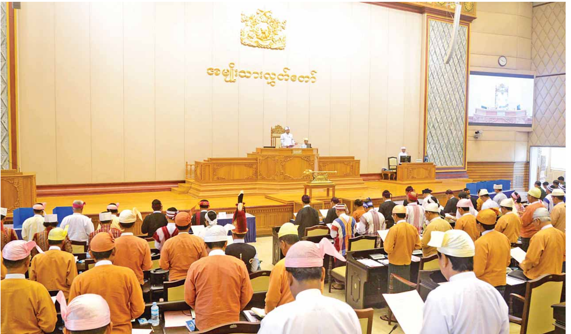
၂၀၁၆ ခုနှစ် ဖေဖော်ဝါရီ ၃ ရက်နေ့က စတင်ကျင်းပသော ဒုတိယအကြိမ် အမျိုးသားလွှတ်တော်အစည်းအဝေး ပထမနေ့တွင် လွှတ်တော်ကိုယ်စားလှယ်များ သဘာပတိ၏ရှေ့မှောက်တွင် ကတိသစ္စာပြုကြစဉ်။

ဥပဒေကြမ်းကော်မတီအနေဖြင့် အစိုးရသစ်တာဝန်ယူခဲ့သည့် တစ်နှစ်အတွင်း အမျိုးသားလွှတ်တော်၌ စတင်ဆွေးနွေးသည့် ဥပဒေပေါင်း ၂၂ ခုအနက် ၁၅ ခု ဆောင်ရွက်ပြီးစီးခဲ့သည်။ ကျန်ဥပဒေ ငါးခုမှာ ဆောင်ရွက်နေဆဲဖြစ်ပြီး ဥပဒေနှစ်ခုကို ပြည်သူ့လွှတ်တော်သို့ ပေးပို့ထားသည်။ ပြည်သူ့လွှတ်တော်၌စတင်ပြီး အမျိုးသားလွှတ်တော်သို့ပေးပို့လာသော ဥပဒေ ၁၁ ခုအနက် ကိုးခုမှာ ဆောင်ရွက်ပြီးစီး၍ နှစ်ခုမှာ ဆောင်ရွက်နေဆဲဖြစ်သည်။ တစ်နှစ်တာကာလအတွင်း ဥပဒေပေါင်း ၂၄ ခု တာဝန်ယူဆောင်ရွက်ပြီးစီးခဲ့ပြီး ကိုးခုမှာ ဆောင်ရွက်ဆဲဖြစ်