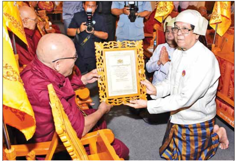
အမျိုးသားလွှတ်တော်ဒုတိယဥက္ကဋ္ဌ ဦးအေးသာအောင် အဂ္ဂမဟာ သဒ္ဓမ္မဇောတိကဇာ ဘွဲ့တံဆိပ်တော်ရဆရာတော်တစ်ပါးအား ဘွဲ့တံဆိပ်တော် ဆက်ကပ်လှူဒါန်းစဉ်။ (သတင်းစဉ်)

သုဒဿနာရာမ စာသင်တိုက် ဆရာတော် ဘဒ္ဒန္တသေဋ္ဌလ၊ ရှမ်းပြည်နယ် လားရှိုးမြို့ ဇေယျအေး အေတီတပ်ဦးကျောင်း ဆရာတော်