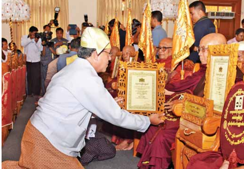
ပြည်ထောင်စုတရားသူကြီးချုပ် ဦးထွန်းထွန်းဦး အဂ္ဂမဟာပဏ္ဍိတ ဘွဲ့တံဆိပ်တော်ရ ဆရာတော် တစ်ပါးအား ဘွဲ့တံဆိပ်တော် ဆက်ကပ်လျှို့ဝှက်စဉ်။ (သတင်းစဉ်)