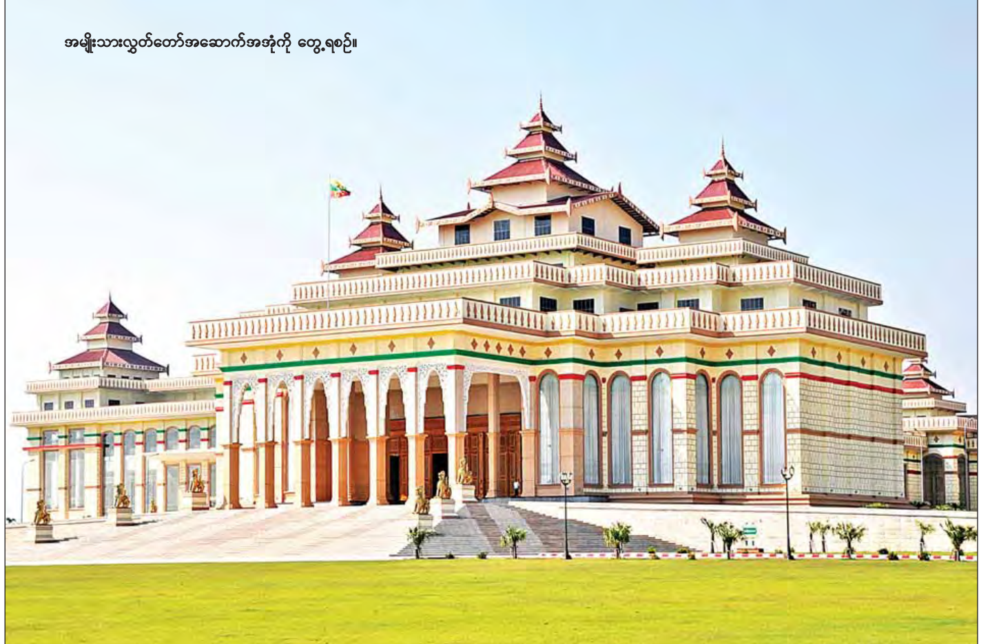
အမျိုးသားလွှတ်တော်အဆောက်အအုံကို တွေ့ရစဉ်။

တိုင်းရင်းသားပြည်သူများ၏ အကျိုးနှင့် ဒေသအကျိုးအတွက် အမှန်တကယ် လိုအပ်လျက် ရှိသော ကိစ္စများ၊ ပြည်ထောင်စု အစိုးရအဖွဲ့က ဆောင်ရွက်ပေး စေလိုသည့် ကိစ္စရပ်များစွာကို ပြည်သူလူထုအကျိုးငှာ ကြယ်ပွင့်ပြမေးခွန်းပေါင်း ၂၈၄ ခုနှင့် ကြယ်ပွင့်မပြ မေးခွန်းပေါင်း ၁၆၀ တို့ကို မေးမြန်းခဲ့ပြီး အဆိုလေးခုကို လည်း တင်သွင်းနိုင်ခဲ့