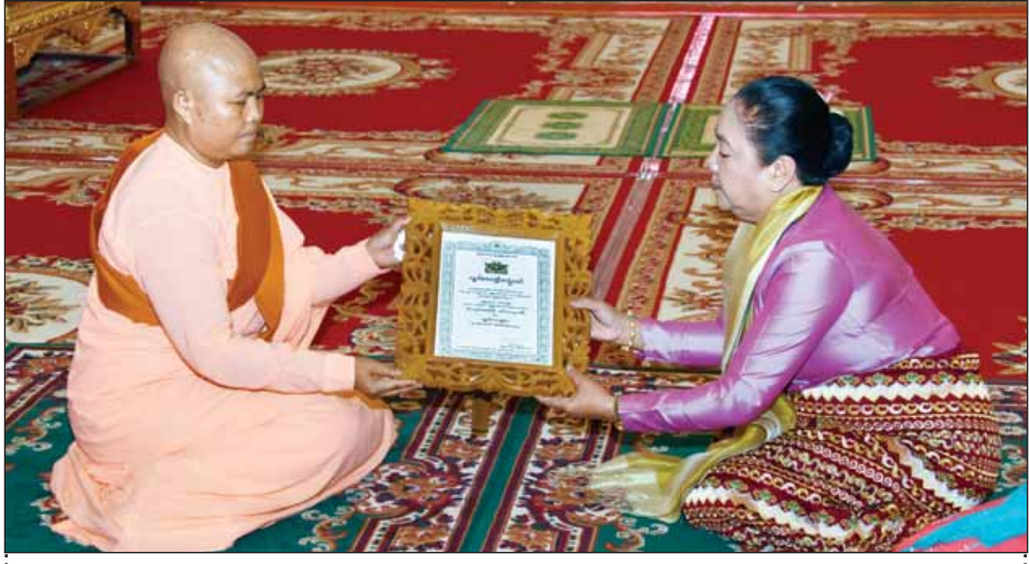
ပြည်သူ့လွှတ်တော်ဥက္ကဋ္ဌ၏ဇနီး ဒေါ်ချိုချို ဂန္ဓဝါစကပဏ္ဍိတ ဘွဲ့တံဆိပ်တော်ရ သီလရှင်ဆရာကြီးတစ်ပါးအား ဘွဲ့တံဆိပ်တော် ဆက်ကပ်လှူဒါန်းစဉ်။ (သတင်းစဉ်)

ယင်းနောက် ပြည်ထောင်စုဝန်ကြီး များ၊ ပြည်ထောင်စုရွှေ့နေချုပ်၊ ပြည်ထောင်စု စာရင်းစစ်ချုပ်၊ ပြည်ထောင်စုရာထူးဝန်အဖွဲ့ဥက္ကဋ္ဌ၊ နေပြည်တော်ကောင်စီဥက္ကဋ္ဌ၊ မြန်မာ နိုင်ငံတော်ဗဟိုဘဏ်ဥက္ကဋ္ဌ၊ ညွှန်ကြား