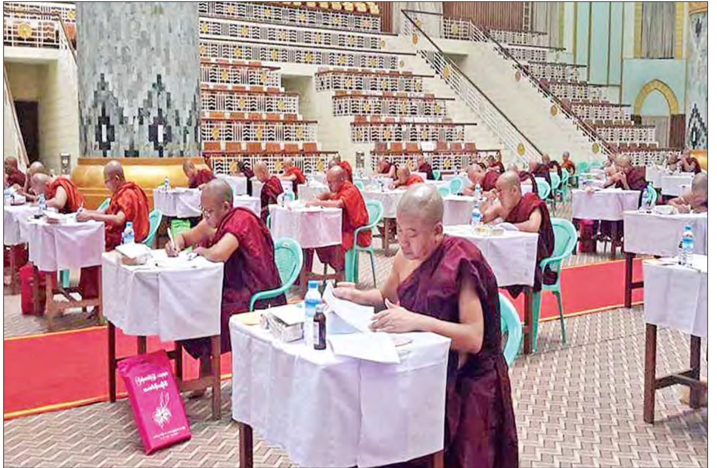
(၆၉) ကြိမ်မြောက် တိပိဋကဓရ တိပိဋကကော်မိဒ်ရှေးချယ်ရေးစာမေးပွဲဖြေဆိုနေကြသည့် ရဟန်းတော်များကို တွေ့ရစဉ်။

ဆံတော်ရှင်ကျိုက်ထီးရိုး စေတီတော်သို့ ဘုရားဖူး သွားရောက်ရာတွင် မရှိမဖြစ်လိုအပ်သည့် နေထိုင်ရေးအတွက် တည်းခိုခန်းများကိုလည်း အခမဲ့တည်းခိုနိုင်ရန်၊ အနည်းဆုံးအခငွေ ဖြစ်စေရန်နှင့် ပိုမိုကောင်းမွန်သော ဝန်ဆောင်မှုများရရှိစေရန် ဆောင်ရွက်လျက်ရှိ