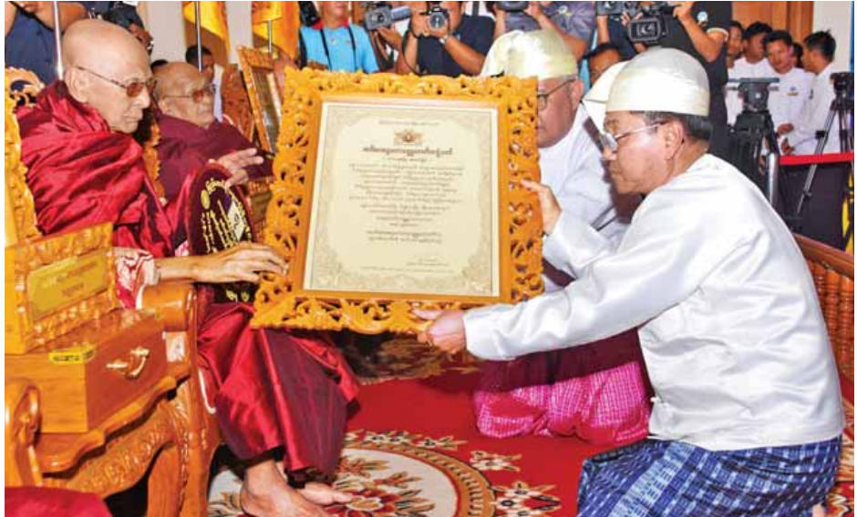
ဒုတိယသမ္မတ ဦးမြင့်ဆွေ အဘိဓမ္မဟာရဋ္ဌဂုရုဘွဲ့တံဆိပ်တော်ရ မန္တလေးတိုင်းဒေသကြီး မိတ္ထီလာမြို့ အသောကာရုံရေလည်ပရိယတ္တိစာသင်တိုက် ဆရာတော် ဘဒ္ဒန္တလာဘာဝတအား ဘွဲ့တံဆိပ်တော် ဆက်ကပ်လျှို့ဝှက်စဉ်။ (သတင်းစဉ်)