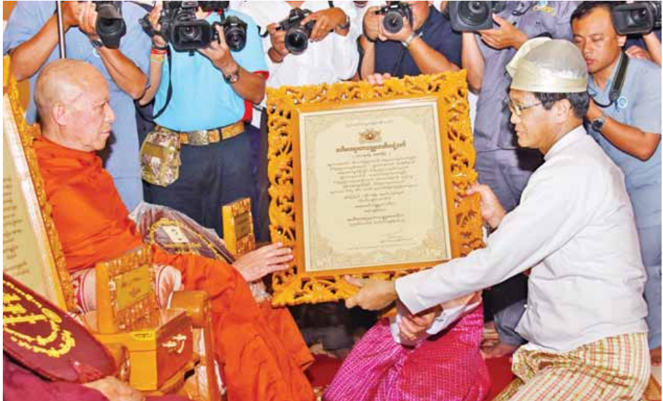
ဒုတိယသမ္မတ ဦးဟင်နရီဗန်ထီးယူ အဘိဓမ္မဟာရဋ္ဌဂုရုဘွဲ့တံဆိပ်တော်ရ ရှမ်းပြည်နယ်(အရှေ့ပိုင်း) ကျိုင်းတုံမြို့ ဟိုခုံပရိယတ္တိစာသင်တိုက်ဆရာတော် ဘဒ္ဒန္တဇောတိကအား ဘွဲ့တံဆိပ်တော် ဆက်ကပ်လျှို့ဝှက်စဉ်။ (သတင်းစဉ်)