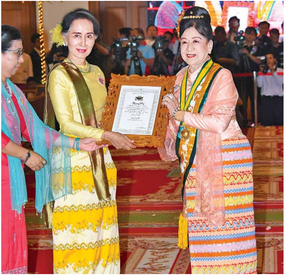
နိုင်ငံတော်၏အတိုင်ပင်ခံပုဂ္ဂိုလ် ဒေါ်အောင်ဆန်းစုကြည် သီရိသုဓမ္မသီရိဘွဲ့တံဆိပ်ရ ဒေါ်မေသက်မော်အား ဘွဲ့တံဆိပ်ပေးအပ်ချီးမြှင့်စဉ်။