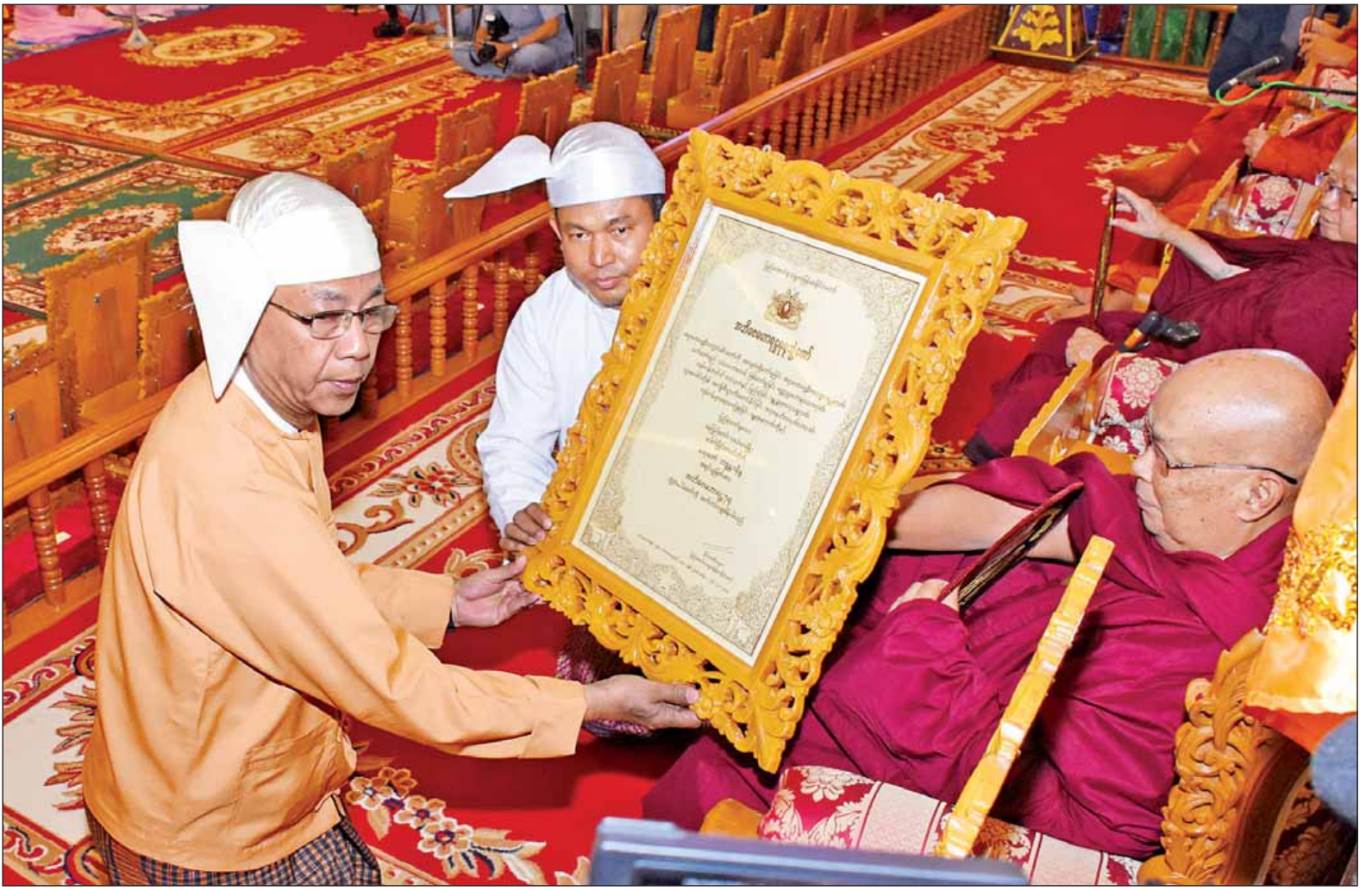
နိုင်ငံတော်သမ္မတ ဦးထင်ကျော် အဘိဓဇ မဟာရဋ္ဌဂုရု ဘွဲ့တံဆိပ်တော်ရ နေပြည်တော် လယ်ဝေးမြို့ ပေါက်မြိုင်စာသင်တိုက် ဆရာတော် ဘဒ္ဒန္တ ဇနိန္ဒာအား ဘွဲ့တံဆိပ်တော် ဆက်ကပ်ပူဇော်ခြင်းပွဲ။ (သတင်းစဉ်)

၂၀၁၇ ခုနှစ် သာသနာတော်ဆိုင်ရာ ဘွဲ့တံဆိပ်တော်များ ဆက်ကပ်ပူဇော် ပွဲနှင့် ဆွမ်းဆန်စိမ်းလောင်းလှူပွဲ မဟာမင်္ဂလာအခမ်းအနားကို ယနေ့ မွန်းလွဲ ၁ နာရီတွင် နေပြည်တော် ဥပဒေရေးရာဌာနအဖွဲ့အစည်းတော် ပရိသတ်တို့ သာသနာ့မဟာမိတ်အဖွဲ့အစည်းကြီး၌ ကျင်းပရာ နိုင်ငံတော်သမ္မတ ဦးထင်ကျော်၊ နိုင်ငံတော်၏အတွင်း ပင်ခံပုဂ္ဂိုလ် ဒေါ်အောင်ဆန်းစုကြည်၊ ဒုတိယသမ္မတများနှင့် တာဝန်ရှိသူများ တက်ရောက်ကြည့်ညှိ၍ သာသနာ တော်ဆိုင်ရာ ဘွဲ့တံဆိပ်တော်များ ဆက်ကပ်ပူဇော်ခြင်း၊ ဆွမ်းဆန်စိမ်းနှင့် လှူဖွယ်ပစ္စည်းများ လောင်းလှူသည်။ ရှေးဦးစွာ သာသနာတော်ဆိုင်ရာ ဘွဲ့တံဆိပ်တော်များ ဆက်ကပ်ပူဇော် ပွဲကို ကျင်းပရာ သာသနာရေးနှင့် ယဉ်ကျေးမှုဝန်ကြီးဌာန သာသနာရေး ဦးစီးဌာန ညွှန်ကြားရေးမှူးချုပ် ဦးမြင့်ဦးက အခမ်းအနားဖွင့်စာတမ်း ကို ဖတ်ကြားလျှောက်ထား၍ အခမ်း အနားကို ဖွင့်လှစ်သည်။ ထို့နောက် နိုင်ငံတော်သံမဏိ နာယကအဖွဲ့ဥက္ကဋ္ဌ အဘိဓဇ မဟာ ရဋ္ဌဂုရု အဘိဓဇ အဂ္ဂမဟာသဒ္ဓမ္မ ဇောတိက မန္တလေးမြို့၊ ပန်းမော် ကျောင်းတိုက်ဆရာတော် ဒေါက်တာ ဘဒ္ဒန္တကုမာရာဘိဝံသထံမှ နိုင်ငံတော် သမ္မတနှင့် ပရိသတ်များက ငါးပါးသီလ ခံယူဆောက်တည်ကြသည်။