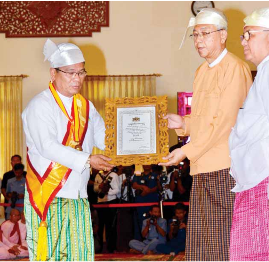
နိုင်ငံတော်သမ္မတ ဦးထင်ကျော် သုဓမ္မမင်္ဂလာတရဘွဲ့တံဆိပ်ရ ဦးကြည်စိုးအား ဘွဲ့တံဆိပ်ပေးအပ်ချီးမြှင့်စဉ်။ (သတင်းစဉ်)