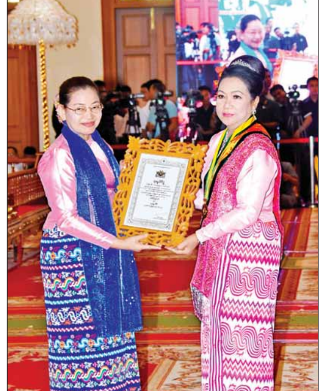
နိုင်ငံတော်ပွဲစဉ်အခြေခံဥပဒေဆိုင်ရာနဲ့ဥက္ကဋ္ဌ၏ ဇနီး ဒေါ်ဌေးရည် သုဓမ္မသီရိ ဘွဲ့တံဆိပ်ရရှိသူ ဒေါ်ကြည်ခင်အား ဘွဲ့တံဆိပ်ပေးအပ်ချီးမြှင့်စဉ်။ (သတင်းစဉ်)