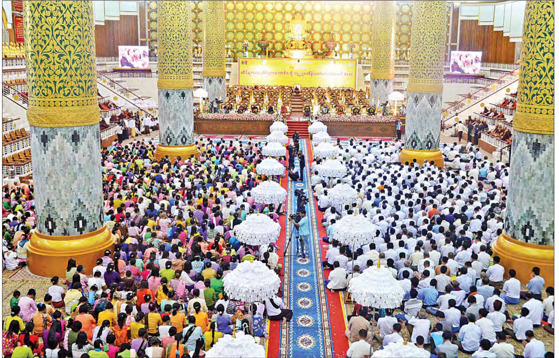
(၆၈) ကြိမ်မြောက် တိပိဋကဓရ တိပိဋကကော်မိဒ် ချီးကျူးပူဇော်ပွဲမဟာမင်္ဂလာအခမ်းအနားကျင်းပစဉ်။

သိရသည်။ ကျိုက်ထီးရိုး ဆံတော်ရှင်စေတီမြတ်ကြီးမှ ယခင်နှစ် လေးလတာအတွင်းက ငွေကျပ်သိန်းပေါင်း လေးထောင်ရှစ်ရာကိုးဆယ်သုံးသိန်းကျော် အလှူငွေရရှိခဲ့ပြီး ယခုနှစ် လေးလတာကာလအတွင်းတွင် ငွေကျပ် အထူးကဏ္ဍ (ဆ) သို့ >>>