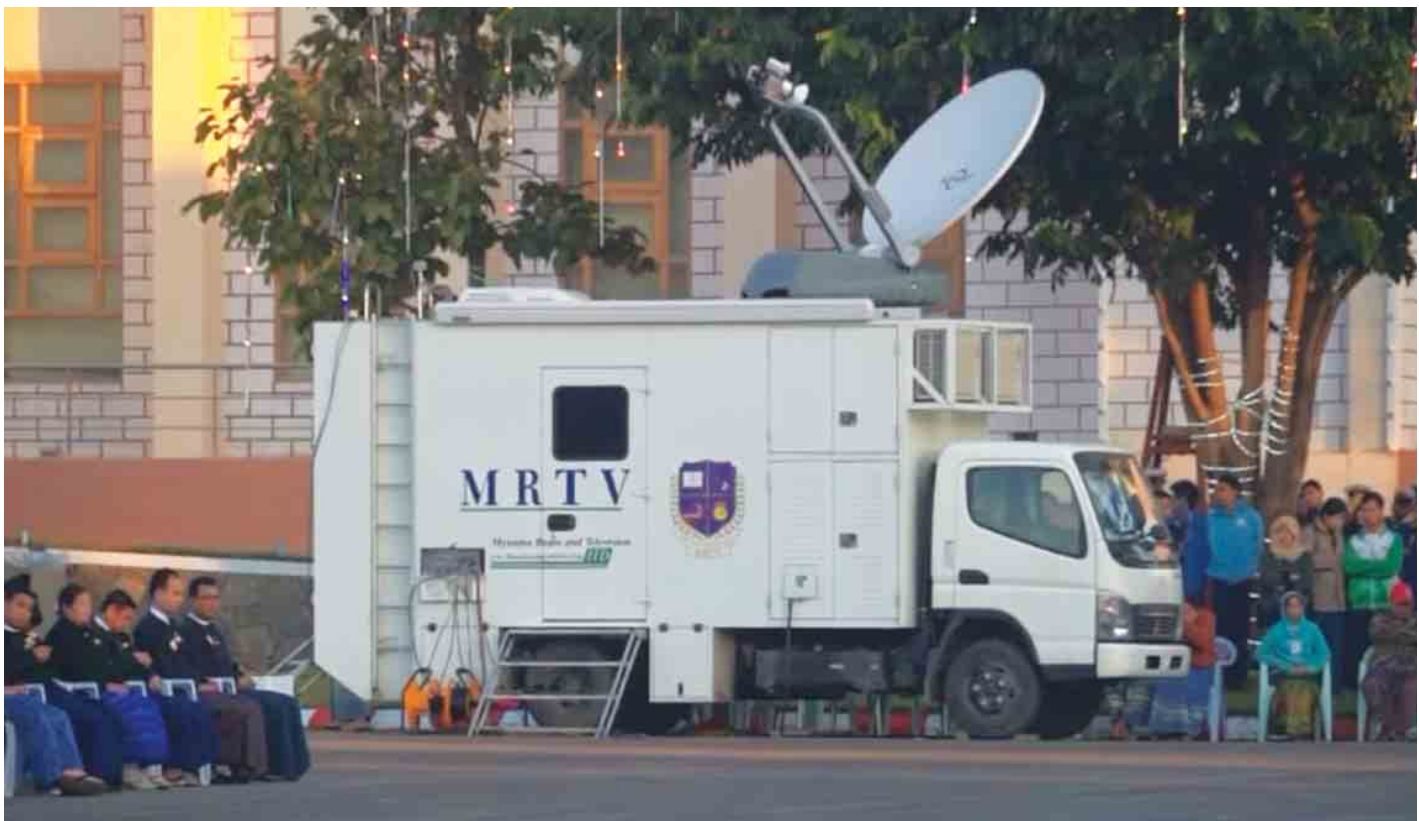
နိုင်ငံတော်အဆင့် အခမ်းအနားများ၊ ဘောလုံးပွဲများ၊ အခြားတိုက်ရိုက်ထုတ်လွှင့်မှုများအတွက် အသုံးပြုသော မော်တော်ယာဉ်ကို တွေ့ရစဉ်။

ပြည်သူတွေရဲ့ စိတ်လက်အပန်းဖြေမှုကို ပေးစွမ်းနိုင်ဖို့ မြန်မာ့အသံနှင့်ရုပ်မြင်သံကြားဟာ တေးသီချင်းအသစ်တွေ ရိုက်ကူးထုတ်လုပ်ခြင်း၊ နိုင်ငံတော်အခမ်းအနားတွေမှာ ပါဝင်ဖျော်ဖြေတင်ဆက်ခြင်းတို့အပြင် နိုင်ငံတော်သံရုံးတိုင်းမှာ နိုင်ငံခြားသားပညာရှင်တွေနဲ့ ပူးပေါင်းပြီး နိုင်ငံ တကာအဆင့် တေးဂီတဖျော်ဖြေပွဲတွေ ပြုလုပ်နိုင်ခဲ့ပါတယ်။ နိုင်ငံတစ်ဝန်းမှာ ဖြစ်ပျက်နေတဲ့ သတင်းဖြစ်ရပ် မျိုးစုံကို MRTV သတင်းထောက်တွေ ကိုယ်တိုင်ဖြစ်ပွား ရာကို အရောက်သွားလို့ သတင်းရယူရိုက်ကူးပြီး အချိန်နဲ့ တစ်ပြေးညီနီးပါး သတင်းပို့၊ တင်ဆက်နိုင်အောင် ကြိုးပမ်း ခဲ့ကြတာကြောင့် ပြီးခဲ့တဲ့တစ်နှစ်တာကာလအတွင်း နေပြည်တော်၊ ရန်ကင်း၊ မန္တလေးသတင်းဌာနခွဲတွေအပြင် တိုင်းရင်းသား(၁၁)ဘာသာရဲ့ နယ်သတင်းဌာနခွဲ(၁၁)ခုက ပေးပို့တဲ့ ဒေသသတင်းတွေကိုပါ သတင်းပေးပို့တဲ့စနစ်တွေ၊ ဆက်ကြောင်းတွေကို အဆင့်မြှင့်တင်ဆောင်ရွက်နိုင်ခဲ့ပါတယ်။ တိုင်းရင်းသားလူမျိုးပေါင်းစုံတို့ရဲ့ ပကတိအခြေအနေဖြစ်ရပ်တွေကို ထင်ဟပ်ဖော်ပြနေတဲ့ တိုင်းရင်းသားလူမျိုးများရုပ်သံလိုင်းအနေနဲ့ တိုင်းရင်းသားတို့၏ ရိုးရာယဉ်ကျေးမှု ဓလေ့စရိုက်တွေနဲ့ ၎င်းတို့ရဲ့ ဒေသအစားအစာတွေအပြင် ပျောက်ကွယ်လုနီးပါး ရိုးရာယဉ်ကျေးမှုအသုံးအနှုန်းတွေ၊ ဝေါဟာရတွေကို ပရိသတ်တွေ သိရှိစေနိုင်ဖို့ ထိမိတဲ့ဖန်တီးထုတ်လွှင့်မှုတွေနဲ့ ထုတ်လွှင့်လျက်ရှိပါတယ်။