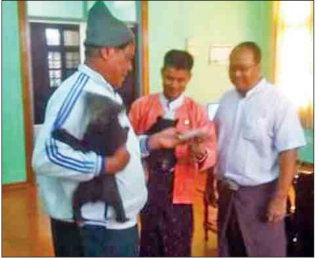
ပန်းမောက်မြို့နယ်၌ ဖမ်းမိရရှိသောဝက်ပေါက် နှစ်ကောင် စစ်ကိုင်းတိုင်းဒေသကြီးဝန်ကြီးချုပ် ဒေါက်တာမြင့်နိုင်ထံ ပေးအပ်

ပန်းမောက် မတ် ၆ ပန်းမောက်မြို့နယ်၌ ဖမ်းမိရရှိသောဝက်ပေါက် နှစ်ကောင်ကို မတ် ၅ ရက် နံနက်ပိုင်းက စစ်ကိုင်းတိုင်းဒေသကြီးဝန်ကြီးချုပ် ဒေါက်တာမြင့်နိုင်ထံ ပေးအပ်ခဲ့ကြောင်း သိရသည်။