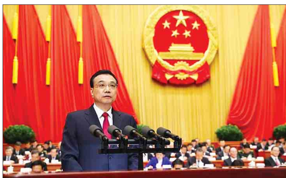
ရိုနေရန် လျာထားသည်။ ယင်းမှာ ၂၀၁၆ ခုနှစ်အတွက် နှင့် နှိုင်းယှဉ်နိုင်ကြောင်း အစိုးရအဖွဲ့က အမျိုးသား ပြည်သူ့ကွန်ဂရက်သို့ တင်သွင်းသော လုပ်ငန်းအကောင်

တရုတ်နိုင်ငံသည် ၂၀၁၇ ခုနှစ်အတွက် ပြည်တွင်း အသားတင်ထုတ်လုပ်မှုတန်ဖိုး(ဂျီဒီပီ)တိုးတက်မှုနှုန်းကို ၆ ဒသမ ၅ ရာခိုင်နှုန်း လျာထားသတ်မှတ်လိုက်ကြောင်း၊ ကမ္ဘာပေါ်တွင် ဒုတိယစီးပွားရေးအင်အားတည်ရာ တရုတ်နိုင်ငံသည် ယခုနှစ်တွင် အနည်းငယ်မျှ ပိုမိုနှေးကွေးသွားသော ဂျီဒီပီတိုးတက်မှုနှုန်းကို လက်ခံရမည့်အခြေအနေတွင် ရှိနေကြောင်း၊ ထိုစဉ်အတွင်း ဝန်ကြီးချုပ်လီခချန်းက ယခုနှစ်အတွင်း ကမ္ဘာစီးပွားရေးတွင် ပိုမိုရှုပ်ထွေးပေလိမ့်မည် အခက်အခဲများကို တွေ့မြင်ရဖွယ်ရှိသည်ဟု သတိပေးလိုက်ကြောင်း ဒေသဆိုင်ရာ သတင်းဌာနများက မတ် ၆ ရက်တွင် သတင်းထုတ်ပြန်သည်။