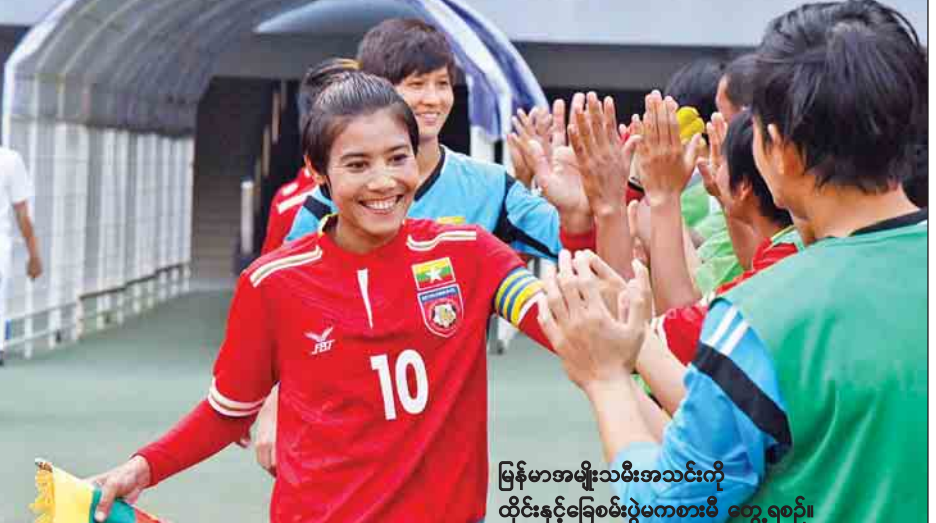
မြန်မာအမျိုးသမီးအသင်းကို ထိုင်းနှင့်ခြေစမ်းပွဲကစားမီ တွေ့ရစဉ်။

ရန်ကုန် မတ် ၆ အာရှဘောလုံးအဖွဲ့ချုပ် (AFC) က သတ်မှတ်ထားသော AFC Women's Football Day 2017 အခမ်းအနားကို မတ် ၈ ရက် ညနေ ၃ နာရီခွဲတွင် ရန်ကုန်မြို့ သုဝဏ္ဏမြက်ခင်းတုကွင်း၌ ကျင်းပမည်ဖြစ်သည်။ မြန်မာနိုင်ငံ ဘောလုံးအဖွဲ့ချုပ်သည် မတ် ၈ ရက်တွင် ကျရောက်သည့် AFC Women's Football Day ကို ဆင်နွှဲခြင်းဖြစ်ပြီး အသက်ငါးနှစ်မှ ၁၆ နှစ်ကြားရှိ လူငယ်အမျိုးသမီးကစားသမားများကို အမျိုးသမီးနည်းပြများက ဘောလုံးအခြေခံနည်းစနစ်များ သင်ကြားပေးမည်ဖြစ်သည်။ ထို့ပြင် AFC Women's Football Day အထိမ်းအမှတ်အဖြစ် မြန်မာ့လက်ရွေးစင် အမျိုးသမီးအသင်းနှင့် အမျိုးသမီးလိဂ် ညွှန်ပေါင်းအသင်းတို့ ခြေစမ်းပွဲယှဉ်ပြိုင်ကစားမည်ဖြစ်သည်။ မြန်မာ့လက်ရွေးစင် အမျိုးသမီး