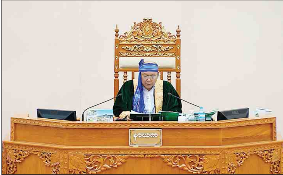
ပြည်ထောင်စုလွှတ်တော်နာယက မန်းဝင်းခိုင်သန်း

ဆက်လက်၍ စိုက်ပျိုးရေး၊ မွေးမြူရေးနှင့် ဆည်မြောင်း ဝန်ကြီးဌာန ဒုတိယဝန်ကြီး ဦးလှကျော်ကလည်း