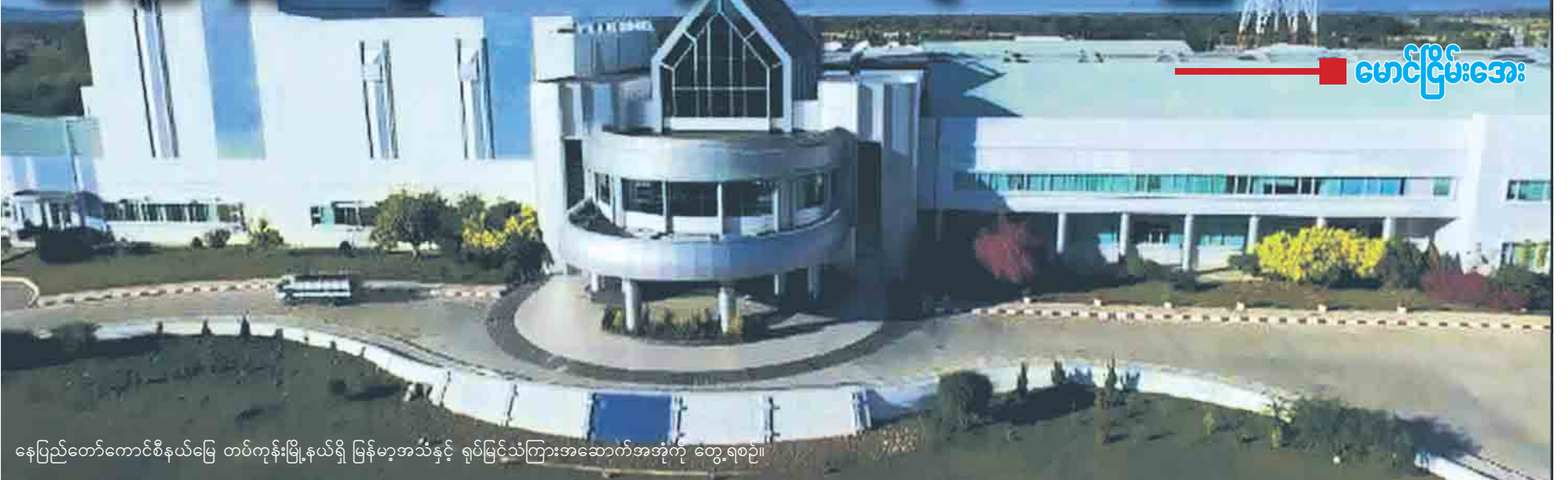
မောင်ငြိမ်းအေး