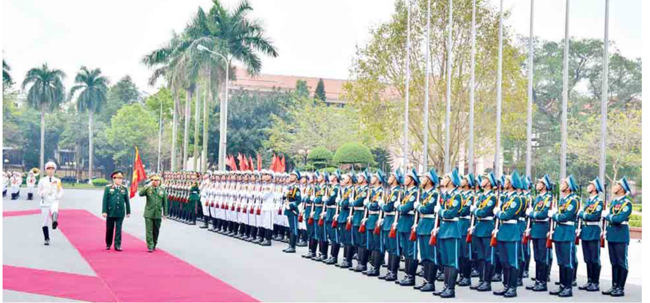
တပ်မတော်ကာကွယ်ရေးဦးစီးချုပ် ဗိုလ်ချုပ်မှူးကြီးမင်းအောင်လှိုင်နှင့် ဗီယက်နမ်အမျိုးသားကာကွယ်ရေးဝန်ကြီးတို့ ဂုဏ်ပြုတပ်ဖွဲ့အား စစ်ဆေးကြစဉ်။