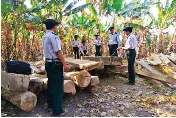
ရှိမှုတို့ကြောင့်ဖြစ်ကြောင်း ကျောက်ဆည်ခရိုင် သစ်တောဦးစီးဌာန၏ သုံးသပ်ချက်အရ သိရသည်။

ကျောက်ဆည် မတ် ၆ သယံဇာတနှင့် သဘာဝပတ်ဝန်းကျင်ထိန်းသိမ်းရေးဝန်ကြီးဌာန သစ်တောဦးစီးဌာနသည် သစ်တောကြီးပိုင်းများ၊ ကြီးပြင်ကာကွယ်တောများနှင့် သဘာဝထိန်းသိမ်းရေးနယ်မြေများတွင် သစ်တောဖုံးလွှမ်းမှု တိုးတက်လာစေရန်အတွက် သစ်တောများ ပြန်လည်ထောင်ရေးလုပ်ငန်းများကို ၂၀၁၇-၂၀၁၈ ခုနှစ်မှ ၂၀၂၆-၂၀၂၇ ခုနှစ်အထိ ၁၀ နှစ်စီမံခန့်ခွဲရေး ချမှတ်အကောင်အထည်ဖော်ဆောင်ရွက်လျက်ရှိသည့်အပြင် ထိန်းသိမ်းထားသော သဘာဝတောများနှင့် တည်ထောင်ပြီး သစ်မျိုးစုံစိုက်ခင်းများအတွင်းမှ တရားမဝင် ခုတ်လှဲထုတ်ယူခြင်းများကို စောင့်ကြည့်တားဆီးပြီး ဖော်ထုတ်အရေးယူခြင်းများ ဆောင်ရွက်လျက်ရှိကြောင်း သိရသည်။