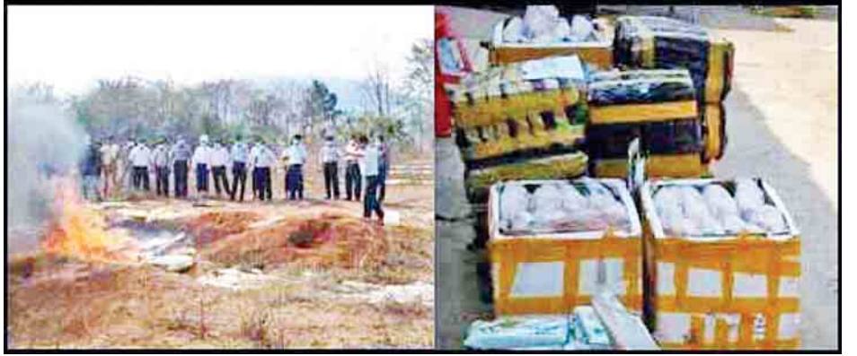
အထူး တစ်စုံတစ်ရာ တင်ပြနိုင်ခြင်းမရှိသည့် အေးခဲ ဘဲသား ၆၇၂ ကီလိုဂရမ် (ခန့်မှန်းတန်ဖိုးငွေကျပ် ၁ ဒသမ ၁၅၂ သန်းခန့်)ကို တွေ့ရှိသိမ်းဆည်းခဲ့ပြီး မတ် ၅ ရက် တွင် အဆိုပါ အေးခဲဘဲသားများကို အများပြည်သူ

သော ကုန်ပစ္စည်းများကို စစ်ဆေးမှုပြုလုပ်ဆောင်ရွက် လျက်ရှိရာ မတ် ၅ ရက်က ရေပူအမြဲတမ်းစစ်ဆေးရေးစခန်း တွင် တားဆီးမှု ၁၂ မှု (ခန့်မှန်းတန်ဖိုးငွေကျပ် ၂၂ ဒသမ ၇ သန်းခန့်)နှင့် မရမ်းချောင့်အမြဲတမ်းစစ်ဆေးရေးစခန်းက တားဆီးမှု ၅၈ မှု (ခန့်မှန်းတန်ဖိုးငွေကျပ် ၄ ဒသမ ၉၀၃ သန်းခန့်) စုစုပေါင်း ၁၄ မှု (ခန့်မှန်းတန်ဖိုးငွေကျပ် ၂၇ ဒသမ ၆၀၃ သန်းခန့်) သိမ်းဆည်းရရှိကြောင်း သိရသည်။ ထူးခြားဖမ်းဆီးမှုအနေဖြင့် မတ် ၄ ရက်တွင် မူဆယ် မှ မန္တလေးသို့သွားရောက်မည့် ခရီးသည်တင်ယာဉ်ကို ရေပူအမြဲတမ်းစစ်ဆေးရေးစခန်း ပူးပေါင်းစစ်ဆေးရေးအဖွဲ့ က စစ်ဆေးခဲ့ရာ တရားဝင်စာရွက်စာတမ်း အထောက်