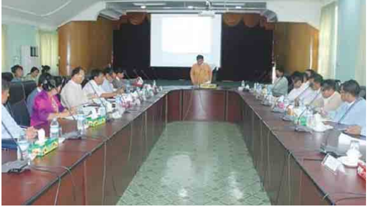
များအဖွဲ့ပါဝင်ပြီး ၎င်းအဖွဲ့မှ ဒီဇိုင်းများ အရည်အသွေးသတ်မှတ်ချက်များ ဆောင်ရွက်ရန်၊ အကြံပေးပညာရှင်များ၏ သတ်မှတ်ချက်များအတိုင်း ကန့်သတ်ရိတ်တာများ လုပ်ငန်းဆောင်ရွက်ခြင်းရှိ-မရှိ စစ်ဆေးရေးအဖွဲ့ (QC) မှ ထပ်မံစစ်ဆေးရန်ဖြစ်ကြောင်းနှင့် BRBCA အတည်ပြုဖွဲ့စည်းနိုင်ရေးအတွက် ဌာနဆိုင်ရာများ၊ အသိပညာရှင်၊ အတတ်ပညာရှင်များ၊ ပုဂ္ဂလိကလုပ်ငန်းရှင်များ၊ ရပ်မိရပ်ဖများပါဝင်

သမာဓိရှိသူ နှစ်ဦး စုစုပေါင်း ၁၂ ဦးဖြင့် ဖွဲ့စည်းနိုင်ရေး အကြမ်းဖျင်းလျာထားပါကြောင်း၊ အဖွဲ့အစည်းတစ်ခုချင်းစီအတွက် လုပ်ပိုင်ခွင့်များ၊ လုပ်ငန်းတာဝန်များအား တာဝန်ယူမှု တာဝန်ခံမှုစနစ်ဖြင့် ဆောင်ရွက်သွားရမည်ဖြစ်ပါကြောင်း တင်ပြဆွေးနွေးခဲ့သည်။