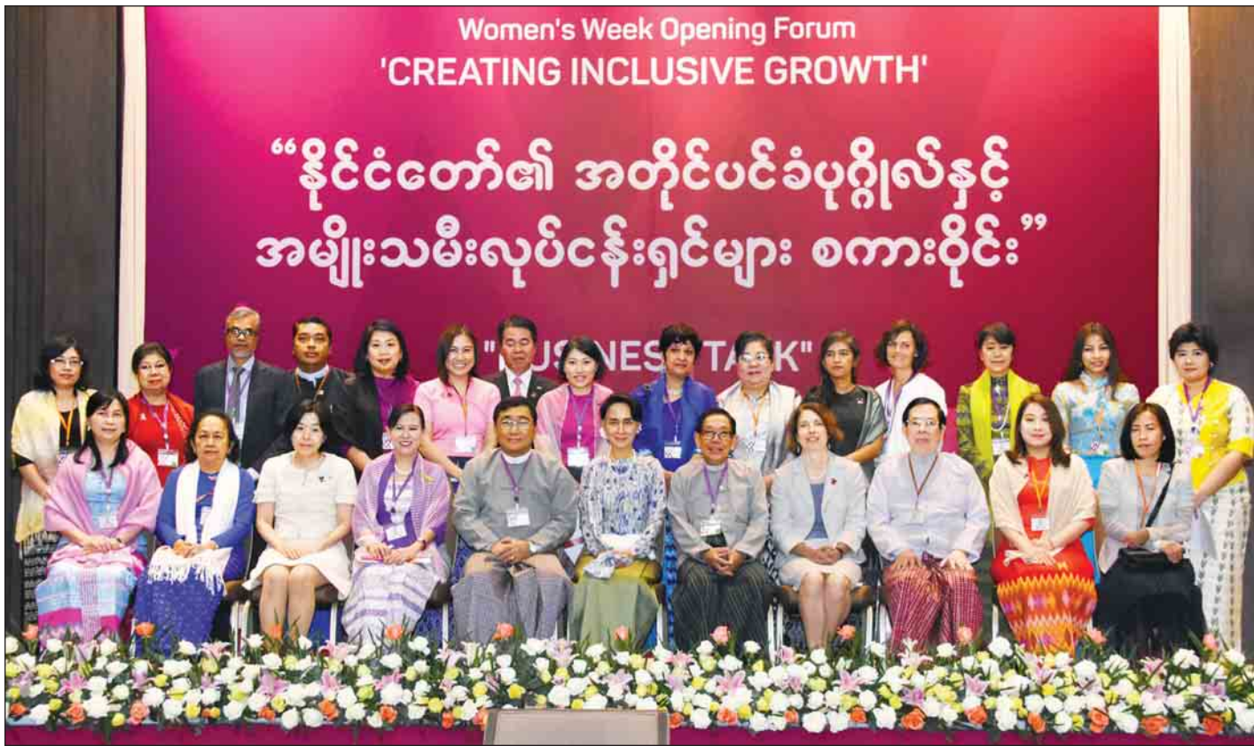
နိုင်ငံတော်၏ အတိုင်ပင်ခံပုဂ္ဂိုလ် ဒေါ်အောင်ဆန်းစုကြည် မြန်မာအမျိုးသမီးများ ရက်သတ္တပတ်ပီရမ်စ်ဖွင့်ပွဲသို့ တက်ရောက်လာကြသူများနှင့်အတူ မှတ်တမ်းတင်ဓာတ်ပုံရိုက်စဉ်။ (သတင်းစဉ်)

★ ရှေ့မှ “ပြည်သူ့အားလုံးပါဝင်သော ဖွံ့ဖြိုးတိုးတက်မှု” ဆောင်ပုဒ်ဖြင့် ယနေ့နံနက်ပိုင်းက နေပြည်တော်ရှိ Kempinski Hotel ၌ကျင်းပမည့် မြန်မာအမျိုးသမီးများ ရက်သတ္တပတ်၏ ဖွံ့ဖြိုးဖွံ့ဖြိုးအခမ်းအနားတွင် နိုင်ငံတော်၏ အတိုင်ပင်ခံပုဂ္ဂိုလ် ဒေါ်အောင်ဆန်းစုကြည်က အဖွင့်အမှာ စကားပြောကြားရာတွင် ထိုသို့ပြောကြားခဲ့ခြင်းဖြစ် သည်။