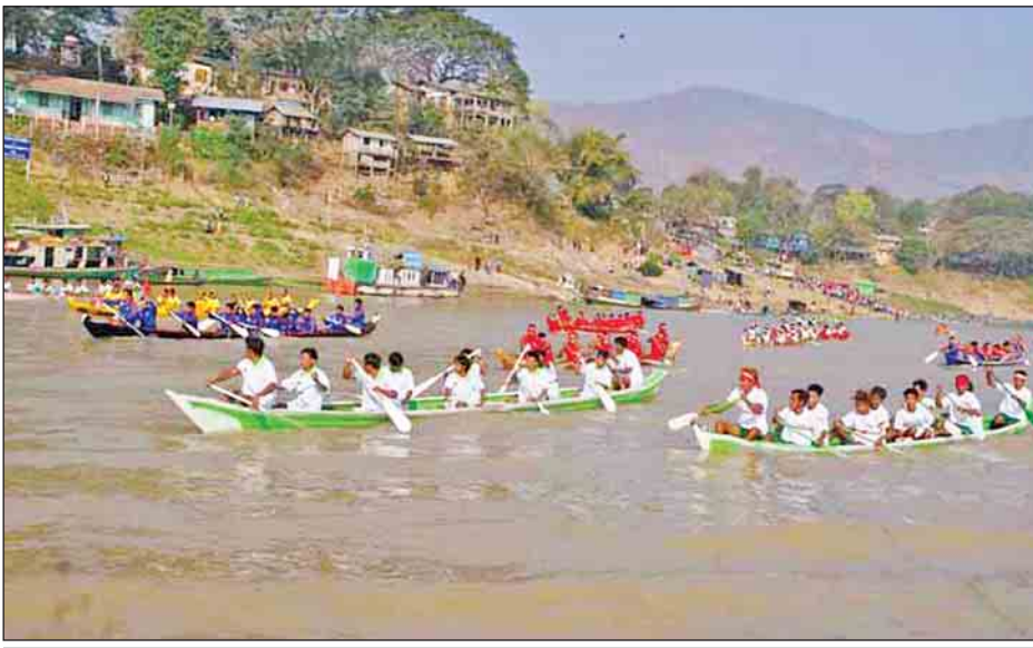
ချင်းတွင်းမြစ်အတွင်း၌ မြန်မာ့ရိုးရာလှေလှော်ပြိုင်ပွဲ ကျင်းပစဉ်။

ပါဝင်ယှဉ်ပြိုင်ခဲ့ကြရာ အမျိုးသား လေ့လျော်အသင်းမှ ပထမဆုကို ကလေးဝမြို့နယ် ဇီးဒေါင့်ကျေးရွာ ပေါ့ပါးလှေအသင်းက ရွှေမုဒ္ဒော တံခွန်စိုက် ခိုင်းဆုကြီးနှင့် ငွေသားဆု၊ ဒုတိယဆုကို မင်းကင်းမြို့နယ် ခိုသာ ကျေးရွာ ဇော်မင်းသားလှေအသင်း၊ တတိယဆုကို ကလေးဝမြို့နယ် တွန်းနန်းကျေးရွာ ပျံလွှားလှေအသင်း တို့က လည်းကောင်း၊ အမျိုးသမီး လှေလှော်အသင်းမှ ပထမဆုကို ကလေးဝမြို့နယ် ကိုင်းကျေးရွာ နွေကျည် မလှေအသင်းက ရွှေမုဒ္ဒောတံခွန်စိုက် ခိုင်းဆုကြီးနှင့် ငွေသားဆု၊ ဒုတိယ ဆုကို ကလေးဝမြို့နယ် ဇီးဒေါင့် ကျေးရွာ ရွှေဇီးမာန်လှေအသင်း၊ တတိယဆုကို ကလေးဝမြို့နယ် တွန်းနန်းကျေးရွာ ပျံလွှားလှေအသင်း တို့က လည်းကောင်း အသီးသီးဆုများ ထိုက်ထိုက်တန်တန် ဆွတ်ခူးခဲ့ကြ ကြောင်း သိရသည်။