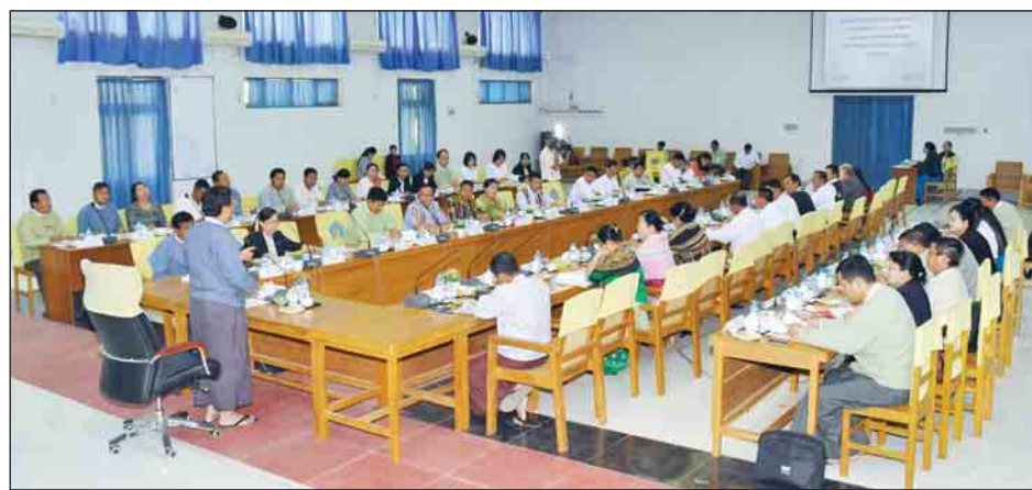
အစဉ်များကို ပူးတွဲဆောင်ရွက်သွားမည်ဖြစ်ပါကြောင်း၊ ကိုယ်ဝန်ဆောင်မိခင်များ ကျန်းမာရေးစောင့်ရှောက်မှု ခံယူလာခြင်းဖြင့် မိခင်နှင့်ကလေး သေဆုံးမှုနှုန်းများ လျော့နည်းလာမည်ဖြစ်ပါကြောင်း၊ ယခုအစီအစဉ်ကို ကျန်

ထို့ကဲ့သို့ ထိရောက်သော အာဟာရရရှိပါက ခန္ဓာကိုယ် ပုံမှန်ကြီးထွားပြီး ဦးနှောက်ဖွံ့ဖြိုးမှုကောင်းသောကလေး ငယ်များဖြစ်လာမည်ဖြစ်ပြီး အနာဂတ်မြန်မာနိုင်ငံအတွက် အားထားရမည့် မျိုးဆက်သစ်များ ရရှိမည်ဖြစ်ကြောင်း၊ ထောက်ပံ့ငွေကို ကိုယ်ဝန်ဆောင်နှင့် ၎င်းတို့မှ မွေးဖွားလာ သော အသက်(၂)နှစ်အောက်ကလေးများ အာဟာရပြည့်ဝ ရေးအတွက် ထိရောက်စွာအသုံးပြုရန် လိုအပ်ပါကြောင်း၊ အစားအစာများ သန့်ရှင်းလတ်ဆတ်ရေး၊ အာဟာရ ပြည့်ဝစွာ စားသုံးရေးတို့အတွက်လည်း အသိပညာပေးအစီ