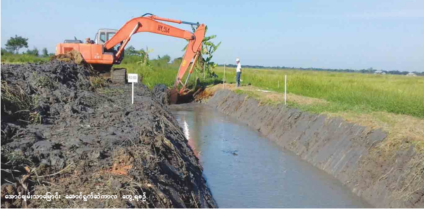
အောင်ချမ်းသာမြောင်း၊ ဆောင်ရွက်ဆဲကာလ တွေ့ရစဉ်။

ဧရာဝတီတိုင်းဒေသကြီး ဝါးခယ်မမြို့နယ်အတွင်း ရွှေလောင်းကျွန်းပတ်တာ၊ ကဝဲသဲဒင်းတာ၊ စပါးရိုထိ တန်တာ၊ ပေကုန်းတာ၊ ထန်းလေးပင်တာ၊ ဂရမ်းကြာ တွင်းတာ၊ ဦးပိတ္တလိစစ်ချောင်းတာနှင့် တံခွန် တိုင်ငှက် ပျောချောင်းတာဟူ၍ ကျွန်းပတ်တာတစ်ခုနှင့် တာတမံ ခုနစ်ခုရှိပြီး ထော်ကနွတ်ရေတံခါး၊ အရှေ့ဒရင်း၊ ဘုရား ကုန်း၊ မဲလီ၊ အူကျွန်း၊ တလုတ်ထော်၊ ကျွဲကပြင်၊ ကျွဲပ ဒေါ၊ ကလိပ်၊ ကလ၊ အလန်း၊ အလမ်းတူးချောင်း၊ စစ်ကုန်း၊ မနန်းတုတ်၊ ညောင်ချောင်း၊ ကျွဲခေါင်းနှင့် ထီးတန်ဟူ၍ ရေတံခါး ၁၈ လုံးရှိပြီး ၂၀၁၆-၂၀၁၇ ဘဏ္ဍာ နှစ်တွင် အဆိုပါရေဘေးကာကွယ်ရေးဧရိယာအတွင်း မိုး စပါးလျာထားဧက ၆၁၄၂၅ ဧက စိုက်ပျိုးရန်လျာထား ခဲ့ရာ ရာနှုန်းပြည့်စိုက်ပျိုးနိုင်ခဲ့ကြောင်း သိရသည်။