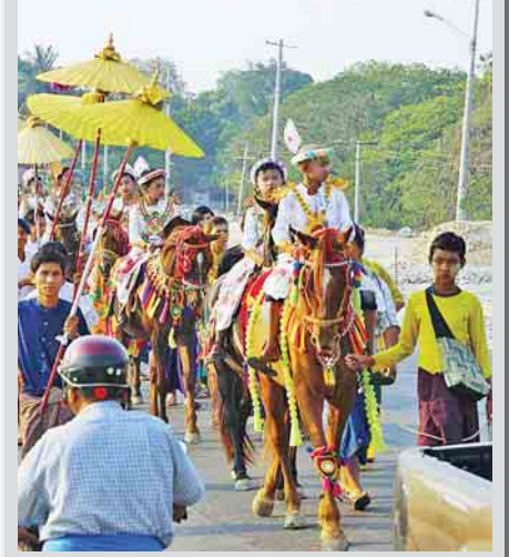
စာမျက်နှာ - ၇

မိတ္ထီလာတွင် ဒုတိယအကြိမ် ရှင်အပါး ၅၀၀ ရှင်လောင်းလှည့်ပွဲ စည်ကားသိုက်မြိုက်စွာ ကျင်းပ