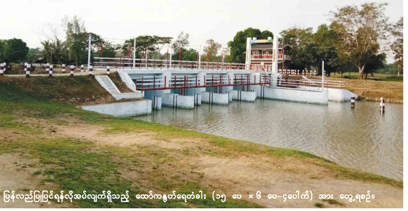
ပြန်လည်ပြုပြင်ရန်လိုအပ်လျက်ရှိသည့် ထော်ကနွတ်ရေတံခါး (၁၅ ပေ x ၆ ပေ-၄ပေ) အား တွေ့ရစဉ်။

နွေစပါးစိုက်ပျိုးရာသီအမီ စိုက်ပျိုးရေးရရှိရေးအတွက် အောက်တိုဘာ ၂၈ ရက်မှ ဒီဇင်ဘာ ပထမပတ်အထိ ရက်ပေါင်း ၄၀ ကာလအတွင်း ရွှေလောင်းကျွန်းပတ် တာတွင် သဲကုန်း-ကြာဖြူ ဆက်သွယ်ရေးမြောင်း၊ S1-14 မြောင်း၊ S1-12 မြောင်း၊ ကြာအိုင်ကုန်း-အူကျွန်း ကားလမ်း သေး(ဝဲ/ယာ)မြောင်း၊ S1-15 မြောင်း၊ အောင်ချမ်းသာ မြောင်း၊ ကြာအိုင်မြောင်း၊ S1-11 မြောင်း၊ S1-10 မြောင်း၊ S1-13 မြောင်း၊ S1-1-11 မြောင်း၊ အောင်ပြည့်စုံမြောင်း၊ စက်ဘီးမြောင်း၊ SM-3 မြောင်း၊ SP-1 မြောင်း၊ SD-1 မြောင်းနှင့် ထော်ကနွတ်အနောက်စုမြောင်း တူးဖော်ပေး ခဲ့သဖြင့် နွေစပါးလျာထားစိုက်စေရန်အထောက်အကူ ပြုနိုင်မည်ဖြစ်ကြောင်း သိရသည်။