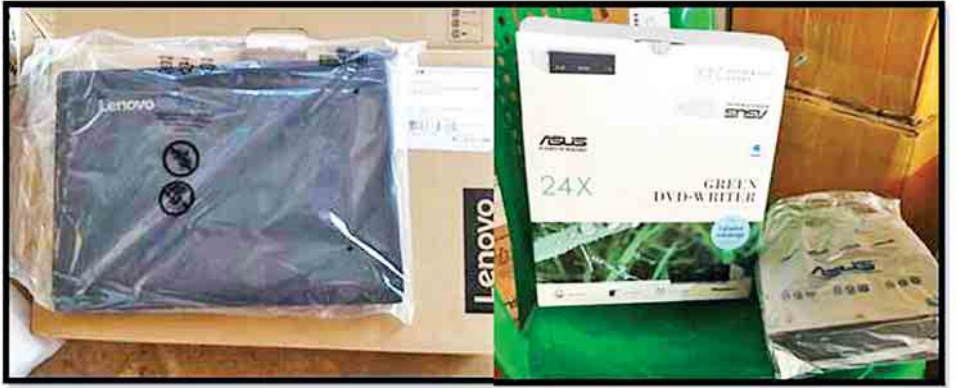
တရားဝင်စာရွက်စာတမ်းအထောက်အထားတင်ပြနိုင်ခြင်းမရှိသည့် ကွန်ပျူတာနှင့် ဆက်စပ်ပစ္စည်းများ။

အလားတူ မတ် ၃ ရက်တွင် မန္တလေး-မုဆယ် ပြည်ထောင်စုလမ်းမကြီးတစ်လျှောက် ကုန်သွယ်မှုယာဉ် ပို့ကုန် ၆၃၆ စီး၊ သွင်းကုန် အစီး ၇၀၂၊ ရန်ကုန်- မြဝတီ လမ်းမကြီးတစ်လျှောက် ကုန်သွယ်မှုယာဉ် ပို့ကုန် ၁၂၇ စီး၊ သွင်းကုန် ၂၁၅ စီး၊ မတ် ၄ ရက်တွင် မန္တလေး-မုဆယ် ပြည်ထောင်စုလမ်းမကြီးတစ်လျှောက် ကုန်သွယ်မှုယာဉ် ပို့ကုန် ၆၅၅ စီး၊ သွင်းကုန် ၇၀၁ စီး၊ ရန်ကုန်-မြဝတီ လမ်းမကြီးတစ်လျှောက် ကုန်သွယ်မှုယာဉ် ပို့ကုန် ၁၄၃ စီး၊ သွင်းကုန် ၂၆၇ စီး ကုန်စည်များ သယ်ယူပို့ဆောင် လျက်ရှိကြောင်း သိရသည်။