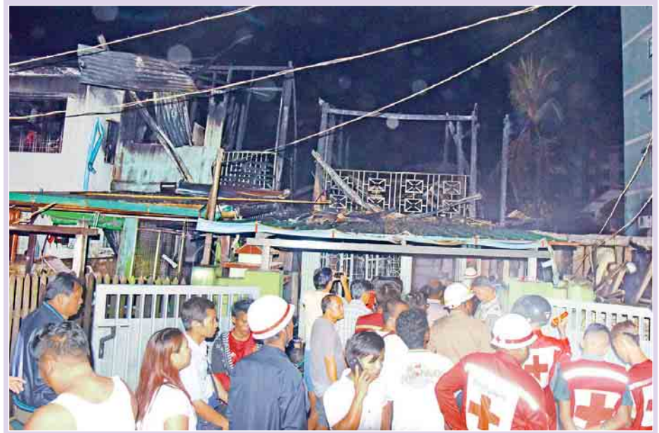
ရန်ကုန်တိုင်းဒေသကြီး တောင်ဥက္ကလာပမြို့နယ် (၉)ရပ်ကွက် သူရ(၂)လမ်း၌ မတ် ၅ ရက် ည ၇ နာရီ ခန့်တွင် မီးလောင်ကျွမ်းမှုဖြစ်ပွားခဲ့ပြီး ည ၇ နာရီ ၅၅ မိနစ်တွင် မီးငြိမ်းသတ်နိုင်ခဲ့သည်။ မီးလောင်မှုကြောင့် နေအိမ် ၄၀ ခန့်နှင့် တိုက်ခန်းနှစ်ခန်း မီးလောင်ဆုံးရှုံးသွားကြောင်း ကနဦးသတင်းအရ သိရသည်။

၂၀၁၇ ခုနှစ် မတ်လ ၈ ရက်တွင် စတင်ကျင်းပမည့် တက္ကသိုလ်ဝင်စာမေးပွဲတွင် ညောင်တုန်းမြို့နယ်စာစစ်ဌာန များ၌ ဝင်ရောက်ဖြေဆိုကြမည့် ကျောင်းတွင်းဖြေနှင့် ပြင်ပဖြေ ကျောင်းသား ကျောင်းသူ စုစုပေါင်း ၃၂၅၂ ဦး ဝင်ရောက်ဖြေဆိုမည်ဖြစ်ကြောင်း မြို့နယ်ပညာရေးမှူးရုံးမှ သိရသည်။