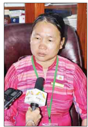
နော်ပန်းသဏ္ဍာဗျိုး (ရန်ကုန်တိုင်းဒေသကြီး ကရင်တိုင်းရင်းသားလူမျိုးရေးရာဝန်ကြီး)

ကြိုတင်ပြင်ဆင်ထားတယ်။ ဒါကြောင့် အခုလိုအောင်မြင်စွာနဲ့ ခွဲစိတ်ပေးနိုင်ခဲ့တာပါ။ ဝန်ကြီးချုပ်က အထူးကြပ်မတ်ဆောင်မှာ နောက်ထပ်တစ်ရက်၊ နှစ်ရက်လောက် နေရမယ်။ ပြီးရင် ဆေးရုံမှာ တစ်ပတ်၊ ဆယ်ရက်လောက်နေပြီး အိမ်ပြန် လို့ရမှာပါ။ အိမ်ပြန်ပြီးရင်တော့ ပုံမှန်ပြန်ရောက်သွားဖို့ဆိုရင် ပုံမှန်အားဖြင့် လေးပတ်နဲ့ ခြောက်ပတ်၊ အလွန်ဆုံး ရှစ်ပတ်လောက်ကြာတတ်ပါတယ်။ ပြန်လည်ကျန်းမာပြီး ပုံမှန်ပြန်ဖြစ်လာမှာပါ။ ပါမောက္ခ ဝင်းဝင်းကျော် (နှလုံး သွေးကြောခွဲစိတ် အထူးကု ဆရာဝန်ကြီး) ဝန်ကြီးချုပ်ကို ခွဲစိတ်ဖို့ ပါမောက္ခ အောင်ရဲဦးနဲ့ဆက်သွယ်တယ်။ ဝန်ကြီးချုပ်က မွေးရာပါ အဆိုရှင် သုံးခုရှိတဲ့နေရာမှာ မွေးရာပါ အဆိုရှင်နှစ်ခုပဲ ပါလာတာဆိုတော့ သွေးကြောမကြီးကလည်း ကြီးနေတာဆိုတော့ ရောဂါ ရှာဖွေတွေ့ရှိသွားတာပါ။ သူက ဟိုမှာလည်းခွဲလို့ရတယ်။ ဒီမှာလည်းခွဲလို့ရတယ်ပြောတော့ ဝန်ကြီးချုပ်က ဒီမှာပဲ ခွဲမယ်ပြောလို့ လိုအပ်တဲ့ ကျန်းမာရေး စစ်ဆေးမှုတွေလုပ်ပြီး သုံးပတ်လောက်အချိန်ယူပြီး ပြင်ဆင်ခဲ့ပါတယ်။ အားလုံး အသင့်ဖြစ်ပြီဆိုတော့မှ ပါမောက္ခ အောင်ရဲဦးက လာရောက်ခွဲစိတ်ပေးခဲ့တာပါ။ ဝန်ကြီးချုပ်ရဲ့ ကျန်းမာရေးအခြေအနေအားလုံးကောင်းပါတယ်။ ဝန်ကြီးချုပ်ကို လာရောက်ခွဲစိတ်ပေးတဲ့ နှလုံးသွေးကြောခွဲစိတ် အထူးကုဆရာဝန်ကြီး ပါမောက္ခ အောင်ရဲဦးက ရန်ကင်းဆေးရုံမှာ တစ်နှစ်ကို နှစ်ခါလောက် လာခွဲစိတ်ပေးတယ်။ ကျွန်မတို့ ရန်ကင်းကလေးဆေးရုံကြီးမှာဆိုရင် နှလုံးခွဲစိတ်မှုကို ၂၀၁၂ ခုနှစ် နိုဝင်ဘာ ၅ ရက်က စတင်ခဲ့ပြီး ယနေ့အထိ လူနာပေါင်း ၁၈၀၀ ခန့်ကို ခွဲစိတ်ကုသပေးနိုင်ခဲ့ပါတယ်။