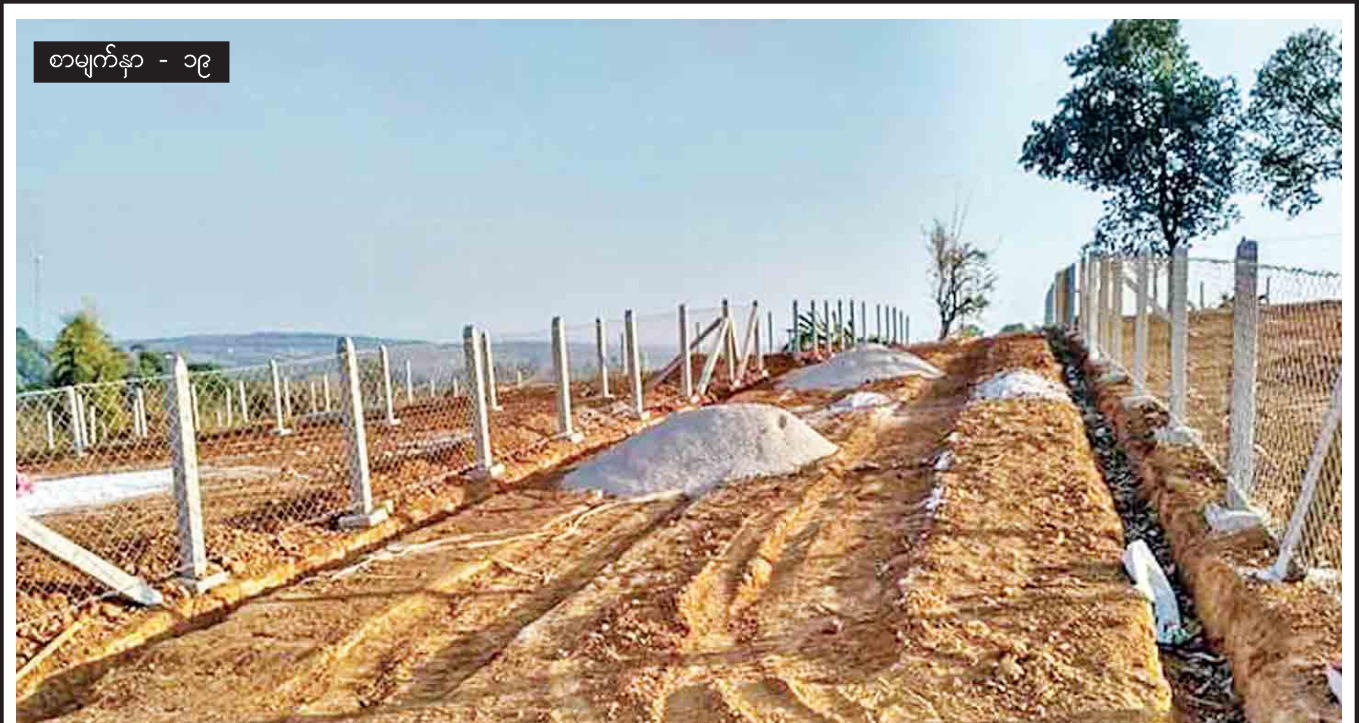
စာမျက်နှာ - ၁၉