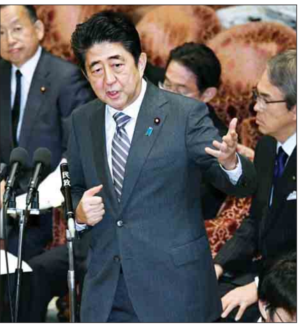
အင်နအိတ်ချီကေ။

ဝန်ကြီးချုပ်ရွေးကောက်ပွဲတွင် ဝန်ကြီးချုပ် ရှင်ဇိအာဘေးအနေဖြင့် ဝန်ကြီးချုပ် သက်တမ်းသုံးကြိမ်မြောက်အဖြစ် ဝင်ရောက်ယှဉ်ပြိုင်မည်ဖြစ်သည်။ လွတ်လပ်သော ဒီမိုကရက်တစ်ပါတီအနေဖြင့် ၂၇ နှစ်အတွင်း ပထမ ဆုံးအကြိမ် မဲအများဆုံးအနိုင်ရရှိခဲ့သည့် ယမန်နှစ်ရွေးကောက်ပွဲနှင့် ပတ်သက်ပြီး ဝန်ကြီးချုပ် ရှင်ဇိအာဘေးက ပြန်လည်ပြောကြားခဲ့သည်။ ပါတီအနေဖြင့် ပြည်သူများ၏ ယုံကြည်မှုကိုပြန်လည်ရရှိရန် ၂၅ နှစ်ကျော် အချိန်ယူခဲ့ရကြောင်းနှင့် ၎င်းအနေဖြင့် ထိုအချိန်ကတည်းမာမူများကို အောက်မေ့ သတိရကာ ရှေ့ဆက်ရမည့်အနာဂတ်စိန်ခေါ်မှုများကို အစွမ်းကုန် ရင်ဆိုင်ကြိုးပမ်း သွားမည်ဖြစ်ကြောင်း ဝန်ကြီးချုပ်ရှင်ဇိအာဘေးက ဆိုသည်။ ထို့ပြင် ဝန်ကြီးချုပ်က ယခုနှစ်ကျင်းပခဲ့သော ဖွဲ့စည်းပုံအခြေခံဥပဒေမိုးမိုးမှု နှစ် ၇၀ ပြည့် နှစ်ပတ်လည်နေ့အခမ်းအနားကျင်းပမှုနှင့် ပတ်သက်ပြီး ထည့်သွင်းပြောကြားခဲ့သည်။ ဂျပန်နိုင်ငံအနေဖြင့် နောက်ထပ် နှစ်ပေါင်း ၇၀ တိုင်အောင် ဖွဲ့စည်းပုံအခြေခံဥပဒေမိုးမိုးမှုရရှိရန်လိုအပ်ကြောင်း ဝန်ကြီးချုပ်က ပြောကြားခဲ့သည်။