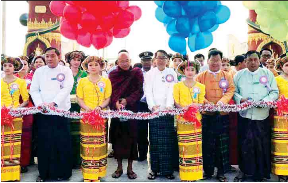
ခရိုင်အုပ်ချုပ်ရေးမှူး၊ ခရိုင်လဝက မှစ၍ တပေါင်းလပြည့်နေ့အထိ ဦးစီးမှုနှင့် ဧည့်သည်တော်များ ရှစ်ရက်ကျင်းပမည်ဖြစ်ကြောင်း သိရ တက်ရောက်ခဲ့ပြီး ပွဲတော်ကို ယနေ့ သည်။ အခမ်းအနားသို့ ပြည်နယ် လွှတ်တော်ကိုယ်စားလှယ်များ၊ မိုးညှင်း ဝင်းနိုင်(ကချင်မြေ)

မိုးကောင်း မတ် ၅ ကချင်ပြည်နယ် မိုးညှင်းခရိုင် အင်းတော်ကြီးဒေသရှိ သမိုင်းဝင် အင်းတော်ကြီး ရွှေမဉ္ဇူရေလယ်ဘုရား (၁၄၈)ကြိမ်မြောက် ဗုဒ္ဓပူဇော်ပွဲတော် ဖွင့်ပွဲအခမ်းအနားကို မတ် ၅ ရက် နံနက် ၈ နာရီခွဲတွင် ပြည်နယ် ဘဏ္ဍာ အခွန်၊ စီမံကိန်းနှင့် စီးပွားရေးဝန်ကြီး ဌာန ဝန်ကြီး ဦးဝေလင်းက ဖဲကြီးဖြတ် ဖွင့်လှစ်ပေးခဲ့ကြောင်း သိရသည်။ အဆိုပါ အခမ်းအနားတွင် ဝန်ကြီး က အင်းတော်ကြီး ရွှေမဉ္ဇူရေလယ် ဘုရား၏ အခွန်လွတ်ဂရန်ကို ဂေါပက အဖွဲ့နှင့် တာဝန်ရှိသူများအား ပေးအပ်ခဲ့သည်။ ဆက်လက်၍ ဝန်ကြီးနှင့်အဖွဲ့သည် အင်းတော်ကြီးကန်အတွင်း ငါးလွတ်ပွဲ အခမ်းအနားပြုလုပ်ကာ ငါးများ လွတ်ခဲ့ပြီး မွန်းတည့် ၁၂ နာရီတွင် အခမ်းအနားပြီးဆုံးခဲ့ကြောင်း သိရ