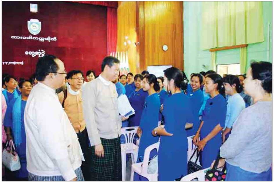
တွေ့ဆုံ၍ ပညာရေးဖွံ့ဖြိုးတိုးတက်စေရန် ဆက်လက် ဆောင်ရွက်မည့်အစီအစဉ်များကို ဆွေးနွေးညှိနှိုင်းကြပြီး ထားဝယ်မြို့ရှိ ထားဝယ်တက္ကသိုလ်၊ နည်းပညာတက္ကသိုလ်၊ ကွန်ပျူတာတက္ကသိုလ်၊ ပညာရေးကောလိပ်၊ အစိုးရ နည်းပညာ အထက်တန်းကျောင်းနှင့် အထက(၁)ထားဝယ် တို့သို့ သွားရောက်ကာ ဆရာ ဆရာမများ၊ ဝန်ထမ်းများနှင့် တွေ့ဆုံ၍ သင်ကြားရေးဆိုင်ရာ လိုအပ်ချက်များကို ညှိနှိုင်း ဆောင်ရွက်ပေးခဲ့ကြောင်း သတင်းရရှိသည်။ (သတင်းစဉ်)

စေမည့် သင်ကြားသင်ယူနည်းစနစ်များဖြင့် သင်ကြား ပေးခြင်း၊ ဂီတ၊ အနုပညာ၊ ပန်းချီ၊ အားကစား၊ လူမှုရေး လုပ်ငန်းများ ဆောင်ရွက်တတ်စေရန်လည်း တွန်းအားပေး ဆောင်ရွက်ကြစေလိုပါကြောင်း။