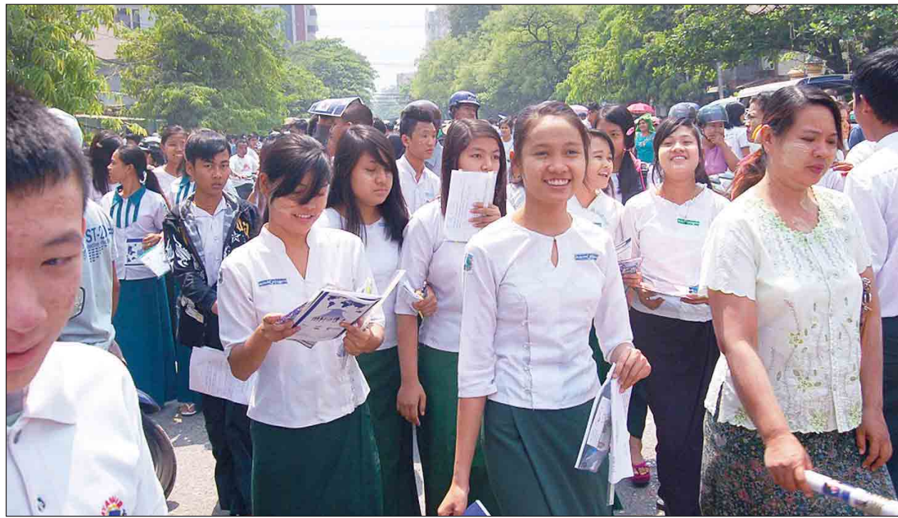
၂၀၁၆ ခုနှစ်က တက္ကသိုလ်ဝင်စာမေးပွဲဖြေဆိုကြသည့် ကျောင်းသား ကျောင်းသူများကို တွေ့ရစဉ်။