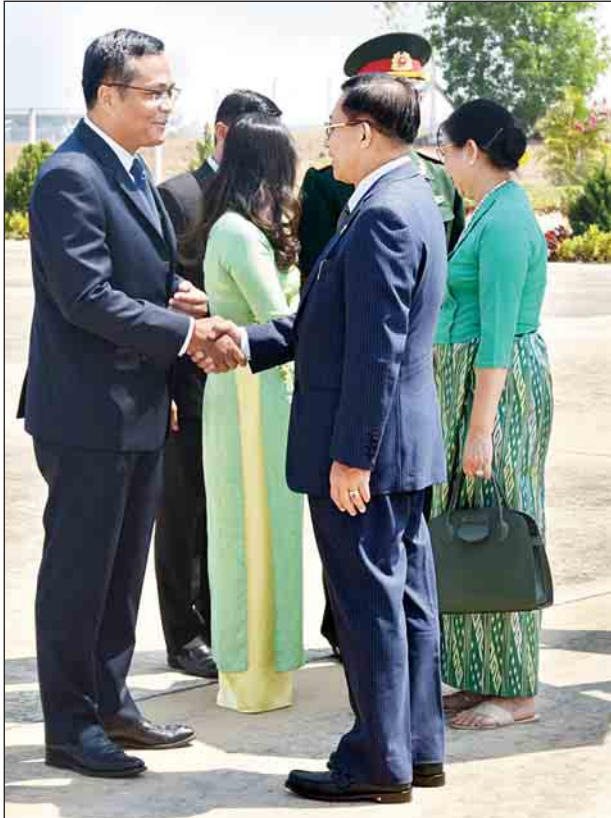
ဖွယ်ရာလက်ဆောင်ပစ္စည်းများ၊ တပ်မတော်အထည်ချုပ်စက်ရုံများမှ အဝတ် အထည်များအား ပေးအပ်ရာ သံအမတ်ကြီးနှင့်ဇနီး၊ သံရုံးမိသားစုများ၊ စစ်သံမှူး နှင့် ဇနီး၊ စစ်သံရုံးမိသားစုများ၊ သင်တန်းသားများက လက်ခံရယူကြသည်။ ထို့နောက် တပ်မတော်ကာကွယ်ရေးဦးစီးချုပ်နှင့် အဖွဲ့ဝင်များအား သံရုံးမိသားစု များက ညစာဖြင့် တည်ခင်းစဉ်ခံခဲ့ကြောင်း သတင်းရရှိသည်။ (သတင်းစဉ်)

ယင်းနောက် ဒေသစံတော်ချိန် ည ၇ နာရီတွင် တပ်မတော် ကာကွယ်ရေး ဦးစီးချုပ်နှင့် အဖွဲ့ဝင်များသည် ပီယက်နမ်နိုင်ငံသို့ ရောက်ရှိကြပြီး သုံးရက်ခန့်ခန့် ညှိနှိုင်းကွပ်ကဲရေး ဦးစီးချုပ်က သံရုံး၊ စစ်သံရုံးတို့မှ မိသားစုများ၊ ပီယက်နမ်နိုင်ငံတွင် သင်တန်း တက်ရောက်နေသည့် သင်တန်းသားများအား အမှာစကား ပြောကြားသည်။ ယင်းနောက် တပ်မတော်ကာကွယ်ရေးဦးစီးချုပ်နှင့် ဇနီးတို့က စားသောက်