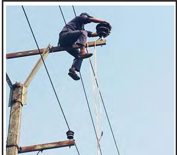
မန္တလေးခရိုင် အောင်မြေသာစံမြို့နယ်နှင့် ချမ်းအေးသာစံမြို့နယ်အတွင်း ဓာတ်အားလိုင်းအပြစ်ဖြစ်ပွားမှုလျော့နည်းပြီး ပြည်သူများဓာတ်အားပိုမိုသုံးစွဲနိုင်ရန် 33 kv မရမ်းခြံဓာတ်အားလိုင်းတွင် တပ်ဆင်ထားသော နှစ်ထပ်ကြွေးသီးများအား သုံးထပ်ကြွေးသီးများဖြင့် လဲလှယ်ခြင်းကို မန္တလေးခရိုင်လျှပ်စစ်မန်နေဂျာ ခုခရိုင်လျှပ်စစ်မန်နေဂျာတို့ ဦးစီး၍ အင်အား ၆၀ ဖြင့် ဖေဖော်ဝါရီ ၂၈ ရက်က ဆောင်ရွက်ကြစဉ်။ တင်မောင်(မန်ကိုပွား)

ဝါးခယ်မမြို့နယ်အနေဖြင့် တက္ကသိုလ်ဝင်စာမေးပွဲဖြေဆိုရန် စာစစ်ဌာန ၁၀ ခုထားရှိကြောင်း၊ အခြေခံပညာ အထက်တန်းကျောင်း ၁၃ ကျောင်း၊ အထက်တန်းကျောင်း (ခွဲ) ကျောင်း ၄ ကျောင်း၊ ကျောင်းသူ ၃၃၀၆ ဦးနှင့် ပြင်ပမှ ဖြေဆိုမည့် ကျောင်းသား၊ ကျောင်းသူ ၁၂၄၇ ဦး စာရင်းပေးသွင်း ဖြေဆိုသွားမည်ဖြစ်ကြောင်း၊ ရပ်ဝေးခရီးမှ ဖြေဆိုမည့် ကျောင်းသား၊ ကျောင်းသူများ နေထိုင်ရေး၊ စားသောက်ရေးအတွက် မြို့နယ်ပညာရေးကြီးကြပ်မှုကော်မတီဥက္ကဋ္ဌ မြို့နယ်အုပ်ချုပ်ရေးမှူးမှ တည်းခိုမည့် ကျောင်းသား၊ ကျောင်းသူ ၁၀၀ နှင့်အထက် ကျောင်းသုံးကျောင်းအား ငွေကျပ် ၁၅၀၀၀၀ နှုန်းဖြင့်လည်းကောင်း၊ ကျောင်းသား၊ ကျောင်းသူ ၁၀၀ နှင့်အောက် ကျောင်းသုံးကျောင်းအား ငွေကျပ် ၁၀၀၀၀၀ နှုန်းဖြင့်လည်းကောင်း ကူညီပံ့ပိုး ထောက်ပံ့ပေးခဲ့ကြောင်း သိရသည်။ လွမ်းသီဟ (ဝါးခယ်မ)