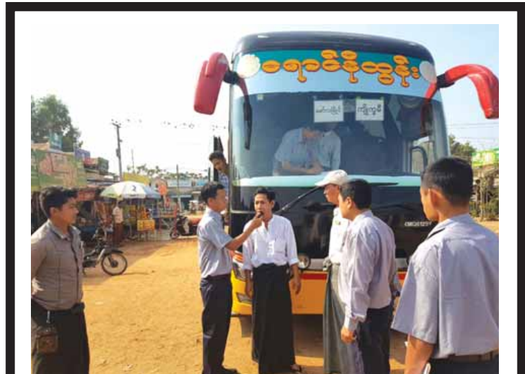
ကညနလုပ်ငန်းလိုင်စင်ဌာန၊ ခရိုင်၊ မြို့နယ်ယာဉ်လုပ်ငန်းများကြီးကြပ်ရေးကော်မတီတို့ ပူးပေါင်းပါဝင်သော စစ်ဆေးရေးအဖွဲ့သည် ဖေဖော်ဝါရီ ၂၈ ရက်က ပဲခူးမြို့ယာဉ်ဝင်းသစ်အတွင်း ယာဉ်များစစ်ဆေးရာတွင် ဦးတက်၊ ယာဉ်မောင်း၊ ယာဉ်နောက်လိုက်လိုင်စင်၊ ခါးပတ်၊ မှန်ခွဲတူ၊ မီးသတ်ဆေးဘူး၊ အရေးပေါ်ထွက်ပေါက်ရုံ - မရှိနှင့် ယာဉ်မောင်း၊ ယာဉ်နောက်လိုက်များ အရက်သေစာသောက်စားမှုရှိ - မရှိတိုင်းသောက်ရိယာများဖြင့် စစ်ဆေးခဲ့ကြောင်း သိရသည်။