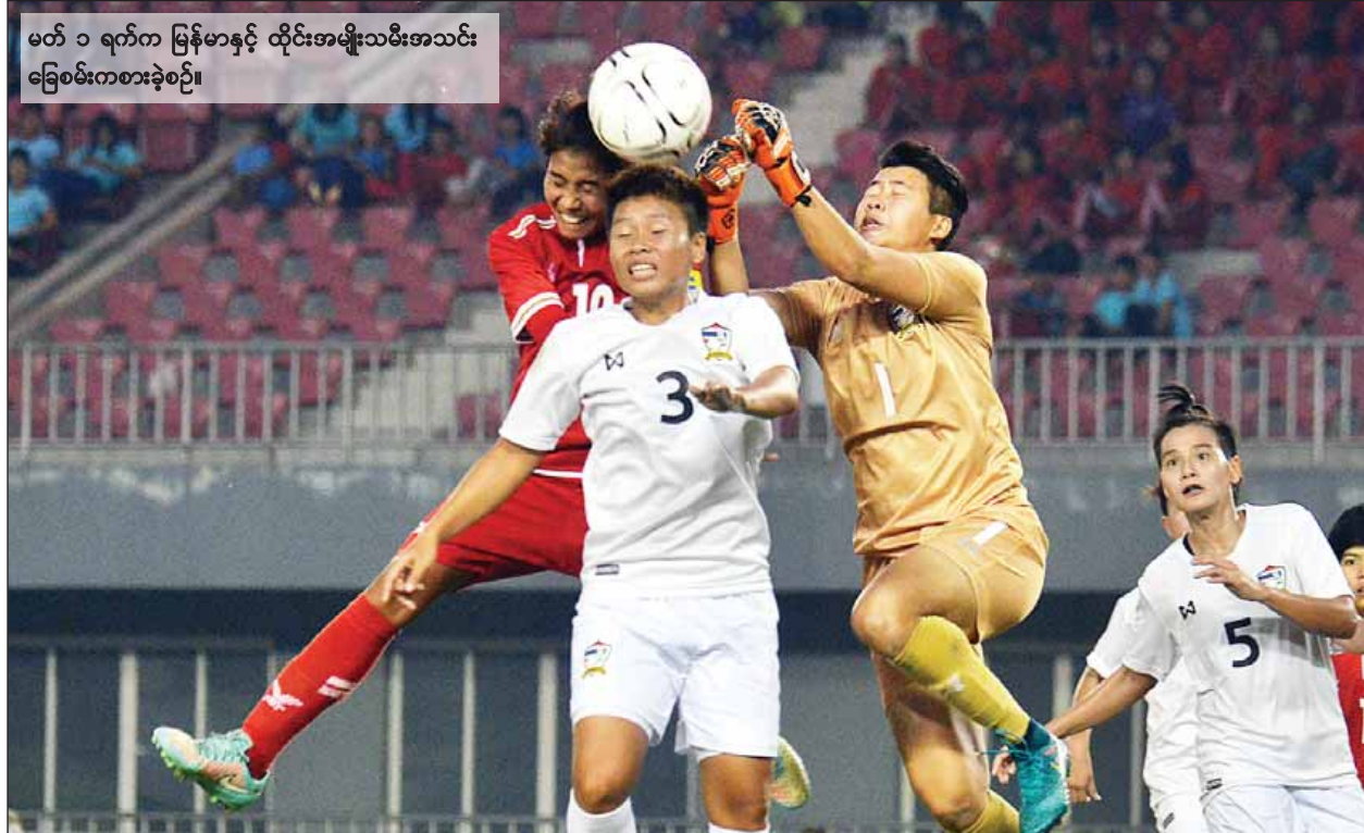
မတ် ၁ ရက်က မြန်မာနှင့် ထိုင်းအမျိုးသမီးအသင်း ခြေစမ်းကစားခဲ့စဉ်။

စစ်ကိုင်းတိုင်းဒေသကြီး ကလေးခရိုင် ကလေးဝမြို့၌ တည်ထားကိုးကွယ်တော်မူသည့် ကလေးဝမြို့နယ်လုံးဆိုင်ရာ သာသနာ့သမိုင်းဝင် ရွှေမုဋ္ဌောစေတီတော်မြတ်ကြီး၏ လုံးတော်ပြည့် ရွှေသင်္ကန်းကပ်လှူခြင်းအောင်ပွဲအထိမ်းအမှတ် မြန်မာ့ရိုးရာလှေလှော်ပြိုင်ပွဲကို မတ် ၁ ရက် နံနက် ၈ နာရီမှ စတင်၍ စည်ကားသိုက်မြိုက်စွာကျင်းပသည်။ စာမျက်နှာ ၈ ကော်လံ ၅ သို့ ❖