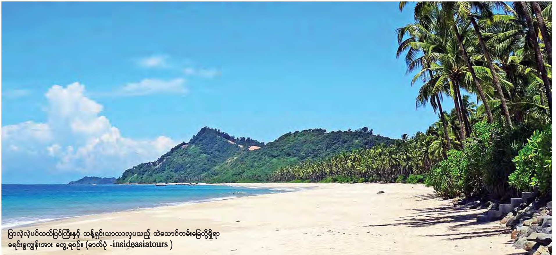
ပြာလုံလုံပင်လယ်ပြင်ကြီးနှင့် သန့်ရှင်းသာယာလှပသည့် သဲသောင်ကမ်းခြေတို့ရှိရာ ခရင်းခွကျွန်းအား တွေ့ရစဉ်။