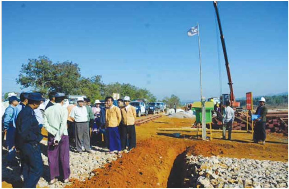
ဆောက်ပြီးစီးမှုအခြေအနေကိုလည်းကောင်း သွားရောက်ကြည့်ရှုစစ်ဆေးပြီး ဖရူဆိုမြို့မှ လောထောတနောကျေးရွာအထိ ကတ္တရာလမ်းဖောက်လုပ်နိုင်ရေး သက်ဆိုင်ရာဌာနနှင့် ပေါင်းစပ်ညှိနှိုင်းဆောင်ရွက်ပေးခဲ့သည်။ ဆက်လက်၍ ဖရူဆိုမြို့နယ် မီးသတ်ဦးစီးဌာန လေးခန်းတွဲ နှစ်ထပ်ဝန်ထမ်းနေအိမ်တည်ဆောက်ရေးလုပ်ငန်း တည်ဆောက်ပြီးစီးမှုအခြေအနေကိုလည်းကောင်း၊ ကျေးလက်ဒေသဖွံ့ဖြိုးတိုးတက်ရေးဦးစီးဌာနမှ ဆောင်ရွက်သော ဖရူဆိုမြို့မှ လောထောတနောကျေးရွာထိ ကတ္တရာလမ်းခင်းခြင်း လုပ်ငန်းပြီးစီးမှုနှင့် လောထောတနောကျေးရွာထိ ဂါလန် ၅၀၀၀ ဆွဲ အုတ်ရေကန် တည်ဆောက်ပြီးစီးမှုအခြေအနေကိုလည်းကောင်း၊ ဖရူဆိုမြို့နယ် စီမံကိန်းဦးစီးဌာန တည်ဆောက်ပြီးစီးမှုအခြေအနေအား သွားရောက်ကြည့်ရှုစစ်ဆေးခဲ့ကြောင်း သိရသည်။ ဖြည့်နယ်(ဖြန့်/ဆက်)

ဖရူဆိုမြို့နယ် ဝန်ထမ်းအိမ်ရာ လေးခန်းတွဲ သုံးထပ်၊ Steel Structure တစ်လုံး ( ၁၀၂ x ၂၉ ဒသမ ၆)ပေ၊ ခွင့်ပြုရန်ပုံငွေကျပ် ၁၂၆ ဒသမ ၈၂၈ သန်းဖြင့် တည်ဆောက်လျက် ရှိသော လုပ်ငန်းခွင်အား သွားရောက်ကြည့်ရှုစစ်ဆေးပြီး တာဝန်ရှိသူများအား စံချိန်စံညွှန်းပြည့်မီရေး၊ သတ်မှတ်ချိန်အတွင်း အချိန်မီပြီးစီးရေး၊ လုပ်ငန်းခွင်အန္တရာယ်ကင်းရှင်းရေး၊ လုပ်ငန်းအား စေတနာထားလုပ်ကိုင်ရေး လမ်းညွှန်မှာကြားပြီး ဝန်ထမ်းအိမ်ရာများ သန့်ရှင်းသော သောက်သုံးရေရရှိရေး သက်ဆိုင်ရာဌာနများနှင့် ပေါင်းစပ်ညှိနှိုင်းဆောင်ရွက်ခဲ့သည်။ ဆက်လက်၍ ဖရူဆိုမြို့နယ်ဆေးရုံအတွင်းရှိ ကုလသမဂ္ဂ စီမံကိန်းများဝန်ဆောင်မှုရုံး၊ ထောင်စုနှစ် ဖွံ့ဖြိုးတိုးတက်ရေးရည်မှန်းချက်သုံးမျိုး၊ ရန်ပုံငွေမှဆောင်ရွက်သည့် မိခင်နှင့်ကလေးကျန်းမာရေးဌာန ဆောက်လုပ်ပြီးစီးမှုလုပ်ငန်းအခြေအနေအား သွားရောက်ကြည့်ရှုစစ်ဆေးပြီး လောထောတနော ကျေးလက်ကျန်းမာရေးဌာနခွဲနှင့် ဝန်ထမ်းအိမ်ရာတည်ဆောက်နေမှုအား သွားရောက်ကြည့်ရှုစစ်ဆေးရာ အရည်အသွေးပြည့်မီရေး၊ လုပ်ငန်းအပေါ် စေတနာထားလုပ်ကိုင်ရေးနှင့် ဒေသခံပြည်သူများအား ကျေးဇူးတားလမ်းဖောက်လုပ်ရေး လမ်းညွှန်မှာကြားခဲ့ပြီး ကျေးရွာနေပြည်သူများ နွေရာသီတွင် အသုံးပြုနိုင်ရန် သောက်သုံးရေအတွက် အလှူငွေကျပ် ၁၅၀၀၀၀ လှူဒါန်းခဲ့သည်။ ယင်းနောက် မိုဆိုကျေးရွာအုပ်စု ထီးဒူးကျေးရွာအနီး လိုက်ဂူအတွင်း ပေ ၁၂၀ အနက်နေရာရှိ ရေထွက်ရိုက်ကို လည်းကောင်း၊ အမက(လောထောတနော) ပေ (၆၀ x ၃၀) သွပ်မိုး အုပ်ညှပ်တစ်ထပ်ကျောင်းဆောင်သစ် တည်