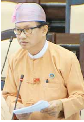
ရန်ကုန်တိုင်းဒေသကြီး မဲဆန္ဒနယ်အမှတ်(၂)မှ ဦးဌေးဦး

ဆက်လက်၍ ဒုတိယဝန်ကြီးက လက်ရှိ အခြေခံပညာအထက်တန်း သင်ရိုးတွင် အခြေခံဥပဒေဘာသာရပ် တစ်ခုအဖြစ် မဟုတ်သော်လည်း နိုင်ငံ သားကောင်းများ မွေးထုတ်နိုင်ရန်