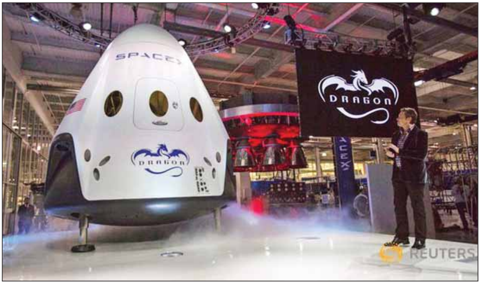
ကို ခရီးနှင့်ရမည်ဖြစ်ကြောင်း၊ ကမ္ဘာ့ဆွဲအားဖြင့် အာကာသ စပေ့အိပ်ကပ် ကမ္ဘာမြေပြင်ပေါ်သို့ လေထီးဖြင့် ဆင်းသက် ယာဉ်ကို ကမ္ဘာလေထုသွားအတွင်းသို့ ပြန်လည်ဝင်ရောက် စေမည်ဖြစ်ကြောင်း မက်စ်က ပြောကြားသည်။ ရိုက်တာ။

ပြောကြားရန် ငြင်းဆိုသည်။ ထို့အပြင် အာကာသခရီးစဉ်ဖြင့် လိုက်ပါနိုင်ရေးအတွက် ပုဂ္ဂိုလ်နှစ်ဦးက ငွေကြေးမည်ရွှေမည်မျှပေးရသည်ကိုလည်း ပြောဆိုခြင်း မရှိပေ။ သို့ရာတွင် အာကာသခရီးသည်နှစ်ဦးမှာ ဟောလိဝုဒ်ရုပ်ရှင်လောကမှ မဟုတ်ဟုဆိုသည်။ ရက်သတ္တတစ်ပတ်ကြာမြင့်မည့် အာကာသခရီးစဉ်ဖြင့် လိုက်ပါနိုင်ရေးအတွက် အာကာသခရီးသည် နှစ်ဦးအနေဖြင့် ငွေကြေးအမြောက်အမြား ပေးရကြောင်း၊ ၎င်းတို့သည် အာကာသခရီးမနှင်မီ လေ့ကျင့်သင်တန်း တက်ရောက်ရမည်ဖြစ်ကြောင်း မက်စ်က ပြောကြားသည်။ တစ်နှစ်လျှင် အာကာသခရီးသည် တစ်ဦးမှ နှစ်ဦးအထိ ရှိမည်ဟု မိမိမျှော်လင့်ကြောင်း၊ စပေ့အိပ်ကပ်ကုမ္ပဏီက အာကာသခရီးစဉ်အတွက် ခရီးသည်များထံမှ တောင်းခံသည့် ငွေကြေးပမာဏသည် ကုမ္ပဏီဝင်ငွေ၏ ၁၀ ရာခိုင်နှုန်းမှ ၂၀ ရာခိုင်နှုန်းအထိ ရှိလိမ့်မည် ဖြစ်ကြောင်း ၎င်းက ပြောကြားသည်။ လအနီးအပါးမှ ဖြတ်သန်းမည့် အာကာသခရီးစဉ်အတွင်း ခရီးတင်ပို့ပေးခြင်း ၃၀၀၀၀၀ မှ ၄၀၀၀၀၀ အထိ