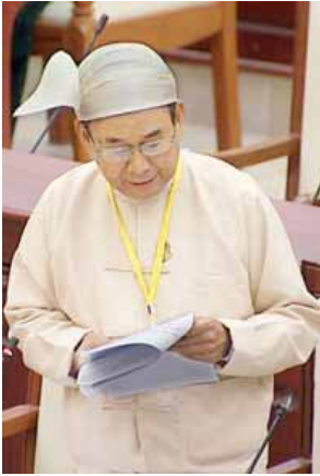
ပြည်ထောင်စုဝန်ကြီး ဦးအုန်းဝင်း

၈ ရက်တွင် ကျင်းပသော ရန်ကုန်တိုင်းဒေသကြီး အစိုးရအဖွဲ့အစည်းအဝေး အမှတ်စဉ် (၁၈/၂၀၁၇) ဆုံးဖြတ်ချက်အပိုင်း (၇)အရ သဘောတူကြောင်း အကြောင်းကြားလာပါသဖြင့် အဆိုပါကိစ္စနှင့်စပ်လျဉ်း၍ ရန်ကုန်မြို့တော်စည်ပင် သာယာရေးကော်မတီမှ သတ်မှတ်ထားသော စည်းကမ်းများနှင့်ညီညွတ်သဖြင့် ခွင့်ပြုပေးခဲ့ပြီးဖြစ်ကြောင်း။