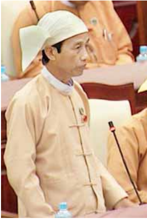
လှိုင်းဘွဲ့မဲဆန္ဒနယ်မှ လွှတ်တော်ကိုယ်စားလှယ် ဦးခင်ချို

ယနေ့အစည်းအဝေးတွင် တောင်ဥက္ကလာပမဲဆန္ဒနယ်မှ လွှတ်တော် ကိုယ်စားလှယ် ဒေါက်တာဦးစောနိုင်၏ တောင်ဥက္ကလာပမြို့နယ်၊ ဥက္ကလာပ စေတီပရိတ်၏ ပေ ၁၀၀ အတွင်း ပေ ၇၀ ထက်မြင့်သော အထပ်မြင့် အဆောက် အအုံဆောက်လုပ်နေခြင်းနှင့်ပတ်သက်၍ သက်ဆိုင်ရာဌာနများအနေဖြင့် မည်သို့စဉ်းစားသည်ကိုသိလိုခြင်း မေးခွန်းနှင့်စပ်လျဉ်း၍ သာသနာရေးနှင့် ယဉ်ကျေးမှုဝန်ကြီးဌာန ပြည်ထောင်စုဝန်ကြီး သူရဦးအောင်က တောင် ဥက္ကလာပစေတီတော်သည် ၁၉၉၀ ခုနှစ်တွင် တည်ဆောက်ခဲ့ပြီး ဉာဏ်တော် ၁၀၈ ပေရှိပါကြောင်း၊ အဆိုပြုမြေကွက်သည် မြေရှင် ဦးဌေးအောင်မှ မူလက မူအားဖြင့် ခွင့်ပြုထားသည့် Basement + ၁၂ ဒသမ ၅ ထပ်တိုက်အစား ၄ ထပ်လျှော့၍ တောင်ဥက္ကလာပစေတီတော်၏ စိန်ဖူးတော်နှင့် ထီးတော်တို့ထက် နိမ့်ချပြီး အမြင့် ၉၈ ပေရှိသော Basement + ၈ ဒသမ ၅ ထပ်တိုက် အဆောက် အအုံဆောက်လုပ်ခွင့်ပြုပေးပါရန် တင်ပြလျှောက်ထားမှုအား ၂၀၁၅ ခုနှစ် ဧပြီ