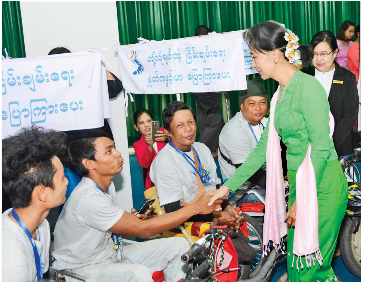
နိုင်ငံတော်၏အတိုင်ပင်ခံပုဂ္ဂိုလ် ဒေါ်အောင်ဆန်းစုကြည် ငြိမ်းချမ်းရေးတွဲလက်များ Wheel Chair ရထားအဖွဲ့မှ အဖွဲ့ဝင်များအား ရင်းရင်းနှီးနှီး နှုတ်ဆက်စဉ်။