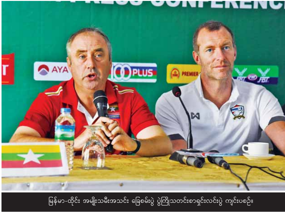
မြန်မာ-ထိုင်း အမျိုးသမီးအသင်း ခြေစမ်းပွဲ ပွဲကြိုသတင်းစာရှင်းလင်းပွဲ ကျင်းပစဉ်။