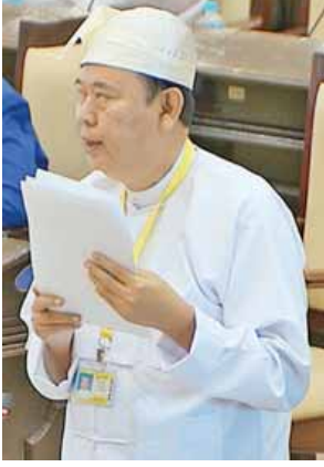
ဒုတိယဝန်ကြီး ဦးဝင်းမော်ထွန်း

အတွက် နိုင်ငံသားများ၏အခွင့်အရေး များ၊ ရပိုင်ခွင့်များ၊ လိုက်နာဆောင်ရွက် ရမည့် တာဝန်များ၊ ဒီမိုကရေစီအခြေခံ