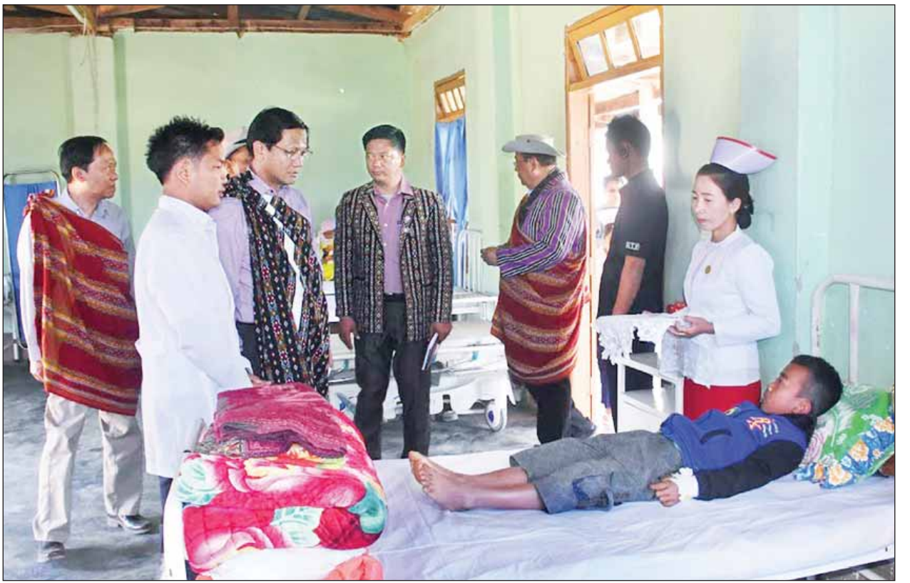
ဒုတိယသမ္မတ ဦးဟင်နရီဗန်ထီးယူ ရေဇာမြို့ (၁၆)ခုတင်ဆုံ ဆေးရုံတွင် တက်ရောက်ဆေးကုသမှုခံယူနေသော လူနာများကို ကြည့်ရှုအားပေးစဉ်။ (သတင်းစဉ်)

ဆက်လက်၍ မတူပီမြို့အတွက် နယ်စပ်ရေးရာဝန်ကြီးဌာနမှ ထောက်ပံ့