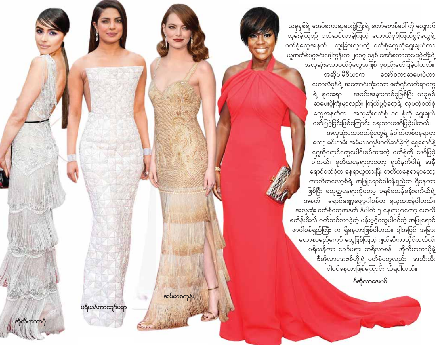
ဗိုလီဗာကာပို