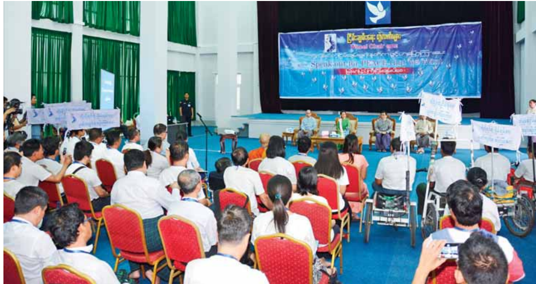
နိုင်ငံတော်၏အတိုင်ပင်ခံပုဂ္ဂိုလ် ဒေါ်အောင်ဆန်းစုကြည်နှင့် ငြိမ်းချမ်းရေးတွဲလက်များ Wheel Chair ရထားအဖွဲ့တို့ တွေ့ဆုံခြင်းအခမ်းအနား ကျင်းပစဉ်။ (သတင်းစဉ်)

လွတ်လပ်ရေးမရခင်က လွတ်လပ်ရေးအတွက် လှုပ်ရှားရုန်းကန်နေသည့် ခေါင်းဆောင်များ ပြောသည့်စကားရှိပါကြောင်း၊ မိမိတို့၏ ကံကြမ္မာကို မိမိတို့ ဖန်တီးနိုင်ခွင့်ရစေချင်ပါကြောင်း၊ လွတ်လပ်ရေးလိုချင်သည်မှာ ကိုယ့်ကံကြမ္မာကို ကိုယ်ဖန်တီးပိုင်ခွင့်တောင်းဆိုခြင်းဟု ပြောပါကြောင်း၊ ကိုယ့်ကံကြမ္မာ ကိုယ်ဖန်တီးပိုင်ခွင့်ရသည့်အခါ ဒီအခွင့်အရေးကို မှန်မှန်ကန်ကန်သုံးရန်အရေးကြီးပါကြောင်း။