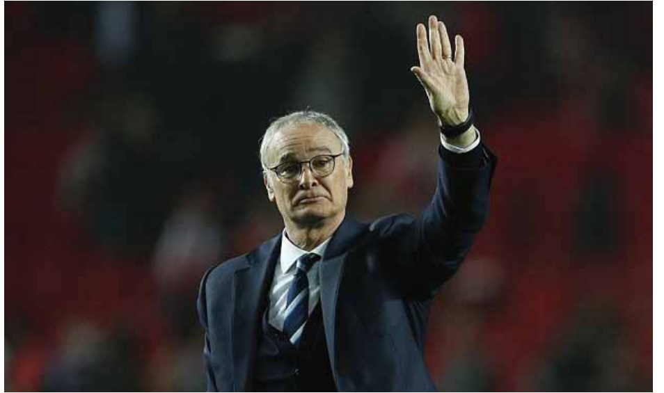
သက်တမ်းရှိ စာချုပ်သစ်တစ်ရပ်ကိုလည်း ချုပ်ဆိုထားခဲ့ကြောင့် လက်စတာစီးတီးအသင်းက ထုတ်ပယ်ခဲ့ခြင်းဖြစ်သည်။ သို့ရာတွင် လက်ရှိတွင် ရလဒ်ပိုင်းဆိုးရွားခဲ့ခြင်းကြောင့်လည်း သိရသည်။ (ဇွေကြယ်)

နည်းပြကလော်ဒီယိုရာနီအား ၂၀၁၅ ခုနှစ် ဇူလိုင်လတွင် ခေါ်ယူခဲ့ပြီး ပရီမီယာလိဂ်ဖလားရယူပေးခဲ့ခြင်းကြောင့် ၂၀၁၆ ခုနှစ် ဩဂုတ်လအတွင်းက လေးနှစ်