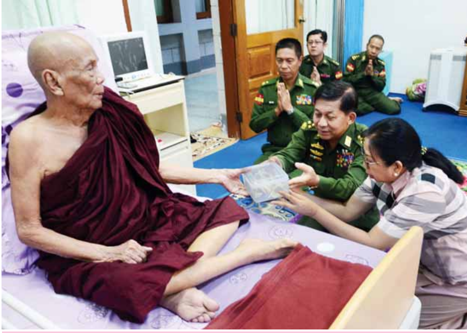
တပ်မတော်ကာကွယ်ရေးဦးစီးချုပ် ပိုလ်ချုပ်မှူးကြီး မင်းအောင်လှိုင်နှင့် ဇနီး ဒေါ်ကြူကြူလှတို့ ဓမ္မရက္ခိတ ဝန်းသိုကျောင်းတိုက် ဆရာတော်အား အာဟာရများ ဆက်ကပ်လျှော့ဒါနစဉ်။(သတင်းစဉ်)

နေပြည်တော် ဖေဖော်ဝါရီ ၂၄ တပ်မတော်ကာကွယ်ရေးဦးစီးချုပ် ပိုလ်ချုပ်မှူးကြီး မင်းအောင်လှိုင်နှင့် ဇနီး ဒေါ်ကြူကြူလှတို့သည် ယနေ့ ညနေပိုင်းတွင် နေပြည်တော်ရှိ တပ်မတော်ဆေးရုံကြီး မျက်စိခွဲစိတ် ကုသဆောင်၌ မြစ်ကြီးနားမြို့ ဓမ္မရက္ခိတ ဝန်းသိုကျောင်းတိုက် ဆရာတော် အဘိဓဇမဟာရဋ္ဌဂုရု အဘိဓဇအဂ္ဂမဟာသဒ္ဓမ္မဇောတိက တက္ကသိုလ်လတ်သဘာ သွားရောက် ဖူးမြော်ကြည်ညိုပြီး ဆရာတော်ကြီး၏ မျက်စိခွဲစိတ်ကုသမှုအခြေအနေနှင့် ကချင်ပြည်နယ် ဝိုင်းမော်မြို့နယ် မိုင်းနားကျေးရွာ ရွှေမိုးတောင်၌ ရဟန္တာ(၁၀၀၀) ရှင်ပင်မြတ်စွာ အောင်သုခစေတီတော်ကြီး တည်ထား ကိုးကွယ်မည့် အခြေအနေကို လျှောက်ထားမေးမြန်းကာ အာဟာရ များ ဆက်ကပ်လျှော့ဒါနကြောင်း သတင်းရရှိသည်။ (သတင်းစဉ်)