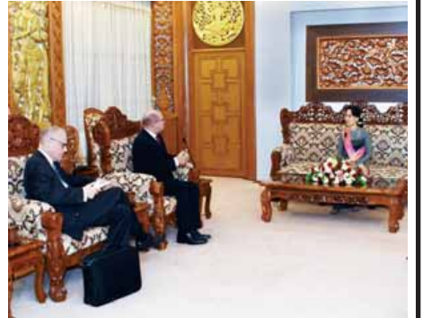
သတင်း စာမျက်နှာ - ၃

နိုင်ငံတော်၏အတိုင်ပင်ခံပုဂ္ဂိုလ် ရုရှားနှင့်ဆွံ့ဒင် ညွှန်ကြားမှုအဖွဲ့အဖွဲ့များအား သီးခြားစီလက်ခံတွေ့ဆုံ