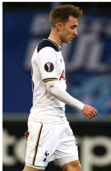
ကွင်းတွင် ကစားခဲ့သည့်ပွဲစဉ်တွင် နှစ်ဂိုးစီ သရေရလဒ် ထွက်ပေါ်ခဲ့ပြီး စပါးအသင်းက