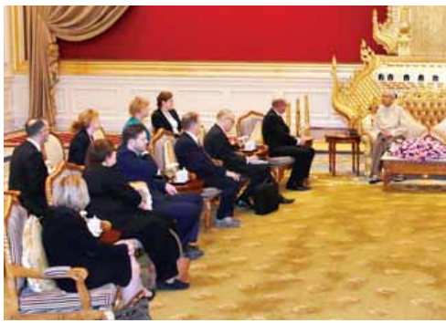
သတင်း စာမျက်နှာ - ၃

နိုင်ငံတော်သမ္မတ ဦးထင်ကျော် ဆွံ့ဒင်နိုင်ငံလွှတ်တော်ဥက္ကဋ္ဌနှင့် အဖွဲ့အား လက်ခံတွေ့ဆုံ