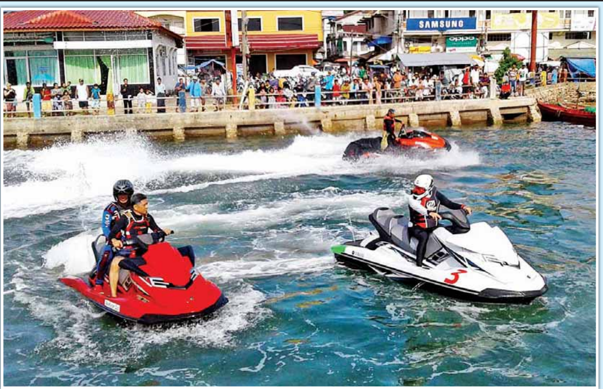
GrandAndaman Travel & Tour Co., Ltd. ၏ အစီအစဉ်ဖြင့် မြန်မာ(ကော့သောင်း)-ထိုင်း(ရနောင်း) နှစ်နိုင်ငံ နယ်စပ်ခရီးသွားလုပ်ငန်း မြှင့်တင်မှု Jetski (Water Scooter) စီးနင်းသရုပ်ပြပွဲကို ဖေဖော်ဝါရီ ၂၄ ရက်က ကော့သောင်းမြို့ မြို့မဗဟိုတန်းရှေ့တွင် ကျင်းပစဉ်။ [ထိုင်းနိုင်ငံ YAMAHA ကုမ္ပဏီ ၏ Water Scooter ၂၂ စင်းဖြင့် စီးနင်းသရုပ်ပြသည့် ၄၀ ခန့်က ကော့သောင်းခရိုင် အက်ဒမန်ပင်လယ်ပြင်အတွင်းရှိ သာယာလှပသည့် ကျွန်းပတ်ဝန်းကျင်များအား တစ်နေ့တာ စီးနင်းသရုပ်ပြသကြသည်။] ကျော်စိုး(ကော့သောင်း)

အဆိုပါ အခမ်းအနားတွင် စက်မှုဝန်ကြီးဌာန စက်မှုကြီးကြပ်ရေးနှင့် စစ်ဆေးရေးဦးစီးဌာန စာမျက်နှာ ၁၁ ကော်လံ ၁ သို့