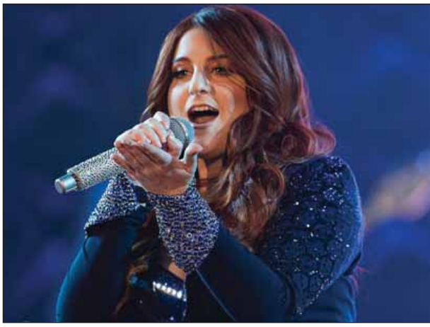
မှာ အသက် (၂၃)နှစ် ရှိပြီဖြစ်တဲ့ မက်ဂ်ဟန်ထရီနာက သူ့ရဲ့ တစ်ကိုယ်တော် တေးသီချင်းနဲ့ ပတ်သက်ပြီး ထုတ်ဖော်ပြောကြား လာခဲ့တာဖြစ်ပါတယ်။ "Smurfs: The Lost Village" ရဲ့ အဓိကဇာတ်ဝင်တေးတစ်ပုဒ်ဖြစ်တဲ့ မက်ဂ်ဟန်ထရီနာရဲ့ တေးသီချင်း

"All About That Bass" တေးသီချင်း နဲ့ ကျော်ကြားတဲ့ ပေါ့ပ်ကြယ်ပွင့် မက်ဂ်ဟန်ထရီနာရဲ့ တေးသီချင်း သစ်တစ်ပုဒ်ကို ဒစ်စနေရဲ့ အောင်မြင် တဲ့ ရုပ်သံဖန်တီးမှုရုပ်ရှင်တစ်ခုဖြစ် တဲ့ "Smurfs: The Lost Village" ရုပ်ရှင်ရဲ့ ဇာတ်ဝင်တေးသီချင်းတစ်ပုဒ် အဖြစ် မြင်တွေ့ရတော့မှာဖြစ်ကြောင်း အေဘီဗီဒီဘစ်ဒီဒေါ့ကွန်းရဲ့ ဖော်ပြချက် တွေအရ သိရပါတယ်။