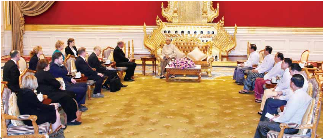
နိုင်ငံတော်သမ္မတ ဦးထင်ကျော် ဆွီဒင်နိုင်ငံ Riksdag လွှတ်တော်ဥက္ကဋ္ဌ H.E. Mr. Urban Ahlin ဦးဆောင်သော ကိုယ်စားလှယ်အဖွဲ့အား လက်ခံတွေ့ဆုံစဉ်။ (သတင်းစဉ်)

တွေ့ဆုံပွဲသို့ ပြည်သူ့လွှတ်တော် ဒုတိယဥက္ကဋ္ဌ ဦးတီခွန်မြတ်၊ အမျိုးသား လွှတ်တော် ဒုတိယဥက္ကဋ္ဌ ဦးအေးသာအောင်၊ တိုင်းရင်းသားလူမျိုးများရေးရာ ဝန်ကြီးဌာန ပြည်ထောင်စုဝန်ကြီး နိုင်သက်လွင်၊ စီမံကိန်းနှင့်တက္ကသိုလ်ရေး ဝန်ကြီးဌာန ဒုတိယဝန်ကြီး ဦးမောင်မောင်ဝင်းနှင့် တာဝန်ရှိသူများ တက်ရောက် ကြသည်။ (သတင်းစဉ်)