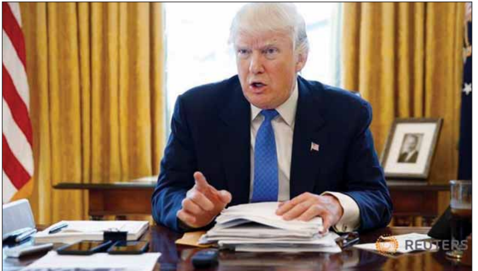
လုံခြုံရေးအသုံးစရိတ်များအား မျှထည့်ဝင်ကြခြင်းဖြင့် သက်သာစေမည်ဖြစ်ကြောင်း ၎င်းက ပြောကြားသည်။ အမေရိကန်၏ ဘတ်ဂျက်အပေါ် ဝန်ထုပ်ဝန်ပိုး ဖြစ်စေမှုကို ရိုက်တာ။

မြောက်အတ္တလန္တိတ်စာချုပ်အဖွဲ့(နေတိုး) မဟာမိတ် နိုင်ငံများအနေဖြင့် ၎င်းတို့၏ ကာကွယ်ရေးအတွက် ရန်ပုံငွေ ပိုမိုထည့်ဝင်ကြရေးကို မိမိတိုက်တွန်းခဲ့ပြီး