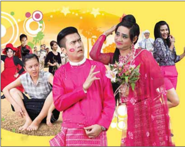
ကို ဘဝမှန်ကိုရောက်စေချင်တာကြောင့် ဘယ်လိုကြိုးပမ်းကြမလဲ။ မြို့ကြီးမှာနေတဲ့ ဦးအောင်ဗလရဲ့ မြေးနှစ်ယောက်နဲ့ ဦးတုတ်ကြီးတို့မိသားစု ချိတ်ဆက်မိပြီး

“ရယ်သောသူ အသက်ရှည်၏” ဆိုစကားအတိုင်း ပင်ပန်းသမျှ ဘဝအမော တွေကို ရယ်မောခြင်းဖြင့် တစ်ခဏတာ အပန်းပြေစေဖို့ ဒီတစ်ပတ်မှာ ရုံတင်မယ့် မြန်မာအချစ်ဟာသ ဇာတ်ကားသစ်တစ်ကားနဲ့ မိတ်ဆက်ပေးချင်ပါတယ်။ မာန်ထက်ချီရုပ်ရှင်နှင့် ဗီဒီယိုထုတ်လုပ်ဖြန့်ချိရေးက ထုတ်လုပ်ပြီး ဒါရိုက်တာပြည်တိုင်းသီဟရဲ့လက်ရာ ဟာသဇာတ်ကားသစ်ဖြစ်တဲ့ “ကြီးကြီးကျယ်ကျယ်” ဆိုတဲ့ မြန်မာဟာသဇာတ်ကားလေးပါ။ မြန်မာတို့ရဲ့ချစ်စရာ တောခလေးလေးတွေကိုလည်း ဖော်ကျူးထားပြီး ယောက်ျားနဲ့ မိန်းမ သဘာဝချင်း ကွဲလွဲနေတဲ့ မောင်နှမနှစ်ယောက်ကြားက အလွဲလေးတွေကို ဟာသစွဲပြီး ခြယ်မှုန်းရိုက်ကူးထားတဲ့ ဇာတ်ကားလေးဖြစ်ပါတယ်။