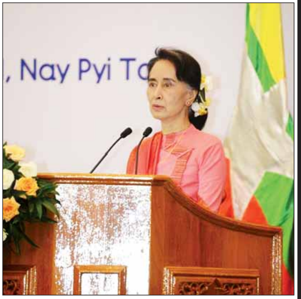
ပညာရေးဖွံ့ဖြိုးမှုမိတ်ဖက်အဖွဲ့အစည်းများ၊ လွှတ်တော်ကိုယ်စားလှယ်များ၊ ပညာရေးနှင့်ပတ်သက်သောစံသစ်များအားလုံး၏ အကြံပြုချက်များအပေါ်တွင် အခြေခံပြီးရေးဆွဲထားခြင်းဖြစ်ပါသည်။

အမျိုးသားပညာရေးမဟာဗျူဟာစီမံကိန်း(၂၀၁၆- ၂၀၂၁)ကို သက်ဆိုင်ရာပညာရေးကဏ္ဍအလိုက် ပြည်တွင်းပြည်ပပညာရှင်များ၊ ဆရာဆရာမများ၊ မိဘများ၊ ရပ်ရွာပြည်သူလူထုများ၊ တိုင်းရင်းသားမျိုးနွယ်စုများ၊ ရပ်ရွာအခြေပြုအဖွဲ့အစည်းများ၊ ပြည်တွင်းပြည်ပမှ အစိုးရမဟုတ်သောအဖွဲ့အစည်းများ