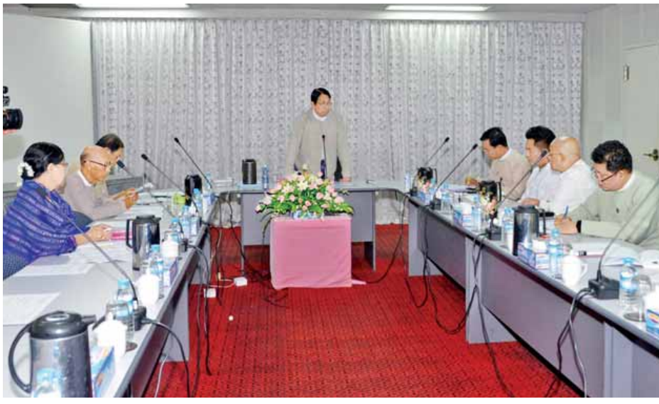
ပြန်ကြားရေးဝန်ကြီးဌာန အစည်းအဝေးခန်းမ၌ ကျင်းပသည့် မြန်မာ့ဒီမိုကရေစီရပ်ရှင် ကျန်ဇာတ်လမ်းများကို ရုပ်မြင်သံကြားဇာတ်လမ်းတွဲများ ရိုက်ကူးရေး ညှိနှိုင်းဆွေးနွေးခဲ့ကြောင်း သိရသည်။ (သတင်းစဉ်)

ဆက်လက်ရိုက်ကူးသွားရန် တက်ရောက်လာကြသူများက ပိုင်းဝန်းဆွေးနွေးကြစေလိုပါကြောင်း ပြောကြားသည်။ ယင်းနောက် တက်ရောက်လာကြသော စာပေပညာ ရှင်ကြီးများ၊ ပြန်ကြားရေးဝန်ကြီးဌာနနှင့် မြန်မာနိုင်ငံ ရုပ်ရှင်အစည်းအရုံးတို့မှ တာဝန်ရှိသူများက ဇာတ်လမ်း၊ ဇာတ်ညွှန်း၊ ဒါရိုက်တာ၊ သရုပ်ဆောင်များ ရွေးချယ်ရေး၊ ရုပ်ရှင်ကားကြီးများနှင့် ရုပ်မြင်သံကြားဇာတ်လမ်းတွဲများ ရိုက်ကူးရေးတို့ကို ဆွေးနွေးညှိနှိုင်းကြရာ ပြည်ထောင်စု ဝန်ကြီးက ပေါင်းစပ်ညှိနှိုင်းဆွေးနွေးသည်။ ယခုအစည်းအဝေးတွင် မြန်မာ့ဒီမိုကရေစီရပ်ရှင် ရက်သတ္တပတ်ပွဲတော်အတွက် ပေးပို့လာသော ဇာတ်လမ်း ၄၅ ပုဒ်အနက် ဆန်ခါတင် ၁၁ ပုဒ်ရွေးချယ်ထားပြီးဖြစ်