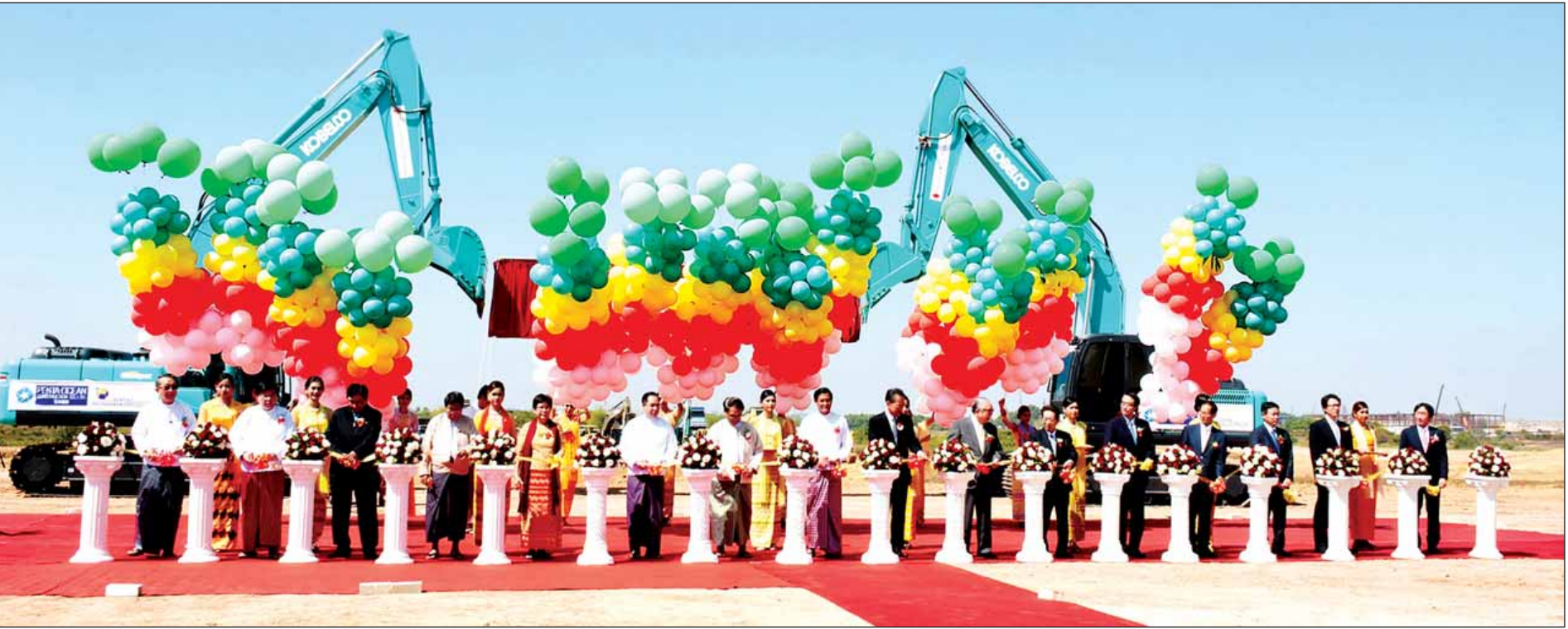
သီလဝါအထူးစီးပွားရေးဇုန် အပိုင်း(ခ)စီမံကိန်းတည်ဆောက်မှု စတင်ခြင်းအခမ်းအနားကို မြန်မာအထူးစီးပွားရေးဇုန်ဆိုင်ရာ ဗဟိုအဖွဲ့ဥက္ကဋ္ဌ ဒုတိယသမ္မတ ဦးဟင်နရီဗန်ထီးယူနှင့် တာဝန်ရှိသူများက ဖဲကြိုးဖြတ်ဖွင့်လှစ်ပေးကြစဉ်။ (သတင်းစဉ်)

ရန်ကုန် ဖေဖော်ဝါရီ ၂၄ ရန်ကုန်မြို့နှင့် ကီလိုမီတာ ၂၀ အကွာအဝေးတွင်တည်ရှိသည့် သီလဝါအထူးစီးပွားရေးဇုန် အပိုင်း(ခ)စီမံကိန်းတည်ဆောက်မှု စတင်ခြင်းအခမ်းအနားကို ယနေ့ နံနက် ၉ နာရီတွင် ရန်ကုန်တောင်ပိုင်းခရိုင် သီလဝါအထူးစီးပွားရေး ဇုန်ဌာနဌာနမှ မြန်မာအထူးစီးပွားရေးဇုန်ဆိုင်ရာ ဗဟိုအဖွဲ့ဥက္ကဋ္ဌ ဒုတိယသမ္မတ ဦးဟင်နရီဗန်ထီးယူ တက်ရောက်ဖွင့်လှစ်ပေးသည်။ စာမျက်နှာ ၉ ကော်လံ ၁ သို့ □