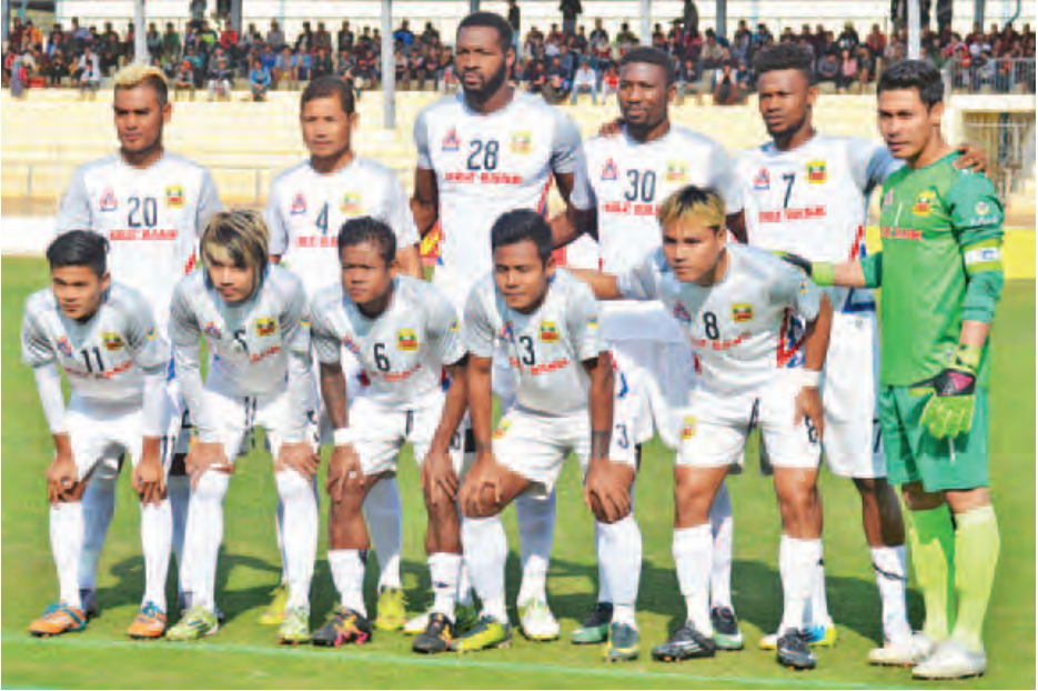
ဒုတိယနေရာတွင် ရပ်တည်နေသည့် ရှမ်းယူနိုက်တက်အသင်း။

ရန်ကုန် ဖေဖော်ဝါရီ ၂၃ ရန်ကုန်၏နေ့ဦးက အပူရှိန်ပြင်းထန်လာမှုနှင့် ရောဂါကာကွယ်ရေးလုပ်ငန်းများ ဆောင်ရွက်နေမှုများ၊ ရှေ့ဆက်လက်ဆောင်ရွက်သွားမည့် အစီအစဉ်များနှင့် စပ်လျဉ်း၍ ရန်ကုန်တိုင်းဒေသကြီး ပြည်သူ့ကျန်းမာရေး ဦးစီးဌာနမှူး ဒေါက်တာဝင်းလွင်နှင့် မြန်မာ့သတင်းစဉ်က သွားရောက်တွေ့ဆုံမေးမြန်းခဲ့ပါသည်။ စာမျက်နှာ ၈ ကော်လံ ၁ သို့