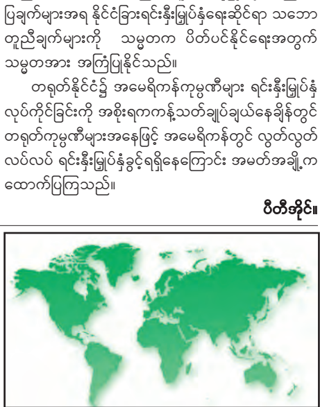
ပီတီအိုင်။

တရုတ်အာဏာပိုင်များက ဖေဖော်ဝါရီ ၁၉ ရက်တွင် မြောက်ကိုရီးယား၏ ကျောက်မီးသွေးတင်ပို့မှုကို ပယ်ဖျက် သည့် ကြေညာချက်တစ်ရပ် ထုတ်ပြန်ခဲ့သည်။ တရုတ်နိုင်ငံ အနေဖြင့် လုံခြုံရေးကောင်စီ ဆုံးဖြတ်ချက်များကို တဖြည်းဖြည်း အကောင်အထည်ဖော်ဆောင်လျက် ရှိသည်ဟု တရုတ်အာဏာပိုင်များကဆိုသည်။ တရုတ်နိုင်ငံ၏ ကျောက်မီးသွေးတင်ပို့မှုမဟာဏ တစ်ဝက်နီးပါးကို မြောက်ကိုရီးယားနိုင်ငံက တင်သွင်း ကြောင်း သိရသည်။ တရုတ်နိုင်ငံက ပြုယမ်း၏ ကုန်စည်တင်သွင်းမှုများကို ပိတ်ပင်ခဲ့ခြင်းသည် နိုင်ငံခြားငွေရရှိရန် ကုန်သွယ်မှုအပေါ် အားထားနေရသည့် မြောက်ကိုရီးယား အစိုးရအတွက် ဘေးကျပ်နံ့ကျပ် ဖြစ်နိုင်ဖွယ်ရှိကြောင်း သိရသည်။ အင်န်အိတ်ချီကေ။