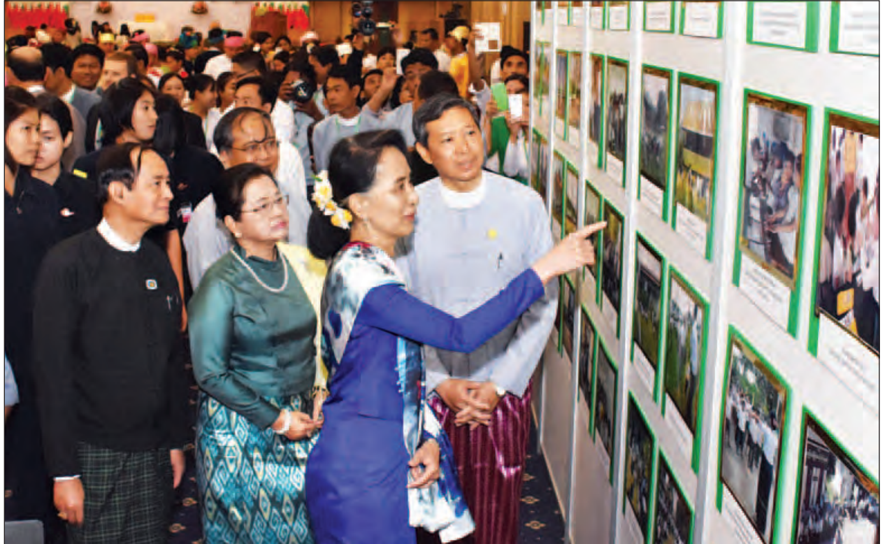
နိုင်ငံတော်၏အတိုင်ပင်ခံပုဂ္ဂိုလ် ဒေါ်အောင်ဆန်းစုကြည်နှင့် တက်ရောက်လာကြသူများ အမျိုးသားပညာရေးမဟာဗျူဟာစီမံကိန်းဆောင်ရွက်မှု မှတ်တမ်းဓာတ်ပုံများကို ကြည့်ရှုအားပေးကြစဉ်။ (သတင်းစဉ်)

သိစရာရှိသည့်ကိစ္စများကို သိအောင်လုပ်နိုင်သော အရည်အချင်းရှိသည်ဆိုသည့် ယုံကြည်မှုလည်းရှိအောင် လုပ်ရန်လိုပါကြောင်း၊ ကလေးသူငယ်များသည် သိစရာအများကြီးရှိသေးသည်ဆိုသော စိတ်ဓာတ်ရှိပါကြောင်း၊ သို့သော် ထိုကလေးများ၏ သိချင်၊တတ်ချင်သည့်စိတ်ဓာတ်ကို လူကြီးများက အားမပေးလျှင်၊ သင်ပေးသူ ဆရာ ဆရာမများက အားမပေးလျှင် သင်ယူချင်သည့် စိတ်ဓာတ်သည် ဖွံ့ဖြိုးနိုင်မည် မဟုတ်ပါကြောင်း၊ လူကြီးများ၏ အဓိက ပြဿနာမှာ သင်ယူချင်စိတ် မရှိတော့ခြင်းပင် ဖြစ်ပါကြောင်း၊ ပြည်ပသွားပြီဟု ထင်ခြင်းဖြစ်ပါကြောင်း၊ မိမိတို့အနေဖြင့် ဘယ်တော့မှ ပညာပြည့်စုံသည်ဟု မရှိနိုင်ပါကြောင်း၊ တစ်သက်တာ အသက်ရှင်နေသရွေ့ ပညာဆက်လက်ရှာဖွေရမည်ဆိုသည့် စိတ်ဓာတ်မွေးမြူရန်လိုပါကြောင်း၊ မိမိတို့အားလုံး ပညာသင်ယူရမည်၊ ဆက်ပြီး သင်ယူရမည်၊ ပညာသင်ချင်သည်၊ ဘယ်လိုသင်ယူရမည် ဆိုသည့် အချက်များကို သေချာနားလည်မည်ဆိုလျှင် နိုင်ငံ၏ အမျိုးသား ပညာရေး မဟာဗျူဟာစီမံကိန်းသည် ကျောင်းသားများ၊ လူငယ်များနှင့် အရွယ်ရောက်သူများ၏ ဘဝတစ်သက်တာ ပညာသင်ယူမှု၊ ပညာသင်ယူ သွားရန်မှာ ခက်ခဲတော့မည် မဟုတ်ပါကြောင်း၊ နိုင်ငံတော်က ဦးဆောင်ပြီး လုပ်ရမည်မှာ မှန်ပါကြောင်း၊ နိုင်ငံတော်က ဦးဆောင်ပြီးလုပ်သည့်အခါ စိတ်