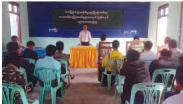
တောင်သူများအားဂုဏ်ပြုခြင်းနှင့်ပညာပေးဟောပြောပွဲကျင်းပ