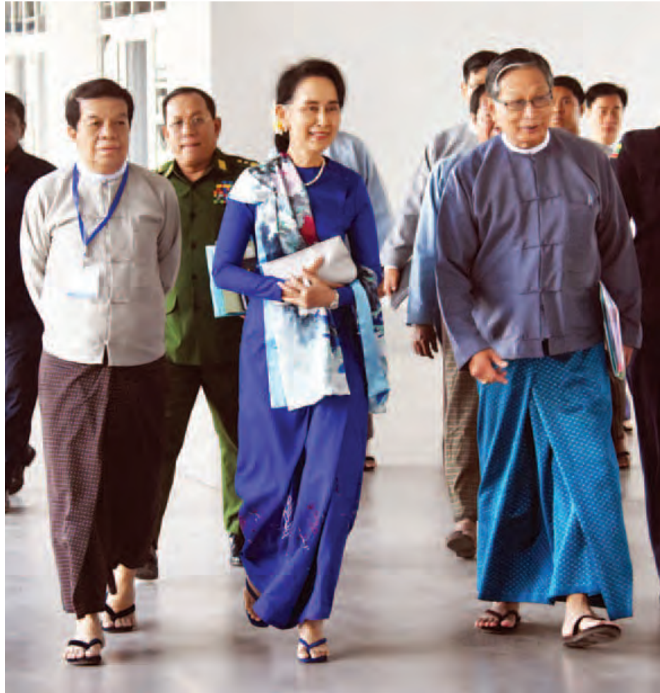
နိုင်ငံတော်၏အတိုင်ပင်ခံပုဂ္ဂိုလ် ဒေါ်အောင်ဆန်းစုကြည်၊ ပြည်ထောင်စုဝန်ကြီး ဦးကျော်တင်ဆွေ၊ ငြိမ်းချမ်းရေး ကော်မရှင်ဥက္ကဋ္ဌ ဒေါက်တာတင်မျိုးဝင်းတို့ ငြိမ်းချမ်းရေးလုပ်ငန်းစဉ်များရန်ပုံငွေဆိုင်ရာ ပေါင်းစပ်ညှိနှိုင်းရေးအဖွဲ့ အစည်းအဝေးသို့ တက်ရောက်လာကြစဉ်။ (သတင်းစဉ်)