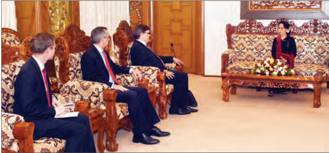
နေပြည်တော် ဖေဖော်ဝါရီ ၂၃

နိုင်ငံတော်၏အတိုင်ပင်ခံပုဂ္ဂိုလ်နှင့် နိုင်ငံခြားရေးဝန်ကြီးဌာန ပြည်ထောင်စုဝန်ကြီး ဒေါ်အောင်ဆန်းစုကြည်သည် ယနေ့မနက်လွှဲပိုင်းတွင် မြန်မာနိုင်ငံဆိုင်ရာ ဒိန်းမတ်သံအမတ်ကြီး၊ အမေရိကန်သံအမတ်ကြီးနှင့် ပြိတ်နံသံရုံး ဒုတိယအကြီး