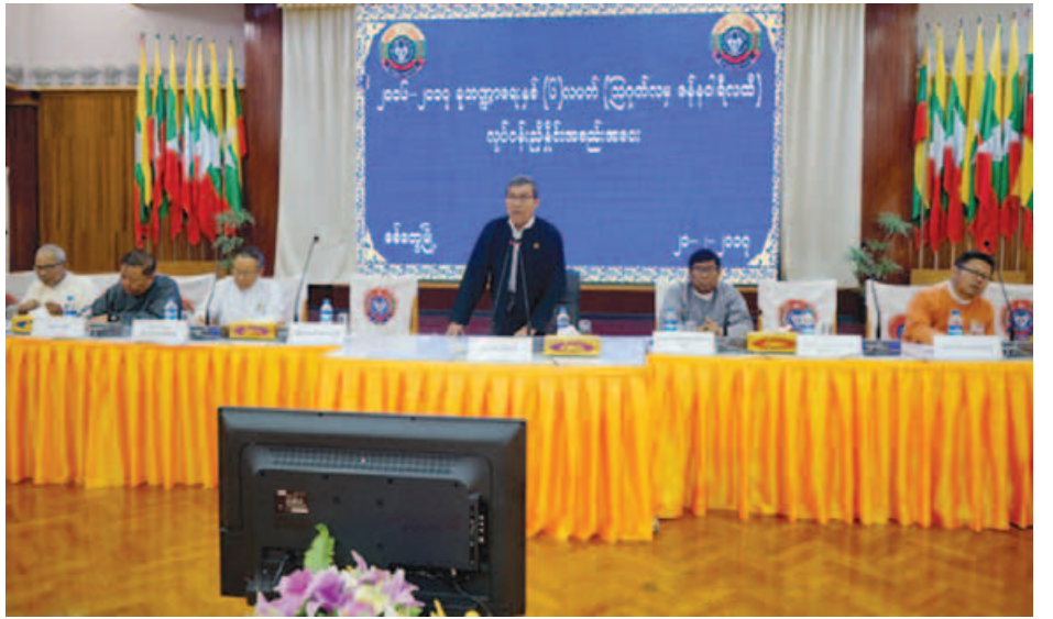
ဝန်ကြီးချုပ်နှင့် ပြည်နယ်ဝန်ကြီးများ၊ ပြည်နယ်ဥပဒေချုပ်၊ ခရိုင်အုပ်ချုပ်ရေးမှူးများနှင့် မြို့နယ်အုပ်ချုပ်ရေးမှူးများ ပြည်နယ်စာရင်းစစ်ချုပ်၊ ပြည်နယ်အဆင့်ဌာနဆိုင်ရာများ၊ တက်ရောက်ခဲ့ကြောင်းသိရသည်။ တင်ထွန်း(ပြန်/ဆက်)

အဆိုပါ လုပ်ငန်းညှိနှိုင်းအစည်းအဝေးသို့ ပြည်နယ်