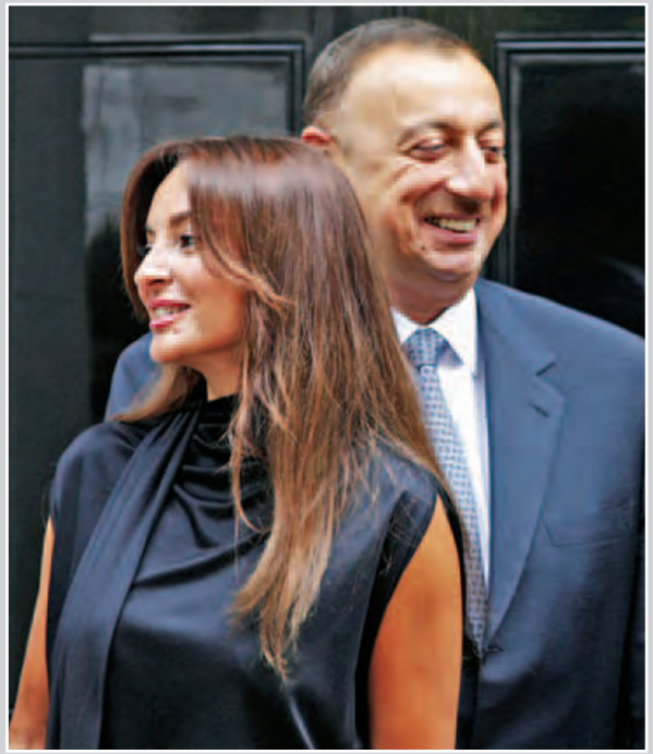
အဇာဘိုင်ဂျန်သမ္မတက ၎င်း၏ ဇနီးကို ဒုတိယသမ္မတအဖြစ် ခန့်အပ် ဘကူ ဖေဖော်ဝါရီ ၂၀ အဇာဘိုင်ဂျန်သမ္မတ အီလ်ဟမ် အလီယက်ဗင်က ၎င်း၏ဇနီးဖြစ်သူ မီဟရီဘန် အလီယက်ဗင်ကို နိုင်ငံ၏ ဒုတိယသမ္မတ (၁)အဖြစ်ခန့်အပ်သည့် အမိန့်ကို ဖေဖော်ဝါရီ ၂၀ ရက်တွင် လက်မှတ်ရေးထိုးလိုက်ကြောင်း သမ္မတရုံး ဝက်ဘ်ဆိုက်တွင် ဖော်ပြသည်။ အဆိုပါ ဒုတိယသမ္မတ(၁)ရာထူးနှင့် ဒုတိယသမ္မတရာထူးများကို လွန်ခဲ့သည့် စက်တင်ဘာလတွင် ပြုလုပ်ခဲ့သည့် ဖွဲ့စည်းပုံအခြေခံဥပဒေ ပြည်လုံးကျွတ်ဆန္ဒခံယူပွဲဖြင့် ဖန်တီးခဲ့ခြင်းဖြစ်သည်။ ယင်းဆန္ဒခံယူပွဲတွင် သမ္မတသက်တမ်းကိုလည်း ငါးနှစ်မှ ခုနစ်နှစ်သို့ တိုးမြှင့်လိုက်သည်။ ပြင်ဆင်ဖြည့်စွက်ထားသည့် ဖွဲ့စည်းပုံအခြေခံဥပဒေတွင် ဒုတိယသမ္မတ ရာထူးများကို သမ္မတက ခန့်အပ်ပိုင်ခွင့်နှင့် ဖြုတ်ချပိုင်ခွင့်ရှိမည်ဖြစ်သည်။ အသက်(၅၂)နှစ်ရှိ မီဟရီဘန် အလီယက်ဗင်သည် အဇာဘိုင်ဂျန်တွင် ရိုးရာစာပေနှင့် ဂီတအမွေအနှစ်များကို ထိန်းသိမ်းစောင့်ရှောက်ရန်နှင့် ဖွံ့ဖြိုးတိုးတက်ရေးဆောင်ရွက်ခဲ့သည့် စွမ်းဆောင်မှုများကြောင့် ၂၀၀၄ ခုနှစ် ယူနက်စကို သံတမန်အဖြစ် ခန့်အပ်ခံခဲ့ရသည်။ မီဟရီဘန် အလီယက်ဗင်သည် လွှတ်တော်အမတ်တစ်ဦးဖြစ်သကဲ့သို့ အဇာဘိုင်ဂျန်နိုင်ငံ၏ ကျွမ်းဘားအားကစားအဖွဲ့ချုပ်ဥက္ကဋ္ဌလည်းဖြစ်သည်။ (ဆင်ဟွာ)