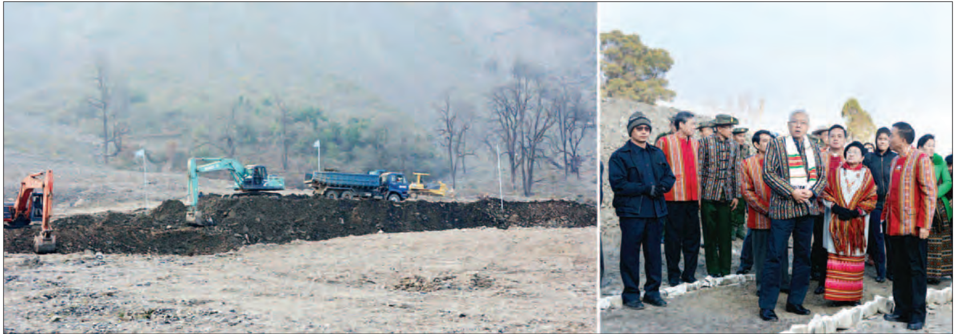
မိုးသည်းထန်စွာရွာသွန်းမှုကြောင့် ပြိုကျခဲ့သည့် ရုန်းတောင်အခြေအနေကို နိုင်ငံတော်သမ္မတ ဦးထင်ကျော်နှင့် ဇနီး ဒေါ်စုစုလွင်တို့ ကြည့်ရှုကြစဉ်။ (သတင်းစဉ်)