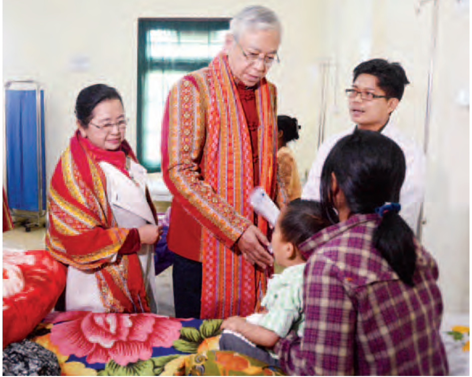
နိုင်ငံတော်သမ္မတ ဦးထင်ကျော် နှင့်ဇနီး ဒေါ်စုစုလွင် ထန်တလန်ပြည်သူ့ဆေးရုံကြီး၌ ဆေးဝါးကုသမှုခံယူနေသော လူနာများအား အားပေးစကားပြောကြားစဉ်။ (သတင်းစဉ်)

ဖော်ဆောင်ရွက်ပေးရေး၊ ဟားခါး-ထန်တလန်လမ်းကို ၁၈ ပေအကျယ် ကတ္တရာလမ်းခင်းပေးနိုင်ရေး၊ (၂၅)ခုတင် ဆံ့ ပြည်သူ့ဆေးရုံကို ခုတင် (၅၀) ဆံ့ဆေးရုံအဖြစ် အဆင့် မြှင့်တင်ပေးရေး၊ တည်းခိုရိပ်သာနှင့် အဆင့်မီခန်းမ တည်ဆောက်ပေးရေးတို့ကို တင်ပြရာ ပြည်ထောင်စု ဝန်ကြီး ဦးဝင်းခိုင်၊ ဒေါက်တာမြင့်ထွေးနှင့် ဒေါက်တာ