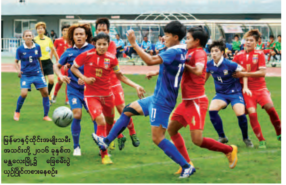
မြန်မာနှင့်ထိုင်းအမျိုးသမီး အသင်းတို့ ၂၀၁၆ ခုနှစ်က မန္တလေးမြို့၌ ခြေစစ်ပွဲ ယှဉ်ပြိုင်ကစားနေစဉ်။

ယှဉ်ပြိုင်ရတာပါ။ ဒီပွဲက အတွေ့အကြုံတွေ၊ လိုအပ်ချက်တွေကို ကြည့်ပြီး ပြန်ပြင်ဆင်သွားမှာပါ။ ကျွန်တော်တို့ အသင်းပါဝင်တဲ့ အုပ်စု (H) မှာ ရတနာပုံအသင်းက အားအနည်းဆုံးလို့ ပြောလို့ရပါတယ်။ ဘာဖြစ်လို့လဲဆိုတော့ ကျွန်တော်တို့အသင်းမှာ နိုင်ငံခြားသားကစားသမား တစ်ဦးပဲပါပါတယ်။ ဒါပေမဲ့ ပြိုင်ဘက်အသင်းတွေကို ကြောက်ရွံ့နေမှာမဟုတ်ပါဘူး။ ကစားသမားတွေအပေါ်မှာ ယုံကြည်မှုအပြည့်ရှိပါတယ်။ နောက်တစ်ဆင့်တက်နိုင် အောင် ကြိုးစားသွားမှာပါ။ စာမျက်နှာ ၈ ကော်လံ ၃ သို့