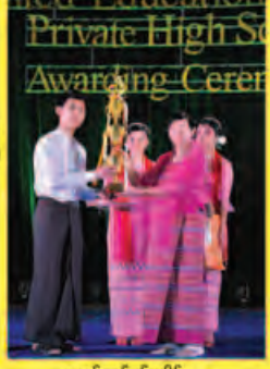
ဖောင်လွင်မင်းသိန်း ဆာကရ - ၀၄၄၂ (ဘာသာစုံဂုဏ်ထူးရှင်)

United Education Centre ကိုယ်ပိုင်အထက်တန်းကျောင်း KG - Grade 10