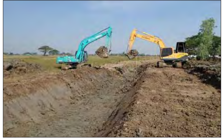
သုံးခွမြို့နယ်အတွင်း ရေကြီးနစ်မြုပ်မှုလျော့ကျစေရေးအတွက် တိမ်ကောနေသော ချောင်း၊ မြောင်းများ ပြန်လည်တူးဖော်ဆောင်ရွက်စဉ်။