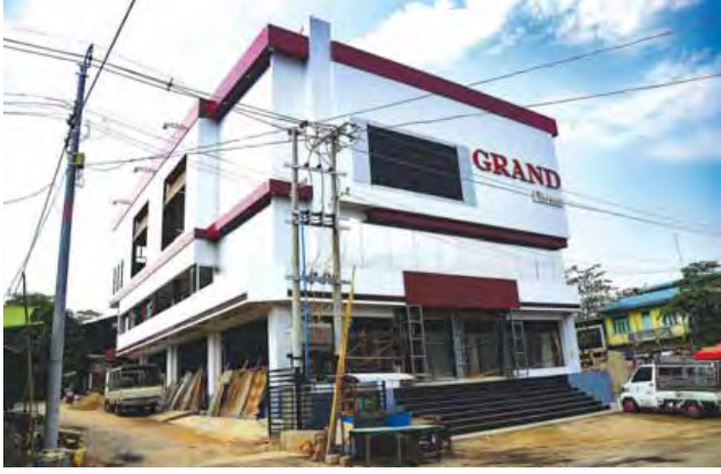
ပြသခဲ့သည့် ဇွဲရုံ၊ ရွှေပတိုရုံရုံ၊ ဂရင်း (မျိုးမြင့်)ရုံ စုစုပေါင်း ရုပ်ရှင်ရုံ သုံးရုံရှိခဲ့ပြီး အကြောင်းအမျိုးမျိုးကြောင့် ရုပ်ရှင်ရုံများပြသနိုင်ခြင်း မရှိတော့ဘဲ ၂၀၁၃ ခုနှစ် ဖေဖော်ဝါရီလအထိ ဂရင်းရုပ်ရှင်ရုံတစ်ခုသာ ဖလင်စနစ်ဖြင့် နောက်ဆုံးပြသခဲ့ကြောင်းသိရသည်။ ရုမ်းသာ(မိတ္ထီလာ)

အသစ်ဖွင့်လှစ်ပြသမည့် မိတ္ထီလာ အဆင့်မြင့်ဒစ်ဂျစ်တယ်ဂရင်းရုပ်ရှင်ရုံသစ်တွင် ၁၀၀၀ ကျပ်၊ ၂၀၀၀ ကျပ်၊ ၃၀၀၀ ကျပ်ဟူ၍ အတန်း သုံးမျိုးခွဲခြားပြီး ရုံဝင်ကြေးကောက်ခံမည်ဖြစ်ကာ စုစုပေါင်းရုပ်ရှင်ကြည့်ပရိသတ် ၂၄၆ ဦး ကြည့်ရှုနိုင်မည်ဖြစ်သည်။ မိတ္ထီလာတွင် ယခင်က ဖလင်ဖြင့်