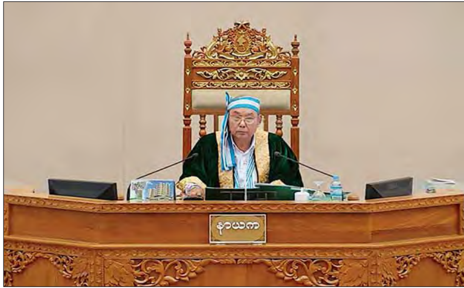
ပြည်ထောင်စုလွှတ်တော်နာယက မန်းဝင်းခိုင်သန်း

ထို့ပြင် ဒုတိယဝန်ကြီးက ပြည်ထောင်စု၏ နှစ်စဉ် အခွန်အကောက်ဥပဒေဆိုသည်မှာ အခွန်အကောက်ဆိုင်ရာ မူလဥပဒေများဖြစ်သော ဝင်ငွေခွန်ဥပဒေ၊ ကုန်သွယ်လုပ်ငန်းခွန်ဥပဒေ၊ အထူးကုန်စည်ခွန်ဥပဒေ၊ တံဆိပ်ခေါင်းခွန်ဥပဒေတို့တွင် ပြဋ္ဌာန်းထားချက်များအပေါ် အခြေခံ၍ အခွန်ပေးဆောင်ခြင်း၊ အခွန်ကင်းလွတ်