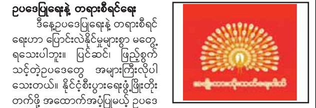
ဝစ်မန်သော အပြောင်းအလဲအတွက် အမျိုးသားတိုးတက်ရေးပါတီ

ဒါကြောင့် -ဦးဆောင်သူကိုလည်းကြည့်ပါ။ -ပါတီကိုလည်းကြည့်ပါ။ -ကိုယ်စားလှယ်လောင်းကိုလည်း လေ့လာပြီးတော့ အမှန်တကယ် ကိုယ့်ဒေသ၊ ကိုယ့်လူမျိုးအကျိုးအတွက် စဉ်းစားကြမယ် ဆိုရင် အမျိုးသားတိုးတက်ရေးပါတီက ကိုယ်စားလှယ်လောင်းကိုသာ မဲထည့်ခြင်းနဲ့ စနစ်တစ်ခုကို အမှန်တကယ် စစ်စစ်မှန်မှန် ပြောင်းလဲနိုင်ပါလိမ့်မယ်လို့ တင်ပြရင်း နိဂုံးချုပ်လိုက်ရပါတယ်။ ကျန်းမာချမ်းသာကြပါစေ။ ။