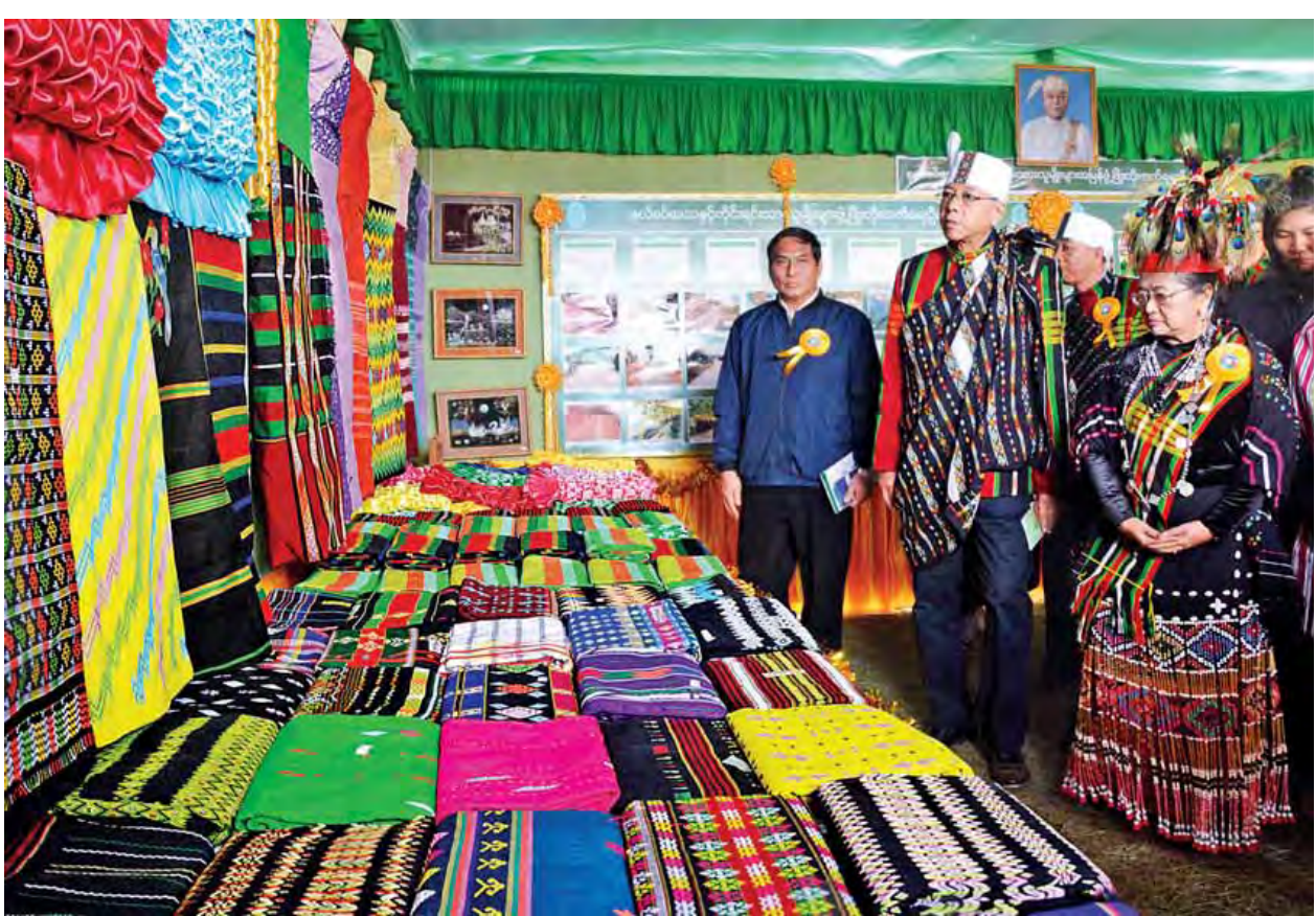
နိုင်ငံတော်သမ္မတ ဦးထင်ကျော်နှင့်ဇနီး ဒေါ်စုစုလွင်တို့ ချင်းအမျိုးသားနေ့အထိမ်းအမှတ်ပြခန်းကို ကြည့်ရှုလေ့လာကြစဉ်။ (သတင်းစဉ်)

ထို့နောက် နိုင်ငံတော်သမ္မတ ဦးထင်ကျော်က မိန့်ခွန်းပြောကြားရာတွင် ဖေဖော်ဝါရီ ၂၀ ရက်တွင် ကျရောက်သည့် (၆၉)နှစ်မြောက် ချင်းအမျိုးသားနေ့ နေ့ထူးနေ့မြတ် အခါသမယတွင် ချင်းတိုင်းရင်းသား ညီအစ်ကိုမောင်နှမ ပြည်ထောင်စုသားအားလုံးနှင့်အတူ ကိုယ်တိုင်ကိုယ်ကျပါဝင်ဆင်နွှဲခွင့်ရသည့် အတွက် အထူးဝမ်းသာဂုဏ်ယူပါကြောင်း။