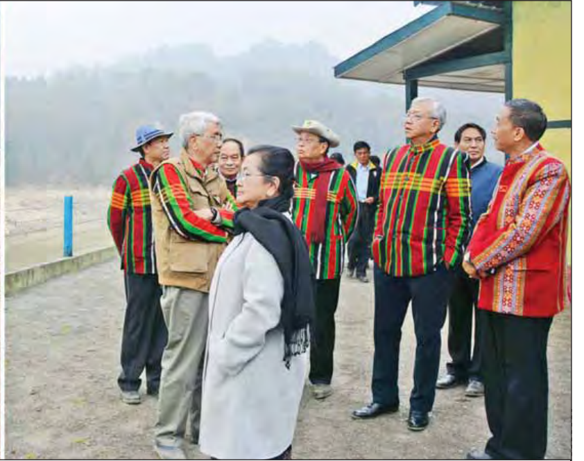
နိုင်ငံတော်သမ္မတ ဦးထင်ကျော် လိုက်ဖားဆည်ကြိုခိုင်းမှုနှင့် ရေဝင်ရောက်မှုအခြေအနေတို့ကို ကြည့်ရှုစစ်ဆေးစဉ်။ (သတင်းစဉ်)