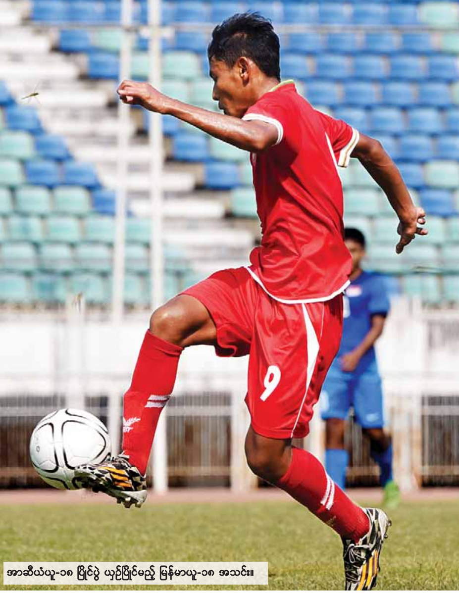
အာဆီယံယူ-၁၈ ပြိုင်ပွဲ ယှဉ်ပြိုင်မည့် မြန်မာယူ-၁၈ အသင်း။

ယင်းပြိုင်ပွဲကို စက်တင်ဘာ ၄ ရက်မှ ၁၇ ရက်အထိ ရန်ကုန်မြို့ရှိ သုဝဏ္ဏကွင်း၌ကျင်းပမည်ဖြစ်ပြီး အာဆီယံ နိုင်ငံ ၁၁ နိုင်ငံနှင့် သမုဒ္ဒရာပိုင်းဇုန်မှ နယူးဇီလန်အသင်း တို့ ပါဝင်ယှဉ်ပြိုင်မည်ဖြစ်သည်။ အုပ်စုခွဲဝေထားမှုအရ မြန်မာအသင်းသည် အုပ်စု(ခ)တွင် နယူးဇီလန်၊ ဝီယက်နမ်၊ ဖိလစ်ပိုင်၊ ဘရူနိုင်း၊ အင်ဒိုနီးရှားတို့နှင့်အတူ ကျရောက် နေပြီး အုပ်စု(က)တွင် စင်ကာပူ၊ မလေးရှား၊ ကမ္ဘောဒီးယား၊ လာအို၊ တီမောနှင့် ထိုင်းအသင်းတို့ ပါဝင်လျက်ရှိသည်။ အိမ်ရှင်မြန်မာအသင်းသည် အာဆီယံဒေသတွင်း အသင်းများဖြစ်သည့် ဝီယက်နမ်၊ အင်ဒိုနီးရှားတို့နှင့်အတူ ပါဝင်နေသလို နယူးဇီလန်အသင်း ပါဝင်နေသောကြောင့် ဆီမီးဖိုင်နယ် တက်ရောက်ရန်ရုန်းကန်ရဖွယ်ရှိနေသည်။ မြန်မာ ယူ-၁၈ အသင်းသည် ယင်းပြိုင်ပွဲ ယှဉ်ပြိုင်ရန် ၂၀၁၆ ခုနှစ် နှစ်ကုန်ပိုင်းကတည်းက စတင်ပြင်ဆင်ခဲ့ပြီး ရွေးချယ်ထားသည့် ပဏာမကစားသမား ၅၀ ကို နှစ်သင်း ခွဲ၍ ဖီးနစ်အသင်းအမည်ဖြင့် ပထမတန်း စီနီယာပြိုင်ပွဲနှင့် ပထမတန်း ယူ-၂၀ ပြိုင်ပွဲတို့တွင် ဝင်ရောက်ယှဉ်ပြိုင်လျက် ရှိသည်။ မြန်မာအသင်းသည် နိုင်ငံတကာပြိုင်ပွဲအတွေ့ အကြုံရရှိစေရန် ဒီဇင်ဘာလတွင် တရုတ်နိုင်ငံသို့ သွား ရောက်၍ လေ့ကျင့်မှုများပြုလုပ်ခဲ့ပြီး ခြေစမ်းပွဲ ခြောက်ပွဲ ယှဉ်ပြိုင်ကစားခဲ့သည်။ စာမျက်နှာ ၉ ကော်လံ ၄ သို့ ၀