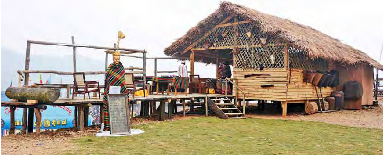
(၆၉)နှစ်မြောက် ချင်းအမျိုးသားနေ့အထိမ်းအမှတ်အဖြစ်ပြသထားသည့် ချင်းရိုးရာအိမ်ကို တွေ့ရစဉ်။

ချင်းပြည်နယ်တွင် သွားလာရန်ခက်ခဲသည့် သဘာဝမြေမျက်နှာပြင်နှင့် မြင့်မားသည့်တောင်တန်း၊ တောင်စွယ်များတည်ရှိခြင်းကြောင့် ဖွံ့ဖြိုးတိုးတက် ရေးလုပ်ငန်းများဆောင်ရွက်ရာတွင် အခက်အခဲများကြုံတွေ့နေရသော်လည်း နိုင်ငံတော်အနေဖြင့် ပြည်နယ်တိုးတက်ရေးအတွက် ကြိုးပမ်းပြည့်ဆည်း ဆောင်ရွက်ပေးလျက်ရှိပြီး ချင်းပြည်နယ်အတွင်း တိုင်းရင်းသားများကလည်း တတ်စွမ်းသရွေ့ ပူးပေါင်းပါဝင်ဆောင်ရွက်သွားရန် လိုအပ်ပါကြောင်း။