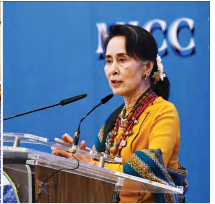
နိုင်ငံတော်၏အတိုင်ပင်ခံပုဂ္ဂိုလ် ဒေါ်အောင်ဆန်းစုကြည် (၆၉)နှစ်မြောက် ချင်းအမျိုးသားနေ့အခမ်းအနားတွင် အမှာစကားပြောကြားစဉ်။ (သတင်းစဉ်)