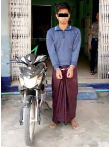
ဖွင့်အရေးယူဆောင်ရွက်လျက်ရှိကြောင်း သိရ စိုင်း(သီပေါ)