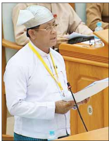
ဒုတိယဝန်ကြီး ဦးမောင်မောင်

အရိုင်းနှင့် အချောထည်များ ထုတ်လုပ်ရောင်း ချမှုမှ ၂၀၁၄ - ၂၀၁၅ ဘဏ္ဍာနှစ်အတွင်း ရတနာအခွန် တစ်မျိုးတည်းသာ ကောက်ခံခဲ့ သည့်အတွက် ငွေကျပ် ၇၃ ဒသမ ၇၂၅ ဘီလီယံကောက်ခံရရှိခဲ့ပါကြောင်း၊ ၂၀၁၅ - ၂၀၁၆ ဘဏ္ဍာနှစ်တွင် ရတနာအခွန်အပြင် ကုန်သွယ်လုပ်ငန်းခွန်ကိုပါ ကောက်ခံခဲ့ သည့်အတွက် အခွန်နှစ်ရပ်ပေါင်း ငွေကျပ် ၁၆၆ ဒသမ ၀၆၄ ဘီလီယံ ကောက်ခံရရှိခဲ့ပါ ကြောင်း။