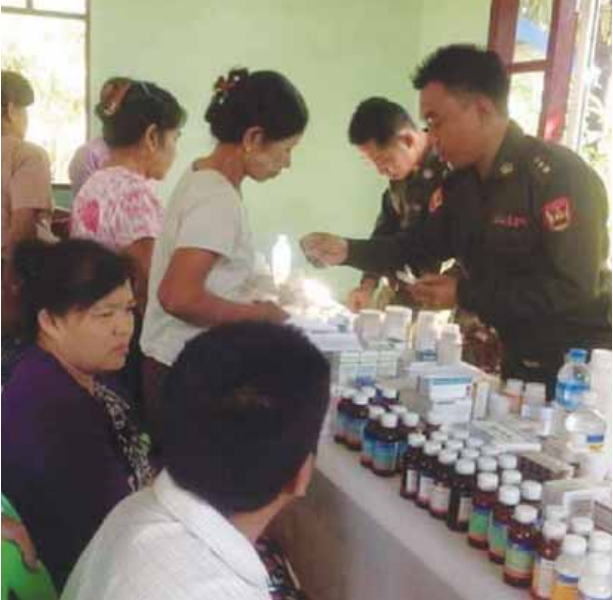
သရက်ချောင်း ဖေဖော်ဝါရီ ၂၀

တနင်္သာရီတိုင်းဒေသကြီး သရက်ချောင်းမြို့နယ် သရက်နှစ်ခွကျေးရွာ အုပ်ချုပ်ရေးမှူးရုံးနေရာ၌ ဖေဖော်ဝါရီ ၁၇ ရက်က နယ်လှည့်ဆေးကုသရေးအဖွဲ့မှ ကျန်းမာရေးစောင့်ရှောက်မှု လုပ်ငန်းများကိုအခမဲ့ ဆောင်ရွက်ပေးခဲ့သည်။