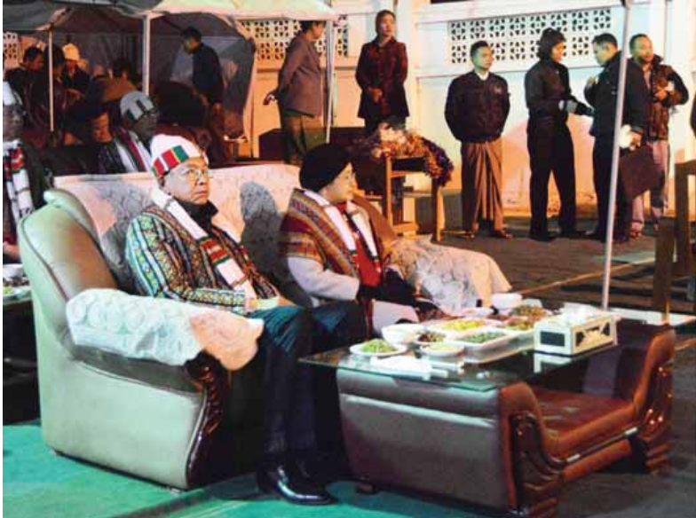
နိုင်ငံတော်သမ္မတ ဦးထင်ကျော်နှင့်ဇနီး ဒေါ်စုစုလွင်တို့ ဟားခါးမြို့၌ကျင်းပသည့်မီးပွဲကို ကြည့်ရှုအားပေးစဉ်။ (သတင်းစဉ်)