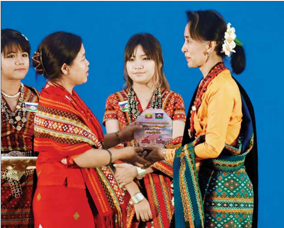
၂၀၁၅-၂၀၁၆ ပညာသင်နှစ်တွင် Ph.D ပါရဂူဘွဲ့ရ တိုင်းရင်းသူတစ်ဦးအား နိုင်ငံတော်၏အတိုင်ပင်ခံပုဂ္ဂိုလ် ဒေါ်အောင်ဆန်းစုကြည် ဂုဏ်ပြုဆုပေးအပ်ချီးမြှင့်စဉ်။