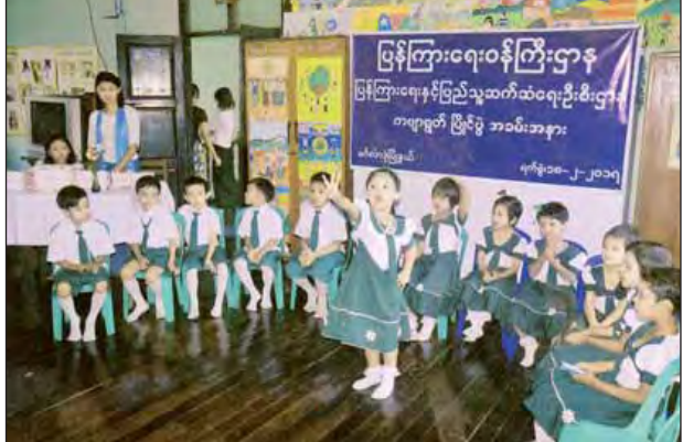
မင်္ဂလာဒုံမြို့နယ် ပြန်ကြားရေးနှင့် ပြည်သူ့ဆက်ဆံရေးဦးစီးဌာနတွင် ကဗျာ ရွတ်ဆိုပြိုင်ပွဲနှင့် ဆေးရောင်ခြယ်ပြိုင်ပွဲကို ဖေဖော်ဝါရီ ၁၈ ရက် နံနက်က မြို့နယ်ပြန်/ဆက် ဦးစီးဌာနနှင့် အမက(၄) ကျောင်းတို့ ပူးပေါင်း၍ ကျောင်းသား ကျောင်းသူများက ကဗျာရွတ်ဆိုပြိုင်ပွဲနှင့် ဆေးရောင်ခြယ် ပြိုင်ပွဲ ကျင်းပစဉ်။ (ဝင်းမင်း)