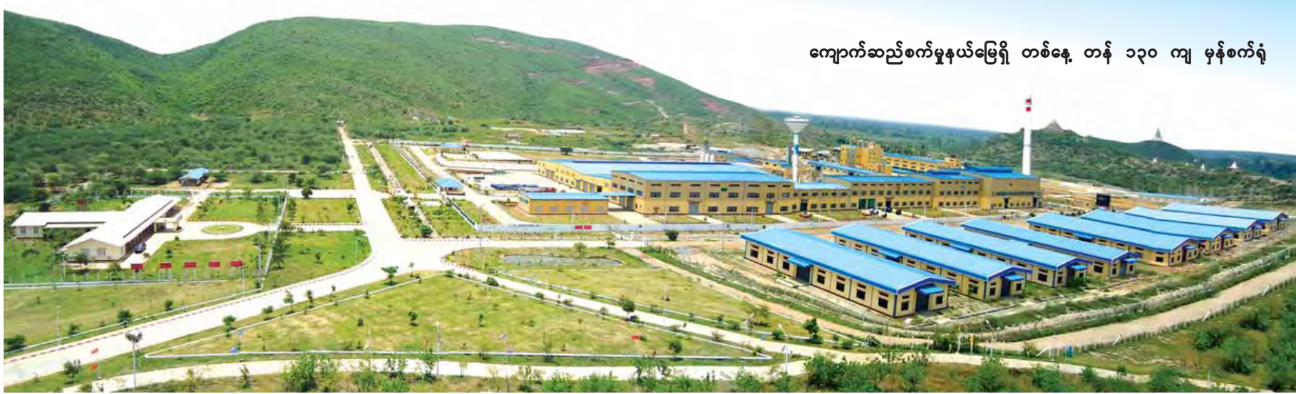
ကျောက်ဆည်စက်မှုနယ်မြေရှိ တစ်နေ့ တန် ၁၃၀ ကျ မှန်စက်ရုံ