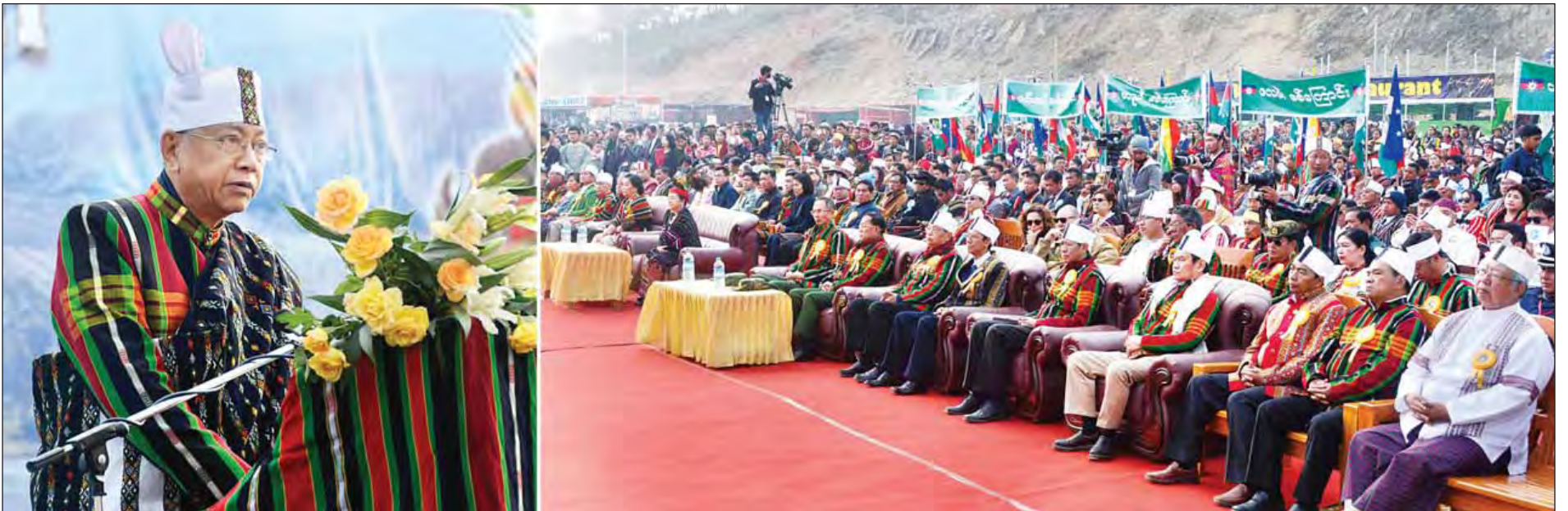
(၆၉)နှစ်မြောက် ချင်းအမျိုးသားနေ့ အခမ်းအနား၌ နိုင်ငံတော်သမ္မတ ဦးထင်ကျော် မိန့်ခွန်းပြောကြားစဉ်။ (သတင်းစဉ်)