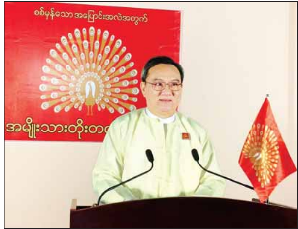
ရဟန်းရှင်လူ၊ မိဘပြည်သူများ ရွှင်လန်းချမ်းမြေ့ကြပါစေ။ မကြာခင်မှာ ကြားဖြတ်ရွေးကောက်ပွဲကြီး ကျင်းပပါတော့မယ်။

အမျိုးသားတိုးတက်ရေးပါတီဥက္ကဋ္ဌ ဒေါက်တာ နေဇင်လတ်က ၎င်းတို့ပါတီ၏ မူဝါဒ၊ သဘောထား၊ လုပ်ငန်းစဉ် စသည်တို့ကို ဖေဖော်ဝါရီ ၂၀ ရက် ညပိုင်းတွင် ရေဒီယိုနှင့် ရုပ်မြင်သံကြား အစီအစဉ်များမှ ဟောပြောတင်ပြခဲ့ပါသည်။ အဆိုပါ ဟောပြောတင်ပြချက်အပြည့်အစုံမှာ အောက်ပါအတိုင်းဖြစ်ပါသည်-