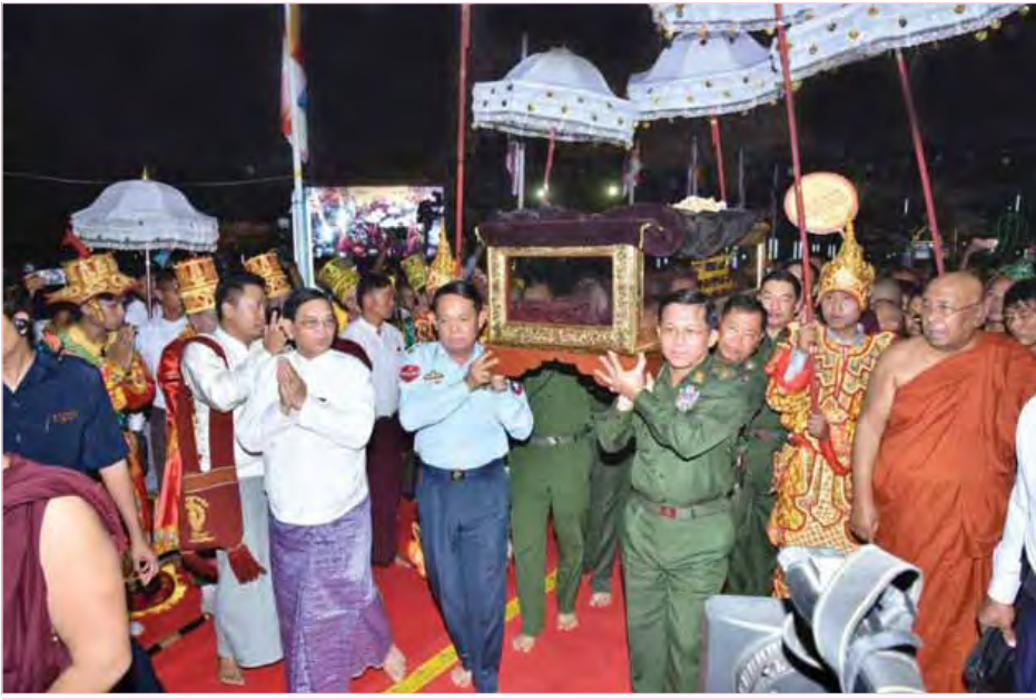
တပ်မတော်ကာကွယ်ရေးဦးစီးချုပ် ဗိုလ်ချုပ်မှူးကြီးမင်းအောင်လှိုင် ရွှေကျင်သာသနာပိုင်ဆရာတော်ကြီး၏ ဥတုဇရုပ်ကလာပ်တော်အား အန္တိမဈာပနပြုလုပ်ပည့်နေရာသို့ ပင့်ဆောင်လာစဉ်။

အဆိုပါ အန္တိမဈာပနသာဓုကုဋ်ဋ္ဌပူဇော်ပွဲအခမ်း အနားသို့ ရန်ကုန်မြို့ မရမ်းကုန်းမြို့နယ် ဝိဇ္ဇေတာရုံ စာသင်တိုက် ပဓာနနာယက နိုင်ငံတော်ဩဝါဒါစရိယ ပန္နရသမရွေ့ကျင်သာသနာပိုင် အဂ္ဂမဟာပဏ္ဍိတ ဘဒ္ဒန္တ ဝိဇ္ဇေတဆရာတော်အမှုပြုသော ဆရာတော်၊ သံဃာ တော်များ ကြွရောက်တော်မူကြပြီး တပ်မတော်ကာကွယ်ရေး ဦးစီးချုပ် ဗိုလ်ချုပ်မှူးကြီးမင်းအောင်လှိုင်နှင့်ဇနီး ဒေါ်ကြူကြူလျှာ၊ သာသနာရေးနှင့် ယဉ်ကျေးမှုဝန်ကြီးဌာန ပြည်ထောင်စုဝန်ကြီး သူရဦးအောင်ကို၊ မန္တလေးတိုင်း ဒေသကြီးဝန်ကြီးချုပ် ဦးဇော်မြင့်မောင်၊ ဖိတ်ကြားထားသော ဧည့်သည်တော်များနှင့် ဒါယကာ၊ ဒါယိကာမများ တက်ရောက်ကြသည်။