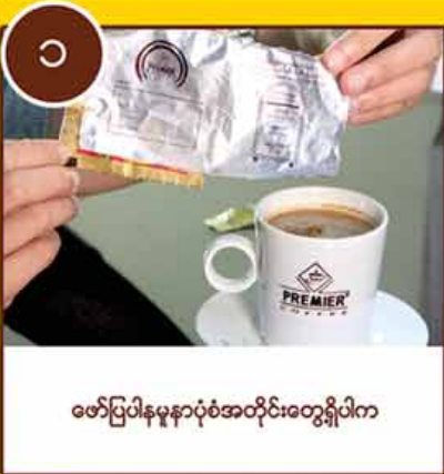
ဖော်ပြပါနမူနာပုံစံအတိုင်းတွေ့ရှိပါက

(၂)ထပ်ကွမ်း ငွေလမ်း ကံစမ်းမဲ ငွေကျပ်သိန်း ၁၀၀ ဆု (၂၀) ဆု အောက်ဖော်ပြပါပုံစံ အတိုင်းကံစမ်းနိုင်ပါသည်။