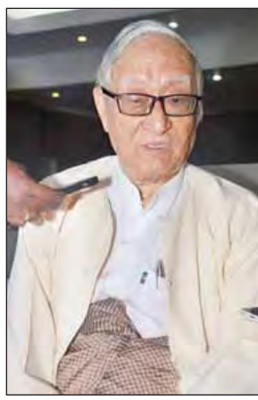
စည်သူဒေါက်တာသော်ကောင်း