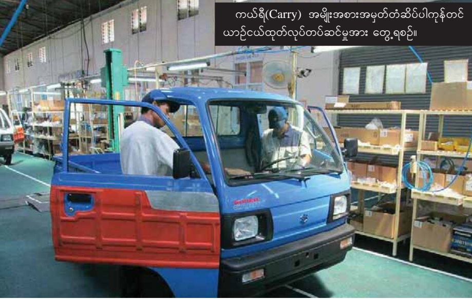
ကယ်ရီ(Carry) အမျိုးအစားအမှတ်တံဆိပ်ပါကုန်တင် ယာဉ်ငယ်ထုတ်လုပ်တပ်ဆင်မှုအား တွေ့ရစဉ်။

လက်ရှိအနေအထားအရ ဆူဇူးကီး (မြန်မာ)မော်တာ ကုမ္ပဏီလီမိတက် အနေဖြင့် သီလဝါအထူးစီးပွားရေးဇုန် ၌ တပ်ဆင်ထုတ်လုပ်ခဲ့သော ကယ်ရီ (Carry) အမျိုးအစားအမှတ်တံဆိပ်ပါ ကုန်တင်ယာဉ်ငယ်တစ်စီးအား လာအို နိုင်ငံသို့ ရေကြောင်းခရီးဖြင့်