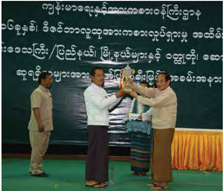
ကျန်းမာရေးနှင့် အားကစားဝန်ကြီးဌာန အမြဲတမ်းအတွင်းဝန် ပါမောက္ခ ဒေါက်တာ သက်ခိုင်ဝင်းက ဒီဇင်ဘာလူထုအားကစား လှုပ်ရှားမှုများတွင် အတတ်ကြွဆုံးပါဝင် လှုပ်ရှားခဲ့သည့် တိုင်းဒေသကြီးနှင့် ပြည်နယ် များမှ မွန်ပြည်နယ်၊ စစ်ကိုင်းတိုင်းဒေသကြီး၊ မကွေးတိုင်းဒေသကြီးတို့အားလည်းကောင်း ဆုများပေးအပ်ချီးမြှင့်ခဲ့ပြီး တတိယဆုရရှိ သော ပဲခူးတိုင်းဒေသကြီး၊ ဒုတိယဆုရရှိသော ရှမ်းပြည်နယ်၊ ပထမဆုရရှိသော မန္တလေး တိုင်းဒေသကြီးနှင့် ၂၀၁၆ ခုနှစ်အတွင်း အားကစားပြိုင်ပွဲတိုင်းတွင် အောင်မြင်မှု အမြင့်မားဆုံးဆုရရှိသော ရန်ကုန်တိုင်း ဒေသကြီးတို့အား ပြည်ထောင်စုဝန်ကြီး ဆွေလီမြင့် (ပြေးခုန်ပစ်)၊ သင့်မြတ် (ရေကူး)၊ ဒေါက်တာ မြင့်ထွေးက ဆုဖလားနှင့် ငွေသား ဆုများ ပေးအပ်ချီးမြှင့်ခဲ့သည်။

ရှမ်းပြည်နယ် လူမှုရေးဝန်ကြီး ဒေါက်တာ မျိုးထွန်း၊ မွန်ပြည်နယ် ကရင်တိုင်းရင်းသား လူမျိုးရေးရာဝန်ကြီး ဦးအောင်မြင်ခိုင်၊ ကရင် ပြည်နယ် ဗမာတိုင်းရင်းသား လူမျိုးရေးရာ ဝန်ကြီး ဦးတေထွန်းလှိုင်ထွေးနှင့် ရန်ကုန်တိုင်း ဒေသကြီး လူမှုရေးဝန်ကြီး ဦးနိုင်လင်းတို့က ဆုရရှိသူများအား ဆုများအသီးသီး ပေးအပ် ချီးမြှင့်ခဲ့သည်။