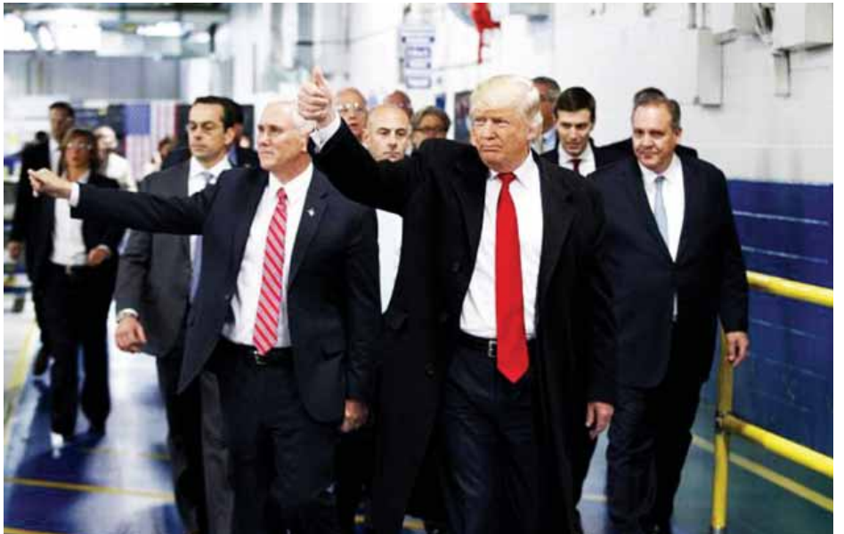
သေးပေ။ မကြာသေးမီကာလအတွင်း အခွန်အခကောက်ခံခြင်းဆိုင်ရာ ပြုပြင်ပြောင်းလဲရေး လုပ်ငန်းများ အမေရိကန်နိုင်ငံအတွင်း လုပ်ဆောင်နိုင်ဖွယ်ရှိကြောင်း နိုင်ငံရေး စောင့်ကြည့်လေ့လာသူများက ဆိုသည်။ အန်ဒရီအိုဘီအိုကော့

ထိခိုက်မှုမရှိစေရေးအတွက် ကုန်သွယ်ရေးကဏ္ဍတွင် နိုင်ငံခြားတိုင်းပြည်များနှင့် သဘောတူညီမှုများကိုလည်း ပြန်လည် သုံးသပ်မည့် သူ၏အစီအစဉ်ကို သမ္မတထရန်ဒေါ့က ပြောကြားခဲ့သည်။ အမေရိကန် ကုန်သွယ်ရေးမူဝါဒ များကိုလည်း တင်းကျပ်စွာ ပြဌာန်းမည်ဖြစ်သည်ဟု သမ္မတ ထရန်ဒေါ့က ဆိုသည်။ အမေရိကန်ပြည်ထောင်စုပြင်ပရှိ အမေရိကန် ကုမ္ပဏီများက တင်သွင်းသော ထုတ်ကုန်များအပေါ် အခွန်အခများ တိုးမြှင့်ကာကွယ်မည်ဖြစ်ကြောင်း အလေးပေး ပြောကြားခဲ့သည်။ ပြင်ပနိုင်ငံများရှိ အမေရိကန်ကုမ္ပဏီများက တင်သွင်း သော ထုတ်ကုန်များကို ၃၅ ရာခိုင်နှုန်းထိ တိုးမြှင့် ကောက်ခံမည်ဖြစ်ကြောင်း သမ္မတထရန်ဒေါ့က ကနဦးက ပြောကြားခဲ့သည်။ သို့သော် ယင်းကိစ္စနှင့်ပတ်သက်ပြီး ယခုအချိန်ထိ အကောင်အထည်ဖော်ဆောင်မူ မရှိ