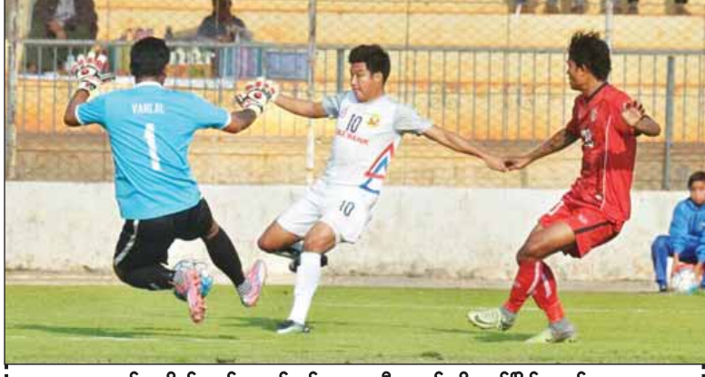
ရှမ်းယူနိုက်တက်အသင်းနှင့် ဧရာဝတီအသင်းတို့ ယှဉ်ပြိုင်နေစဉ်။