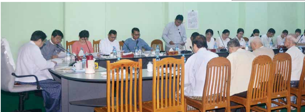
မြန်မာ့စွယ်စုံကျမ်းများ ခေတ်နှင့်လျော်ညီအောင် ပြန်လည်ထုတ်ဝေနိုင်ရေး ညှိနှိုင်းအစည်းအဝေးကျင်းပစဉ်။ (သတင်းစဉ်)

ရန်ကုန် ဖေဖော်ဝါရီ ၁၈ - မြန်မာ့စွယ်စုံကျမ်းများ ခေတ်နှင့်လျော်ညီအောင် ပြန်လည်ထုတ်ဝေနိုင်ရေးလုပ်ငန်း ညှိနှိုင်းအစည်းအဝေးနှင့် ဘာသာပြန်စာပေ စာတမ်းဖတ်ပွဲ အောင်မြင်စွာကျင်းပနိုင်ရေးညှိနှိုင်းအစည်းအဝေးတို့ကို ယနေ့ နံနက်ပိုင်းတွင် ရန်ကုန် မြို့ သိမ်ဖြူလမ်းရှိ ပုံနှိပ်ရေးနှင့်ထုတ်ဝေရေးဦးစီးဌာန ဗဟိုပုံနှိပ်စက်ရုံအစည်းအဝေးခန်းမ၌ ကျင်းပသည်။