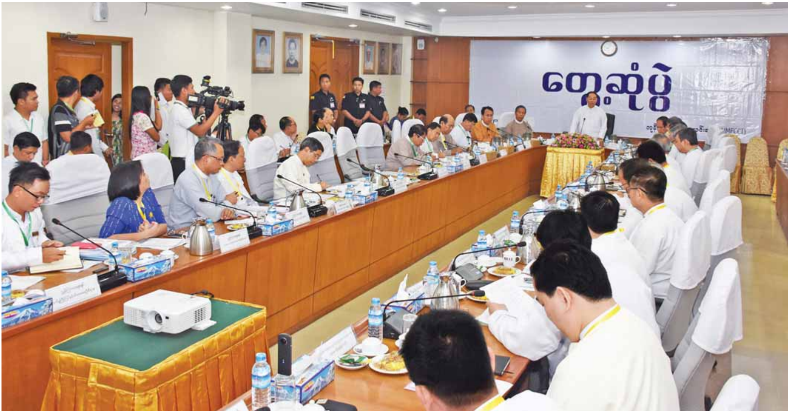
မြန်မာ့စီးပွားရေးလုပ်ငန်းရှင်များနှင့် တတိယအကြိမ်ပုံမှန်တွေ့ဆုံဆွေးနွေးပွဲတွင် ဒုတိယသမ္မတ ဦးမြင့်ဆွေ အမှာစကားပြောကြားစဉ်။

ရန်ကုန် ဖေဖော်ဝါရီ ၁၈ လုပ်ငန်းရှင်များအနေဖြင့် စီးပွား ရေးလုပ်ငန်းများ လုပ်ဆောင်ရာတွင် လွယ်ကူ လျင်မြန်ချောမွေ့စေရန် အတွက် လိုအပ်ချက်များကို သက်ဆိုင် ရာကဏ္ဍအလိုက် ဌာနအသီးသီးမှ ဖြည့်ဆည်းပေးရန် ရည်ရွယ်ချက် များဖြင့် မြန်မာ့စီးပွားရေးလုပ်ငန်း ရှင်များနှင့် တတိယအကြိမ်ပုံမှန် တွေ့ဆုံဆွေးနွေးပွဲကို ယနေ့နံနက် ၉ နာရီတွင် ရန်ကုန်မြို့၊ လမ်းမတော် မြို့နယ် မင်းရဲကျော်စွာလမ်းရှိ ကုန်သည်များနှင့် စက်မှုလက်မှု လုပ်ငန်းရှင်များ အသင်းချုပ် (UMFCCI) အစည်းအဝေးခန်းမ၌ ကျင်းပရာ ပုဂ္ဂလိကကဏ္ဍဖွံ့ဖြိုး တိုးတက်ရေးကော်မတီဥက္ကဋ္ဌ ဒုတိယ သမ္မတဦးမြင့်ဆွေ တက်ရောက်အမှာ စကားပြောကြားသည်။ ဒုတိယသမ္မတက ပုဂ္ဂလိကကဏ္ဍ ဖွံ့ဖြိုးရေးအတွက် စီးပွားရေးလုပ်ငန်း ရှင်များနှင့် တွေ့ဆုံဆွေးနွေးခဲ့သည် မှာ ယခုတစ်ကြိမ်အပါအဝင် သုံးကြိမ် မြောက်ဖြစ်ပါကြောင်း၊ တွေ့ဆုံဆွေးနွေး မှုများက ရရှိသည့် လုပ်ငန်းရှင်များ၏ စာမျက်နှာ ၃ ကော်လံ ၁ သို့