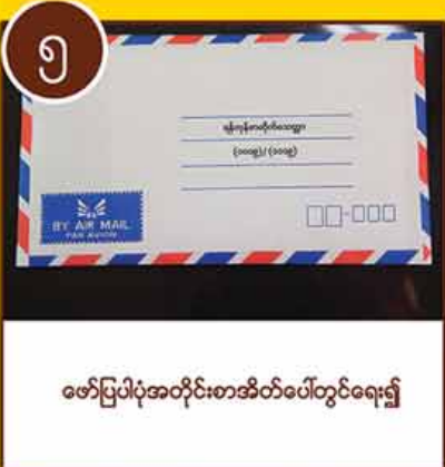
ဖော်ပြပါပုံစံအတိုင်းစာအိတ်ပေါ်တွင်ရေး၍