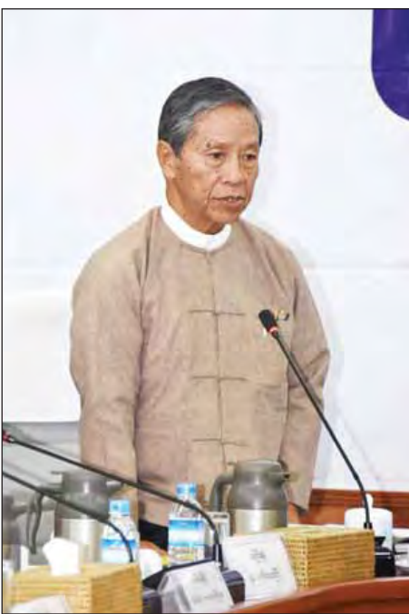
ပြည်ထောင်စုဝန်ကြီး ဦးကျော်ဝင်း

၂၀၁၆ခုနှစ် ဒီဇင်ဘာ ၁ ရက်က ဤအစည်းအဝေးခန်းမ ၌ ပြုလုပ်ခဲ့သော အစည်းအဝေးတွင် တင်ပြချက်များအပေါ် ဖြေရှင်းဆောင်ရွက်ပေးရန် အချက် ၂၇ ချက်နှင့် ၂၀၁၇ ခုနှစ် ဇန်နဝါရီ ၁၃ ရက်က ပြုလုပ်ခဲ့သော အစည်းအဝေး၌ တင်ပြချက်များအပေါ် ဖြေရှင်းဆောင်ရွက်ပေးရန်အချက် ၁၁ ချက် စုစုပေါင်း ၃၈ ချက်ကို သက်ဆိုင်ရာဝန်ကြီးဌာန အဖွဲ့အစည်းများနှင့် ပေါင်းစပ်ညှိနှိုင်းဖြေရှင်း ဆောင်ရွက် ပေးနေပြီဖြစ်ပါကြောင်း၊ ဆောင်ရွက်ပြီးစီးမှုအခြေအနေများ