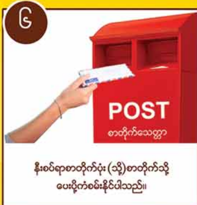
နီးစပ်ရာစာတိုက်ပုံး (သို့) စာတိုက်သို့ ပေးပို့ကံစမ်းနိုင်ပါသည်။

ကံစမ်းမဲကာလ (ဒီဇင်ဘာ ၂၀၁၆) မှ (ဧပြီ ၂၀၁၇) ထိ