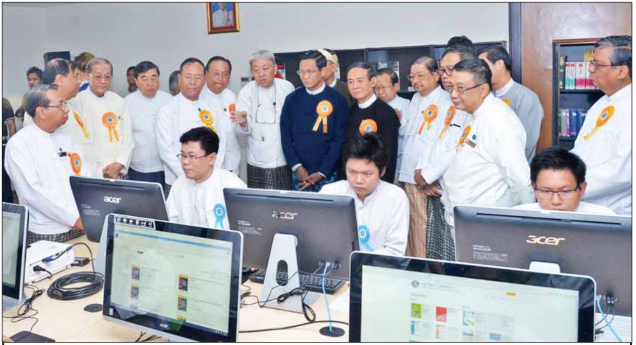
မြန်မာနိုင်ငံအင်ဂျင်နီယာကောင်စီရုံးအတွင်း ဒုတိယသမ္မတ ဦးဟင်နရီဗန်ထီးယူနှင့် ပြည်သူ့လွှတ်တော်ဥက္ကဋ္ဌ ဦးဝင်းမြင့်တို့ လှည့်လည်ကြည့်ရှုကြစဉ်။ (သတင်းစဉ်)