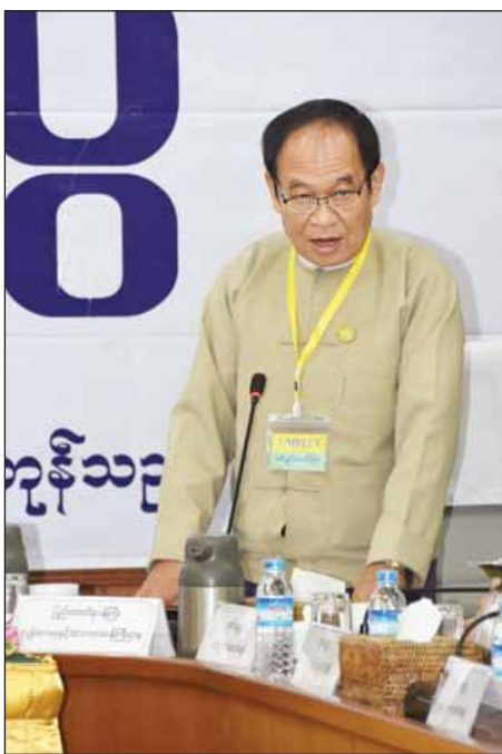
ပြည်ထောင်စုဝန်ကြီး ဒေါက်တာမြင့်ထွေး

ပုဂ္ဂလိကကဏ္ဍ ဖွံ့ဖြိုးတိုးတက်ရေး ကော်မတီအနေဖြင့် ပုဂ္ဂလိကလုပ်ငန်းရှင်များ၏ တင်ပြချက်များနှင့်ပတ်သက်ပြီး အမြန်ဖြေရှင်းပေးနိုင်ရန်အတွက် လုပ်ငန်းကော်မတီများ နှင့် ချိတ်ဆက်ဆောင်ရွက်လျက်ရှိပြီး အချို့အချက်များကို