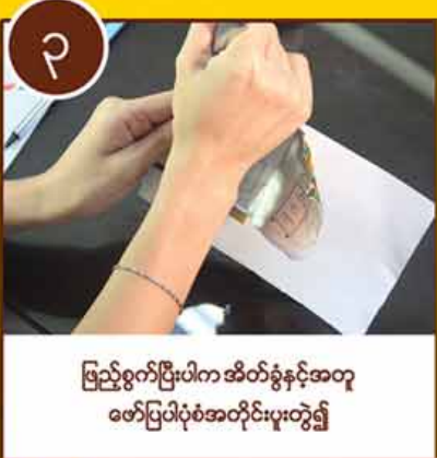
ဖြည့်စွက်ပြီးပါက အိတ်ခွံနှင့်အတူ ဖော်ပြပါပုံစံအတိုင်းပူးတွဲ၍