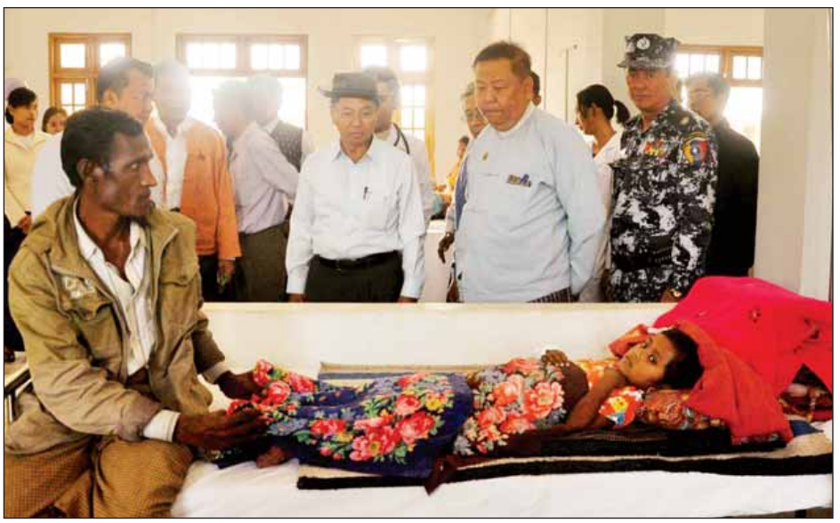
ခုတင် (၅၀)ဆံ့ မောင်တောခရိုင် ပြည်သူ့ဆေးရုံ၌ ကျန်းမာရေးစောင့်ရှောက်ပေးနေမှုအခြေအနေများကို ကော်မရှင်ဥက္ကဋ္ဌ ဒုတိယသမ္မတ ဦးမြင့်ဆွေ ကြည့်ရှုစစ်ဆေးစဉ်။ (သတင်းစဉ်)

ဦးရဲထွဋ်က ကုန်သွယ်ရေးဇုန်၏ စီမံကိန်းဆိုင်ရာအချက်အလက်များ၊ ဆောင်ရွက်ဆဲလုပ်ငန်းများ၊ ဆက်လက် ဆောင်ရွက်မည့်လုပ်ငန်းများ၊ တည်ဆောက်ပြီးဖြစ်သည့် အဆောက်အအုံများနှင့် ကညင်ချောင်း ဆိပ်ခံတံတား တို့ကို လိုက်လံရှင်းလင်းပြသသည်။ ကညင်ချောင်းကုန်သွယ်ရေးဇုန်သည် စီးပွားရေး ဖွေးကွက်စနစ်၏ လိုအပ်ချက်နှင့်အညီ ပြည်တွင်းထွက်ကုန် ပစ္စည်းများအပေါ် ဝယ်ယူဈေးကွက်မှ ရောင်းသူဈေးကွက် ဖြစ်ပေါ်လာစေရန်၊ ကုန်သွယ်မှုပမာဏတိုးမြှင့်လာစေရန် နှင့် ကုန်တင်သင်္ဘောများ အချိန်မရွေးဆိုက်ကပ်နိုင်ရန် ရည်ရွယ်ချက်ဖြင့် အကောင်အထည်ဖော်ဆောင်ရွက်ခြင်း ဖြစ်ကြောင်း ပြည်နယ်ဝန်ကြီးချုပ်က ဖြည့်စွက်ရှင်းလင်း သည်။ မောင်တောခရိုင်သည် ဖွံ့ဖြိုးမှုအလားအလာကောင်း သည့် ဒေသတစ်ခုဖြစ်သည့်အပြင် တစ်ဖက်နိုင်ငံ၏ ဝယ်ယူ အားပမာဏများပြားခြင်းတို့ကြောင့် အခြားနယ်စပ်ဒေသ ကုန်သွယ်ရေးဇုန်များနှင့် နှိုင်းယှဉ်လျှင် သွင်းကုန်ထက် ပို့ကုန်ကို ဦးစားပေးဆောင်ရွက်နိုင်သည့် အခြေအနေ ကောင်းများရှိကြောင်း သိရသည်။ (သတင်းစဉ်)