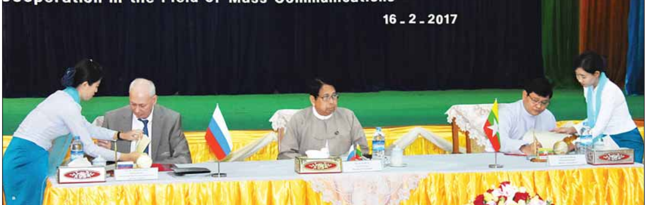
ပြန်ကြားရေးဝန်ကြီးဌာနနှင့် ရုရှားဖက်ဒရေရှင်းနိုင်ငံ ဆက်သွယ်ရေးနှင့် သတင်းမီဒီယာဝန်ကြီးဌာနတို့အကြား လူထုဆက်သွယ်ရေးကဏ္ဍ ပူးပေါင်းဆောင်ရွက်ရေး နားလည်မှုစာချုပ်လွှာလက်မှတ်ရေးထိုးပွဲကျင်းပစဉ်။

တွေ့ဆုံသည်။ ဆက်လက်၍ ရုရှားနိုင်ငံ ဒုတိယဝန်ကြီးနှင့်အဖွဲ့သည် မြန်မာ့အသံ နှင့် ရုပ်မြင်သံကြားနှင့် သတင်းနှင့်စာနယ်ဇင်းလုပ်ငန်းတို့မှ တာဝန်ရှိသူများနှင့် တွေ့ဆုံပြီး နှစ်နိုင်ငံမီဒီယာကဏ္ဍ ပူးပေါင်းဆောင်ရွက်ရေးနှင့်စပ်လျဉ်း၍