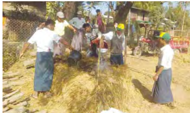
ရွာ၌ သဘာဝမြေဆွေးပုံ ၁၀၀ ကို လက်တွေ့ပြုလုပ်ပြသနိုင်ခဲ့ပြီဖြစ်ကြောင်း နှင့် အဆိုပါမြေဆွေးပုံများကို မိုးကြိုသီးနှံများ စိုက်ပျိုးသည့်အခါ ထည့်သွင်း အသုံးပြုသွားမည်ဖြစ်ကြောင်း သိရသည်။ (၆၆၆)

ယင်းသို့ဆောင်ရွက်လျက်ရှိရာ ဂန့်ဂေါမြို့နယ်၌ ဇန်နဝါရီမှ မတ်လအထိ ကျေးရွာ ၁၅ ရွာတွင် ဆောင်ရွက်သွားမည်ဖြစ်ကာ ယနေ့ထိ ကျေးရွာ ၁၁