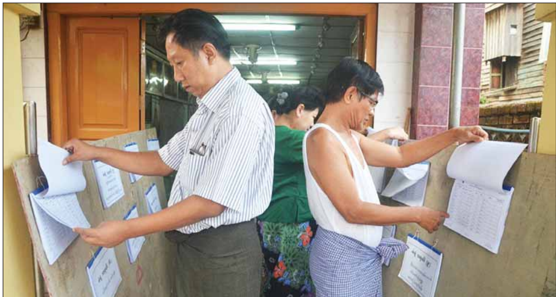
ရန်ကုန်တိုင်းဒေသကြီး လှိုင်မြို့နယ် (၁၃) ရပ်ကွက်တွင် ကြားဖြတ်ရွေးကောက်ပွဲအတွက် ပထမကြိမ် မဲဆန္ဒရှင်စာရင်း ကပ်ထားကြေညာမှုကို ပြည်သူများ လာရောက်ကြည့်ရှုနေသည်ကိုတွေ့ရစဉ်။

ရန်ကုန်တိုင်းဒေသကြီးတွင် ကြားဖြတ်ရွေးကောက်ပွဲအတွက် မဲပေးပိုင်ခွင့်ရှိသူ မဲဆန္ဒရှင်စာရင်းများကို ဖေဖော်ဝါရီ ၁ ရက်နံနက်ပိုင်းမှ ၁၄ ရက်အထိ သက်ဆိုင်ရာမြို့နယ်များအလိုက် ရပ်ကွက်နှင့် ကျေးရွာရွေးကောက်ပွဲကော်မရှင် အဖွဲ့ခွဲရုံးများတွင် ပထမအကြိမ်အဖြစ် ကပ်ထားကြေညာပေးခဲ့ရာ တိုင်းဒေသကြီးအတွင်း မဲပေးပိုင်ခွင့်ရှိသူ