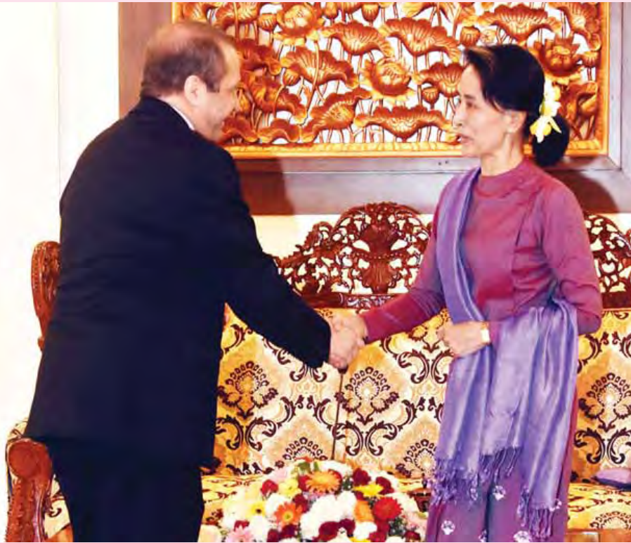
နိုင်ငံတော်၏အတိုင်ပင်ခံပုဂ္ဂိုလ် ဒေါ်အောင်ဆန်းစုကြည် မြန်မာနိုင်ငံဆိုင်ရာ အယ်လ်ဂျီးရီးယားပြည်သူ့ဒီမိုကရက်တစ် သမ္မတနိုင်ငံ သံအမတ်ကြီး မစ္စတာ ဗိုဟာမက်ဘီရာ အား ရင်းရင်းနှီးနှီးနှုတ်ဆက်စဉ်။ (သတင်းစဉ်)