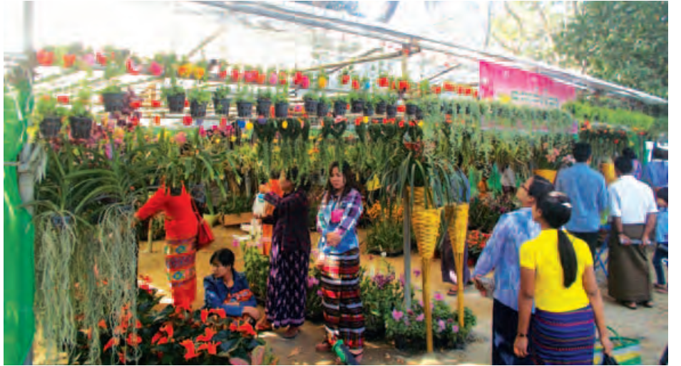
လျက်ရှိသည်။ အနည်းဆုံးသစ်ခွ ပန်းပင်တစ်ပင်လျှင် ငွေ ကျပ် ၂၅၀၀မှ အများဆုံး ငွေကျပ် ၂၅၀၀၀အထိရှိသည်။ လက်ရှိကာလ သစ်သီးဝလံပန်းမန်ပြပွဲပြိုင်ပွဲလာသူများ သည် သစ်ခွပန်းများကို ဝယ်ယူမှု များပြားလျက်ရှိကြောင်း သိရသည်။

ဖန်စီဟုခေါ်သော သစ်ခွတွင် လှပသော အဝါရောင် ကလေးများပွင့်ပြီးစိတ်ဝင်စားကြသည်။ အရောင်မျိုးစုံရှိ သော သစ်ခွများတွင်အိမ်ချိတ်ဆွဲရန် ခရမ်းစပေါပြောက် သစ်ခွအရောင်ကလေးများကို ရွေးချယ်မှုများကြသည်။ လှပသော သစ်ခွပန်းအိုးကလေးများကို အလွယ်တကူချိတ် ဆွဲနိုင်အောင် ကြေးနန်းကလေးများဖြင့် သေသပ်ကျနစွာ ပြုလုပ်ပေးထားသည်။ ဒန်ဒိုဗီယာကို ငွေကျပ် ၂၅၀၀ မှ ကျပ် ၃၀၀၀ ဝှိကာလာအရောင်သစ်ခွ၊ ကတ်ကတီးယား သစ်ခွများနှင့်အတူ အခြားသစ်ခွပန်းများကိုလည်း အပင် အနေအထားအလိုက်ဈေးနှုန်းအမျိုးမျိုးဖြင့် ရောင်းချ