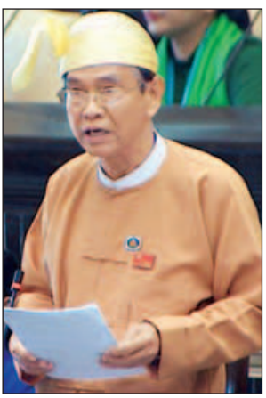
မန္တလေးတိုင်းဒေသကြီး မဲဆန္ဒနယ် အမှတ်(၃)မှ ဒေါက်တာကျော်သန်းထွန်း

ဝန်ကြီးဌာနအနေဖြင့် လေလွင့် ကလေးငယ်များလမ်းပေါ်နေ ကလေး များ၊ တောင်းရမ်း စားသောက်သူများ၊ ခိုကိုးရာမဲ့များ၊ စောင့်ရှောက်သူမဲ့ မသန်စွမ်းသူများ လျော့နည်းပပျောက် ရေးအတွက် ရှေ့ပြေးစီမံချက် ရေးဆွဲ ခဲ့ပါကြောင်း၊ ရက်(၁၀၀) စီမံချက် နောက်ပိုင်းတွင် လေလွင့်ကလေး သူငယ်များအား ကာကွယ်စောင့် ရှောက်ရေး၊ မိဘအုပ်ထိန်းသူများနှင့် ပြန်လည်ပေါင်းစည်းရေး၊ လူမှုအသိုက် အဝန်းအတွင်း ပြန်လည်ဝင်ဆံ့ရေး လုပ်ငန်းများကို ဆောင်ရွက်လျက်ရှိပါ ကြောင်း ပြည်ထောင်စုဝန်ကြီး ဒေါက်တာဝင်းမြတ်အေးက ပြောကြား သည်။