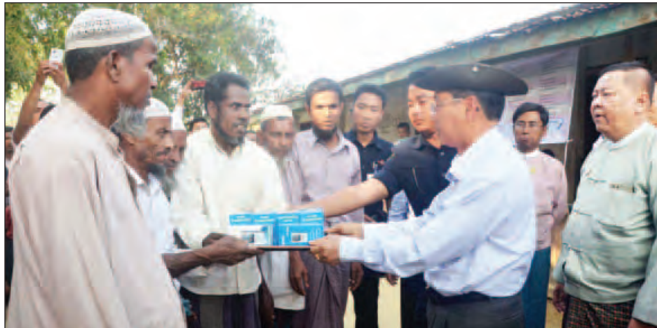
ကော်မရှင်ဥက္ကဋ္ဌ လက်ဆောင်ပေးစဉ်။ ဒုတိယသမ္မတ ဦးမြင့်ဆွေ ဦးရှည်ကျကျေးရွာမှ ရွာသားများအား ရေဒီယိုများ (သတင်းစဉ်)

ကော်မရှင်အဖွဲ့၏ ညှိနှိုင်းအစည်းအဝေး၌ မောင်တောဒေသစုံစမ်းစစ်ဆေးရေးကော်မရှင်ဥက္ကဋ္ဌ ဒုတိယသမ္မတ ဦးမြင့်ဆွေ အမှာစကားပြောကြားစဉ်။ (သတင်းစဉ်)