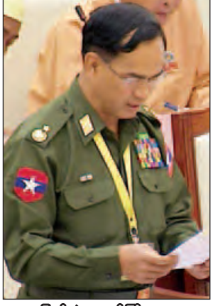
ပြည်ထောင်စုဝန်ကြီးဌာန ဒုတိယဝန်ကြီး ဗိုလ်ချုပ်အောင်စိုး

ကော်မတီမှ ကုမ္ပဏီမှတ်ပုံတင်ခြင်းလုပ်ငန်းကို စားသုံးသူရေးရာဦးစီးဌာန၊ အကောက်ခွန်ဦးစီးဌာနအပါအဝင် ဌာန (၉) ခုတို့ဖြင့် တစ်နေရာတည်းတွင် ဆောင်ရွက်ပေးနေပြီ ဖြစ်ပါကြောင်း၊ One Stop Shop ဆိုသည်မှာသက်ဆိုင်ရာ ဌာနတစ်ခုစီမှ ဝန်ထမ်းများအား ပြည်သူ့ဝန်ဆောင်မှုရုံးသို့ စေလွှတ်ပြီး ယင်းတို့၏ သက်ဆိုင်ရာဌာနတစ်စိတ်တစ်ပိုင်းအဖြစ် ကိုယ်ပိုင်ကောင်တာများကို တစ်နေရာတည်းတွင်ထားရှိပြီး ပြည်သူများ/ဝန်ဆောင်မှုရယူသူများအတွက် အချိန်ကုန် သက်သာပြီး လွယ်ကူမှု ပိုမိုရရှိစေရန် ဆောင်ရွက်ပေးသည့် လုပ်ငန်းဖြစ်ပါကြောင်း။