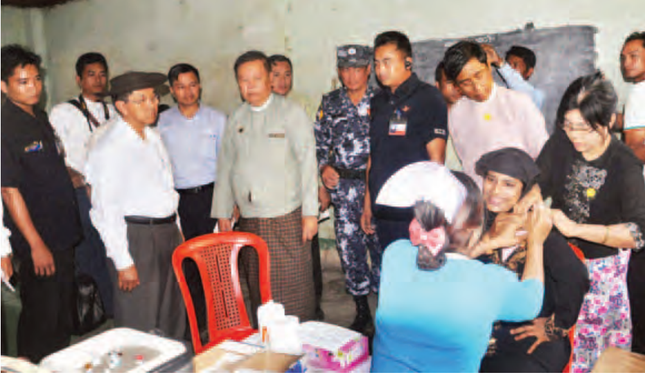
မောင်တောမြို့နယ် ဦးရှည်ကျကျေးရွာ၌ ကျန်းမာရေးစောင့်ရှောက်မှုလုပ်ငန်းများကို ကော်မရှင်ဥက္ကဋ္ဌ ဒုတိယသမ္မတ ဦးမြင့်ဆွေ ကြည့်ရှုစဉ်။ (သတင်းစဉ်)