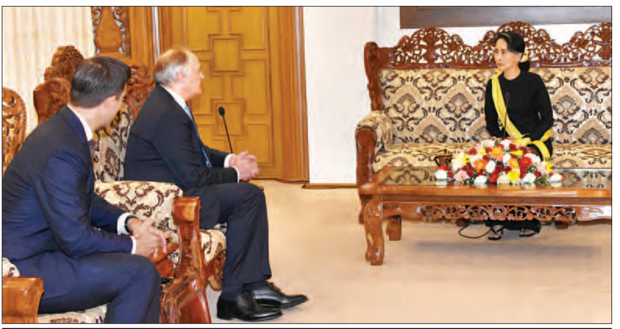
နိုင်ငံတော်၏အတိုင်ပင်ခံပုဂ္ဂိုလ် ဒေါ်အောင်ဆန်းစုကြည် Unilever ကုမ္ပဏီ၏ အမှုဆောင်အရာရှိချုပ် Mr. Paul Polman အား လက်ခံတွေ့ဆုံစဉ်။

နေပြည်တော် ဖေဖော်ဝါရီ ၁၅ နိုင်ငံတော်၏အတိုင်ပင်ခံပုဂ္ဂိုလ်၊ နိုင်ငံခြားရေးဝန်ကြီးဌာန ပြည်ထောင်စု ဝန်ကြီး ဒေါ်အောင်ဆန်းစုကြည်သည် ဗြိတိန်နိုင်ငံ Unilever ကုမ္ပဏီ၏ အမှုဆောင်အရာရှိချုပ် Mr. Paul Polman နှင့်အဖွဲ့အား ယနေ့နံနက် ၁၀ နာရီတွင် နေပြည်တော်ရှိ နိုင်ငံခြားရေးဝန်ကြီးဌာန ပြည်ထောင်စုဝန်ကြီး၏ ဧည့်ခန်းမ၌ လက်ခံတွေ့ဆုံသည်။ ဆွေးနွေး တွေ့ဆုံစဉ် မြန်မာနိုင်ငံ၌ Unilever ကုမ္ပဏီက ဆောင်ရွက်လျက်ရှိသည့် ကျန်းမာရေးအသိပညာပေးမှု၊ အလုပ်အကိုင်ဖန်တီးရေးနှင့် ရပ်ရွာအဖွဲ့အစည်း ဖွံ့ဖြိုးတိုးတက်ရေးအစီအစဉ်များနှင့် မြန်မာနိုင်ငံရှိ လယ်ယာထွက်ကုန်များ တန်ဖိုးမြှင့်ထုတ်လုပ်နိုင်ရေးကိစ္စရပ်များကို ဆွေးနွေးကြသည်။ (သတင်းစဉ်)