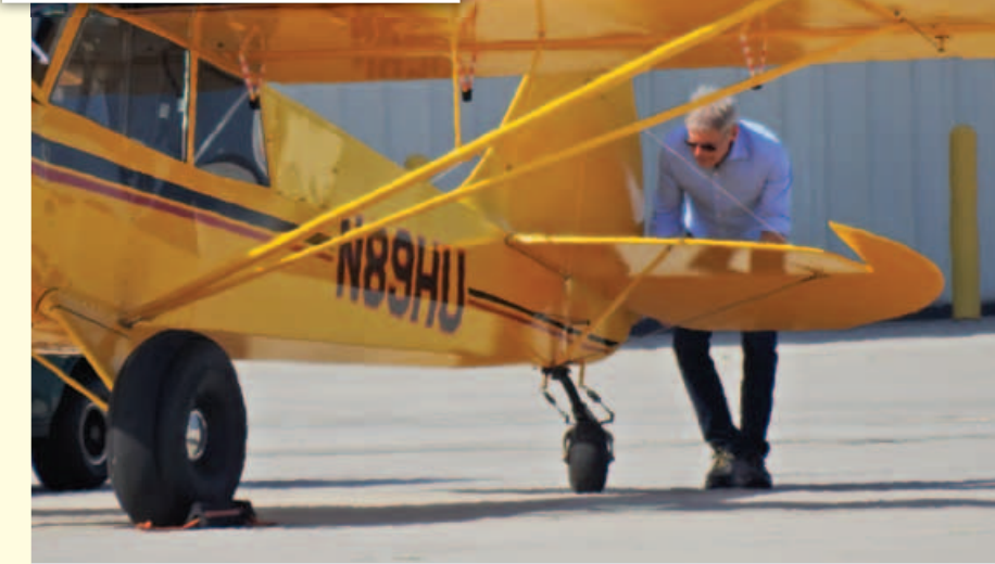
စန်တာမော်နီကာလေဆိပ်တွင် မောင်းနှင်မည့်လေယာဉ်ကို စစ်ဆေးနေသည့် ဟယ်ရီစင်ဖွဲ့နီကို တွေ့ရစဉ်။

ဟောလီဝုဒ်ရဲ့ နာမည်ကျော်မင်းသားကြီးတစ်ဦးဖြစ်တဲ့ ဟယ်ရီစင်ဖွဲ့နီဟာ ပြီးခဲ့တဲ့ ဖေဖော်ဝါရီ ၁၃ ရက်မှာ ဖြစ်ပွားခဲ့တဲ့ ယာဉ်တိုက်မှုတစ်ခုကြောင့် လတ်တလောမှာ စုံစမ်းစစ်ဆေးမှုတွေခံယူနေရကြောင်း အီးတီအွန်လိုင်းဒေါ့ကွန်းရဲ့ ဖော်ပြချက်တွေအရ သိရပါတယ်။ “Star Wars: The Force Awakens” ရုပ်ရှင်တွေရဲ့ အဓိကဇာတ်လိုက်တစ်ဦးဖြစ်တဲ့ မင်းသားကြီး ဟယ်ရီစင်ဖွဲ့နီကိုယ်တိုင်မောင်းနှင်လာခဲ့တဲ့ သူ့ရဲ့ ကိုယ်ပိုင်လေယာဉ်ဟာ လေဆိပ်ကို ဆင်းသက်ခဲ့စဉ် လေဆိပ်အတွင်းရှိနေတဲ့ ခရီးသည်တင်လေယာဉ်ကို ဝင်တိုက်မိခဲ့ရာ တစ်ဦးတစ်ယောက်မှာ ဒဏ်ရာရခဲ့ခြင်းမရှိပေမယ့် မင်းသားကြီးကတော့ စုံစမ်းစစ်ဆေးမှုတွေ ခံယူနေရကာ လတ်တလောမှာ အသက် (၇၄)နှစ်ရှိပြီဖြစ်တဲ့ ဟယ်ရီစင်ဖွဲ့နီဟာ သူ့ရဲ့ လေယာဉ် မောင်းလိုက်စင်ကို အသိမ်းခံရနိုင်ဖွယ်ရှိကြောင်း သိရပါတယ်။