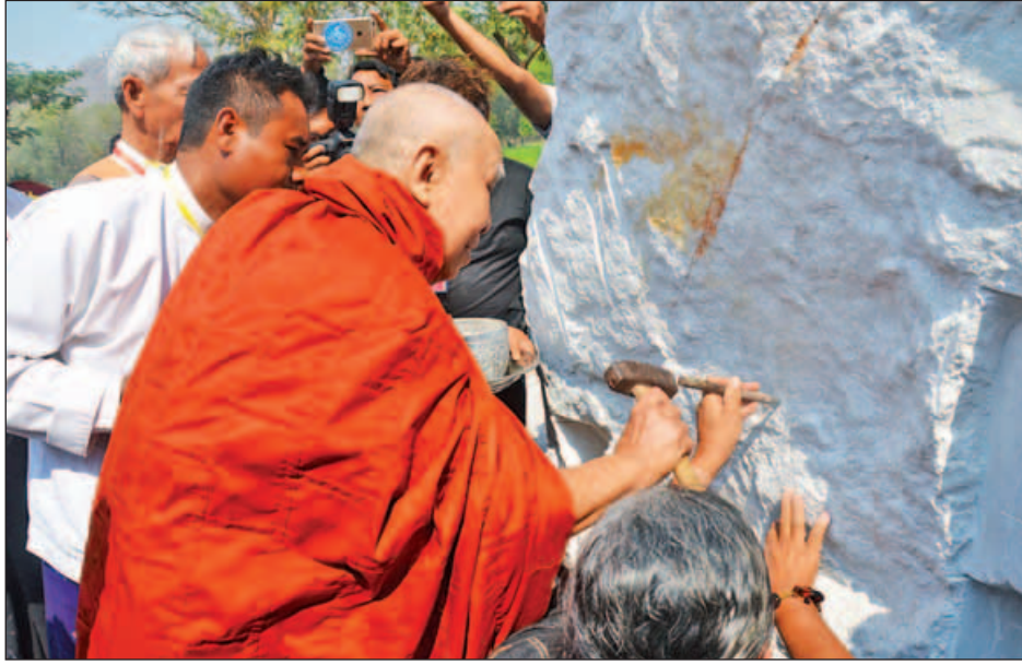
ဆောက်တည်ကြပြီး ဆရာတော်သံဃာတော်များ ရွတ်ပွား ကြသည်။ ယင်းနောက် ဖြစ်မြောက်ရေးအဖွဲ့ဥက္ကဋ္ဌ ဦးသိန်း ချီးမြှင့်သော ပရိတ်တရားတော်များကို နာယူကြည့်လို တန်က ဗိုလ်ချုပ်ပုံတူထုလုပ်ခြင်းအကြောင်း ရှင်းလင်း

ဗိုလ်ချုပ်အောင်ဆန်း (၁၀၂)နှစ်ပြည့် မွေးနေ့နှင့် ဗိုလ်ချုပ်ပုံတူ စတင်ကျောက်ရုပ်တုစတင်ထုဆစ်ခြင်း ဩဝါဒခံယူပွဲနှင့် အန္တရာယ်ကင်း ပရိတ်တရားတော်နာ အခမ်းအနားကို မဟာလောကမာရဇိန် ကုသိုလ်တော်နှင့် နန်းမြေဘုံသာစံနန်းတော်ရာ စန္ဒာမုနိဘုရား နှစ်ဆူကြား တွင် ယနေ့ နံနက်ပိုင်းကကျင်းပရာ နိုင်ငံတော် သံယမဟာ နာယကအဖွဲ့၊ ဒုတိယဥက္ကဋ္ဌ အဘိဓဇမဟာရဋ္ဌဂုရု မန္တလေးမြို့ဘုရားကြီးတိုက် ဆင်မင်းကျောင်းဆရာတော် ဘဒ္ဒန္တ ဩဘာသာဘိဝံသ၊ ရန်ကုန်မြို့ အပြည်ပြည်ဆိုင်ရာ ထေရဝါဒဗုဒ္ဓသာသနာပြုတက္ကသိုလ် ပဋိပတ္တိမဟာဌာန ပါမောက္ခ (မဟာဌာနမှူး) ဓမ္မဒူတ ဆရာတော် ဒေါက်တာ အရှင်ဆေကိန္ဒ၊ မန္တလေးမြို့ပေါ်ရှိ ကျောင်းတိုက်ကြီးများမှ ဆရာတော်ကြီးများ၊ ဗိုလ်ချုပ်အောင်ဆန်းကျောက်ဆစ် ရုပ်တုနှင့် ဝိမာန်၊ ပြည်သူ့အပန်းဖြေဥယျာဉ် တည်ဆောက် ရေးအဖွဲ့ဥက္ကဋ္ဌ ဦးသိန်းတန်နှင့် အဖွဲ့ဝင်များ၊ ရုပ်တု ထုလုပ်ရာတွင် ပါဝင်ကြမည့် ပညာရှင်များ၊ လူမှုအဖွဲ့ အစည်းများနှင့် အခြားစိတ်ဝင်စားသူများ တက်ရောက်ခဲ့ကြ သည်။