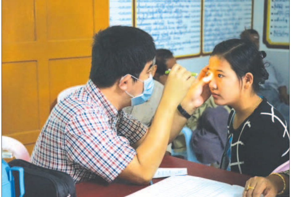
လှဝင်း(နတ်မောက်)

နတ်မောက် ဖေဖော်ဝါရီ ၁၃ မကွေးတိုင်းဒေသကြီး နတ်မောက်မြို့၌ ရန်ကုန်မြို့မှ မျက်စိအထူးကုဆရာဝန်ကြီးများ နှင့် ပညာသဟာယသင်္ဂဟအကျိုးတော် ဆောင် စေတနာအလှူရှင်လူငယ်များတို့ ပူး ပေါင်း၍ မျက်စိစမ်းသပ်ခွဲစိတ်ကုသမှုအခမဲ့ ပြုလုပ်ပေးခြင်းကို ဖေဖော်ဝါရီ ၉ ရက် နံနက် ၈ နာရီက နတ်မောက်မြို့ အောင်ဆန်းရပ် ဒီပက် ရာပရိယတ္တိစာသင်တိုက်အတွင်းရှိ သီတဂူဒီပက်ရာစကွဲဒါနဆေးရုံတော်ကြီး ၌ ပြုလုပ်ခဲ့သည်။