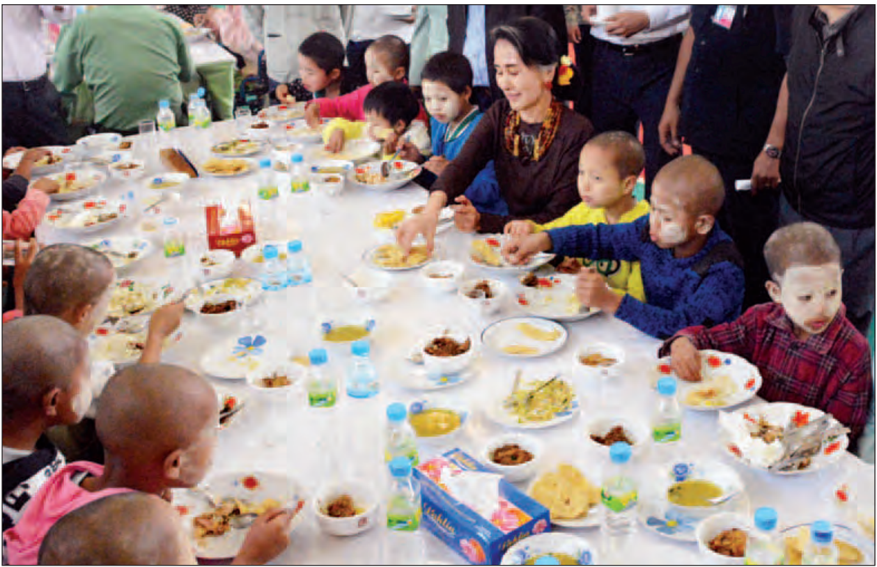
နိုင်ငံတော်၏အတိုင်ပင်ခံပုဂ္ဂိုလ်နှင့် ကလေးငယ်များ လက်ရည်တစ်ပြင်တည်း နေ့လယ်စာ သုံးဆောင်ကြစဉ်။ (သတင်းစဉ်)

ဆက်လက်၍ ရွှေဘုန်းပွင့်ဘုရားဓမ္မာရုံ၌ နိုင်ငံတော်ဩဝါဒါစရိယ စွန်းလွန်းဆရာတော် အမျိုးပြုသော ဆရာတော်၊ သံဃာတော်များထံမှ နိုင်ငံတော်၏အတိုင်ပင်ခံပုဂ္ဂိုလ်နှင့် ဧည့်ပရိသတ်များက ငါးပါးသီလခံလှူ ဆောက်တည်ကြပြီး လှူဖွယ်ပစ္စည်းများ ကပ်လှူပူဇော်၍ လှူဒါန်းမှုအစုစုတို့ အတွက် ရေစက်ချအမျှပေးဝေကြသည်။