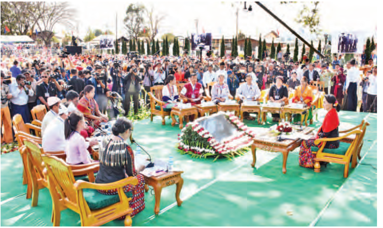
ဖေဖော်ဝါရီ ၁၂ ရက်က ရှမ်းပြည်နယ် ပင်လုံမြို့၌ နိုင်ငံတော်၏အတိုင်ပင်ခံပုဂ္ဂိုလ် ဒေါ်အောင်ဆန်းစုကြည်နှင့် တိုင်းရင်းသားများ၏စကားဝိုင်းပြုလုပ်စဉ်။ (သတင်းစဉ်)

ကျွန်မကတော့ ကရင်အမျိုးသားအဆင့် နိုင်ငံရေးဆွေးနွေးပွဲမှာ တောက်လျှောက်ပါခဲ့တယ်။ နော်ဒီးလာ(လိုင်ဇာ)မှာကတည်းက တောက်လျှောက်ပါခဲ့တဲ့ သူတစ်ယောက်အနေနဲ့ အခုကရင်အမျိုးသားအဆင့် နိုင်ငံရေးဆွေးနွေးပွဲဆိုရင် ပင်လုံကိုရောက်တာနဲ့ ပြန်ပြောင်းပြီးသတိရတာက ပင်လုံအနှစ်သာရအပြည့်နဲ့ ကျွန်မတို့လုပ်ခဲ့ကြလို့သာ အခုတစ်နိုင်ငံလုံးကလည်း ပြောနေတယ်။ ကရင်ပွဲက အရမ်းအောင်မြင်တယ်။ ကရင်ပွဲကို အားရတယ်။ ကျေနပ်တယ်ပေါ့။ တကယ်တမ်းမှာ ဘယ်လိုပုံစံမျိုးနဲ့ လုပ်ခဲ့ကြတာလဲဆိုတော့ အခက်အခဲတွေအများကြီးရှိခဲ့ကြပါတယ်။ ညှိနှိုင်းရတယ်။ ယုံယုံကြည်ကြည်နဲ့ ကိုယ့်ကိုယ်ကိုယ် အရင်စတာပေါ့။ ကိုယ့်ကိုယ်ကိုယ် အရင်ယုံကြည်ရတယ်။ ပြီးတော့မှ ကိုယ့်ရဲ့လုပ်ဖော်ကိုင်ဖက်ပေါ့။ ဒါမှမဟုတ်ရင် ပူးတွဲပြီး အလုပ်လုပ်မယ့်သူတွေကိုလည်း ယုံကြည်ရတယ်။ ပြီးတော့ ညီညီညွတ်ညွတ်နဲ့ တစ်ဦးကိုတစ်ဦး လေးစားသမှုနဲ့ သာတူညီမျှစကားတစ်ခွန်းက အမြဲတမ်းကျွန်မခေါင်းထဲမှာပေါ်နေတာက အမျိုးသားအဆင့် နိုင်ငံရေးဆွေးနွေးပွဲကို စတင်စီစဉ်တဲ့အခါမှာ ပူးတွဲလုပ်ရတဲ့ကော်မတီတွေက အများကြီးပါ။ ကရင်တွေဘက်အခြမ်းကတောင် ကရင်တိုင်းရင်းသားလက်နက်ကိုင်က သုံးဖွဲ့၊ ကရင်ပါတီက ငါးဖွဲ့၊ ဘာသာရေးခေါင်းဆောင်တွေ၊ CSO တွေ။