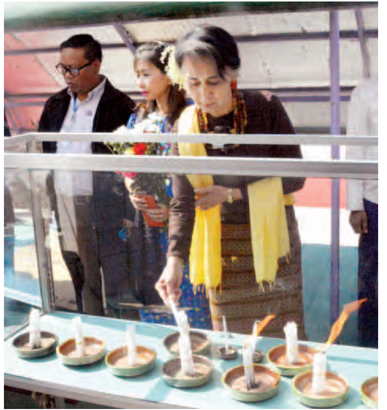
နိုင်ငံတော်၏ အတိုင်ပင်ခံပုဂ္ဂိုလ် ဒေါ်အောင်ဆန်းစုကြည် ဗိုလ်ချုပ်အောင်ဆန်း၏ မွေးနေ့နေ့ထောင့်၌ ဆီမီး ၁၀၂တိုင် ထွန်းညှိကုသိုလ်ပြုစဉ်။(သတင်းစဉ်)