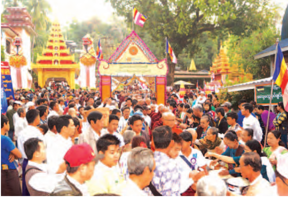
လောင်းလှူခဲ့ကြသည်။ အဆိုပါ ဗုဒ္ဓပူဇော်ယဉ်အထိမ်းအမှတ်အဖြစ် ဖေဖော်ဝါရီ ၈ ရက်မှစတင်ကာ မြသပိတ် စေတီတော်မြတ်ကြီး ရင်ပြင်တော်တွင် ဗုဒ္ဓဒေသနာတော်များကို အသံမစဲရွတ်ဆို ပူဇော်ခဲ့ကြပြီး လပြည့်နေ့ ညနေ ၄ နာရီမှစတင်၍ မြို့တွင်းရှိစေတီနာရီများက နိဗ္ဗာန်ဈေးဖြင့် တည်ခင်းကျေးဇူးက ဖေဖော်ဝါရီ ၈ ရက်မှစတင်ကာ စည်ကားစွာ ကျင်းပခဲ့ကြောင်း ဝေါပကအဖွဲ့ထံမှ သိရသည်။

သထုံ ဖေဖော်ဝါရီ ၁၃ မွန်ပြည်နယ် သထုံမြို့ မြသပိတ် တောင်ထိပ်ရှိ ဆံတော်ရှင် မြသပိတ် စေတီတော်မြတ်ကြီး၏ (၅၉) ကြိမ်မြောက် ဗုဒ္ဓပူဇော်ယဉ်နှင့် တောင်ခြေရှိ မြန်မာနိုင်ငံ၌ အကြီးဆုံးဖြစ်သော နီးဘုရားကြီး ပူဇော်ပွဲကို ဖေဖော်ဝါရီ ၁၁ ရက် (တပို့တွဲလပြည့်နေ့) နံနက်က စည်ကားစွာ ကျင်းပခဲ့သည်။ နံနက် ၅ နာရီတွင် တောင်ထိပ်ရှိ ဆံတော်ရှင် စေတီတော်မြတ်ကြီးအား သံဃာတော် ၄၅ ပါးတို့က ဗုဒ္ဓါဘိသေက အနေကဇာတင် ပူဇော်ကာ ပန်း၊ ဆီမီး၊ အမွှေးနံ့သာများနှင့် ဆွမ်းပွဲ ၁၀၀၀ ပြင် ကပ်လှူပူဇော်ကြပြီး နံနက် ၇ နာရီမှစတင်ကာ သထုံမြို့နယ်အတွင်းရှိ ကျောင်းတိုက်ပေါင်း ၁၇၄ ကျောင်းမှ သံဃာတော် ၆၀၀ ကျော်နှင့် သီလရှင်ကျောင်းတိုက် ၃၆ တိုက်မှ သီလရှင် ၈၀ ကျော်တို့အား အလှူရှင်အသီးသီးတို့က (ထမနဲ့) ဆွမ်းဆန်နှင့် လှူဖွယ်ဝတ္ထုအစုစုတို့ကို တောင်ခြေတွင် စည်ကားသိုက်မြိုက်စွာ စုပေါင်း