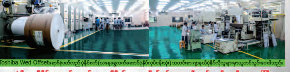
Toshiba Wed Offset ရောင်းပတ်လည် ပုံနှိပ်စက် (ယနေ့ရွှေလက်ဆောင်ပုံနှိပ်လုပ်ငန်းသုံး) သတင်းစာ၊ ဂျာနယ်ပုံနှိပ်လိုသူများ မှာယူတင်သွင်းပေးပါသည်။

ပုံပိုးကူညီနိုင်သော ဝန်ဆောင်မှုများကို မိတ်ဆွေများ စိတ်ချမ်းသာမှုရရှိသည်အထိ ကူညီပေးနေပါပြီ။