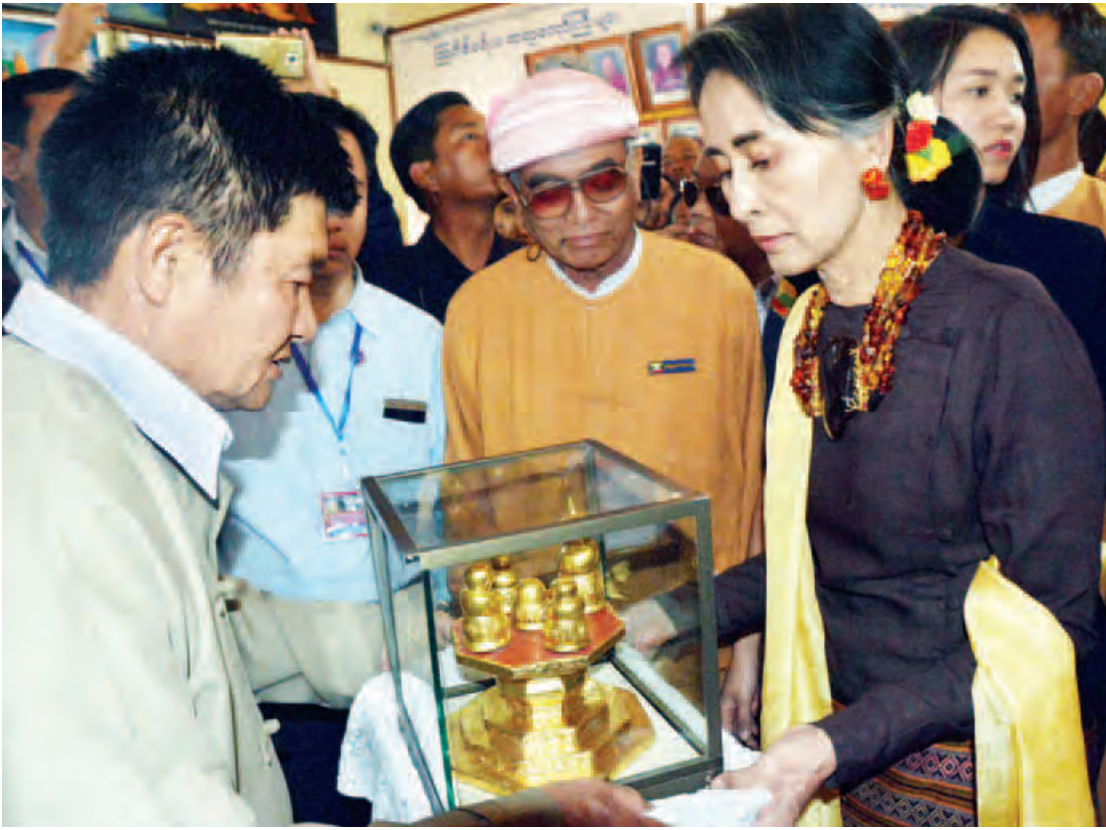
နိုင်ငံတော်၏ အတိုင်ပင်ခံပုဂ္ဂိုလ် ဒေါ်အောင်ဆန်းစုကြည်အား ဂေါပကအဖွဲ့ဝင်တစ်ဦးက အင်းလေးဖောင်တော်ဦး ဗုဒ္ဓရုပ်ပွား တော်မြတ်ပုံတူများ အမှတ်တရလက်ဆောင်ပေးအပ်စဉ်။ (သတင်းစဉ်)