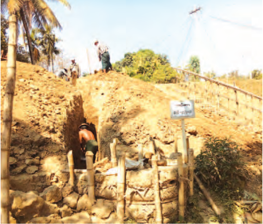
ရေယိုစိမ့်ပေါက် စုစုပေါင်း ၁၁ ပေါက် ပြုပြင်ဆောင် ရွက်ခဲ့ကြောင်း၊ အဆိုပါရေကာတာရေယိုစိမ့်ပေါက် မြေသား ပြုပြင်ခြင်းလုပ်ငန်းများအား ဖေဖော်ဝါရီ ၉ ရက်က အပြီးသတ်ဆောင်ရွက်သွားမည်ဖြစ် ကြောင်း ပြောကြားခဲ့သည်။