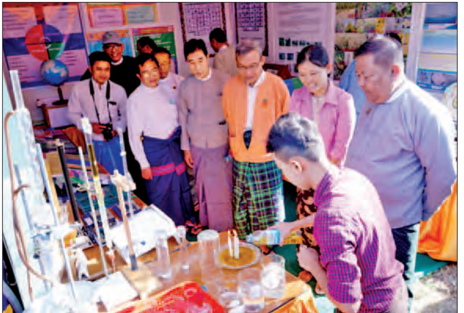
ပြည်နယ်လွှတ်တော်ဥက္ကဋ္ဌ ဦးစံကျော်လှနှင့်ဇနီး၊ ပြည်နယ် အစိုးရအဖွဲ့ဝင်ဝန်ကြီးများနှင့် ဇနီးများ၊ ပြည်နယ်၊ ခရိုင်၊ မြို့နယ်အဆင့် ဌာနဆိုင်ရာများ၊ မြို့မ မြို့ဖများ၊ သူနာပြု နှင့် သားဖွားသင်တန်းကျောင်းမှ သင်တန်းသား သင်တန်း သူများ တက်ရောက်ကြကြောင်း သိရသည်။ တင်ထွန်း(ပြန်/ဆက်)

ယနေ့ပြခန်းများဖွင့်ပွဲသို့ ပြည်နယ်ဝန်ကြီးချုပ် ဦးညီပု၊