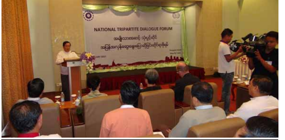
ဆဋ္ဌမအကြိမ်မြောက် အမျိုးသားအဆင့် အလုပ်သမား၊ အလုပ်ရှင်နှင့် အစိုးရကိုယ်စားလှယ်များ ပါဝင်သော သုံးပွင့်ဆိုင်ဆွေးနွေးပွဲ ဖွင့်ပွဲအခမ်းအနားတွင် ပြည်ထောင်စုဝန်ကြီး ဦးသိန်းဆွေ အဖွင့်အမှာစကားပြောကြားစဉ်။

လွတ်လပ်စွာ ဆောင်ရွက်ခွင့်ရှိသည့် အလုပ်သမားအဖွဲ့အစည်း ဥပဒေ နှင့်အညီ အလုပ်သမားအဖွဲ့အစည်း များ စနစ်တကျ ဖွဲ့စည်းဆောင်ရွက် နေပြီဖြစ်ပါကြောင်း၊ အလုပ်ရှင်၊ အလုပ်သမား အငြင်းပွားမှုများ ဖြစ်ပေါ်ခဲ့ပါက မျှတစွာဖြေရှင်း ဆောင်ရွက်ပေးနိုင်ရန် အလုပ်သမား ရေးရာအငြင်းပွားမှု ဖြေရှင်းရေးဥပဒေ ကိုလည်း အတည်ပြုပြဋ္ဌာန်းထားပြီး ဖြစ်ပါကြောင်း၊ နိုင်ငံတော်ဖွံ့ဖြိုး