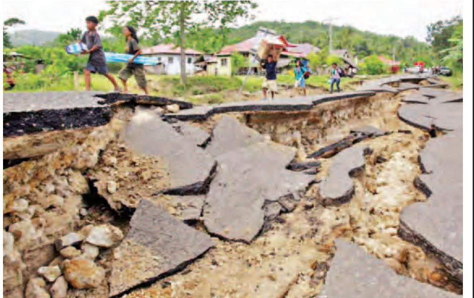
ဒဏ်ကြောင့် လှုပ်ခတ်ခတ်အားပြတ်တောက်မှုများဖြစ်ပွားခဲ့ကာ ယင်းမြို့ရှိ လေဆိပ်၏ လေယာဉ်ပြေးလမ်းများ၊