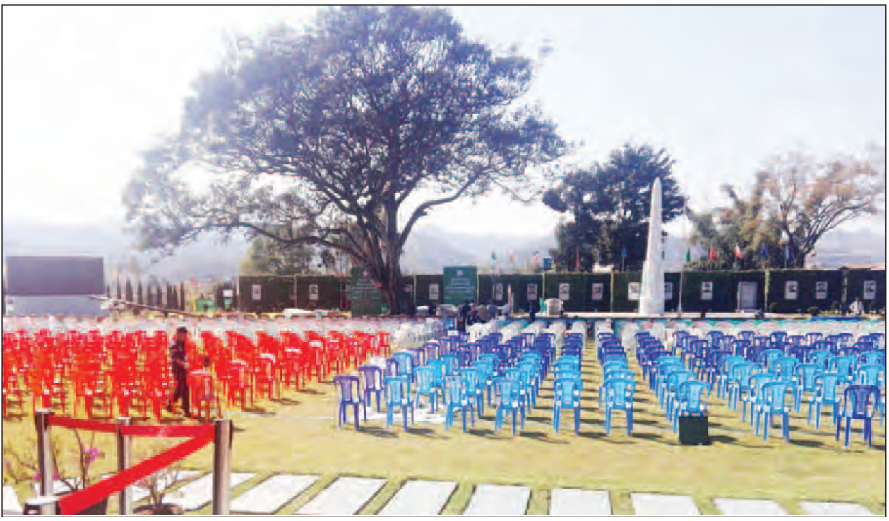
ပင်လုံကျောက်တိုင်ကွင်း၌ ကျင်းပမည့် နှစ်(၇၀)မြောက် ပြည်ထောင်စုနေ့အခမ်းအနား ပြင်ဆင်ထားမှုကို တွေ့ရစဉ်။