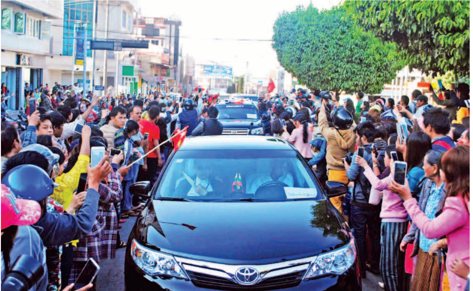
ရှမ်းပြည်နယ် ပင်လုံမြို့၌ ကျင်းပမည့် နှစ်(၇၀)မြောက် ပြည်ထောင်စုနေ့အခမ်းအနားနှင့် ငြိမ်းချမ်းရေးစကားပိုင်းတို့သို့ တက်ရောက်ရန် နိုင်ငံတော်၏ အတိုင်ပင်ခံပုဂ္ဂိုလ် ဒေါ်အောင်ဆန်းစုကြည် ဟဲဟိုးလေဆိပ်မှ တောင်ကြီးမြို့သို့ မော်တော်ယာဉ်များဖြင့် ရောက်ရှိလာရာ မြို့သူ မြို့သားများက သောင်းသောင်းဖြူဖြူဆိုကြပါသည်။ (သတင်းစဉ်)

တောင်ကြီး ဖေဖော်ဝါရီ ၁၁ ရှမ်းပြည်နယ် ပင်လုံမြို့၌ ကျင်းပမည့် နှစ်(၇၀)မြောက် ပြည်ထောင်စုနေ့ အခမ်းအနားနှင့် ငြိမ်းချမ်းရေးစကားပိုင်း တို့သို့ တက်ရောက်ရန် နိုင်ငံတော်၏ အတိုင်ပင်ခံပုဂ္ဂိုလ် ဒေါ်အောင်ဆန်းစုကြည်သည် ယနေ့ မွန်းလွဲပိုင်းတွင် နေပြည်တော်မှ ရှမ်းပြည်နယ်တောင်ပိုင်း ဟဲဟိုးမြို့သို့ လေကြောင်းခရီးဖြင့် ရောက်ရှိသည်။ နိုင်ငံတော်၏ အတိုင်ပင်ခံပုဂ္ဂိုလ် ဒေါ်အောင်ဆန်းစုကြည်အား ရှမ်းပြည်နယ်ဝန်ကြီးချုပ် ဒေါက်တာ လင်းထွဋ်၊ ပြည်နယ်လွှတ်တော် ဥက္ကဋ္ဌ ဦးစိုင်းလုံးဆိုင်၊ ပြည်နယ်ဝန်ကြီးများ၊ လွှတ်တော်ကိုယ်စားလှယ်များနှင့် ဌာနဆိုင်ရာတာဝန်ရှိသူများက ဟဲဟိုး လေဆိပ်၌ ကြိုဆိုနှုတ်ဆက်ကြသည်။ နိုင်ငံတော်၏ အတိုင်ပင်ခံပုဂ္ဂိုလ်သည် ပြည်ထောင်စုဝန်ကြီး ဒုတိယ ဗိုလ်ချုပ်ကြီး ကျော်ဆွေ၊ ဒုတိယ ဗိုလ်ချုပ်ကြီး ရဲအောင်၊ ဒေါက်တာ ဖေမြင့်၊ ဒေါက်တာဝင်းမြတ်အေး၊ ငြိမ်းချမ်းရေးကော်မရှင် ဥက္ကဋ္ဌ ဒေါက်တာ တင်မျိုးဝင်း၊ ကာကွယ်ရေး ဝန်ကြီးဌာနမှ ဒုတိယဗိုလ်ချုပ်ကြီး ရာပြည့်၊ ပြည်နယ်ဝန်ကြီးချုပ် ဒေါက်တာလင်းထွဋ်၊ ဒုတိယဝန်ကြီး များနှင့်အတူ ဖေဖော်ဝါရီ ၁၂ ရက် တွင် ရှမ်းပြည်နယ် ပင်လုံမြို့၌ ကျင်းပမည့် ပြည်ထောင်စုနေ့အခမ်းအနားကို ဆက်လက် တက်ရောက်မည်ဖြစ် သည်။ (သတင်းစဉ်)