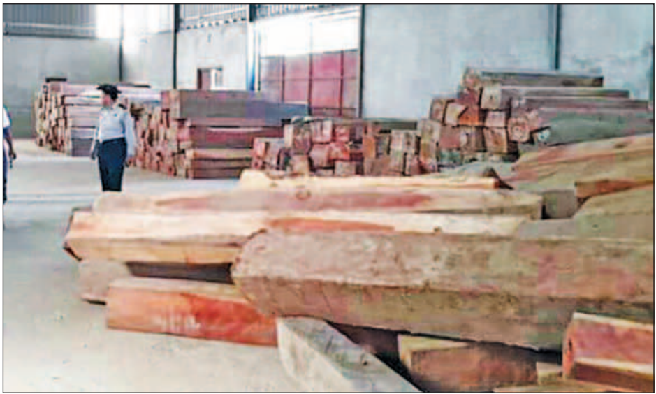
ဒဂုံမြို့သစ်အရှေ့ပိုင်းမှ သိမ်းဆည်းရမိသည့် သစ်တုံးများအား တွေ့ရစဉ်။

“ဆိပ်ကမ်းမှာဖမ်းမိတဲ့ သတင်းကွင်းဆက်တွေကို