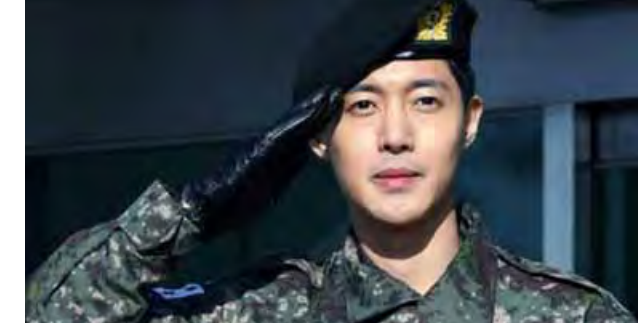
အေးပြည့်-စုစည်းသည်

ကမ်ဟွန်ဂျွန်းဟာ စစ်မှုထမ်းမိကာ လူမှုရေးပြဿနာကြောင့် တရားရင်ဆိုင် ခဲ့ရကာ အဆိုပါဖြစ်ရပ်ကြောင့် သူ့ရဲ့ ရှေ့ဆက်ရမယ့် အနုပညာခရီးအတွက် စိုးရိမ်မှုတွေရှိနေခဲ့တာလည်း ဖြစ်ပါတယ်။