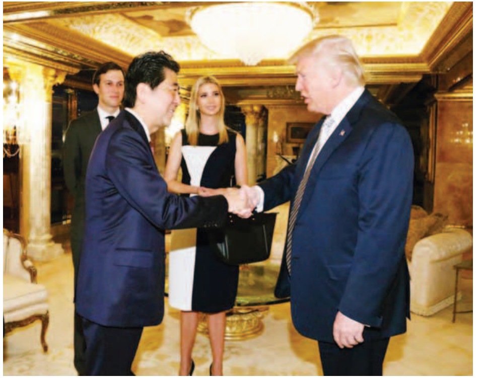
နှစ်နိုင်ငံဒေသတွင်းနှင့် ကမ္ဘာလုံးဆိုင်ရာ စီးပွားရေး ဖွံ့ဖြိုးတိုးတက်ရေးအတွက် ဘဏ္ဍာရေး၊ ငွေကြေးကဏ္ဍနှင့် ဖွဲ့စည်းတည်ဆောက်ပုံဆိုင်ရာ မူဝါဒများအပေါ် ကိုင်တွယ်ဖြေရှင်းရာတွင် အကျိုးဖြစ်ထွန်းစေမည့် နည်းလမ်းများကို ချဲ့ထွင်သွားမည်ဖြစ်ကြောင်း ခေါင်းဆောင်နှစ်ဦးက သဘောတူညီခဲ့ကြသည်။ ထို့ပြင် နှစ်နိုင်ငံစီးပွားရေးအကျိုးရလဒ်များ ထွက်ပေါ်

ပြုယမ်း၏ နျူကလီးယားခုံးလက်နက်ဖွံ့ဖြိုးရေးအစီအစဉ်များကို ရပ်တန့်နိုင်ရန် ခေါင်းဆောင်နှစ်ဦးက မြောက်ကိုရီးယားအား တိုက်တွန်းပြောကြားခဲ့သည်။