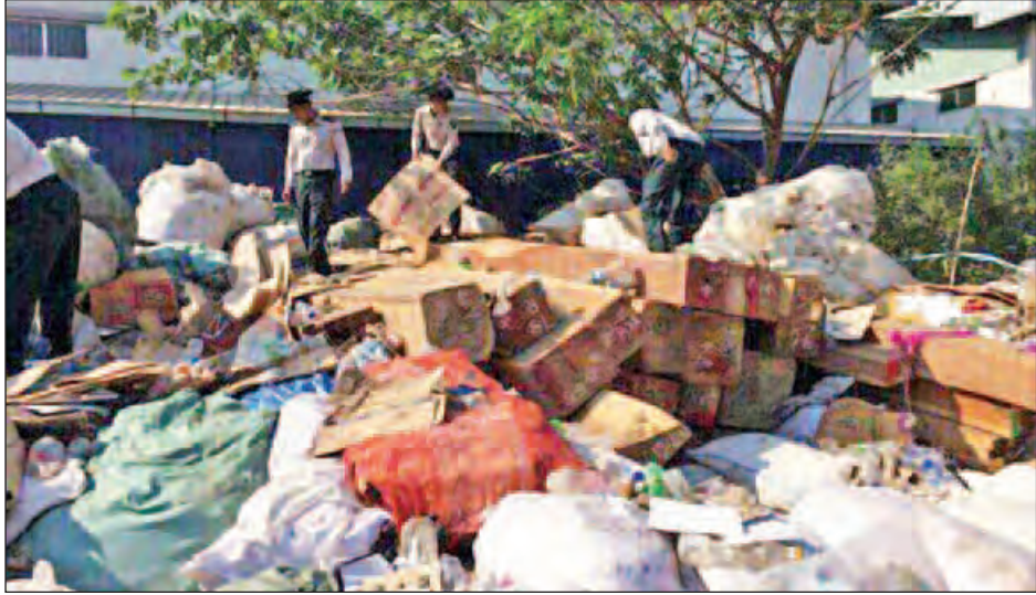
ဒဂုံမြို့သစ်တောင်ပိုင်းမှ သိမ်းဆည်းရမိသည့် ဖုံးအုပ်ကွယ်ဝှက်ထားသော သစ်တုံးများအား တွေ့ရစဉ်။