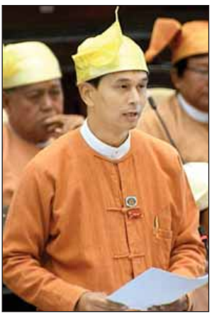
ဦးမောင်ကျော်စံ

DELCO ကုမ္ပဏီ၏ မြစ်မြောက် နိုင်ငံစွမ်း အကြိုလေ့လာမှု အစီရင် ခံစာအရ ကံပေါက်သတ္တုတွင်းဧရိယာ တွင် ခဲမပြု၊ အပြိုက်နက်နှင့် ရောရာ သတ္တုစုစုပေါင်း ၂၁၆၀၀ မက်ထရစ် တန် ကျန်ရှိနေသည်ကို စမ်းသပ် တိုင်းတာတွေ့ရှိရကြောင်း သယ်ယူပို့ ဆောင်ရွက်ရေးဝန်ကြီးဌာန ပြည်ထောင်စုဝန်ကြီး ဦးအုန်းဝင်းက ပြောကြားသည်။