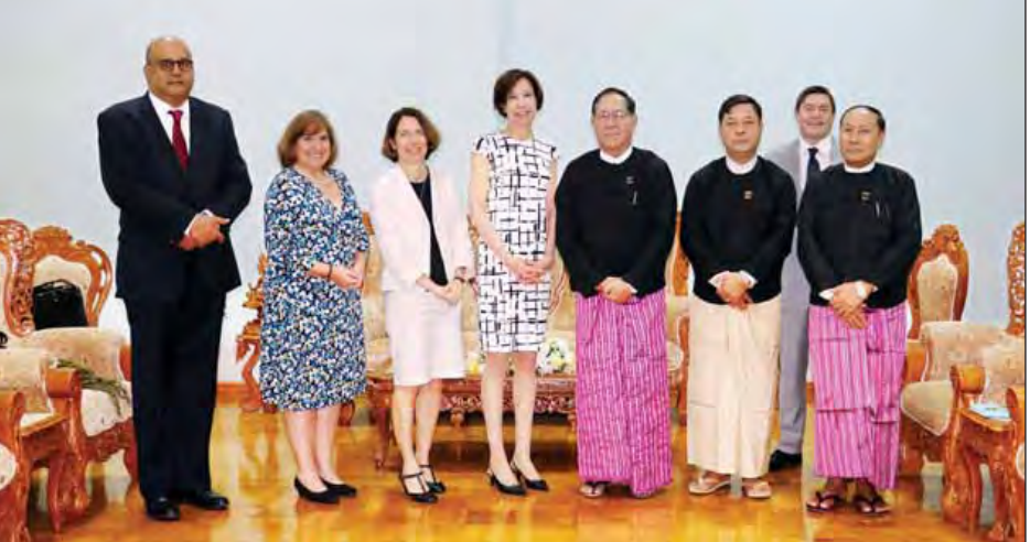
ပြည်ထောင်စုတရားသူကြီးချုပ် ဦးထွန်းထွန်းဦးနှင့် The United States Court of Appeals for the Fourth Circuit မှ တရားသူကြီး The Hon. Allyson K. Duncan တို့ မှတ်တမ်းတင်ဓာတ်ပုံရိုက်ကြစဉ်။ (သတင်းစဉ်)

ပြည်ထောင်စုတရားသူကြီးချုပ် ဦးထွန်းထွန်းဦးသည် The United States Court of Appeals for the Fourth Circuit မှ တရားသူကြီး The Hon. Allyson K. Duncan အား ယနေ့ နံနက် ၉ နာရီခွဲတွင် နေပြည်တော်ရှိ ပြည်ထောင်စုတရားလွှတ်တော်ချုပ် ဧည့်ခန်းမ၌ လက်ခံတွေ့ဆုံသည်။ ယင်းသို့တွေ့ဆုံစဉ် ပြည်ထောင်စုတရားလွှတ်တော်ချုပ်နှင့် USAID တို့အကြား ပူးပေါင်းဆောင်ရွက်လျက်ရှိသည့် လုပ်ငန်းများနှင့် အမေရိကန်ပြည်ထောင်စုနှင့် ပြည်ထောင်စုသမ္မတမြန်မာနိုင်ငံတော်တို့အကြား တရားစီရင်ရေး ပူးပေါင်းဆောင်ရွက်မှု တို့နှင့်စပ်လျဉ်း၍ ရင်းနှီးပွင့်လင်းစွာ ဆွေးနွေးကြသည်။ အဆိုပါတွေ့ဆုံပွဲသို့ ပြည်ထောင်စုတရားသူကြီးချုပ်နှင့် အတူ ပြည်ထောင်စု တရားလွှတ်တော်ချုပ် တရားသူကြီး ဦးသာဌေး၊ ဦးမြင့်အောင်နှင့် တာဝန်ရှိသူများ တက်ရောက်ကြသည်။ (သတင်းစဉ်)