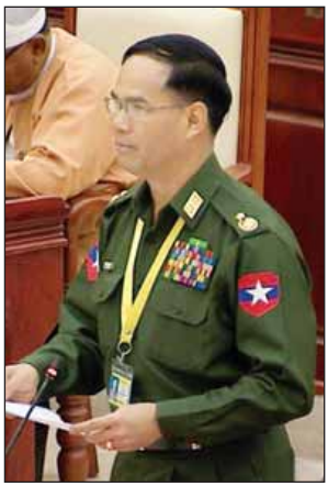
ဒုတိယဝန်ကြီး ဗိုလ်ချုပ်အောင်စိုး

ရွှေကျင်ခြင်း၊ ရွှေသတ္တုတူးဖော်ခြင်း သို့မဟုတ် သယ်ယူပို့ဆောင်ရေး ဖြစ်ပေါ်မှု ဟု ပြဋ္ဌာန်းထားရှိပြီး ကျူးလွန်ပါက ယင်းဥပဒေပုဒ်မ ၂၆ အရ ၂ နှစ်ထက် မပိုသော ထောင်ဒဏ်ဖြစ်စေ၊ ကျပ်သုံးသောင်းထက်မပိုသော ငွေဒဏ်ဖြစ်စေ၊ ဒဏ်နှစ်ရပ်လုံးဖြစ်စေ ချမှတ်နိုင်သည်ဟု ပြဋ္ဌာန်းထားပါကြောင်း။