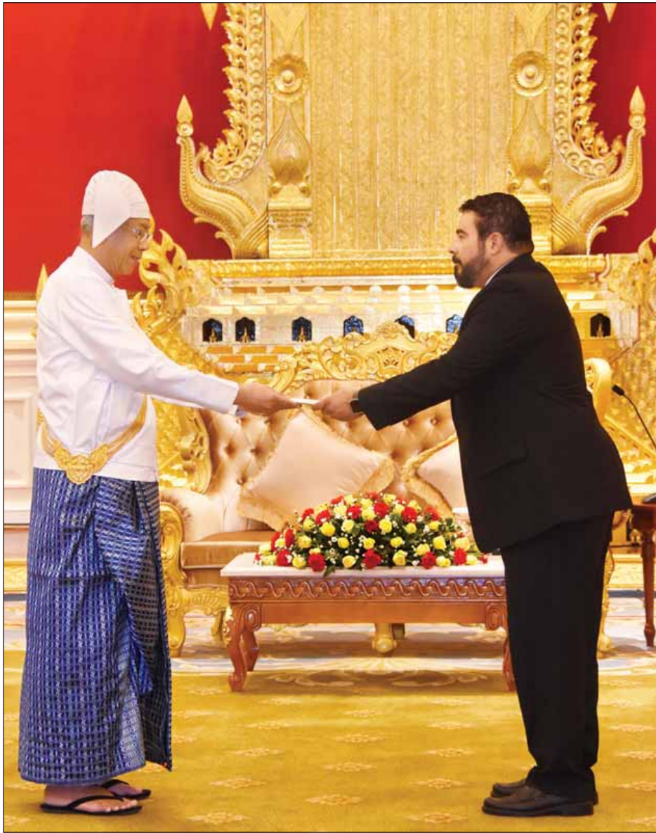
နိုင်ငံတော်သမ္မတ ဦးထင်ကျော်ထံ ပန်းမားသမ္မတနိုင်ငံ သံအမတ်ကြီး မစ္စတာ ဆာဗီအို ဆောင် ဆစ်မူဒီအို ဘီသန် ကော့စ် ၎င်း၏သံအမတ်ခန့်အပ်လွှာကို ပေးအပ်စဉ်။ (သတင်းစဉ်)