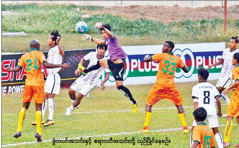
ဇွဲကပင်အသင်းနှင့် ဧရာဝတီအသင်းတို့ ယှဉ်ပြိုင်နေစဉ်။

၂၀၁၇ ခုနှစ်၊ တက္ကသိုလ်ဝင် စာမေးပွဲ ဘောဂဗေဒ ဘာသာရပ်ဆိုင်ရာ အထောက်အကူပြု သင်ခန်းစာ အချုပ်ပိုမိုရို