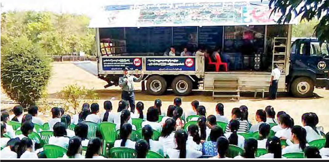
မြန်မာ့အသံပညာပေးပြခန်းယာဉ်ဖြင့် မုဒုံမြို့နယ် ကွမ်လှကျေးရွာ အထက(ခွဲ)ကျောင်းရှေ့တွင် အသံပညာပေးဟောပြောဆောင်ရွက်နေစဉ်။