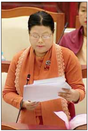
ဒေါ်မြခင်မြအောင်

ရွှေတောင်မဲဆန္ဒနယ်မှ လွှတ်တော်ကိုယ်စားလှယ် ဒေါ်မြခင်မြအောင်၏ ရွှေတောင်မြို့နယ်အပါအဝင် ဧရာဝတီမြစ်ကြောင်းတစ်လျှောက် မြစ်အတွင်း ပြုလုပ်နေသော မြစ်ကျောက်လုပ်ငန်းများမှာ ရေအရင်းအမြစ်နှင့် မြစ်ချောင်း များ ဖွံ့ဖြိုးတိုးတက်ရေးဦးစီးဌာနမှ ချမှတ်ထားသော ဥပဒေစည်းကမ်းချက်များ နှင့်အညီ ဆောင်ရွက်ရန် ပြည်ထဲရေးဝန်ကြီးဌာနအောက်ရှိ အထွေထွေအုပ်ချုပ် ရေးဦးစီးဌာနနှင့် မြန်မာနိုင်ငံရဲတပ်ဖွဲ့မှ ပူးပေါင်းဆောင်ရွက်ပေးရန် အစီအစဉ် ရှိ၊ မရှိ မေးခွန်းကို ဒုတိယဝန်ကြီး ဗိုလ်ချုပ်အောင်စိုးက ရေအရင်းအမြစ်နှင့် မြစ်ချောင်းများထိန်းသိမ်းရေး ဥပဒေပုဒ်မ ၁၃ တွင် မည်သူမျှ မြစ်ချောင်းနယ်၊ တမ်းပါးနယ်နှင့် တမ်းနားနယ်တို့တွင် ဦးစီးဌာန၏ ထောက်ခံချက်မရှိဘဲ စီးပွားရေးအလို့ငှာ သဲစုပ်ခြင်း၊ သဲတူးခြင်း၊ သဲကျွန်းခြင်း၊ မြစ်ကျောက်ထုတ်ခြင်း၊