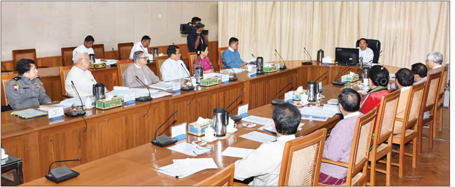
မောင်တောဒေသ စုံစမ်းစစ်ဆေးရေးကော်မရှင်အစည်းအဝေး (၄/၂၀၁၇)တွင် ကော်မရှင်ဥက္ကဋ္ဌ ဒုတိယသမ္မတ ဦးမြင့်ဆွေ အမှာစကားပြောကြားစဉ်။ (သတင်းစဉ်)

အစည်းအဝေးတွင် ဒုတိယသမ္မတက ကုလသမဂ္ဂလူ့အခွင့်အရေးဆိုင်ရာ မဟာမင်းကြီးရုံး (OHCHR) အဖွဲ့က ရခိုင်ပြည်နယ် မြောက်ပိုင်း၌ လူ့အခွင့်အရေးအခြေအနေများနှင့်စပ်လျဉ်း၍ အစီရင်ခံစာ တစ်ရပ်ကို ၃-၂-၂၀၁၇ ရက်၌ ထုတ်ပြန်ခဲ့ပါကြောင်း၊ ယင်းအစီရင်ခံစာပါအချက်အလက်များနှင့် စွပ်စွဲချက်များအနက် မိမိတို့အလေးထား စုံစမ်းစာမျက်နှာ ၇ ကော်လံ ၄ သို့