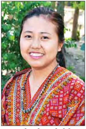
မဟင်္ဂလာရီအေရမ်နွန်ပါး (ချင်းပြည်နယ်)