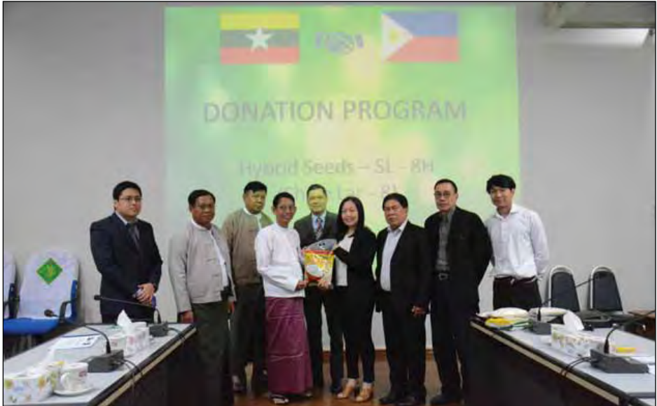
နေပြည်တော်၊ မန္တလေး၊ မကွေး၊ စစ်ကိုင်းတိုင်းဒေသကြီးများတွင် စုစုပေါင်း ဧက ၆၀၀၀ စိုက်ပျိုးရန် စပ်မျိုးစပါးမျိုးစေ့ ကိုလိုဂရမ် ၆၀၀၀၀ ကို ဖိလစ်ပိုင်နိုင်ငံ Waterstone Co., Ltd. မှ လှူဒါန်းစဉ်။

နေပြည်တော် ဖေဖော်ဝါရီ ၈ စိုက်ပျိုးရေး၊ မွေးမြူရေးနှင့် ဆည်မြောင်း ဝန်ကြီးဌာန ပြည်ထောင်စုဝန်ကြီး ဒေါက်တာအောင်သူသည် ယမန်နေ့ နံနက် ၁၀ နာရီက ဖိလစ်ပိုင်နိုင်ငံ Waterstone Co., Ltd. ဥက္ကဋ္ဌ Mr. Norberto Ong ဦးဆောင်သော စပ်မျိုးစပါးမျိုးစေ့ထုတ် ပညာရှင်များအား ပြည်ထောင်စုဝန်ကြီးရုံး အစည်းအဝေးခန်းမ၌ တွေ့ဆုံ၍ စပ်မျိုးစပါး စိုက်ပျိုးထုတ်လုပ်ရေး ဆိုင်ရာများ ဆွေးနွေးသည်။ ဖိလစ်ပိုင်နိုင်ငံ SL Agritech ကော်ပိုရေးရှင်းနှင့် မြန်မာနိုင်ငံမှ ပင်လယ်ကွီးသွယ်ရောင်းဝယ်ရေး ကုမ္ပဏီတို့ပူးပေါင်း၍ စပ်မျိုးစပါးမျိုးစေ့ ထုတ်လုပ်ခြင်းဆိုင်ရာကိစ္စရပ်များကို ဖိလစ်ပိုင်နိုင်ငံ Waterstone Co., Ltd. ဥက္ကဋ္ဌ Mr. Norberto Ong ဦးဆောင်သော စပ်မျိုးစပါးမျိုးစေ့ထုတ် ပညာရှင်များက ရှင်းလင်းတင်ပြကြရာ ပြည်ထောင်စုဝန်ကြီးက မြန်မာနိုင်ငံ၏ ရေမြေရာသီဥတုနှင့်ကိုက်ညီ၍ တောင်သူလယ်သမားများ၏ ဝင်ငွေနှင့် အကျိုးစီးပွားဖြစ်ထွန်းစေမည့် အရည်အသွေးကောင်းသော စပ်မျိုး