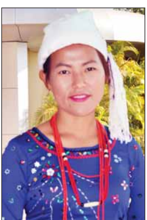
မအရူး (ကချင်ပြည်နယ်)