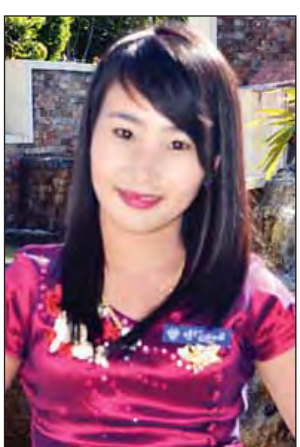
မအေးနှင်းနှင်းစိုး (ရခိုင်ပြည်နယ်)