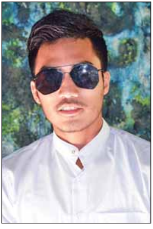
ကိုလင်းစိုး (ကချင်ပြည်နယ်)