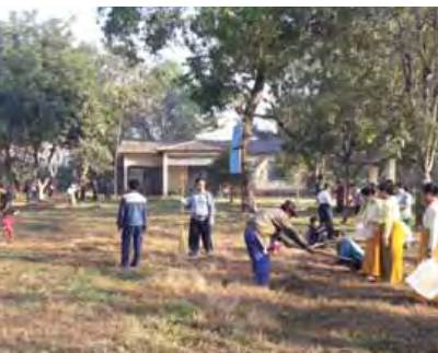
ရေတာရှည်မြို့နယ်/ဆက်

မြန်မာနိုင်ငံရဲတပ်ဖွဲ့ဝင်များ၊ အခြေခံပညာ ကျောင်းများမှ ဆရာ၊ ဆရာမများနှင့် ကျောင်းသား၊ ကျောင်းသူများ၊ အရပ်ဘက် လူမှုအဖွဲ့အစည်းများနှင့် ပြည်သူလူထုတို့ ပူးပေါင်းပါဝင်ခဲ့ကြကာ အမှိုက်သိမ်းယာဉ် နှစ်စီးဖြင့် ပြည်သူ့ဆေးရုံအတွင်း၊ အောင်မင်း ခေါင်ဘုရားအတွင်းနှင့် မင်္ဂလာကန်တော်ရှိ အမှိုက်များကို စုပေါင်းပတ်ဝန်းကျင် သန့်ရှင်း ရေးဆောင်ရွက်ခဲ့ကြကြောင်း သိရသည်။