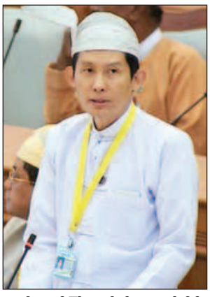
ဒုတိယဝန်ကြီး ဒေါက်တာထွန်းနိုင်