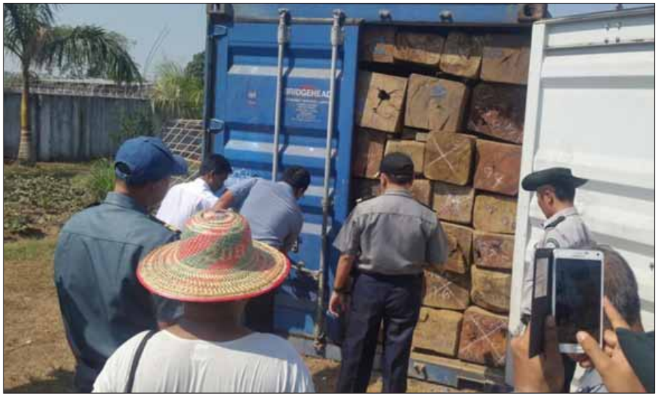
ရန်ကုန်တိုင်းဒေသကြီး မင်္ဂလာဒုံမြို့နယ် ပုလဲမြို့သစ် စကားဝါလမ်းတွင် သိမ်းဆည်းရမိသောသစ်များကို တွေ့ရစဉ်။

အဲဒီထောက်ခံချက်ရသွားပြီဆိုရင် နိုင်ငံခြားတင်ပို့ဖို့ ကုန်သွယ်ရေးညွှန်ကြားမှုဦးစီးဌာနမှာ သစ်တောက ထုတ်ပေးလိုက်တဲ့ တရားဝင်သစ်ဖြစ်ကြောင်း ထောက်ခံ ချက်ကိုတိုင်ပြီး export လိုင်စင်လျှောက်ရတယ်။ ပြီးရင် အကောက်ခွန်မှာ ထုတ်ကုန်ကြေညာလွှာ လျှောက်ရတယ်။ သစ်တောက ထောက်ခံချက်ပေးလိုက်တဲ့ သစ်တွေကို ကုန်သေတ္တာထည့်ပါတော့မယ်ဆိုပြီး ပြည်ပပို့ သစ်တော ထွက်ပစ္စည်းများ စိစစ်ထောက်ခံရေးအဖွဲ့ရုံးကို ကုန်သေတ္တာ ထည့်သွင်းခွင့် ထပ်မံလျှောက်ထားရပါတယ်။ အဲဒီလို လျှောက်ထားရာမှာ ကုမ္ပဏီရဲ့ MD (သို့မဟုတ် ) GM တစ်ဦးဦးရဲ့ ကုန်သေတ္တာထည့်သွင်းခွင့်လျှောက်လွှာ၊ အရင် ထုတ်ပေးထားတဲ့ တရားဝင်သစ်တောထွက်ပစ္စည်းမှန်ကန် ကြောင်း ထောက်ခံချက်ပြန်ယူလာရမယ်။ အဲဒီလျှောက်