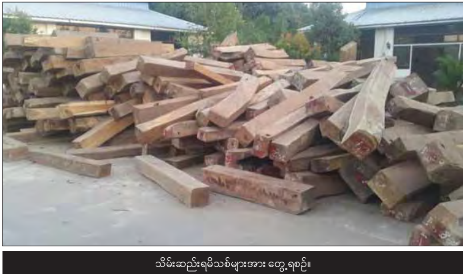
သိမ်းဆည်းရမိသစ်များအား တွေ့ရစဉ်။