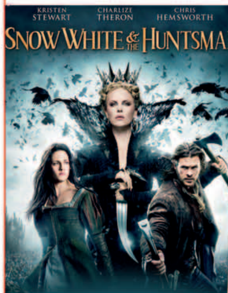
Snow White and The Huntsman (3.2.17) 5:00 PM