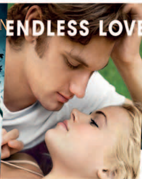
Endless Love (4.2.17) 5:20 PM