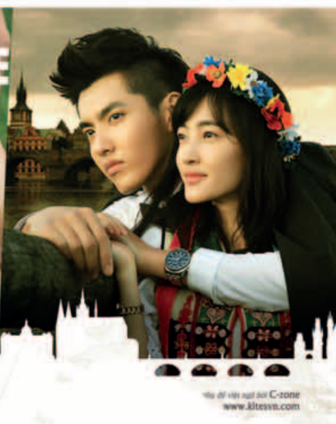
Somewhere Only We Know (5.2.2017) 7:00 PM