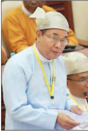
ပြည်ထောင်စုဝန်ကြီး ဦးအုန်းဝင်း

ဖောင်းပြင်မဲဆန္ဒနယ်မှ လွှတ်တော်ကိုယ်စားလှယ် ဦးထွန်းဝေ၏ တရားဝင်သစ်စက်နှင့် သစ်ဆိုင်မရှိသော မြို့ငယ်များတွင် ကျွန်းနှင့် သစ်မာများကို ပြည်သူများ တရားဝင်သုံးစွဲခွင့်ရရန် မည်သည့်မူဝါဒများ ချမှတ်၍ မည်သို့အကောင်အထည်ဖော်ပေးမည်နှင့် ပြည်ပပို့ကုန်အတွက် စဉ်ဆက်မပြတ် ထုတ်လုပ်နိုင်ရန် စီမံထားသော သစ်တောများ ပြုစုပျိုးထောင်ရန်အစီအစဉ် ရှိ မရှိ မေးခွန်းအား ပြည်ထောင်စုဝန်ကြီး ဦးအုန်းဝင်းက ဝန်ကြီးဌာနအနေဖြင့် ကျွန်းနှင့်သစ်မာများကို ပြည်သူများ တရားဝင်သုံးစွဲခွင့်ရရှိရေးအတွက် မြန်မာ့သစ်လုပ်ငန်း၊ ပြည်တွင်းရောင်းသစ်စက်များမှ ရောင်းချခြင်းနှင့် သစ်တောဦးစီးဌာနရှိ ပုံစံ(၈)ဝင် သစ်များအား ဒေသဖွံ့ဖြိုးရေးနှင့် တည်ဆောက်ရေး