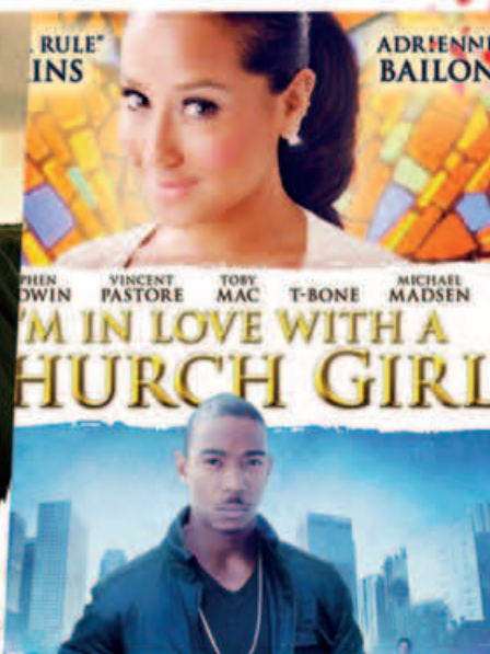
I'm in Love with a Church Girl (8.2.2017) 5:00 PM

4TV HD Receiver ကို ဝယ်ယူတပ်ဆင်လိုပါက 01-230 6166 ကို ဖုန်းလေး ဆက်လိုက်ပါနော်