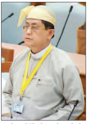
ဒုတိယဝန်ကြီး ဦးမောင်မောင်ဝင်း

တစ်နှစ်လျှင် နှစ်ကြိမ်ပေးဆပ်ရမည် ဖြစ်ပါကြောင်း၊ ယခုချေးငွေအား သက်သာသော ချေးငွေ ဟုတ် မဟုတ် ဆန်းစစ်ရာတွင် Grant Element ၆၉ ဒသမ ၂၀ ရာခိုင်နှုန်းရရှိသဖြင့် သက်သာသောချေးငွေ ဖြစ်ပါကြောင်း ရှင်းလင်းတင်ပြသည်။