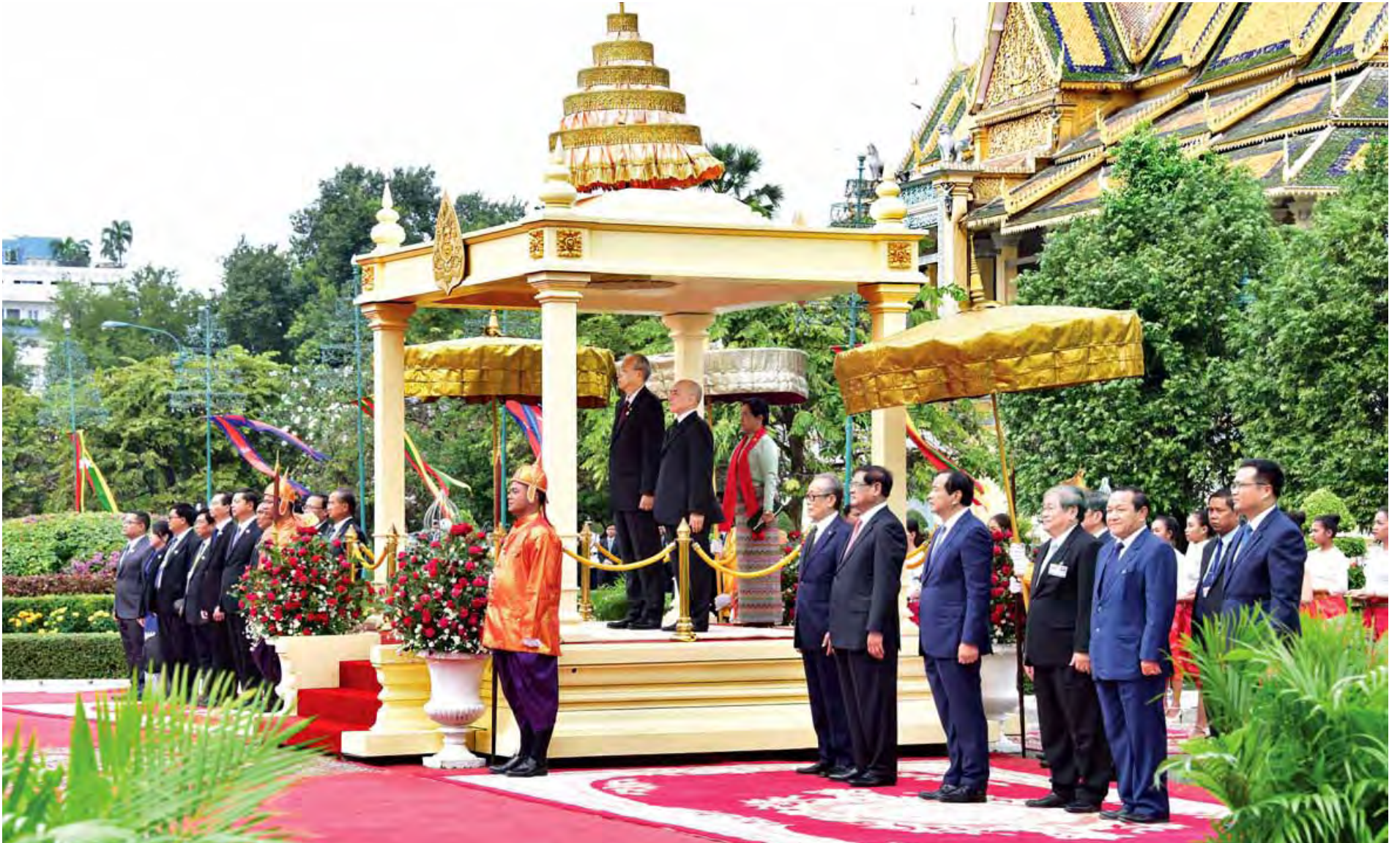
နိုင်ငံတော်သမ္မတ ဦးထင်ကျော်နှင့် ဇနီးတို့ ကမ္ဘောဒီးယားနိုင်ငံ ဖနောင်ပင်မြို့ရှိ ဘုရင့်နန်းတော်၌ ကျင်းပသည့် ဂုဏ်ပြုကြိုဆိုပွဲအခမ်းအနားတွင် ကမ္ဘောဒီးယားဘုရင်မင်းမြတ်နှင့်အတူ ဂုဏ်ပြုတပ်ဖွဲ့၏ အလေးပြုခြင်းကို ခံယူစဉ်။

အချင်းချင်း ခိုက်ရန်ဖြစ်ပွားခြင်းသည် မကောင်း။ ရန်ပြု တတ်သူတို့အလယ်တွင် ရန်မပြုဘဲနေခြင်းသည် လည်းကောင်း၊ ကိလေသာ အနှိပ်စက်ခံရသူတို့အလယ်၌ ကိလေသာ အနှိပ်အစက်မခံရဘဲနေခြင်းသည် လည်းကောင်း၊ ကာမဂုဏ်ကို ကြောင်ကြဲစိုက်ကုန်သော သူတို့အလယ်၌ ကြောင်ကြဲမစိုက်ကုန်ဘဲ နေခြင်းသည်လည်းကောင်း ချမ်းသာ၏။ သုခဝဂ်(ဓမ္မပဒ-၁၉၉)