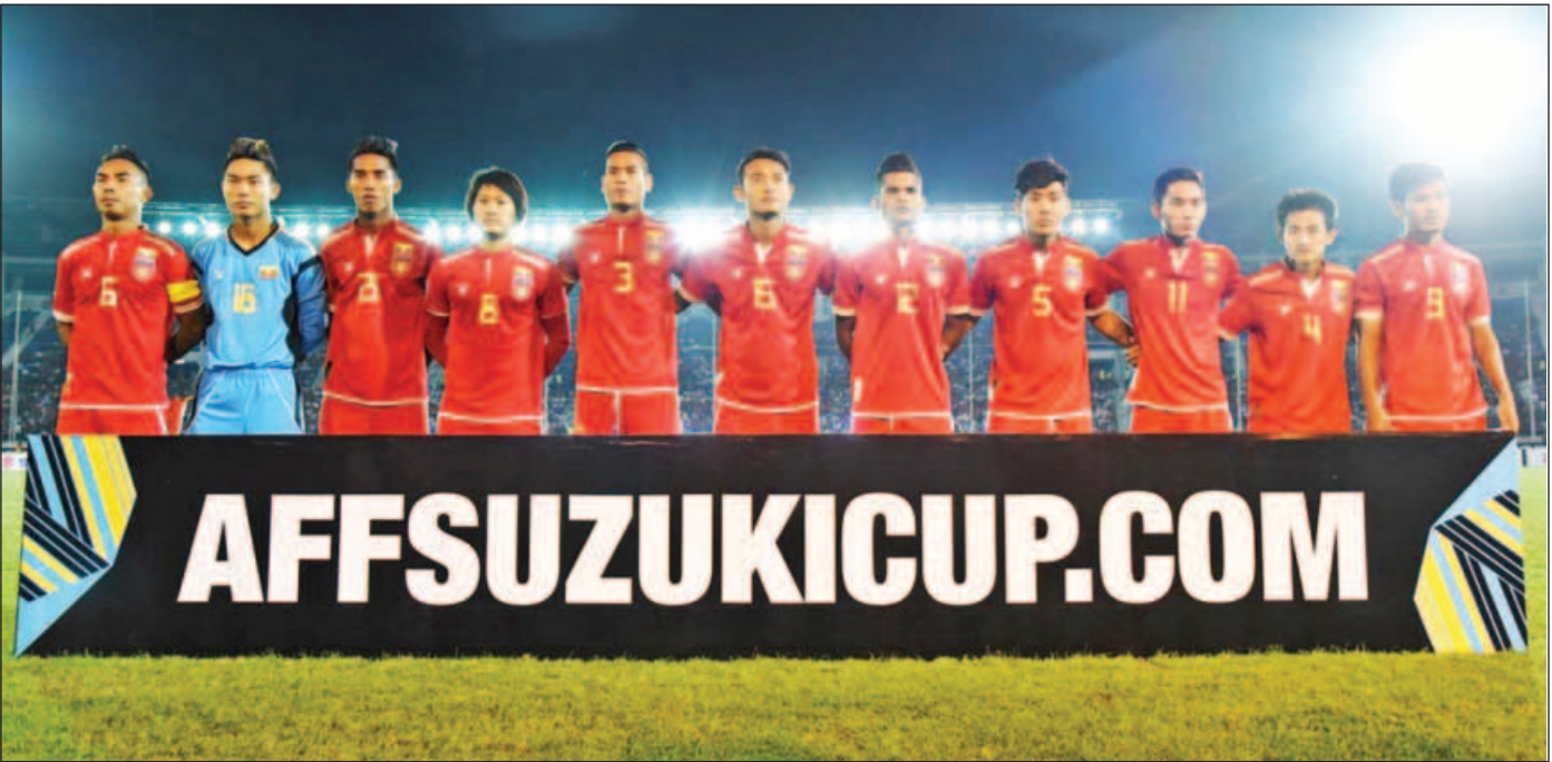
၂၀၁၆ အာဆီယံ ဆူပူကီးဖလားပြိုင်ပွဲတွင် ပူးတွဲတတိယဆုရခဲ့သည့် မြန်မာ့လက်ရွေးစင်ဘောလုံးအသင်း။