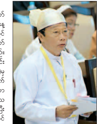
ဒုတိယဝန်ကြီး ဦးလှကျော်

အစည်းအဝေးတွင် စစ်ကိုင်းတိုင်း ဒေသကြီး မဲဆန္ဒနယ်အမှတ်(၁၂)မှ ဦးမင်းနိုင်၏ ခေတ်အဆက်ဆက် ဒေသဖွံ့ဖြိုးရေး နောက်ကျနေသော နာဂကိုယ်ပိုင် အုပ်ချုပ်ခွင့်ရဒေသ အတွက် လယ်ယာမြေဖော်ထုတ်ပြီး စိုက်ပျိုးမြေ ဖန်တီးရေးအပါအဝင် လူမှုဘဝတိုးတက်စေရေး စီမံကိန်းများ သီးခြားရေးဆွဲ အကောင်အထည်ဖော်နိုင်ရန်အတွက် နိုင်ငံတော်မှ ဆောင်ရွက်ပေးရန် အစီအစဉ် ရှိ မရှိ မေးခွန်းနှင့် စပ်လျဉ်း၍ စိုက်ပျိုးရေး၊ မွေးမြူရေးနှင့် ဆည်မြောင်းဝန်ကြီးဌာန ဒုတိယဝန်ကြီး ဦးလှကျော်က ခေတ်အဆက်ဆက် ဒေသဖွံ့ဖြိုးရေး နောက်ကျခဲ့သည့် နာဂကိုယ်ပိုင် အုပ်ချုပ်ခွင့်ရဒေသတွင် လယ်ယာမြေဖော်ထုတ်ပြီး စိုက်ပျိုးမြေဖန်တီးရေး အပါအဝင် လူမှုဘဝတိုးတက်စေရေး စီမံကိန်းများသီးခြားရေးဆွဲ အကောင်အထည်ဖော်နိုင်ရန်အတွက် နာဂကိုယ်ပိုင်အုပ်ချုပ်ခွင့်ရ ဒေသနှင့် စစ်ကိုင်းတိုင်းဒေသကြီးအစိုးရအဖွဲ့