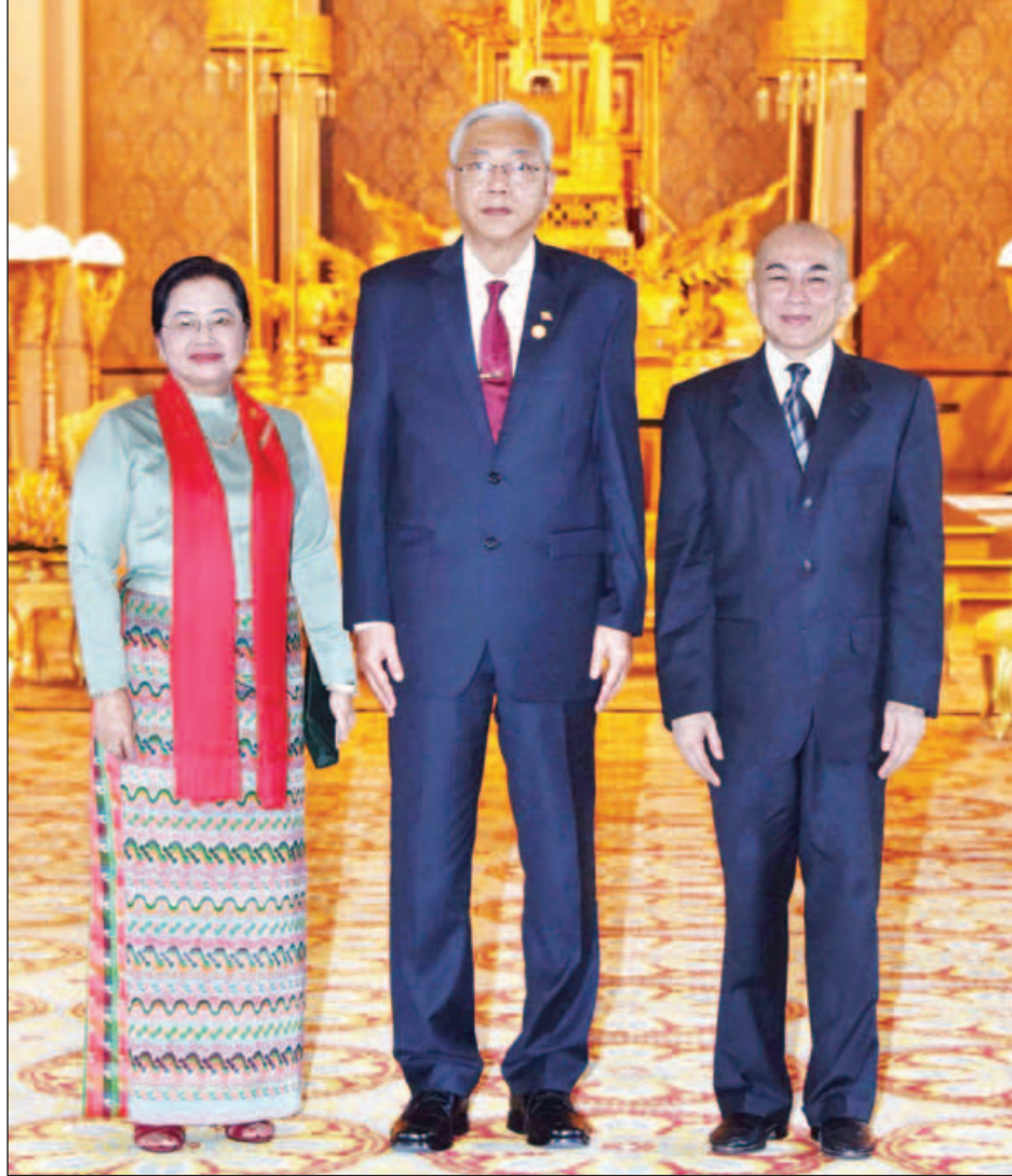
နိုင်ငံတော်သမ္မတ ဦးထင်ကျော်နှင့်ဇနီး ဒေါ်စုစုလွင်တို့ ဦးဆောင်သောကိုယ်စားလှယ်အဖွဲ့ ကမ္ဘောဒီးယားနိုင်ငံ ဖနောင်ပင်မြို့သို့ရောက်ရှိလာရာ တာဝန်ရှိသူများက လေဆိပ်တွင် ကြိုဆိုနှုတ်ဆက်ကြစဉ်။