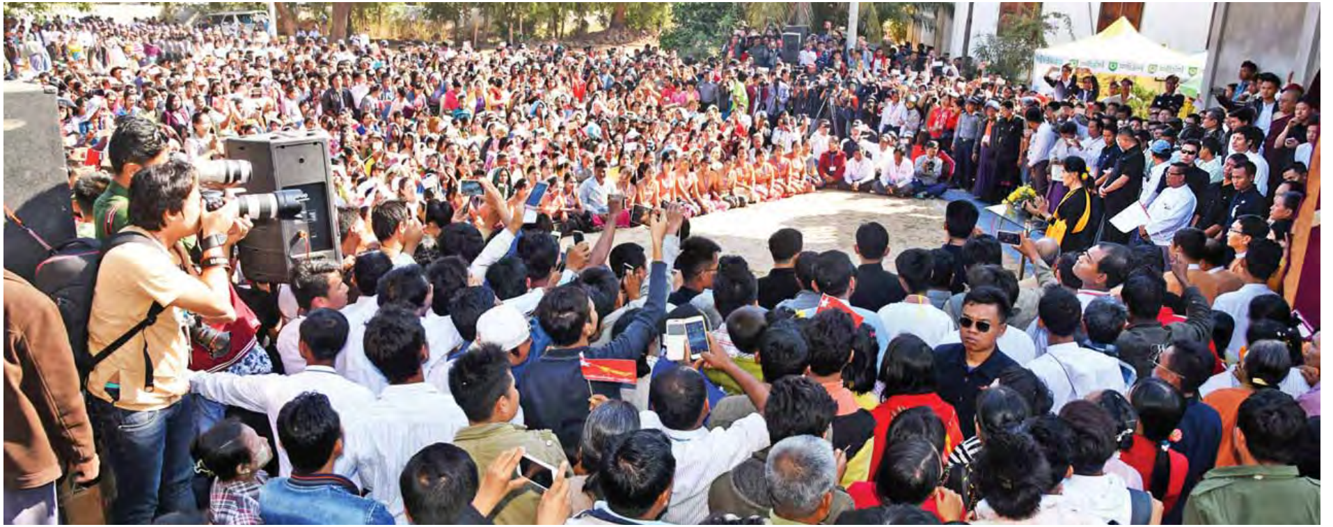
နိုင်ငံတော်၏အတိုင်ပင်ခံပုဂ္ဂိုလ် ဒေါ်အောင်ဆန်းစုကြည် ပခုက္ကူမြို့နယ် စံပြုကြီးကျေးရွာနှင့် ပတ်ဝန်းကျင်ကျေးရွာများမှ ဒေသခံများအား တွေ့ဆုံအမှာစကားပြောကြားစဉ်။