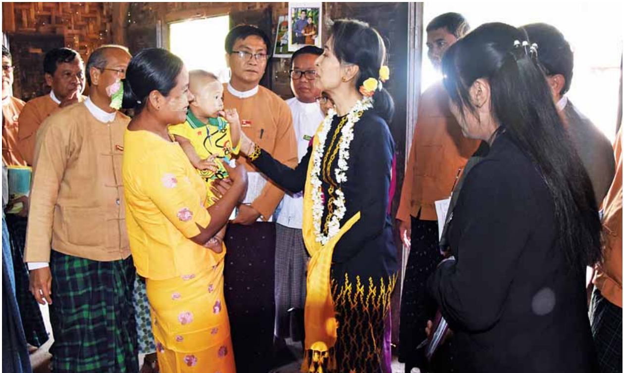
နိုင်ငံတော်၏အတိုင်ပင်ခံပုဂ္ဂိုလ်ဒေါ်အောင်ဆန်းစုကြည် စံပြုကြီးကျေးရွာအတွင်းရှိ နေအိမ်များသို့သွားရောက်၍ မိသားစုဝင်များအား ရင်းရင်းနှီးနှီး တွေ့ဆုံစဉ်။

တိုင်းဒေသကြီးဝန်ကြီးချုပ်တစ်ဦးသည် ပြည်သူ့လူထုက မဲပေးပြီး ရောက်လာခြင်းဖြစ်ကြောင်း၊ ထို့ကြောင့် ပြည်သူ့လူထုက ခိုင်းပိုင်ခွင့်ရှိသည်ကို သေသေချာချာ မှတ်ထားရန်လို... (သတင်းစဉ်)