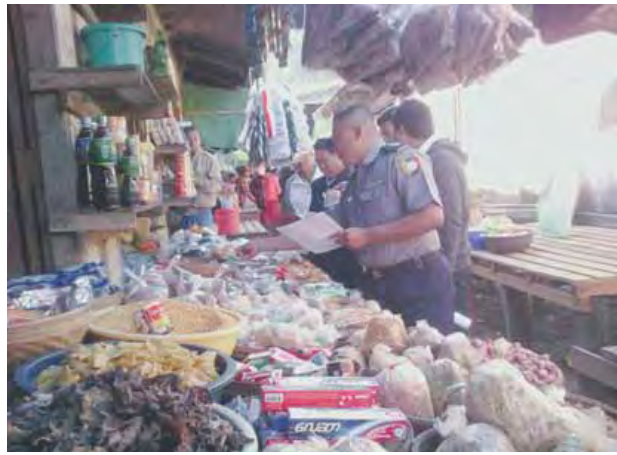
မင်းကင်း ဇန်နဝါရီ ၂၅

စစ်ကိုင်းတိုင်းဒေသကြီး ကလေးခရိုင် မင်းကင်းမြို့ မဈေးအတွင်းရောင်းချ လျက်ရှိသည့် စားသောက်ကုန်များတွင် မှိုဆိပ်ပါဝင်သည့် ဟင်းခတ်အမွှေး အကြိုင်နှင့် ငရုတ်သီးမှုန့်များ ရောင်းချခြင်းမရှိစေရန် ဇန်နဝါရီ ၂၁ ရက် နံနက် ၉ နာရီက စစ်ဆေးခဲ့သည်။