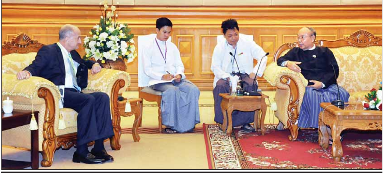
အမျိုးသားလွှတ်တော်ဥက္ကဋ္ဌ မန်းဝင်းခိုင်သန်း အမေရိကန်ပြည်ထောင်စု အခြေစိုက် General Electric (GE) ကုမ္ပဏီမှ ဒုတိယဥက္ကဋ္ဌ မစ္စတာ ဂျွန်ဂျီရိုက်စ်အား လက်ခံတွေ့ဆုံစဉ်။ (သတင်းစဉ်)

နေပြည်တော် ဇန်နဝါရီ ၂၅ အမျိုးသားလွှတ်တော်ဥက္ကဋ္ဌ မန်းဝင်းခိုင်သန်းသည် အမေရိကန်ပြည်ထောင်စု အခြေစိုက် General Electric (GE) ကုမ္ပဏီမှ ဒုတိယဥက္ကဋ္ဌ မစ္စတာ ဂျွန်ဂျီရိုက်စ်နှင့်အဖွဲ့အား ယနေ့နံနက် ၁၀ နာရီတွင် နေပြည်တော်ရှိ အမျိုးသားလွှတ်တော် ဧည့်ခန်းမဆောင်၌ လက်ခံတွေ့ဆုံသည်။ တွေ့ဆုံစဉ် GE ကုမ္ပဏီမှ ဆောင်ရွက်လျက်ရှိသော လျှပ်စစ်၊ စွမ်းအင် ထုတ်လုပ်မှုနည်းပညာကဏ္ဍ၊ ကျန်းမာရေးဝန်ဆောင်မှု အထောက်အကူပြုပစ္စည်းများ ထုတ်လုပ်မှုကဏ္ဍများနှင့်ပတ်သက်၍ ဆွေးနွေးကြသည်။ မွန်းလွဲ ၁ နာရီတွင် အမျိုးသားလွှတ်တော်ဥက္ကဋ္ဌသည် Inter-Parliamentary Union (IPU)မှ Technical Cooperation, Program Manager, Ms. Norah Babic အား လက်ခံတွေ့ဆုံသည်။ တွေ့ဆုံစဉ် IPU ၏ လွှတ်တော်ဖွံ့ဖြိုးတိုးတက်မှုဆိုင်ရာ အကူအညီပေးရေးကိစ္စများနှင့်ပတ်သက်၍ ဆွေးနွေးကြသည်။ တွေ့ဆုံပွဲများသို့ အမျိုးသားလွှတ်တော် ဒုတိယဥက္ကဋ္ဌ ဦးအေးသာအောင်နှင့် အမျိုးသားလွှတ်တော်ရုံးမှ တာဝန်ရှိသူများ တက်ရောက်ကြသည်။ (သတင်းစဉ်)