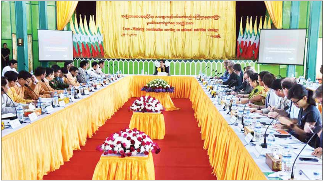
နိုင်ငံတော်၏အတိုင်ပင်ခံပုဂ္ဂိုလ် ဒေါ်အောင်ဆန်းစုကြည် အမျိုးသားအာဟာရဆိုင်ရာ မဟာဗျူဟာနှင့်ပတ်သက်သည့် ဝန်ကြီးဌာနများအကြား ပူးပေါင်းဆောင်ရွက်ရေးအစည်းအဝေးတွင် အမှာစကားပြောကြားစဉ်။

လုပ်ငန်းများအကောင်အထည်ဖော်ရာ၌ ဒေသနှင့်သင့်လျော်သည့် နည်းစနစ်များ အသုံးပြုရန်လိုအပ်ပါကြောင်း၊ မိမိတို့၏နိုင်ငံတွင် အာဟာရချို့တဲ့မှု မည်သည့်အခြေအနေတွင် ရှိနေသည်ကို သိရှိထားရန်လိုအပ်ပါကြောင်း၊ အာဟာရဖွံ့ဖြိုးမှုနှင့်ပတ်သက်၍ သုတေသန လုပ်ဆောင်ထားခြင်းမရှိသေးသည်ကို တွေ့ရပါကြောင်း၊ ရှေ့လုပ်ငန်းများကို မည်သည့်ပုံစံဖြင့် အကောင်အထည်ဖော်သွားမည်ကို ဆုံးဖြတ်နိုင်ရန် ယခုကဲ့သို့ အစည်းအဝေးများ မကြာခဏ ကျင်းပရန်လိုအပ်ပါကြောင်း၊ အာဟာရပြည့်ဝမှုနှင့်ပတ်သက်သည့် အခြေအနေ