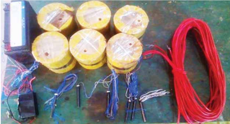
TNLA အကြမ်းဖက်သောင်းကျန်းသူများ ထောင်ထားသည့် လက်လုပ်မိုင်းနှင့်ဆက်စပ်ပစ္စည်းများ တွေ့ရှိရင်းလင်းစဉ်။

နေပြည်တော် ဇန်နဝါရီ ၂၅ ရှမ်းပြည်နယ် အရှေ့မြောက်ဒေသ နမ့်တူမြို့အနီးတွင် ယမန်နေ့ နံနက်ပိုင်းက တပ်မတော်စစ်ကြောင်း သည် လက်လုပ်မိုင်းနှင့်ဆက်စပ် ပစ္စည်းများ သိမ်းဆည်းရမိခဲ့ကြောင်း သိရသည်။