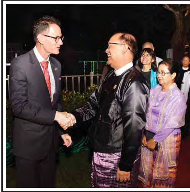
ဇန်နဝါရီ ၂၅ ရက်က ဩစတြေးလျနိုင်ငံ အမျိုးသားနေ့အထိမ်းအမှတ် ဧည့်ခံပွဲအခမ်းအနား တက်ရောက်လာကြသည့် ပို့ဆောင်ရေးနှင့် ဆက်သွယ်ရေးဝန်ကြီးဌာန ပြည်ထောင်စု ဝန်ကြီး ဦးသန့်စင်မောင်နှင့် ဇနီး ဒေါက်တာဒေါ်ခင်သန်းအေးတို့အား မြန်မာနိုင်ငံဆိုင်ရာ ဩစတြေးလျနိုင်ငံ သံအမတ်ကြီး H.E. Mr. Nicholas Coppel ကြိုဆိုနှုတ်ဆက်စဉ်။ (သတင်းစဉ်)

ဆက်လက်၍ ပြည်ထောင်စုဝန်ကြီးက ရှမ်းပြည်နယ်တွင် ရေပူစစ်ဆေးရေးဂိတ်နှင့် မွန်ပြည်နယ်တွင် မရမ်းချောင်းစစ်ဆေးရေးဂိတ် ဖွင့်လှစ်လိုသည့်အတွက် ယာဉ်ကြောပိတ်ဆို့မှုများ ဖြစ်နိုင်ကြောင်း၊ ပုပ်သိုးလွယ်သော ကုန်စည်များ ထိခိုက်ပျက်စီးနိုင်ကြောင်း၊ လာဘ်ပေးလာဘ်ယူမှုများလည်းရှိနိုင်ကြောင်း စသည်ဖြင့် ထောက်ပြပြောကြားမှုများရှိကြောင်း၊ ထိုသို့ ထောက်ပြ ဝေဖန်မှုများကို ဖြေရှင်းနိုင်သည့်အစီအစဉ်များ ပြုလုပ်စီမံထားကြောင်း၊ ယာဉ်ကြောပိတ်ဆို့မှုမဖြစ်စေရေး စစ်ဆေးရေးဂိတ်များတွင် စစ်ဆေးရေးအဖွဲ့ တစ်ခုအစား လိုသလို ဖွဲ့စည်းစစ်ဆေးသွားမည်ဖြစ်ကြောင်း၊ သတင်းစာများ၊ မီဒီယာများမှ