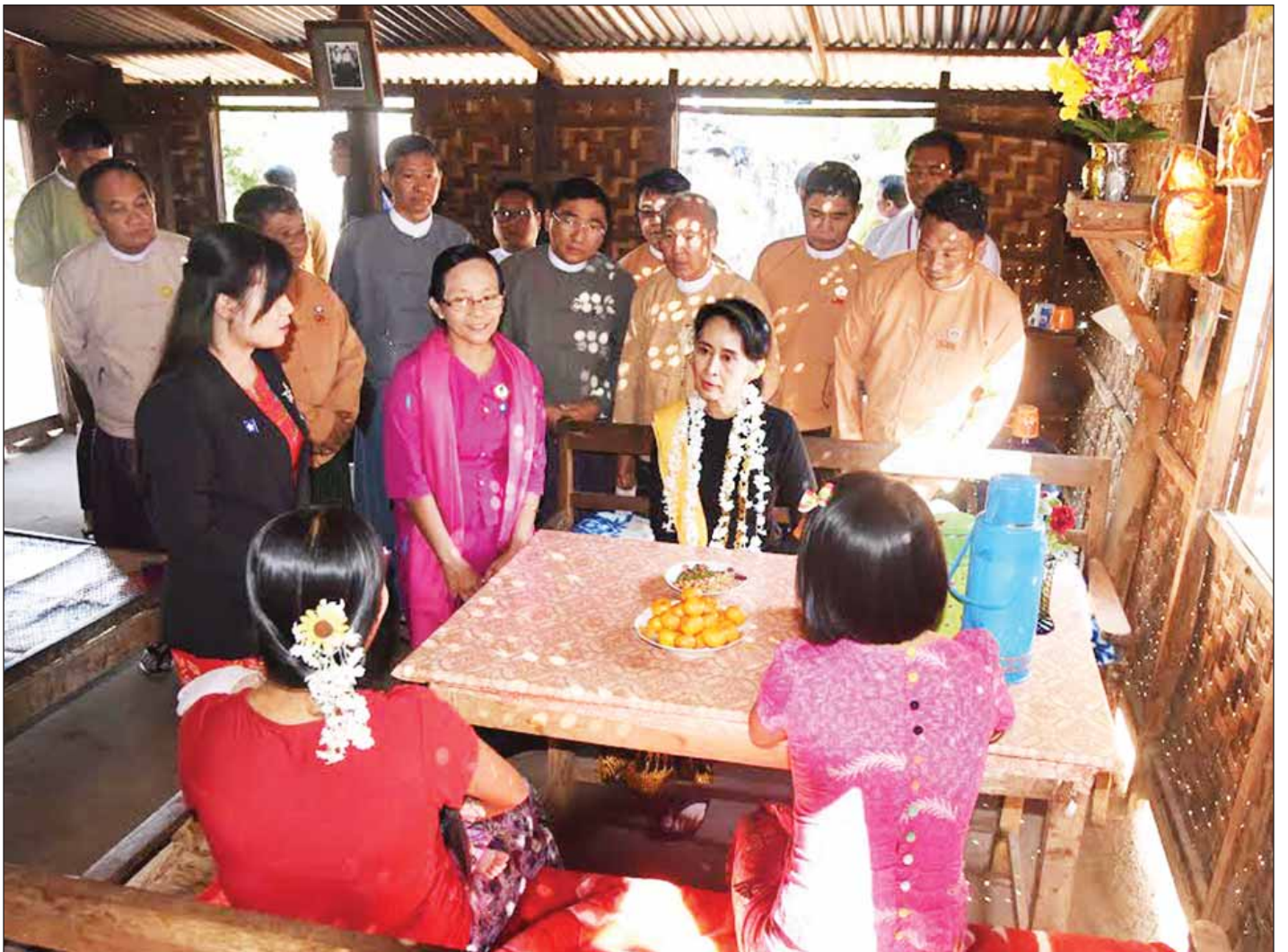
နိုင်ငံတော်၏အတိုင်ပင်ခံပုဂ္ဂိုလ် ဒေါ်အောင်ဆန်းစုကြည် ပခုက္ကူမြို့နယ် စံပြကြီးကျေးရွာ၌ မိသားစုဝင်များအား ပညာရေး၊ ကျန်းမာရေးအခြေအနေများကို ရင်းရင်းနှီးနှီး တွေ့ဆုံမေးမြန်းစဉ်။