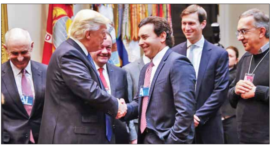
လှုပ်ရှားမှုတစ်ရပ်အဖြစ် ရေနံပိုက်လိုင်း စီမံကိန်း နှစ်ခုကို ကို သမ္မတအိုဘားမားလက်ထက်က သဘာဝပတ်ဝန်း ကျင်ထိခိုက်ပျက်စီးမှုဖြစ်စေသည့်အတွက် ဆိုင်းငံ့ထားခြင်း ဖြစ်ကြောင်းသိရသည်။ အင်န်အိတ်ချ်ကေ။

ပေါ်ပေါက်စေရေးနှင့် မော်တော်ကားစက်ရုံများ နိုင်ငံ အတွင်း တည်ဆောက်ရေးအတွက် အဓိကအချက်မှာ အမေရိကန်ဒေါ်လာတန်ဖိုးမြင့်တက်စေရန် ဖြစ်ပြီး အမှုဆောင်အရာရှိချုပ်များက သမ္မတဒေါ်နယ်လ် ထရန်အား တောင်းဆိုထားကြောင်း Ford ကုမ္ပဏီ၏ အမှုဆောင်အရာရှိချုပ် မာ့ခ်ဖီးစ်က မီဒီယာများအား ဖွင့်ဟပြောကြားခဲ့သည်။ ကုန်သွယ်မှုအတွက် အကြီးမားဆုံး အတားအဆီးမှာ ငွေကြေး မတည်ငြိမ်မှုဖြစ်ကြောင်း အမှုဆောင်အရာရှိချုပ် များက သမ္မတထရန်အား အလေးပေးပြောကြားခဲ့သည်။ အမေရိကန်ဒေါ်လာတန်ဖိုးသည် မြင့်တက်လျက် ရှိသည်။ အရေးကြီးသောအချက်မှာ ငွေကြေးတည်ငြိမ်မှုရှိ စေရန် ၎င်းအနေဖြင့် မည်သို့တိုင်တွယ်ဖြေရှင်းမလဲဆို သည်ကိုသာ အဓိကစောင့်ကြည့်စေလိုကြောင်း သမ္မတ ထရန်က လွန်ခဲ့သော ရက်သတ္တနှစ်ပတ်က မီဒီယာများအား ပြောကြားခဲ့သည်။ နိုင်ငံအတွင်း အလုပ်အကိုင်များစွာ ပေါ်ပေါက်ရေး