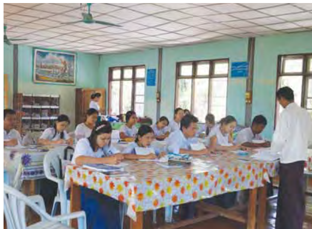
ကျောက်ရိတ် ဇန်နဝါရီ ၂၅

ကရင်ပြည်နယ် ကျောက်ရိတ်ခရိုင် ပြန်ကြားရေးနှင့်ပြည်သူ့ဆက်ဆံရေးဦးစီး ဌာန ကျောက်ရိတ်ခရိုင်ရုံးတွင်ပြုလုပ်သော လုပ်ငန်းကျွမ်းကျင်မှုမြှင့်တင်ရေး ဆင့်ပွားသင်တန်းကို ဇန်နဝါရီ ၂၃ ရက် နံနက် ၉ နာရီက ပြုလုပ်ခဲ့သည်။