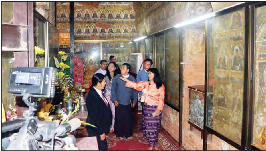
ဘူတန်နိုင်ငံ ဘုရင်မင်းမြတ်၏ဒွေးတော် အလိုတော်ပြည့်ဘုရားအား ဖူးမြော်ကြည့်ညှိစဉ်

ဘူတန်နိုင်ငံ ဘုရင်မင်းမြတ်၏ ဒွေးတော်ဖြစ်သူ ယခင်ဘူတန်ဘုရင်၏ ပထမမြောက်မိဖုရား Her Majesty the Queen Mother Ashi Dorji Wangmo Wangchuck သည် ယနေ့တွင် ပုဂံမြို့၏ ရှုခင်းများအား လှည့်လည်ကြည့်ရှုလေ့လာပြီး ပုဂံမြို့ရှိ ရှေးဟောင်းဘုရားများသို့ သွားရောက် ဖူးမြော်ကြည့်ညှိသည်။