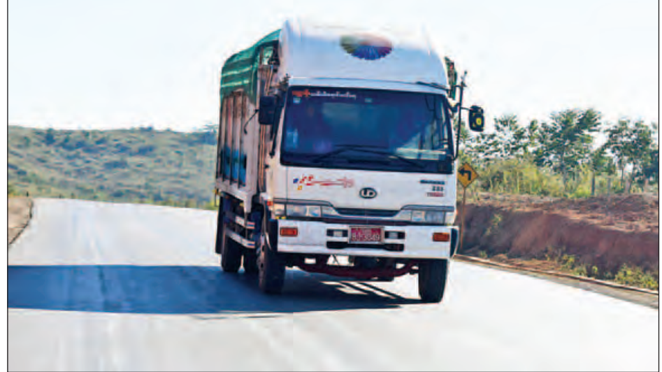
လားရှိုးမြို့ရှောင်လမ်းတွင် ကားအသွားအလာ ရှင်းနေသည်ကို တွေ့ရစဉ်။

တစ်ရံ လမ်းလုံခြုံရေးတာဝန်ကျ တပ်မတော်သားတွေကပါ နေ့၊ ည၊ မိုးရွာ၊ နေပူမရွေး ဆောင်ရွက်ပေးနေပါတယ်။ ယခု လမ်းအခြေအနေကြောင့် ယာဉ်ကြောပိတ်ဆို့မှု မဖြစ်ပေါ် စေဖို့ အမြဲတမ်းသွားလာနေတဲ့ ကုန်တင်ယာဉ်ကြီးတွေ၊ ခရီးသည်တင်ယာဉ်တွေရဲ့ အကြံပြုချက်တွေရယူပြီး ကွေ့အတက်နေရာတွေဖြစ်တဲ့ ရှုခင်းသာဘက်ကွေ့အပါ အဝင် မိုင် ၂၃၀ မှ မိုင် ၂၃၃ ကြားရှိ ကွေ့အတက်တွေကို စတင်ပြုပြင်နေပြီး ကွတ်ခိုင်-ရှုခင်းသား-နမ့်ခိုင်လမ်းပိုင်း မိုင် ၂၂၄ မှ မိုင် ၂၃၆ အထိ ၁၂ မိုင်ကို လမ်းဘေး ၈၊ ယာ ခြောက်ပေစီ တိုးချဲ့ကတ္တရာလမ်းခင်းခြင်း စီမံချက်ရေးဆွဲ လုပ်ကိုင်နေပြီလို့ သိရပါတယ်။