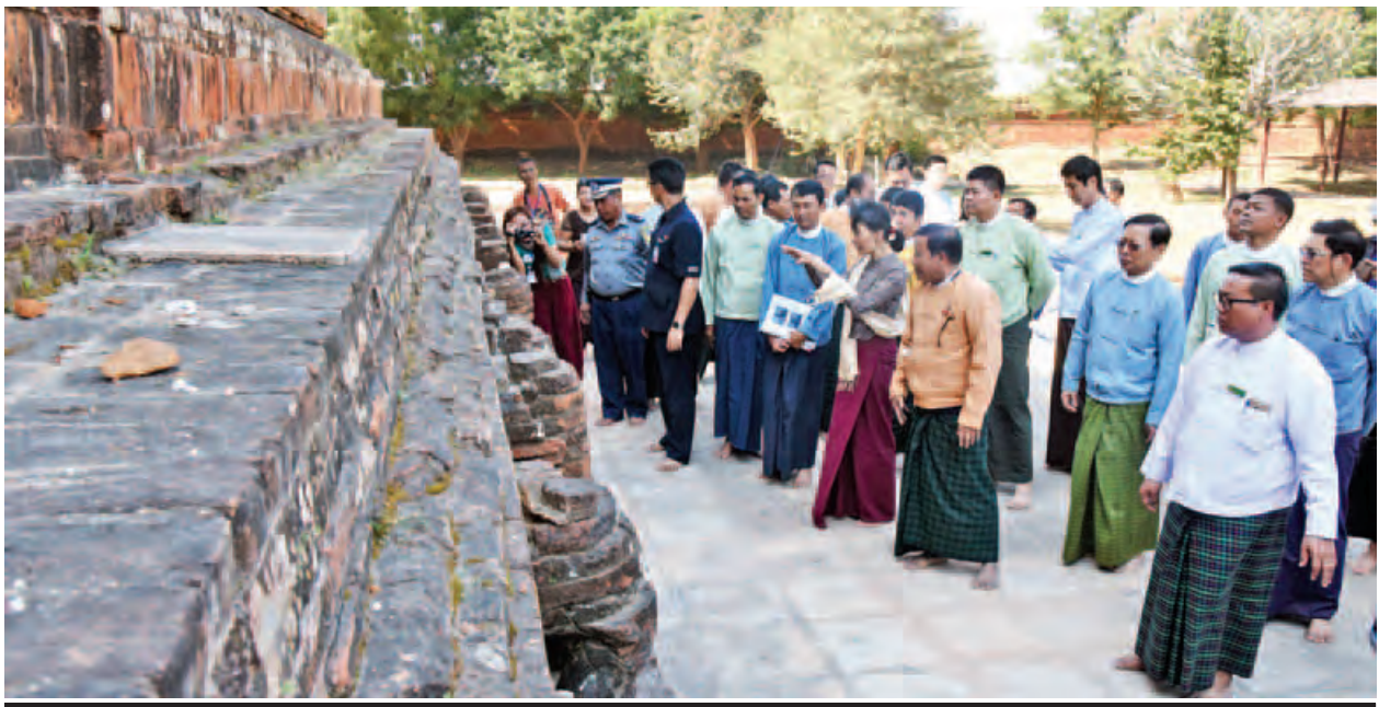
နိုင်ငံတော်၏အတိုင်ပင်ခံပုဂ္ဂိုလ် ဒေါ်အောင်ဆန်းစုကြည် ငလျင်ဒဏ်ကြောင့် ထိခိုက်ပျက်စီးခဲ့သည့် စေတီပုထိုးများအား ပြုပြင်ထိန်းသိမ်းရေးလုပ်ငန်း ဆောင်ရွက်ထားရှိမှုအခြေအနေကို ကြည့်ရှုစစ်ဆေးစဉ်။ (သတင်းစဉ်)

က ထိုသို့ပြောကြားခဲ့ခြင်းဖြစ်သည်။ ဆက်လက်၍ နိုင်ငံတော်၏အတိုင်ပင်ခံပုဂ္ဂိုလ်က ရှေးဟောင်းအမွေ အနှစ်များကို ထိန်းသိမ်းခြင်းသည် သက်မဲ့ပစ္စည်း အဟောင်းများကို ထိန်းသိမ်းခြင်း မဟုတ်ကြောင်း၊ မိမိတို့နိုင်ငံ၏ သမိုင်း၊ ယဉ်ကျေးမှုနှင့် ဆက်စပ်မှုရှိသည့်အတွက် ထိန်းသိမ်း ခြင်းဖြစ်ကြောင်း၊ အတိတ်သမိုင်းတွင် ဂုဏ်ယူစရာများရှိသကဲ့သို့ ဂုဏ်ယူ စရာမကောင်းသည့် အချက်များကို လည်း သင်ခန်းစာယူနိုင်ပါ ကြောင်း။ သမိုင်းနှင့်ယဉ်ကျေးမှု၏ အခြေ အမြစ်ကိုနားလည်ရန် အရေးကြီးပါ ကြောင်း၊ သို့မှသာ မည်သည့်အရာ များကို ထိန်းသိမ်းသင့်သည်၊ ပြုစု ပျိုးထောင်သင့်သည်၊ ပြောင်းလဲသင့် သည်ကို ဆုံးဖြတ်နိုင်မည်ဖြစ်ပါ ကြောင်း၊ မိမိတို့နိုင်ငံရှိ တစ်ကမ္ဘာလုံး က သိသည့် ရှေးဟောင်းဒေသ ပုဂံမြို့ ဟောင်းမှ စေတီတော်များကို ဘာသာရေးအရ ဖူးမြော်ကြသကဲ့သို့ ယဉ်ကျေးမှုအရ စိတ်ဝင်စား၍