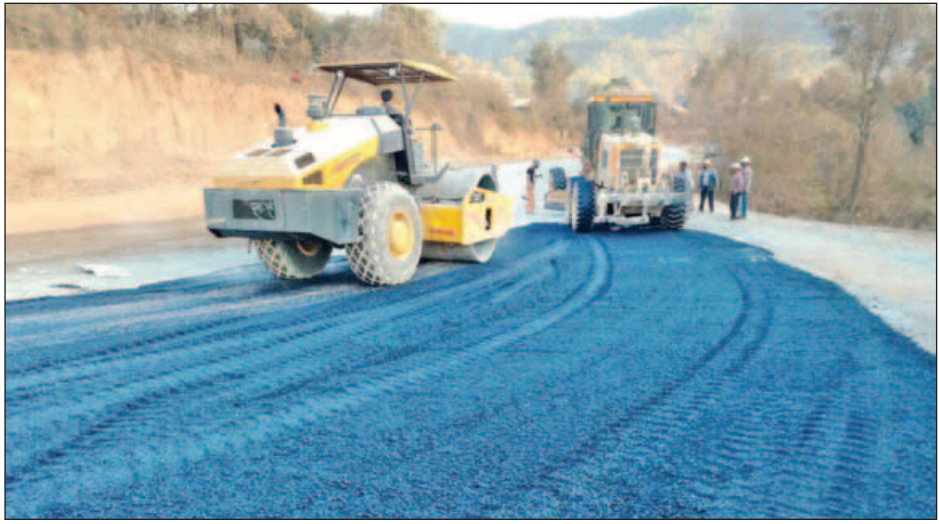
ကွတ်ခိုင်-ရှုခင်းသာလမ်းပိုင်း ပြင်ဆင်ဆောင်ရွက်နေသည်ကို တွေ့ရစဉ်။

ထို့ကြောင့်ယာဉ်ကြောကျပ်တည်းမှု၊ ယာဉ်ကြောပိတ်ဆို့မှုတို့ မဖြစ်ပေါ်စေရန် ထိုလမ်းကိုအသုံးပြုသူတို့ အားလုံးက စနစ်တကျ ယာဉ်စည်းကမ်း၊ လမ်းစည်းကမ်းကို လိုက်နာ ပါက စာရေးသူတစ်ဦး၏အမြင်အရ အကောင်းဆုံးဟု ထင်ပါသည်။ လမ်းပျက်ခြင်း၊ လမ်းပြုပြင်ခြင်းနှင့် လိုအပ် သလို လမ်းချဲ့ထွင်ခြင်းတို့ကိုလည်း သက်ဆိုင်ရာ ကုမ္ပဏီ၊ နီးနွယ်ပတ်သက်သောဌာနနှင့် အုပ်ချုပ်သူတို့က ပိုင်းဝန်း စွမ်းဆောင်ပေးနိုင်ပါက ယခုဖြစ်ပေါ်နေသည့် ယာဉ်ကြော ပိတ်ဆို့ခြင်း၏ ရလဒ်ဆိုးများ ကင်းဝေးသွားနိုင်ပါမည်ဟု အကြံပြုရေးသားလိုက်ပါသည်။ ။