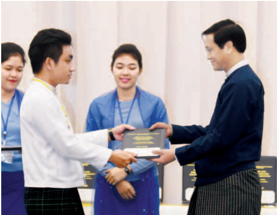
ဒုတိယသမ္မတ ဦးဟင်နရီဗန်ထီးယူ အင်္ဂလိပ်ဘာသာ စွမ်းရည်ပြိုင်ပွဲတွင် ဆုရရှိသူတစ်ဦးအား ဂုဏ်ပြုဆု ပေးအပ်ချီးမြှင့်စဉ်။(သတင်းစဉ်)

ဦးဟင်နရီဗန်ထီးယူက ဘွဲ့ကြိုအဆင့် စာစီစာကုံးပြိုင်ပွဲ၊ ကျပန်းစကားပြောပြိုင်ပွဲ၊ စကားဝိုင်းဆွေးနွေးပွဲပြိုင်ပွဲ ပြိုင်ပွဲသုံးမျိုးလုံးတွင် ပထမဆုရ မောင်စတီဗင်ဇော်ဇော်မြတ်၊ ဒုတိယဆုရ မောင်စွမ်းပြည့်အောင်နှင့် တတိယဆုရ မောင်ဖြိုးသူရဌေးတို့အား ဂုဏ်ပြုဆုများ ပေးအပ်ချီးမြှင့်သည်။ ထို့နောက် ပြည်ထောင်စုဝန်ကြီး ဒုတိယဗိုလ်ချုပ်ကြီး ရဲအောင်က ဘွဲ့လွန်အဆင့် စာစီစာကုံးပြိုင်ပွဲတွင် ပထမ၊ ဒုတိယ၊ တတိယဆု ရရှိကြသူများအား လည်းကောင်း၊ ပြည်ထောင်စုဝန်ကြီး ဒေါက်တာဝင်းမြတ်အေးက ဘွဲ့ကြိုအဆင့်စာစီစာကုံးပြိုင်ပွဲတွင် ပထမ၊ ဒုတိယ၊ တတိယဆု ရရှိကြသူများအား လည်းကောင်း၊ ပြည်ထောင်စုဝန်ကြီး ဦးသန့်စင်မောင်က ဘွဲ့လွန်အဆင့် ကျပန်းစကားပြောပြိုင်ပွဲတွင် ပထမ၊ ဒုတိယ၊ တတိယဆု ရရှိကြသူများအား လည်းကောင်း၊ နေပြည်တော်ကောင်စီ ဥက္ကဋ္ဌ ဒေါက်တာမျိုးအောင်က ဘွဲ့ကြိုအဆင့် ကျပန်းစကားပြောပြိုင်ပွဲတွင် ပထမ၊ ဒုတိယ၊ တတိယဆု ရရှိကြသူများအား လည်းကောင်း၊ ပြည်ထောင်စုဝန်ကြီး ဒေါက်တာမြင့်ထွေးက ဘွဲ့လွန်အဆင့် စကားဝိုင်းဆွေးနွေးပွဲပြိုင်ပွဲတွင် ပထမ၊ ဒုတိယ၊ တတိယဆု ရရှိကြသူများအား လည်းကောင်း၊ ပြည်ထောင်စုဝန်ကြီး ဒေါက်တာ မျိုးသိမ်းကြီးက ဘွဲ့ကြိုအဆင့် စကားဝိုင်းဆွေးနွေးပွဲပြိုင်ပွဲတွင် ပထမ၊ ဒုတိယ၊ တတိယ ဆုရရှိကြသူများအား လည်းကောင်း၊