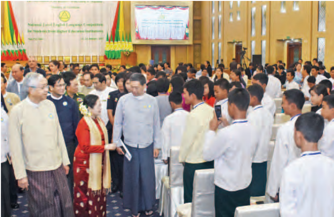
တက္ကသိုလ်၊ ဒီဂရီကောလိပ်နှင့် ကောလိပ်တို့မှ ကျောင်းသား ကျောင်းသူများ၏ ပဟိုအဆင့် အင်္ဂလိပ်ဘာသာစွမ်းရည်ပြိုင်ပွဲ ဆုချီးမြှင့်ပွဲတွင် ကျောင်းသား ကျောင်းသူများအား နိုင်ငံတော်သမ္မတ ဦးထင်ကျော်နှင့်ဇနီး ဒေါ်စုစုလွင် ရင်းရင်းနှီးနှီးနှုတ်ဆက်စဉ်။ (သတင်းစဉ်)