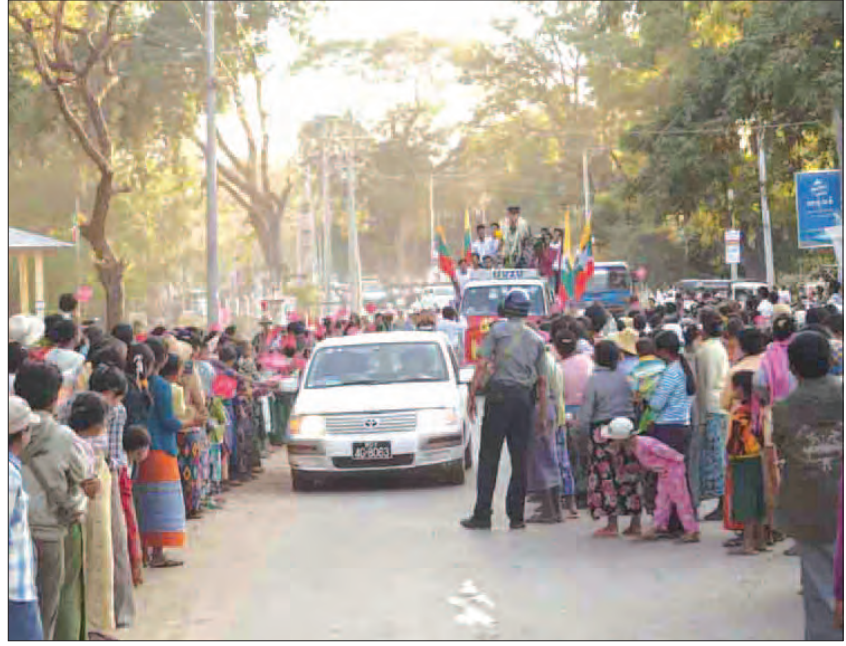
ငါန်းဇွန်မြို့နယ်၌ ဗိုလ်ချုပ်အောင်ဆန်းကြေးရုပ်အား ပျော်ရွှင်လို့ကလဲ့စွာကြိုဆို