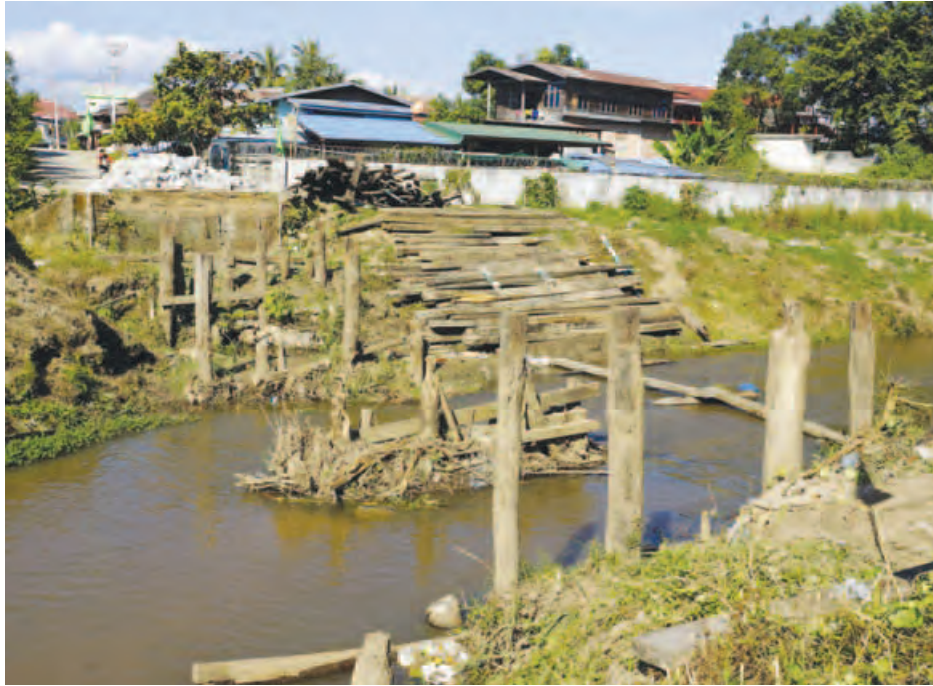
မိုင်းဆတ်မြို့ နဝဒေးတံတားအား မတ်လကုန်အပြီးတည်ဆောက်မည်