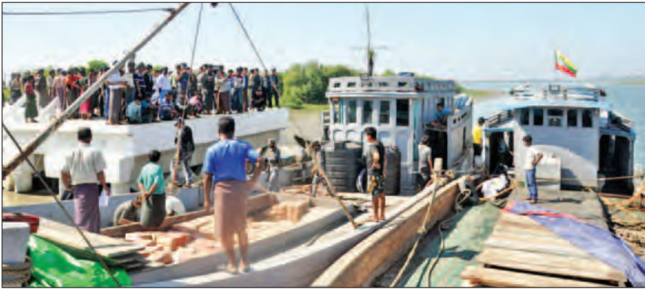
ကညင်ချောင်းဆိပ်ကမ်းသို့ရောက်ရှိလာသည့် ထောက်ပံ့ရေးတင်ဆောင်လာသော သင်္ဘောများကို တွေ့ရစဉ်။