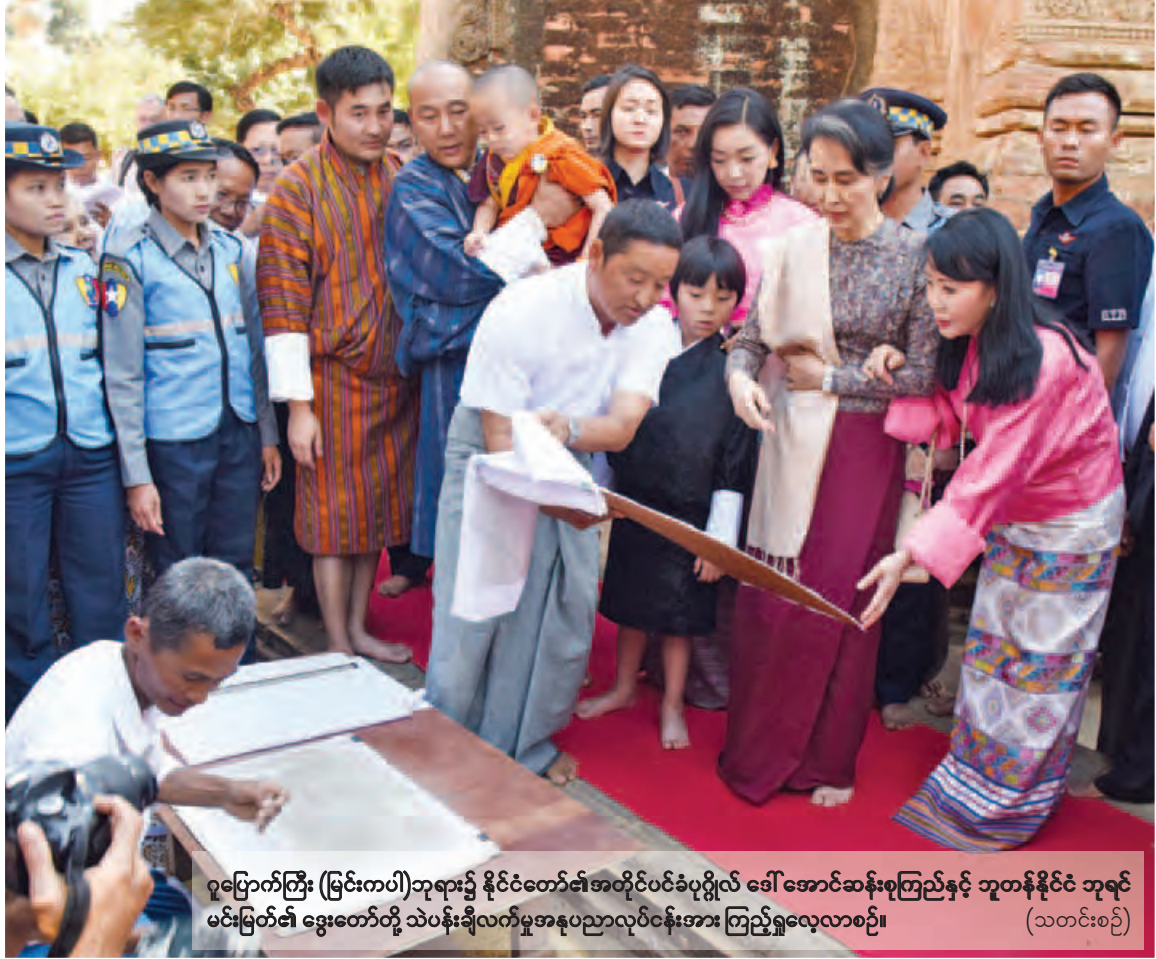
ပူပြောက်ကြီး (မြင်းကပါ)ဘုရား၌ နိုင်ငံတော်၏အတိုင်ပင်ခံပုဂ္ဂိုလ် ဒေါ်အောင်ဆန်းစုကြည်နှင့် ဘူတန်နိုင်ငံ ဘုရင် မင်းမြတ်၏ ဒွေးတော်တို့ သံပန်းချီလက်မှုအနုပညာလုပ်ငန်းအား ကြည့်ရှုလေ့လာစဉ်။ (သတင်းစဉ်)