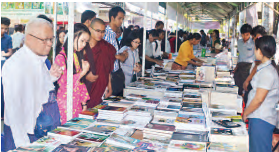
နိဘယ်လ်-မြန်မာစာပေပွဲတော် ၂၀၁၇၊ ရသစာပေတွင် စာအုပ်ဈေးခင်းဖွင့်လှစ်ကာ ရသစာပေစာအုပ်မျိုးစုံကို ရောင်းချပေးလျက်ရှိရာ စာပေဝါသနာရှင်များဖြင့် အထူးစည်ကားလျက်ရှိသည်ကို တွေ့ရစဉ်။

သတင်း-ရီရီမြင့်၊ ဥဗ္ဗာသန့်၊ ဓာတ်ပုံ-လှစိုး