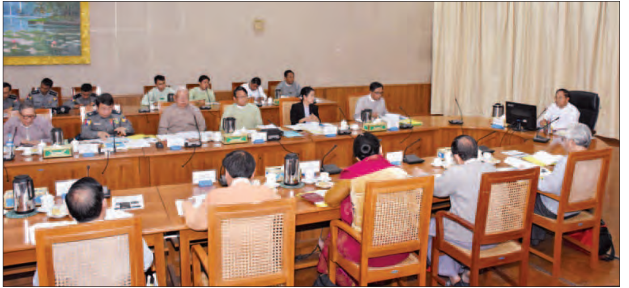
မောင်တောဒေသ စုံစမ်းစစ်ဆေးရေးကော်မရှင်အစည်းအဝေး (၃/၂၀၁၇) တွင် ကော်မရှင်ဥက္ကဋ္ဌ ဒုတိယသမ္မတ ဦးမြင့်ဆွေ အမှာစကားပြောကြားစဉ်။

အစီရင်ခံစာကို အကောင်းဆုံး အပြည့်စုံဆုံး ပြုစုတင်ပြသွားမည် ဖြစ်ပါကြောင်း၊ အစီရင်ခံစာတွင် အကြံပြုချက်များနှင့်စပ်လျဉ်း၍ အမြန်ဆုံး ထိရောက်စွာ အကောင်အထည်ဖော် စာမျက်နှာ ၉ ကော်လံ ၁ သို့ ❖