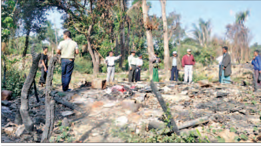
စံပြုကျေးရွာအဖြစ်တည်ဆောက်ရန် မြေနေရာ ကြည့်ရှုစစ်ဆေးစဉ်။