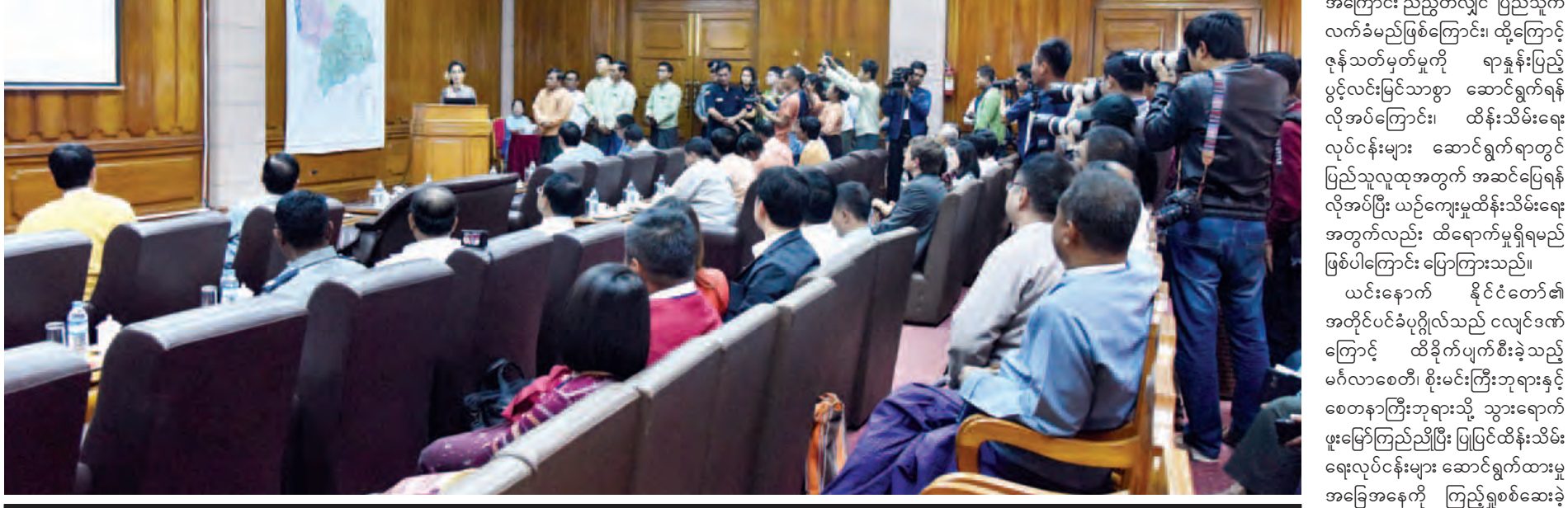
နိုင်ငံတော်၏အတိုင်ပင်ခံပုဂ္ဂိုလ် ဒေါ်အောင်ဆန်းစုကြည် ရှေးဟောင်းသုတေသနပြုတိုက်၌ တာဝန်ရှိသူများနှင့်တွေ့ဆုံပြောကြားစဉ်။ (သတင်းစဉ်)

လာရောက်လေ့လာသူများ ရှိပါ ကြောင်း၊ ထိုသို့ လာရောက်လေ့လာ ခြင်းသည် ဒေသ၏ဖွံ့ဖြိုးရေးကို အားပေးရာရောက်ပါကြောင်း။ ပြည်သူများ လက်ခံနိုင်သည့် ပုံစံဖြင့်ဆောင်ရွက်မှသာ အောင်မြင် နိုင်မည်ဖြစ်ကြောင်း၊ ပြည်သူလူထု