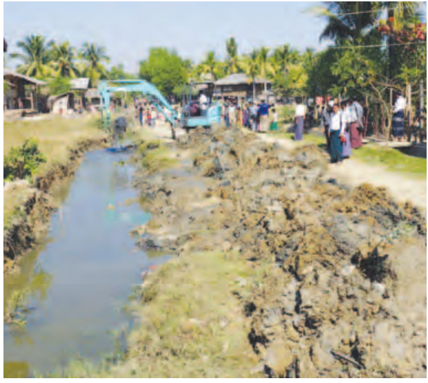
လမ်းများ ရေစီးရေလာကောင်းမွန်ရေး ဆောင်ရွက်