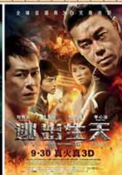
(25.1.2017) 3:15 PM Out of Inferno