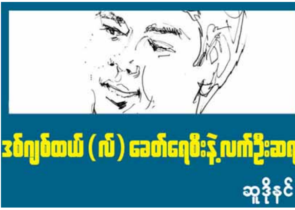
စာဖတ်ခြင်းသာဖြစ်ပါတယ်။

သည့်အချက်က အင်မတန် အင်မတန် အရေးကြီးပါတယ်။ ခေတ်မီ လူ့အသုံးအဆောင်တွေရဲ့ရေစီးကို ကျွန်တော်တို့ လိုက်တားနေလို့မရပါဘူး။ ဒါပေမယ့် အဲဒါတွေက မိမိတို့ရဲ့ မိသားစုကို လှိုက်စားမသွားအောင် လုပ်နိုင်တဲ့ နည်းက တစ်နည်းပဲရှိပါတယ်။ အဲဒါက မိသားစုရဲ့အသိဉာဏ်အဆင့်ကို မြှင့်သထက်မြှင့်အောင် မြှင့်တင်ပေးတဲ့နည်းပါပဲ။ အဲသလို မိသားစုရဲ့ အသိဉာဏ် အဆင့်ကို မြှင့်တင်ပေးနိုင်တဲ့ တစ်ခုတည်းသော လက်နက်ကိရိယာကတော့