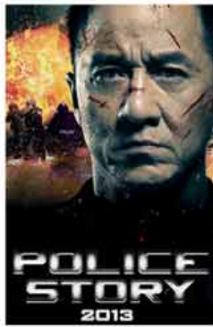
(27.1.2017) 11:15 AM The Police Story 2013