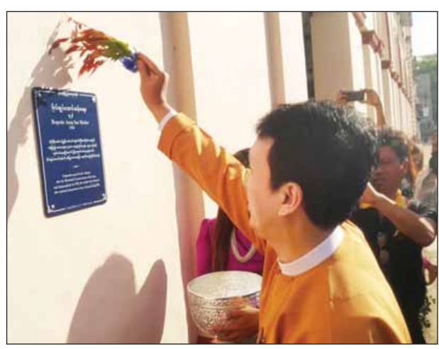
ရန်ကုန်တိုင်းဒေသကြီး ဝန်ကြီးချုပ် ဦးဖြိုးမင်းသိန်း အပြာရောင်ကမ္ဘည်းပြားအား အမွှေးနံ့သာ ပတ်ဖျန်းစဉ်။

ရှေးဟောင်းအဆောက်အအုံများ၊ နေရာများနှင့် ယင်းတို့နှင့်ဆက်စပ်နေသည့် သမိုင်းဝင်လူပုဂ္ဂိုလ်များ၊ သမိုင်းအဖြစ်အပျက်များ အကြောင်းကို ဖော်ပြသော ရန်ကုန်မြို့ပြအမွေအနှစ်အထိမ်းအမှတ် အပြာရောင်ကမ္ဘည်းပြားများတပ်ဆင်ခြင်းကို ရန်ကုန်မြို့တော်စည်ပင်သာယာရေးကော်မတီနှင့် ရန်ကုန်မြို့ပြအမွေအနှစ်ထိန်းသိမ်းစောင့်ရှောက်ရေးအဖွဲ့ (YHT) တို့က ပူးပေါင်းဆောင်ရွက်လျက် ရှိရာ ယနေ့နံနက် ၉ နာရီတွင် ၁၆ ခုမြောက် အပြာရောင်ကမ္ဘည်းပြားကို ရန်ကုန်မြို့ပန်းဘဲတန်းမြို့နယ် ဗိုလ်ချုပ်အောင်ဆန်းလမ်းမပေါ်ရှိ ဗိုလ်ချုပ်အောင်ဆန်းဈေးကြီး၌ တပ်ဆင်သည်။ “အဓိက တော့ လူသိထင်ရှားတဲ့ အဆောက်အအုံကြီးတွေဆိုရင်လည်း သူတို့သမိုင်းနဲ့ မြို့ပြသမိုင်း ဆက်စပ်တဲ့ဟာကို လူတွေသိအောင်လုပ်တယ်။ လူသိနည်းတဲ့အဆောက်အအုံဆိုရင်လည်း ပိုပြီးတော့ သိလာအောင်လုပ်မယ်။ ပိုပြီးတော့သိလာတာက နေပြီးတော့ တန်ဖိုးထားလာအောင်၊ တန်ဖိုးထားမှု ဒါထိန်းသိမ်းစောင့်ရှောက်တဲ့အပိုင်းကိုရောက်မှာ ဖြစ်လို့ ဒီအပြာရောင် ကမ္ဘည်းပြားတပ်တဲ့ လုပ်ငန်းတွေကို ဆောင်ရွက်တာဖြစ်ပါတယ်” ဟု ရန်ကုန်မြို့ပြ အမွေအနှစ်ထိန်းသိမ်းစောင့်ရှောက်ရေးအဖွဲ့ ဒါရိုက်တာ ဒေါ်မိုးမိုးလွင်က ပြောသည်။ ယနေ့တပ်ဆင်သော ကမ္ဘည်းပြားတွင် ဗိုလ်ချုပ်အောင်ဆန်းဈေးကို ၁၉၂၆ ခုနှစ်တွင် စတင်ခဲ့ပြီး ကိုလိုနီခေတ်၌ မြို့နယ်ပယ်ကော်မရှင်မင်းကြီးတစ်ဦး၏အမည်ကို အစွဲပြု၍ စကော့ဈေးဟု မူလက အမည်တွင်ခဲ့ပြီး ၁၉၄၈ ခုနှစ်တွင် လွတ်လပ်ရေးရပြီးနောက် မြန်မာ့လွတ်လပ်ရေးသူရဲကောင်း ဗိုလ်ချုပ်အောင်ဆန်းကို