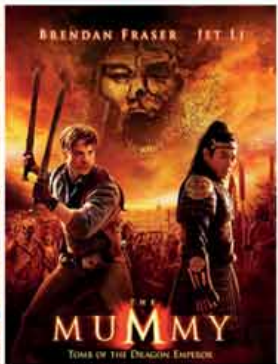
(29.1.2017) 3:26 PM The Mummy (Tomb of the Dragon Emperor)