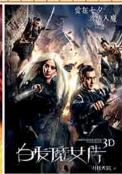
(25.1.2017) 9:10 PM The White Haired Witch of Lunar Kingdom