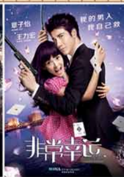
(26.1.2017) 3:27 PM My Lucky Star