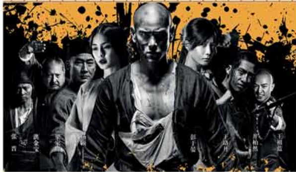
(23.1.17) 7:00 PM Rise of the legend