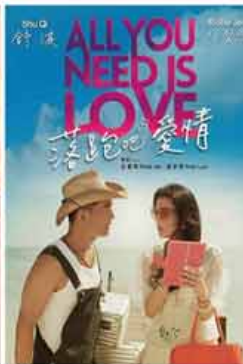
(30.1.2017) 5:14 PM All You Need Is Love