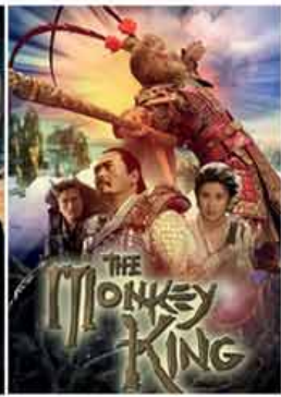
(27.1.2017) 7:00 PM The Monkey King