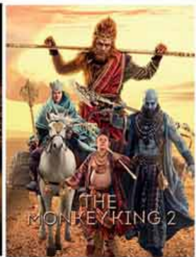
(28.1.2017) 7:00 PM The Monkey King 2