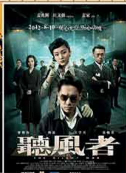
(24.1.17) 3:14 PM The Silent War