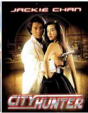
(28.1.2017) 5:18 PM City Hunter