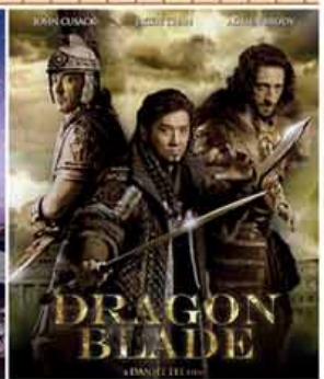
(26.1.2017) 8:38 PM Dragon Blade