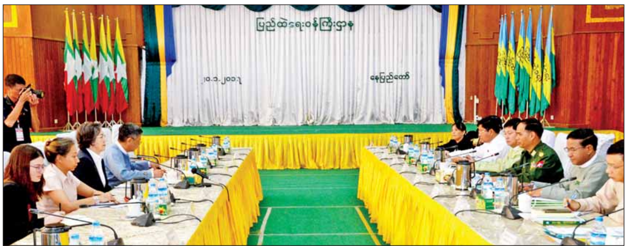
ပြည်ထဲရေး ဝန်ကြီးဌာန ပြည်ထောင်စုဝန်ကြီး ဒုတိယဗိုလ်ချုပ် ကြီး ကျော်ဆွေနှင့်တွေ့ဆုံစဉ် ကုလ

ပြန်ကြားရေး ဝန်ကြီးဌာန ပြည်ထောင်စုဝန်ကြီး ဒေါက်တာ ဖေမြင့်နှင့်တွေ့ဆုံစဉ် ဝန်ကြီးဌာနမှ စီမံခန့်ခွဲလျက်ရှိသည့် ပုံနှိပ်ခြင်းနှင့် ထုတ်ဝေခြင်းလုပ်ငန်းဥပဒေ၊ သတင်း မီဒီယာဥပဒေ၊ ရုပ်မြင်သံကြားနှင့် အသံထုတ်လွှင့်ခြင်းဆိုင်ရာ ဥပဒေ