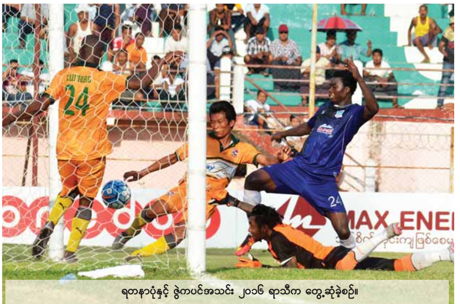
ရတနာပုံနှင့် ဇွဲကပင်အသင်း ၂၀၁၆ ရာသီက တွေ့ဆုံခဲ့စဉ်။

ပွဲစဉ်(၂)အဖြစ် ဇန်နဝါရီ ၂၀ ရက်တွင် ပုသိမ်တွင်း၌ ဧရာဝတီအသင်းနှင့်မကွေးအသင်း၊ သုဝဏ္ဏကွင်း၌ GFA အသင်းနှင့် ရှမ်းယူနိုက်တက်အသင်း၊ ဇန်နဝါရီ ၂၂ရက်တွင် မန္တလေးသီရိတွင်း၌ ရတနာပုံအသင်းနှင့် ဇွဲကပင်အသင်း၊ အောင်ဆန်းတွင်း၌ ချင်းယူနိုက်တက်အသင်းနှင့် Southern အသင်း၊ တောင်ငူတွင်း၌ ဟံသာဝတီအသင်းနှင့် နေပြည်တော်အသင်း၊ ဇန်နဝါရီ ၂၃ ရက်တွင် သေသလီတွင်း၌ ရခိုင်အသင်းနှင့်ရန်ကုန်အသင်းတို့ ယှဉ်ပြိုင်ကစားမည် ဖြစ်သည်။ ပွဲစဉ်(၁)တွင် လက်ရှိချန်ပီယံ ရတနာပုံအသင်းနိုင်ပွဲပျောက်ဆုံးကာ သရေကျခဲ့သော်လည်း ချန်ပီယံဟောင်း ရန်ကုန်၊ ရှမ်းယူနိုက်တက်၊ ဧရာဝတီ၊ ဇွဲကပင်အသင်းတို့ အနိုင်ရခဲ့သည်။ ရတနာပုံ၊ ချင်းယူနိုက်တက်၊ ရခိုင်၊ Southern အသင်းတို့ သရေကျခဲ့ပြီး မကွေး၊ နေပြည်တော်၊ ဟံသာဝတီနှင့် GFA အသင်းတို့ ရှုံးပွဲကြုံတွေ့ခဲ့သည်။ ပွဲစဉ် (၁) တွင် နိုင်ပွဲရထားသည့်အသင်းများအားလုံးမှာ စာမျက်နှာ ၉ ကော်လံ ၃ သို့ ○