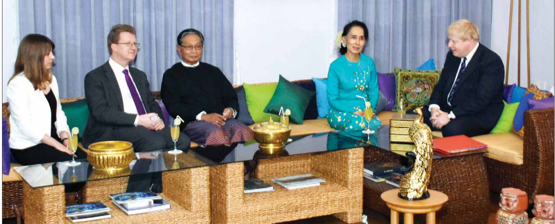
နိုင်ငံတော်၏အတိုင်ပင်ခံပုဂ္ဂိုလ် ဒေါ်အောင်ဆန်းစုကြည်နှင့် ပြတိန်နိုင်ငံခြားရေးဝန်ကြီး မစ္စတာ ဘောရစ်ဂျွန်ဆင်တို့ တွေ့ဆုံစဉ်။ (သတင်းစဉ်)

နိုင်ငံတော်၏အတိုင်ပင်ခံပုဂ္ဂိုလ် နိုင်ငံခြားရေးဝန်ကြီးဌာန ပြည်ထောင်စုဝန်ကြီး ဒေါ်အောင်ဆန်းစုကြည်သည် ပြတိန်နိုင်ငံခြားရေးဝန်ကြီး မစ္စတာ ဘောရစ်ဂျွန်ဆင် ဦးဆောင်သည့် ကိုယ်စားလှယ်အဖွဲ့အား ယနေ့ညနေ ၆ နာရီတွင် နေပြည်တော် ဇေယျာသီရိမြို့နယ်ရှိ နေအိမ်၌ ညစာစားပွဲဖြင့် တည်ခင်းညှိနှိုင်းခဲ့သည်။ စာမျက်နှာ ၃ ကော်လံ ၆ သို့ ❖