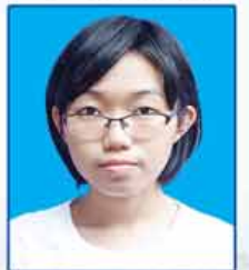
မစိုးရွှေသော် ဆရာက-၅၇၇ (ရန်ကုန်မြို့)