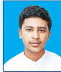
ဟောင်မျိုးမင်းသိန်း ဆရာက-၅၀၂ (မန်းမော်မြို့)