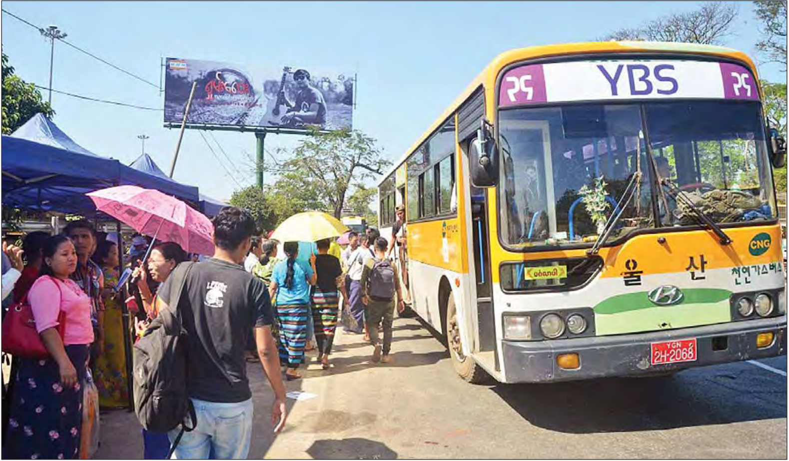
ရန်ကုန်ဘတ်စ်ကားလိုင်းစနစ်သစ်တွင် ပြေးဆွဲလျက်ရှိသည့် YBS ခရီးသည်တင်ယာဉ်ကို တွေ့ရစဉ်။

ရန်ကုန် ဇန်နဝါရီ ၁၉ ရန်ကုန်တိုင်းဒေသကြီး အစိုးရအနေ ဖြင့် ရန်ကုန်မြို့နေပြည်သူများအတွက် ကောင်းမွန်သည့် ဝန်ဆောင်မှုကို ပေးနိုင်ရန် အများပြည်သူသယ်ယူ ပို့ဆောင်ရေးယာဉ်လိုင်းစနစ် (YBS) တစ်ခုကို ပြောင်းလဲခဲ့ပြီဖြစ်သည်။ ပြောင်းလဲခြင်း အစပြုမှု၏ နောက်ကွယ်တွင် ပြည်သူ့ ယာဉ် ပိုင်ရှင်၊ ယာဉ်မောင်းနှင့် မထသ ဝန်ထမ်းများ အခက်အခဲအချို့နှင့် ကြုံတွေ့ခဲ့ရသည်။ ထိုအခက်အခဲများ ကိုကျော်လွှား၍ ကောင်းမွန်သည့် ခရီးသွားဝန်ဆောင်မှုစနစ်တစ်ခုရရှိ လာစေရန် တိုင်းဒေသကြီးအစိုးရအဖွဲ့ အနေဖြင့် ကြိုးစားဆောင်ရွက်လျက် ရှိသည်။ ထိုသို့ ဆောင်ရွက်ရာတွင် ပြောင်းလဲလိုက်သည့် စနစ်နှင့် ပတ်သက်၍ ပြည်သူတို့လက်ရှိ ကြုံတွေ့နေရသည့် အခက်အခဲများ အပြင် ဆက်လက်ဆောင်ရွက်သွား မည့်အပေါ် ကရင်တိုင်းရင်းသား လူမျိုးရေးရာဝန်ကြီး နော်ပန်းသဏ္ဍာ မျိုးအား သွားရောက်တွေ့ဆုံမေးမြန်း ခဲ့သည်များကို ဖော်ပြလိုက်ပါ သည်။ စာမျက်နှာ ၆ ကော်လံ ၁ သို့ □