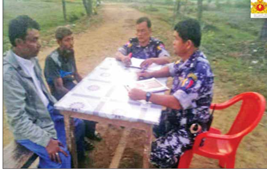
ရေခဲခရိုင်ဒေသများ ရွာမှ ဆယ်အိမ်များ မာမောက်ရော်ရီးအား မေးမြန်းစဉ်။