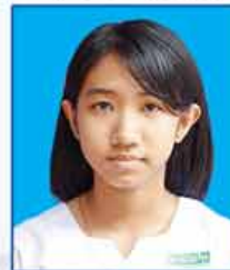
မမြတ်သီရိနှယ် ဆရာက-၅၃၉ (ရန်ကုန်မြို့)