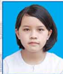
မဖြူပွင့်မြယ် ဆရာက-၄၀၅ (ရန်ကုန်မြို့)