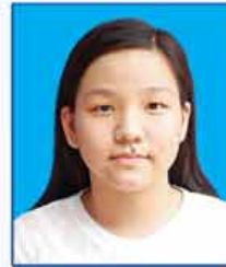
မမြတ်သီရိကျော် ဆရာက-၄၆၂ (ရန်ကုန်မြို့)