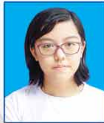
မဖြူဖွန်ကြည် ဆရာက-၄၆၄ (ရန်ကုန်မြို့)