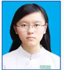
မပြည့်ကြည်သာချော ဆရာက-၄၀၄ (ရန်ကုန်မြို့)