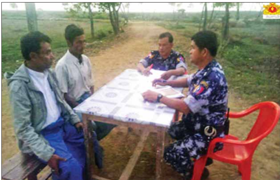
ရေခဲခရိုင်ဒေသများ ရပ်မိရပ်ဖ မာမောက်တာလောင်အား မေးမြန်းစဉ်။

အလားတူ ရေခဲခရိုင်ဒေသများ ဆယ်အိမ်များ မာမောက်ရော်ရီးက မိမိမှာ ရေခဲခရိုင်ဒေသများ ရှာ နေထိုင်သူဖြစ်ပြီး လွန်ခဲ့သည့် ၁၄ ရက်က ဆယ်အိမ်များ တာဝန်ထမ်းဆောင်ကြောင်း၊ Zafor Alam ကို ကောင်းစွာသိရှိကြောင်း၊ အိမ်ထောင်စု ၁၁၂ တွင် နေထိုင်သူဖြစ်ပြီး လွန်ခဲ့သည့် နှစ်လခန့်က ဘင်္ဂလားဒေ့ရှ် နိုင်ငံသို့ ထွက်ပြေးသွားသည်ဟု သိရကြောင်း၊ ၂၀၁၆ ခုနှစ် ဒီဇင်ဘာ ၄ ရက်၊ ၅ ရက်တို့တွင် ဦးရှင်းကျားချောင်း နှင့် ချောင်းဝတွင် ဘင်္ဂလားဒေ့ရှ်နိုင်ငံသို့ ခိုးထွက်သည့် လောင်းလှေတိုင်းမှောက်သည်ကို မကြားသိကြောင်း၊ မြန်မာနယ်ခြားစောင့်ရဲတပ်ဖွဲ့မှ သေနတ်များဖြင့် ပစ်ခတ်မှုကြောင့် ကလေးငယ်များနှင့် အမျိုးသမီး များ သေဆုံးကြောင်းကို မကြားသိကြောင်း ပြောကြား သည်။