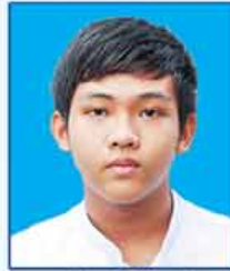
ဟောင်ဘန်းမြင့်ကျော် ဆရာက-၄၅၆ (ပဲခူးမြို့)

၂၀၁၆ ခုနှစ် တက္ကသိုလ်ဝင်တန်းစာမေးပွဲ ဘာသာစုံဂုဏ်ထူးရ ကျောင်းသား၊ ကျောင်းသူများ