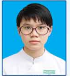
မကေခိုင်ကြွယ် ဆရာက-၄၆၅ (တောင်ကြီးမြို့)