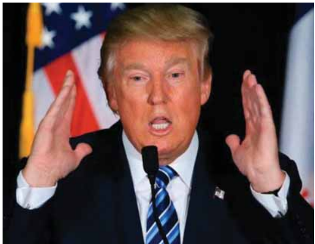
အမေရိကန်သမ္မတအသစ် ဒေါ်နယ်ထရန်န့် လက်ထက်တွင် ကုန်သွယ်မှုဆိုင်ရာ အတားအဆီးများ ချမှတ်လာမည်ကို တရုတ်နိုင်ငံအနေဖြင့် စိုးရိမ်လျက်ရှိသည်။

ဒီသဘောတူညီချက်ကို မိမိတို့နိုင်ငံအလိုက် ပြည်တွင်းဥပဒေတွေနဲ့အညီ အတည်ပြု(ratify) ကြဖို့ အချိန်ကာလ နှစ်နှစ် သတ်မှတ်ပေးထားပါတယ်။ သတ်မှတ်ချက်တွေအရ ၂၀၁၈ ခုနှစ်မှာ အဖွဲ့ဝင် ၁၂ နိုင်ငံလုံး အတည်မပြုနိုင်