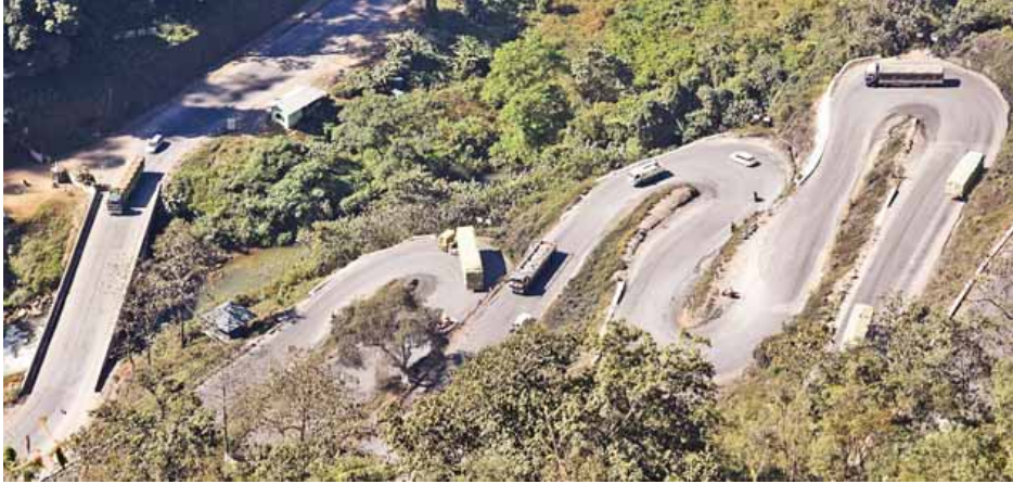
ဂုတ်တွင်းခြောက်ထပ်ကွေ့ သွားလာမှုအဆင်ပြေနေသည်ကိုတွေ့ရစဉ်။

ညပိုင်းတွေမှာလည်း ပိတ်တာပါပဲ။ ကျွန်တော်တို့ကတော့ နေ့မနား၊ ညမအားကားပိတ်ပီဆိုရင် အချိန်မရွေး ရှင်းပေးနေပါတယ်။ လမ်းက အတတ်ကားရော၊ အဆင်းကားပါဆိုတော့ အတတ်ကားများရင် အတတ်ကားကို ဦးစားပေးပြီး အဆင်းကားများရင် တော့အဆင်းကို ဦးစားပေးရတာပေါ့။ အခုရက်ပိုင်းဆိုရင် မော်တော်ယာဉ်တွေ အလွန်များတယ်။ သစ်သီးပေါ်ချိန်ပိုလို့ အတတ်ကားတွေများသလို