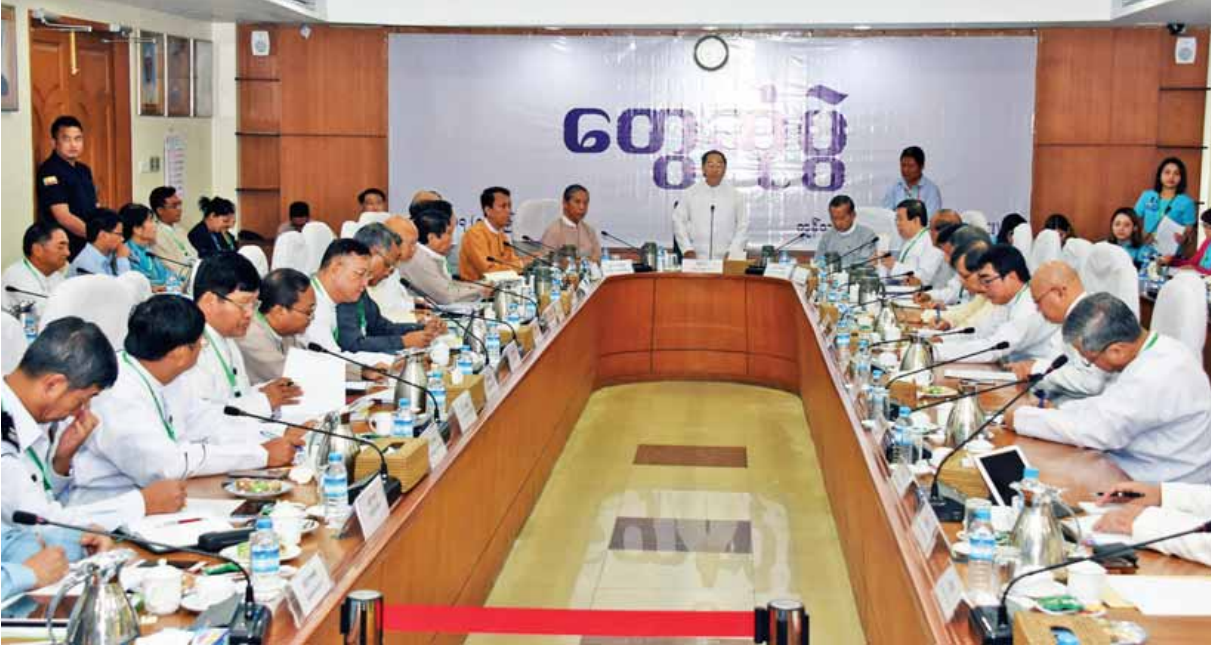
မြန်မာ့စီးပွားရေးလုပ်ငန်းရှင်များ ဒုတိယအကြိမ် ပုံမှန်တွေ့ဆုံပွဲတွင် ပုဂ္ဂလိကကဏ္ဍ ဖွံ့ဖြိုးတိုးတက်ရေးကော်မတီဥက္ကဋ္ဌ ဒုတိယသမ္မတ ဦးမြင့်ဆွေ အမှာစကားပြောကြားစဉ်။ (သတင်းစဉ်)