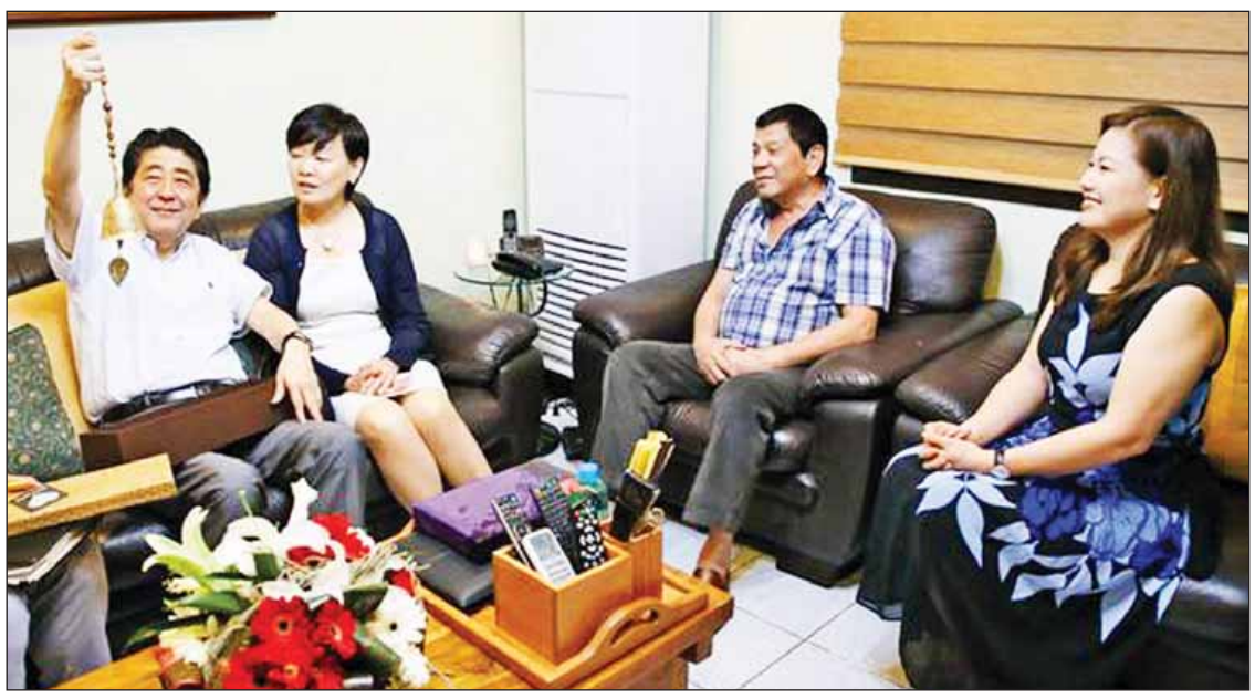
ပွဲသို့ တက်ရောက်ခဲ့သည်။ နှစ်နိုင်ငံဒေသတွင်း အဖွဲ့ဝန်ကြီးအချို့လည်း တက်ရောက်ခဲ့သည်။ သည် အရေးပါကြောင်း ဝန်ကြီးချုပ် ရှင်ဒိုအာဘေးက ပြောကြားခဲ့ပြီး ဖိလစ်ပိုင် နိုင်ငံမှ ချမှတ်သော မူဝါဒများကို ဂျပန်နိုင်ငံ

ထို့နောက် ခေါင်းဆောင်နှစ်ဦးတို့သည် ဟိုတယ်တစ်ခု၌ကျင်းပသည့် အစည်းအဝေး