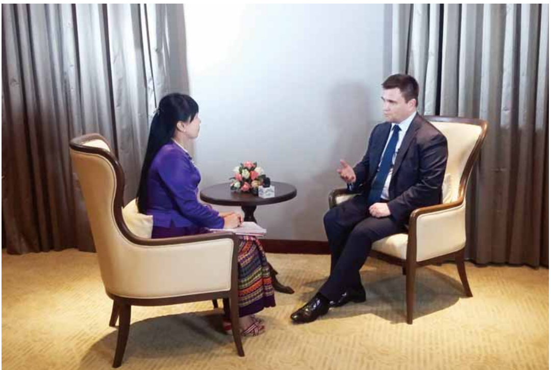
ယူကရိန်း နိုင်ငံခြားရေး ဝန်ကြီး ပါဗလို ကလင်းကင်အား တွေ့ဆုံ မေးမြန်းစဉ်

ဖြေ - မြန်မာနိုင်ငံမှာ ကိုင်တွယ်ဖြေရှင်းရမယ့် စိန်ခေါ်မှုတွေ အများကြီးရှိ နေတယ်ဆိုတာ ကျွန်တော်ယုံပါတယ်။ ဒါဟာ အလွန်ကို အရေးကြီးပါတယ်။ မြန်မာနိုင်ငံခေါင်းဆောင်တွေနဲ့ ကျွန်တော်တွေ့ဆုံဆွေးနွေးတဲ့အခါမှာ ပြုပြင် ပြောင်းလဲရေးနဲ့ ပတ်သက်တဲ့ ရှင်းလင်းပြတ်သားတဲ့ ကတိကဝတ်တွေကိုသိခဲ့ရ ပါတယ်။ နယ်ပယ်တော်တော်များများမှာလည်း သဘောတူညီချက်တွေရရှိခဲ့ပါ တယ်။ ဒုတိယအချက်အနေနဲ့ ဒါဟာ ပြုပြင်ပြောင်းလဲရေးနဲ့ပတ်သက်တဲ့ ကတိကဝတ်လို့ပဲ ကျွန်တော်မြင်ပါတယ်။ မြန်မာခေါင်းဆောင်တွေရဲ့ဆောင် ရွက်ချက်အပေါ် အပြုသဘောလို့ပဲမြင်ပါတယ်။ မြန်မာပြည်သူတွေ ရင်ဆိုင် နေရတဲ့စိန်ခေါ်မှုတွေကို ကိုင်တွယ်ဖြေရှင်းနေတဲ့ မြန်မာနိုင်ငံခေါင်းဆောင်တွေက ဘယ်လိုကြိုးစား လုပ်ဆောင်ခဲ့သလဲဆိုတာကို ကျွန်တော်အပြုသဘောအနေနဲ့ မြင်ပါတယ်။