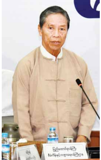
ပြည်ထောင်စုဝန်ကြီး ဦးကျော်ဝင်း

တရားမဝင် ကုန်စည်စီးဆင်းမှု မရှိစေရေးအတွက် ဆောင်ရွက်နေသည့် သက်ဆိုင်ရာအဖွဲ့အစည်းအသီးသီးမှ ဝန်ထမ်းများအားလုံး၏ လုပ်ငန်းတာဝန်များကို အကတိလိုက်စားမှု ကင်းရှင်းအောင်ဆောင်ရွက်ထားကြောင်း၊ တရားမဝင်