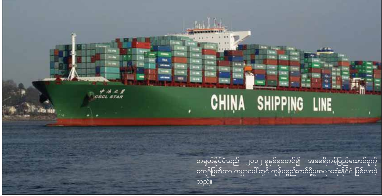
တရုတ်နိုင်ငံသည် ၂၀၁၂ ခုနှစ်မှစတင်၍ အမေရိကန်ပြည်ထောင်စုကို ကျော်ဖြတ်ကာ ကမ္ဘာပေါ်တွင် ကုန်ပစ္စည်းတင်ပို့မှုအများဆုံးနိုင်ငံ ဖြစ်လာခဲ့သည်။

ရည်ညွှန်းချက် - (၃၁-၁၀-၂၀၁၆) ရက်နေ့ထုတ် South China Morning Post သတင်းစာပါ Rick Tang ၏ Steered by equals ဆောင်းပါးကို အခြေပြု၍ ရေးသားပါသည်။