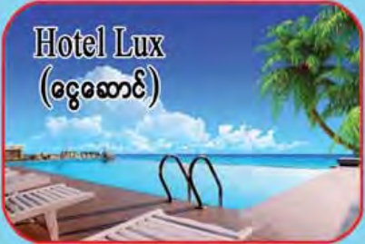
Hotel Lux (ငွေဆောင်)