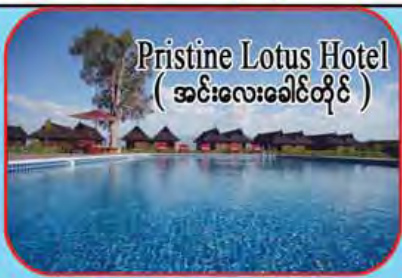
Pristine Lotus Hotel (အင်းလေးခေါင်တိုင်)