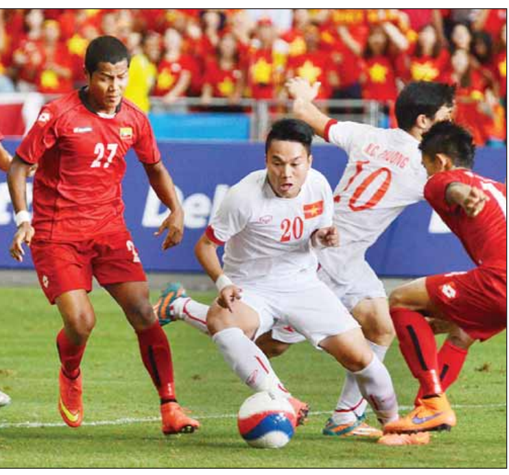
(၂၈)ကြိမ်မြောက် ဆီးဂိမ်းပြိုင်ပွဲတွင် မြန်မာအသင်း ယှဉ်ပြိုင်ခဲ့မှုကို တွေ့ရစဉ်။

မြန်မာနိုင်ငံ ဘောလုံးအဖွဲ့ချုပ်သည် ဩဂုတ်လတွင် မလေးရှားနိုင်ငံ၌ ကျင်းပမည့် (၂၉)ကြိမ်မြောက် ဆီးဂိမ်းပြိုင်ပွဲတွင် အောင်မြင်မှုရရှိရန် စတင်ပြင်ဆင်နေပြီဖြစ်ပြီး ယူ-၂၂ အမျိုးသားဘောလုံးအသင်းကိုလည်း စနစ်တကျ လေ့ကျင့်ပြင်ဆင်မည်ဖြစ်သည်။ မြန်မာအမျိုးသားဘောလုံးအသင်းသည် (၂၈)ကြိမ်မြောက် ဆီးဂိမ်းပြိုင်ပွဲတွင် ငွေတံဆိပ် ရခဲ့သောကြောင့် ယခုပြိုင်ပွဲတွင် အောင်မြင်မှု ရရန် ကြိုးပမ်းနေခြင်းဖြစ်သည်။