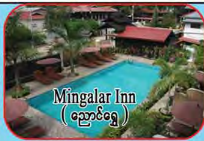
Mingalar Inn (ညောင်ရွှေ)