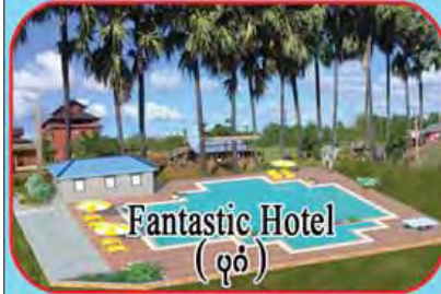
Fantastic Hotel (ပုဂံ)