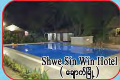
Shwe Sin Win Hotel (ချောက်မြို့)