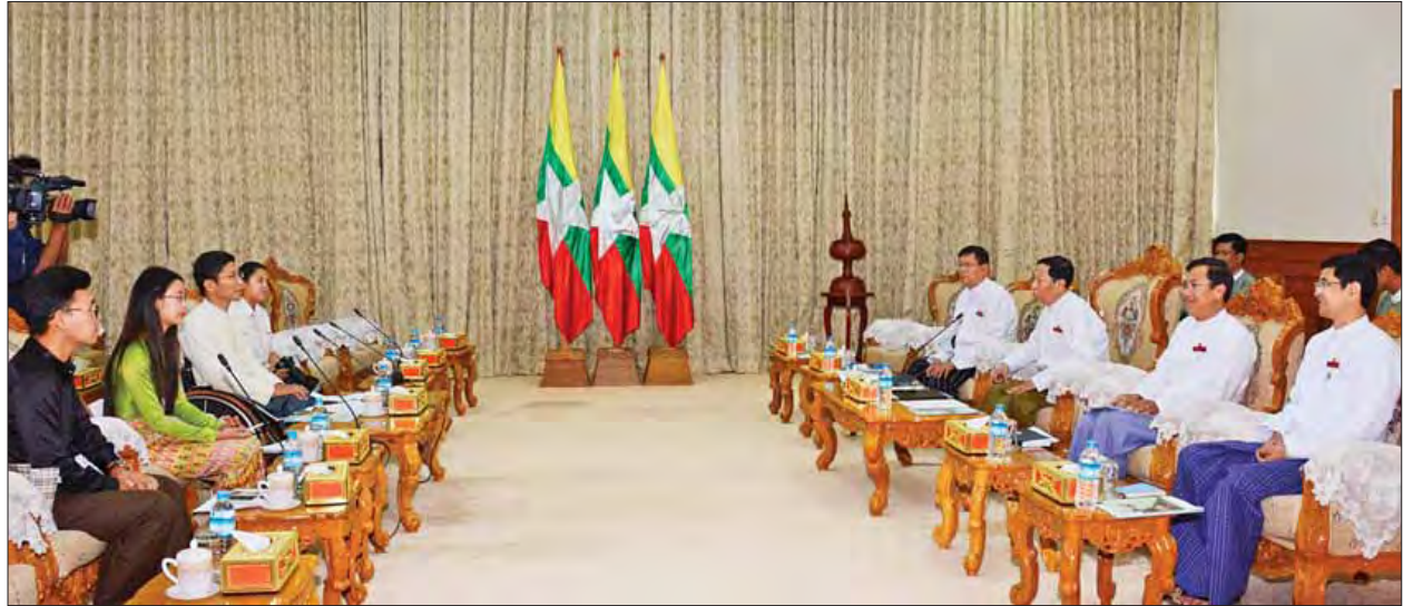
ပြည်ထောင်စုရွေးကောက်ပွဲကော်မရှင်ဥက္ကဋ္ဌ ဦးလှသိန်း မြန်မာနိုင်ငံ မသန်စွမ်းသူများရွှေ့ဆောင်အဖွဲ့ (MILI) မှ ဦးနေလင်းစိုးနှင့်အဖွဲ့အား လက်ခံတွေ့ဆုံသည်။ (သတင်းစဉ်)

နေပြည်တော် ဇန်နဝါရီ ၁၂ ပြည်ထောင်စုရွေးကောက်ပွဲကော်မရှင်ဥက္ကဋ္ဌ ဦးလှသိန်းသည် မြန်မာနိုင်ငံ မသန်စွမ်းသူများရွှေ့ဆောင်အဖွဲ့ (MILI) မှ ဦးနေလင်းစိုးနှင့် အဖွဲ့အား ယနေ့ နံနက် ၁၀ နာရီတွင်လည်းကောင်း၊ မြန်မာနိုင်ငံဆိုင်ရာ တရုတ်နိုင်ငံသံအမတ်ကြီး မစ္စတာ ဟန်လျန်နှင့်အဖွဲ့အား ယနေ့မွန်းလွဲ ၂ နာရီတွင်လည်းကောင်း နေပြည်တော် ရှိ ပြည်ထောင်စုရွေးကောက်ပွဲကော်မရှင်ဥက္ကဋ္ဌနှင့် ဧည့်ခန်းမဆောင်၌ သီးခြားစီ လက်ခံတွေ့ဆုံသည်။