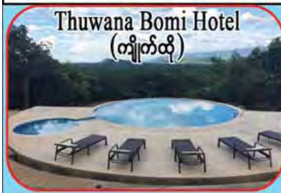
Thuwana Bomi Hotel (ကျိုက်ထို)

ကျွန်တော်တို့ ကုမ္ပဏီနှင့် ရေကူးကန်လုပ်ငန်းများဆောင်ရွက်ခဲ့ကြသော ဟိုတယ်ပိုင်ရှင် သူဌေးမင်းများ တစ်နှစ်ပတ်လုံး ဧည့်သည် မပြတ် ဝင်လာမစဲတသံသံနှင့် ဥစ္စာစီးပွားဒီရေအလားတိုးတက်ကြပါစေကြောင်း နှစ်သစ်ကူးဆုမွန်ကောင်းတောင်းအပ်ပါသည်။