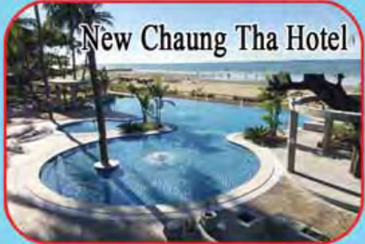
New Chaung Tha Hotel