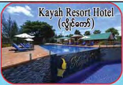
Kayah Resort Hotel (လွိုင်တော်)