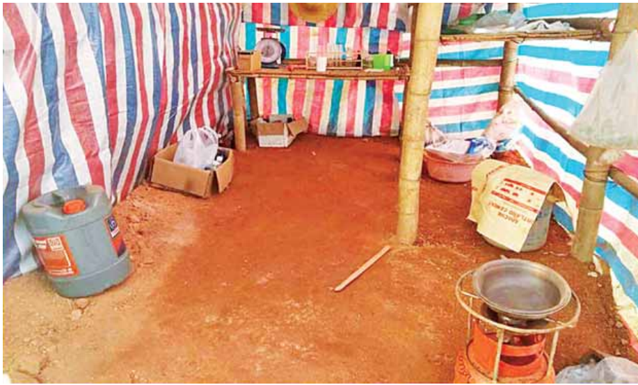
များနှင့်အတူ ဖမ်းဆီးရမိသူများအား ဆောင်ရွက်နိုင်ရန် တာချီလိတ် တရားဥပဒေအရ အရေးယူ မြို့နယ် ရဲတပ်ဖွဲ့မှူးရုံးသို့ စနစ်တကျ လွှဲပြောင်းအပ်နှံခဲ့ကြောင်း သတင်းရရှိသည်။ (သတင်းစဉ်)

ရွှမ်းပြည်နယ်(အရှေ့ပိုင်း) တာချီလိတ်မြို့နယ် ဟေ့လှမ်းကျေးရွာအနီး တစ်ဝိုက်၌ တရားမဝင် ရွှေသတ္တုတူးဖော်လုပ်ကိုင်နေကြောင်း သတင်းအရ ယနေ့နံနက် ၄ နာရီခန့်တွင် တပ်မတော်စစ်ကြောင်းက သွားရောက်ရှင်းလင်းရာ ဟေ့လှမ်းကျေးရွာ၏ အနောက်တောင်ဘက် မီတာ ၂၀၀၀ ခန့်အကွာ၌ တရားမဝင် ရွှေသတ္တုတူးဖော်နေသော တစ်ဖက်နိုင်ငံသား ရှစ်ဦးနှင့် မြန်မာနိုင်ငံသား ၂၀ တို့ကို ရွှေတူးဖော်ရာတွင် အသုံးပြုသည့် ဘက်ဟိုး သုံးစီး၊ ဒိုဇာ တစ်စီး၊ မြေသယ်ယာဉ် တစ်စီး၊ မော်တော်ယာဉ် တစ်စီး၊ ရေစုပ်စက် သုံးလုံး၊ မီးစက် တစ်လုံး၊ လူနေတဲ သုံးလုံးတို့နှင့်အတူ ဖမ်းဆီးရမိခဲ့သည်။ အဆိုပါယာဉ်များ၊ ဆက်စပ်ပစ္စည်းများနှင့်အတူ ဖမ်းဆီးရမိသူများအား ဆောင်ရွက်နိုင်ရန် တာချီလိတ် တရားဥပဒေအရ အရေးယူ မြို့နယ် ရဲတပ်ဖွဲ့မှူးရုံးသို့ စနစ်တကျ လွှဲပြောင်းအပ်နှံခဲ့ကြောင်း သတင်းရရှိသည်။ (သတင်းစဉ်)