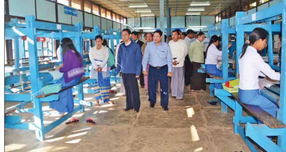
ပြည်ထောင်စုဝန်ကြီး ဒေါက်တာအောင်သူ ရက်ကန်းသင်တန်းခန်းမအတွင်း လှည့်လည်ကြည့်ရှုစဉ်။ (သတင်းစဉ်)

ပြည်ထောင်စုဝန်ကြီး ဒေါက်တာအောင်သူက ဆွေးနွေးပြောကြားသည်။ အခမ်းအနားတွင် အသေးစားစက်မှုလက်မှုလုပ်ငန်း ဦးစီးဌာန ညွှန်ကြားရေးမှူးချုပ်က အသက်မွေးဝမ်းကျောင်းပညာသင်တန်းများ ပို့ချသင်ကြားပေးနေမှုအခြေအနေများ ရှင်းလင်းတင်ပြရာ ပြည်ထောင်စုဝန်ကြီးက သင်ရိုးညွှန်းတမ်းများ အဆင့်မြှင့်တင်တိုးချဲ့ဆောင်ရွက်ရန် လိုအပ်ချက်များ ဆွေးနွေးမှာကြားသည်။ ထို့နောက် မွန်မျိုးစုံသင်တန်းခန်းမဆောင်နှင့် သင်တန်းသားများ လက်တွေ့ထုတ်လုပ်ထားသော တန်ဖိုးမြင့် ကုန်ချောပစ္စည်းများကိုလည်းကောင်း၊ ရက်ကန်းသင်တန်းခန်းမအတွင်း စက်ရက်ကန်း၊ လက်ရက်ကန်း၊ ဂျပ်ခတ်နှင့် ကြာချည်ထုတ်လုပ်နေမှုများကိုလည်းကောင်း လှည့်လည်ကြည့်ရှုအားပေးသည်။ ထိုမှတစ်ဆင့် တောင်ကြီးခရိုင် ညောင်ရွှေမြို့နယ် ရှမ်းရိုးမမွေးမြူရေးဇုန်သို့ ရောက်ရှိကြပြီး စုဝေးဆောင်ခန်းမတွင် ဇုန်အတွင်းရှိ ဥတားကြက်မွေးမြူထုတ်လုပ်သူ လုပ်ငန်းရှင်များနှင့်တွေ့ဆုံ၍ မွေးမြူရေးလုပ်ငန်းရှင်များ