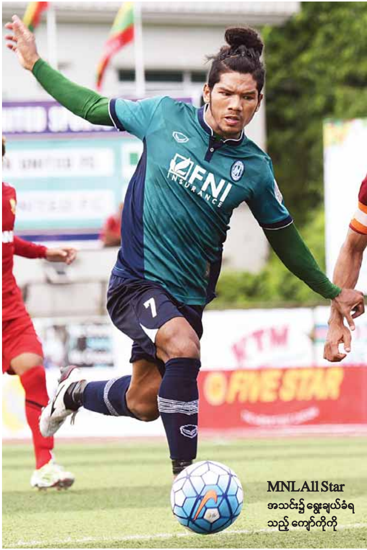
MNL All Star အသင်း၌ ရွေးချယ်ခံရ သည့် ကျော်ကိုကို