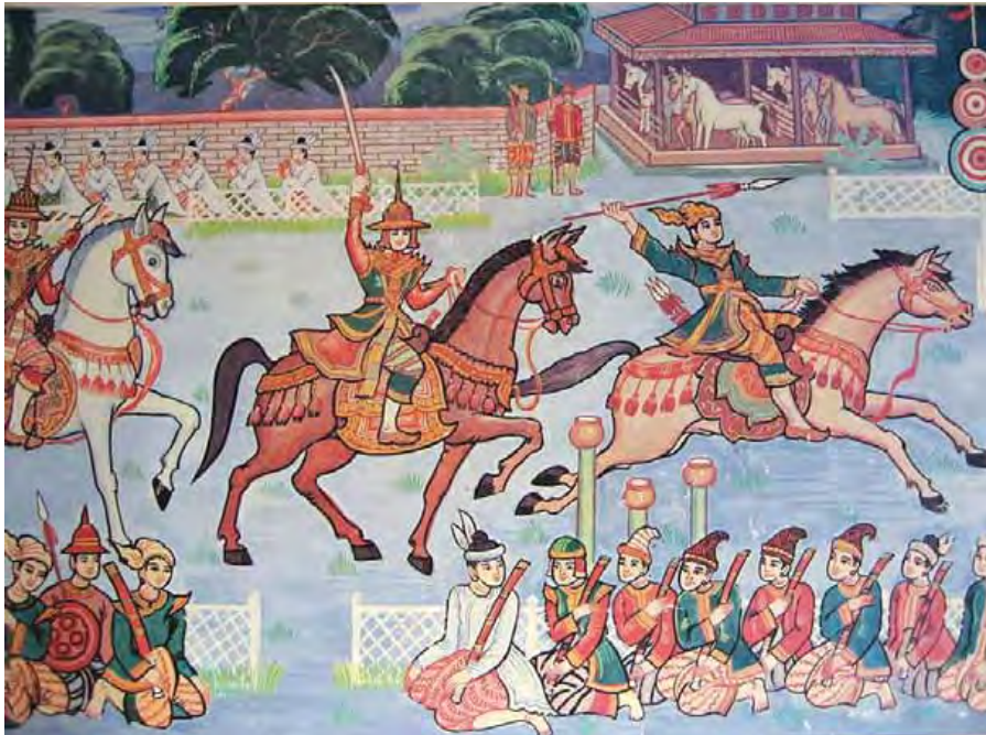
ဆင်လည်းမုန်ပြင်း၊ မြင်းခင်းပွဲတော်”

“သည်တွင်ရတု၊ မြင်း၊ ဆင်၊ ခြေသည် စွယ်ရှည်ဖွေးဖွေးမုန်စွေးစွေးနှင့် ခိုင်းလေး သေနတ်၊ ပစ်ခတ်ခင်းကျင်း၊ မြင်းလည်းတလျှောက်၊ ဆင်ပေါက်ဦးစီး၊ မျိုးကြီးမတ်များ ရွှေသားစိုစို၊ မောက်တို့ မောက်လူ၊ လှံယူစားစွဲ၊ လက်ဝဲလက်၊ တီးပါအတည်၊ မြင်းရှည်မြင်းတို၊ ကိုယ်ကိုဝတ်ဆင်၊ ရွှေဖျင်အင်္ကျီ၊ ပုစွန်ဆီနှင့် နီလာမြသွေး၊ စိုင်းနှင့်ပြေး၍၊ မြင်းရေယှဉ်ပြိုင်၊ စက်တိုင်စက်ကွင်း၊ စီးနင်းထိုးဖောက်၊ ရှေ့နောက်ဆုတ်ဝင်၊