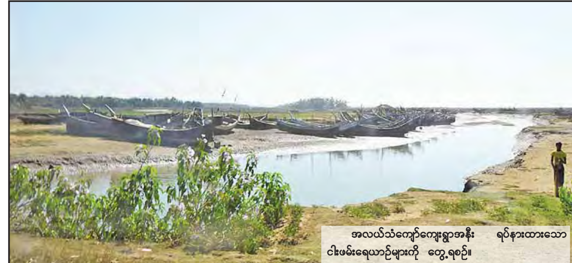
အလယ်သံကျော်ကျေးရွာအနီး ရပ်နားထားသော ငါးဖမ်းရေယာဉ်များကို တွေ့ရစဉ်။

မောင်တော ဇန်နဝါရီ ၁၀ ရခိုင်ပြည်နယ် မောင်တောမြို့နယ်အတွင်း အကြမ်းဖက်မှု ဖြစ်စဉ်များဖြစ်ပွားခဲ့မှုကြောင့် ရပ်နားထားရသော ငါးဖမ်းရေယာဉ်များအား ခုတ်မောင်းပြေးဆွဲခွင့်လိုင်စင်၊ ငါးဖမ်းခွင့်လိုင်စင်များနှင့် ရေယာဉ်မှတ်ပုံတင်များ ကျေးရွာအရောက် ကွင်းဆင်းပြုလုပ်ပေးရေး ညှိနှိုင်းအစည်းအဝေးကို မောင်တောမြို့ရှိ ခရိုင်အထွေထွေ အုပ်ချုပ်ရေးဦးစီးဌာန အစည်းအဝေးခန်းမ၌ ယနေ့ညနေ ၄ နာရီက ကျင်းပခဲ့သည်။ ရခိုင်ပြည်နယ် ကမ်းရိုးတန်းတစ်လျှောက် အခြေစိုက်နယ်မြေများရှိ ငါးဖမ်းစက်လှေများကို ပြည်နယ်ရေကြောင်း ပို့ဆောင်ရေး ညွှန်ကြားမှုဦးစီးဌာန၊ ပြည်နယ်ငါးလုပ်ငန်းဦးစီးဌာန၊ ပြည်နယ်အာမခံလုပ်ငန်း၊ ခရိုင်/မြို့နယ်ရဲတပ်ဖွဲ့ဝင်များ၊ မြို့နယ်အထွေထွေ အုပ်ချုပ်ရေးဦးစီးဌာနတို့ ပူးပေါင်းပြီး ကွင်းဆင်းတိုင်းတာ စစ်ဆေးခြင်းကို စစ်တွေမြို့နယ်၊ ပေါက်တောမြို့နယ်၊ ရမ်းဗြဲမြို့နယ် တို့တွင် ဆောင်ရွက်ပေးခဲ့ပြီးဖြစ်သည်။ ယခုအခါ မောင်တောမြို့နယ်အတွင်းရှိ အလယ်သံကျော်နယ်မြေအတွင်း မှတ်ပုံတင်ပေးရေးနှင့် ခုတ်မောင်းပြေးဆွဲခွင့်လိုင်စင်၊ ငါးဖမ်းခွင့်လိုင်စင်များ ကျေးရွာအရောက် ကွင်းဆင်းတိုင်းတာစစ်ဆေးပြီး ထုတ်ပေးနိုင်ရေး ဆောင်ရွက်သွားမည်ဖြစ်ကြောင်း သိရသည်။ မောင်တောမြို့နယ်အတွင်းရှိ ငါးဖမ်းစက်လှေများတွင် ကမ်းဝေးငါးဖမ်းလုပ်ငန်းများ ဆောင်ရွက်မှုမရှိဘဲ ကမ်းနီးငါးဖမ်းရေယာဉ်အစီးရေ ၃၀၀ကျော်ရှိကာ တစ်ပိုင်တစ်နိုင် ငါးဖမ်းစက်လှေ အစင်းရေ ၁၃၀၀ကျော်ရှိကြောင်း၊ ပြည်တွင်းစားသုံးမှု ဖူလုံစေရေးအတွက် ပင်လယ်ပြင်ငါးဖမ်းလုပ်ငန်းမှ အဓိကထုတ်လုပ်ရခြင်းဖြစ်ပြီး ပြည်တွင်းစားသုံးမှု၏ လေးပုံသုံးပုံခန့်မှာ ပင်လယ်ပြင်ငါးဖမ်းဆီးခြင်းမှ ရရှိနေခြင်းကြောင့် မောင်တောဒေသအတွင်း ငါးဖမ်းလုပ်ငန်းသည် ဒေသခံများ၏ အဓိကစီးပွားရေးလုပ်ငန်း