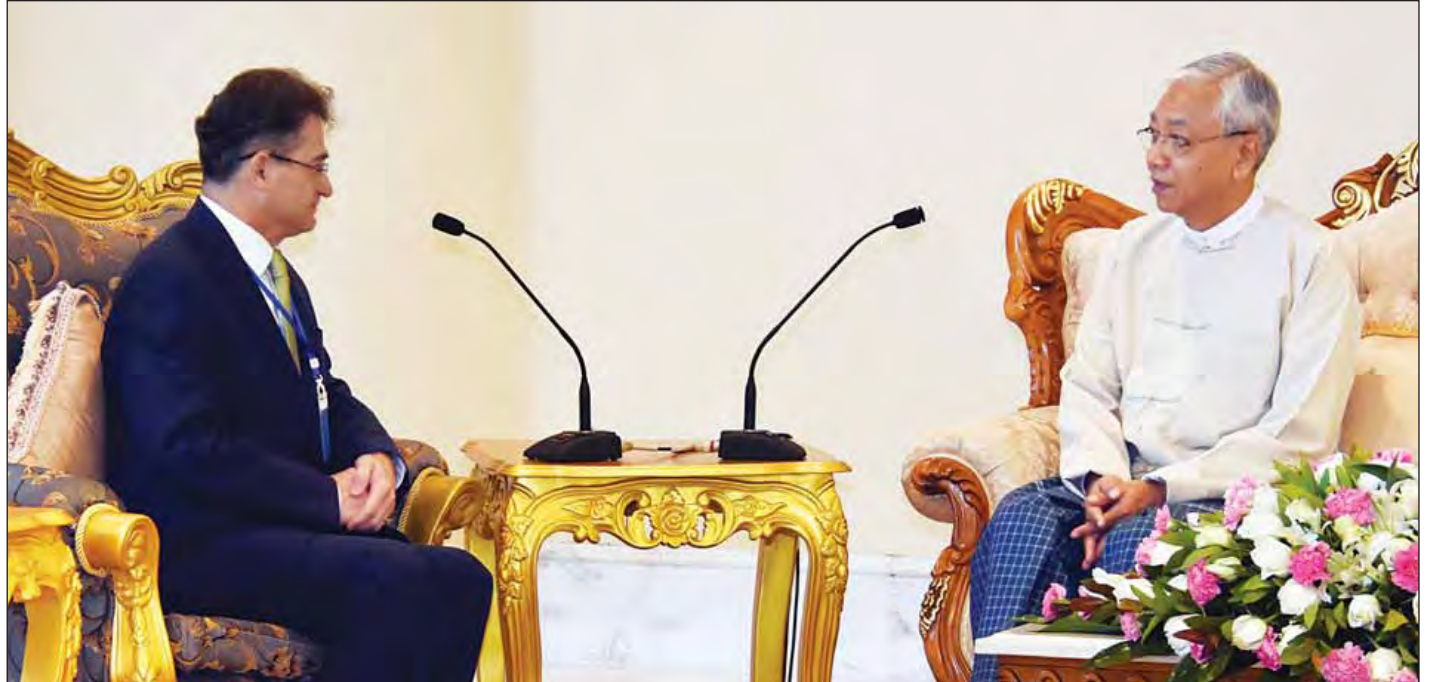
နိုင်ငံတော်သမ္မတ ဦးထင်ကျော် ချီလီနိုင်ငံ သံအမတ်ကြီး H.E.Mr.Javier Becker အား လက်ခံ တွေ့ဆုံစဉ်။ (သတင်းစဉ်)