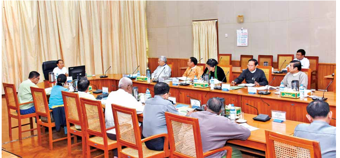
မောင်တောဒေသ စုံစမ်းစစ်ဆေးရေးကော်မရှင် အစည်းအဝေး (၁/၂၀၁၇) ကျင်းပစဉ်။ (သတင်းစဉ်)

နေပြည်တော် ဇန်နဝါရီ ၅ မြန်မာနိုင်ငံ၏ ငြိမ်းချမ်းရေးလုပ်ငန်းစဉ်အတွက် တရုတ်ပြည်သူ့သမ္မတနိုင်ငံ အစိုးရမှ ငွေကြေး ကူညီထောက်ပံ့မှု အခမ်းအနားကို ယနေ့နံနက်ပိုင်းတွင် နေပြည်တော်ရှိ နိုင်ငံခြားရေး ဝန်ကြီးဌာန၌ ကျင်းပရာ မြန်မာနိုင်ငံဆိုင်ရာ တရုတ်ပြည်သူ့သမ္မတနိုင်ငံ သံအမတ်ကြီး မစ္စတာဟုန်လျန်က အမေရိကန်ဒေါ်လာ တစ်သန်းကို နိုင်ငံခြားရေးဝန်ကြီးဌာန အမြဲတမ်း အတွင်းဝန် ဦးကျော်ဇေယျထံ ပေးအပ်သည်။ နိုင်ငံခြားရေးဝန်ကြီးဌာန အမြဲတမ်းအတွင်းဝန် ဦးကျော်ဇေယျက သံအမတ်ကြီး မစ္စတာဟုန်လျန်ထံ အမျိုးသားပြန်လည်သင့်မြတ်ရေးနှင့် ငြိမ်းချမ်းရေး ဗဟိုဌာန၏ ကျေးဇူးတင်ရှိကြောင်း စာလွှာကို ပြန်လည် ပေးအပ်ခဲ့သည်။ မြန်မာနိုင်ငံအမျိုးသားပြန်လည်သင့်မြတ်ရေးနှင့် ငြိမ်းချမ်းရေးလုပ်ငန်းစဉ်အတွက် တရုတ်နိုင်ငံမှ စုစုပေါင်း အမေရိကန်ဒေါ်လာ သုံးသန်း လှူဒါန်းသွားမည်ဖြစ်ကြောင်း သိရသည်။ (သတင်းစဉ်)