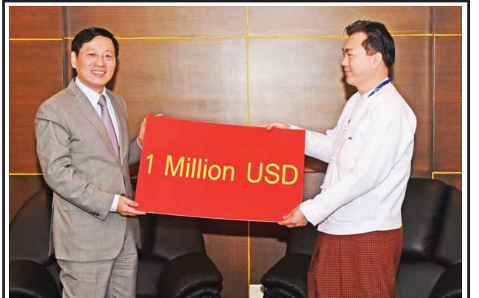
မြန်မာနိုင်ငံဆိုင်ရာ တရုတ်ပြည်သူ့သမ္မတနိုင်ငံ သံအမတ်ကြီး မစ္စတာ ဟုန်လျန် အမေရိကန်ဒေါ်လာ တစ်သန်းကို နိုင်ငံခြားရေးဝန်ကြီးဌာန အမြဲတမ်းအတွင်းဝန် ဦးကျော်ဇေယျထံ ပေးအပ်စဉ်။ (သတင်း-ကျော့ဖုံး) (သတင်းစဉ်)