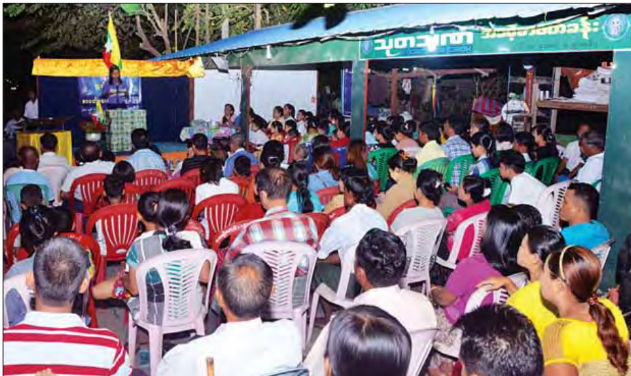
(၆၉)နှစ်မြောက် လွတ်လပ်ရေးနေ့ အထိမ်းအမှတ် စာဖတ်စွမ်းရည်သရုပ်ပြပွဲကို ဇန်နဝါရီ ၄ ရက်က သာကေတမြို့နယ် (၇) ဈေးလမ်းမကြီး ၁၀/တောင်ရှိ သုတဘဏ် (အခမဲ့) စာဖတ်ခန်းမ၌ကျင်းပရာ ကျောင်းသား ကျောင်းသူလေးများအား မခိုင်စုစုလှိုင်က သရုပ်ပြသရင်းပြစဉ်။