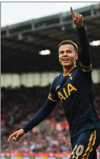
မေလဲသင်း -ရေးသားသည်

ဂိုးယဲလ်မက်ဒရစ်အသင်းသည် စပါးအသင်းမှ လူကာမိုဒရစ်၊ ဂါရတ်ဘေးလ်တို့ကိုလည်း ခေါ်ယူခဲ့ပြီးဖြစ်သလို အယ်လီရရှိရေးကိုလည်း ထပ်မံကြိုးပမ်းလာခြင်းဖြစ်သည်။ ပရိသတ်အများစုက အယ်လီအနေဖြင့် လာမည့်နှစ် ဈေးကွက်အရောက်တွင် ဂိုးယဲလ်မက်ဒရစ်သို့ ပြောင်းရွှေ့ကြေး ပေါင်သန်း ၆၀ ဖြင့် ပြောင်းရွှေ့မည့် သတင်းကိုပင် ကြားသိထားကြောင်း၊ အသက်(၂၀)အရွယ်အယ်လီ (၂၃)နှစ် မပြည့်မီမှာပင် ဂိုးယဲလ်သို့ ရောက်ရှိသွားမည်ဖြစ်ကြောင်း၊ စပါးသည် ကစားသမားကောင်းများစွာကို ပိုင်ဆိုင်ခဲ့ဖူးသော်လည်း အကြိမ်ကြိမ် ရောင်းချခဲ့ခြင်းကြောင့် အယ်လီကိုလည်း ဆုံးရှုံးမည်ဖြစ်ကြောင်း စသဖြင့် ထင်မြင်ချက်များ အမျိုးမျိုးရေးသားခဲ့ကြသည်။