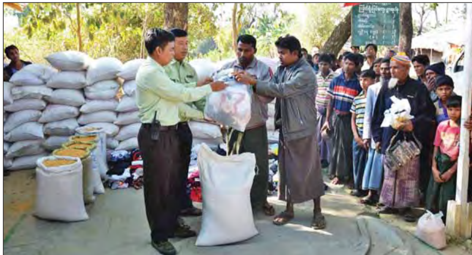
ကြက်ရိုးပြင်ရွာတွင် ထောက်ပံ့ပစ္စည်းများပေးအပ်စဉ်။