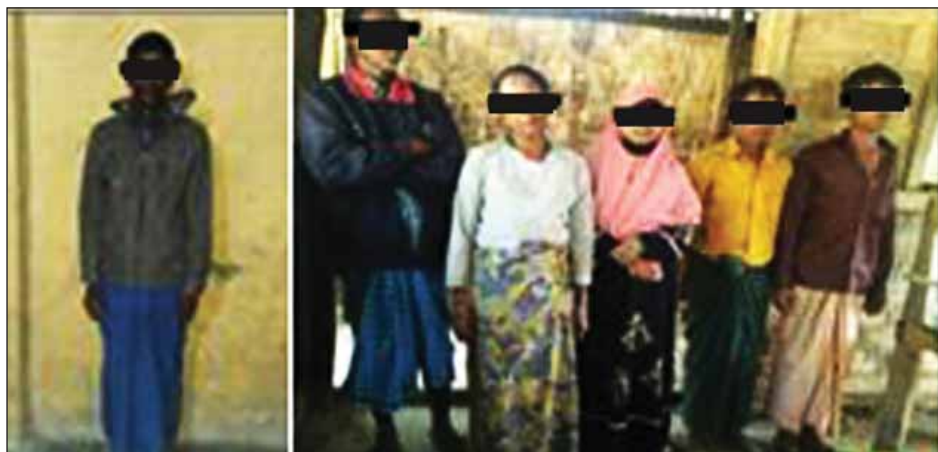
တာဇော်မိုကုတ်

မောင်တောမြို့နယ် ကွမ်းသီးပင် (အလယ်)ရွာ၌ အခကြေးငွေယူ၍ နေသူတစ်ဦးနှင့် သွားရောက်မည့်သူ ဘင်္ဂလားဒေ့ရှ်နိုင်ငံသို့ ပို့ဆောင်ပေး ငါးဦးအား ဇန်နဝါရီ ၄ ရက် နံနက်