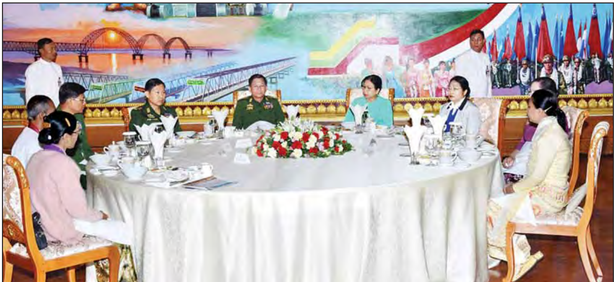
တွေ့ဆုံစဉ် ရခိုင်ပြည်နယ်မြောက်ပိုင်းဒေသ၌ဖြစ်ပွားနေသည့်ဖြစ်စဉ် ပဋိပက္ခ များအပေါ် အမြင်ချင်းဖလှယ် ဆွေးနွေးခဲ့ကြကြောင်း သတင်းရရှိများနှင့် ရှမ်းပြည်နယ် အရှေ့ မြောက်ဒေသ၌ဖြစ်ပေါ်ခဲ့သည့် လက်နက်ကိုင် သတင်း (သတင်းစဉ်)

တပ်မတော်ကာကွယ်ရေးဦးစီးချုပ်သည် မြန်မာနိုင်ငံဆိုင်ရာ အမေရိကန်နိုင်ငံ သံအမတ်ကြီး မစ္စတာစကော့မာစီရယ်အား မွန်းလွဲ ၁ နာရီခွဲတွင် နေပြည်တော်ရှိ ဘုရင့်နောင်ရိပ်သာ ဧည့်ခန်းမဆောင်၌ လက်ခံတွေ့ဆုံသည်။