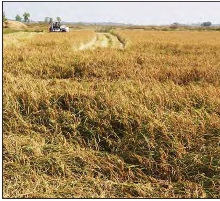
ပေါဆန်းဘေးကျားကြီးစပါးခင်းအား ရိတ်သိမ်းခြွေလှေ့စက်ဖြင့် ရိတ်သိမ်းနေစဉ်။