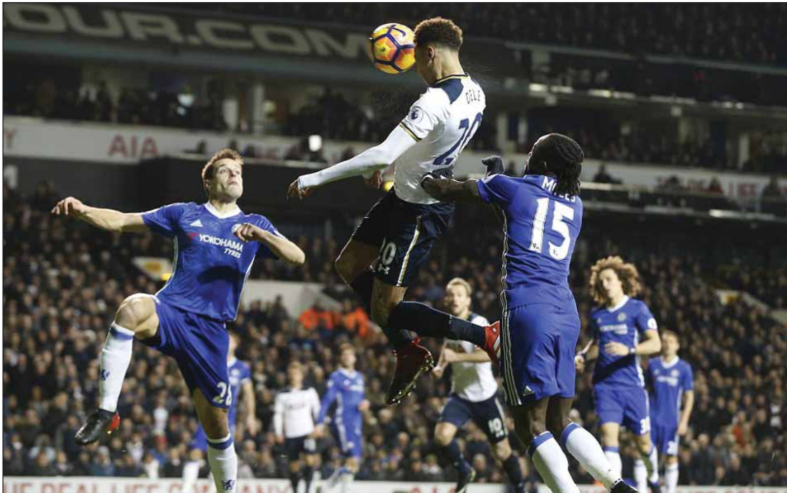
ချန်ပီယံလိဂ်အုပ်စုအဆင့်မှ ထွက်ခဲ့ရပြီး နောက် စပါးအသင်းခြေစွမ်းမတည်မငြိမ်ဖြစ်ခဲ့ရပြီး ဒီဇင်ဘာလအစောပိုင်းက မန်ယူအသင်းကို ရှုံးနိမ့်ခဲ့သည့်ပွဲစဉ်နောက်ပိုင်း စပါးအသင်း၏ခြေစွမ်းမှာ ပြန်လည်ကောင်းမွန်လာခဲ့ကာ ယခုချယ်လ်ဆီးအသင်းကို အနိုင်ရ ရှိခဲ့သည့်ပွဲစဉ်အပါအဝင် ငါးပွဲဆက်နိုင်ပွဲရရှိမှု စံချိန်ကိုတင်နိုင်ခဲ့ပြီဖြစ်သည်။ စပါးအသင်း၏ အိမ်ကွင်းတွင် အသင်း

စပါးအသင်းသည် ချယ်လ်ဆီးအသင်းအား ပွဲစဉ်(၂၀)တွင် အနိုင်ရရှိအောင်ကစားနိုင်ခဲ့ခြင်းကြောင့် ချယ်လ်ဆီးအသင်း၏ ပရီမီယာလိဂ် ၁၄ ပွဲဆက်နိုင်ပွဲဖြစ်လာမည့်စံချိန်ကို အဆုံးသတ်နိုင်ခဲ့သည့်အပြင် ပရီမီယာလိဂ်ဆုဖလားရယူနိုင်မည့် အသင်းစာရင်းထဲတွင်လည်း စပါးအသင်း အပါအဝင်ဖြစ်လာခဲ့သည်။