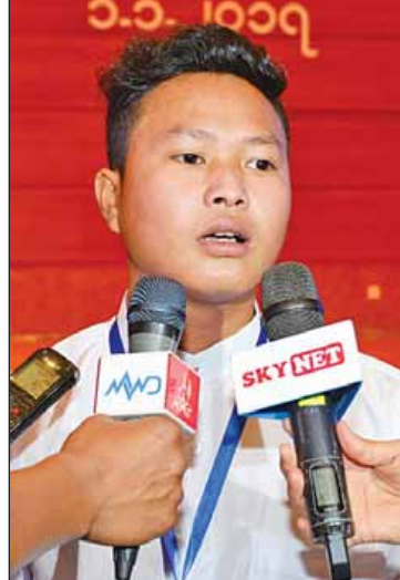
ကိုဇော်ဝင်းအောင်။