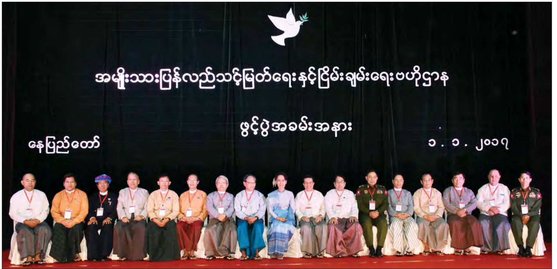
အမျိုးသားပြန်လည်သင့်မြတ်ရေးနှင့် ငြိမ်းချမ်းရေးဗဟိုဌာန ဖွင့်ပွဲအခမ်းအနားတွင် နိုင်ငံတော်၏ အတိုင်ပင်ခံပုဂ္ဂိုလ် ဒေါ်အောင်ဆန်းစုကြည်နှင့် တက်ရောက်လာကြသူများ စုပေါင်းမှတ်တမ်းတင်ဓာတ်ပုံရိုက်ကြစဉ်။ (သတင်းစဉ်)

ရေဖုံးမှ နိုင်ငံတော်၏ အတိုင်ပင်ခံပုဂ္ဂိုလ် ဒေါ်အောင်ဆန်းစုကြည်က မိန့်ခွန်းပြောကြားရာတွင် ဤနေ့ကိုရှေးပြီး အမျိုးသားပြန်လည်သင့်မြတ်ရေးနှင့် ငြိမ်းချမ်းရေးဗဟိုဌာနကို ဖွင့်ရသည့် အကြောင်းအရင်းသည် မိမိတို့၏ ငြိမ်းချမ်းရေးလုပ်ငန်းများ၊ ငြိမ်းချမ်းရေးအတွက် ကြိုးပမ်းမှုများ ယခုနှစ်တွင် အောင်မြင်ပါစေဆိုသည့် စိတ်ထားဖြင့် ရွေးချယ်ခြင်းဖြစ်ကြောင်း၊ အောင်မြင်ရန်အတွက်လည်း အားလုံးက ဝိုင်းဝန်းပြီး ကူညီရန် လိုအပ်သည်ကို အထူးအထွေ ပြောရန် မလိုအပ်ကြောင်း။