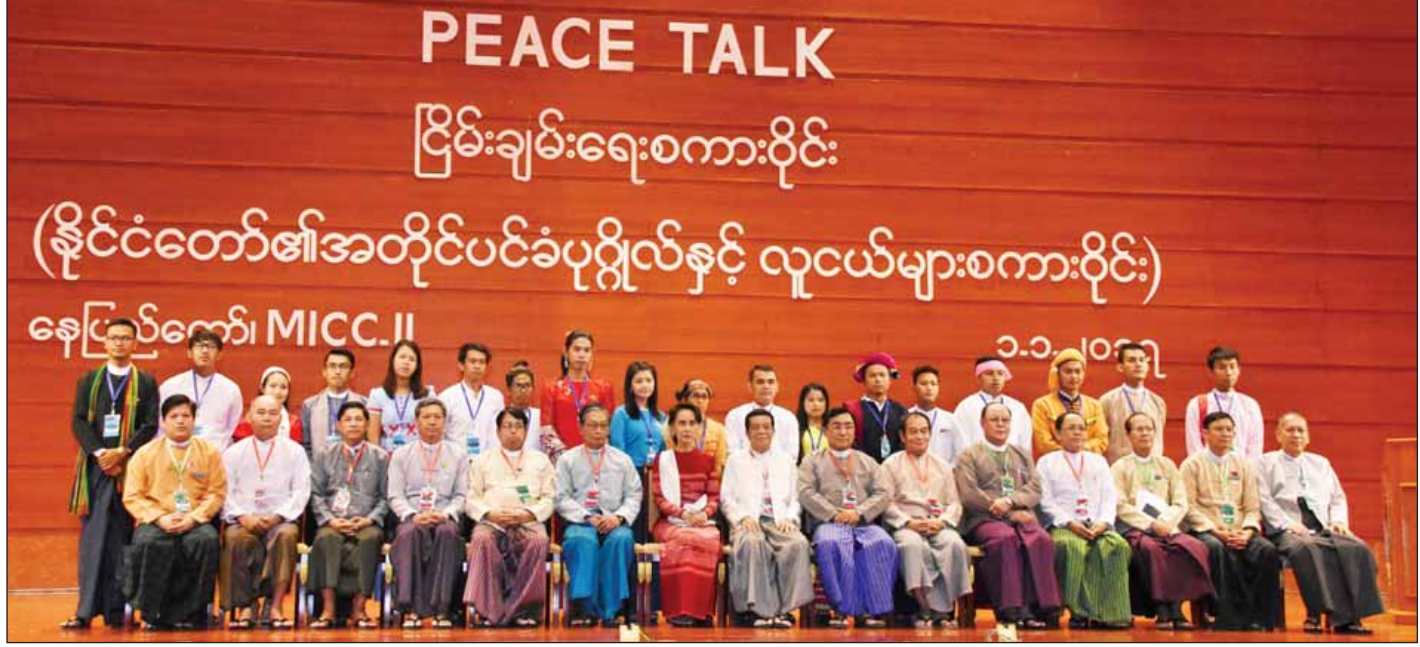
နိုင်ငံတော်၏အတိုင်ပင်ခံပုဂ္ဂိုလ် ဒေါ်အောင်ဆန်းစုကြည် လူငယ်များနှင့်အတူ စုပေါင်းဓာတ်ပုံရိုက်စဉ်။ (သတင်းစဉ်)

ထို့နောက် နိုင်ငံတော်၏အတိုင်ပင်ခံပုဂ္ဂိုလ်နှင့် စကားဝိုင်းသို့ တက်ရောက်လာကြသည့် လူငယ်များက ငြိမ်းချမ်းရေးအတွက် ယုံကြည်မှုတည်ဆောက်ရေး၊ တိုင်းဒေသကြီးနှင့်ပြည်နယ်များ လုပ်ပိုင်ခွင့် ပိုမိုရရှိရေး၊ ပြည်ထောင်စုစိတ်ဓာတ်ထားရှိရေး၊ မတူကွဲပြားမှု ညီညွတ်မှု တည်ဆောက်နိုင်ရေး၊ ပြည်တွင်းစစ်ကြောင့် ရရှိခဲ့သည့် စိတ်ဒဏ်ရာများကုစားနိုင်ရေး၊ ပြည်သူလူထုကို ဗဟိုပြု သည့် တရားဥပဒေဖြင့် အုပ်ချုပ်ရေး၊ ငြိမ်းချမ်းရေးဖြစ်စဉ် များတွင် လူငယ်များပါဝင်ရေး၊ စစ်ကြောင့် ကိုယ်အင်္ဂါ ဆုံးရှုံးခဲ့ရသူများအား ကူညီစောင့်ရှောက်ရေးစသည့် ကိစ္စ များနှင့်ပတ်သက်၍ အပြန်အလှန် ဆွေးနွေးကြသည်။ ထို့နောက် နိုင်ငံတော်၏ အတိုင်ပင်ခံပုဂ္ဂိုလ်သည် လူငယ်များက ဂါရဝပြုပေးအပ်သော အမှတ်တရပန်းစည်း လက်ဆောင်အားလက်ခံပြီး လူငယ်များနှင့်အတူ စုပေါင်း ဓာတ်ပုံရိုက်သည်။