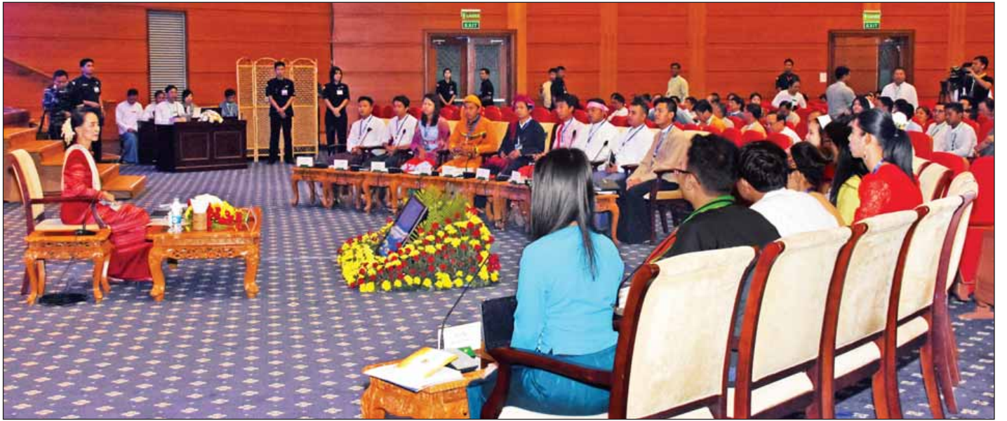
နိုင်ငံတော်၏အတိုင်ပင်ခံပုဂ္ဂိုလ် ဒေါ်အောင်ဆန်းစုကြည်နှင့် လူငယ်များစကားဝိုင်း(ငြိမ်းချမ်းရေးစကားဝိုင်း) ကျင်းပစဉ်။ (သတင်းစဉ်)

ဘယ်ဆန္ဒကို ဦးစားပေးရမလဲဆိုသည်ကို ရွေးချယ်ရန် လည်း အရေးကြီးပါကြောင်း၊ ယင်းဆန္ဒများကို ဘယ်လို ပုံစံဖြင့် ဖြည့်ဆည်းပေးရမည်ဆိုသည်ကို ဆုံးဖြတ်ရန် လည်း အင်မတန်မှ အရေးကြီးပါကြောင်း၊ တချို့က နည်းလမ်းက အရေးမကြီးဘူး၊ ကိုယ်လိုရာရရင်ပြီးရောဟု ထင်ကြပါကြောင်း၊ ကိုယ်လိုရာပန်းတိုင်ရောက်ရင်ပြီးရော ဘယ်လိုလမ်းကသွားရ သွားရဆိုပြီး ယူဆသူများလည်း ရှိပါကြောင်း၊ မိမိတို့အမြင်တွင် လမ်းမှားသွားလျှင် ပန်းတိုင်ရောက်သည့်အခါ ကိုယ်ထင်သလို မဟုတ်တာ ဖြစ်တတ်ပါကြောင်း၊ လမ်းမှန်ကသွားမှသာလျှင် မိမိတို့ လိုချင်သည့်ပန်းတိုင်ကို မှန်မှန်ကန်ကန်ရောက်မည်ဖြစ်ပါ ကြောင်း။