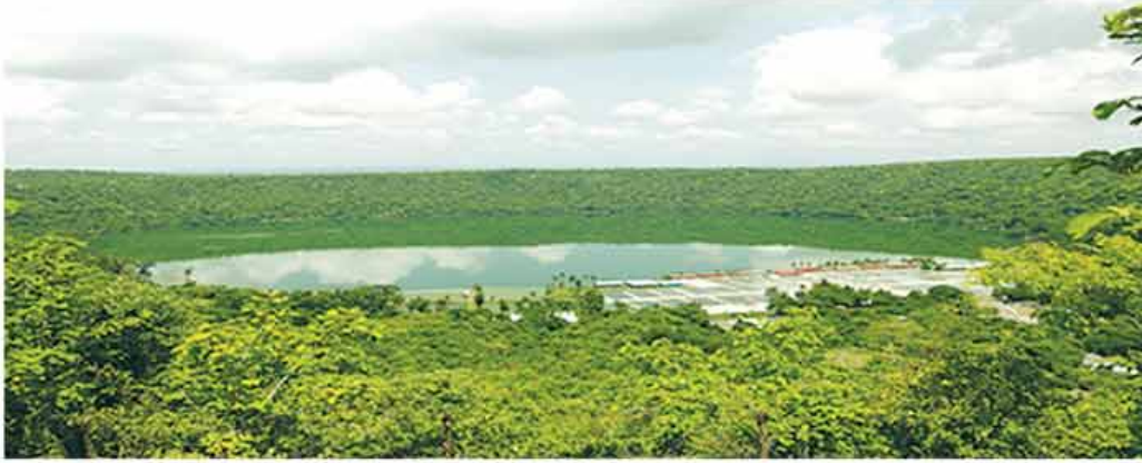
တွင်းတောင်အင်း (ဘုတလင်မြို့နယ်)

ပြည်ထောင်စုသမ္မတမြန်မာနိုင်ငံတော် ခစ်ကိုင်းတိုင်းဒေသကြီးအတွင်းရှိ သက်ရှိသယံဇာတ သဘာဝ စပီရူလိုင်းနားစိမ်းပြာရေညှိအင်းများ