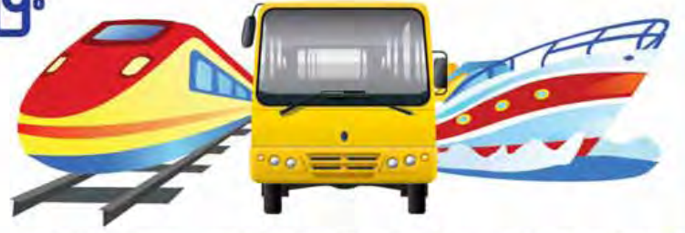
ရန်ကုန်မြို့ပတ်ရထား အဝီပတ် (အဖြူ၊ အပြာ၊ အဝါ၊ အနီ) ရန်ကုန် - ဒလကူးတို့သင်္ဘော

OK$ ဖြင့် လက်မှတ်ခငွေပေးချေပြီး ကံထူးရှင် ဖြစ်လိုက်ပါ။