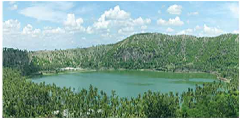
တောင်ပျောက်အင်း (ကနီမြို့နယ်)