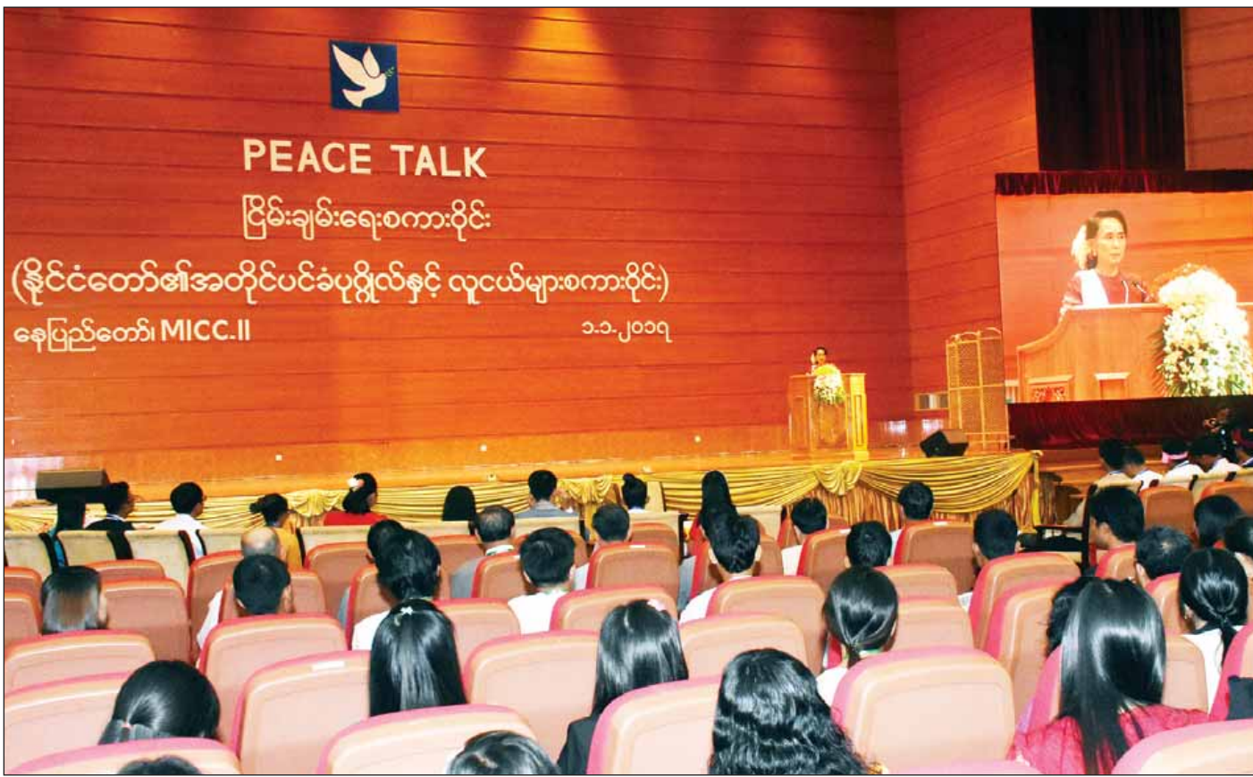
ငြိမ်းချမ်းရေးစကားပွဲနှင့် နိုင်ငံတော်၏အတိုင်ပင်ခံပုဂ္ဂိုလ် ဒေါ်အောင်ဆန်းစုကြည် အဖွင့်အမှာစကားပြောကြားစဉ်။ (သတင်း-စာမျက်နှာ ၈) (သတင်းစဉ်)

စာမျက်နှာ ၃ မှ ၆ နိုင်ငံသားအားလုံး၏ အကူအညီဖြင့်၊ တစ်ကမ္ဘာလုံးမှာရှိသည့် မိမိတို့နိုင်ငံအပေါ် တကယ့်ကို စေတနာထားသည့် မိတ်ဆွေများ၏ဝန်းရံမှုဖြင့် မိမိတို့အမျိုးသားပြန်လည်သင့်မြတ်ရေးနှင့် ငြိမ်းချမ်းရေးရအောင် လုပ်သွားမည်ဆိုသည်ကို ပြည်သူ့ပြည်သားအားလုံးသိအောင် ပြောချင်ပါကြောင်း နိုင်ငံတော်၏အတိုင်ပင်ခံပုဂ္ဂိုလ်က ပြောကြားသည်။ ထို့နောက် နိုင်ငံတော်၏အတိုင်ပင်ခံပုဂ္ဂိုလ်နှင့် တက်ရောက်လာကြသူများသည် စုပေါင်းမှတ်တမ်းတင် ဓာတ်ပုံ ရိုက်ပြီး နိုင်ငံတော်၏အတိုင်ပင်ခံပုဂ္ဂိုလ်နှင့် အဖွဲ့သည် ငြိမ်းချမ်းရေးပဟိဋ္ဌာနအတွင်း လှည့်လည်ကြည့်ရှုသည်။ ယဉ်ကျေးမှုတိုင်းတွင် ငြိမ်းချမ်းရေးအမှတ်သင်္ကေတများ ကိုယ်စီကိုယ်စီ ရှိနေတတ်ပြီး နိုင်ငံတကာအသိအမှတ်ပြု အမှတ်သင်္ကေတတစ်ခုမှာ သံလွင်ခက်ကိုကိုက်ချိ၍ ပျံသန်းနေသော ချိုးငှက်ဖြူဖြစ်သည်။ သံလွင်ခက်ကို ကိုက်ချိ၍ ပျံသန်းနေသော ချိုးငှက်ဖြူသည် ငြိမ်းချမ်းရေးအထိမ်းအမှတ်သင်္ကေတများအနက် ရှေးအကျဆုံးသင်္ကေတလက္ခဏာ တစ်ခုဖြစ်ပြီး အောင်ပွဲ၏ အထိမ်းအမှတ်အဖြစ်လည်း အမှတ်သညာပြုကြသည်။ သံလွင်ခက်သည် ဖျက်ဆီး၍ မရနိုင်သော အပင်၊ ခံနိုင်ရည်ရှိသော အပင်၊ လူတို့အတွက် အကျိုးပြုသော အပင်၊ ငြိမ်းချမ်းရေးအသွင်ဆောင်သော အပင်၊ လောကအကျိုးသယံပိုးသောအပင်အဖြစ်လည်း မှတ်ယူကြသည်။ အရွယ်ရောက်ပြီး သံလွင်ခက်၏ အမြင့်မှာ ပေ ၅၀ နှင့် ပင်စည်လုံးပတ် ၃၃ ပေခန့်ရှိ၍ အနှစ် ၂၀၀၀ ကျော်အထိ ရှင်သန်နိုင်ကြောင်း သိရသည်။ ထို့ကြောင့် ပြည်ထောင်စုမြန်မာနိုင်ငံတော်၏ပြည်တွင်း ငြိမ်းချမ်းရေး၊ အမျိုးသားပြန်လည်သင့်မြတ်ရေးတို့ကို ဦးစီးဆောင်ရွက်မည့် အမျိုးသားပြန်လည်သင့်မြတ်ရေးနှင့် ငြိမ်းချမ်းရေးပဟိဋ္ဌာန ဖွင့်ပွဲအထိမ်းအမှတ်အနေဖြင့် စိုက်ပျိုးခဲ့ခြင်းဖြစ်ကြောင်း သိရသည်။ (သတင်းစဉ်)