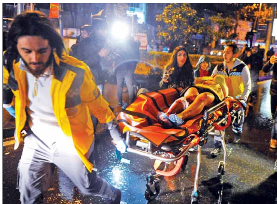
အကြား ရေပန်းစားလှသည်။ အခင်းဖြစ်ပွားစဉ်တွင် နှစ်သစ်ကူးအခါသမယကို ကြိုဆိုနေကြသည့်ပြည်သူများ စည်ကားများပြားလျက်ရှိသည်။ အခင်းဖြစ်ပွားပြီးနောက် ညကလပ်နှင့်အနီးဝန်းကျင်ကို ဖြတ်သန်းသွားလာမှုများ မပြုလုပ်ရန် ယာယီပိတ်ဆို့ထားသည်။ နိုင်ငံအတွင်းရှိဒေသအားလုံးကို လုံခြုံရေး

အန်ကာရာ ဇန်နဝါရီ ၁ ဇန်နဝါရီ ၁ ရက် နှစ်သစ်ကူးအခါသမယတွင် တူရကီနိုင်ငံ၏ အကြီးဆုံးမြို့တော် အစ္စတန်ဘူရှိ ရီနာ ညကလပ်တစ်ခု၌ အကြမ်းဖက်သေနတ်ပစ်ခတ်မှုကြောင့် အနည်းဆုံး လူပေါင်း ၃၉ ဦး သေဆုံးခဲ့ပြီး ၆၉ ဦး ထိခိုက်ဒဏ်ရာရရှိခဲ့ကြောင်း သတင်းများအရ သိရသည်။ သေဆုံးသူများအနက် ၁၅ ဦးကျော်မှာ နိုင်ငံခြားသားများဖြစ်သည်။ ဇန်နဝါရီ ၁ ရက် နံနက် ၁ နာရီထိုးပြီးနောက် အကြမ်းဖက်သမားတစ်ဦးက ညကလပ်အတွင်းရှိ နှစ်သစ်ကူးအခါသမယကို ဖျော်ရွှင်စွာကြိုဆိုနေကြသည့် ပြည်သူများအား သေနတ်ဖြင့် ဦးတည်ရာမဲ့ ပစ်ခတ်ခဲ့ကြောင်းနှင့် အကြမ်းဖက်ပစ်ခတ်မှုနှင့်ပတ်သက်ပြီး စုံစမ်းစစ်ဆေးမှုများ လုပ်ဆောင်လျက်ရှိသည်ဟု တူရကီပြည်ထဲရေးဝန်ကြီး ဆူလေမန်ဆိုလက် ဆိုသည်။ တူရကီသမ္မတ ရီဆပ်တေရစ်ပင် အာဒိုဂန်က အဆိုပါ အကြမ်းဖက်သေနတ်ပစ်ခတ်မှုအား ရှုတ်ချသည့် ကြေညာချက်တစ်ရပ် ထုတ်ပြန်ခဲ့သည်။ အဆိုပါပစ်ခတ်မှုနှင့်ပတ်သက်ပြီး အသေးစိတ် စုံစမ်းစစ်ဆေးသွားမည်ဖြစ်ကြောင်းနှင့် ယင်းကဲ့သို့ အကြမ်းဖက်ကျူးလွန်မှုများကြောင့် နိုင်ငံရေးမတည်ငြိမ်မှုများ ဖြစ်ပွားနိုင်သည့်အတွက် အကြမ်းဖက်သမားများကို အမြစ်ပြတ်ချေမှုန်းသွားမည်ဖြစ်ကြောင်း ယင်းကြေညာချက်ထဲတွင် ပါရှိသည်။ ရီနာညကလပ်သည် ဘိုစပေါ်ရစ် ရေလက်ကြားကို မျက်နှာမူထားသည့် ခရိုင်တစ်ခုတွင် တည်ရှိပြီး နိုင်ငံခြားသားများနှင့် ချမ်းသာကြွယ်ဝသော ဒေသဒ်ပြည်သူများ