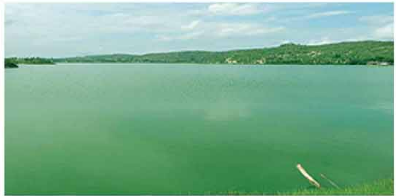
ရေခါးအင်း (စစ်ကိုင်းမြို့နယ်)