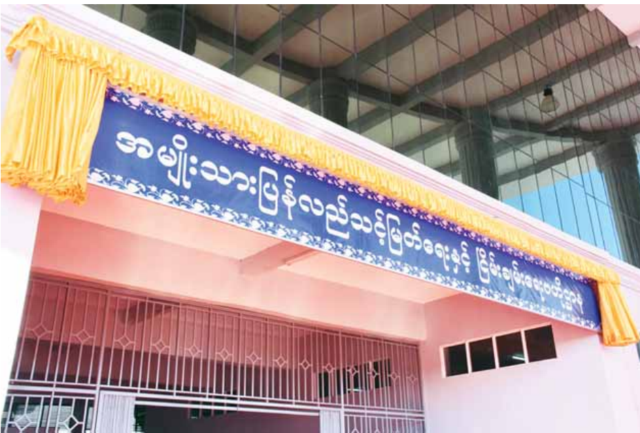
နိုင်ငံတော်၏အတိုင်ပင်ခံပုဂ္ဂိုလ် ဒေါ်အောင်ဆန်းစုကြည် အမျိုးသားပြန်လည်သင့်မြတ်ရေးနှင့် ငြိမ်းချမ်းရေး ဗဟိုဌာန ဆိုင်းဘုတ်ကို စက်ခလုတ်နှိပ်၍ ဖွင့်လှစ်ပေးစဉ်။