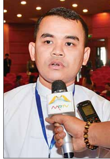
ကိုသူရိန်။