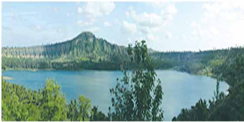
တွင်းမအင်း (ကနီမြို့နယ်)