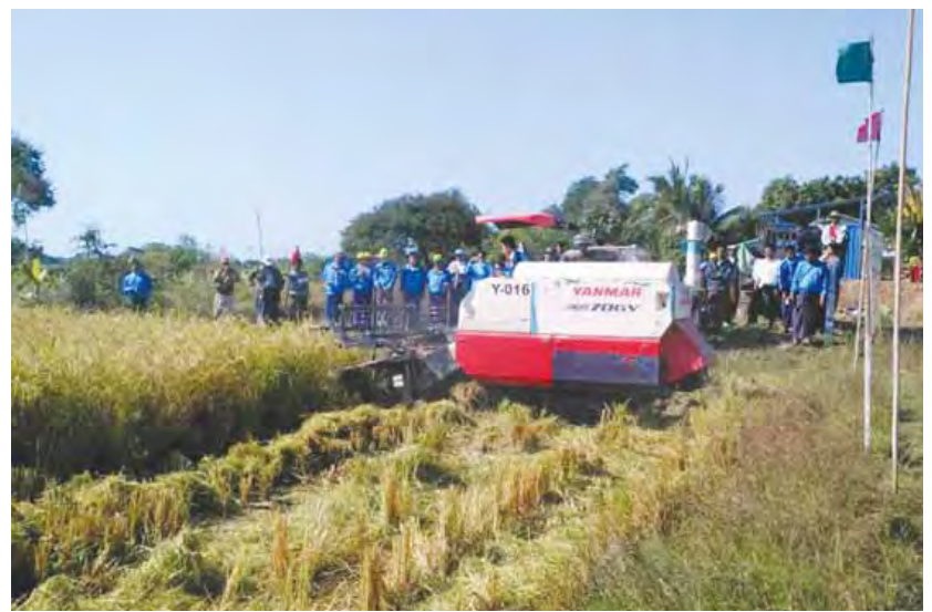
စီမံခန့်ခွဲမှုအဖွဲ့ဝင်များနှင့် ရာအိမ်မှူး၊ ဆယ်အိမ် တက်ရောက်ခဲ့ကြောင်း သိရသည်။ မျိုးချမ်း(မုံရွာ)

အဆိုပါစံကွက်ရိတ်သိမ်းပွဲသို့ ခရိုင်စိုက်ပျိုးရေး ဦးစီးဌာနမှူး၊ မြို့နယ်စီမံခန့်ခွဲမှုကော်မတီဥက္ကဋ္ဌ နှင့် အဖွဲ့ဝင်များ၊ မြို့နယ်လယ်ယာမြေစီမံခန့်ခွဲ ရေးနှင့် စာရင်းအင်းဦးစီးဌာနမှူး၊ မြို့နယ်စိုက်ပျိုး ရေးဦးစီးဌာနမှူး၊ ဇရစ်ကျေးရွာအုပ်စု လယ်ယာမြေ