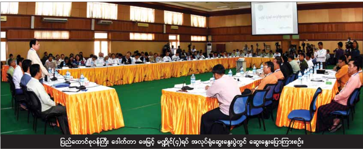
ပြည်ထောင်စုဝန်ကြီး ဒေါက်တာ ဖေမြင့် မဏ္ဍိုင်(၄)ရပ် အလုပ်ရုံဆွေးနွေးပွဲတွင် ဆွေးနွေးပြောကြားစဉ်။

ယင်းနောက် နေပြည်တော်ကောင်စီနယ်မြေ၊ တိုင်းဒေသကြီးနှင့် ပြည်နယ်များမှ ပတ်ဝန်းကျင်ထိန်းသိမ်းရေးနှင့် ရာသီဥတုပြောင်းလဲမှုဆိုင်ရာ ကြီးကြပ်မှု ကော်မတီတို့မှ ဥက္ကဋ္ဌများနှင့် တာဝန်ရှိသူများ၊ ဗဟိုကော်မတီဝင်များနှင့် တာဝန်ရှိသူများက ပတ်ဝန်းကျင်ထိန်းသိမ်းရေးဆိုင်ရာ လုပ်ငန်းဆောင်ရွက်မှု အခြေအနေများကို ရှင်းလင်းတင်ပြကြသည်။ (သတင်းစဉ်)