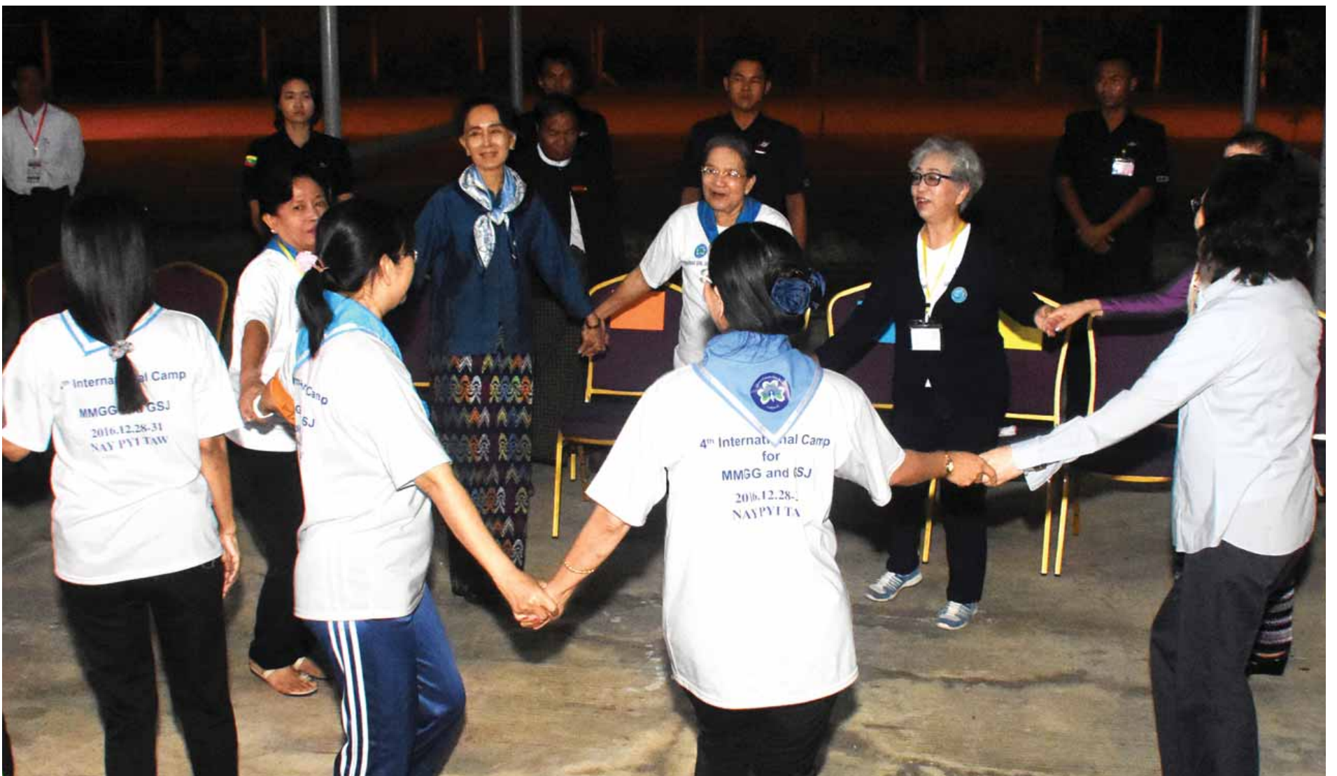
နိုင်ငံတော်၏အတိုင်ပင်ခံပုဂ္ဂိုလ် ဒေါ်အောင်ဆန်းစုကြည် မြန်မာ-ဂျပန် အမျိုးသမီးကင်းထောက်များ၏ စခန်းချမ်းပုံပွဲတွင် ပါဝင်ဆင်နွှဲစဉ်။ (သတင်းစဉ်)