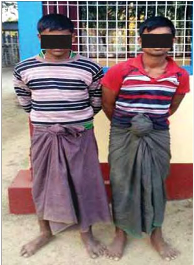
မောင်တောမြို့နယ်အတွင်း အကြမ်းဖက်မှုဖြစ်စဉ်များတွင် ပါဝင်ခဲ့သူများအား ပမ်းဆီးရမိ

လုံခြုံရေးအစီအမံများ ညှိနှိုင်းအစည်းအဝေးကို ယနေ့ နံနက်ပိုင်းတွင် ရန်ကုန်တိုင်းဒေသကြီး အစိုးရအဖွဲ့ရုံး၌ ကျင်းပသည်။ အစည်းအဝေးတွင် နှစ်သစ်ကူးအကြို လုံခြုံရေးတာဝန်ကျမည့် မြန်မာနိုင်ငံရဲတပ်ဖွဲ့ဝင်များ၊ သက်ဆိုင်ရာမြို့နယ် အုပ်ချုပ်ရေးအဖွဲ့များအနေဖြင့် ပူးပေါင်းဆောင်ရွက်သွားမည့်အခြေအနေများ၊ ၂၀၁၆ ခုနှစ်တွင် တွေ့ကြုံခဲ့ပြီးသော လုံခြုံရေးအစီအမံများ၏ အားနည်းချက်အားသာချက်များကိုရလျက် ယခုနှစ် ၂၀၁၇ ခုနှစ်၏ နှစ်ဦးအကြိုအတွက် လုံခြုံရေးအင်အားကို အကောင်းဆုံးဆောင်ရွက်သွားမည့်အခြေအနေများနှင့်ပတ်သက်၍ ဆွေးနွေးကြသည်။ (ဗညား)