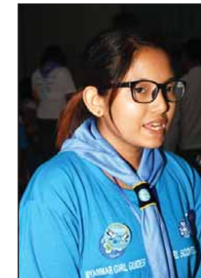
မအေးစန္ဒာအောင် အမျိုးသားစီမံခန့်ခွဲမှုပညာ ဒီဂရီကောလိပ် တတိယနှစ် ကျောင်းသူ