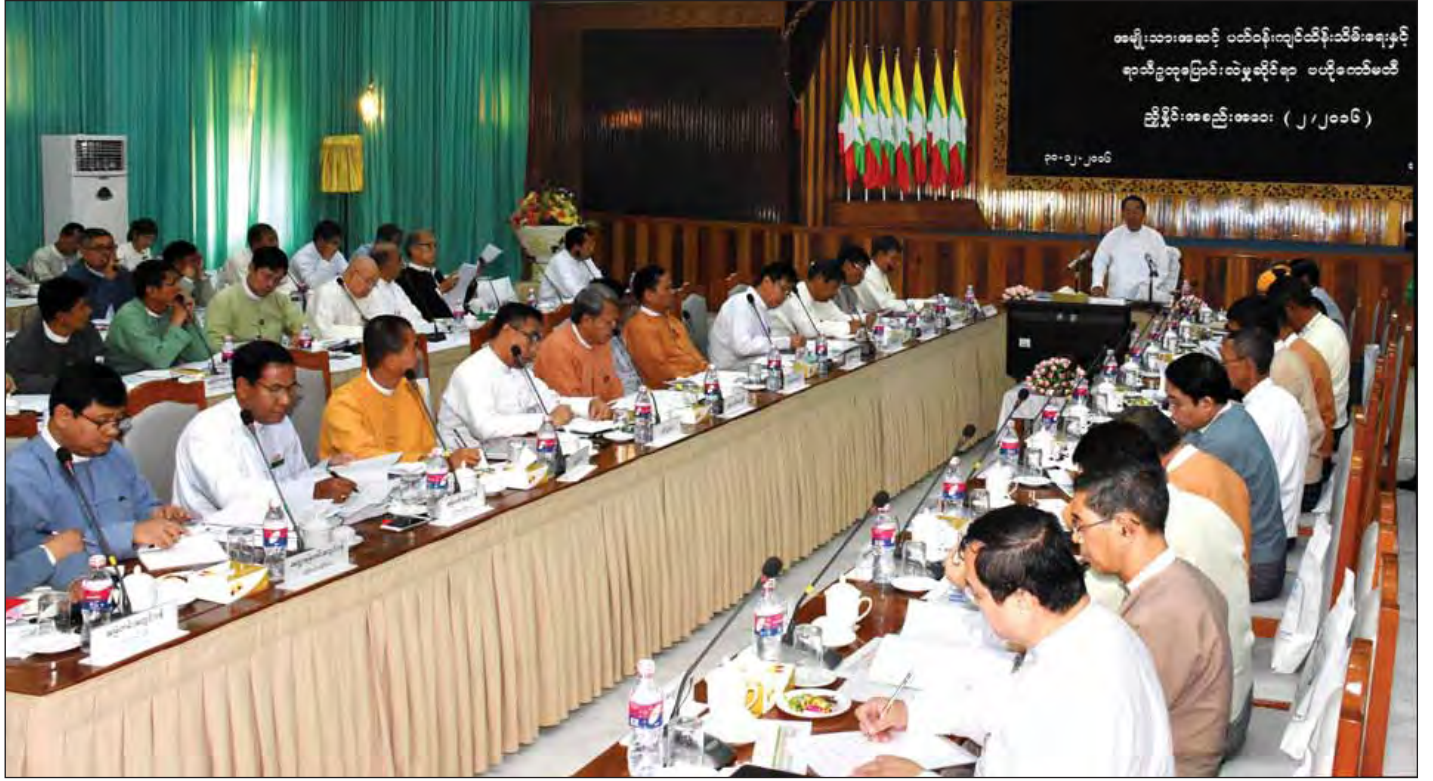
အမျိုးသားအဆင့် ပတ်ဝန်းကျင်ထိန်းသိမ်းရေးနှင့် ရာသီဥတုပြောင်းလဲမှုဆိုင်ရာ ပဟိုကော်မတီ (၂/၂၀၁၆) လုပ်ငန်းညှိနှိုင်းအစည်းအဝေး ကျင်းပစဉ်။ (သတင်းစဉ်)

ဒုတိယသမ္မတ ဦးမြင့်ဆွေက သက်ဆိုင်ရာဌာနများ၊ တိုင်းဒေသကြီး၊ ပြည်နယ်များတွင် ခွင့်ပြုဆောင်ရွက်နေ သည့် စက်ရုံ၊ အလုပ်ရုံများနှင့် သယံဇာတ အခြေခံစီမံကိန်း လုပ်ငန်းစာရင်းများနှင့် ဆက်စပ်သည့်အချက်အလက်များ စုစည်းပေးနိုင်ရန်၊ လက်ရှိလည်ပတ် ဆောင်ရွက်နေသည့် စက်ရုံ၊ အလုပ်ရုံများနှင့် သယံဇာတအခြေခံစီမံကိန်း လုပ်ငန်းများကြောင့် သဘာဝနှင့် လူမှုပတ်ဝန်းကျင်အပေါ် ဆိုးကျိုးသက်ရောက်မှုများ မဖြစ်ပေါ်အောင် ဥပဒေ၊ နည်းဥပဒေများ၊ လုပ်ထုံးလုပ်နည်းများနှင့်အညီ စစ်ဆေးကြပ် မတ်သွားနိုင်ရန် စာမျက်နှာ ၈ ကော်လံ ၁ သို့ *