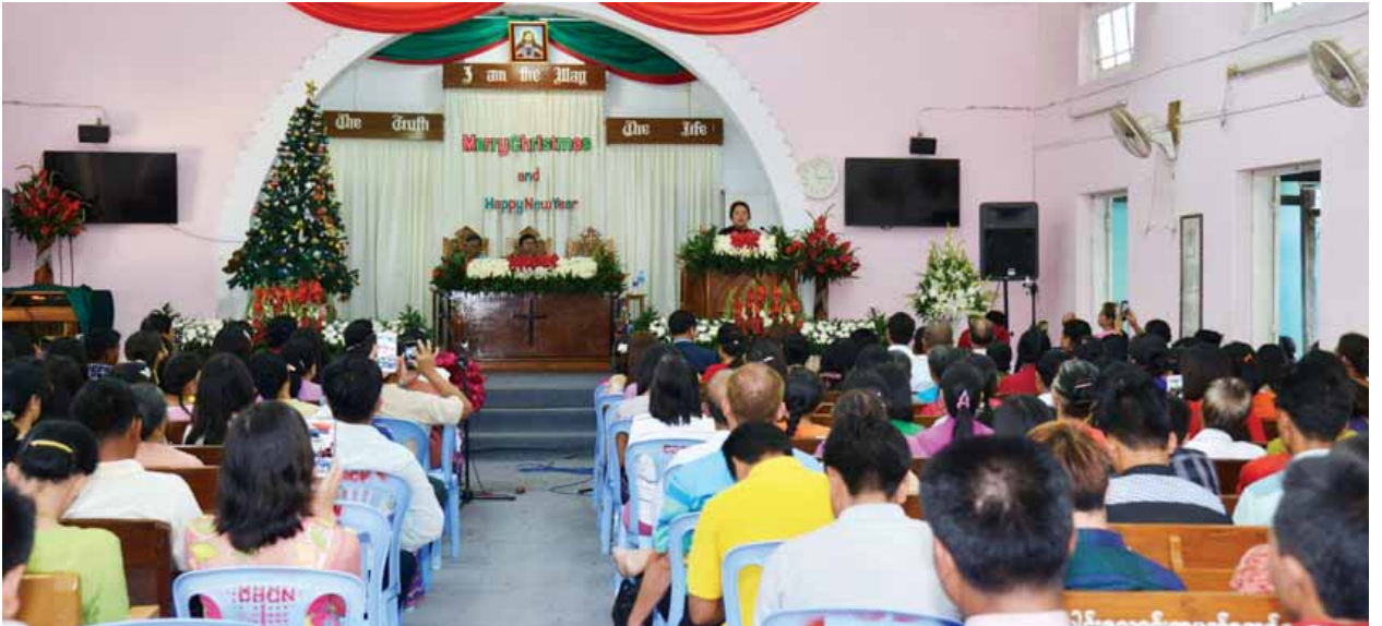
ချင်းနှစ်ခြင်းခရစ်ယာန်အသင်းတော်၏ ခရစ္စမတ်နေ့အထိမ်းအမှတ် ဝတ်ပြုကိုးကွယ်ခြင်းအခမ်းအနား ကျင်းပစဉ်။

ယင်းနောက် အသင်းတော်မှ တည်ခင်း ဧည့်ခံသည့် ညနေစာကို ဒုတိယ သမ္မတနှင့်အတူ တက်ရောက်လာသူများက အတူတကွသုံးဆောင်ကြသည်။ အခမ်းအနားသို့ တိုင်းရင်းသားလူမျိုးများရေးရာဝန်ကြီးဌာန ပြည်ထောင်စု ဝန်ကြီး နိုင်သက်လွင်၊ သမ္မတရုံးဝန်ကြီးဌာန ဒုတိယဝန်ကြီး ဦးမင်းသူတို့ တက်ရောက်ကြသည်။ (သတင်းစဉ်)