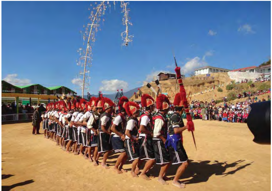
၂၀၁၅ ခုနှစ်က နာဂရိုးရာပွဲဆင်နွှဲနေမှုမြင်ကွင်း