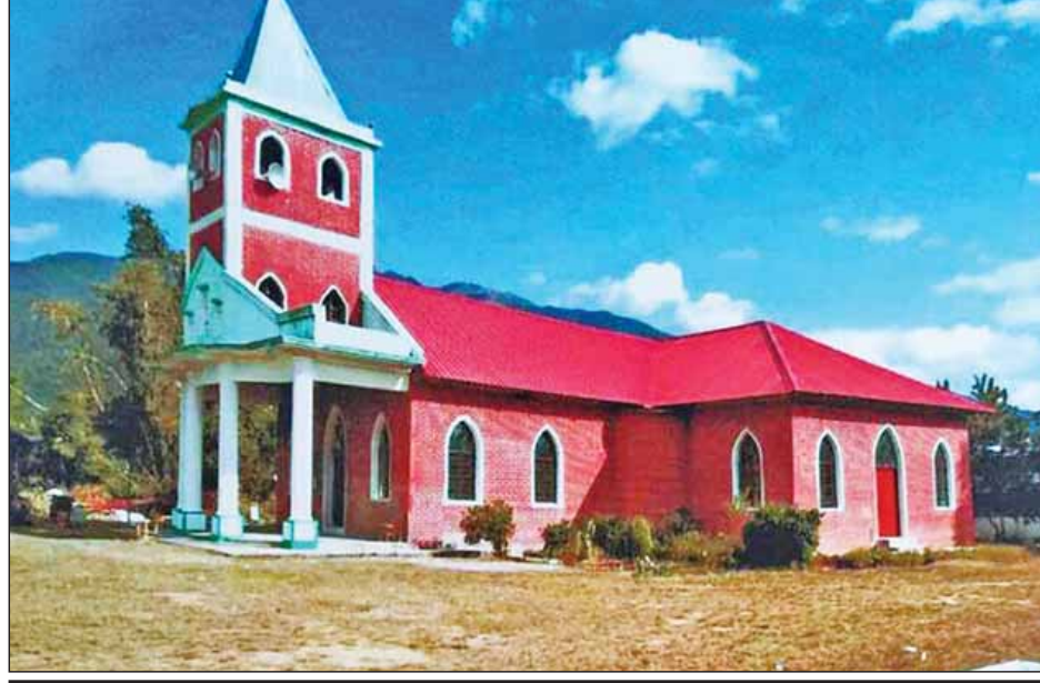
လက်နက်ကိုင်ပူးပေါင်းအဖွဲ့များ၏ ပစ်ခတ်တိုက်ခိုက်မှုများကြောင့် ပျက်စီးသွားသည့် ကက်သလစ်ဘုရားကျောင်းအား ပြန်လည်ပြုပြင်ထားမှုကို တွေ့ရစဉ်။

တစ်ပွဲ၊ အဝေးကွင်းတစ်ပွဲကစားရခြင်းဖြစ်ပြီး ရတနာပုံအသင်းသည် အဝေးကွင်းတစ်ပွဲ ကစားထားသောကြောင့် ယခုအိမ်ကွင်းကစားရခြင်းဖြစ်သည်။ အုပ်စုပထမရရှိသည့်အသင်းမှာ ဆီမီးဖိုင်နယ်တွင် ကမ္ဘောဒီးယားကလပ် အန်ကောအသင်းနှင့် အဝေးကွင်း ကစားရမည်ဖြစ်ပြီး ဗိုလ်လုပွဲတွင် ထိုင်းကလပ်ဘူရီရမ်အသင်းနှင့် တွေ့ဆုံနေသည်။ ဆီမီးဖိုင်နယ်ကို တစ်ကျော့တည်း ကျင်းပမည်ဖြစ်သော်လည်း ဗိုလ်လုပွဲကို အိမ်ကွင်း၊ အဝေးကွင်း ကစားရမည်ဖြစ်သည်။ (ရှင်းထက်ဇော်)