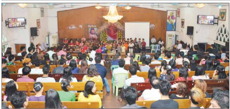
ရန်ကုန်မြို့၊ ဗိုလ်အောင်ကျော်လမ်းနှင့် ဗိုလ်ချုပ်လမ်းထောင့်ရှိ စိန်မေရိကာသိဒြယ်ဘုရားကျောင်းတွင် ခရစ္စမတ်နေ့အခမ်းအနား ကျင်းပနေစဉ်။