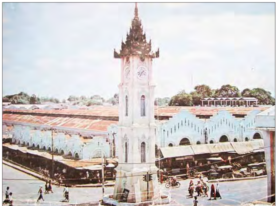
ပြာသာဒ်၊ မြန်မာ့အမွေပန်းများနှင့် မြန်မာ့ဗိသုကာကို အခြေခံသည်။

ဝီတိုရိယဘုရင်မကြီး နန်းတက်သက် ၆၀ ပြည့်နှစ်အထိမ်းအမှတ် ဈေးချိုနာရီစင်ကြီးတွင် တပ်ဆင်အသုံးပြုရန်အတွက် သီးခြားထုတ်လုပ်တည်ဆောက်ပေးခဲ့သော သံပတ်ပေး ရောမကိန်းခိုင်ခွက်များနှင့် သံမဏိနာရီစင်ကြီးပေးမယ့် အချိုးကျ လှပခုံညားသော