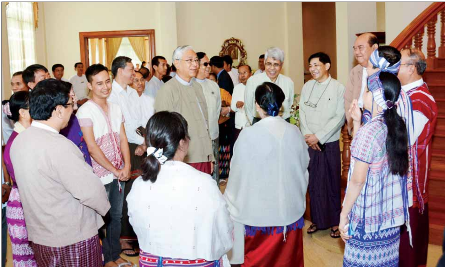
နိုင်ငံတော်သမ္မတ ဦးထင်ကျော်နှင့် ဇနီး ဒေါ်စုစုလွင် အမျိုးသားလွှတ်တော်ဥက္ကဋ္ဌနေအိမ်၌ကျင်းပသည့် ခရစ်တော်မွေးနေ့ ဝတ်ပြုဆုတောင်းခြင်းနှင့် ခရစ္စမတ် အထိမ်းအမှတ် မိတ်ဆုံစားပွဲအခမ်းအနားသို့ တက်ရောက်စဉ်။ (သတင်းစဉ်)

ထို့နောက် နိုင်ငံတော်သမ္မတနှင့် ဇနီးတို့သည် အခမ်းအနားသို့ တက်ရောက်လာကြသူများနှင့်အတူ မှတ်တမ်းတင်ဓာတ်ပုံရိုက်ကြသည်။ (သတင်းစဉ်)