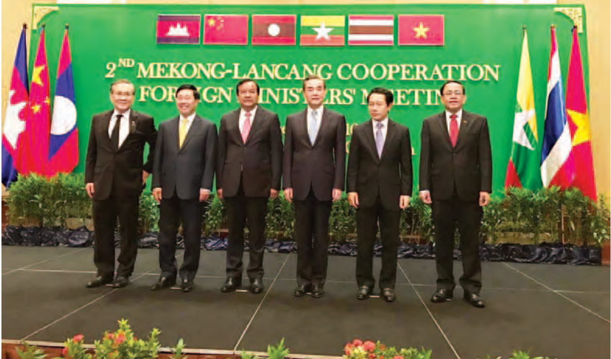
နိုင်ငံခြားရေးဝန်ကြီးဌာန ဒုတိယဝန်ကြီး ဦးကျော်တင် မဲခေါင်-လန်ချန်း နိုင်ငံခြားရေးဝန်ကြီးများနှင့်အတူ မှတ်တမ်းတင်ဓာတ်ပုံရိုက်စဉ်။ (သတင်းစဉ်)

နိုင်ငံခြားရေးဝန်ကြီးဌာန ဒုတိယ ဝန်ကြီးဦးကျော်တင်သည် ဒီဇင်ဘာ ၂၃ ရက်တွင် ကမ္ဘောဒီးယားနိုင်ငံ ဆီရမ်ရိမြို့၌ ပြုလုပ်သည့် မဲခေါင်-လန်ချန်းပူးပေါင်း ဆောင်ရွက်ရေး ဆိုင်ရာ ဒုတိယအကြိမ် နိုင်ငံခြားရေး ဝန်ကြီးများ အစည်းအဝေးသို့ တက်ရောက်ခဲ့သည်။