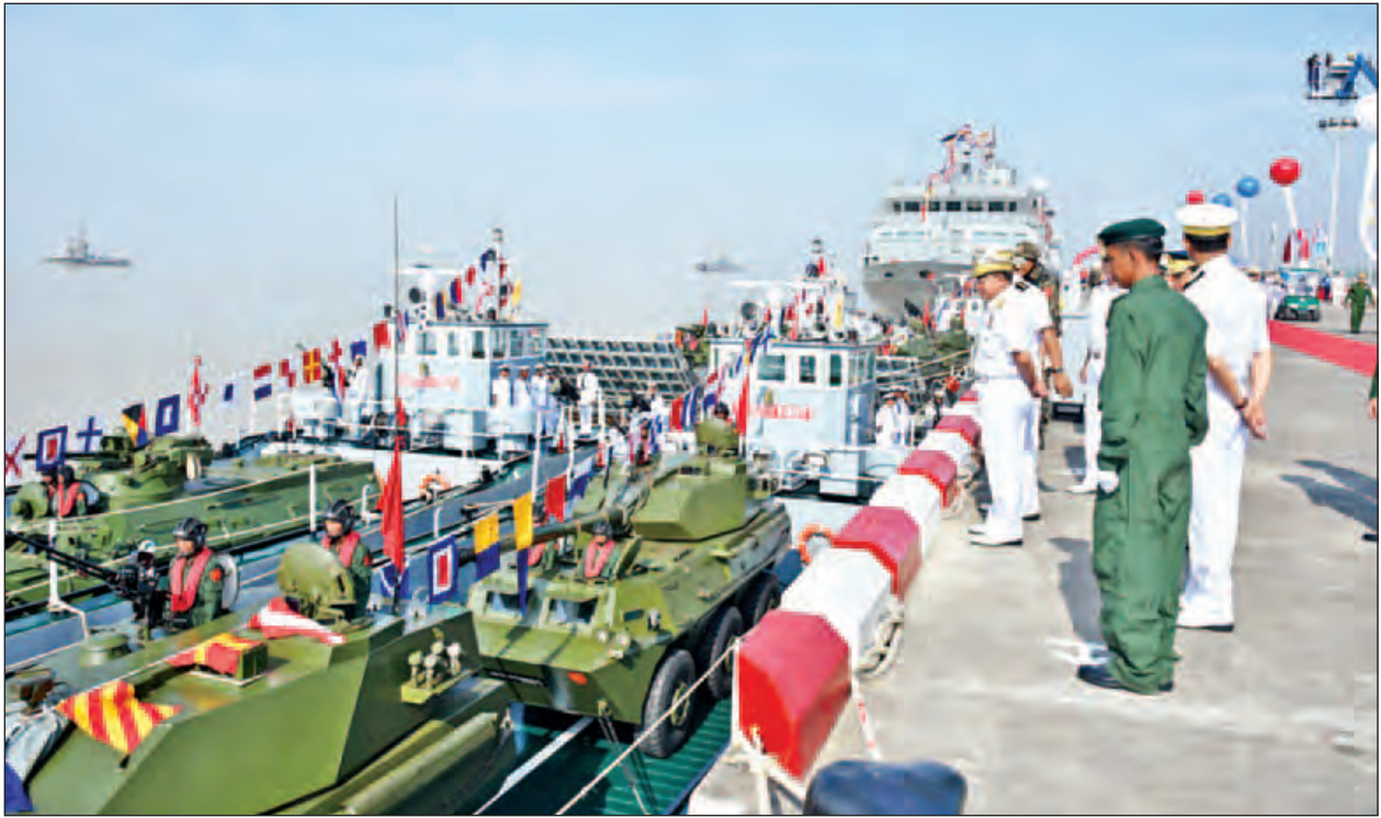
တပ်မတော်ကာကွယ်ရေးဦးစီးချုပ် ဗိုလ်ချုပ်မှူးကြီးမင်းအောင်လှိုင် တပ်တော်ဝင်စစ်ရေယာဉ်များကို ကြည့်ရှုစစ်ဆေးစဉ်။(သတင်းစဉ်)

တပ်မတော်ကာကွယ်ရေးဦးစီးချုပ်က ဂုဏ်ပြုအမှာစကားပြောကြားရာတွင် ယခင်ကမြန်မာ့ကမ်းရိုးတန်းကာကွယ်ရေးတွင် ယိုပေါက်များစွာရှိခဲ့ရာမှ စစ်ရေယာဉ် အရေအတွက်များလာခြင်း၊ စစ်ရေယာဉ်များ၏ စွမ်းဆောင်ရည်မြင့်မားလာခြင်းတို့ကြောင့် ယင်းယိုပေါက်များ နည်းနိုင်သမျှနည်းလာပြီး မိမိတို့ပိုင်နက်ရေပြင်ကို ဝင်မလာဘဲလည်အထိ လုပ်ဆောင်နိုင်ကြောင်း၊ ထိုသို့နိုင်ငံတော်အတွက် ငွေကြေးသက်သာမှုများစွာရရှိစေပြီး စိတ်ဓာတ်ရေးအရ လည်းကောင်း၊ စွမ်းရည်မြင့်မားစေရေးအတွက်လည်းကောင်း၊ တပ်မတော်(ရေ)ကို အဆင့်မြှင့်တင်ပေးနေသည့် စစ်ရေယာဉ်တည်ဆောက်ရေးလုပ်ငန်းအသီးသီးတွင် တာဝန်ယူတည်ဆောက်နေကြသည့် တပ်မတော်(ရေ)မှ အရာရှိ