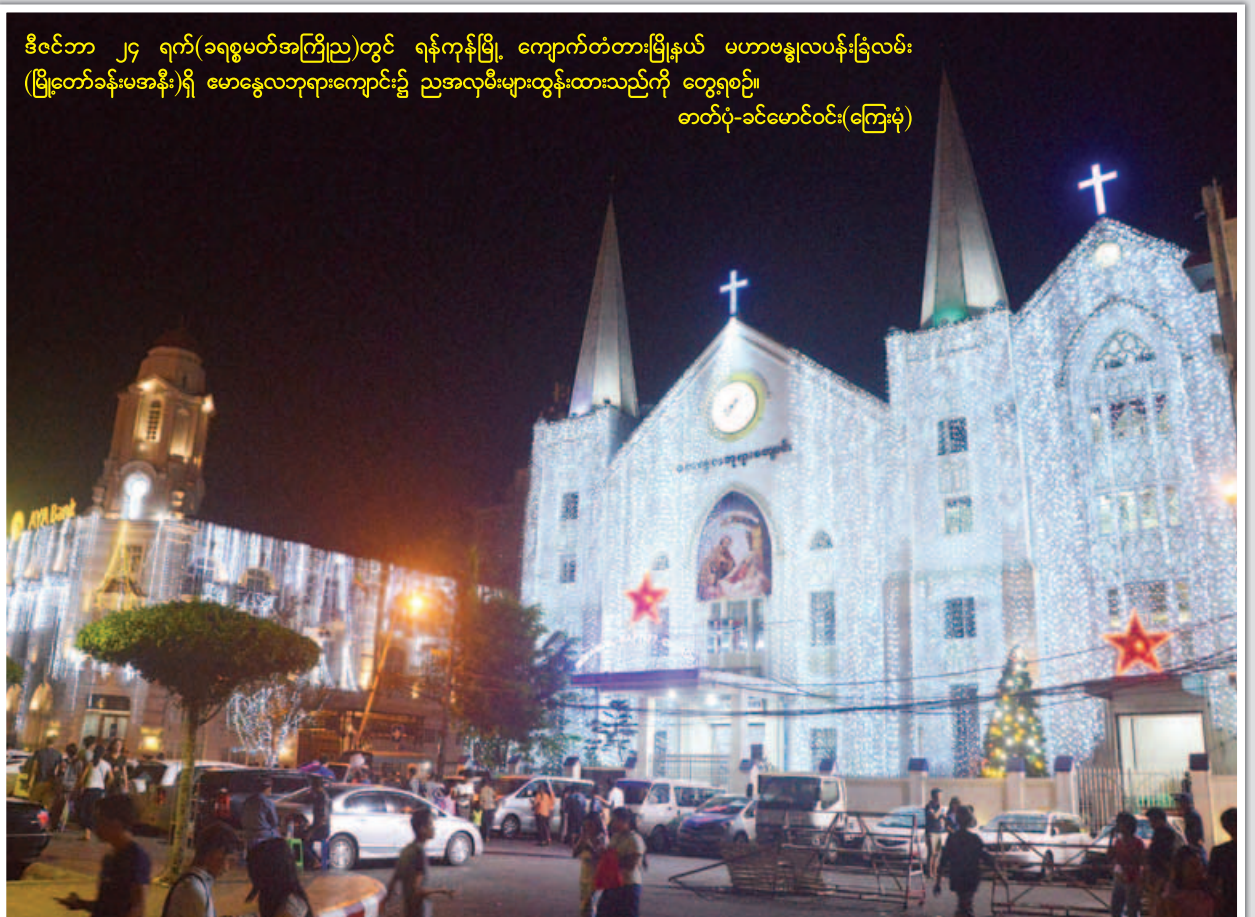
ဒီဇင်ဘာ ၂၄ ရက်(ခရစ္စမတ်အကြိုည)တွင် ရန်ကုန်မြို့ ကျောက်တံတားမြို့နယ် မဟာဗန္ဓုလပန်းခြံလမ်း (မြို့တော်ခန်းမအနီး)ရှိ မောဇွေလဘုရားကျောင်း၌ ညအလှူမီးများထွန်းထားသည်ကို တွေ့ရစဉ်။