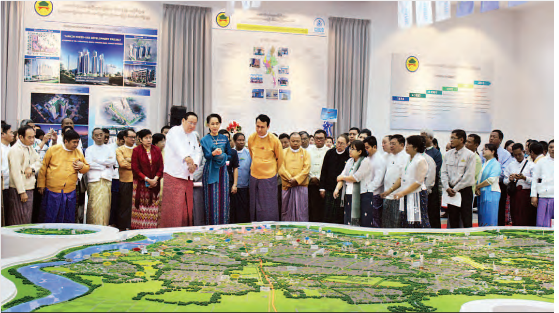
နိုင်ငံတော်၏အတိုင်ပင်ခံပုဂ္ဂိုလ် ဒေါ်အောင်ဆန်းစုကြည် ရန်ကုန်မြို့ပြ ဖွံ့ဖြိုးရေးပုံစံငယ်၊ ဒဂုံဆိပ်ကမ်းမြို့နယ် ပုံစံငယ်နှင့် ရတနာနှင်းဆီ အဆင့်မြင့်အိမ်ရာပုံစံငယ်များကို ကြည့်ရှုစဉ်။ (သတင်းစဉ်)