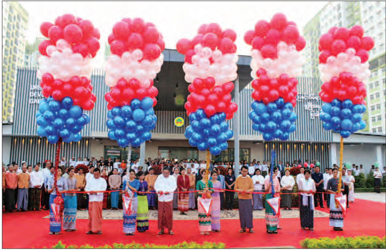
ဆောက်လုပ်ရေးဝန်ကြီးဌာန ပြည်ထောင်စုဝန်ကြီး ဦးဝင်းခိုင်၊ ရန်ကုန်တိုင်းဒေသကြီး ဝန်ကြီးချုပ် ဦးဖြိုးမင်းသိန်း၊ အင်ဂျင်နီယာများကြီး ဒေါ်စန်းစန်းအေးနှင့် ရွှေတောင်ကုမ္ပဏီမှ မန်နေဂျင်းဒါရိုက်တာ ဦးအောင်သန်းတို့ ရတနာနှင့်ဆီအဆင့်မြင့်အိမ်ရာ ၁၈ ထပ်အဆောက်အအုံသစ်စီမံကိန်း မိတ်ဆက်ဖွင့်ပွဲအခမ်းအနားကို ဖဲကြိုးဖြတ်ဖွင့်လှစ်ပေးကြစဉ်။ (သတင်းစဉ်)

လစဉ် (၈ နှစ်၊ ၁၀ နှစ်၊ ၁၂ နှစ်၊ ၁၅ နှစ်) အရစ်ကျ ပေးဆပ်သည့်စနစ်ဖြင့် စီမံဖြည့်ဆည်းပေးလျက်ရှိပါကြောင်း ပြောကြားသည်။