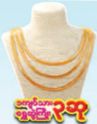
၁၀၀၀၀ သာ ရွှေဖွဲ့ကြေး ၃ ဆ

ကံစမ်းမဲကာလ (1-10-2016) ခု (31-12-2016) အထိ