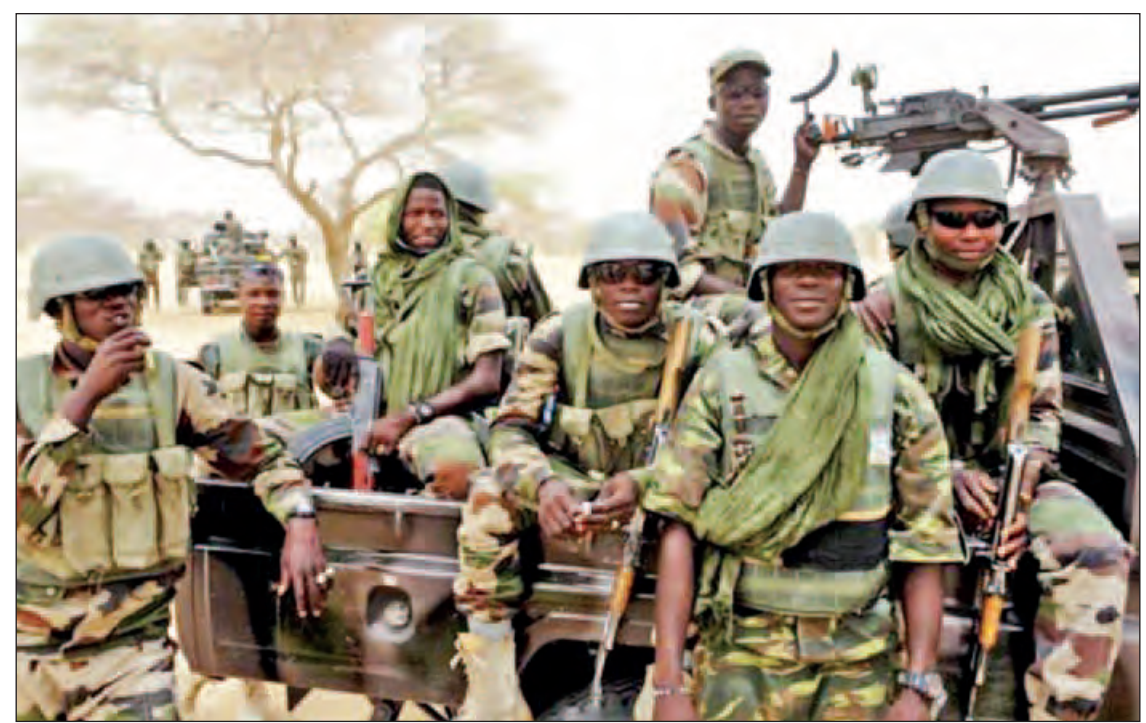
တောကစားရန်အတွက် သီးသန့်သတ်မှတ် သစ်တောကြီးဖြစ်ပြီး ဘိုကိုဟာရမ် စစ်သွေးကြွ စခန်းတည်ဆောက်ထားခြင်းဖြစ်သည်။

အဘူဂျာ ဒီဇင်ဘာ ၂၄ နိုင်ဂျီးရီးယားနိုင်ငံ အရှေ့မြောက်ပိုင်း ဆမ်ဘီဆာသစ်တောအတွင်းရှိ ဘိုကိုဟာရမ် အစွဲလာမ္မစ် စစ်သွေးကြွများ၏ အဓိကကျ သော ခြေကုပ်စခန်းတစ်ခုအား နိုင်ဂျီးရီးယား တပ်ဖွဲ့များက သိမ်းပိုက်ရရှိခဲ့ကြောင်း နိုင်ဂျီးရီးယားသမ္မတ မိုဟာမာဒူ ဘူဟာရီက ဒီဇင်ဘာ ၂၄ ရက်တွင် ပြောကြားသည်။ ဘိုကိုဟာရမ်တို့၏ အဓိကကျသော စခန်း သည် ဒီဇင်ဘာ ၂၂ ရက် မွန်းလွဲ ၁ နာရီ ၃၅ မိနစ်တွင် မိမိတပ်ဖွဲ့များလက်တွင်းသို့ ကျရောက်သွားပြီဖြစ်ကြောင်း နိုင်ဂျီးရီးယား တပ်မတော်၏ အကြီးအကဲအနေဖြင့် မိမိ ပြောကြားကြောင်း၊ ၎င်းတို့အတွက် ကြာရှည် ပြေးလွှားပုန်းခိုရန် နေရာမရှိတော့ကြောင်း နိုင်ဂျီးရီးယားသမ္မတက ပြောကြားသည်။ နိုင်ဂျီးရီးယား အစိုးရတပ်ဖွဲ့များသည် မကြာသေးမီ ရက်သတ္တပတ်များအတွင်းက ကြီးကျယ်သော ထိုးစစ်ကြီးတစ်ခုအား ဆမ်ဘီဆာသစ်တောဒေသတွင် ဆင်နွှဲခဲ့ သည်။ ဆမ်ဘီဆာသစ်တောသည် နိုင်ဂျီးရီးယား နိုင်ငံ ကိုလိုနီအဖြစ် ကျရောက်ခဲ့စဉ်က