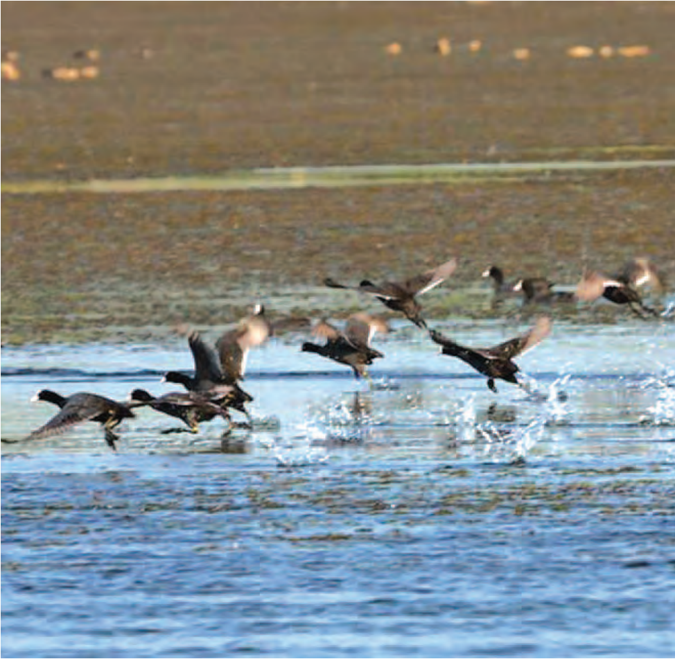
ရိုက်ကူးလျက်ရှိသည်။ ရိုက်ကူးမှုတွင် ငှက်များ အနှောင့်အယှက်မဖြစ်ရေး သဘာဝအတိုင်း နေထိုင်ကျက်စားမှုကို အထူးဂရုပြု ရိုက်ကူးကြရသည်။ ရိုက်ကူးမှုတွင် အဝေးဆွဲ ရိုက်ရသောကင်မရာ (Lens) များဖြစ်သည့် 600 mm (300 mm) များဖြင့် ရိုက်ကူးရကြောင်း ငှက်ချစ်သူဓာတ်ပုံဆရာများ နှင့် ငှက်ပညာရှင်များက ပြောသည်။ တိမ်တမန်

ဒီဇင်ဘာလတွင် ရောက်ရှိလာသော ငှက်များဖြစ်သည့် တောငန်းရိုင်း (Greylag goose)၊ ခရုတုတ် (Asian openbill)၊ ဟင်္သာ၊ ဥပန်းငှက် (Oriental darter) နှင့်အတူ အခြားရှားပါး ငှက်မျိုးစိတ်များ ရောက်ရှိနေပြီဖြစ်သည်။ လက်ရှိကာလ တွင် မန္တလေးမြို့နှင့်အနီးအင်းများအတွင်း ဆောင်းခိုငှက် များ ဝင်ရောက်လာပြီဖြစ်သည့်အတွက် ငှက်ချစ်မြတ်နိုးသည့် ဓာတ်ပုံဆရာများ အင်းအတွင်း ငှက်အလှဓာတ်ပုံများ နေ့စဉ်