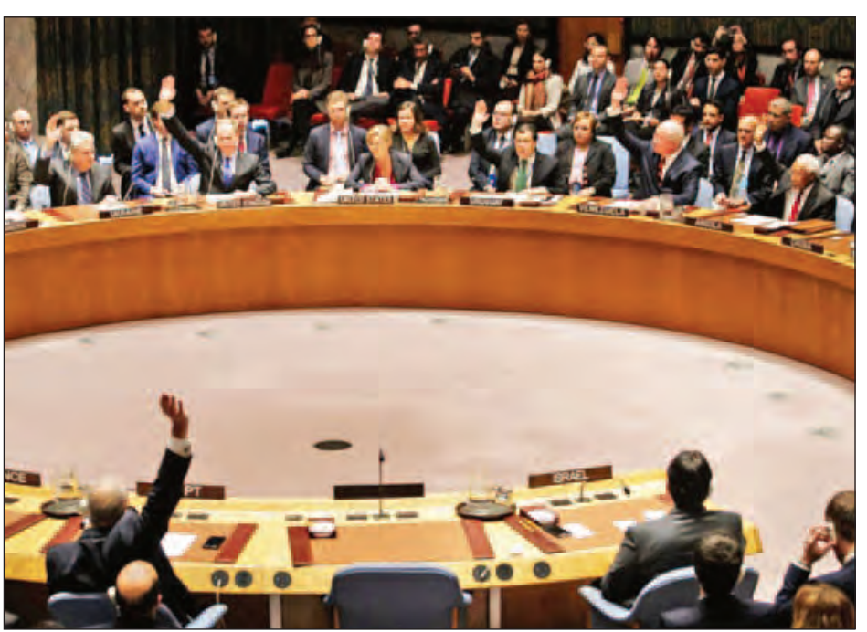
အောင်လုပ်ဆောင်သွားနိုင်မည်ဟု မျှော်လင့်နေသည်။ လိုက်ပြီး အစွဲရေးအခြေချအိမ်ရာတည်ဆောက်ရေး မူဝါဒကို အလဲထိုးနိုင်လိုက်သည်ဟု ပြောကြားသည်။ အင်န်အိတ်ချ်ကေ။

စမန်သာ ပါဝါကပြောကြားသည်။ အိုဘားမားအစိုးရက ၎င်း၏သမ္မတသက်တမ်း မကုန်ဆုံးမီ အစွဲရေးနိုင်ငံကို အခြေချအိမ်ရာတည်ဆောက် ရေးမှုဝါဒကို ပြန်လည်သုံးသပ်ရန် တိုက်တွန်းခဲ့သည်ဟု လေ့လာသူများက ပြောကြားသည်။ အမေရိကန်ရွေးကောက်ခံသမ္မတ ဒေါ်နယ်ထရန်က အစွဲရေးနိုင်ငံ၏ ရပ်တည်ချက်ကို ထောက်ခံပြီး အဆိုပါ ဆုံးဖြတ်ချက်အတွက် ကနဦးအဆိုပြုခဲ့သည့် အီဂျစ်နိုင်ငံ၏ အဆိုပြုချက်ကို ရုပ်သိမ်းသွားအောင်လည်း ဖိအားပေးနိုင်ခဲ့ သည်။ ဆုံးဖြတ်ချက်ကို အစွဲရေးနိုင်ငံက ပယ်ချခဲ့ပြီး ရှုတ်စရာ ကောင်းသည့် ဆုံးဖြတ်ချက်ဖြစ်ကြောင်းနှင့် အစွဲရေး ဆန့်ကျင်သူများဟု တုံ့ပြန်ခဲ့သည်။ အစွဲရေးနိုင်ငံက အမေရိကန်သမ္မတဖြစ်လာမည့် ဒေါ်နယ်ထရန်၊ အမေရိကန်ကွန်ဂရက်ရှိ ၎င်းတို့၏ မိတ်ဆွေများနှင့် အဆိုပါဆုံးဖြတ်ချက်ကို အချည်းနှီးဖြစ်