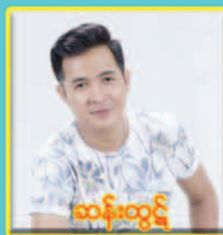
ထန်းထွဋ်