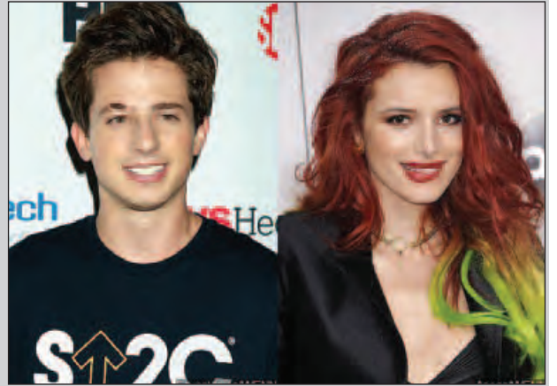
အေးမြည့်

ဘယ်လာနဲ့ ချာလီနဲ့ချစ်ကြိုက်နေတယ်ဆိုတာ လုံးဝမမှန်ကန်ကြောင်း ပြောကြားခဲ့တာကြောင့် သူတို့နှစ်ဦးရဲ့ ဆက်ဆံရေးဟာ ဝေဖန်စရာဖြစ်ခဲ့ပါ တယ်။ မကြာသေးမီက ပြုလုပ်ခဲ့တဲ့ အိုင်ဟာ့တ်ရေဒီယိုက ကျင်းပတဲ့ ဖျော်ဖြေပွဲ တစ်ခုမှာ ဘယ်လာအပေါ်ထားရှိတဲ့ မေတ္တာတရားတွေကို ချာလီက ထုတ်ဖော်ပြသ ခဲ့ကြောင်းလည်း ပီပဲလ်ဒေါ့ကွန်းရဲ့ ဖော်ပြချက်အရ သိရပါတယ်။ဒါ့ကြောင့် ကြယ်ပွင့်စုံတွဲနှစ်ဦးရဲ့ လတ်တလောဆက်ဆံရေး အခြေအနေဟာလည်း ဟောလိဝုဒ်မီဒီယာတွေအဖို့ စိတ်ဝင်စားစရာ ဇာတ်လမ်းတစ်ပုဒ်ဖြစ်နေပါ တော့တယ်။