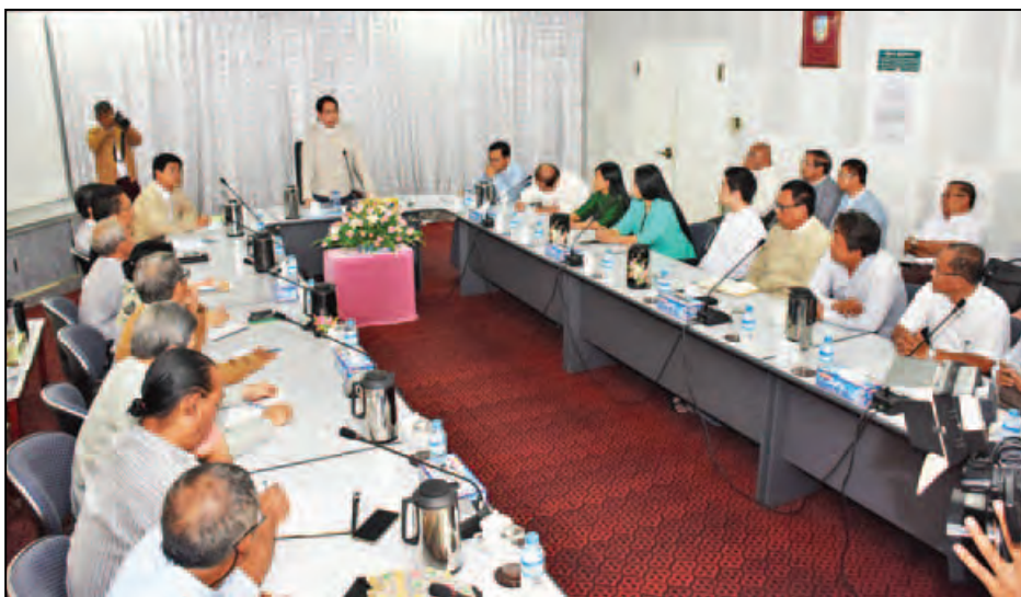
ပြည်ထောင်စုဝန်ကြီး ဒေါက်တာဖေမြင့် မြန်မာ့ဒီမိုကရေစီရပ်ရှင် ရက်သတ္တပတ်ပွဲတော်ကျင်းပရေး ဒုတိယအကြိမ် ညှိနှိုင်းအစည်းအဝေးတွင် အမှာစကားပြောကြားစဉ်။ (သတင်းစဉ်)

မြန်မာ့ဒီမိုကရေစီရပ်ရှင် ရက်သတ္တ ပတ်ပွဲတော်ကျင်းပရေး ဒုတိယ အကြိမ်ညှိနှိုင်းအစည်းအဝေးကို ယနေ့မွန်းလွဲ ၂ နာရီတွင် ရန်ကုန်မြို့၊ ပြည်လမ်းရှိ မြန်မာ့အသံနှင့် ရုပ်မြင် သံကြား အစည်းအဝေးခန်းမ၌ ကျင်းပသည်။