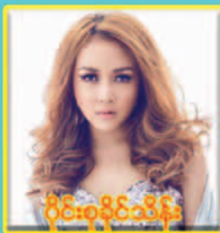
ပိုင်းစုပိုင်သိန်း