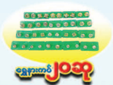
ရွှေစားကပ် ၂၀ ဆ