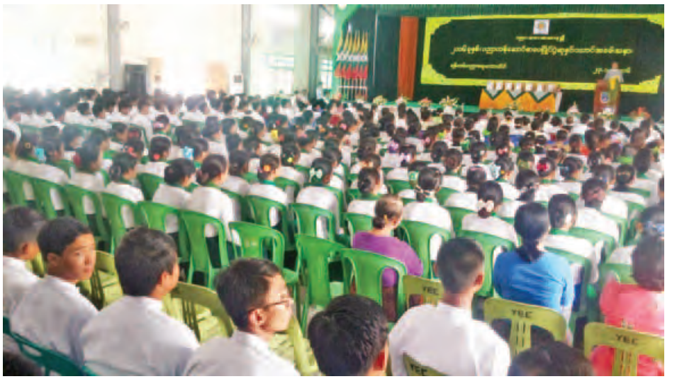
ချီးမြှင့်ကြသည်။ အဆိုပါ အခမ်းအနားသို့ ပြည်ထောင်စုဝန်ကြီးနှင့် တာဝန်ရှိသူများ၊ ရန်ကုန်တိုင်းဒေသကြီးအစိုးရအဖွဲ့မှ တာဝန်ရှိသူများ၊ မြန်မာနိုင်ငံစာရေးဆရာအသင်းဥက္ကဋ္ဌ၊ ပညာတန်ဆောင်နာယကကြီးများနှင့် အုပ်ချုပ်ရေးအဖွဲ့

ယင်းနောက် အခမ်းအနားအစီအစဉ်အရ ပညာ တန်ဆောင်အုပ်ချုပ်ရေးအဖွဲ့ဥက္ကဋ္ဌ ဒေါက်တာဦးသန်းဦး က နှုတ်ခွန်းဆက်စကားပြောကြားပြီး တာဝန်ရှိသူများက ပညာတန်ဆောင်ဂုဏ်ထူးဆောင် ဂုဏ်ပြုမှတ်တမ်း ပေးအပ်ခြင်း၊ ပညာတန်ဆောင်ဂုဏ်ထူးဆောင်ပုဂ္ဂိုလ်ကြီး များ၊ ကမ္ဘာ့ဆရာများနေ့ ဂုဏ်ထူးဆောင်ဆရာကြီးများနှင့် စာပေပိမာန်စာမူဆုရရှိသူများအား ထပ်ဆင့်ဂုဏ်ပြု ချီးမြှင့်ခြင်း၊ ပညာတန်ဆောင်လက်ရွေးစင်ထူးချွန်ဆုချီးမြှင့် ခြင်း၊ မဂ္ဂဇင်းဖြန့်ချိမှုထူးချွန်ဆု ဂုဏ်ပြုလှူဒါန်းပေးအပ်ခြင်းနှင့် ပညာတန်ဆောင်စာပေပြိုင်ပွဲ ဆုရရှိသူများအား ဂုဏ်ပြုဆု