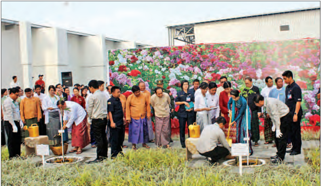
နိုင်ငံတော်၏အတိုင်ပင်ခံပုဂ္ဂိုလ် ဒေါ်အောင်ဆန်းစုကြည် ရတနာနှင့်ဆီအဆင့်မြင့်အိမ်ရာဝင်းအတွင်း ဖွင့်ပွဲအထိမ်းအမှတ်အဖြစ် မဟာလေကားပင်နှင့် ပြည်ထောင်စုဝန်ကြီး ဦးဝင်းခိုင် သရဖိုပင်တို့ စိုက်ပျိုးပေးကြစဉ်။ (သတင်းစဉ်)

ပြည်သူလူထု၏ နေရေးအဆင်ပြေမှုနှင့်ဆိုင်ရန် ဆောက်လုပ်ရေးဝန်ကြီးဌာနအနေဖြင့် ဆောက်လုပ်ရေးနှင့် အိမ်ရာဖွံ့ဖြိုးရေးဘဏ်ကို ၂၀၁၄ ခုနှစ်တွင် ထူထောင်ခဲ့ကြောင်း၊ ယခုအခါ သိန်း ၁၀၀ အောက် တန်ဖိုးနည်းအိမ်ရာများကို ပြည်သူလူထုထံသို့ ကနဦး တစ်လုံးတစ်ခဲတည်း ၃၀ ရာခိုင်နှုန်းပေးသွင်းစေပြီး ၇၀ ရာခိုင်နှုန်းကို ဆောက်လုပ်ရေးနှင့် အိမ်ရာဖွံ့ဖြိုးရေးဘဏ်နှင့် ချိတ်ဆက်၍