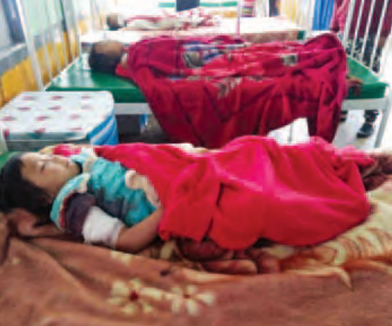
ပေးခဲ့ပြီး ဖြစ်စဉ်ဖြစ်ပွားရာနေရာ လုပ်ငန်းများ ဆောင်ရွက်လျက်ရှိကြောင်း တစ်ဝိုက်သို့ နယ်မြေရှင်းလင်းရေး သတင်းရရှိသည်။ (သတင်းစဉ်)

ရှမ်းပြည်နယ် အရှေ့မြောက်ဒေသ ကွတ်ခိုင်မြို့နယ် ပြည်ထောင်စု ကားလမ်းမကြီးပေါ်၌ ပုံမှန်သွားလာ လျက်ရှိသည့် ယာဉ်များအား ယနေ့ နံနက် ၉ နာရီခန့်တွင် KIA လက်နက်ကိုင်အဖွဲ့အင်အား ငါးဦး ခန့်က မန်လွယ်ကျေးရွာ၏ အရှေ့ဘက် မီတာ ၅၀၀ ခန့်အကွာမှနေ၍ လက်နက်ကြီးဖြင့် အကြောင်းမဲ့ ပစ်ခတ်ခဲ့ရာ အပြစ်မဲ့ပြည်သူ ငါးဦး လက်နက်ကြီးကျည် ထိမှန်ဒဏ်ရာရ ရှိခဲ့သည်။ အဆိုပါ ဒဏ်ရာရရှိသူများအား တပ်မတော်စစ်ကြောင်းများက ဆေးဝါး ကုသနိုင်ရေးအတွက် ကူညီဆောင်ရွက်