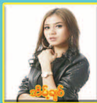
ခင်စုချစ်