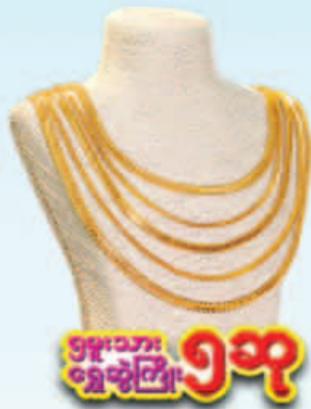
၅၅၀၀၀ သာ ရွှေဖွဲ့ကြေး ၅ ဆ