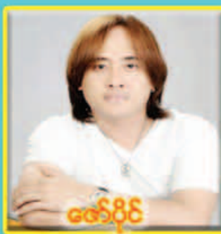
ဇော်ပိုင်