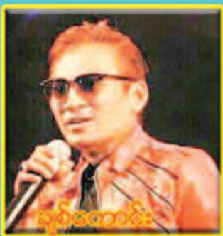
ရှင်စတန်း

ဝယ်ယူထားသော မိတ်ဆွေများ အနေဖြင့် ကံစမ်းမဲဖွင့်ပွဲ အခမ်းအနားသို့ ဝယ်ယူထားသော ဘောင်ချာ၊ ကုပွန်စာရွက် ၊ မှတ်ပုံတင် နှင့် တကွ ယူဆောင်လာပြီး နိုင်ငံကျော် တေးသံရှင်များ၏ ဖျော်ဖြေမှုနှင့်အတူ ရင်ခုန်ဖွယ်ရာ ကံထူးရှင်ရွေးချယ်ပွဲကြီးအား ချက်ချင်းမဲနှိုက်ပြီး ချက်ချင်းချီးမြှင့်သွားမည်ဖြစ်ပါ၍ ကြွရောက်ပေးပါရန် ဖိတ်ကြားအပ်ပါသည်။