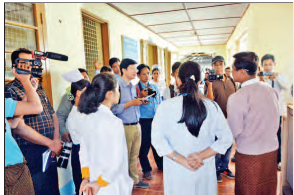
အခြေအနေများနှင့်ပတ်သက်၍ မေးမြန်းသတင်းရယူခဲ့ကြသည်။ သတင်း-ဇေယျာ(မိုင်ရာ)၊ တင်မောင်လွင်၊ ဓာတ်ပုံ-မောင်မွှေး

ပြည်တွင်း၊ ပြည်ပ သတင်းမီဒီယာအဖွဲ့ ဘူးသီးတောင်မြို့နယ်ရှိ မြို့နယ်ပြည်သူ့ဆေးရုံ၌ မေးမြန်းသတင်းရယူနေကြစဉ်။