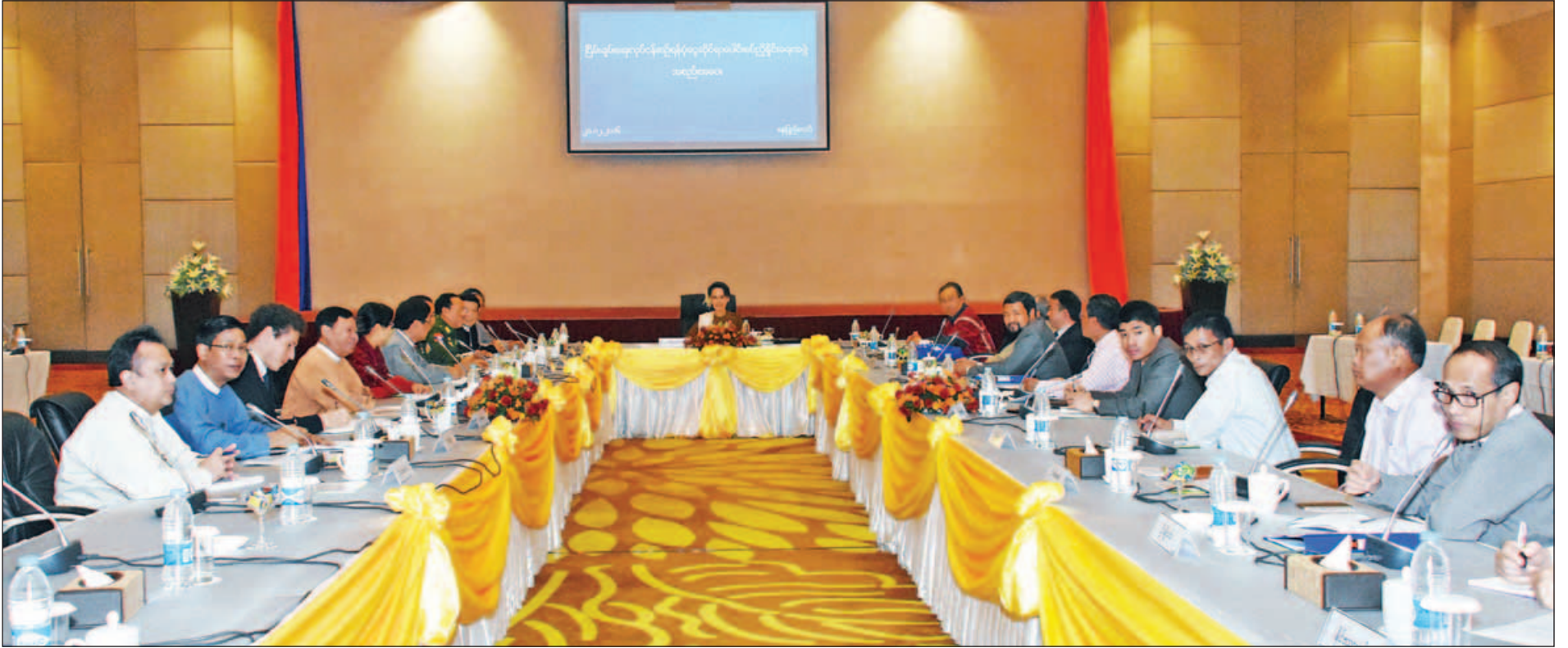
နိုင်ငံတော်၏အတိုင်ပင်ခံပုဂ္ဂိုလ် ဒေါ်အောင်ဆန်းစုကြည် ငြိမ်းချမ်းရေးလုပ်ငန်းစဉ် ရန်ပုံငွေဆိုင်ရာပေါင်းစပ်ညှိနှိုင်းရေးအဖွဲ့ ဖွဲ့စည်းရေးဆိုင်ရာအစည်းအဝေးတွင် အမှာစကားပြောကြားစဉ်။ (သတင်းစဉ်)