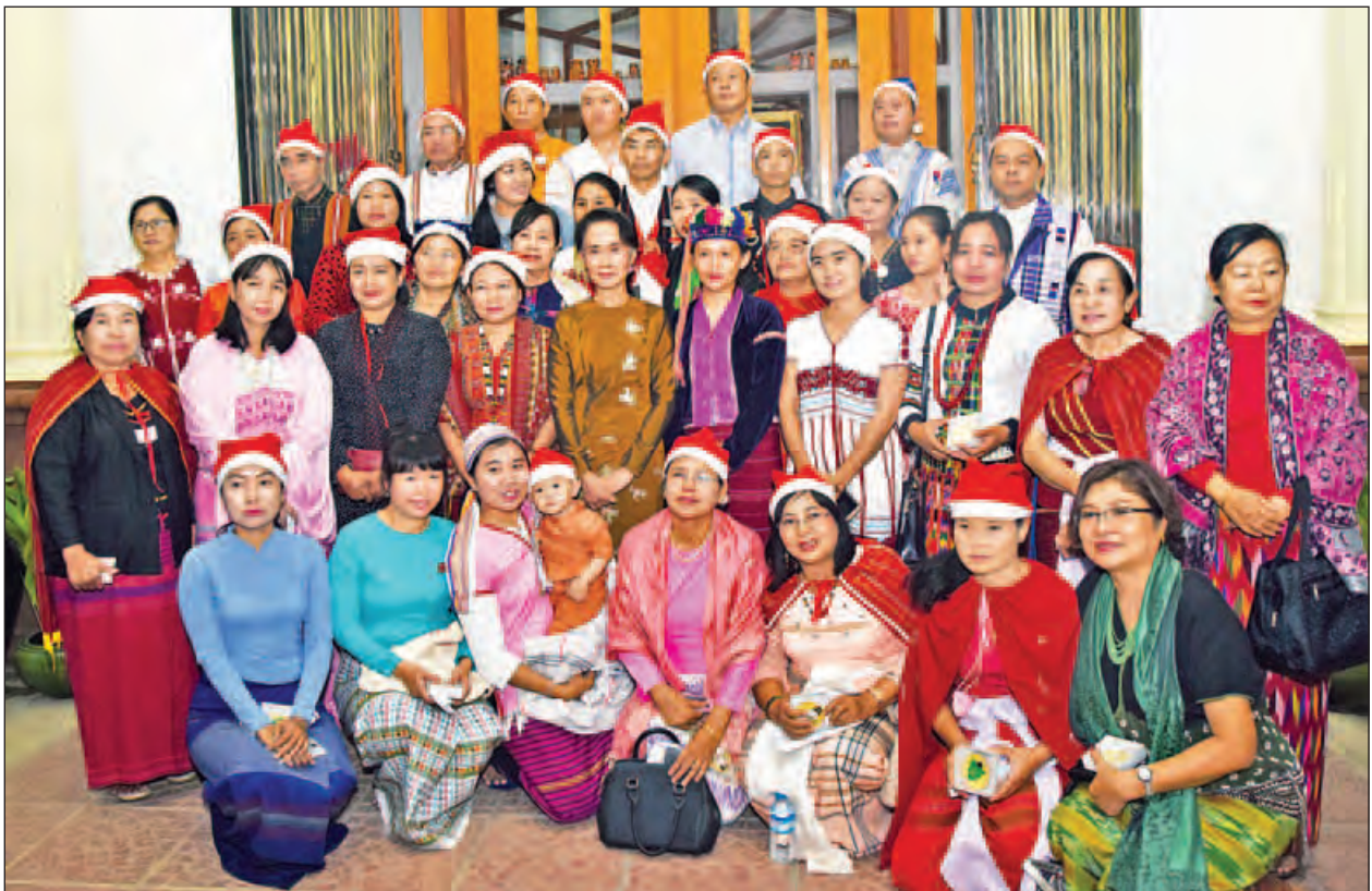
နိုင်ငံတော်၏အတိုင်ပင်ခံပုဂ္ဂိုလ် ဒေါ်အောင်ဆန်းစုကြည် ပြည်ထောင်စုလွှတ်တော်ကိုယ်စားလှယ်များမိသားစုအဖွဲ့နှင့်အတူ စုပေါင်းဓာတ်ပုံရိုက်ကြစဉ်။ (သတင်းစဉ်)