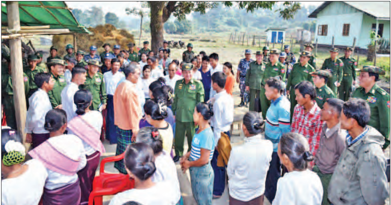
တပ်မတော်ကာကွယ်ရေးဦးစီးချုပ် ဗိုလ်ချုပ်မှူးကြီးမင်းအောင်လှိုင် ဗန္ဓုလကျေးရွာဒေသခံများအား ရင်းရင်းနှီးနှီးတွေ့ဆုံနှုတ်ဆက်စဉ်။ (မြဝတီ)

ဘာသာပေါင်းစုံ အတူတကွ ယှဉ်တွဲပြီး ရောင်းဝယ်နေမှုအခြေအနေကို သတင်းရယူကြသည်။ ဆက်လက်၍ ဘူးသီးတောင်မြို့၏ တောင်ဘက်ရှိ သပိတ်တောင်ကျေးလက်ကျန်းမာရေးဌာနသို့ သွားရောက်ပြီး ရွာပေါင်း ၈၅ ရွာတွင် နယ်လှည့်ကွင်းဆင်း၍ ကျန်းမာရေးစောင့်ရှောက်မှုအခြေအနေကို မေးမြန်းကြသည်။ ယင်းနောက် ပြည်တွင်း၊ ပြည်ပ သတင်းမီဒီယာအဖွဲ့သည် ဘူးသီးတောင်မြို့မှ မောင်တောမြို့သို့ ဆက်လက်ထွက်ခွာကြပြီး ညပိုင်းတွင် မောင်တောမြို့ မြို့မတောင်ရပ်ကွက် ရပ်ကွက်အုပ်ချုပ်ရေးမှူးရုံး၌ အစုလာမိဘာသာရေး ခေါင်းဆောင်၊ ရပ်မိရပ်ဖများနှင့် ရပ်ကွက်အုပ်ချုပ်ရေးမှူးများအား တွေ့ဆုံပြီး မောင်တောမြို့နယ်အတွင်း အောက်တိုဘာ ၉ ရက်တွင် အကြမ်းဖက်စီးနင်းတိုက်ခိုက်ခံရမှုနှင့် နောက်ဆက်တွဲဖြစ်စဉ်များ ဖြစ်ပွားခဲ့မှု ဖြစ်စဉ်ဖြစ်ပွားပြီးနောက် နယ်မြေတည်ငြိမ်အေးချမ်းလာမှု