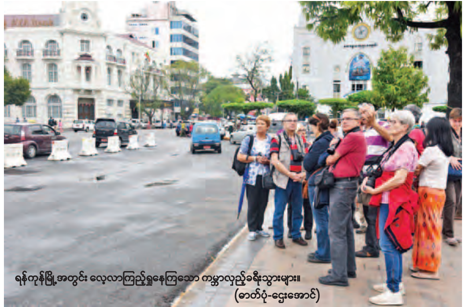
ရန်ကုန်မြို့အတွင်း လေ့လာကြည့်ရှုနေကြသော ကမ္ဘာလှည့်ခရီးသွားများ။

အာဆီယံဒေသတွင်း နိုင်ငံများအနက် ဖွံ့ဖြိုးဆဲနိုင်ငံများဖြစ်သည့် ကမ္ဘောဒီးယား၊ လာအို၊ မြန်မာ၊ ဗီယက်နမ် CLMV လေးနိုင်ငံအနက် မြန်မာနိုင်ငံကို နိုင်ငံတကာမှ ကမ္ဘာလှည့် ခရီးသွားများ သိရှိမှု အနည်းပါးဆုံးဖြစ်ကြောင်း ခရီးသွားကဏ္ဍဆိုင်ရာ စစ်တမ်းပြုစုထားချက်များအရ သိရသည်။