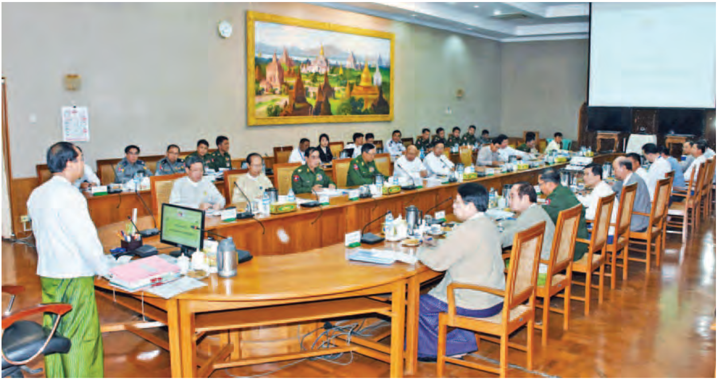
ဒုတိယသမ္မတ ဦးမြင့်ဆွေ (၆၉) နှစ်မြောက် လွတ်လပ်ရေးနေ့ကျင်းပရေးနှင့် စစ်လျဉ်းသည့် တတိယအကြိမ် ညှိနှိုင်းအစည်းအဝေးတွင် အမှာစကားပြောကြားစဉ်။ (သတင်းစဉ်)

အစည်းအဝေးတွင် ၂၀၁၇ ခုနှစ် (၆၉)နှစ်မြောက် လွတ်လပ်ရေးနေ့ကျင်းပရေး ဗဟိုကော်မတီဥက္ကဋ္ဌ ဒုတိယ သမ္မတ ဦးမြင့်ဆွေက လွတ်လပ်ရေးနေ့အတွက် ချမှတ် ထားသော အမျိုးသားရေးဦးတည်ချက် (၄)ရပ်ကို အောင်မြင်အောင် မိမိတို့နိုင်ငံသူ နိုင်ငံသားများ အားလုံး က ကြိုးပမ်းဆောင်ရွက်ကြရမည်ဖြစ်ကြောင်းနှင့် ဆပ်ကော်မတီ(၈)ခုကလည်း မိမိတို့လုပ်ငန်းတာဝန်ဝတ္တ ရားများကို ကျေပွန်အောင် ဆောင်ရွက်ကြရန်လိုကြောင်း၊ ယခုနှစ်တွင် လွတ်လပ်ရေးနေ့ အခမ်းအနားများကို ပိုမို စည်ကားသိုက်မြိုက်စွာ ကျင်းပမည်ဖြစ်၍ လုပ်ငန်းများ ဆောင်ရွက်ရာတွင် အသေးစိတ် စေ့စေ့စပ်စပ် သတိပြု ဆောင်ရွက်သွားကြရမည်ဖြစ်ပါကြောင်း၊ ယခုကျင်းပမည့် လွတ်လပ်ရေးနေ့ အခမ်းအနားသည် အစိုးရသစ် လက်ထက်တွင် ပထမဆုံးကျင်းပမည့် လွတ်လပ်ရေးနေ့ အခမ်းအနားဖြစ်သည့်အားလျော်စွာ အခမ်းအနား အောင်မြင်စွာ ကျင်းပနိုင်ရေးအတွက် တက်ညီလက်ညီ ကြိုးပမ်းဆောင်ရွက်သွားကြရန်ဖြစ်ပါကြောင်း ပြောကြား သည်။