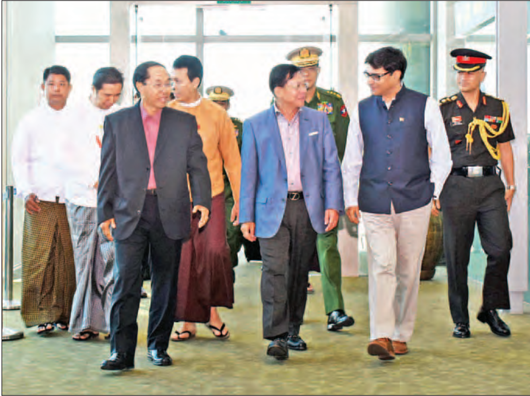
ဒုတိယသမ္မတ ဦးမြင့်ဆွေ၊ တပ်မတော်ကာကွယ်ရေးဦးစီးချုပ် ဗိုလ်ချုပ်မှူးကြီးမင်းအောင်လှိုင်နှင့်အဖွဲ့အား ရန်ကုန်အပြည်ပြည်ဆိုင်ရာ လေဆိပ်၌ ကြိုဆိုနှုတ်ဆက်သူများနှင့်အတူ တွေ့ရစဉ်။ (သတင်းစဉ်)

မကောင်းမှုကို မိမိပြုခဲ့လျှင် မိမိသည်ပင်ညွှန်ပေးရ၏။ မကောင်းမှုကို မိမိမပြုခဲ့လျှင် မိမိသည်ပင် စင်ကြယ်၏။ စင်ကြယ်သောကုသိုလ်နှင့် မစင်ကြယ်သော အကုသိုလ်သည် တခြားစီသာ ဖြစ်၏။ သူတစ်ယောက်သည် အခြားသူတစ်ယောက်ကို (ကိလေသာအညစ်အကြေးမှ စင်ကြယ်အောင်) မသုတ်သင်နိုင်။ (မကောင်းမှုကို မပြုဘဲ မိမိကိုယ်ကို စင်ကြယ်အောင် သုတ်သင်ထားရာ၏။)