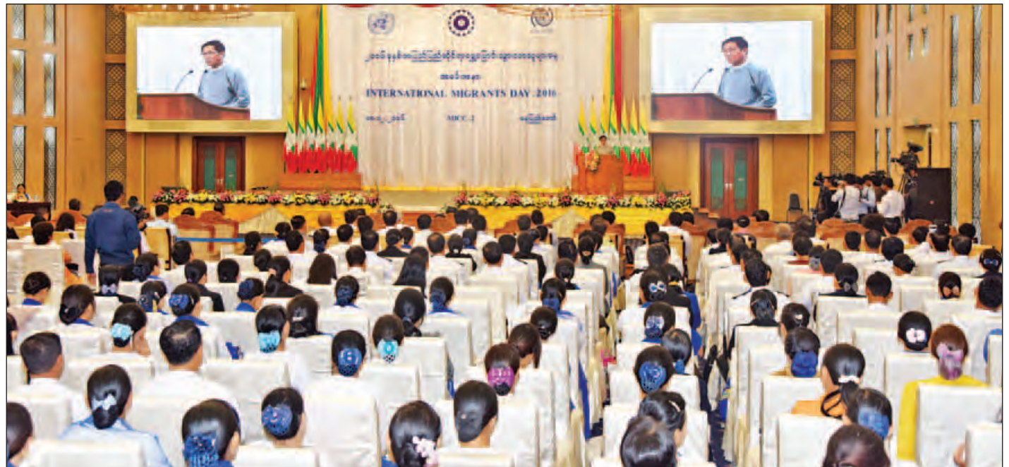
၂၀၁၆ ခုနှစ် အပြည်ပြည်ဆိုင်ရာရွှေ့ပြောင်းသွားလာသူ များနေ့ အထိမ်းအမှတ်အခမ်းအနား ကျင်းပစဉ်။ (သတင်းစဉ်)

ကမ္ဘာ့နိုင်ငံအသီးသီးအနေဖြင့် ရွှေ့ပြောင်းသွားလာသူများ၏ လူ့အခွင့်အရေးကို အပြည့်အဝလေးစားလိုက်နာခြင်းနှင့် မူရင်းနိုင်ငံ၊ လမ်းခရီးရောက်ရှိသည့်နိုင်ငံနှင့် ခရီးလမ်းဆုံး နိုင်ငံများအကြား တာဝန်ဝတ္တရားများကို ပိုမိုပူးပေါင်းမျှဝေ ဆောင်ရွက်ခြင်းဖြင့် အပြည်ပြည်ဆိုင်ရာ၌ အကျိုး သက်ရောက်မှုရလဒ်အသစ်များ ရရှိလာရန် ဆောင်ရွက် သွားရမည်ဖြစ်ကြောင်း ဒုတိယသမ္မတ ဦးဟင်နရီဗန်ထီးယူ က ပြောကြားသည်။ ကမ္ဘာတစ်ဝန်း၌ Globalization ဖြစ်စဉ်နှင့် ကမ္ဘာ့ စီးပွားရေးပြောင်းလဲလာမှုများနှင့်အတူ နိုင်ငံတစ်နိုင်ငံ ချင်းစီ၏ စီးပွားရေးဖွံ့ဖြိုးတိုးတက်မှု၊ ပိုမိုကောင်းမွန်သော အလုပ်အကိုင်အခွင့်အလမ်း ရရှိလိုမှု၊ လူမှုစီးပွားဘဝအဆင့် အတန်းကွာဟမှု စသည့်အခြေအနေများကြောင့် တစ်နိုင်ငံမှ တစ်နိုင်ငံသို့ စာမျက်နှာ ၃ ကော်လံ ၁ သို့ ၀