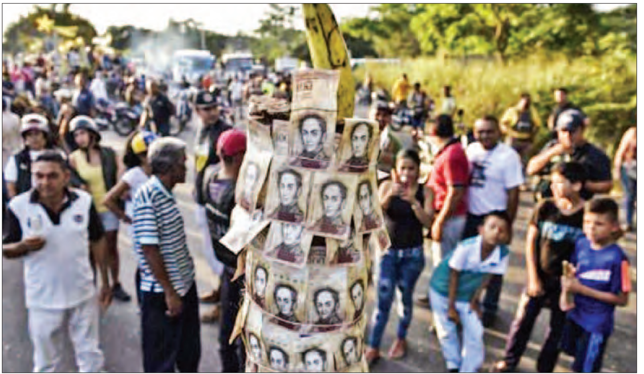
စီးပွားရေး အကျပ်ဆိုင်နေသော ပင်နီဇွဲလားနိုင်ငံ၌ တန်ဖိုးကြီး ငွေစက္ကူ ရုတ်ခြည်းဖျက်သိမ်းခံရမှုကြောင့် ပြည်သူတို့မှာ စားနပ်ရိက္ခာနှင့် စက်သုံးဆီ စသည့် လူသုံးကုန်များ ဝယ်ယူရန်နှင့် ခရစ်စမတ်ပွဲတော်အတွက် ပြင်ဆင်ရန် ဒုက္ခလှလှ တွေ့ကြုံခဲ့ရသည်ဆို၏။

ကာရာကတ် ဒီဇင်ဘာ ၁၈ ပင်နီဇွဲလားနိုင်ငံ၏ လှည့်ပတ်သုံးစွဲငွေစနစ်မှ တန်ဖိုးအကြီးဆုံး ငွေစက္ကူအား ဖျက်သိမ်းသည့်အစီအစဉ်ကို သမ္မတ နီကိုလပ် မာဒူရိုက ဆိုင်းငံ့ထားလိုက်ကြောင်း၊ တန်ဖိုးကြီးငွေစက္ကူ ရုပ်သိမ်းသည့်အစီအစဉ်ကြောင့် နိုင်ငံတစ်ဝန်း မငြိမ်မသက်မှုများ ဖြစ်ပေါ်ခဲ့ရသဖြင့် ယင်းသို့ ဆိုင်းငံ့လိုက်ခြင်းဖြစ်ကြောင်း ဒေသဆိုင်ရာ သတင်းဌာနများက ဒီဇင်ဘာ ၁၈ ရက်တွင် သတင်းထုတ်ပြန်သည်။ ပင်နီဇွဲလားနိုင်ငံ၌ အစိုးရ၏ အမိန့်ဖြင့် ဘီလီယံ ၁၀၀ တန်ဖိုးရှိ ငွေစက္ကူများကို လှည့်ပတ်သုံးစွဲငွေစနစ်မှ ရုတ်ခြည်းရုပ်သိမ်းလိုက်ရာ ဖျက်သိမ်းခံရသော ငွေစက္ကူဟောင်းများကို ပြန်လည်လဲလှယ်လိုသော ပြည်သူများက ဘဏ်များတွင် အချိန်ကြာမြင့်အောင် တန်းစီစောင့်ဆိုင်းခဲ့ကြရခြင်း၊ ဈေးဆိုင်အများအပြား၌ လူယက်မှုများဖြစ်ပွားခြင်း၊ အစိုးရဆန့်ကျင်ရေး ဆန္ဒပြပွဲများ ပေါ်ပေါက်ခြင်း စသည့် ဂယက်ရိုက်ခတ်မှုများ ဖြစ်ပေါ်ခဲ့ရသည်။ ၅၀၀ တန်၊ ၂၀၀၀ တန်နှင့် ၂၀၀၀၀ တန် ဘီလီယံ ငွေစက္ကူသစ်များ သယ်ဆောင်လာမည့် လေယာဉ်သုံးစင်းဆိုင်ရာကိစ္စ နှောင့်နှေးကြန့်ကြာခဲ့ရခြင်းသည် ပြည်ပမှ အဖျက်အမှောင်ပြုလုပ်သူများကြောင့် ဖြစ်ရကြောင်း သမ္မတ မာဒူရိုက ထုတ်ပြန်ကြေညာခဲ့သည်။ ပင်နီဇွဲလားနိုင်ငံ၌ ဘီလီယံ ၁၀၀ တန် ငွေစက္ကူများ သုံးစွဲမှုကို ဒီဇင်ဘာ ၁၅ ရက်မှစ၍ တရားဝင်ရုပ်ဆိုင်းခဲ့သည်။ ဘီလီယံ ၁၀၀ တန် ငွေစက္ကူတစ်ရွက်၏ တန်ဖိုးမှာ မှောင်ခိုငွေကြေးဈေးကွက်တွင် အမေရိကန် ဒေါ်လာ(၄)ဆင့်မျှသာ တန်ဖိုးရှိသည်။ ဇန်နဝါရီ ၂ ရက်အထိ ဘီလီယံ ၁၀၀ တန် ငွေစက္ကူအား လှည့်ပတ်သုံးစွဲငွေအဖြစ် ဆက်လက်သုံးစွဲရန် ခွင့်ပြုပေးလိုက်ကြောင်း သမ္မတ မာဒူရိုက ထုတ်ပြန်ကြေညာသည်။