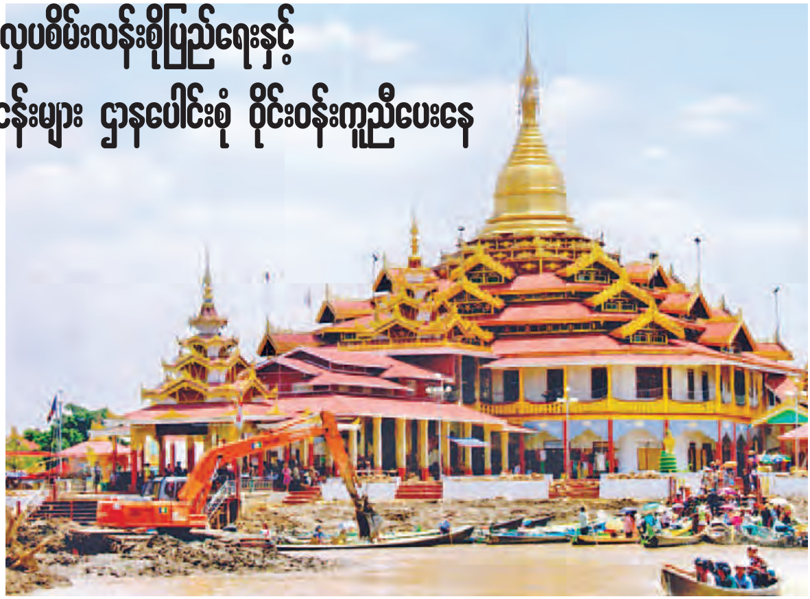
အင်းလေးဖောင်တော်ဦးစေတီအနီး သဲနန်းများ တူးဖော်ဖယ်ရှားနေစဉ်။

အင်းလေးကန်၏ ရေဝေရေလဲဓရိယာသည် ညောင်ရွှေမြို့နယ်၊ တောင်ကြီးမြို့နယ်၊ ကလောမြို့နယ်၊ ပင်းတယ်မြို့နယ်၊ ရပ်စောက်မြို့နယ်နှင့် ဖယ်ခုံမြို့နယ်တို့ ထိစပ်လျက်ရှိပြီး မြန်မာနိုင်ငံ၏ ရေတိမ်ဒေသကြီးများအနက် တစ်ခုအပါအဝင်ဖြစ်ကာ စာမျက်နှာ ၉ ကော်လံ ၁ သို့