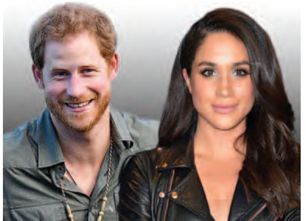
ခရစ္စမတ်သစ်ပင်အတူပင်ခဲ့တဲ့ မင်းသား ဟယ်ရီနဲ့ မက်ဂန်မာကယ်လ်

လတ်တလောထုတ်လွှင့်ခဲ့တဲ့ ဂါဂါရဲ့ တေးအယ်လ်ဘမ်သစ် "Joanne" ဟာ ဂါဂါရဲ့ ခဲစားချက်တွေ လွှမ်းမိုးနေတဲ့ တေးအယ်လ်ဘမ်တစ်ခုဖြစ်တယ်လို့ ဝေဖန်သံတွေ ထွက်ပေါ်လာခဲ့ပါတယ်။ ယင်းတေးအယ်လ်ဘမ်မှာပါဝင်တဲ့ တေးသီချင်းတစ်ပုဒ်ဖြစ်တဲ့ "Perfect Illusion" ဟာလည်း ဂါဂါက မကြာသေးမီကမှ လမ်းခွဲခဲ့တဲ့ ချစ်သူဟောင်း တေလာကင်နေကို ရည်ရွယ်သီဆိုထားတာဖြစ်တယ်လို့ ဝေဖန်ခဲ့ကြပါတယ်။ ဒါပေမယ့် လေဒီဂါဂါကတော့ အဆိုပါကောလာဟလတွေကို ငြင်းဆိုခဲ့ပြီး သူ့အနေနဲ့ တေလာကို အလွန်ချစ်ခင်ကြောင်းနဲ့ လတ်တလောမှာ အကောင်းဆုံးသွယ်ချင်းတွေအဖြစ်သာ ရှိနေပါကြောင်း ပြီးခဲ့တဲ့လအတွင်းက ပြုလုပ်ခဲ့တဲ့ ရေဒီယိုအင်တာဗျူးတစ်ခုမှာ ပြန်လည်တုံ့ပြန်ခဲ့ပါတယ်။