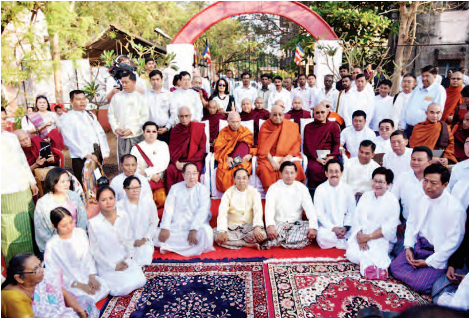
နိုင်ငံတော်သံဃမဟာနာယကအဖွဲ့ဥက္ကဋ္ဌဆရာတော် ဒေါက်တာ ဘဒ္ဒန္တကုမာရာဘိဝံသ ဦးဆောင်သည့် မြန်မာကိုယ်စားလှယ်အဖွဲ့ သီပေါမင်း၏ အနွယ်တော်များနှင့်စုပေါင်းမှတ်တမ်းဓာတ်ပုံ ရိုက်ကြစဉ်။ (သတင်းစဉ်)