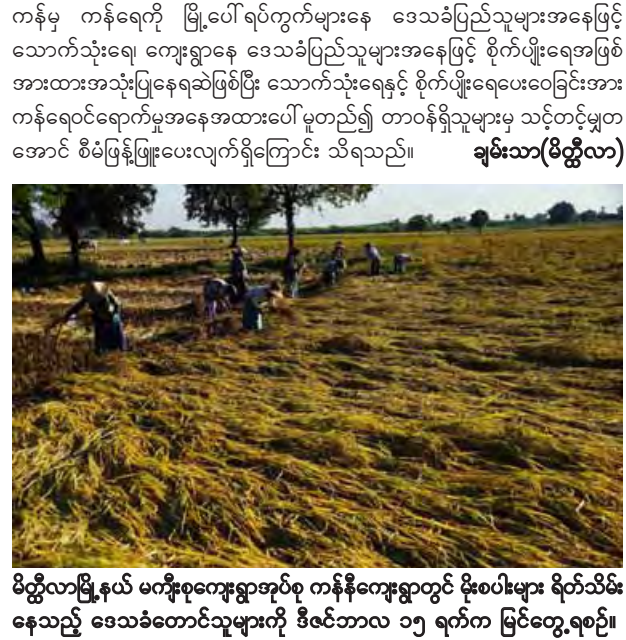
မိတ္ထီလာမြို့နယ် မကျီးစုကျေးရွာအုပ်စု ကန်နီကျေးရွာတွင် မိုးစပါးများ ရိတ်သိမ်း နေသည့် ဒေသခံတောင်သူများကို ဒီဇင်ဘာလ ၁၅ ရက်က မြင်တွေ့ရစဉ်။

ကန်မှ ကန်ရေကို မြို့ပေါ်ရပ်ကွက်များနေ ဒေသခံပြည်သူများအနေဖြင့် သောက်သုံးရေ ကျေးရွာနေ ဒေသခံပြည်သူများအနေဖြင့် စိုက်ပျိုးရေးအဖြစ် အားထားအသုံးပြုနေရဆဲဖြစ်ပြီး သောက်သုံးရေနှင့် စိုက်ပျိုးရေးပေး ဝေခြင်းအား ကန်ရေဝင်ရောက်မှုအနေအထားပေါ် မူတည်၍ တာဝန်ရှိသူများမှ သင့်တင့်မျှတ အောင် စီမံဖြန့်ဖြူးပေးလျက်ရှိကြောင်း သိရသည်။ ချမ်းသာ(မိတ္ထီလာ)