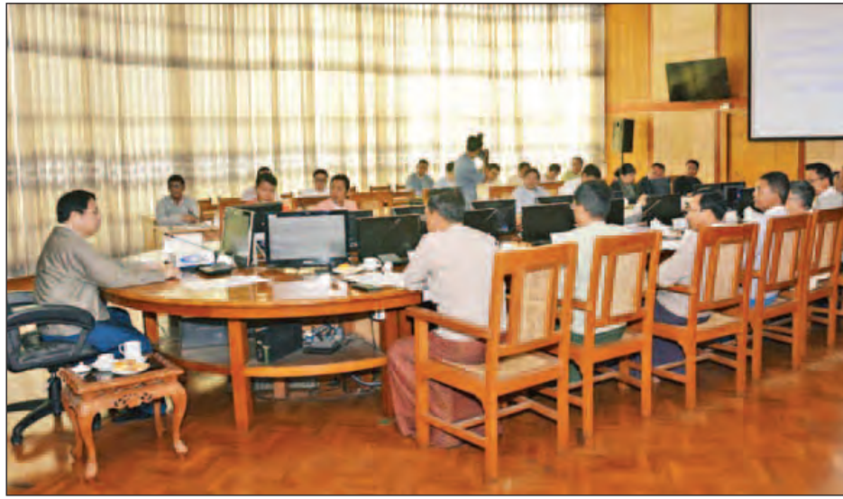
သော ရုပ်သံလုပ်ငန်းများ မည်မျှအထိ လုပ်ပိုင်ခွင့်ရရှိလာ ပါကြောင်း၊ မိမိတို့နှင့် တွေ့ထိရသည့် ပုဂ္ဂိုလ်တိုင်းကလည်း ယင်းအချက်ကို မေးမြန်းတောင်းဆိုနေကြပါကြောင်း။

ရုပ်မြင်သံကြားနှင့် အသံထုတ်လွှင့်ခြင်းဆိုင်ရာ ဥပဒေ ပြင်ဆင်သုံးသပ်ရေးနှင့် နည်းဥပဒေရေးဆွဲရေးကော်မတီ ၏ ဒုတိယအကြိမ် ညှိနှိုင်းအစည်းအဝေးကို ယနေ့နံနက် ၁၀ နာရီတွင် နေပြည်တော်ရှိ ပြန်ကြားရေးဝန်ကြီးဌာန အစည်းအဝေးခန်းမ၌ ကျင်းပသည်။