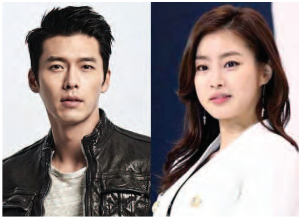
ဟွန်ဘင်းနဲ့ ကန်ဆိုရာ

တောင်ကိုရီးယားရဲ့ ထိပ်တန်းမင်းသားတစ်ဦးဖြစ်တဲ့ ဟွန်ဘင်းနဲ့ မင်းသမီး ကန်ဆိုရာတို့ဟာ ချစ်သူတွေဖြစ်ကြောင်း မကြာသေးမီက ထုတ်ဖော်ပြောကြားခဲ့တယ်လို့ ဟန်စင်းနီးမားဒေါ့ကွန်းက ဖော်ပြခဲ့ပါတယ်။