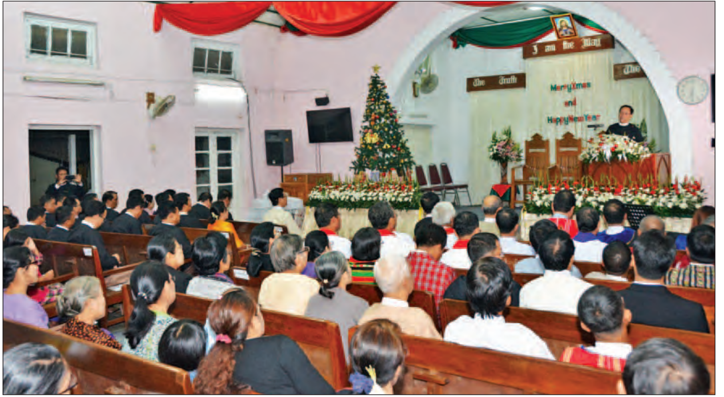
ခရစ်တော်မွေးနေ့ အကြိုဝတ်ပြုဆုတောင်းခြင်းနှင့် မိတ်သဟာယညစာစားပွဲအခမ်းအနား ကျင်းပစဉ်။ (သတင်းစဉ်)