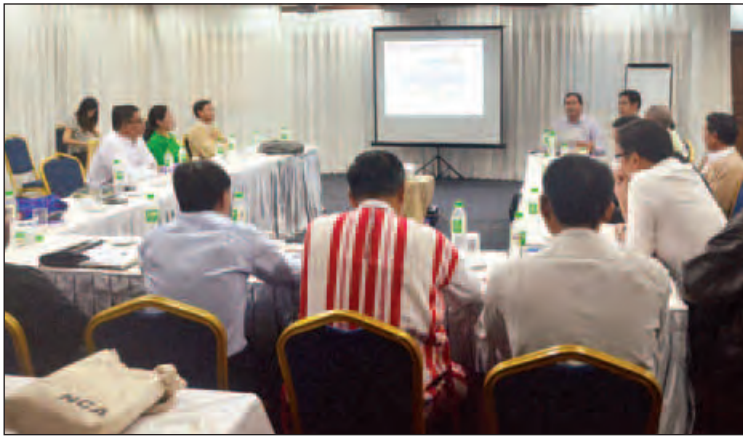
နိုင်ငံရေးပါတီအစုအဖွဲ့များ၏ ကော်မတီကိုယ်စားလှယ်များရွေးချယ်မည့် စုဖွဲ့ညှိနှိုင်းမှုအစည်းအဝေး ကျင်းပစဉ်။

နိုင်ငံရေးပါတီ အစုအဖွဲ့အနေဖြင့် ဆွေးနွေးပွဲမှရရှိလာသည့် လုပ်ငန်းကော်မတီ များ၊ ကြီးကြပ်ရေးကော်မတီများတွင် ပါဝင် မည့် ကိုယ်စားလှယ်စာရင်းများကို ဒီဇင်ဘာ ၁၇ ရက်နေ့ ရန်ကုန်မြို့ NRPC ၌ ပြုလုပ် မည့် UPDJC အတွင်းရေးမှူးအဖွဲ့ အစည်း အဝေးတွင် တင်သွင်းသွားမည်ဖြစ်ကြောင်း သိရသည်။