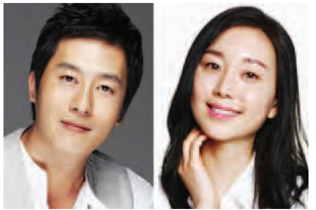
ကင်မင်ကျိုဟွတ်နဲ့ လီယိုယောင်း

တောင်ကိုရီးယားရဲ့ ကျော်ကြားတဲ့ သရုပ်ဆောင်တွေဖြစ်ကြတဲ့ မင်းသားကင်မင်ကျိုဟွတ်နဲ့ မင်းသမီး လီယိုယောင်းတို့ဟာ ချစ်သူတွေဖြစ်ကြောင်း သတင်းတွေ ပေါ်ထွက်လာခဲ့ပြီးနောက် သူတို့နှစ်ဦးရဲ့ အသက်အရွယ်အားဖြင့် (၁၇) နှစ်ခန့်ကွာခြားမှုဟာ ပရိသတ်အများကို အံ့အားသင့်စေခဲ့ကြောင်း အောကေပေါ့ဒေါ့ကွန်းက ဖော်ပြခဲ့ပါတယ်။