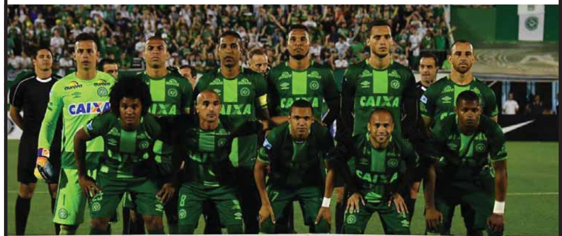
COPA SUDAMERICANA 2016

ခဲ့ခြင်းဖြစ်သည်။ ဘာစီလိုနာအသင်း ထုတ်ပြန်ချက်တွင် ချာပီကို အန်စီအသင်းသားများအားလုံးကို ဂုဏ်ပြုကြောင်းနှင့် ကလပ်အသင်း အမြန်ဆုံးပြန်လည်ထူထောင်နိုင်စေပါကြောင်း ဖော်ပြပါရှိသည်။ ချာပီကို အန်စီအသင်းအား ငွေရေးကြေးရေး အကူအညီများ ပေးအပ်လိုသည့် အသင်းနှင့် ကစားသမား အများအပြားရှိနေသလို ငွေကြေးမရယူဘဲ အခမဲ့ လာရောက်ကစားပေးမည်ဟု ကမ်းလှမ်းထား သည့် ကစားသမားများထဲတွင် ရိုနယ်လ်ဒိုနှင့် ရီကွယ်မီးတို့ ကဲ့သို့သော ကစားသမားများလည်း ပါဝင်နေသည်။ ပြီးခဲ့သည့် ရက်ပိုင်းအတွင်းကပင် ချာပီကို အန်စီအသင်းကို ကိုပါဇူဒါမာရီ ကားနားဖလားကို အပ်နှင်းခဲ့ပြီးဖြစ်သည်။