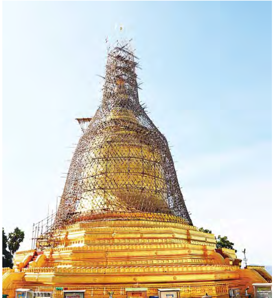
ဒုတိယသမ္မတ ဦးမြင့်ဆွေ လောကနန္ဒာဘုရား ရှေးမူပျက် ပြန်လည်ပြင်ဆင်နေမှုကို လှည့်လည်ကြည့်ရှုစဉ်။ (သတင်းစဉ်)