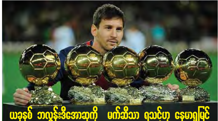
ယခုနှစ် ဘလွန်းဒီအောဆုကို မက်ဆီသာ ရသင့်ဟု နေမာရှုမြင်

ထို့ကြောင့် အာဆင်နယ်အနေဖြင့် သူတို့ နှစ်ဦးဆီက ပြောင်းရွှေ့ကြေး ခံစားခွင့်ရရှိရန် နောင်နှစ်ဘောလုံးရာသီတွင် ထွက်ခွာခွင့် ပေးသင့်သည်ဟု အကြံပြုချက်များလည်း ရှိနေသည်။ သို့သော် ဝင်းဂါးက သူတို့နှစ်ဦးလုံး အာဆင်နယ်တွင် ကာလကြာရှည် ဆက်လက် ရှိနေမည်ဟု မျှော်လင့်ထားသလို စာချုပ်သစ် ထပ်မံချုပ်ဆိုနိုင်ခြင်းမရှိလျှင်ပင် ကလပ် အသင်းဘက်မှ ရောင်းချသွားမည် မဟုတ် ကြောင်း တုံ့ပြန်ခဲ့ခြင်းဖြစ်သည်။ အိုဇေးလ် နှင့် ဆန်းချက်င်တို့နှစ်ဦး အာဆင်နယ်၏ ကမ်းလှမ်းမှုကို အဘယ်ကြောင့် ငြင်းပယ်နေ သည်ကို မီဒီယာများက အမျိုးမျိုး အဖြေထုတ် နေသော်လည်း တကယ်တမ်းတွင် တိကျသည့် အဖြေတစ်ရပ် ယခုထိ မရှာဖွေနိုင်ကြသေးပေ။