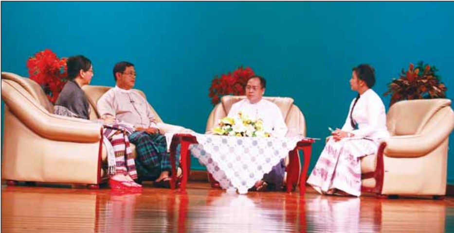
စီမံကိန်းနှင့်ဘဏ္ဍာရေးဝန်ကြီးဌာန ဒုတိယဝန်ကြီး ဦးမောင်မောင်ဝင်း၊ မြန်မာနိုင်ငံတော် ဗဟိုဘဏ် ဒုတိယဥက္ကဋ္ဌ ဦးဆက်အောင်နှင့် ဗဟိုစာရင်းအင်းအဖွဲ့ ညွှန်ကြားရေးမှူးချုပ် ဒေါ်ဝါဝါမောင်တို့၏ မြန်မာ့အသံနှင့်ရုပ်မြင်သံကြားမှ ထုတ်လွှင့်သော ငွေကြေးဖောင်းပွမှုနှင့်ပတ်သက်သည့် တွေ့ဆုံဆွေးနွေးခန်းမပြင်ပတွင်။

အဲဒီတော့ သူနဲ့ တစ်ဆက်တစ်စပ်တည်း ငွေကြေး ဖောင်းပွမှုရဲ့ ဆန့်ကျင်ဘက်ကတော့ ငွေကြေးကျိုးသွားမှု (Deflation)ပါ။ ငွေကြေးကျိုးသွားရင်လည်း ဒါမလိုလား အပ်တဲ့ လက္ခဏာပါ။ ဆိုလိုတဲ့သဘောကတော့ ကုန်ဈေး နှုန်းတွေက ကျနေတယ်ဆိုရင် ထုတ်လုပ်တဲ့သူတွေက လည်း ဒီဈေးနှုန်းနဲ့ မကိုက်တော့ မထုတ်လုပ်နိုင်ဘူး။ အဲဒီတော့ စီးပွားရေးဖွံ့ဖြိုးမှုကို တစ်ခါသွားပြီးတော့ထိခိုက် တယ်။ မူဝါဒတွေချမှတ်ပြီးတော့ ကားတွေ အများကြီးတင် သွင်းလိုက်တယ်။ ကားဈေးတွေကျတယ်။ လူတွေက ကား ဝယ်နိုင်တာမှန်ပေမယ့် ကားရှိသလောက် ငွေဟာ မရှိတော့ ဘဲနဲ့ ဈေးကျသွားတဲ့အနေအထားကြောင့် စီးပွားရေး အဆောက်အအုံပြန်ပြီး ထိခိုက်တယ်။ အလားတူပဲ စပါး