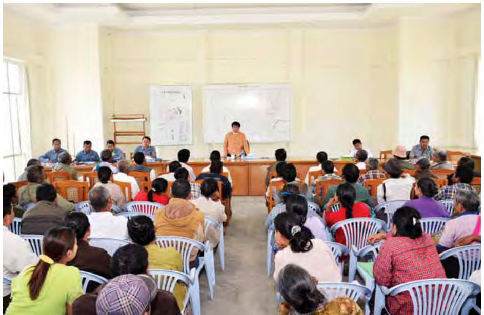
ပတ်သက်ပြီး ပြို့နယ်လယ်ယာမြေစီမံခန့်ခွဲမှုအဖွဲ့များဖြင့် ဆွေးနွေးခဲ့သည်။ ညှိနှိုင်းစိစစ်ဆောင်ရွက်ပေးသွားမည်ဖြစ်ကြောင်း ရှင်းလင်း

ပါ အဖွဲ့ရှစ်ဖွဲ့တို့အား ကော်မတီဝင်(၂)ဦးမင်းသူက ရှင်းလင်းဆွေးနွေးရာတွင် နေပြည်တော်စည်ပင်သာယာရေး ကော်မတီအနေဖြင့် ယခင်ကာလများတွင်လည်း သံတမန် ဇုန်ဇရိယာမှ စက ၁၅၅၀ ရှိသည့်အနက် ရန်အောင်မြင် သစ်တောတွင်း လယ်ယာမြေ ၁၄၇၄ ဒသမ ၉၀ စက အတွက် လျော်ကြေးငွေများကို တောင်သူ ၃၀၅ ဦးတို့အား ၂၀၁၁ ခုနှစ်ကပင် ပြို့နယ်/ကျေးရွာအုပ်စု လျော်ကြေး တွက်ချက်ရေးအဖွဲ့တို့နှင့် တာဝန်ရှိသူတို့က စိစစ်၍ ပေးလျော်ခဲ့ပြီးဖြစ်ကြောင်း၊ ယခုအခါ ၅၅ ဒသမ ၁၀ စက အတွက် ထောက်ပံ့ပေးရန် ကျန်ရှိနေရာတင်ပြတောင်းခံသူ ၂၂၄ ဦးက စက ၁၀၇၃ ဒသမ ၂၅ ခန့် တောင်းခံနေသည့် အတွက်လည်းကောင်း၊ မူလရန်အောင်မြင်သစ်တော အတွင်းဖြစ်သဖြင့် စိုက်ပျိုးမြေအဖြစ် ဦးပိုင်နံပါတ် သတ်မှတ် လုပ်ကိုင်ခဲ့ခြင်းမရှိသည့်အတွက်လည်းကောင်း၊ အမှန် တကယ်စိုက်ပျိုးလုပ်ကိုင်ခဲ့သူများအားစိစစ်ရန် ကော်မတီ တစ်ခုတည်းဖြင့် ဆောင်ရွက်နိုင်ခြင်းမဖြစ်တော့၍ လျော်ကြေးရရှိရေးတင်ပြသည့် မြေယာကိစ္စများနှင့်