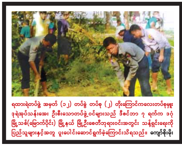
ရထားရဲတပ်ဖွဲ့ အမှတ် (၁၂) တပ်ခွဲ တပ်စု (၂) တိုးကြောင်ကလေးတပ်စုမှူး ဒုရဲအုပ်သန်းအေး ဦးစီးသောတပ်ဖွဲ့ဝင်များသည် ဒီဇင်ဘာ ၇ ရက်က ဒဂုံ မြို့သစ်(မြောက်ပိုင်း) မြို့နယ် မြို့ဦးစေတီဘုရားဝင်းအတွင်း သန့်ရှင်းရေးကို ပြည်သူများနှင့်အတူ ပူးပေါင်းဆောင်ရွက်ခဲ့ကြောင်းသိရသည်။ ကျော်စိုးစိုး