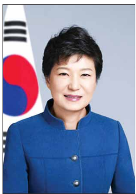
အရှုပ်တော်ပုံများနှင့်ပတ်သက်ပြီး သမ္မတပတ်ဂွန်ဟေး ရာထူးမှ ယာယီဆိုင်းငံ့ကာ တရားစွဲဆိုရန် ထောက်ခံသည့် မဲ ၂၃၄ မဲရရှိခဲ့ပြီး မထောက်ခံသည့်မဲ ၅၆ မဲရရှိခဲ့သည်။ မဲအရေအတွက် ၂၀၀ ကျော်ရရှိခဲ့သည့်အတွက် သမ္မတအားရာထူးမှ နုတ်ထွက်ရန် တောင်းဆိုသည့်အဆို