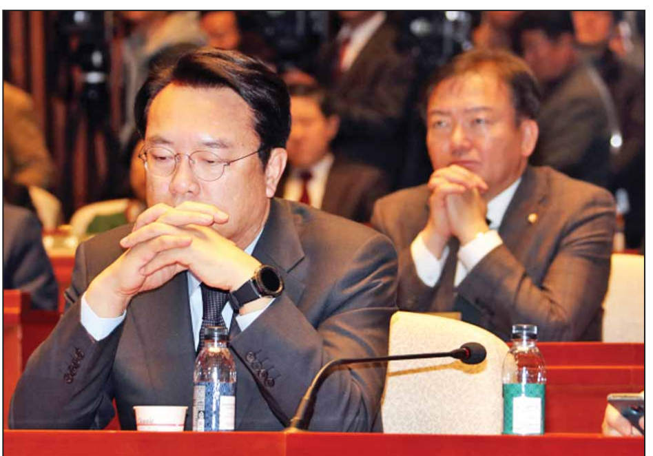
အထမြောက်ခဲ့သည်။ ယနေ့မဲခွဲဆုံးဖြတ်ရာတွင် သမ္မတပတ်ဂွန်ဟေး တာဝန် ထမ်းဆောင်ကြသည့် အာဏာရပါတီမှ အဖွဲ့ဝင်များသည်ပင် ယင်းအဆိုကို ထောက်ခံမဲပေးခဲ့သည်။ တောင်ကိုရီးယား ဝန်ကြီးချုပ် ကျို-အာန်က သမ္မတ ပတ်ဂွန်ဟေး တရားရင်ဆိုင်နေရသည့်ကာလအတွင်း (သို့) သမ္မတရာထူးမှ ယာယီဆိုင်းငံ့ထားသည့် ကာလအတွင်းတွင် သမ္မတရာထူးတာဝန်များကို ယာယီတာဝန်ယူ ထမ်းဆောင် မည်ဖြစ်သည်။