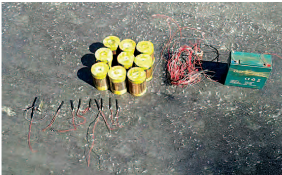
ဒေသန္တရ လက်လုပ်မိုင်းများဖြစ်ပြီး တွဲထားသောစနက်တံ ကိုးချောင်းနှင့် မိုင်းနှင့်အတူ ၁၄ ဒေသမ စ မှီဘက်ထရီ အဝေးထိန်း ဆားကစ်အုံတစ်ခုတို့ တစ်လုံး၊ အဖြူအနီ ဝါယာကြိုးဖြင့် တွေ့ရှိခဲ့ရပြီး တပ်မတော်စစ်ကြောင်း သိရသည်။ (သတင်းစဉ်)

အဆိုပါ မိုင်းကိုးလုံးသည် အမြင့် ခြောက်လက်မ၊ အချင်း လေးလက်မရှိ သံကိုယ်ထည်ဖြင့် ပြုလုပ်ထားသည့်