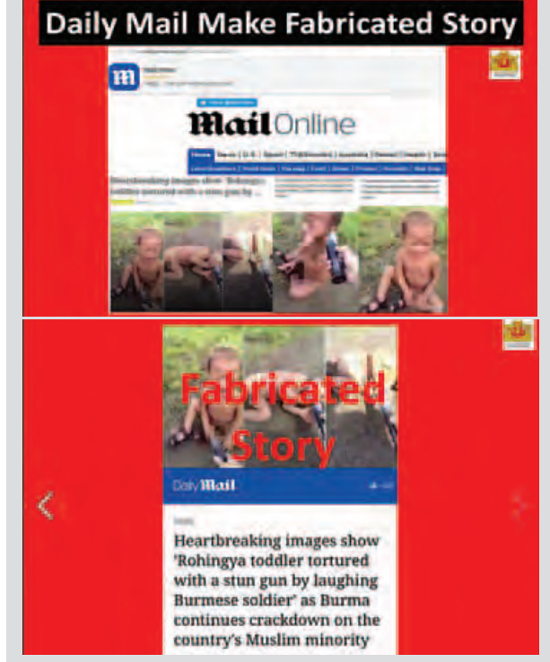
ဗြိတိန်နိုင်ငံ Daily Mail သတင်းဌာန၏ Online စာမျက်နှာ၌ မှားယွင်းဖော်ပြခဲ့သည့် ဓာတ်ပုံကို တွေ့ရစဉ်။