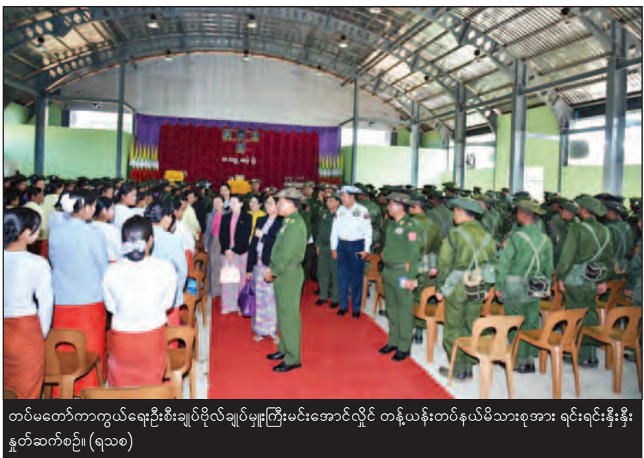
တပ်မတော်ကာကွယ်ရေးဦးစီးချုပ်ပိုလ်ချုပ်မှူးကြီးမင်းအောင်လှိုင် တန့်ယန်းတပ်နယ်မိသားစုများ ရင်းရင်းနှီးနှီး နှုတ်ဆက်စဉ်။ (ရသစ)

စောင့်ရှောက်ရေးအသင်းအတွက် ချီးမြှင့်ငွေများကို ပေးအပ်သည်။ ယင်းနောက် ကာကွယ်ရေးဦးစီး ချုပ်ရုံးမှ တပ်မတော်အရာရှိကြီး များက စားသောက်ဖွယ်ရာများနှင့် အားကစားပစ္စည်းများကို ပေးအပ် ကြပြီး တပ်မတော်ကာကွယ်ရေး ဦးစီးချုပ်နှင့် အဖွဲ့ဝင်များသည် တက်ရောက်လာကြသော အရာရှိ၊ စစ်သည် မိသားစုဝင်များအား ရင်းရင်းနှီးနှီး လိုက်လံနှုတ်ဆက် ကြသည်။ (သတင်းစဉ်)