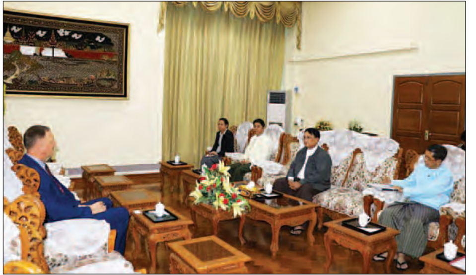
အပါအဝင် ငှက်ပျောသီးနှင့် သရက် သီးစသည့် သစ်သီးဝလံများအား အခြောက်ပြုလုပ်၍ တင်ပို့နိုင်ရေး အတွက် စက်ရုံတည်ဆောက်သွား ဆောင်ရွက်ရေးဆိုင်ရာ ကိစ္စရပ်များ ရေးနှင့် ရုရှားနိုင်ငံမှ ခေတ်မီ ကို ဆွေးနွေးသည်။