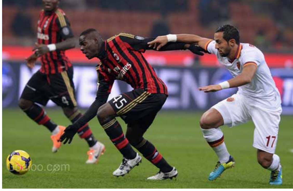
အီတလီစီးရီးအေသင်းများ ရပ်တည်မှု အမှတ်ပေးဇယား