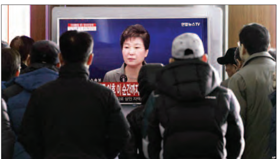
ယခုအကြိမ် သမ္မတပတ်ဂွန်ဟေးအား ရာထူးမှ ဖြုတ်ချရန် ဆုံးဖြတ်ခြင်းသည် တောင်ကိုရီးယားပါလီမန် အတွက် ဒုတိယအကြိမ်မြောက် ဆုံးဖြတ်ချက်ချမှတ်ခြင်း ဖြစ်သည်။ ၂၀၀၄ ခုနှစ်က ပါလီမန်တွင် သမ္မတ ရာမူ ရှောင်အား ရာထူးမှဖြုတ်ချရန် ပထမဆုံးအကြိမ် မဲခွဲဆုံးဖြတ်ခဲ့သည်။ အင်န်အိတ်ချ်ကေ။

မဲခွဲဆုံးဖြတ်မှုကို ဒီဇင်ဘာ ၉ ရက် မွန်းလွဲ ၂ နာရီ ၄၅ မိနစ်တွင် စတင်မည်ဖြစ်သည်။ လွှတ်တော်အမတ် စုစုပေါင်း ၃၀၀ အနက် အနည်းဆုံး ၂၀၀ က မဲအနိုင်ရရှိမှသာ အဆိုကို အတည်ပြုနိုင်မည်ဖြစ်သည်။ အတိုက်အခံပေးသည့် လွှတ်တော်အမတ်များ၏ မဲဆန္ဒအပါအဝင် အာဏာရပါတီမှ လွှတ်တော်အမတ် ၂၈ ဦး၏ မဲဆန္ဒပါဝင်မှသာ အတည်ပြုနိုင်မည်ဖြစ်သည်။ သမ္မတပတ်၏ အာဏာရပါတီမှ အဖွဲ့ဝင်များသည် အဓိကမဲဆန္ဒရှင်များဖြစ်ကြသည်။ ယခုအချိန်ထိတိုင် အာဏာရပါတီအဖွဲ့ဝင်များသည် အစည်းအဝေးအဆိုပြုချက်နှင့်ပတ်သက်ပြီး အတိုက်အခံပေးမှုများ၏ တောင်းဆိုမှုအပေါ် အလေးသာနေဖွယ်ရှိကြောင်း သိရသည်။ သမ္မတပတ်သည် ငယ်သူငယ်ချင်းအရှုပ်တော်ပုံ အပါအဝင် ၂၀၁၄ ခုနှစ်က ဆီဝေါကူးတို့နစ်မြုပ်မှုကို ကောင်းမွန်စွာ ကိုင်တွယ်ဖြေရှင်းခဲ့ခြင်းမရှိဟု အများက ထင်မြင်ယူဆကြသည်။ ဆီဝေါကူးတို့နစ်မြုပ်မှုတွင် ကျောင်းသား ကျောင်းသူအများအပြား သေဆုံးခဲ့ရသည်။