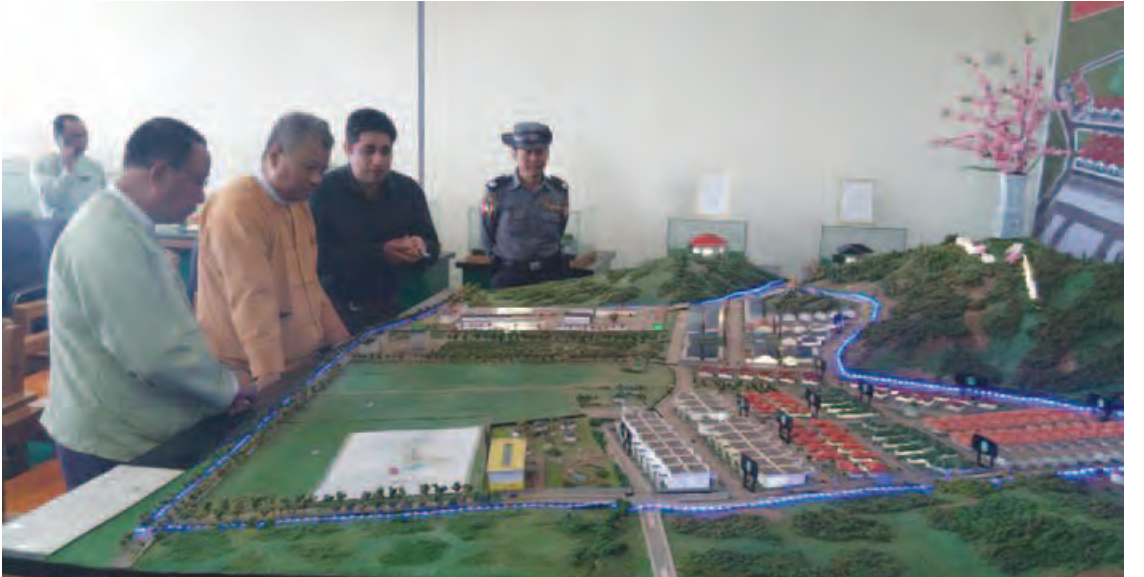
လည်ကြည့်ရှု စစ်ဆေးခဲ့သည်။ ယင်းနောက်တွင် ပြည်နယ်ဝန်ကြီးချုပ်နှင့် အဖွဲ့သည် လားရှိုး ချယ်ရီမြိုင်အဆင့်မြင့်အိမ်ရာတည်ဆောက်ရေးလုပ်ငန်းတစ်ခုလုံး

အထက်တန်းကျောင်း၊ ကြယ်သုံးပွင့် ဟိုတယ်ကြီးတစ်ခုတို့အပါအဝင် ထည့်သွင်း ဆောက်လုပ်သွားမည်ဖြစ်ကြောင်းနှင့် ကုမ္ပဏီမှ စီမံကိန်းအတွင်း ပန်းခြံ၊ ဓမ္မာရုံ၊ မီးသတ်၊ အုပ်ချုပ်ရေးရုံးတို့ကိုလည်း ထည့်သွင်းဆောက်လုပ်ပေးသွားမည်ဖြစ်ကြောင်း၊ ချယ်ရီမြိုင်အဆင့်မြင့်အိမ်ရာ မြေကွက်များကိုဝယ်ယူသူမှန်သမျှ မြေပိုင်ဆိုင်မှုရရှိအောင်ပေးပို့ရန် ကုမ္ပဏီမှ သက်ဆိုင်ရာဌာနများနှင့် ဆက်သွယ်ကာ ဝန်ဆောင်မှု ပြုလုပ်ပေးသွားမည်ဖြစ်ပါကြောင်း၊ သောက်သုံးရေ လျှပ်စစ်မီးသွယ်တန်းထားရန် အခြေအနေများကိုလည်းကောင်း ရှင်းလင်းတင်ပြသည်။