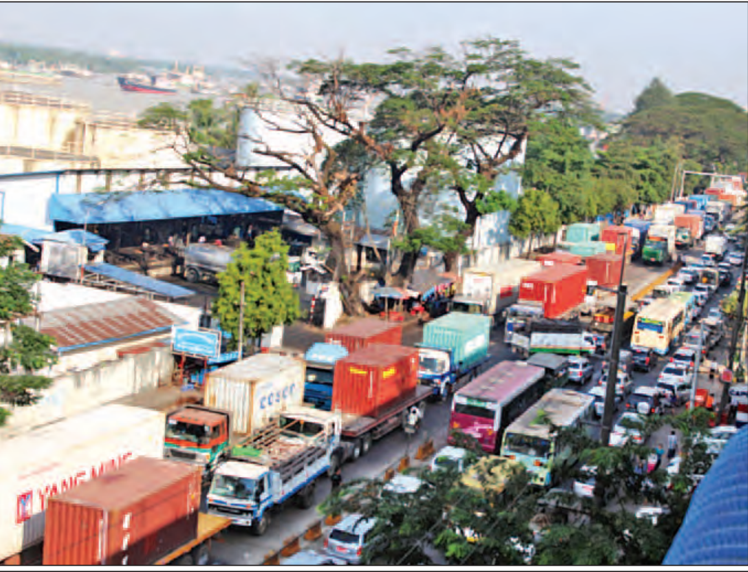
ကြည့်မြင်တိုင်ကမ်းနားလမ်းတစ်လျှောက် ကွန်တိန်နာယာဉ်ကြီးများဖြင့် ပိတ်ဆို့မှုဖြစ်ပွားစဉ်။

ရခိုင်ပြည်နယ်အတွင်း အောက်တိုဘာ ၉ ရက်၊ နိုဝင်ဘာ ၁၂ ရက်နှင့် ၁၃ ရက်တို့တွင် ဖြစ်ပွားခဲ့သော လုံခြုံရေးတပ်ဖွဲ့ဝင်များအား အကြမ်းဖက်စီးနင်းတိုက်ခိုက်ခံရမှုများဖြစ်ပွားပြီးနောက် လုံခြုံရေးတပ်ဖွဲ့ဝင်များက ဥပဒေနှင့်အညီ ဆောင်ရွက်လျက်ရှိသော်လည်း စာမျက်နှာ ၉ ကော်လံ ၁ သို့ ❖