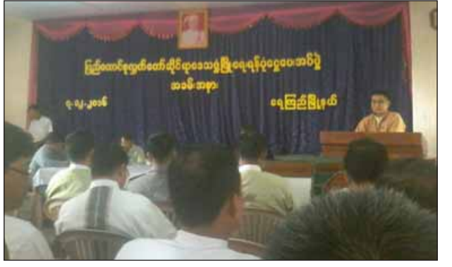
ပြည်ထောင်စုရွေးကောက်ပွဲကော်မရှင်အဖွဲ့ဝင်များနှင့် ကျောက်ဖြူမြို့နယ်ကော်မရှင်အဖွဲ့ဝင်တို့တွေ့ဆုံဆွေးနွေးနေစဉ်

မဲထည့်ရန်၊ UEC အဖွဲ့ဝင်အား အဖွဲ့ဝင်ငါးဦးဖွဲ့စည်းထားပါကြောင်း၊ ဒီမိုကရေစီရှိနေသမျှ ရွေးကောက်ပွဲကော်မရှင်ဆိုတာ အမြဲရှိကြောင်း၊ အမြဲတမ်း(Like)ဖြစ်ရန်၊ တာဝန်ကျေရေးအဓိကသုံးရပ်ကို လက်ကိုင်ဆောင်ရွက်ရန် မှာကြားခဲ့သည်။