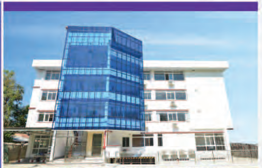
လိပ်စာ - ဖန်ချက်စက်လမ်းနှင့် ဆန်စက်လမ်း ၊ အင်းစိန်မြို့နယ် ၊ ရန်ကင်း ၊