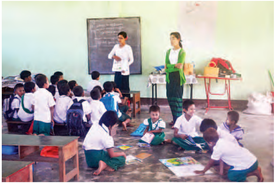
မောင်တောမြို့တောင်ဘက် ရွှေရင်အေးကျေးရွာမူလတန်းကျောင်းတွင် ကလေးငယ်များပညာသင်ကြားနေသည်ကို တွေ့ရစဉ်။

ဖွင့်လှစ်ရန်ကျန်ရှိသော ကျောင်းအများစုမှာ မောင်တောမြောက်ပိုင်းမှ ကျေးရွာများဖြစ်ကြောင်း၊ ဖွင့်လှစ်ရန်အခြေအနေပေးလာသည်နှင့် ကျောင်းများကို တိုးချဲ့ဖွင့်လှစ်သွားမည်ဖြစ်ကြောင်း သိရသည်။ မောင်တော