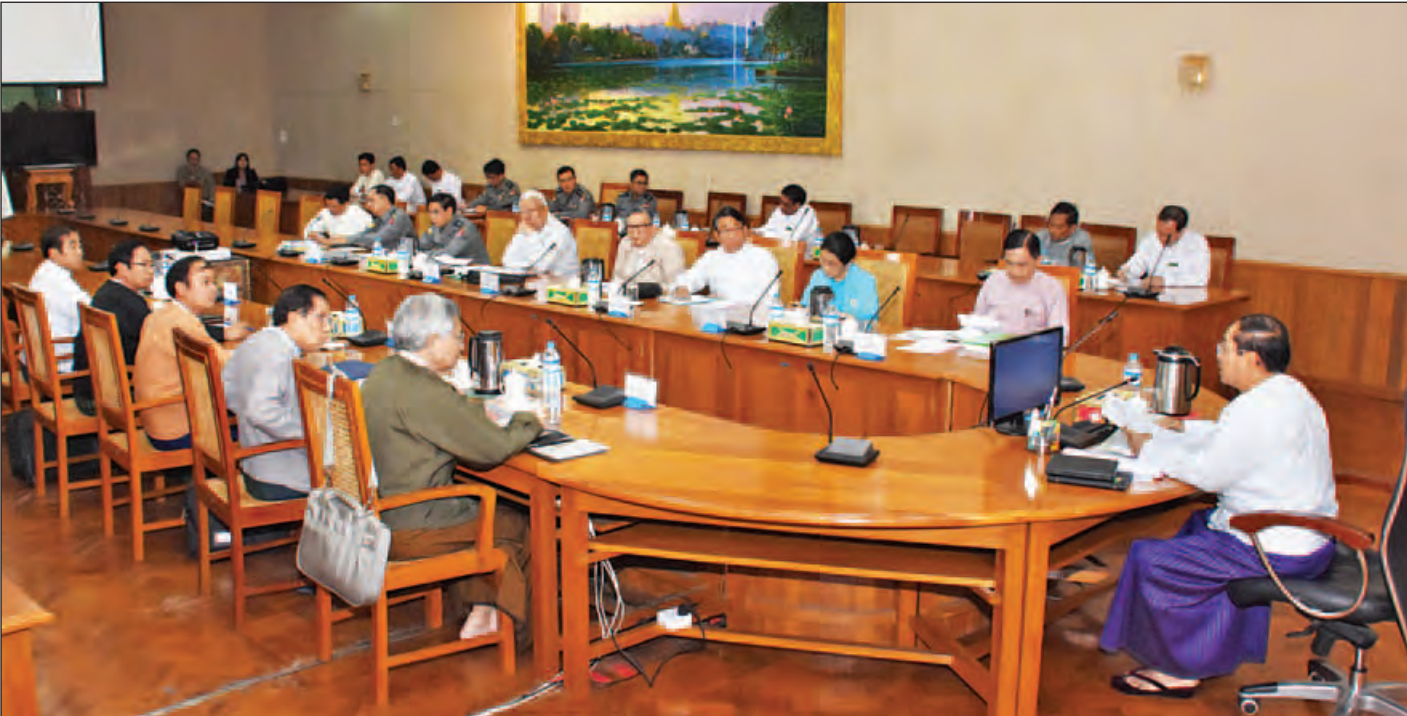
ဒုတိယသမ္မတ ဦးမြင့်ဆွေ ရခိုင်ပြည်နယ် စုံစမ်းစစ်ဆေးရေးကော်မရှင် ပထမအကြိမ်ညှိနှိုင်းအစည်းအဝေးတွင် အမှာစကားပြောကြားစဉ်။ (သတင်းစဉ်)

နေပြည်တော် ဒီဇင်ဘာ ၈ ရခိုင်ပြည်နယ် ဘူးသီးတောင်နှင့် မောင်တောဒေသ ဖြစ်စဉ်များနှင့်ပတ်သက်၍ လူထုနှင့် နိုင်ငံတကာက စိတ်ဝင်စားစွာစောင့်ကြည့်လျက်ရှိပါကြောင်း၊ ထို့ကြောင့် မိမိတို့ကော်မရှင်အနေဖြင့် တုံ့ပြန်ချက်များကို မြန်မြန် ဆန်ဆန် ဆောင်ရွက်နိုင်မှ ပြည်သူ့လူထုနှင့် နိုင်ငံတကာ၏ စိုးရိမ်ပူပန်မှုများကို လျော့ချပေးနိုင်မည်ဖြစ်ပါကြောင်း ရခိုင်ပြည်နယ် စုံစမ်းစစ်ဆေးရေးကော်မရှင်ဥက္ကဋ္ဌ ဒုတိယ သမ္မတ ဦးမြင့်ဆွေက ပြောကြားသည်။ စုံစမ်းစစ်ဆေးရေးကော်မရှင်ဥက္ကဋ္ဌက ကော်မရှင် အနေဖြင့် အောက်တိုဘာ ၉ ရက်ကဖြစ်ပွားခဲ့သည့် ဖြစ်စဉ် သုံးခု၊ အောက်တိုဘာ ၁၀ ရက်မှ ဒီဇင်ဘာ ၉ ရက်အထိ နောက်ဆက်တွဲဖြစ်ပွားခဲ့သည့် ဖြစ်စဉ် ၁၂ ခု၊ ဒီဇင်ဘာ ၁၂ ရက်ကဖြစ်ပွားခဲ့သည့် ဖြစ်စဉ် သုံးခု၊ ဒီဇင်ဘာ ၁၃ ရက်ကဖြစ်ပွားခဲ့သည့် ဖြစ်စဉ် နှစ်ခု တို့နှင့်ပတ်သက်၍ ဖြစ်စဉ်နေရာများသို့ သွားရောက်ပြီး ဖြစ်စဉ်အသေးစိတ်ကို မြေပြင်တွင် သွားရောက်စစ်ဆေး ဖော်ထုတ်၍ အစီရင်ခံစာရေးသားကြရမည်ဖြစ်ကြောင်း၊ ထို့ကြောင့် ဘူးသီးတောင်၊ မောင်တောဒေသရှိ ဖြစ်စဉ် နေရာများသို့ အမြန်ဆုံးသွားရောက်ရမည်ဖြစ်ကြောင်း ပြောကြားခဲ့သည်။