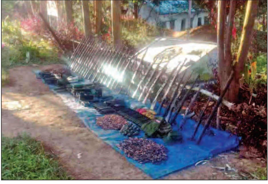
တပ်မတော်စစ်ကြောင်းများအနေဖြင့် မိုးကုန်းမြို့ အတွင်းနှင့် အနီးပတ်ဝန်းကျင်တစ်ဝိုက်အား နေ့ညမပြတ် နယ်မြေရှင်းလင်းရေးလုပ်ငန်းများ ဆောင်ရွက်လျက် ရှိကြောင်း တပ်မတော်ကာကွယ်ရေးဦးစီးချုပ်ရုံးမှ သတင်း ရရှိသည်။ (သတင်းစဉ်)

ယင်းလက်နက် နှစ်ချောင်းထောက် အောက်ခံခုံပါ တစ်စုံ နှင့် ချိန်ဆိုင် တစ်ခု၊ ယင်းပုံးသီး ခုနစ်လုံး၊ ပစ္စတို နှစ်လက်၊ ယင်းကျည် ၃၇ တောင့်၊ အမိ ၂၂ နှစ်လက်၊ ကာဘိုင် သေနတ်တစ်လက်၊ ရိုင်ဖယ်သေနတ်တစ်လက်၊ လုပ်သေနတ် တစ်လက်၊ အမိ ၂၂ ကျည်အိမ် ကိုးခု၊ အမိ ၂၂ ကျည်တောင့် ၉၄၀၊ လက်ပစ်ပုံး ၁၃ လုံး၊ အမိ ၁၆ ကျည်တောင့် ၃၈၀၊ စနိုက်ပါမှန်ပြောင်း တစ်ခုနှင့်လမ်းလျှောက်စကားပြောစက် သုံးလုံးတို့ကို တွေ့ရှိ သိမ်းဆည်းရမိခဲ့သည်။ တပ်မတော်စစ်ကြောင်းများအနေဖြင့် မိုးကုန်းမြို့ အတွင်းနှင့် အနီးပတ်ဝန်းကျင်တစ်ဝိုက်အား နေ့ညမပြတ် နယ်မြေရှင်းလင်းရေးလုပ်ငန်းများ ဆောင်ရွက်လျက် ရှိကြောင်း တပ်မတော်ကာကွယ်ရေးဦးစီးချုပ်ရုံးမှ သတင်း ရရှိသည်။ (သတင်းစဉ်)