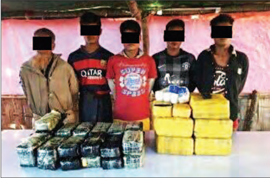
အိတ်ဖွင့်တင်ဒါဖြင့် ထုပ်ပိုးထား တန်ဖိုး ၉၀၀၀၀၀၀၀ ကို ရေး ဆက်လက်ဆောင်ရွက်လျက်ရှိ သည့် WY/R ရောရာစာတန်းပါ သိမ်းဆည်းရမိခဲ့ပြီး ဖမ်းဆီးရမိသူ ကြောင်း သိရသည်။ (သတင်းစဉ်)

မောင်တောမြို့ မောင်နီရွာအရှေ့ဘက်၊ ကင်ညင်ချောင်းတောင်ဘက်တွင် လုံခြုံရေးတပ်ဖွဲ့ဝင်များ တပ်မတော် ရေယာဉ်ဖြင့် လုံခြုံရေးတာဝန် ထမ်းဆောင်နေစဉ် ယနေ့နံနက် ၄ နာရီခွဲတွင် ဘင်္ဂလားဒေ့ရှ်နိုင်ငံသို့ ဖြတ်ကူးနေသည့် မသင်္ကာဖွယ် လှေတစ်စင်းအား တွေ့ရှိစစ်ဆေးရာ မှ စိတ်ကြွဆေးပြားများနှင့်အတူ အမျိုးသား ငါးဦးကို ဖမ်းဆီးရမိခဲ့ကြောင်း သိရသည်။