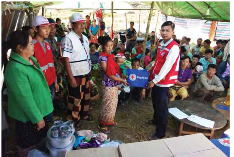
ဒီဇင်ဘာ ၇ ရက်က ရှမ်းပြည်နယ်(မြောက်ပိုင်း)သီပေါမြို့နယ် မိုးတေကျေးရွာအုပ်စု နောင်သကြား/မန်ကောင်း ကျေးရွာ ကယ်ဆယ်ရေးစခန်းသို့ ရောက်ရှိစစ်ဘေးရှောင်လျက်ရှိသည့် အိမ်ထောင်စု ၃၅ စု၊ လူဦးရေ ၁၂၀ တို့အား မြန်မာနိုင်ငံကြက်ခြေနီအသင်းကပေးပို့လှူဒါန်းသော အသုံးအဆောင်ပစ္စည်းများ ပေးအပ်စဉ်။ (၂၄၇)