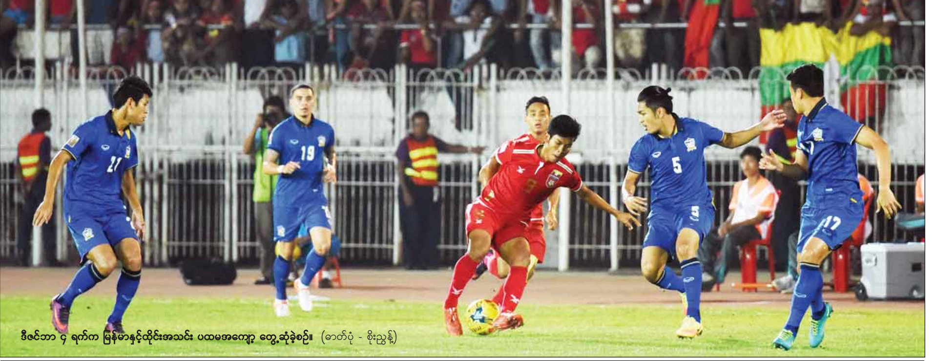
ဒီဇင်ဘာ ၄ ရက်က မြန်မာနှင့်ထိုင်းအသင်း ပထမအကျော့ တွေ့ဆုံခဲ့စဉ်။

ရန်ကုန် ဒီဇင်ဘာ ၇ ၂၀၁၆ အာဆီယံဆူလူးကီးပလားပြိုင်ပွဲ ဗိုလ်လုပွဲရောက် အသင်းများ ယနေ့အဖြေထွက်ပေါ်မည်ဖြစ်ပြီး ဆီမီးပိုင်နယ် ဒုတိယအကျော့ပွဲစဉ်အဖြစ် ထိုင်းအသင်းနှင့် မြန်မာအသင်းဆက်လက်ယှဉ်ပြိုင်မည်ဖြစ်သည်။ ယင်းပွဲကို ဒီဇင်ဘာ ၈ ရက် မြန်မာစံတော်ချိန် ညနေ ၆ နာရီခွဲတွင် ပန်ကောက်မြို့ရှိ ရာဇမင်္ဂလာကွင်း၌ ကျင်းပမည်ဖြစ်သည်။ မြန်မာအသင်းသည် အိမ်ကွင်း၌ နှစ်ဂိုး-ဂိုးမရှိ နှိုးနှိုးခဲ့သောကြောင့် နောက်တစ်ဆင့်တက်ရောက်ရန် အခွင့်အရေး နည်းပါးသွားပြီဖြစ်သော်လည်း လက်ကျန်မျှော်လင့်ချင်အတွက် ဆက်လက်ယှဉ်ပြိုင်ရမည်ဖြစ်သည်။ မြန်မာအသင်းသည် ပထမအကျော့တွင် အမှားတချို့ရှိခဲ့ပြီး လိုအပ်ချက်များကို ပြန်လည်ပြင်ဆင်နိုင်မှသာ အဝေးကွင်း၌ ရလဒ်ကောင်းမည်ဖြစ်သည်။ မြန်မာအသင်းနှင့် ထိုင်းအသင်းသည် ဆူလူးကီးပလားပြိုင်ပွဲတွင် ရှစ်ပွဲမြောက်တွေ့ဆုံခြင်း ဖြစ်ပြီး ထိုင်းနိုင်ငံ၌ လေးကြိမ်မြောက် ကစားရခြင်းဖြစ်သည်။ ဆီမီးပိုင်နယ်ပွဲအတွက် ပွဲကြိုသတင်းစာရှင်းလင်းပွဲကို ယနေ့မုန်းလွဲပိုင်းက ပန်ကောက်မြို့ရှိ Emerald Bangkok ဟိုတယ်၌ ကျင်းပသည်။ စာမျက်နှာ ၉ ကော်လံ ၆ သို့ ၀