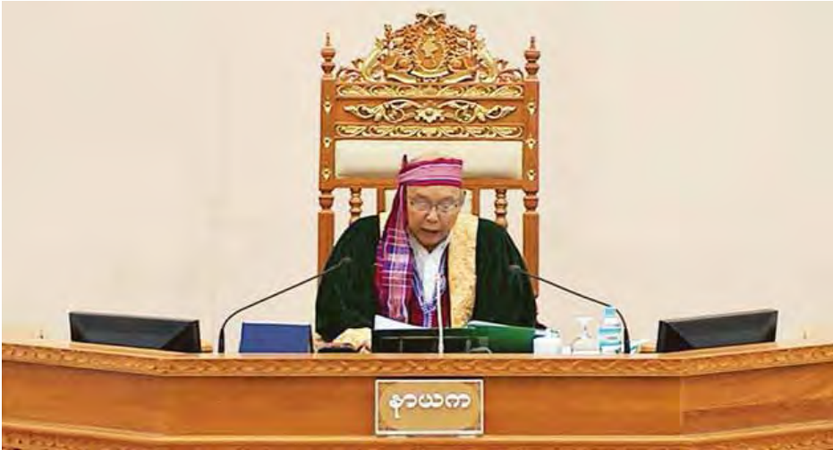
ပြည်ထောင်စုလွှတ်တော် နာယက မန်းဝင်းခိုင်သန်း။

အတည်ပြုသည်ဟု မှတ်ယူရမည့် နိုင်ငံဝန်ထမ်းဥပဒေ ကိုပြင်ဆင်သည့်ဥပဒေကြမ်းကို နိုင်ငံတော်သမ္မတထံ ပေးပို့ ထားကြောင်းနှင့် ယင်းဥပဒေကြမ်းကို လွှတ်တော်က မှတ်တမ်းတင်ကြောင်း ကြေညာသည်။