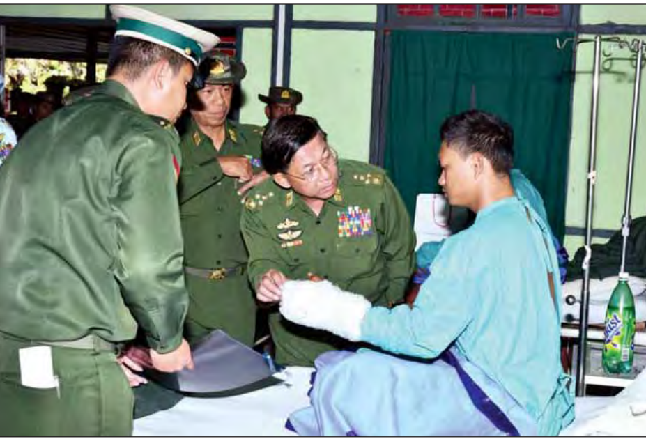
တပ်မတော်ကာကွယ်ရေးဦးစီးချုပ် ဗိုလ်ချုပ်မှူးကြီးမင်းအောင်လှိုင် ဒဏ်ရာရစစ်သည်အား ကြည့်ရှုအားပေးစဉ်။

မွန်းလွဲပိုင်းတွင် ရှေ့တန်းရောက်တပ်မတော်သားများ နှင့် စစ်မြေပြင်တွင် တာဝန်ထမ်းဆောင်စဉ် ထိခိုက်ဒဏ်ရာ