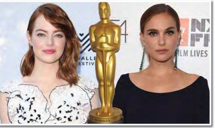
လက်ခ်၊ "Fences" ရုပ်ရှင်နဲ့ ဒန်ဇယ်လီဝါရှင်တန်၊ "Loving" ရုပ်ရှင်နဲ့ ဂျိုးအက်ဂါတန်၊ "La La Land" ရုပ်ရှင်နဲ့ ရှိုင်းယန်ဂျေ့စ်တို့ အသီးသီးရွေးချယ်ဖော်ပြခြင်းခံခဲ့ရတာ ဖြစ်ပါတယ်။

အကောင်းဆုံးအမျိုးသားဇာတ်ဆောင်ဆုအတွက် "Silence" ရုပ်ရှင်နဲ့ ဟောလိဝုဒ် နာမည်ကျော်မင်းသား အန်ဒရူးဂျေးဖီး၊ "Manchester by the Sea" ရုပ်ရှင်နဲ့ ကက်စေးအက်စ်