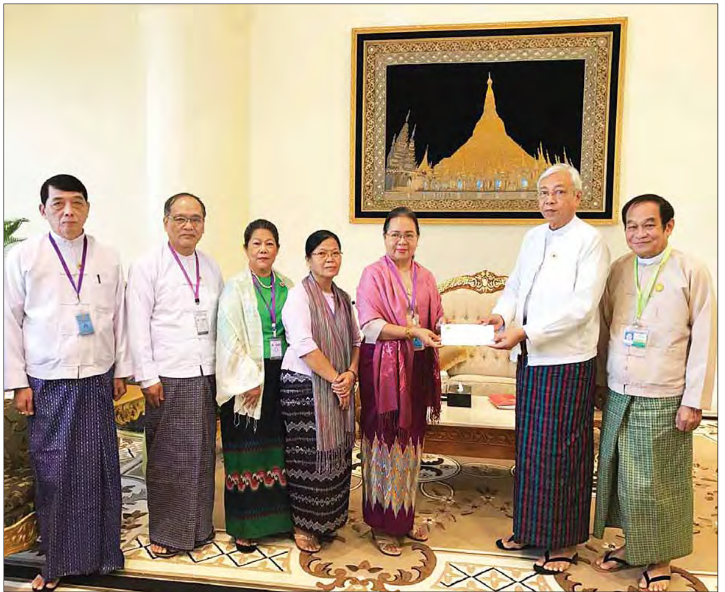
နိုင်ငံတော်သမ္မတ ဦးထင်ကျော် မြန်မာနိုင်ငံကြက်ခြေနီအသင်းအား အလှူငွေ ပေးအပ်လှူဒါန်းစဉ်။

နေပြည်တော် ဒီဇင်ဘာ ၇ မြန်မာနိုင်ငံကြက်ခြေနီအသင်းနာယက နိုင်ငံတော်သမ္မတ ဦးထင်ကျော်သည် ယနေ့နံနက်ပိုင်းတွင် မြန်မာနိုင်ငံကြက်ခြေနီအသင်းဥက္ကဋ္ဌ ပါမောက္ခဒေါက်တာမြသူနှင့် အလုပ်အမှုဆောင်အဖွဲ့ဝင်များအား နိုင်ငံတော်သမ္မတအိမ်တော် ဧည့်ခန်းမ၌ လက်ခံတွေ့ဆုံသည်။ တွေ့ဆုံစဉ် မြန်မာနိုင်ငံကြက်ခြေနီအသင်းမှ အသင်း၏ လုပ်ငန်းဆောင်ရွက်မှု အခြေအနေများကို ရှင်းလင်းတင်ပြပြီး နိုင်ငံတော်သမ္မတက လိုအပ်သည်များ ညှိနှိုင်း