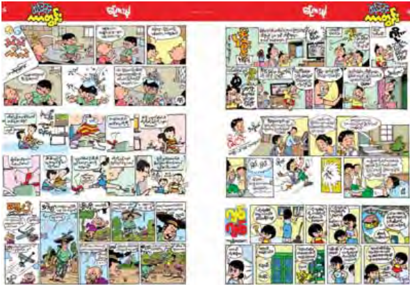
အချပ်ပို ၁၆ - ၁၇