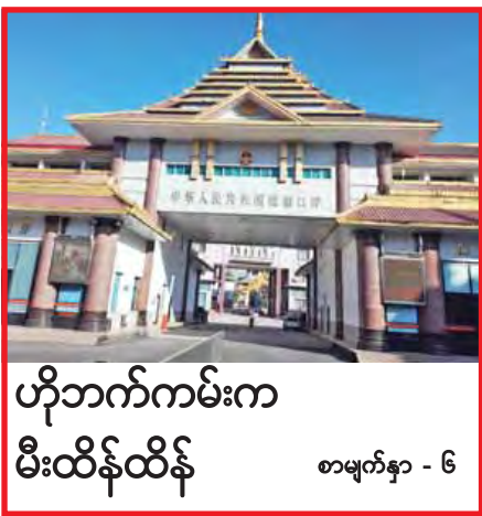
ဟိုဘက်ကမ်းက မီးထိန်ထိန် စာမျက်နှာ - ၆