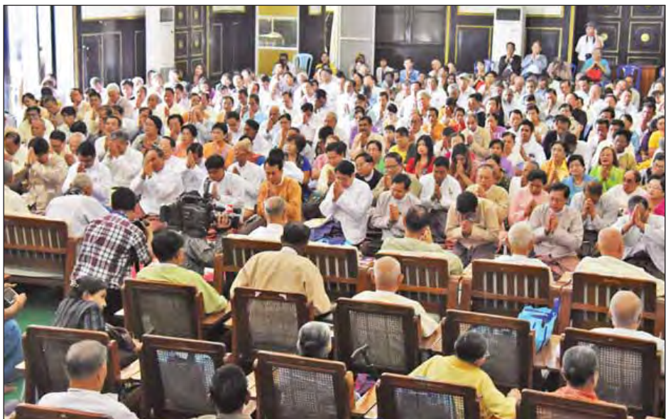
စာရင်းကို ဖတ်ကြားသည်။ သိန်း ၆၀၊ ရန်ကုန်တိုင်းဒေသကြီးအစိုးရအဖွဲ့မှ လှူဒါန်းငွေ ကျပ် ၁၀ သိန်း၊ ရန်ကုန်မြို့တော်စည်ပင်သာယာရေး

ရန်ကုန် ဒီဇင်ဘာ ၃ မြန်မာနိုင်ငံစာရေးဆရာအသင်းက ကြီးပွားကျင်းပသည့် ၁၃၇၈ ခုနှစ် မြန်မာနိုင်ငံစာဆိုတော်နေ့အထိမ်းအမှတ် သက်ကြီးစာပေပညာရှင်များ ပူဇော်ကန်တော့ပွဲကို ယနေ့ နံနက် ၉ နာရီတွင် ရန်ကုန်မြို့၊ မြို့တော်ခန်းမ၌ကျင်းပရာ ပြန်ကြားရေးဝန်ကြီးဌာန ပြည်ထောင်စုဝန်ကြီး ဒေါက်တာ ဖေမြင့်၊ ရန်ကုန်တိုင်းဒေသကြီးဝန်ကြီးချုပ် ဦးဖြိုးမင်းသိန်း၊ ရန်ကုန်မြို့တော်ဝန် ဦးမောင်မောင်စိုး၊ ပူဇော်ကန်တော့ခံ သက်ကြီးစာပေပညာရှင်များ၊ မြန်မာနိုင်ငံစာရေးဆရာ အသင်းဥက္ကဋ္ဌနှင့် အမှုဆောင်အဖွဲ့ဝင်များ၊ အလှူရှင်များ တက်ရောက်ကြသည်။