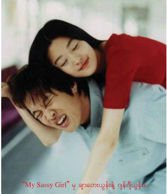
“My Sassy Girl” မှ ချာတေးယွန်းနဲ့ ဂျန်ဂျီယွန်း။

ချာတေးယွန်းကတော့ “The Legend of the Blue Sea” ရုပ်ရှင်မတိုင်မီက ဇာတ်လမ်းတွဲရုပ်ရှင် “Producer” မှာ ဇာတ်ဆောင်မင်းသားတစ်ဦးအဖြစ် ပါဝင်သရုပ်ဆောင်ထားကာ အဆိုပါရုပ်ရှင်ဟာလည်း အောင်မြင်မှုအတော်အတန်ရခဲ့ပါတယ်။