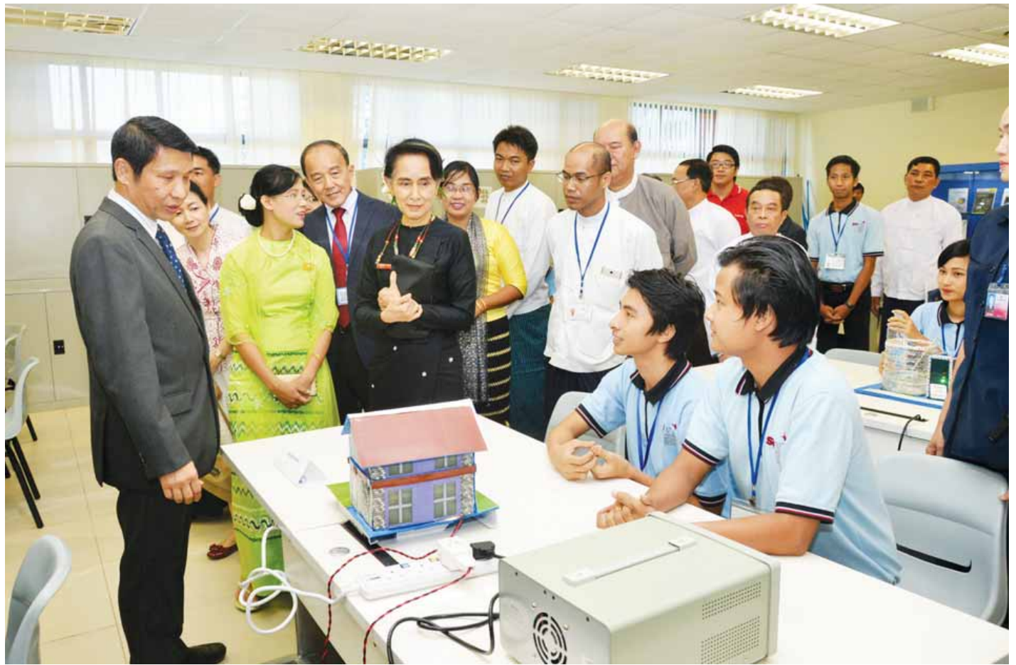
နိုင်ငံတော်၏အတိုင်ပင်ခံပုဂ္ဂိုလ် ဒေါ်အောင်ဆန်းစုကြည် စင်ကာပူ-မြန်မာ သက်မွေးပညာသင်တန်းကျောင်းအတွင်း ကျောင်းသား ကျောင်းသူများ လက်တွေ့သင်ကြားနေမှုများကို လှည့်လည်ကြည့်ရှုအားပေးစဉ်။ (သတင်းစဉ်)

နိုင်ငံတော်၏အတိုင်ပင်ခံပုဂ္ဂိုလ် ဒေါ်အောင်ဆန်းစုကြည်က စင်ကာပူ-မြန်မာ သက်မွေးပညာသင်တန်းကျောင်းမှ စာမျက်နှာ ၃ ကော်လံ ၁ သို့ □