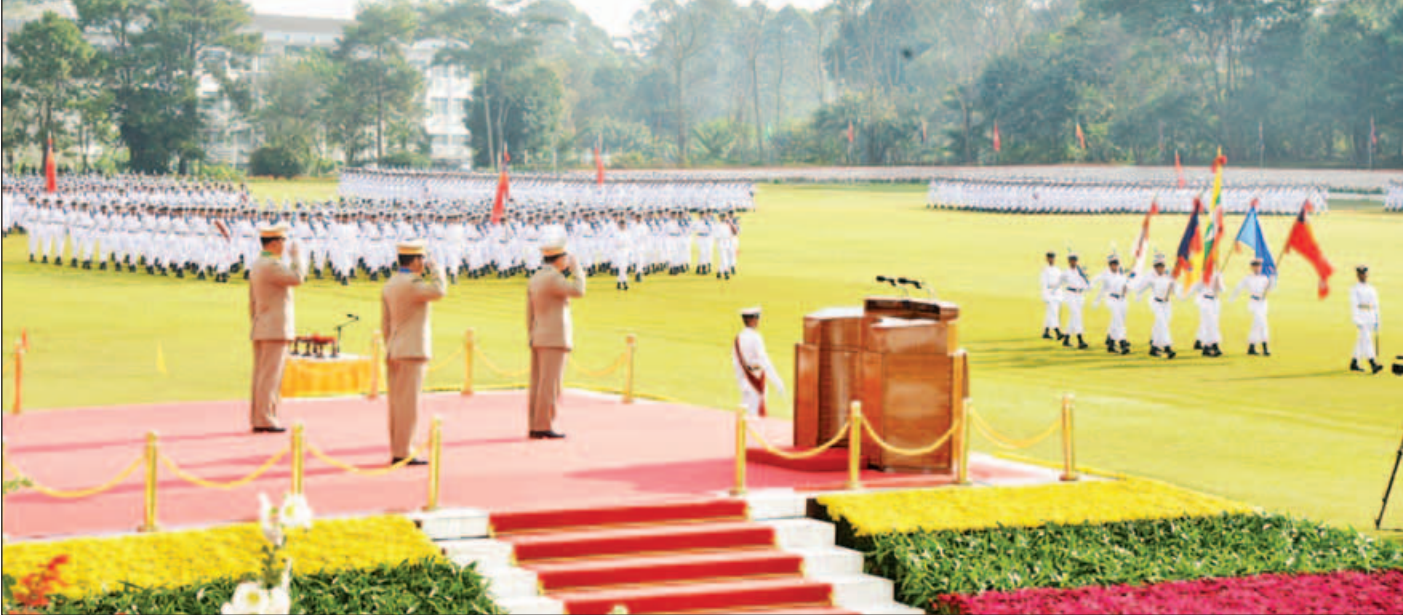
တပ်မတော်ကာကွယ်ရေး ဦးစီးချုပ် ဗိုလ်ချုပ်မှူးကြီး မဟာသရေစည်သူ မင်းအောင်လှိုင် ဗိုလ်လောင်းတပ်ရင်းများ၏ အလေးပြုခြင်းကို ခံယူစဉ်။ (သတင်းစဉ်)

နေပြည်တော် ဒီဇင်ဘာ ၂ စည်းလုံးညီညွတ်မှုသည် “အား” ကို ဖြစ်စေသကဲ့သို့ စည်းလုံးညီညွတ်မှု ပျက်ပြားစေသည့် ကိစ္စရပ်များသည် ခိုင်မာညီညွတ်မှု “အား”ကို လျော့ကျထိခိုက်စေကြောင်း၊ တပ်မတော်(ကြည်း၊ရေ၊လေ) တပ်ဖွဲ့အားလုံး စည်းလုံး ညီညွတ်မှုရှိမှု တပ်မတော်အတွက် “အား” ဖြစ်စေပြီး နိုင်ငံ တော်တွင်လည်း နိုင်ငံသားများ၏ စည်းလုံးညီညွတ်မှုသည် “နိုင်ငံအား” ကိုဖြစ်စေနိုင်ကြောင်း တပ်မတော်ကာကွယ်ရေး ဦးစီးချုပ် ဗိုလ်ချုပ်မှူးကြီး မဟာသရေစည်သူ မင်းအောင် လှိုင်က ပြောကြားသည်။