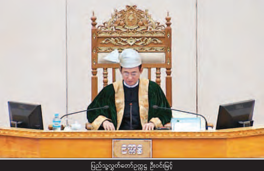
ပြည်သူ့လွှတ်တော်ဥက္ကဋ္ဌ ဦးဝင်းမြင့်

မြစ်ကြီးနားမဲဆန္ဒနယ်မှ ဦးအင်ထုံးခါးနော်ဆစ်က စစ်ပွဲကြောင့် နိုင်ငံအတွင်း ဘဏ္ဍာငွေနှင့် သယံဇာတများ