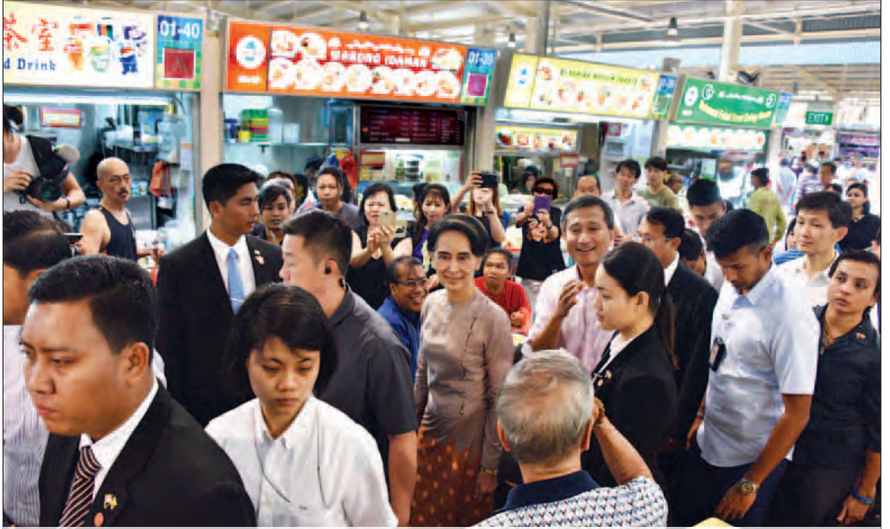
နိုင်ငံတော်၏အတိုင်ပင်ခံပုဂ္ဂိုလ် ဒေါ်အောင်ဆန်းစုကြည် စင်ကာပူနိုင်ငံ Ghim Moh ဈေးအတွင်း ကြည့်ရှုလေ့လာစဉ်။

စင်ကာပူ ဒီဇင်ဘာ ၂ စင်ကာပူနိုင်ငံတွင်ရောက်ရှိနေသည့် နိုင်ငံတော်၏အတိုင်ပင်ခံပုဂ္ဂိုလ် ဒေါ်အောင်ဆန်းစုကြည်သည် ယနေ့ ဒေသစံတော်ချိန် နံနက် ၈ နာရီတွင် စင်ကာပူနိုင်ငံခြားရေးဝန်ကြီး မစ္စတာ ဗီဗီယန် ဘာလာ ကရပ်ရှန်နက်က စင်ကာပူနိုင်ငံ Ghim Moh Hawker Center & Market ၌ တည်ခင်းသည့် နံနက်စာစားပွဲသို့ တက်ရောက်ပြီး ဈေးအတွင်း လှည့်လည်ကြည့်ရှုလေ့လာသည်။ ထို့နောက် နိုင်ငံတော်၏အတိုင်ပင်ခံပုဂ္ဂိုလ်သည် နံနက် ၁၁နာရီတွင် ခေတ္တတည်းခိုရာ ရှန်ဂရီလာဟိုတယ်၌ Channel News Asia သတင်းဌာန၏ တွေ့ဆုံမေးမြန်းမှုကို ပြန်လည်ဖြေကြားသည်။