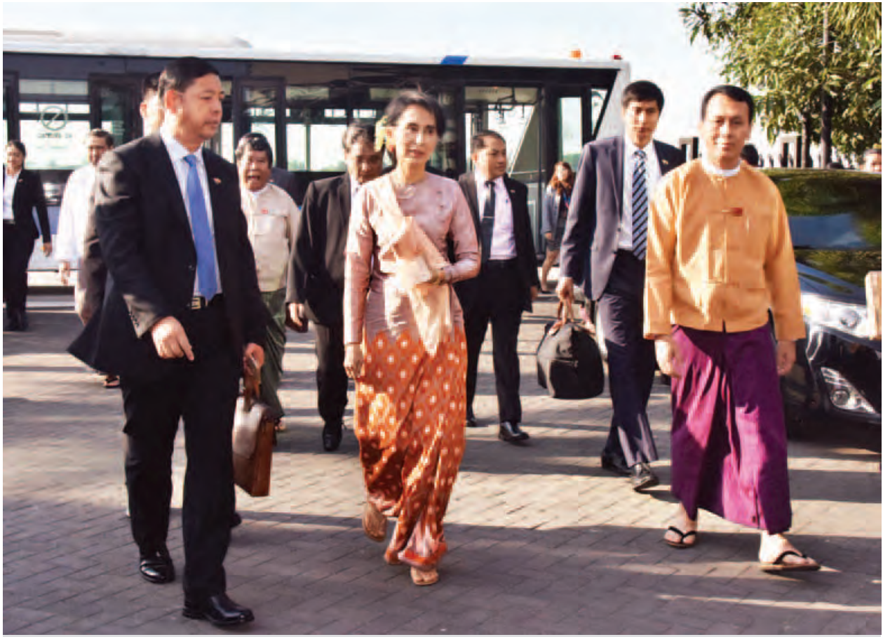
နိုင်ငံတော်၏ အတိုင်ပင်ခံပုဂ္ဂိုလ်အောင်ဆန်းစုကြည်အား ရန်ကုန်အပြည်ပြည်ဆိုင်ရာ လေဆိပ်တွင် တာဝန်ရှိသူများက ကြိုဆိုနှုတ်ဆက်ကြစဉ်။(သတင်းစဉ်) သတင်း - ရှေးမုံ

ဟံသာဝတီ အပြည်ပြည်ဆိုင်ရာ လေဆိပ်သစ်စီမံကိန်း အကောင်အထည် မပေါ်မီကာလ၌ ရန်ကုန်အပြည်ပြည်ဆိုင်ရာလေဆိပ်တိုးချဲ့စီမံကိန်းများ ဆောင်ရွက်လျက်ရှိရာတွင် တစ်နှစ်လျှင် ခရီးသည် သန်း ၂၀ အထိ ဝန်ဆောင်မှု ပေးနိုင်မည့် စီမံကိန်းကို အဆင့်သုံးဆင့်ဖြင့် အကောင်အထည်ဖော် ဆောင်ရွက် နေခြင်းဖြစ်သည်။ အဆိုပါ စီမံကိန်း အဆင့်သုံးဆင့်၏ ပထမအဆင့် စီမံကိန်း တစ်ခုဖြစ်သော ပြည်ပခရီးသည် အဝင်အထွက် ပြုလုပ်မည့် Terminal 1 အဆောက်အအုံသစ်နှင့် ပြည်တွင်းခရီးသည် အဝင်အထွက် ပြုလုပ်မည့်