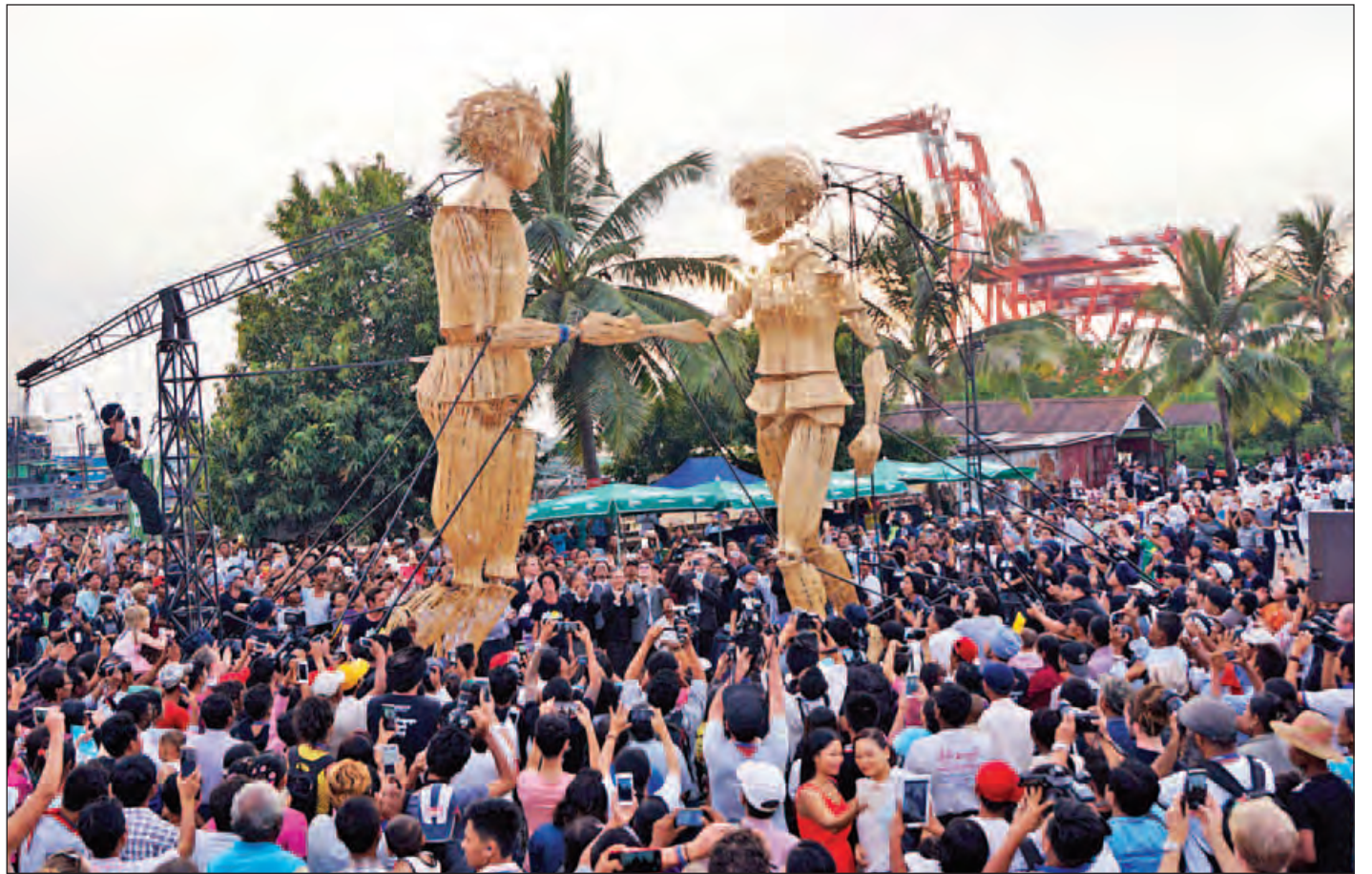
L'Homme Debout အဖွဲ့က ဖန်တီးထားသော အမြင့်ပေ ၂၀ ဝန်းကျင်ရှိ ဝါးဖြင့်ရက်လုပ်ထားသည့် ရုပ်သေးရုပ်ကြီးနှစ်ခုအား တွေ့ရစဉ်။

ဆက်လက်၍ ဒုတိယသမ္မတက အစိုးရသစ်တာဝန်ယူ ပြီးနောက်ပိုင်း ပြင်သစ်နိုင်ငံခြားရေးဝန်ကြီး Mr. Jean-Marc Ayrault မြန်မာနိုင်ငံသို့ အလည်အပတ်လာရောက် ခဲ့ပြီး မြန်မာနိုင်ငံ၏ ဒီမိုကရေစီအသွင်ကူးပြောင်းရေး၊ ငြိမ်းချမ်းရေး၊ အမျိုးသားပြန်လည်သင့်မြတ်ရေးနှင့် စီးပွားရေးဖွံ့ဖြိုးတိုးတက်ရေးတို့အတွက် ကြိုးစား လုပ်ဆောင်နေသည်များကို ပြင်သစ်နိုင်ငံအနေဖြင့် အကူ အညီများပေးသွားမည်ဟု ပြောကြားခဲ့ပါကြောင်း၊ ယဉ်ကျေးမှု အပါအဝင် စာမျက်နှာ ၉ ကော်လံ ၁ သို့ ❖