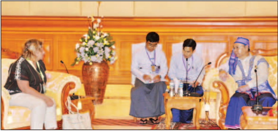
အမျိုးသားလွှတ်တော် ဥက္ကဋ္ဌ သိမ်းရေးဆိုင်ရာ ကော်မတီမှ ဥက္ကဋ္ဌ၊ လွှတ်တော်ရုံးမှ တာဝန်ရှိသူများနှင့် အမျိုးသားလွှတ်တော် သတ္တုသယ်ယူပို့ဆောင်ရေးနှင့် အမျိုးသားလက်ရောက်ကြသည်။ (သတင်းစဉ်)