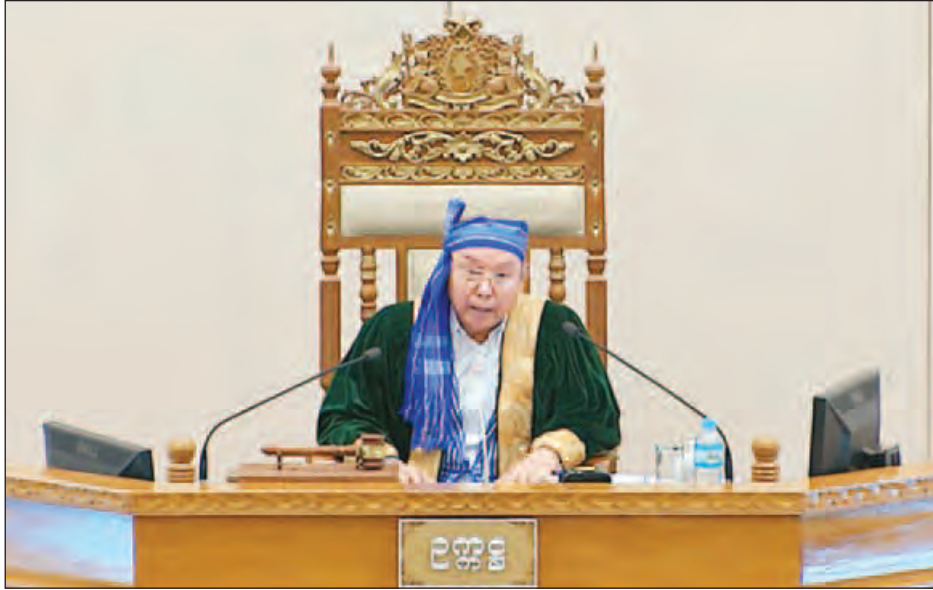
အမျိုးသားလွှတ်တော်ဥက္ကဋ္ဌ မန်းဝင်းခိုင်သန်း။

အဆိုပါမြေဧရိယာ ၄၆ ဒသမ ၄၇ ဧကအား လက်ရှိ အချိန်တွင် စစ်မှုထမ်းဟောင်းမြေနေရာအဖြစ် အသုံးပြုခွင့်ရရှိရေးကို လားရှိုးခရိုင်နှင့် မြို့နယ်လယ်ယာမြေ စီမံခန့်ခွဲရေးနှင့် စာရင်းအင်းဦးစီးဌာနတို့မှ လုပ်ထုံးလုပ်နည်းများနှင့်အညီ အမှုတွဲတည်ဆောက် တင်ပြဆောင်ရွက်လျက်ရှိပါသဖြင့် ပြန်လည်စွန့်လွှတ်ပေးနိုင်မှုမရှိပါကြောင်း၊ မူလမြေပိုင်ဆိုင်မှုစာရင်းတွင် အမည်ပေါက်ပိုင်ဆိုင်သူ စာရင်း ပါရှိခြင်းမရှိသည့်အတွက် မြေယာလျော်ကြေး