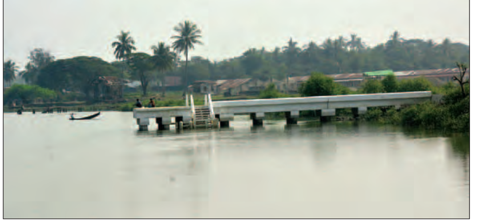
ကညင်ချောင်းကုန်သွယ်ရေးဇုန်တွင် ဆောက်လုပ်ပြီးစီးနေသည့် ဆိပ်ခံတံတား။

လက်ရှိ မောင်တောနယ်စပ်ကုန်သွယ်ရေးစခန်း ဖွင့်လှစ်ထားသည့် မောင်တောချောင်းမှာ တိမ်ကောလာပြီဖြစ်သည့်အတွက် သင်္ဘောကြီးများ ဝင်ထွက်သွားလာနိုင်သည့် ကညင်ချောင်းကုန်သွယ်ရေးဇုန်ကို အကောင်အထည်ဖော်ဆောင်ရွက်နေခြင်းဖြစ်ကြောင်း၊ မကြာမီ မောင်တောခရိုင်သို့ မဟာဓာတ်အားလိုင်းမှ လျှပ်စစ်ဓာတ်အားရရှိလာပါက ကညင်ချောင်းကုန်သွယ်ရေးဇုန်တွင် အအေးခန်းများနှင့် ဟိုတယ်စီမံကိန်းများ ပေါ်ပေါက်