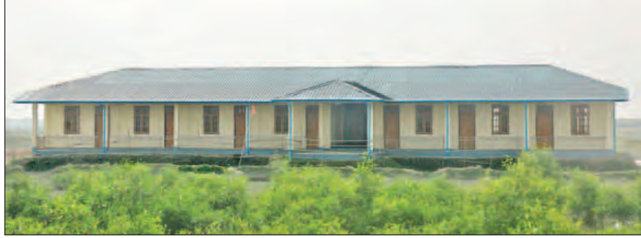
ကညင်ချောင်းကုန်သွယ်ရေးဇုန်တွင် ဆောက်လုပ်ပြီးစီးနေသည့် ပင်မအဆောက်အအုံ။

မောင်တောခရိုင်အတွင်းရှိ ကညင်ချောင်းကုန်သွယ်ရေးဇုန် အကောင်အထည်ဖော်ဆောင်ရွက်နေမှုနှင့်အတူ ကဏ္ဍစုံတွင် ရင်းနှီးမြှုပ်နှံမှုလုပ်ငန်းများ ဟန်ချက်ညီဆောင်ရွက်နိုင်ပါက လူမှုစီးပွားဘဝဖွံ့ဖြိုးတိုးတက်လာပြီး ရေရှည်တည်ငြိမ်အေးချမ်းမှုလည်း ရရှိလာမည် ဖြစ်ပါကြောင်း။