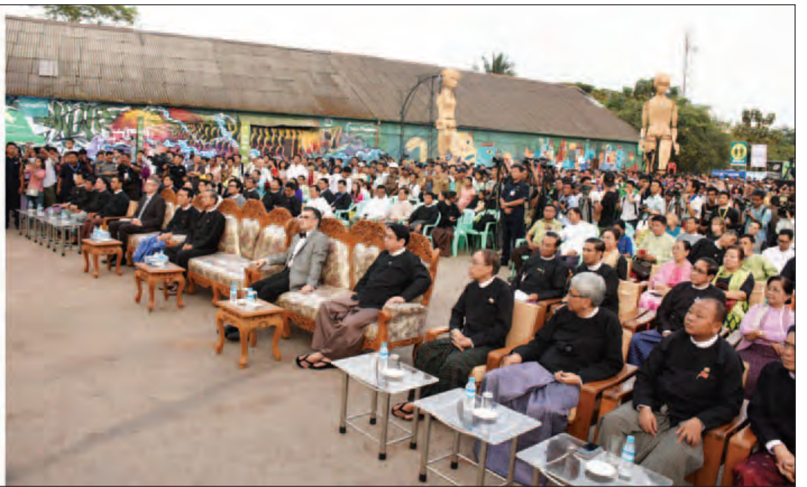
ဒုတိယသမ္မတ ဦးဟင်နရီဗန်ထီးယူ ပြင်သစ်-မြန်မာ ယဉ်ကျေးမှုပွဲတော်ပွင့်ပွဲတွင် (၅၅)နှစ်မြောက် အထိမ်းအမှတ် မင်္ဂလာပါ ယဉ်ကျေးမှုပွဲတော်ဖွင့်ပွဲတွင် အမှာစကားပြောကြားစဉ်။ (သတင်းစဉ်)