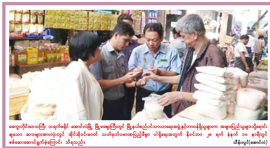
မကျေးတိုင်းဒေသကြီး သရက်ခရိုင် အောင်လံမြို့ မြို့မဈေးကြီးတွင် မြို့နယ်စည်ပင်သာယာရေးအဖွဲ့နှင့်တာဝန်ရှိသူများက အများပြည်သူများသို့ရောင်းချသော ဆားများအားလုံးတွင် ဆိုင်ဆိုင်ခင်းခင်း သတ်မှတ်ပမာဏပြည့်စီစဉ် ပါရှိရေးအတွက် နိုဝင်ဘာ ၂၈ ရက် နံနက် ၁၀ နာရီတွင် စစ်ဆေးဆောင်ရွက်ခဲ့ကြောင်း သိရသည်။ သိန်းလွင်(အောင်လံ)