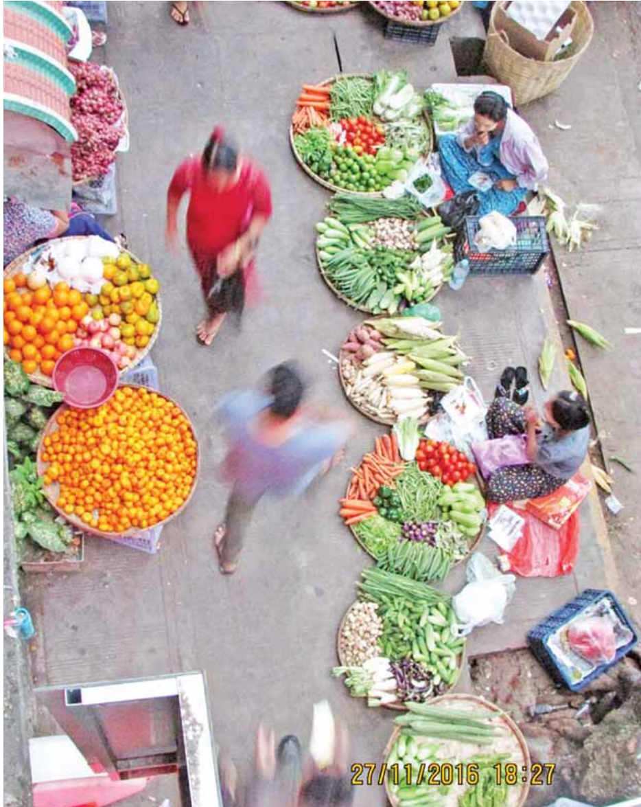
ရန်ကုန်မြို့တစ်နေရာရှိ လမ်းဘေးပလက်ဖောင်းပေါ်တွင် ဈေးရောင်းနေသော ပျံကျဈေးသည်များကို နိုဝင်ဘာ ၂၇ ရက်က တွေ့ရစဉ်။

ရန်ကုန်မြို့သည် မြန်မာနိုင်ငံ၏ အထင်ကရ စီးပွားရေး မြို့တော်တစ်ခုအဖြစ် တည်ရှိနေ၏။ နေပြည်တော်ကို မြန်မာနိုင်ငံ၏ မြို့တော်အဖြစ် သတ်မှတ်ထားသော် လည်း ရန်ကုန်မြို့သည် နိုင်ငံတော်အုပ်ချုပ်ရေး ယန္တရား များ၊ လွှတ်တော်များအပါအဝင် နိုင်ငံရေးအရ အထင် ကရများ မရှိသော်လည်း ယခုထက်တိုင် စီးပွားရေး၊