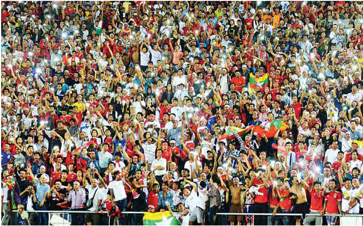
၂၀၁၆ ဆူဇူကီးဖလားပြိုင်ပွဲတွင် တစ်ခဲနက်လာရောက်အားပေးနေသည့် မြန်မာဘောလုံးပရိသတ်များ။