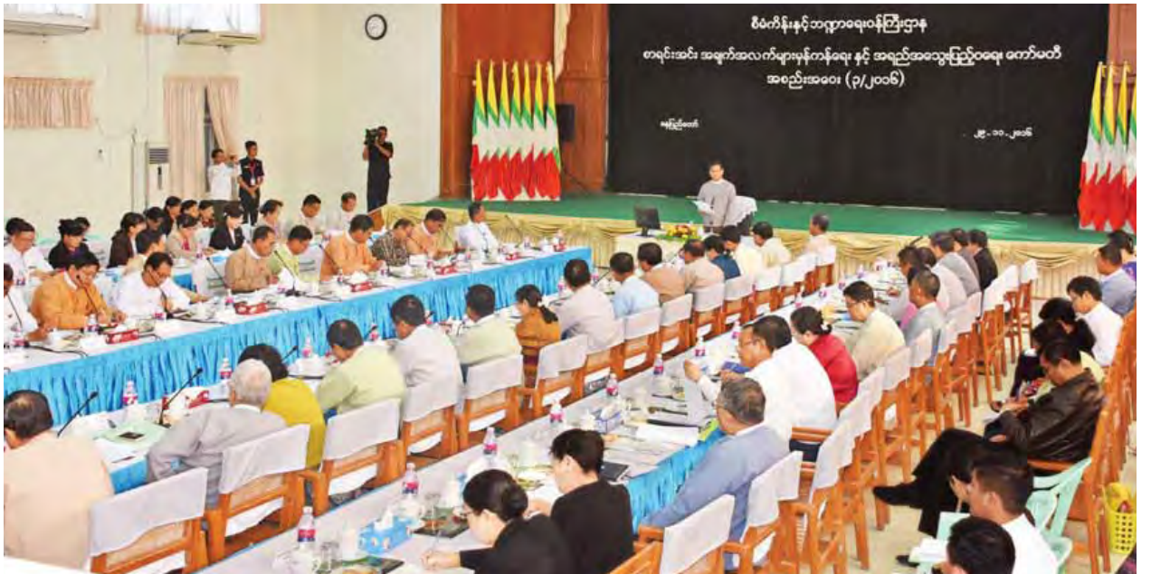
စာရင်းအင်းအချက်အလက်များမှန်ကန်ရေးနှင့် အရည်အသွေးပြည့်ဝရေးကော်မတီအစည်းအဝေး(၃/၂၀၁၆)တွင် ကော်မတီနာယက ဒုတိယသမ္မတ ဦးဟင်နရီဗန်ထီးယူ အမှာစကားပြောကြားစဉ်။ (သတင်းစဉ်)

၂၀၁၆ ခုနှစ် နှစ်လယ်မြန်မာ့ကျောက်မျက်ရတနာပြပွဲ အောင်မြင်စွာ ကျင်းပပြီးစီး