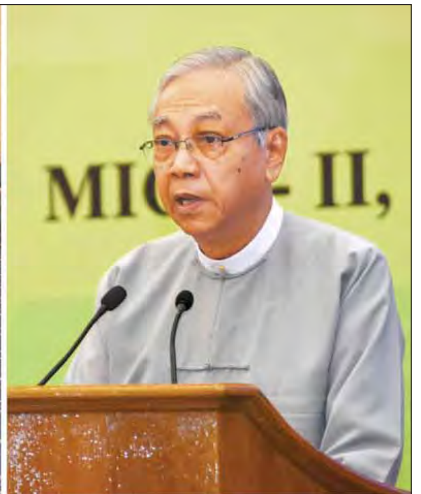
ပဥ္စမအကြိမ် အစိမ်းရောင်စီးပွားရေး အစိမ်းရောင်ဖွံ့ဖြိုးတိုးတက်မှုဖိုရမ် ဖွင့်ပွဲအခမ်းအနားတွင် နိုင်ငံတော်သမ္မတ ဦးထင်ကျော် မိန့်ခွန်းပြောကြားစဉ်။ (သတင်းစဉ်)