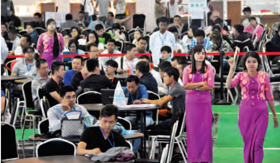
ဈေးပြိုင်စနစ်ဖြင့် ရောင်းချရာ နိုဝင်ဘာ ၂၆ ရက်အထိ ကျောက်စိမ်းအတွဲ ၃၀၀၈ တွဲ ရောင်းချခဲ့ကြောင်း သိရှိရသည်။ ပြပွဲ ဒဿမနေ့(နောက်ဆုံးနေ့)တွင် ချသွားမည်ဖြစ်ကြောင်း သိရသည်။ (သတင်းစဉ်)

၂၀၁၆ ခုနှစ် နှစ်လယ် မြန်မာ့ကျောက်မျက်ရတနာပြပွဲကို နေပြည်တော်ရှိ မဏိရတနာကျောက်စိမ်းခန်းမ၌ ဆက်လက်ကျင်းပလျက်ရှိရာ ယနေ့ (နဝမမြောက်နေ့)တွင် ကျောက်စိမ်းအတွဲအမှတ်(၅၉၂၃)မှ (၅၉၅၇)အထိ အတွဲပေါင်း ၃၅ တွဲကို ဈေးပြိုင်စနစ်ဖြင့် ရောင်းချပေးခဲ့သည်။