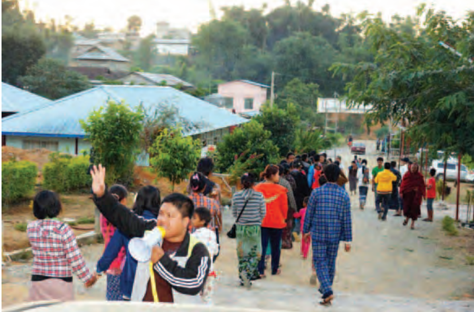
တွင် ၁၅၁ ဦးနှင့် အမှတ်(၄) အခြေခံပညာမူလတန်းကျောင်းတွင် ၁၁ ဦး စုစုပေါင်း စစ်ဘေးတိမ်းရှောင်တော့ကြောင်း သိရသည်။ ခရိုင် (မြန်/ဆက်)

မူဆယ် နိုဝင်ဘာ ၂၈ မူဆယ်မြို့ရှိ ကယ်ဆယ်ရေးစခန်းများတွင် ရောက်ရှိနေသည့် နေရပ်စွန့်ခွာထွက်ပြေးတိမ်းရှောင်သူများသည် ယခုအခါ နယ်မြေတည်ငြိမ်အေးချမ်းမှုရရှိလာပြီဖြစ်၍ ၎င်းတို့၏ ဆန္ဒအလျောက် နေရပ်အသီးသီးသို့ ပြန်လည်ထွက်ခွာနေကြရာ ကြက်ခြေနီအသင်းများ၊ ပရဟိတအသင်းများ၊ ကျန်းမာရေးဌာနမှ လူနာတင်ယာဉ်များဖြင့် နေရပ်များသို့ ပြန်လည်ပို့ဆောင်ပေးလျက်ရှိသည်။ ထိုသို့ နေရပ်အသီးသီးသို့ ပြန်လည်ထွက်ခွာလျက်ရှိရာ ဟိုမှန်ရပ်ကွက် ခရစ်ယာန်ဘုရားကျောင်း ကယ်ဆယ်ရေးစခန်းတွင် ၁၄၂ ဦး၊ အောင်မင်္ဂလာဘုန်းတော်ကြီးကျောင်း (စွမ်းစော်) တွင် ၄၉ ဦး၊ နန်ခွမ်ဘုန်းတော်ကြီးကျောင်းတွင် ရှစ်ဦး၊ အမှတ်(၂) အခြေခံပညာအထက်တန်းကျောင်း