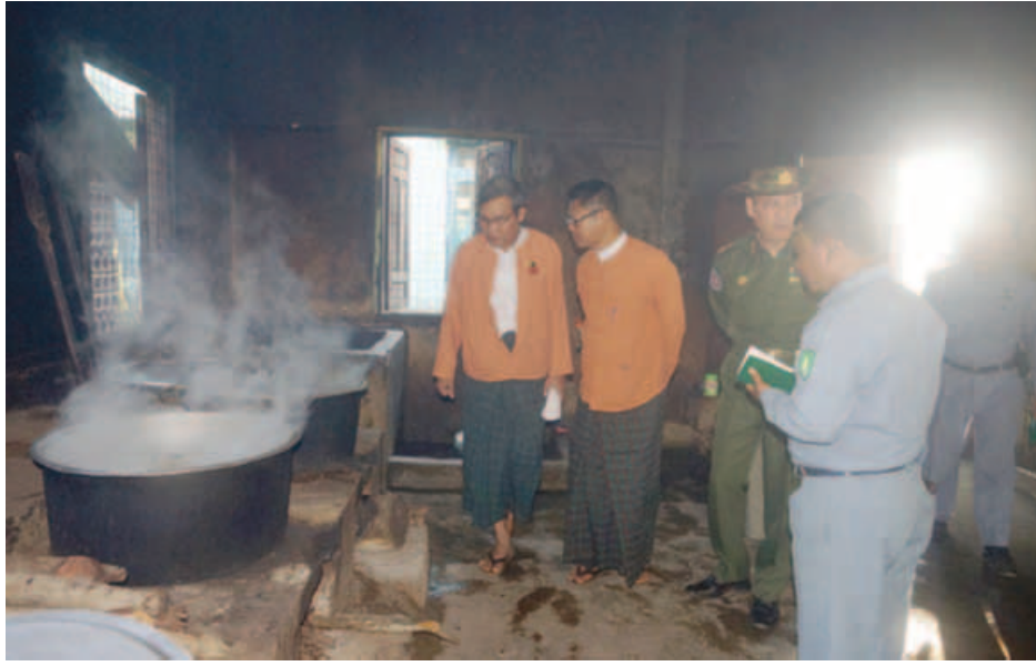
စစ်တွေ နိုဝင်ဘာ ၂၀

နယ်စပ်ဒေသတိုင်းရင်းသားလူငယ်များ ဖွံ့ဖြိုးရေးသင်တန်း ကျောင်း၊ စစ်တွေမြို့ဝန်းထမ်းများ၊ ကျောင်းသား၊ ကျောင်းသူ များနှင့် ရခိုင်ပြည်နယ်ဝန်ကြီးချုပ်နှင့် ပြည်နယ်ဝန်ကြီးများ တွေ့ဆုံပွဲကို နိုဝင်ဘာ ၂၇ ရက် နံနက် ၈ နာရီခွဲက နယ်စပ် ဒေသတိုင်းရင်းသားလူငယ်များ ဖွံ့ဖြိုးရေးသင်တန်း ကျောင်း အစည်းအဝေးခန်းမ၌ ပြုလုပ်ခဲ့သည်။ အဆိုပါတွေ့ဆုံပွဲတွင် ရခိုင်ပြည်နယ်ဝန်ကြီးချုပ် ဦးညီပု က ကျောင်းသား၊ ကျောင်းသူများအနေဖြင့် မိမိတို့မိသားစု များနှင့်ဝေးကွာပြီး ဘဝတိုးတက်ရေးအတွက် ပညာသင် ကြားကြရအောင် တစ်ဦးနှင့်တစ်ဦးချစ်ချစ်ခင်ခင် နေထိုင် သွားကြရန်နှင့် ဆရာ၊ ဆရာမများ၏ သွန်သင်ဆုံးမမှုများကို မှတ်သားကာ သင်တန်းကျောင်းမှ ချမှတ်ထားသော စည်း ကမ်းများကို လိုက်နာကြရန်၊ ကျန်းမာရေးကောင်းမွန် အောင် အထူးဂရုပြုနေထိုင်ကြရန်၊ ပညာတော်၍ နိုင်ငံကို အလှဆင်နိုင်သူများဖြစ်အောင် ကြိုးစားသွားကြရန် အဖွင့် အမှာစကားပြောကြားရာတွင် ထည့်သွင်းပြောကြားခဲ့ သည်။