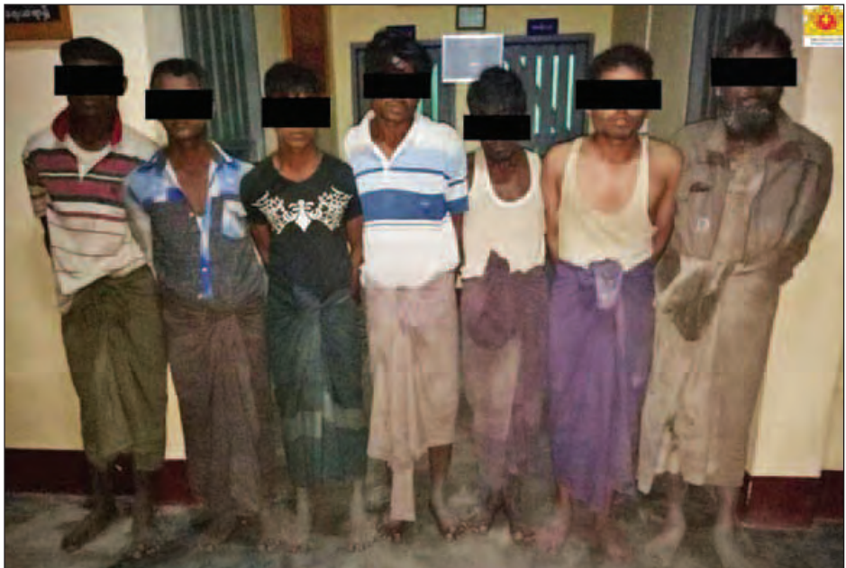
အကြမ်းဖက်တိုက်ခိုက်မှုများတွင် ပါဝင်ပတ်သက်နိုင်သည့် မသင်္ကာသူအချို့ကို တွေ့ရစဉ်။