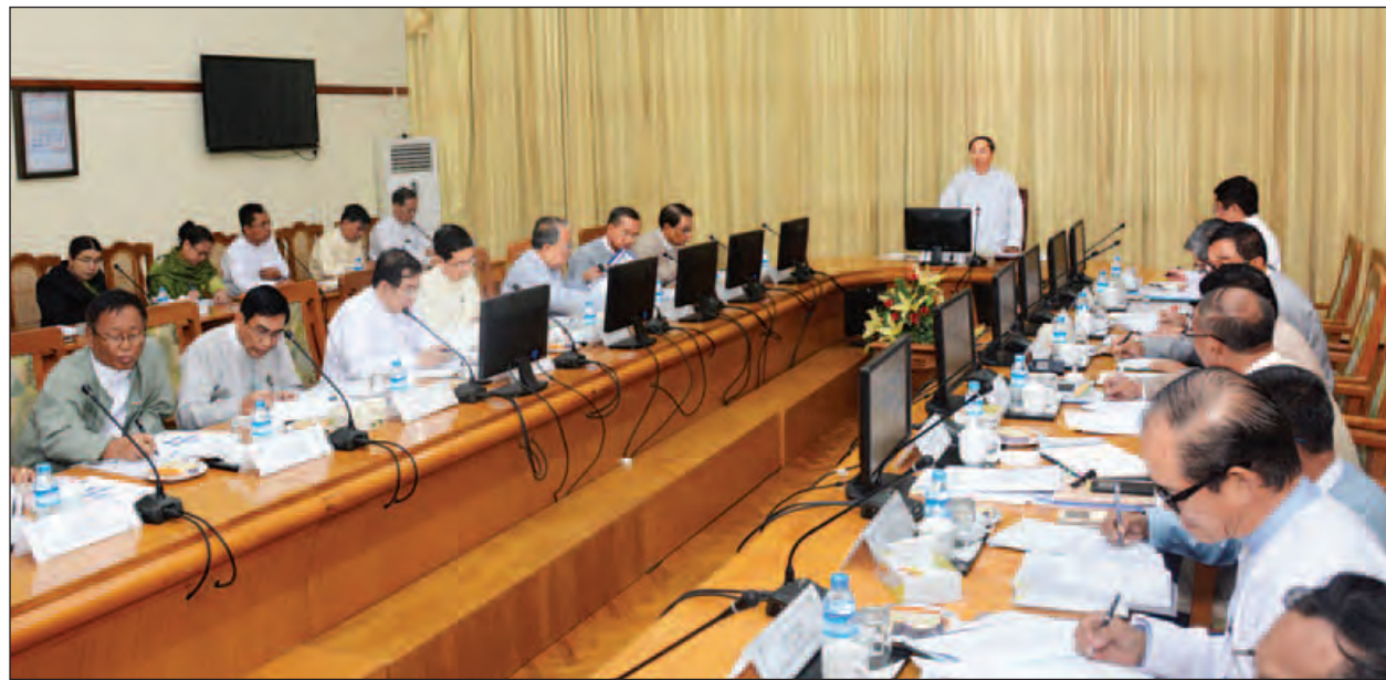
ပုဂ္ဂလိကကဏ္ဍဖွံ့ဖြိုးတိုးတက်ရေးကော်မတီ၏ ပထမအကြိမ်အစည်းအဝေးတွင် ဒုတိယသမ္မတ ဦးမြင့်ဆွေ အမှာစကားပြောကြားစဉ်။ (သတင်းစဉ်)

နေပြည်တော် နိုဝင်ဘာ ၂၈ ပုဂ္ဂလိကကဏ္ဍဖွံ့ဖြိုးတိုးတက်ရေးလုပ်ငန်းစီမံချက်ကို လုပ်ငန်းကော်မတီများ အနေဖြင့် တက်ညီလက်ညီ ပူးပေါင်းအကောင်အထည်ဖော် ဆောင်ရွက်ကြမည် ဆိုပါက ပုဂ္ဂလိကကဏ္ဍ ဖွံ့ဖြိုးတိုးတက်ရေးကို သိသာစွာအထောက်အကူပြုနိုင်မည်ဖြစ်ပြီး တိုင်းပြည်၏စီးပွားရေးဖွံ့ဖြိုးတိုးတက်မှုကိုပါ ဖော်ဆောင်နိုင်မည် ဖြစ်ကြောင်း ပုဂ္ဂလိကကဏ္ဍဖွံ့ဖြိုးတိုးတက်ရေးကော်မတီဥက္ကဋ္ဌ ဒုတိယသမ္မတ ဦးမြင့်ဆွေက ပြောကြားသည်။ နေပြည်တော်ရှိ စီးပွားရေးနှင့်ကူးသန်းရောင်းဝယ်ရေးဝန်ကြီးဌာန အစည်းအဝေးခန်းမ၌ ယနေ့နံနက် ၁၀ နာရီတွင် ကျင်းပသည့် ပုဂ္ဂလိကကဏ္ဍဖွံ့ဖြိုးတိုးတက်ရေးကော်မတီ၏ ပထမအကြိမ်အစည်းအဝေးတွင် ဒုတိယသမ္မတက ထိုသို့ပြောကြားခဲ့ခြင်းဖြစ်သည်။ ဆက်လက်၍ ဒုတိယသမ္မတက ဈေးကွက်စီးပွားရေးစနစ်နှင့်အညီ ပုဂ္ဂလိကလုပ်ငန်းများကို နိုင်ငံစီးပွားရေးတွင် လွတ်လပ်စွာပါဝင်ခွင့်ပြုထားပါကြောင်း၊ နိုင်ငံပိုင်စီးပွားရေးလုပ်ငန်းများကို တဖြည်းဖြည်းလျှော့ချပြီး ပုဂ္ဂလိကပိုင် ပြုလုပ်ခြင်းများကို ဆောင်ရွက်လျက်ရှိပါကြောင်း၊ နိုင်ငံစီးပွားရေးလုပ်ငန်းအားလုံး၏ ၉၀ ရာခိုင်နှုန်းကျော်သည် ပုဂ္ဂလိကစီးပွားရေးလုပ်ငန်းများဖြစ်သည့်အတွက် ပုဂ္ဂလိကစီးပွားရေးလုပ်ငန်းများဖွံ့ဖြိုးတိုးတက်မှုသာလျှင် နိုင်ငံစီးပွားရေးဖွံ့ဖြိုးတိုးတက်မည်ဖြစ်ကြောင်း၊ ပုဂ္ဂလိကကဏ္ဍရှိ လုပ်ငန်းရှင်များ၊ ကျွမ်းကျင်ပညာရှင်များနှင့် ကျွမ်းကျင်လုပ်သားများ၏ အခန်းကဏ္ဍများကပါ အလုပ်အကိုင်အခွင့်အလမ်းများ စာမျက်နှာ ၃ ကော်လံ ၅ သို့ ❖