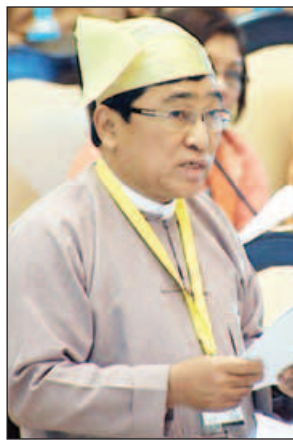
ပြည်ထောင်စုဝန်ကြီး ဒေါက်တာဝင်းမြတ်အေး

ဒုတိယအကြိမ် အမျိုးသားလွှတ်တော် တတိယပုံမှန်အစည်းအဝေး သတ္တမနေ့ကို ယနေ့နံနက် ၁၀ နာရီတွင် နေပြည်တော်ရှိ အမျိုးသားလွှတ်တော်အစည်းအဝေးခန်းမ၌ ကျင်းပသည်။ အစည်းအဝေးတွင် စစ်ကိုင်းတိုင်းဒေသကြီး မဲဆန္ဒနယ်အမှတ်(၃)မှ ဦးဝင်းအောင်၏ လမ်းဘေးလေလွင့်ကလေးသူငယ်များ ဘဝလုံခြုံရေးနှင့် ပြန်လည်ထူထောင်ရေးအတွက် ပညာသင်ကြားရေး၊ အလုပ်အကိုင် အခွင့်အလမ်းရရှိရေးနှင့် မှတ်ပုံတင်ရရှိရေး တို့အတွက် အစီအမံများ ချမှတ်ဆောင်ရွက်ပေးရန် အစီအစဉ် ရှိ မရှိ မေးခွန်းနှင့်စပ်လျဉ်း၍ လူမှုဝန်ထမ်း၊ ကယ်ဆယ်ရေးနှင့် ပြန်လည်နေရာချထားရေးဝန်ကြီးဌာန ပြည်ထောင်စုဝန်ကြီး ဒေါက်တာဝင်းမြတ်အေးက ကာကွယ်စောင့်ရှောက်ရန် လိုအပ်သော ကလေးနှင့် လူငယ်များအတွက် လူမှုဝန်ထမ်းဦးစီးဌာနမှ လူငယ်သင်တန်းကျောင်း ၁၀ ကျောင်း ဖွင့်လှစ်ပြီး လေလွင့်ကလေးသူငယ်များ၊ လမ်းပေါ်နေကလေးများ၊ ကလေးသူငယ်တရားရုံးမှ အမိန့်ချမှတ်၍ အကျင့်စာရိတ္တပြုပြင်ရန် ပို့အပ်လာသည့် ကလေးများ၊ ကလေးသူငယ်တရားရုံးတွင် ပြစ်မှုရင်ဆိုင်ဆဲကလေးများ၊ ကလေးသူငယ်ဥပဒေပုဒ်မ(၃၂) အရ ကာကွယ်စောင့်ရှောက်ရန် လိုအပ်သူများအားလက်ခံ၍ အခြေခံစားဝတ်နေရေး ဖြည့်ဆည်းပေးခြင်း၊ စိတ်ပိုင်း၊ ရုပ်ပိုင်း၊ အကျင့်စာရိတ္တပိုင်း ဆိုင်ရာ ဖွံ့ဖြိုးတိုးတက်ရေးအတွက် လူမှုဝန်ထမ်း နည်းလမ်းများဖြင့် ဆောင်ရွက်ပေးခြင်း၊ အတန်းပညာ၊ သက်မွေးပညာများ သင်ကြားပေး