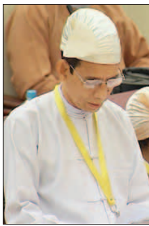
ပြည်ထောင်စုဝန်ကြီး ဒေါက်တာအောင်သူ

ယင်းအဆိုကို ပြည်သူ့လွှတ်တော်က လက်ခံဆွေးနွေးမည်ဖြစ်ပြီး ဆွေးနွေးလိုသည့် လွှတ်တော်ကိုယ်စားလှယ်များ၏ အမည်စာရင်းကို တောင်းခံထားသည်။ ထို့ပြင် အစည်းအဝေးတွင် လှိုင်းဘွဲ့မဲဆန္ဒနယ်မှ ဦးခင်ဦး၏ တောင်သူများအတွက် ခေတ်ကာလနှင့်လျော်ညီသော မြေခွန်နှုန်းထားများ ပြင်ဆင်သတ်မှတ်ကောက်ခံရန်အစီအစဉ် ရှိ မရှိ မေးခွန်းနှင့်စပ်လျဉ်း၍ စိုက်ပျိုးရေး၊ မွေးမြူရေးနှင့် ဆည်မြောင်းဝန်ကြီးဌာန ပြည်ထောင်စုဝန်ကြီး ဒေါက်တာအောင်သူက စည်းကြပ်လျက်ရှိသော မြေခွန်တော်အား တိုးမြှင့်သတ်မှတ်လိုက်ပါက နိုင်ငံတော်အတွက် အခွန်တော်ငွေမြောက်မြားစွာရရှိနိုင်မည်မှာ မှန်ကန်သော်လည်း တောင်သူလယ်သမားများထမ်းဆောင်ရမည့် အခွန်အခကိုင်ပေးပုံပူးပေါင်းပြင်ဆင်ရေးကိုရှေးရှု၍ မြေခွန်နှုန်းထားများ ပြင်ဆင်သတ်မှတ်မှု မပြုလုပ်ခဲ့ပါကြောင်း။