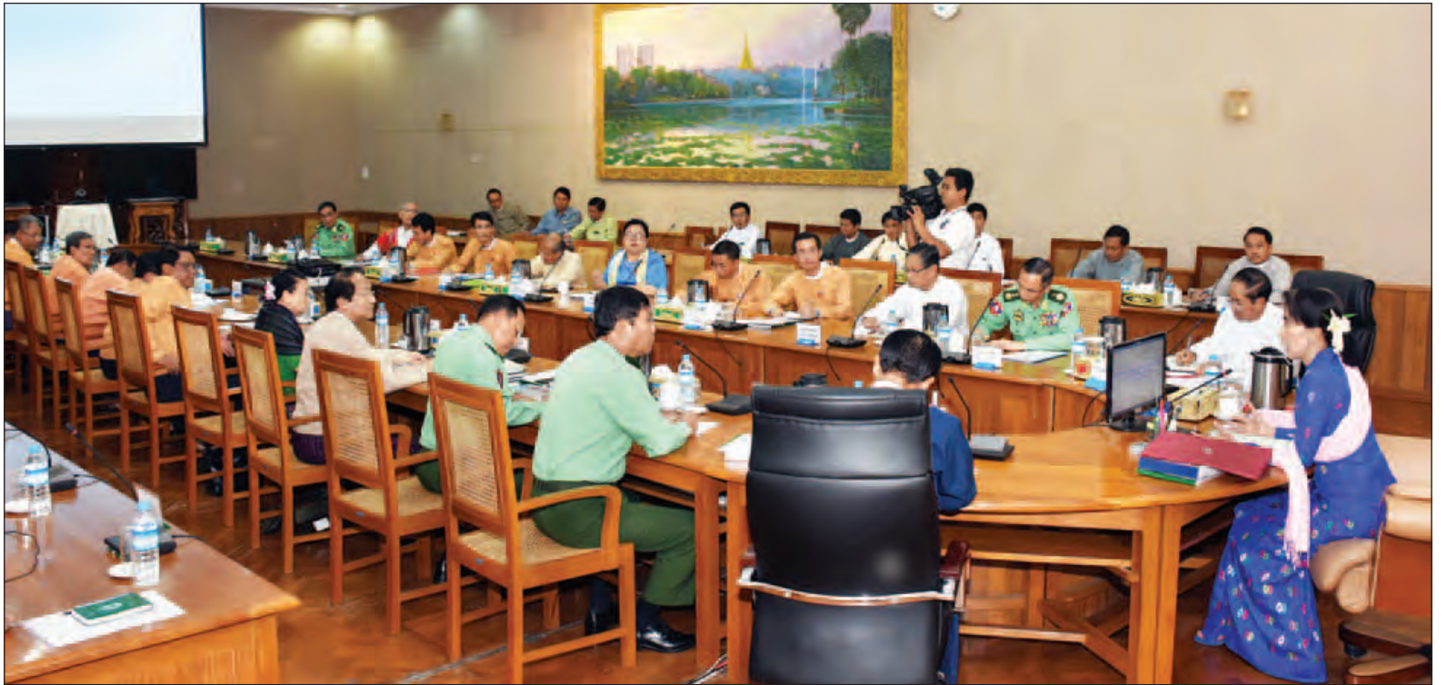
နယ်စပ်ဒေသနှင့် တိုင်းရင်းသားလူမျိုးများ၏ ဖွံ့ဖြိုးတိုးတက်မှုအကောင်အထည်ဖော်ရေးဗဟိုကော်မတီ ညှိနှိုင်းအစည်းအဝေးတွင် ဗဟိုကော်မတီဥက္ကဋ္ဌ နိုင်ငံတော်၏အတိုင်ပင်ခံပုဂ္ဂိုလ် ဒေါ်အောင်ဆန်းစုကြည် မိန့်ခွန်းပြောကြားစဉ်။ (သတင်းစဉ်)

နေပြည်တော် နိုဝင်ဘာ ၂၈ နယ်စပ်ဒေသနှင့်တိုင်းရင်းသားလူမျိုးများ၏ ဖွံ့ဖြိုးတိုးတက်မှုအကောင်အထည်ဖော်ရေးဗဟိုကော်မတီညှိနှိုင်းအစည်းအဝေးကို ယနေ့မနက် ၂ နာရီတွင် နေပြည်တော်ရှိ ပြည်ထောင်စုအစိုးရအဖွဲ့ရုံး အစည်းအဝေးခန်းမ၌ ကျင်းပရာ နယ်စပ်ဒေသနှင့်တိုင်းရင်းသားလူမျိုးများ၏ ဖွံ့ဖြိုးတိုးတက်မှု အကောင်အထည်ဖော်ရေးဗဟိုကော်မတီ ဥက္ကဋ္ဌ နိုင်ငံတော်၏ အတိုင်ပင်ခံပုဂ္ဂိုလ် ဒေါ်အောင်ဆန်းစုကြည် တက်ရောက်မိန့်ခွန်း ပြောကြားသည်။ အစည်းအဝေးသို့ ဗဟိုကော်မတီ ဒုတိယဥက္ကဋ္ဌများဖြစ်ကြသည့် ဒုတိယသမ္မတ ဦးမြင့်ဆွေ၊ ဦးဟင်နရီဗန်ထီးယူ၊ ဗဟိုကော်မတီအဖွဲ့ဝင်များဖြစ်ကြသည့် ပြည်ထောင်စုဝန်ကြီး ဒုတိယဗိုလ်ချုပ်ကြီးကျော်ဆွေ၊ ဒုတိယဗိုလ်ချုပ်ကြီးစိန်ဝင်း၊ ဒုတိယဗိုလ်ချုပ်ကြီးရဲအောင်၊ ဦးကျော်တင်ဆွေ၊ တိုင်းဒေသကြီးနှင့် ပြည်နယ်ဝန်ကြီးချုပ်များ၊ စာမျက်နှာ ၃ ကော်လံ ၁ သို့ ❖