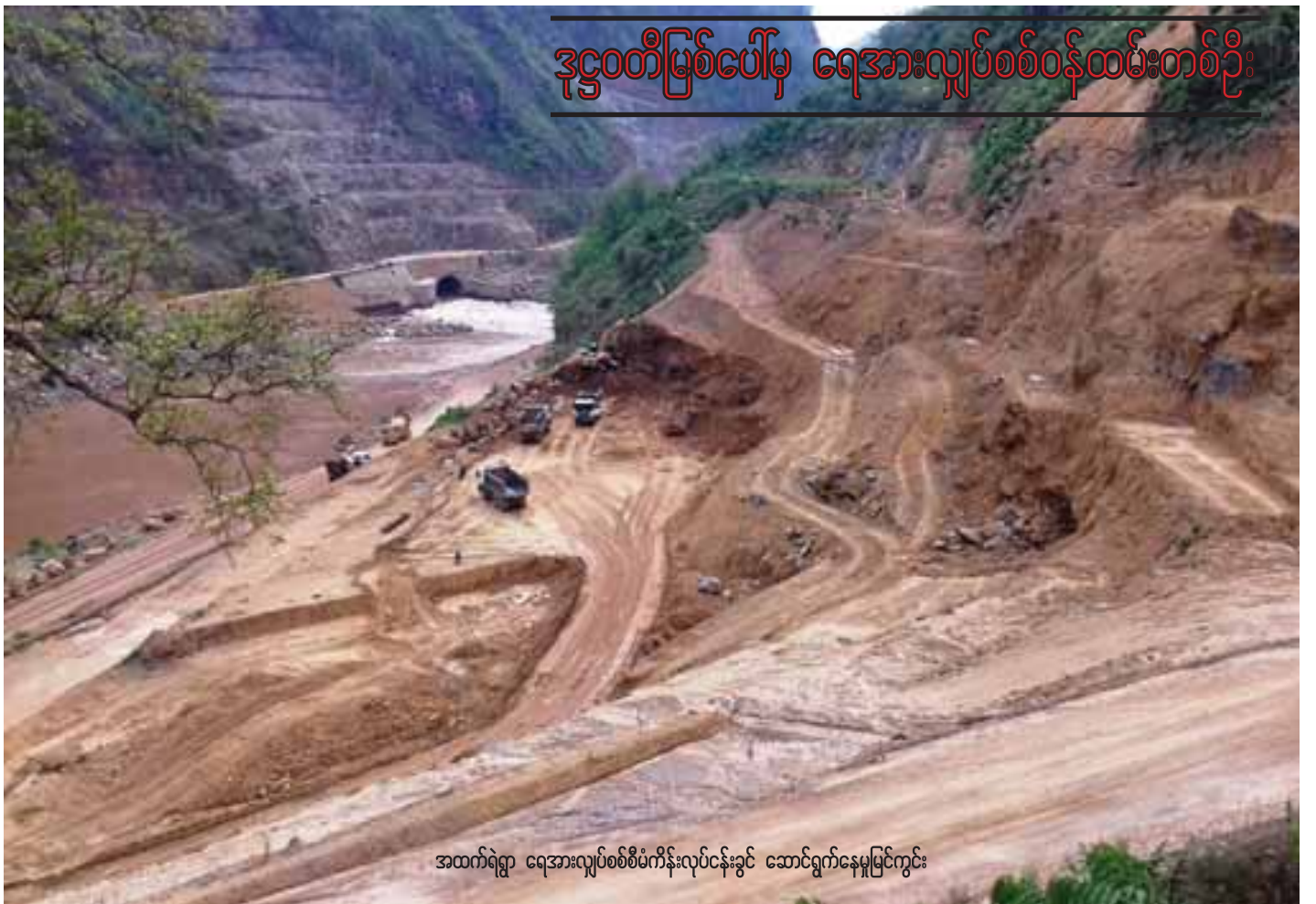
ဒုဌာနတီမြစ်ပေါ်မှ ရေအားလျှပ်စစ်ဝန်ထမ်းတစ်ဦး