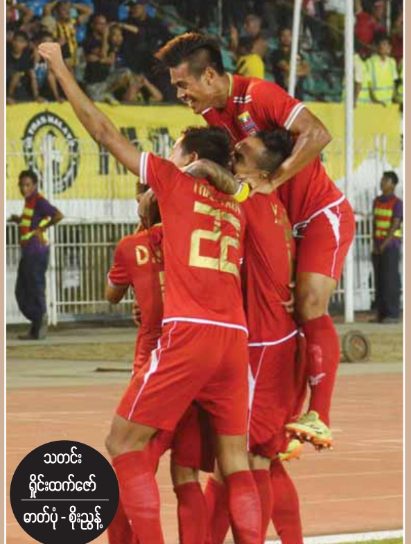
၂၀၁၆ ဆူလူကီးဖလားပြိုင်ပွဲတွင် ဆီမီးဖိုင်နယ်တက်ရောက်သွားသည့် မြန်မာအသင်း။

ရန်ကုန် နိုဝင်ဘာ ၂၇ ၂၀၁၆ အာဆီယံဆူလူကီးဖလားပြိုင်ပွဲ ဆီမီးဖိုင်နယ်ပွဲစဉ်များကို ဒီဇင်ဘာပထမပတ်တွင် စတင်ကျင်းပမည်ဖြစ်ပြီး မြန်မာနှင့်ထိုင်း၊ အင်ဒိုနီးရှားနှင့် ဗီယက်နမ်တို့ တွေ့ဆုံလျက်ရှိသည်။ အုပ်စုပွဲစဉ်များအပြီးတွင် အုပ်စု(က)မှ လက်ရှိချန်ပီယံထိုင်းအသင်း နှင့် အင်ဒိုနီးရှားအသင်း၊ အုပ်စု(ခ)မှ ဗီယက်နမ်အသင်းနှင့် မြန်မာအသင်း တို့ ဆီမီးဖိုင်နယ်သို့ တက်ရောက်ခဲ့သည်။ ဆီမီးဖိုင်နယ်ပွဲစဉ်များကို အိမ်ကွင်း၊ အဝေးကွင်း နှစ်ကျော့စနစ်ဖြင့် ကျင်းပမည်ဖြစ်ပြီး ဒီဇင်ဘာ ၃ ရက်တွင် အင်ဒိုနီးရှားနိုင်ငံ၌ အင်ဒိုနီးရှားအသင်းနှင့် ဗီယက်နမ်အသင်း၊ ဒီဇင်ဘာ ၄ ရက်တွင် ရန်ကုန်မြို့ရှိ သူဝဏ္ဏကွင်း၌ မြန်မာအသင်းနှင့် လက်ရှိချန်ပီယံ ထိုင်းအသင်းတို့ ယှဉ်ပြိုင်တစားမည်ဖြစ်သည်။ ဆီမီးဖိုင်နယ်ဒုတိယအကျော့အဖြစ် ဒီဇင်ဘာ ၇ ရက်တွင် ဗီယက်နမ်နိုင်ငံ၌ ဗီယက်နမ်နှင့် အင်ဒိုနီးရှား၊ ဒီဇင်ဘာ ၈ ရက်တွင် ထိုင်းနိုင်ငံ ဗန်ကောက်မြို့ရှိ ရာဇမင်္ဂလာကွင်း၌ စာမျက်နှာ ၈ ကော်လံ ၄ သို့ ○