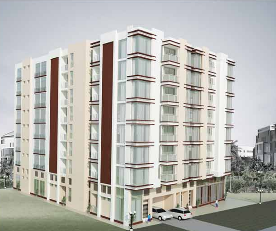
No (9), Panditta Street, (8) Quarter, Hlaing Township, Yangon

Office : No (17), Room 001, Aung Thapayay Street, Tharyargone Quarter, Mingalar Taung Nyunt Township, Yangon, Myanmar Hp : 09-5067138 , 09 - 73208940 , 09 - 796149571 Tel : 01-8619221, 01-200747 Ext : 7329, 09 - 440064458, 09 - 440064459 Fax : 01-8619221