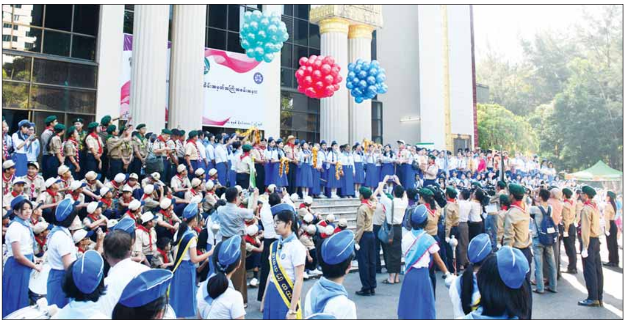
မြန်မာကင်းထောက်ရာပြည့်အထိမ်းအမှတ် အကြံပြုဖွင့်ပွဲကို ရန်ကုန်တက္ကသိုလ် စိန်ရတုခန်းမရွှေတွင် ကျင်းပစဉ်။ (ဇော်မင်းလတ်)