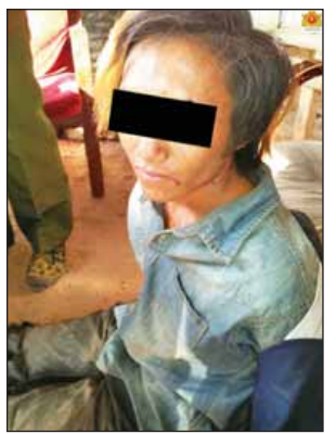
KIA လက်နက်ကိုင်အဖွဲ့မှ တပ်သားအဆင့်ရှိသူ ဝန်မှန်း။

မှု မရှိကြောင်း သိရသည်။ ထို့ပြင် နိုဝင်ဘာ ၂၆ ရက် ည ၈ နာရီခန့်ကလည်း ပန်ခမ်းကျေးရွာမှ မူဆယ်မြို့တက်သို့ ဆိုင်ကယ်နှစ်စီးဖြင့် မောင်းနှင်လာသော အမျိုးသား သုံးဦးသည် ပန်ခမ်းတံတားအလွန် လမ်းဘေးတွင် မိုင်းတစ်လုံးပစ်ချ ဖောက်ခွဲသဖြင့် လုံခြုံရေးတပ်ဖွဲ့ဝင်များက ပစ်ခတ်ရှင်းလင်းရာ ၎င်းဆိုင်ကယ် နှစ်စီးမှာ မူဆယ်မြို့တွင်းသို့ မောင်းနှင်ထွက်ပြေးသွားကြောင်း၊ အဆိုပါပေါက်ကွဲမှုကြောင့် ထိခိုက်ပျက်စီးမှုမရှိကြောင်း၊ ယနေ့ နံနက် ၉ နာရီတွင် လုံခြုံရေးတပ်ဖွဲ့