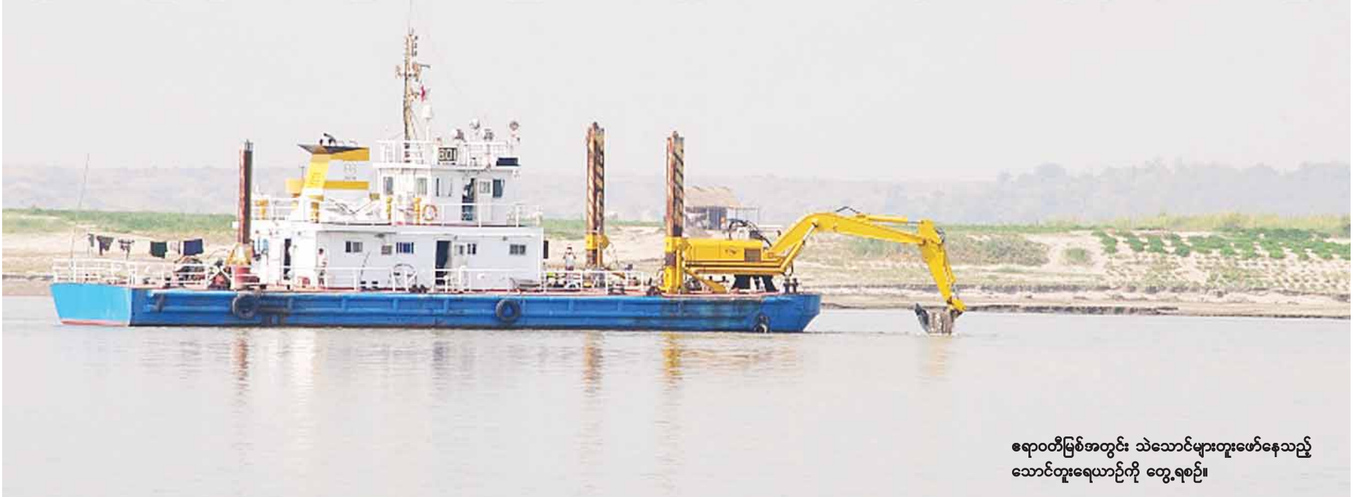
ရောဝတီမြစ်အတွင်း သဲသောင်များတူးဖော်နေသည့် သောင်တူးရေယာဉ်ကို တွေ့ရစဉ်။

မန္တလေး နိုဝင်ဘာ ၂၇ မန္တလေးနှင့် ပုဂံ-ညောင်ဦးသွား ရေလမ်းကြောင်းများသည် နိုင်ငံခြားခရီးသွားပို့ဆောင်ရေးရေယာဉ်များ သွားလာ ခုတ်မောင်းနေသည့်အတွက် ရေလမ်းကြောင်းကောင်းမွန် စေရန် သောင်တူးလုပ်ငန်းများကို ဒီဇင်ဘာလတွင် စတင် ဆောင်ရွက်မည်ဖြစ်ကြောင်း ရေအရင်းအမြစ်နှင့် မြစ်ချောင်းများ ဖွံ့ဖြိုးတိုးတက်ရေးဦးစီးဌာန (ရုံးချုပ်)မှ