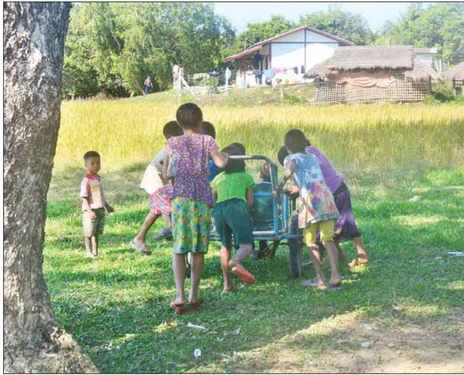
မောင်တောမြောက်ပိုင်းရှိကျေးရွာတစ်ရွာတွင် ကလေးငယ်များအေးချမ်းစွာ ဆော့ကစားနေသည်ကို တွေ့ရစဉ်။

ထိုမှတစ်ဖန် ကျီးကန်းပြင်သို့ ရောက်၏။ ကျီးကန်းပြင်နှင့် မောင်တောမြို့အကြားတွင် ကတ္တရာလမ်းဖြစ်၍ လမ်းပန်းဆက်သွယ်ရေးကောင်း၏။ ကျီးကန်းပြင်မှ ကျော်လွှာ ကျောက်ကြမ်းလမ်းဖြစ်၍ ထင်တိုင်းခရီးမပေါက်ဘဲရှိ၏။ ကျီးကန်းပြင်အရပ်သည် ရဲစခန်း၊ စာသင်ကျောင်း၊ ဆေးပေးခန်းတို့ရှိသဖြင့် ဒေသခံပြည်သူများအတွက် ပညာရေး၊ ကျန်းမာရေးအထိုက်အလျောက် အထောက်အကူပြုနိုင်၏။ ထိုအရပ်တွင် မကြာသေးမီက နေရပ်ရှောင်ပြည်သူများ မိမိတို့နေအိမ်များတွင် စတင်ဝင်ရောက်နေထိုင်လျက်ရှိသည်ကိုလည်း တွေ့ရသည်။ ထို့အတူ အောင်ဇေယျ၊ အောင်မင်္ဂလာ၊ မောင်နှမ၊ အောင်သာယာ အစရှိသော ကျေးရွာများတွင်လည်း ခေတ္တနေရပ်တိမ်းရှောင်ပြည်သူများ ပြန်လည်လာရောက်နေကြပြီဖြစ်သည်။ အိမ်တိုင်းနီးပါးမဟုတ်သော်လည်း အများစုတွေ့နေရပြီဖြစ်သည်။ ဤကျေးရွာများတွင် နေအိမ်များ ပတ်ပတ်လည်တွင် ကွမ်းသီးပင်များ စိုက်ပျိုးထားသဖြင့် နေချင်စဖွယ် ကျေးရွာနေအိမ်များအဖြစ် တွေ့ရ၏။ မေယုတောင်တန်းကြီးကို ကျောထောက်နောက်ခံပြုထားသဖြင့် ကျေးရွာများသည် ပန်းချီကားတစ်ချပ်သဖွယ်သာယာကြည်နူးဖွယ်တွေ့ရ၏။ ဖားဝပ်ချောင်းကျေးရွာတွင်လည်း ကွမ်းသီးပင်အလွန်ပေါ၏။ ဤကျေးရွာအလွန်တွင် ချောင်းငယ်မြောင်းငယ်များ၊ ပုစွန်ကန်များကိုလည်း တွေ့ရ၏။ ငန်းချောင်းကျေးရွာတွင်မူကား စပါးရိတ်၊ စပါးလှေ၊