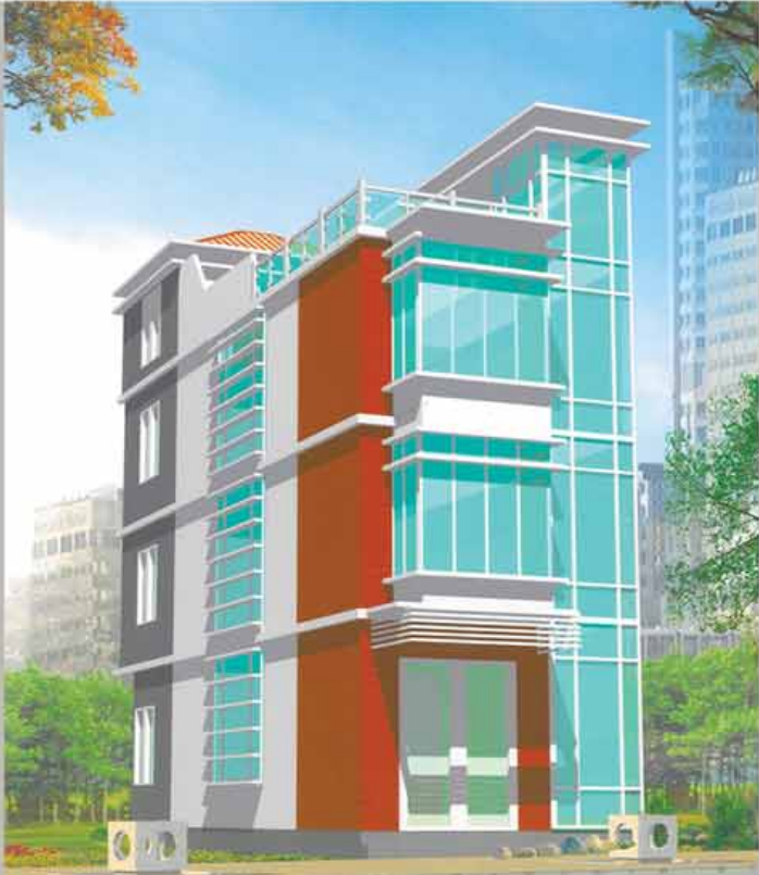
အမှတ် (၁၅/၁၇)၊ ရန်ကုန်-အင်းစိန်လမ်းမကြီးအနီး၊ ဓမ္မသုကျောင်းလမ်း၊ လှိုင်မြို့နယ်။

၃ထပ်ခွဲလုံးချင်းအိမ်သာ တွင်ပါဝင်မည့်ဝန်ဆောင်မှုများမှာ -