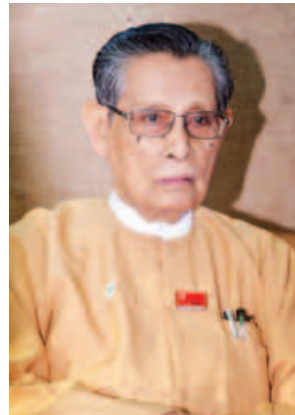
ဦးတင်ဦး (နာယက၊ အမျိုးသားဒီမိုကရေစီအဖွဲ့ချုပ်)