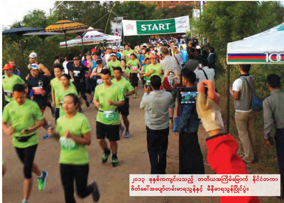
၂၀၁၃ ခုနှစ်ကျင်းပသည့် တတိယအကြိမ်မြောက် နိုင်ငံတကာဖိတ်ခေါ်အပျော်တမ်းမာရသွန်နှင့် မိနီမာရသွန်ပြိုင်ပွဲ။