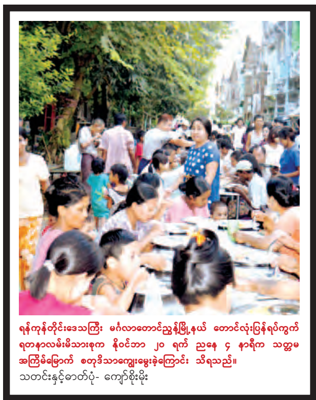
ရန်ကုန်တိုင်းဒေသကြီး မင်္ဂလာတောင်ညွန့်မြို့နယ် တောင်လုံးပြန်ရပ်ကွက် ရတနာလမ်းမိသားစုက နိုဝင်ဘာ ၂၀ ရက် ညနေ ၄ နာရီက သတ္တမအကြိမ်မြောက် စတုဒိသာကျေးမွေးနေ့ကြောင်း သိရသည်။