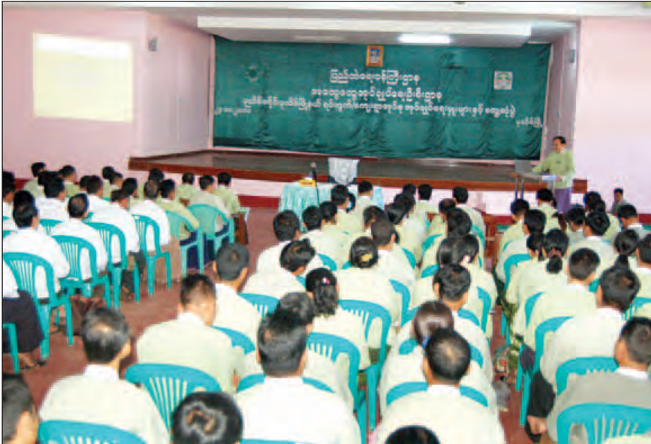
ဥပဒေနှင့်အညီ ဆောင်ရွက်ရေး၊ အနည်းဆုံးတစ်ကြိမ် တွေ့ဆုံ၍ ဒေသတို့အား ဆွေးနွေးမှာကြားခဲ့ကြောင်း သိရသည်။ မြင့်ဟန် (ပြန်/ဆက်)

ပုသိမ် နိုဝင်ဘာ ၂၄ ရောဂါတိုင်းဒေသကြီး အထွေထွေ အုပ်ချုပ်ရေးဦးစီးဌာန တိုင်းအုပ်ချုပ်ရေးမှူး ဦးမောင်မောင်ဆန်းသည် နိုဝင်ဘာ ၂၃ ရက် နံနက် ၁၀ နာရီခွဲတွင် ပုသိမ်ခရိုင် အုပ်ချုပ်ရေးမှူး ဦးလှိုင်ထွန်း၊ ပုသိမ်မြို့နယ် အုပ်ချုပ်ရေးမှူး ဦးဇော်မင်းထွန်း တို့နှင့်အတူ ပုသိမ်မြို့နယ် စုပေါင်းရုံးခန်းမ၌ ပုသိမ်မြို့နယ် အတွင်းရှိ ရပ်ကွက်နှင့် ကျေးရွာအုပ်စု အုပ်ချုပ်ရေးမှူးများ၊ ရပ်ကွက်နှင့် ကျေးရွာအုပ်စု စာရေးဝန်ထမ်းများ စုစုပေါင်း ၁၇၅ ဦးနှင့် တွေ့ဆုံခဲ့သည်။ တွေ့ဆုံပွဲတွင် တိုင်းအုပ်ချုပ်ရေးမှူး ဦးမောင်မောင်ဆန်းက ၂၀၁၂ ခုနှစ် ရပ်ကွက် (သို့မဟုတ်) ကျေးရွာအုပ်စု အုပ်ချုပ်ရေးဥပဒေအား အကျယ်တဝင့် ရှင်းလင်းဆွေးနွေးခဲ့ပြီး အုပ်ချုပ်ရေးဆိုင်ရာ ကိစ္စများအား