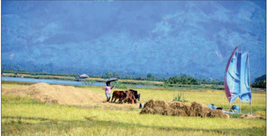
မောင်တောမြို့နယ်ရှိ စပါးများ မြေလှေ့နေသည်ကို တွေ့ရစဉ်။