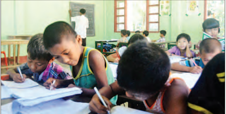
ဥဒေါင်းစံပြကျေးရွာတွင် စာသင်ကြားနေသော ကလေးငယ်များကို တွေ့ရစဉ်။

မောင်တောတောင်ပိုင်းဒေသများ သည် လမ်းပန်းဆက်သွယ်ရေးနှင့် စီးပွားရေး အတော်အသင့်ကောင်း မွန်ပြီး အေးချမ်းစွာနေထိုင်လျက်ရှိ သည်ကို မြင်တွေ့ခဲ့ရပါကြောင်း ရေးသားတင်ပြလိုက်ရပါသည်။ သတင်းဆောင်းပါး - ရဲခေါင်ညွန့်