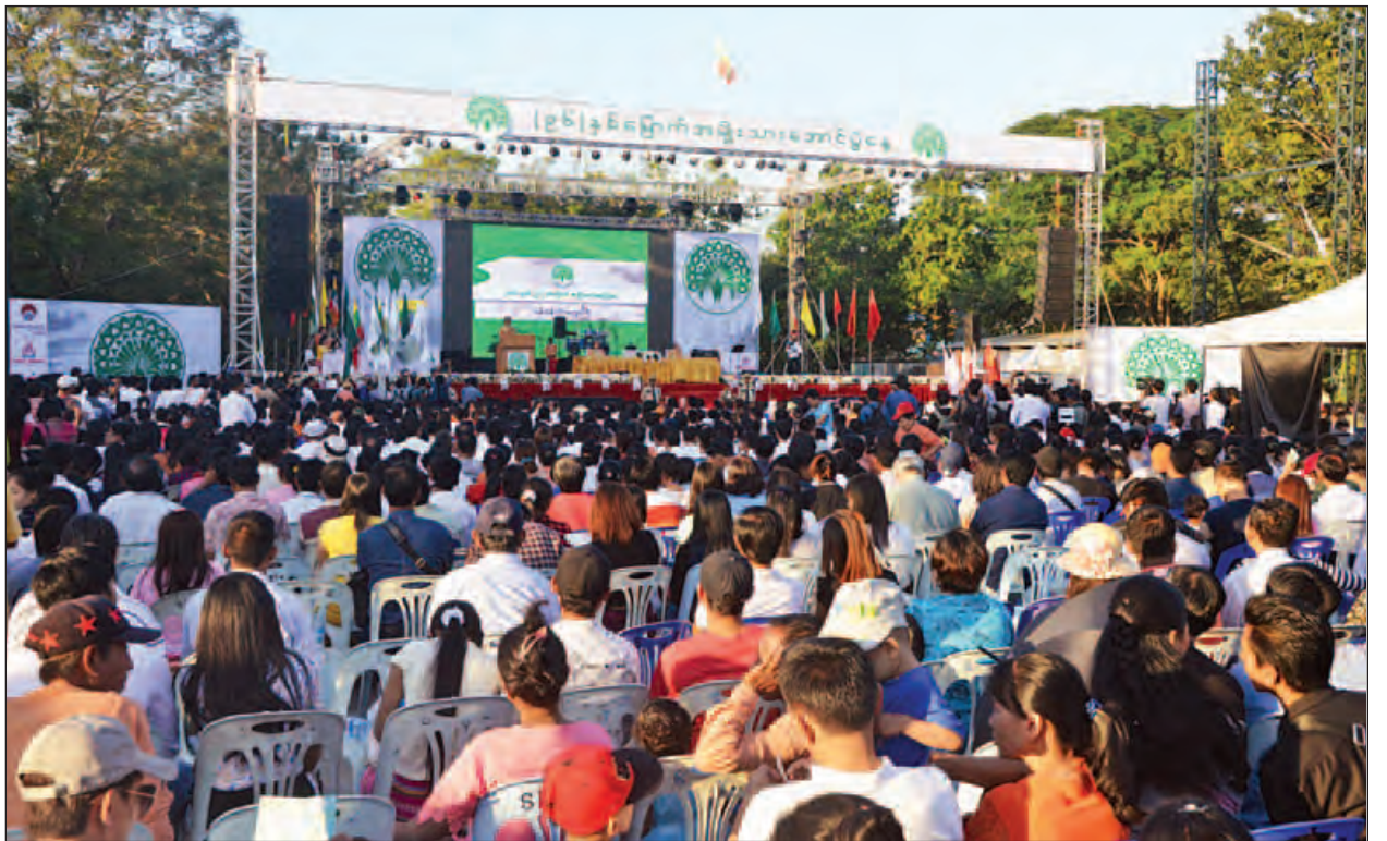
(၉၆)နှစ်မြောက် အမျိုးသားအောင်ပွဲနေ့ အခမ်းအနားကို ရန်ကုန်မြို့၊ ပြည်လမ်းရှိ ပြည်သူ့ရင်ပြင်၌ ကျင်းပစဉ်။