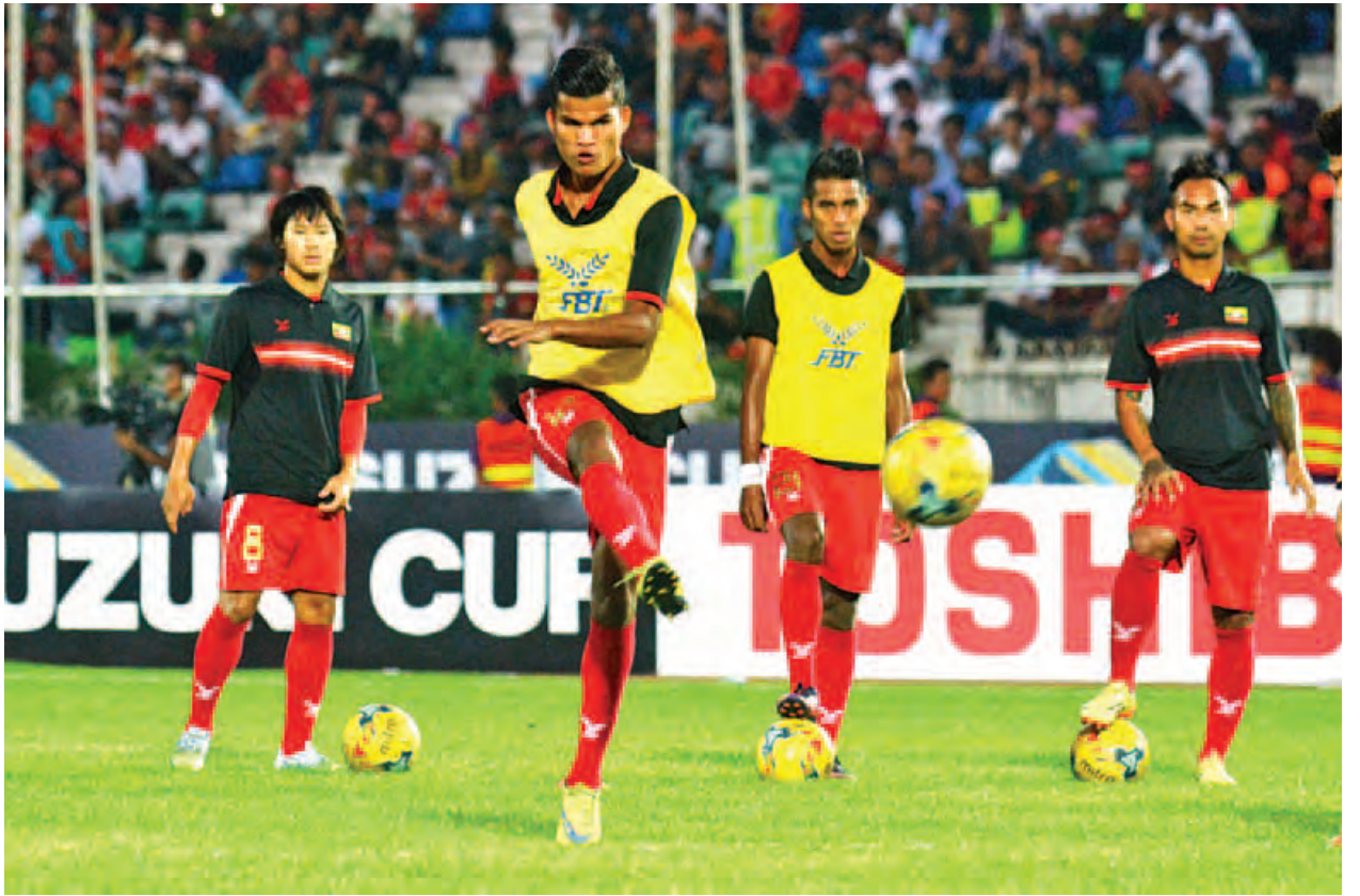
အာဆီယံဆူဂူကီးပလားပြိုင်ပွဲတွင် ဆီမီးဖိုင်နယ်တက်ရောက်ရန် အခွင့်အရေးရှိနေသည့် မြန်မာအသင်း။