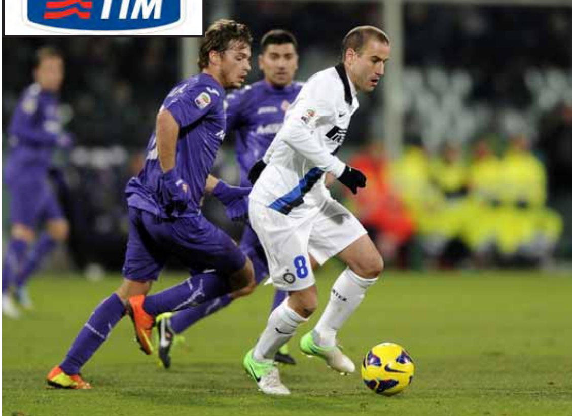
အီတလီစီးရီးအေသင်းများ ရပ်တည်မှု အမှတ်ပေးဇယား