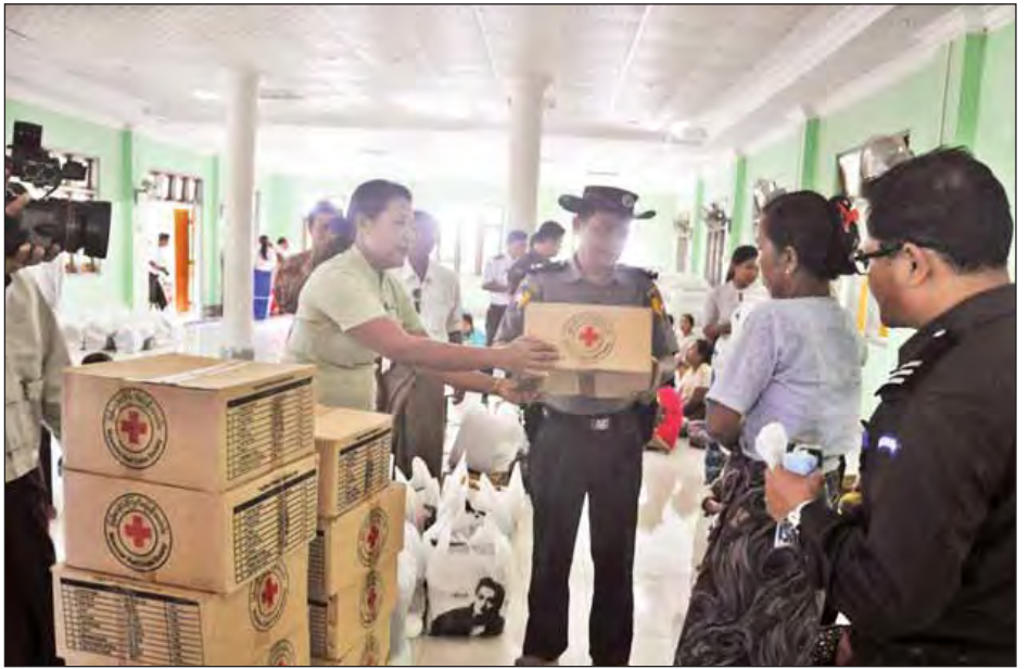
UNICEF၊ UNHCR၊ ICRC အစရှိသော နိုင်ငံတကာ အဖွဲ့အစည်းအသီးသီးက လူသားချင်းစာနာမှုဆိုင်ရာ အကူအညီများပေးနိုင်ရန် ပြည်နယ်အစိုးရက ဝင်ရောက် ခွင့်ပြုထားကြောင်း သိရသည်။ သတင်း-မြင့်မောင်စိုး

ထို့အပြင် ကုလသမဂ္ဂအဖွဲ့အစည်းများက နိုင်ငံတကာ အကူအညီများ၊ ကျန်းမာရေးစောင့်ရှောက်မှုများအပါ အဝင် ရေရရှိရေး၊ ကျောင်းသားလူငယ်များ စောင့်ရှောက် ရေးကိစ္စဆောင်ရွက်နိုင်ရန် ခွင့်ပြုပေးခဲ့ကြောင်း ပြည်နယ် အတွင်းရေးမှူးထံမှ သိရသည်။ သို့ရာတွင် မောင်တောဒေသသို့ နိုင်ငံတကာအကူ အညီပေးရေးအဖွဲ့များ ဝင်ရောက်ခွင့်ပြုသည်ဆိုသော်လည်း မောင်တောမြို့ပေါ် အထိသာ ခွင့်ပြုထားကြောင်း မောင်တောမြောက်ပိုင်းကျေးရွာများအထိ ဝင်ရောက်ခွင့်ပြု နိုင်ရန် ဒေသအာဏာပိုင်များနှင့် ချိတ်ဆက်ဆောင်ရွက်ရန် လိုအပ်ကြောင်း၊ လောလောဆယ်အခြေအနေတွင် နိုင်ငံ တကာဝန်ထမ်းများ မောင်တောမြောက်ပိုင်းကျေးရွာများ သို့ ဝင်ရောက်အကူအညီပေးနိုင်ရန် အခြေအနေရှုပ်ထွေး လာနိုင်သည့်အတွက် ခွင့်မပြုသေးကြောင်း ဒေသခံဝန်ထမ်း များမှတစ်ဆင့် လူသားချင်းစာနာမှုဆိုင်ရာ အကူအညီများ ပေးနိုင်ရန်ခွင့်ပြုထားကြောင်း ပြည်နယ်အတွင်းရေးမှူး ဦးခင်မောင်ဆွေက ပြောသည်။ လက်ရှိအချိန်တွင် မောင်တောဒေသသို့ WFP