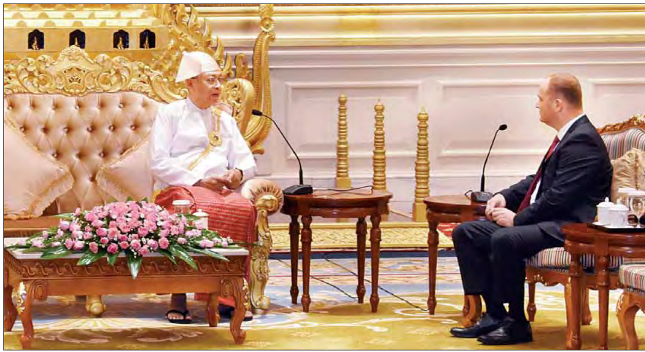
နိုင်ငံတော်သမ္မတ ဦးထင်ကျော် မြန်မာနိုင်ငံဆိုင်ရာ အက်စ်တိုးနီယားနိုင်ငံ သံအမတ်ကြီးအား လက်ခံတွေ့ဆုံစဉ်။ (သတင်းစဉ်)

နေပြည်တော် နိုဝင်ဘာ ၂၀ ပြည်ထောင်စုသမ္မတမြန်မာနိုင်ငံတော် နိုင်ငံတော်သမ္မတ ဦးထင်ကျော်ထံ ပြည်ထောင်စုသမ္မတမြန်မာနိုင်ငံတော်ဆိုင်ရာ အက်စ်တိုးနီယားနိုင်ငံ သံအမတ်ကြီးအဖြစ် ခန့်အပ်ရန်သဘောတူညီပြီးဖြစ်သော သံအမတ်ကြီး မစ္စတာ ရီဟို ခရစ် သည် ယနေ့ နံနက် ၁၀ နာရီတွင်လည်းကောင်း၊ ဖင်လန် နိုင်ငံ သံအမတ်ကြီးအဖြစ်ခန့်အပ်ရန် သဘောတူညီပြီးဖြစ်သည့် သံအမတ်ကြီး