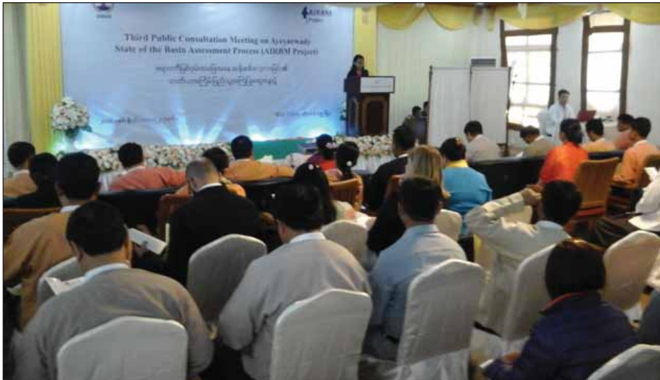
ပြည်ပျိုးတိန်ထံမှ သိရသည်။

ရေအားလျှပ်စစ်ထုတ်လုပ်ခြင်း စိုက်ပျိုးရေးရရှိမှု ရေ အရည်အသွေး၊ သဘာဝပတ်ဝန်းကျင်သဘာဝအခြေပြု ခရီးသွားလာရေးကုန်ကျစရိတ် သက်သာသည့်ရေကြောင်း ပို့ဆောင်ရေးစသည့် ရေနှင့်သက်ဆိုင်သော ကဏ္ဍအားလုံး ကောင်းမွန်စွာစီမံခန့်ခွဲပြီး ဆင်းရဲမဲ့လျှော့ချနိုင်စေရန် ရည်ရွယ်၍ စီမံကိန်းကို ရေးဆွဲခြင်းဖြစ်ကြောင်း စီမံကိန်း Stakeholders Forum Coordinato မဒေါ်မေရတနာ