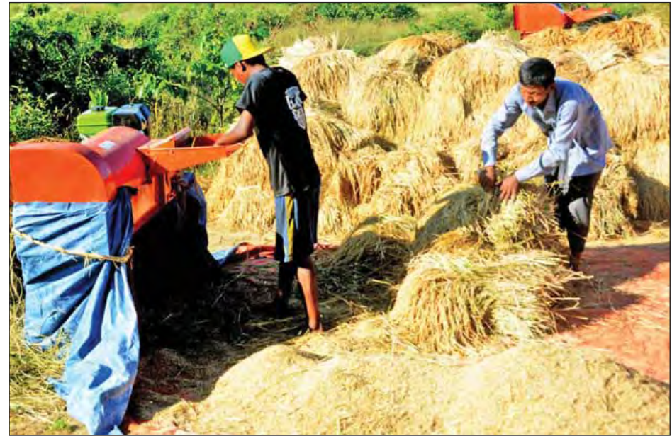
ရခိုင်လူမှုစီးပွားတိုးတက်ရေးအဖွဲ့ (ART) အခမဲ့ စက်ဖြင့် စပါးခြွေလှေ့ပေးနေသည်ကို တွေ့ရစဉ်။

သတင်း-မောင်စိန်လွင်နှင့်အဖွဲ့