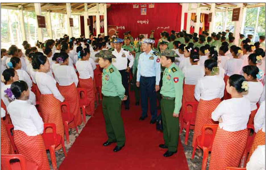
များနှင့် နယ်ခြားစောင့်ရဲတပ်ဖွဲ့ဝင်များအတွက် စားသောက် ဖွယ်ရာများပေးအပ်ပြီး နယ်ခြားစောင့်ရဲတပ်ဖွဲ့ခွဲအတွင်း မော်တော်ယာဉ်များဖြင့် လှည့်လည်ကြည့်ရှုစစ်ဆေး ခဲ့ကြောင်း သတင်းရရှိသည်။ (မြဝတီ) ဒုတိယတပ်မတော်ကာကွယ်ရေးဦးစီးချုပ် ကာကွယ်ရေး ဦးစီးချုပ်ကြီး(ကြည်း) ဒုတိယဗိုလ်ချုပ်မှူးကြီးစိုးဝင်း မြောက်ဦးတပ်နယ်မှ အရာရှိ၊ စစ်သည်မိသားစုများအား တွေ့ဆုံစဉ်။ (သတင်းစဉ်)

အရာရှိ၊ စစ်သည်မိသားစုများအတွက် စားသောက်ဖွယ်ရာ များနှင့် ချီးမြှင့်ငွေများပေးအပ်ပြီး ဒုတိယဗိုလ်ချုပ်ကြီး အောင်ကျော်ဇောနှင့် ကာကွယ်ရေးဦးစီးချုပ်ရုံးမှ တပ်မတော်အရာရှိကြီးများက အရာရှိ၊ စစ်သည် မိသားစု များအတွက် အားကစားပစ္စည်းများနှင့် သူတ၊ ရသေ့ စာအုပ် စာစောင်များ ပေးအပ်သည်။ တွေ့ဆုံပွဲများအပြီးတွင် ဒုတိယတပ်မတော် ကာကွယ်ရေးဦးစီးချုပ်နှင့်အဖွဲ့ဝင်များသည် တက်ရောက် လာကြသည့် တပ်နယ်များမှ အရာရှိ၊ စစ်သည် မိသားစု များအား ရင်းရင်းနှီးနှီး လိုက်လံနှုတ်ဆက်သည်။ ထို့နောက် ဒုတိယတပ်မတော်ကာကွယ်ရေးဦးစီးချုပ် နှင့် အဖွဲ့ဝင်များသည် မွန်လွဲပိုင်းတွင် ရဟတ်ယာဉ်များဖြင့် အမှတ်(၄) နယ်ခြားစောင့်ရဲတပ်ဖွဲ့ခွဲ အလယ်သံကျော်သို့ ရောက်ရှိရာ အစည်းအဝေးခန်းမ၌ တာဝန်ရှိသူများက နယ်မြေလုံခြုံရေးဆောင်ရွက်ထားရှိမှုအခြေအနေများကို ရှင်းလင်းတင်ပြရာ ဒုတိယတပ်မတော်ကာကွယ်ရေး ဦးစီးချုပ်က အလယ်သံကျော်နှင့် ပင်လယ်ကမ်းခြေဒေသ လုံခြုံရေးဆောင်ရွက်ထားမှုအခြေအနေများကို ပေါင်းစပ် ညှိနှိုင်းဆောင်ရွက်ပေးခြင်းနှင့် ရည်မှန်းချက်တာဝန်များ ချမှတ်ပေးခြင်းတို့ကို ဆောင်ရွက်ပေးသည်။ ဆက်လက်၍ ဒုတိယတပ်မတော်ကာကွယ်ရေး ဦးစီးချုပ် ကာကွယ်ရေးဦးစီးချုပ်ကြီး(ကြည်း)က နယ်မြေလုံခြုံ ရေးတာဝန်ထမ်းဆောင်လျက်ရှိသည့် အရာရှိ၊ စစ်သည်