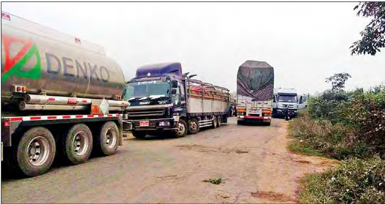
ပြည်သူများအသုံးပြုသွားလာနေသည့်လမ်းအား TNLA အကြမ်းဖက်သောင်းကျန်းသူများက လမ်းကြောင်းပိတ်ဆို့ထားသည်ကို တွေ့ရစဉ်။