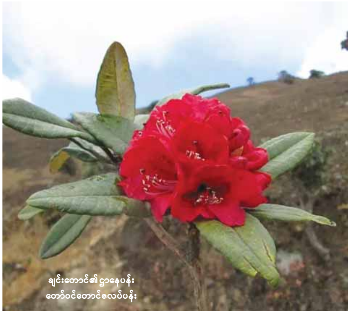
ချင်းတောင်၏ ဌာနပန်း၊ တော်ဝင်တောင်လေပိပန်း