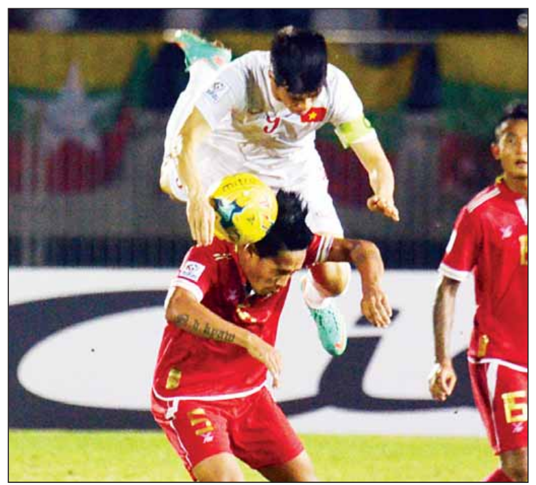
မြန်မာနှင့် ဖိလစ်ပိုင်အသင်းတို့ ဆူလူးကီးပြိုင်ပွဲအုပ်စုပွဲပွဲ၌ တွေ့ဆုံခဲ့စဉ်။

ရန်ကုန် နိုဝင်ဘာ ၂၀ ၂၀၁၆ အာဆီယံဆူလူးကီးဖလားပြိုင်ပွဲအုပ်စု ဒုတိယနေ့ပွဲစဉ်များကို မြန်မာနှင့်ဖိလစ်ပိုင်နိုင်ငံ၌ ဆက်လက်ကျင်းပမည်ဖြစ်ပြီး လက်ရှိချန်ပီယံထိုင်းအသင်းမှာ ယခုပွဲအနိုင်ရပါက ဆီမီးဖိုင်နယ်သို့ တက်ရောက်မည်ဖြစ်သလို အိမ်ရှင်မြန်မာအသင်းမှာ ကမ္ဘောဒီးယားအသင်းနှင့် ထပ်မံယှဉ်ပြိုင်ရ မည်ဖြစ်သည်။ အုပ်စုဒုတိယနေ့ပွဲစဉ်အဖြစ် နိုဝင်ဘာ ၂၂ ရက်တွင် မြန်မာစံတော်ချိန် ညနေ ၃ နာရီတွင် လက်ရှိချန်ပီယံထိုင်းအသင်းနှင့် စင်ကာပူအသင်း၊ မြန်မာစံတော်ချိန် ညနေ ၆ နာရီတွင် အိမ်ရှင်ဖိလစ်ပိုင်အသင်းနှင့် အင်ဒိုနီးရှားအသင်းတို့ ယှဉ်ပြိုင်ကစားမည်ဖြစ်သည်။ အုပ်စု(က) ပထမနေ့တွင် ထိုင်းအသင်းက အင်ဒိုနီးရှားအသင်းကို လေးဂိုး-နှစ်ဂိုးဖြင့်အနိုင်ရပြီး ဖိလစ်ပိုင်နှင့် စင်ကာပူအသင်းတို့မှာ ဂိုးမရှိသရေကျခဲ့သည်။ ပထမနေ့အပြီးတွင် ထိုင်းအသင်းက သုံးမှတ်၊ ဖိလစ်ပိုင်နှင့် စင်ကာပူအသင်းတို့က တစ်မှတ်စီ၊ အင်ဒိုနီးရှားအသင်းက အမှတ်မရသေးပေ။ ထိုင်းအသင်းသည် စင်ကာပူအသင်းနှင့် ယနေ့ကစားရမည်ဖြစ်ပြီး နိုင်ပွဲရခဲ့ပါက အုပ်စုပွဲစဉ် မကုန်မီ ဆီမီးဖိုင်နယ်သို့ တက်ရောက်ခွင့်ရမည်ဖြစ်သည်။ အိမ်ရှင်ဖိလစ်ပိုင်၊ ချန်ပီယံထိုင်း၊ စင်ကာပူနှင့် အင်ဒိုနီးရှားတို့အတွက်လည်း စာမျက်နှာ ၉ ကော်လံ ၅ သို့ ✽