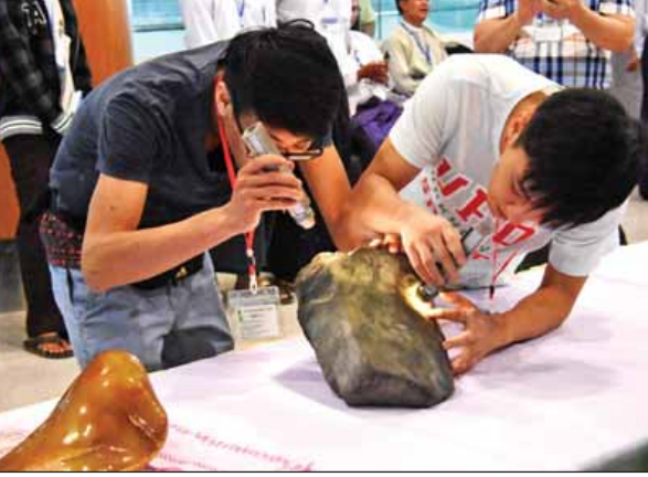
ရတနာကုန်သည်များ ကျောက်စိမ်းအတွဲများအား ကြည့်ရှုရွေးချယ်နေကြစဉ်။ (သတင်းစဉ်)

ပြပွဲဒုတိယနေ့တွင် နံနက်ပိုင်းမှစ၍ ပြည်တွင်း ပြည်ပမှ ရတနာကုန်သည်များသည် အိတ်ဖွင့်တင်ဒါစနစ်၊ ဈေးပြိုင်စနစ်တို့ဖြင့် ရောင်းချရန် သတ်မှတ်ဧရိယာအလိုက် ခင်းကျင်းပြသထားသည့် ကျောက်မျက်အတွဲပေါင်း ၄၃၉