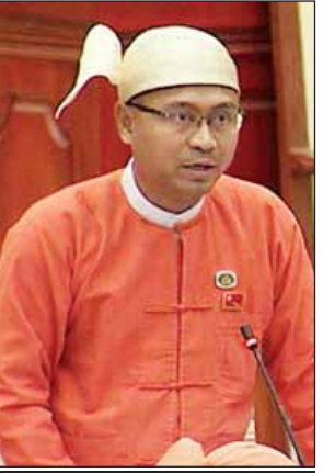
ဘီးလင်းမဲဆန္ဒနယ်မှ ဦးတင်ကိုဦး

ကျေးလက်ဒေသ အခြေခံပညာ ကျောင်းအချို့တွင် မီးဖွားခွင့်ယူသည့် ဆရာ ဆရာမများရှိပါက သင်ကြားရေး တာဝန်ပျက်ကွက်မှုမရှိစေရန် သက်ဆိုင်ရာ မြို့နယ်ပညာရေးမှူးများက နီးစပ်ရာကျောင်းများအနက် ဆရာ ဆရာမအရေအတွက်လုံလောက်စွာရှိသည့် ကျောင်းများမှ ဆရာ ဆရာမများကို လည်းကောင်း၊ ကျောင်းသား ကျောင်းသူ အရေအတွက်နည်းပြီး ဆရာ ဆရာမ ပိုနေသည့်ကျောင်းများမှ ဆရာ ဆရာမများကိုလည်းကောင်း တွဲဖက်တာဝန်ပေးအပ်၍ ဖြေရှင်းဆောင်ရွက်လျက် ရှိကြောင်း ဖြေကြားသည်။