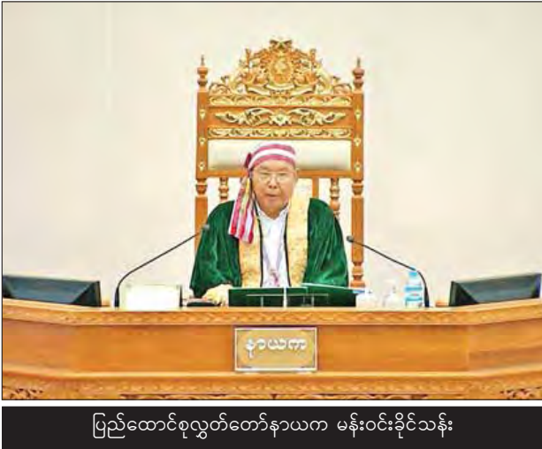
ပြည်ထောင်စုလွှတ်တော်နာယက မန်းဝင်းခိုင်သန်း

နိုင်ငံတော်သမ္မတထံမှ ပေးပို့ထားသော ဘင်းမိမိတက်အဖွဲ့ဝင်နိုင်ငံများ အကြား ဓာတ်အားကွန်ရက်အချင်းချင်း ချိတ်ဆက်ကုန်သွယ်နိုင်ရေးဆိုင်ရာ နားလည်မှု စာချွန်လွှာကို မြန်မာနိုင်ငံမှ ပါဝင်လက်မှတ်ရေးထိုးရန်ကိစ္စနှင့် စပ်လျဉ်း၍ လျှပ်စစ်နှင့်စွမ်းအင်ဝန်ကြီးဌာန ပြည်ထောင်စုဝန်ကြီး ဦးဖေဖေထွန်းက ဘင်းမိမိတက်အဖွဲ့ဝင်နိုင်ငံများအကြား နိုင်ငံဖြစ်ကြောင်း ဓာတ်အားကွန်ရက် ချိတ်ဆက်ကုန်သွယ်နိုင်ရေးဆိုင်ရာ နားလည်မှုစာချွန်လွှာအရ အဖွဲ့ဝင်နိုင်ငံများ၏ ဓာတ်အားကွန်ရက်များချိတ်ဆက်မှုနှင့် ရောင်းဝယ်မှုများကို အကောင်အထည်ဖော်နိုင်ရေး စီမံချက်ရေးဆွဲခြင်း၊ အကောင်အထည်ဖော်ခြင်းနှင့် ထိန်းသိမ်းမောင်းနှင်ခြင်းကဏ္ဍတို့တွင် ပူးပေါင်းဆောင်ရွက်ရန်၊ ကုန်ကျစရိတ်များကို အပြည့်အဝကာမိစေပြီး အကျိုးအမြတ် မျှဝေခံစားနိုင်စေရန်၊ အဖွဲ့ဝင်နိုင်ငံများသို့ ယုံကြည်စိတ်ချရသော စီးပွားရေးတွက်ခြေကိုက်မှုရှိသည့် လျှပ်စစ်ဓာတ်အားပို့လွှတ်မှုရရှိရန်၊ ဓာတ်အားခနှုန်းထားဆိုင်ရာ မူဘောင်ပေါ်ထွန်းလာစေရန်နှင့် လျှပ်စစ်ဓာတ်အား ကုန်သွယ်မှုတိုးမြှင့်ဆောင်ရွက်နိုင်ရေးအတွက် ပူးပေါင်းဆောင်ရွက်မှုလမ်းကြောင်း ဖွင့်လှစ်ရန် ရည်ရွယ်ဆောင်ရွက်ခဲ့ခြင်း