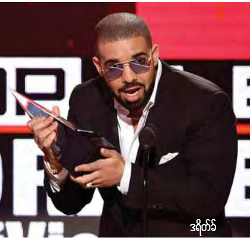
ဒရိုက်ခဲ