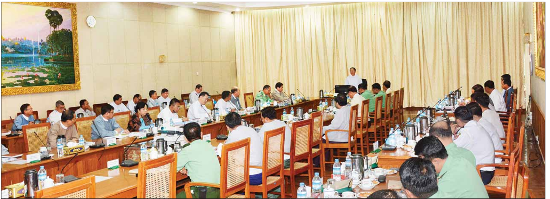
(၆၉)နှစ်မြောက် လွတ်လပ်ရေးနေ့ကျင်းပရေး ဒုတိယအကြိမ် ညှိနှိုင်းအစည်းအဝေးတွင် ဗဟိုကော်မတီဥက္ကဋ္ဌ ဒုတိယသမ္မတ ဦးမြင့်ဆွေ အမှာစကားပြောကြားစဉ်။ (သတင်းစဉ်)