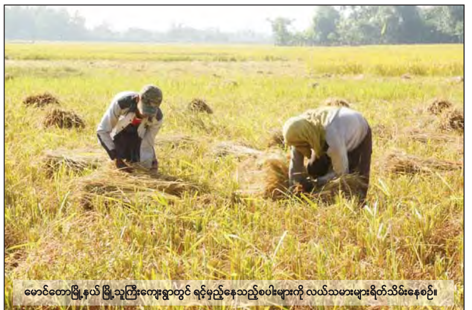
မောင်တောမြို့နယ် မြို့သူကြီးကျေးရွာတွင် ရင့်မှည့်နေသည့်စပါးများကို လယ်သမားများရိတ်သိမ်းနေစဉ်။