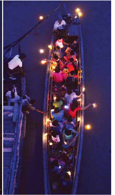
ရှင်ဥပဂုတ္တမထေရ်မြတ်ဖောင်တော် ဒေသစာရီ ကြွချီစဉ်(ဝဲပုံ)နှင့် မီးကြာခွက်များ မီးမျှောပူဇော်ကြစဉ်(ယာပုံ)။