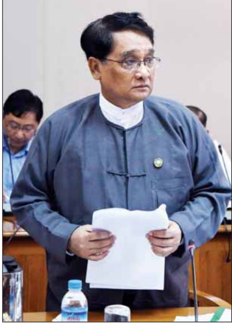
မြန်မာအထူး စီးပွားရေးဇုန် ဗဟိုလုပ်ငန်းအဖွဲ့ ဥက္ကဋ္ဌ စီးပွားရေး နှင့် ကူးသန်း ရောင်းဝယ်ရေး ဝန်ကြီးဌာန ပြည်ထောင်စု ဝန်ကြီး ဒေါက်တာ သန်းမြင့် ရှင်းလင်း တင်ပြစဉ်။