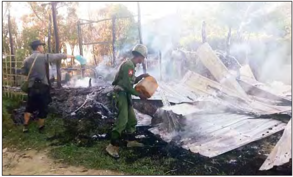
အကြမ်းဖက်စီးနင်းတိုက်ခိုက်သူများ မီးရှို့ဖျက်ဆီးသွားသည့် နေအိမ်များအား တပ်မတော်သားများနှင့် နယ်ခြားစောင့်ရတပ်ဖွဲ့ဝင်များက ဝိုင်းဝန်းမီးငြိမ်းသတ်နေစဉ်။

မဒေါက်မြို့မှ ညောင်လေးပင်မြို့နယ် မဒေါက် မြို့တန်ဆောင်တိုင်ကာလ မီးမျှော ပူဇော်ပွဲသည် မြန်မာနိုင်ငံရှိ ပွဲတော် များအနက် အနယ်နယ်အရပ်ရပ်မှ ဧည့်ပရိသတ်များ စုဝေးလာရောက် ကြသည့် ဒေသတွင်းပွဲတော်တစ်ခုဖြစ် သည်။ (ခွန်ဆက်နေ)