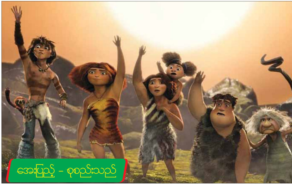
အေးပြည့် - စုစည်းသည်