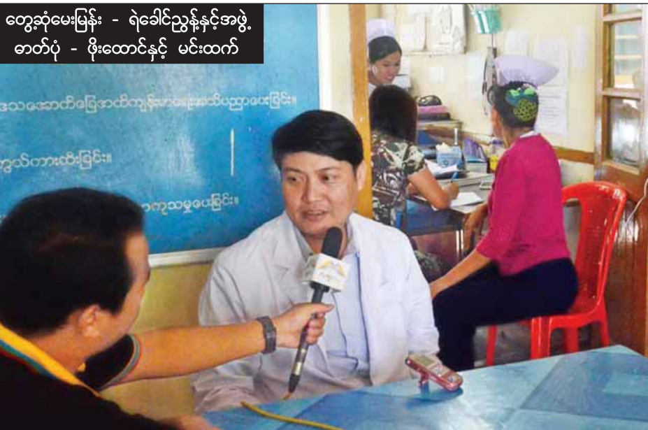
တွေ့ဆုံမေးမြန်း - ရဲခေါင်ညွန့်နှင့်အဖွဲ့

“ကျန်းမာရေးဝန်ဆောင်မှုအနေနဲ့ ၂၄ နာရီလုံး ဆေးရုံမှာ ဆရာဝန်ရော၊ ဆရာမတွေရော တာဝန်ချထား ပေးပါတယ်။ လက်ထောက် ဆရာဝန်လေးယောက်ကတော့ တစ်ရက်ခြားစီတာဝန်ယူပါတယ်။ ကျွန်တော်တို့ကတော့ သူတို့ခေါ်တာနဲ့ အမြဲတမ်းလာကြည့်ပါတယ်။ သမားတော် ကလည်း နေ့စဉ်လာပါတယ်။ ညဘက်လိုရင်လည်း လာပါတယ်။ နောက်ဆေးဝါးကလည်း ကျွန်တော်တို့ ဝန်ကြီး ဌာနက ချပေးတဲ့ ဆေးဝါးတွေရှိပါတယ်။ အဲဒီထက်ပိုပြီး လိုအပ်ရင် ကျွန်တော်တို့ဆီမှာ မရှိရင်တော့ အပြင်က ဝယ်ခိုင်းတာမျိုးရှိပါတယ်။ ဒါကလည်း မဖြစ်မနေသုံးဖို့ လိုအပ်မှပါ။ ဘယ်လိုလူနာဆို လက်ခံကုသပေးနေပါတယ်။ အကြမ်းဖက်မှု ဖြစ်စဉ်တွေရှိပေမယ့် တစ်လျှောက်လုံးမှာလည်း ၂၄ နာရီ အချိန်ပြည့် ဖွင့်ထားပါတယ်။ အမြဲတမ်းဝန်ဆောင်မှုပေးနေပါတယ်။ ဆေးရုံကို မပိတ်