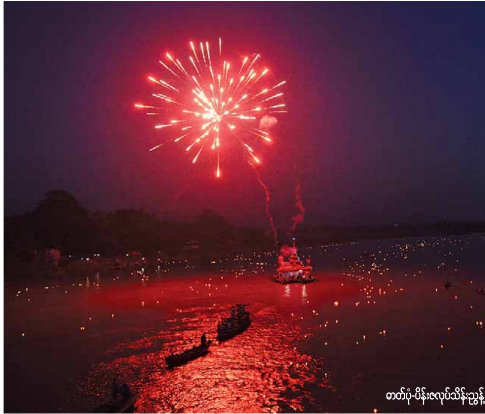
တက်ပုံ-ပိန်းလုပ်သိန်းညွန့်