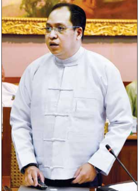
သီလဝါအထူး စီးပွားရေးဇုန် စီမံခန့်ခွဲမှု ကော်မတီဥက္ကဋ္ဌ ဒေါက်တာ ဆက်အောင် သီလဝါအထူး စီးပွားရေးဇုန် ဆိုင်ရာကိစ္စရပ် များအား ရှင်းလင်း တင်ပြစဉ်။