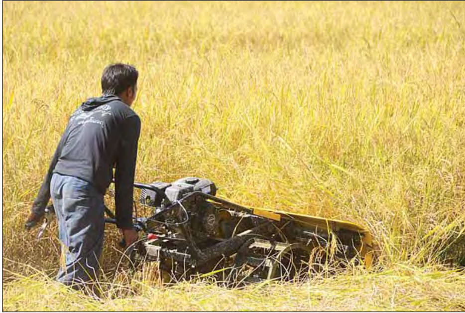
မောရဝတီကျေးရွာတွင် စက်ဖြင့် စပါးရိတ်သိမ်းနေစဉ်။