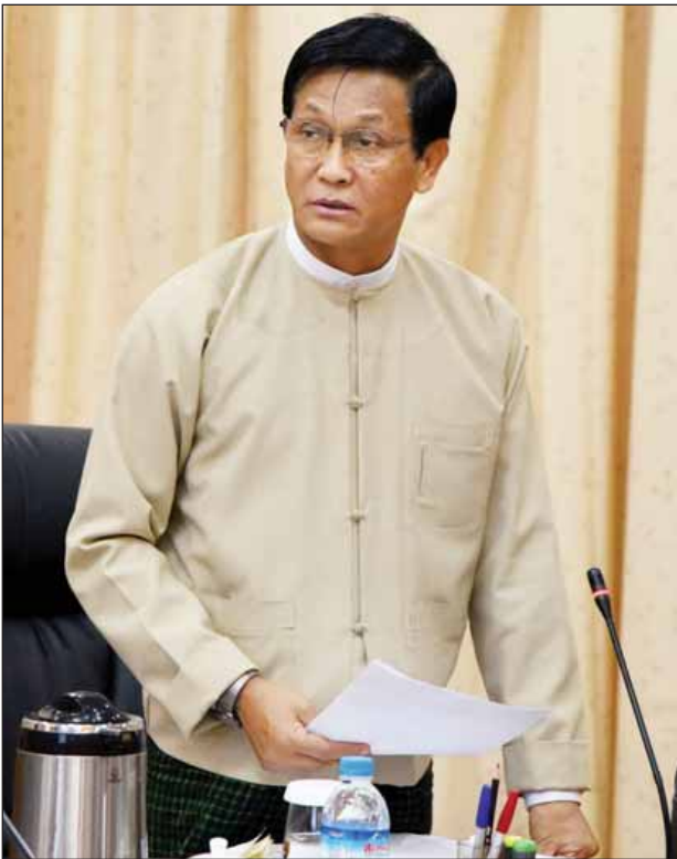
မြန်မာအထူးစီးပွားရေးဇုန်ဗဟိုအဖွဲ့ဥက္ကဋ္ဌ ဒုတိယသမ္မတ ဦးဟင်နရီဗန်ထီးယူ အမှာစကားပြောကြားစဉ်။

ကမ္ဘာ့ကုလသမဂ္ဂ၏ ဖွံ့ဖြိုးတိုးတက်မှု ရည်မှန်းချက်များ အောင်မြင်မှုရရန် စီးပွားရေးဖွံ့ဖြိုးမှုများ ဖွံ့ဖြိုးတိုးတက်မှုသည် များစွာအရေးကြီးပါကြောင်း၊ ယခု ရေတိုအတွင်း ဖြစ်မြောက်အောင် လုပ်ကိုင်ရမည့်ကိစ္စသည် အလုပ်အကိုင် အခွင့်အလမ်းဖြစ်ပါကြောင်း၊ အလုပ်အကိုင်မရှိခြင်းသည် မိမိတို့နိုင်ငံ၏ စီးပွားရေးဖွံ့ဖြိုးတိုးတက်မှုသာမက လူသားများ၏ အကျင့်စာရိတ္တကို ပျက်စီးစေပါကြောင်း၊ အကျင့်စာရိတ္တမကောင်းပါက မည်သို့မျှ ဖွံ့ဖြိုးတိုးတက်သည့် နိုင်ငံကိုထူထောင်နိုင်မည်မဟုတ်ပါကြောင်း၊ ပြည်သူ့လူထုအတွက် ပညာရေးနှင့် ကျန်းမာရေးစနစ်ကို ပြည့်ပြည့်စုံစုံပံ့ပိုးပေးနိုင်ရန် ငွေကြေးတောင့်တင်းရေးသည် အရေးကြီးပါကြောင်း၊ မိမိတို့ပြည်သူများ ဖူဖူလုံလုံ ပြည့်ပြည့်စုံစုံ ဖြစ်အောင် အချိန်တိုအတွင်းရောက်ရှိအောင် ဆောင်ရွက်ရမည်ဖြစ်ပါကြောင်း။