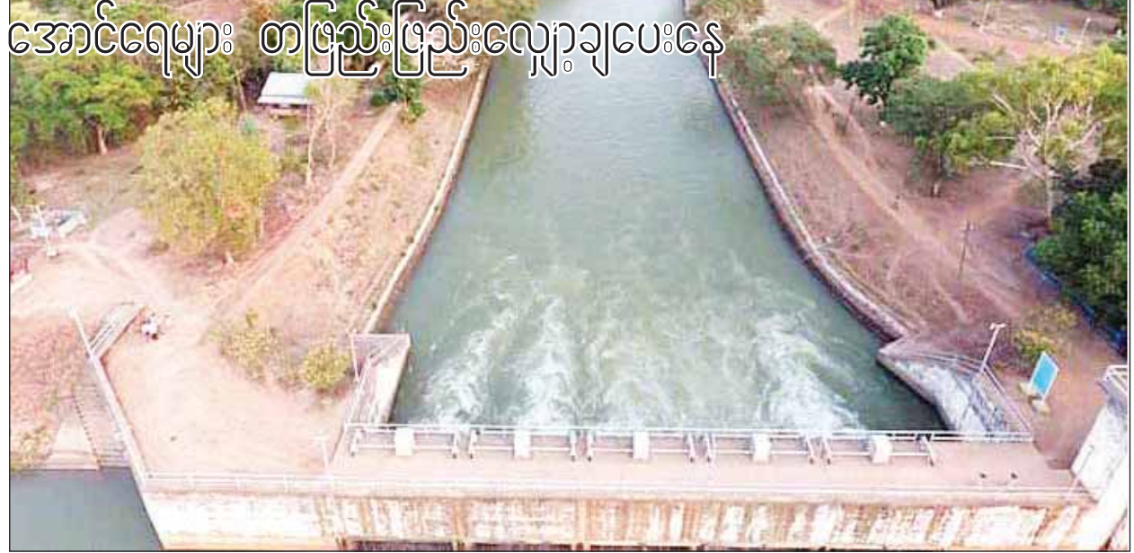
အောင်ရေများ တဖြည်းဖြည်းလျှော့ချပေးနေ