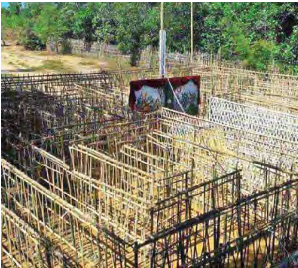
တိမ်မြုပ်ပျောက်ကွယ်လုနီးပါးဖြစ်နေသော ဝက်ပါပွဲ ရေရှိမြို့၌ ကျင်းပ