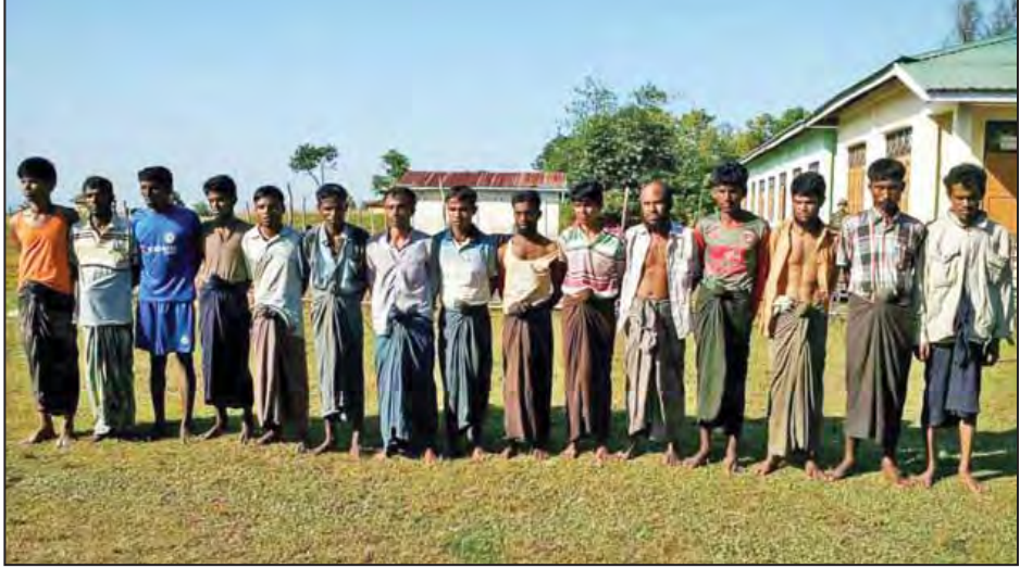
မောင်တောမြို့နယ်အတွင်း မသင်္ကာဖွယ် ဖမ်းဆီးရမိသူ အချို့ကို တွေ့ရစဉ်။

အလားတူ ယနေ့ ညနေ ၃ နာရီတွင် ရေတွင်းကျွန်း ကျေးရွာတွင် ရှင်းလင်းစဉ် တိုက်ပွဲဖြစ်ပွားပြီးနောက် တိမ်းရှောင်ထွက်ပြေးလာသည့် အခြားကျေးရွာများမှ ခွေလာ(ဘ)ရွာလာဟာ ဒူလာအပါအဝင် ၃၀ အား ထပ်မံ ဖမ်းဆီးရမိခဲ့သည်။ အဆိုပါ ဖမ်းဆီးရမိသူများအား တရားဥပဒေအရ စစ်ဆေးအရေးယူနိုင်ရေး ဆက်လက်ဆောင်ရွက်လျက် ရှိကြောင်း သတင်းရရှိသည်။ (မြဝတီ)