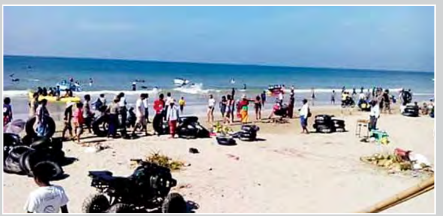
တန်ဆောင်မုန်းလပြည့်နေ့က ငွေဆောင်ကမ်းခြေတွင် လာရောက်အပန်းဖြေကြသည့် ခရီးသွားဧည့်သည်များဖြင့် အထူးစည်ကားလျက်ရှိသည်ကို တွေ့ရစဉ်။