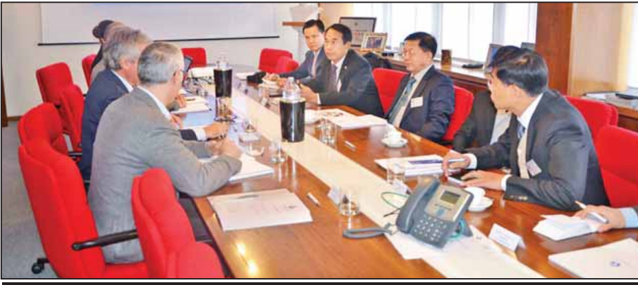
တပ်မတော်ကာကွယ်ရေးဦးစီးချုပ် ပိုလ်ချုပ်မှူးကြီးမင်းအောင်လှိုင်အား Goriziane Group ၏ President and Chief Executive Officer ဖြစ်သူ Mr. Pierluigi Zanin နှင့် တာဝန်ရှိသူများက ကုမ္ပဏီအစည်းအဝေးခန်းမ၌ ကုမ္ပဏီ၏ လုပ်ငန်းဆောင်ရွက်နေမှုအခြေအနေများကို ရှင်းလင်းပြောကြားစဉ်။ (သတင်းစဉ်)

နေပြည်တော် နိုဝင်ဘာ ၁၁ အီတလီနိုင်ငံ ဗင်းနစ်မြို့၌ ရောက်ရှိ နေသည့် တပ်မတော်ကာကွယ်ရေး ဦးစီးချုပ် ပိုလ်ချုပ်မှူးကြီး မင်းအောင်လှိုင်နှင့် အဖွဲ့သည် အီတလီနိုင်ငံဆိုင်ရာ မြန်မာနိုင်ငံ သံအမတ်ကြီး ဦးမြင့်နောင်နှင့်အတူ နိုဝင်ဘာ ၁၀ ရက် ဒေသစံတော်ချိန် နံနက် ၁၁ နာရီတွင် Gorizia ပြည်နယ် Villesse ရှိ Goriziane Group သို့ သွားရောက်လေ့လာသည်။ တပ်မတော်ကာကွယ်ရေးဦးစီး ချုပ်နှင့်အဖွဲ့ဝင်များအား ကုမ္ပဏီမှ တာဝန်ရှိသူများက အစည်းအဝေး ခန်းမ၌ လုပ်ငန်းဆောင်ရွက်နေမှု အခြေအနေများကို ရှင်းလင်း ပြောကြားပြီး စက်ရုံအတွင်းလှည့်လည် ကြည့်ရှုကြသည်။ မွန်းလွဲပိုင်းတွင် တပ်မတော်