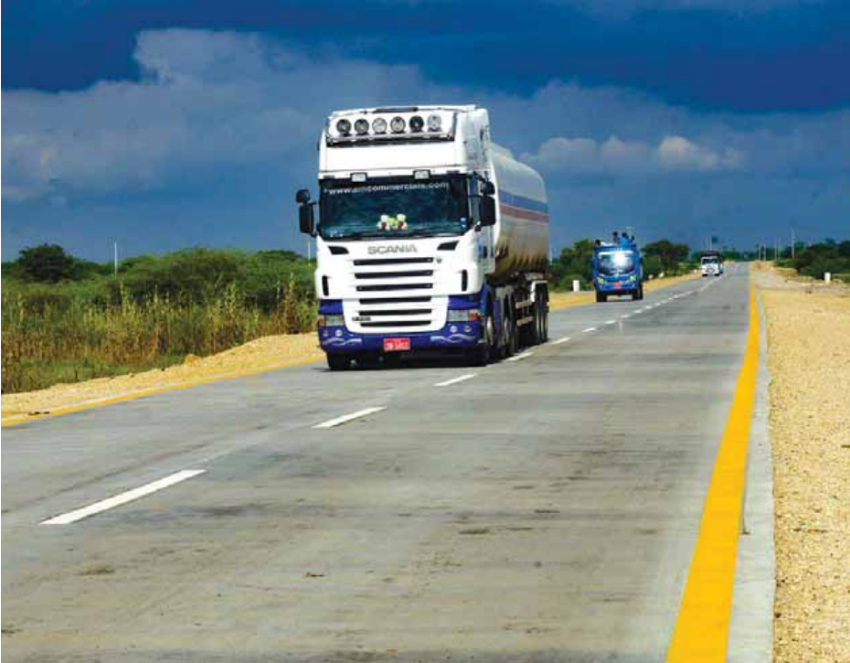
မိတ္ထီလာ နိုဝင်ဘာ ၁၁