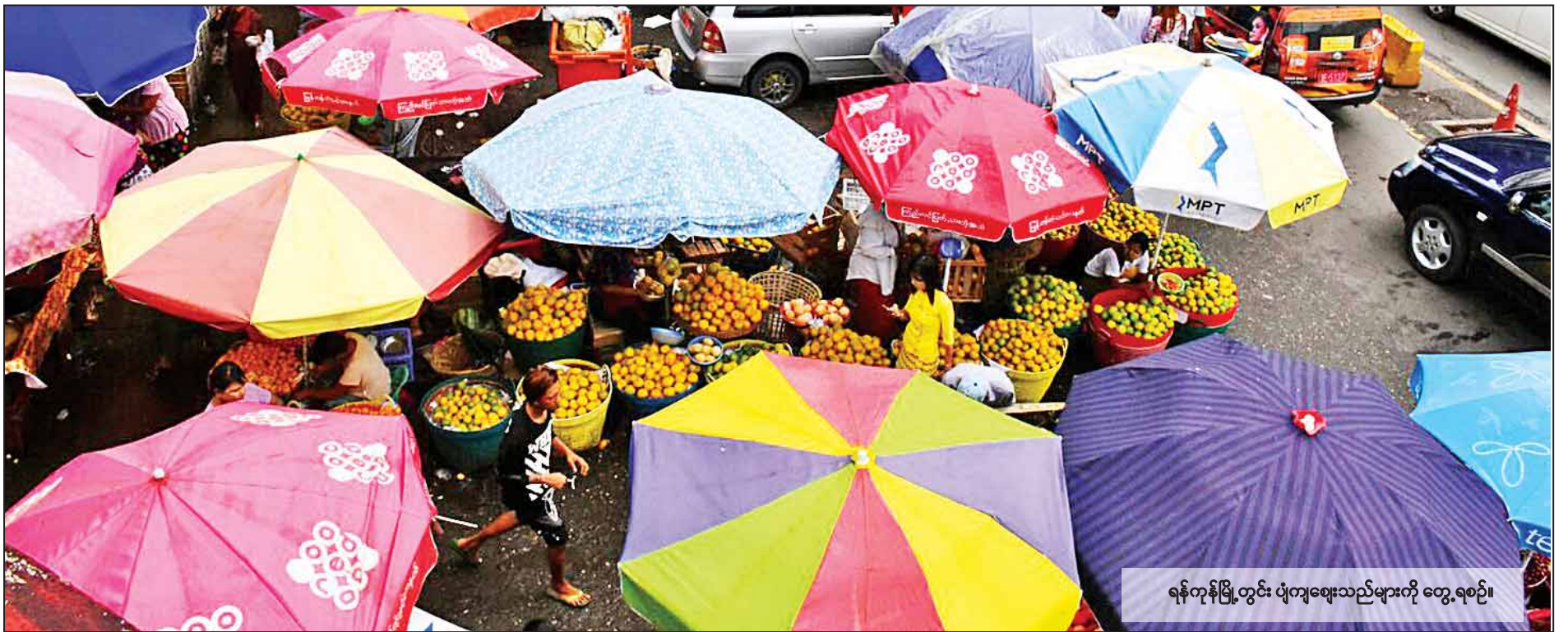
ရန်ကုန်မြို့တွင်း ပျံကျဈေးသည်များကို တွေ့ရစဉ်။