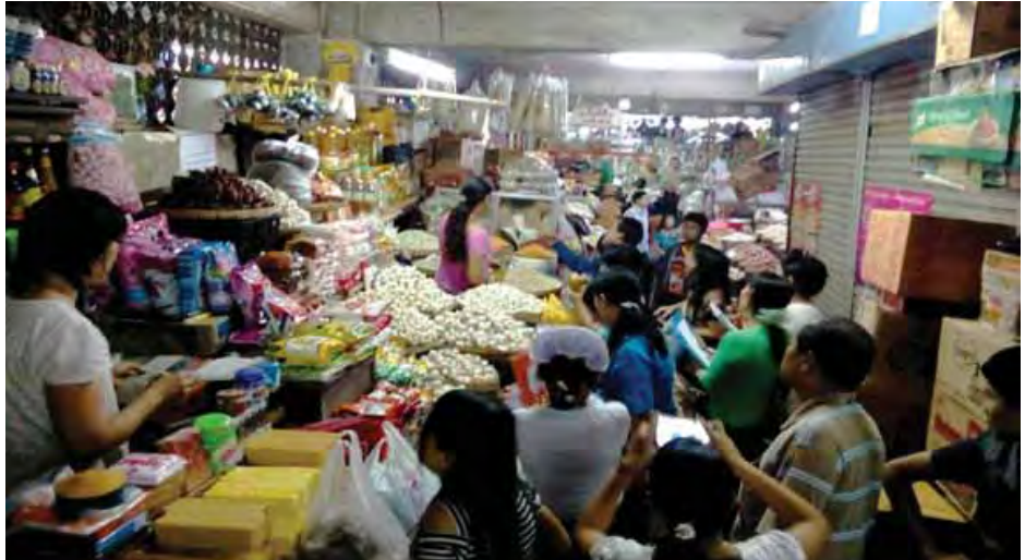
ဈေးများသို့ စားသုံးသူအကာအကွယ်ပေးရေးအတွက် ကွင်းဆင်းဆောင်ရွက်စဉ်။

သို့ပါ၍ကမ္ဘာတည်သရွေ့ မြန်မာပြည်သူများ သက်ရှည်ကျန်းမာစွာဖြင့် သက်တမ်းစေ့ထိုင်နိုင်ရေးအတွက် ကိုယ်နားမလည်သည့်စာသားများပါသော မုန့်ပဲသရေစာ၊ အချိုရည်များ မစားမသောက်ကြရေး၊ ပြန်ကြော်ဆီနှင့် ကြော်ထားသောအာလူးကြော်နှင့်အခြားဆီကြော်မုန့်များကို မစားသောက်ရေး၊ ရောင်စုံဓာတုဆိုးဆေးထိုးထားသော အစားအသောက်များ ဥပမာ- မျှစ်၊ တုတ်ထိုး၊ ယိုဖုံ၊ ငါးခြစ်၊ ချိုချဉ် စသည်များ၊ အစေးချွတ်ဆေးဖြင့် စိမ်ထားသော ပိန္နဲကွင်းများ မစားသောက်ရေး၊ ကော်ဖီမစ်များကို (အိတ်အခွံ၊ ပလတ်စတစ်၊ ကော်ဖွန်း) တို့ဖြင့် မဖျော်ဘဲ စတိုးဇွန်းဖြင့်သာဖျော်ပြီးမှ သောက်ရေး၊ ဆေးလိပ်၊ ကွမ်းယာ၊ အရက်၊ ဘီယာတို့ကိုရှောင်ရှားရေး၊ သီးနှံများမှည့်စေရန်အတွက် ရော်ဘာပင်များတွင်အသုံးပြုသော အီသလဲဆေးစိမ်ထားသည့် အသီးအနှံများကိုမစားရေး၊ နူးပြီး ခရမ်းချဉ်သီးများ အရောင်အမြန်တက်စေရန် (ETN) ပိုးသတ်ဆေးဖျန်းထားသော ရဲရဲတောက်အသီးများ မစားရေး၊ ကွမ်းရွက်များကိုပျော့စေရန်အတွက် ဖျူရာဒန် (3G) စိမ်ထားတာတွေကို မစားရေး၊ ကွမ်းသီးများ မှိုမတက်စေရန်အတွက် ကန့်နှင့်မိုင်းတိုက် ထားတာတွေကို မစားရေး၊ ငါးပိ၊ ငါးခြောက်များတွင် ယင်မနားစေရန်အတွက် ယင်မနားဆေးသုံးထားတာတွေမစားရေး၊ လူသေကောင်များ အနံ့မထွက်စေရန်နှင့် မပုပ်မသိုးစေရန်အတွက် အသုံးပြုသော ဖော်မလင်ဆေးများ သုံးထားသည့်အသား၊ ငါးများ၊ ပဲပြား၊ မုန့်ဟင်းခါးဖတ်များကို မစားရေးစသည့် အချက်များကို လိုက်နာကာ အသိတရားလက်ကိုင်ထားပြီး သတိထားစားသောက်ကြရေးအတွက် စားသုံးသူရေးရာဦးစီးဌာနမှ ကွင်းဆင်း၍ အသိပညာပေးလုပ်ငန်းများကို ပြည်တွင်း၊ ပြည်ပ အသိပညာရှင်၊ အတတ်ပညာရှင်၊ လုပ်ငန်းရှင်၊ အသင်းအဖွဲ့၊ သက်ဆိုင်ရာဌာနများနှင့် ပူးပေါင်းကာ ဆောင်ရွက်လျက်ရှိသဖြင့် စားသုံးသူပြည်သူများကလည်း ပူးပေါင်းပါဝင်ကြပါရန် တိုက်တွန်းဖော်ပြအပ်ပါသည်။ ။