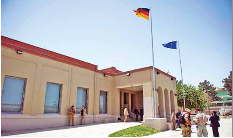
ပုံးခွဲတိုက်ခိုက်ခြင်းမခံရမီ အာဖဂန်နစ္စတန်နိုင်ငံမြောက်ပိုင်း မာဇာအီရှရစ်မြို့ရှိ ဂျပန်ကောင်စစ်ဝန်ရုံးကို တွေ့ရစဉ်။