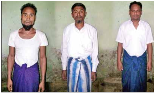
ဖမ်းဆီးရမိ မသင်္ကာဖွယ် ဘင်္ဂါလီ မာမတ်အာလောင် ၅၂နှစ်(ဘ) မော်ဟီအာမတ်၊ ဒီမိုဟာမက် ၄၃နှစ်(ဘ) မူဆာဟာလီ၊ မော်လီဆော်ပီဟာလောင် ၃၅ နှစ်(ဘ)မူလာဟူစိန်။ (မသစ/ရသစ)