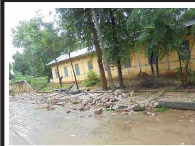
မန္တလေးတိုင်းဒေသကြီး မြင်းခြံခရိုင် တောင်သာမြို့တွင် နိုဝင်ဘာ ၁၀ ရက် နံနက် ၃ နာရီခန့်က မိုးရေချိန် ၃ ဒသမ ၉၅ လက်မ မိုးများ ရွာသွန်းနေစဉ် တောင်သာ အထကကျောင်း မြောက်ဘက် ရှိအကျယ် မြောက်ပေါ် အမြင့် မြောက်ပေါ်ရှိ အုတ်တံတိုင်းများ အုတ်နံရံ အခန်း ၅၀ ကျော် ခန့် ဖြိုကျ ဖျက်စီးခဲ့သည်။ သတင်းနှင့်စာတတ်ပုံ (တောင်သာမြန်/ဆက်)

ယင်းနောက် တက်ရောက်လာကြသော ဒေသခံပြည်သူများက လိုအပ်ချက်များကို ပြန်လည်ဆွေးနွေးရာ ဆွေးနွေးချက်များအပေါ် စက်မှုဇုန်တည်ဆောက်ရေးကော်မတီဝင် မြို့နယ်အုပ်ချုပ်ရေးမှူးနှင့် လွှတ်တော်ကိုယ်စားလှယ်တို့က ပြန်လည်ရှင်းလင်းဖြေကြားခဲ့ကြသည်။ မြို့နယ်မြန်/ဆက်