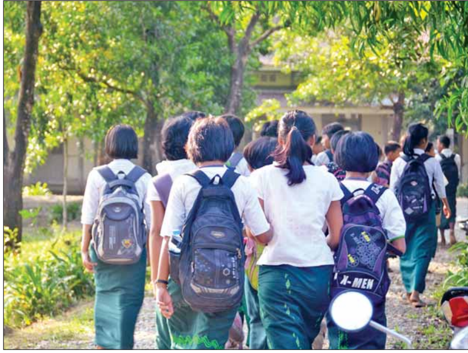
ကျောင်းသား ကျောင်းသူများဖြင့် အသက်ဝင်လျက်ရှိနေသည့် ဘူးသီးတောင်အထက်တန်းကျောင်း။

ဆောင်းပါး-ကိုကိုသက်နှင့်အဖွဲ့