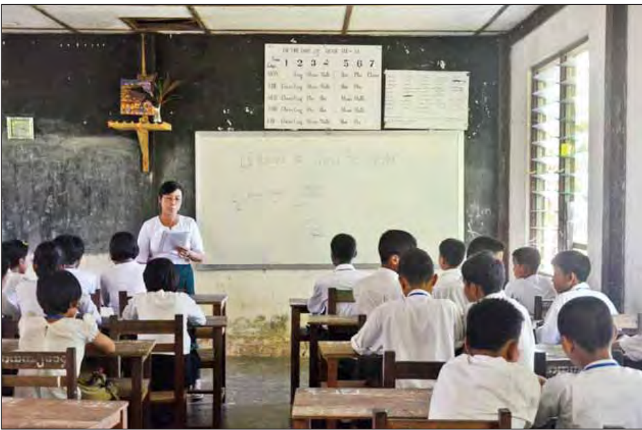
ဘူးသီးတောင်အထက်တန်းကျောင်းတွင် ကျောင်းသား ကျောင်းသူများ စာသင်ကြားနေစဉ်။

ဦးအောင်ဇံကျော်က “ကျွန်တော်အပါအဝင် ဒီကျောင်းမှာအထက်တန်း၊ အလယ်တန်း၊ မူလတန်းဆရာ