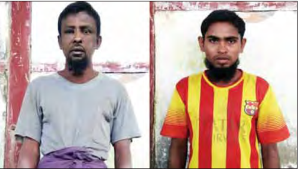
ပေါက်နိုင်ရေး တရားဥပဒေနှင့်အညီ လွှဲပြောင်းအပ်နှံခဲ့ကြောင်း သတင်း အရေးယူဆောင်ရွက်နိုင်ရေးအတွက် ရရှိသည်။ (မြဝတီ)