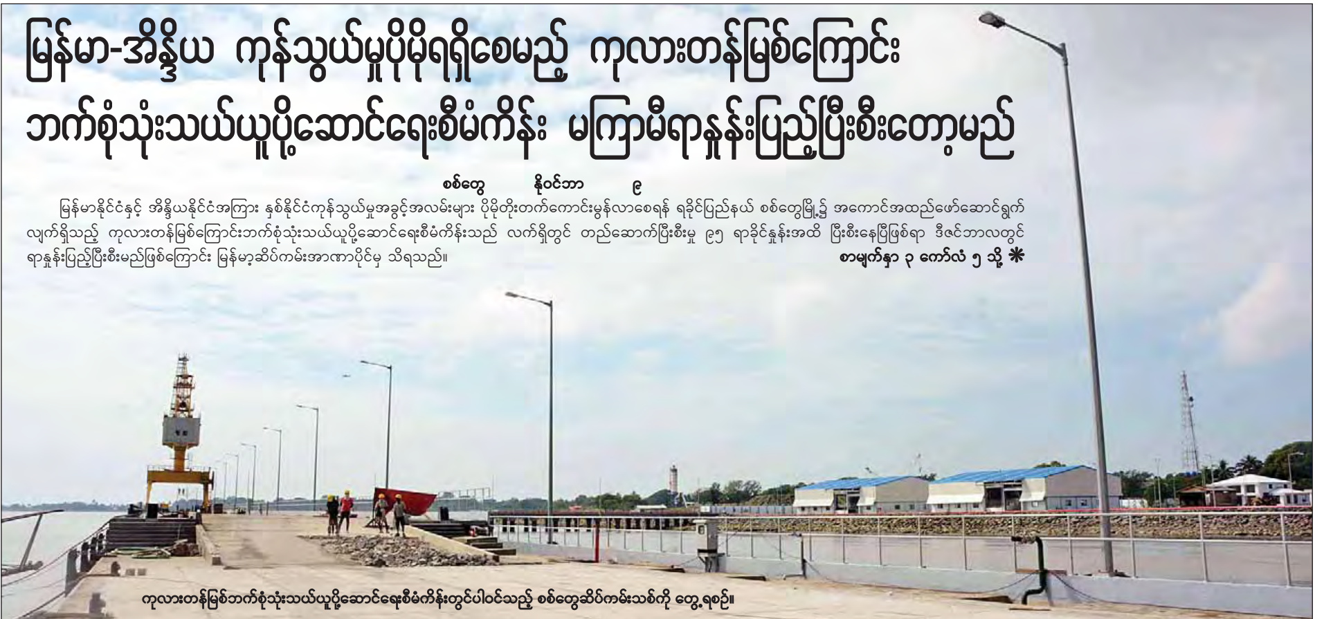
ကုလားတန်မြစ်ဘက်စုံသုံးသယ်ယူပို့ဆောင်ရေးစီမံကိန်းတွင်ပါဝင်သည့် စစ်တွေဆိပ်ကမ်းသစ်ကို တွေ့ရစဉ်။