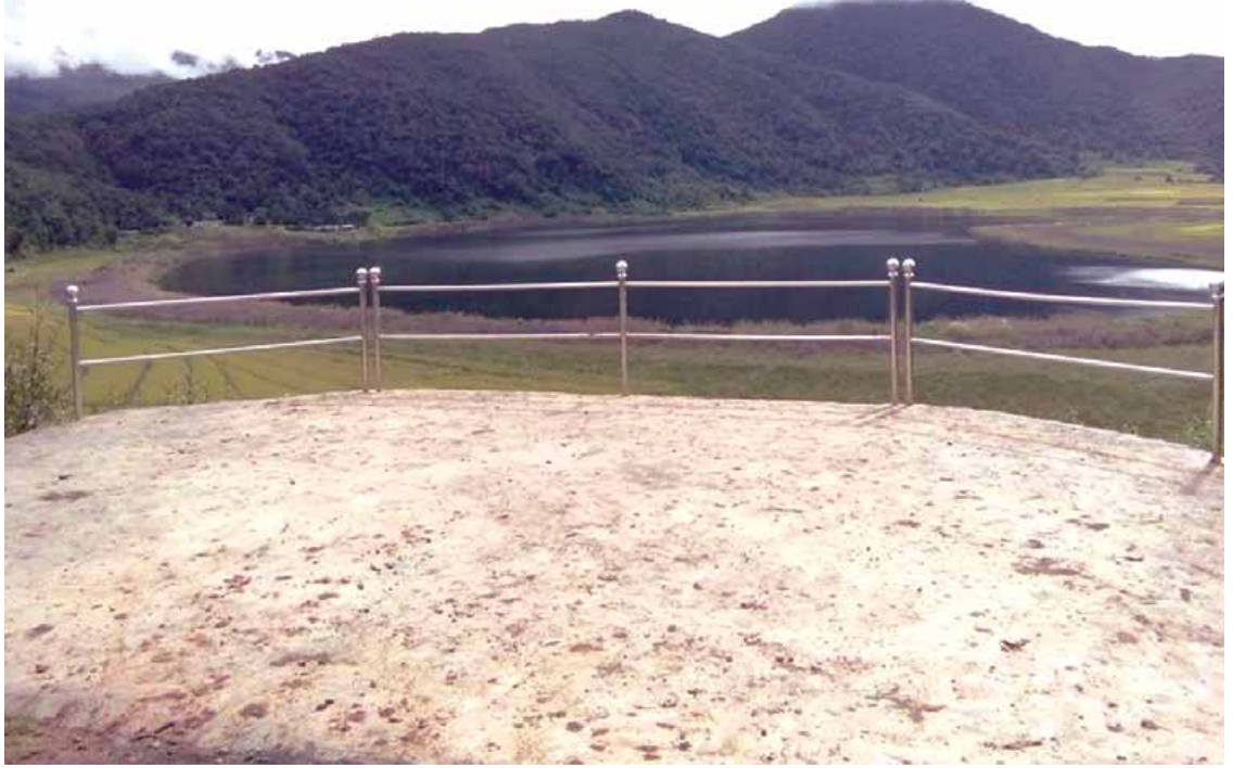
ရေစီးမဝင်ဘဲ မိုးရာသီတွင် ကန်ရေပြင်ကြည့်လင်၍ ဆောင်းနှင့်ထန်သည့်အချိန်တွင် ကန်ရေပြင် ရဲရဲလျက် ရေနေောက်မှု မရှိသော်လည်း နှစ်စဉ်နှစ်တိုင်း ဒီဇင်ဘာလကုန်ပိုင်း အအေးဆုံးကာလတွင် ၇ ရက်မှ ၁၀ ရက်ခန့်အထိ ရေကန်မှ ရေများ အလိုအလျောက်နောက်ကျသည့် အချိန်ရှိခြင်း၊ ရီခေါဒါရီမြို့ရှိ ရေကန်မှ ရေကိုခပ်ယူပြီး အခြားအရပ်ဒေသသို့ယူဆောင်ပါက အဆိုပါရေသည် ရီခေါဒါရီမြို့နောက်ကျနေချိန်တွင် ခပ်ယူသော

ရီခေါဒါရီမြို့အံ့ဩဖွယ်ထူးခြားမှုများမှာ စတင်တွေ့ရှိသည့်အချိန်မှ ယခုအချိန်အထိ ရေကန်၏ ရေအတိမ် အနက်နှင့် အကျယ်အဝန်းများ ပြောင်းလဲခြင်းမရှိဘဲ ပကတိအတိုင်း တည်ရှိတည်မြဲနေခြင်း၊ ခြောက်သွေ့မြင့်မားသော တောင်တန်းများကြားတွင် ရေကန်ကြီးဖြစ်ပေါ်လာခြင်း၊ ချောင်းရေမြောင်း