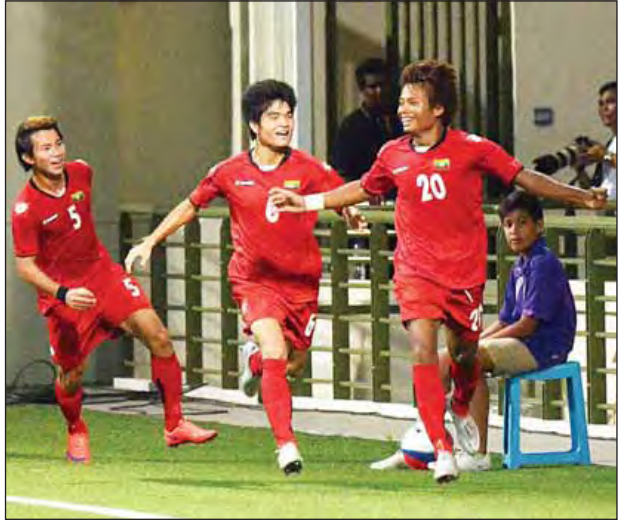
ယခုဖွဲ့စည်းခဲ့သည့် မြန်မာယူ-၂၂ အသင်းတွင် ပါဝင်လာသည့် ၂၀၁၅ ဆီးဂိမ်း ငွေဆုရအသင်းမှ ကစားသမားများ။

ရန်ကုန် နိုဝင်ဘာ ၉ ၂၀၁၇ ခုနှစ်အတွင်း ယှဉ်ပြိုင်ရမည့် ဆီးဂိမ်းပြိုင်ပွဲ၊ အာရှယူ-၂၃ ခြေစစ်ပွဲ၊ ၂၀၁၆ ဒီဇင်ဘာလတွင် ယှဉ်ပြိုင်ရမည့် နိုင်ငံတကာပြိုင်ပွဲနှင့် ခြေစမ်းပွဲတို့အတွက် မြန်မာယူ-၂၂ အသင်းကို ဖွဲ့စည်းလိုက်ပြီဖြစ်ပြီး ၂၀၁၅ ယူ-၂၀ ကမ္ဘာ့ဖလားပြိုင်ပွဲနှင့် ၂၀၁၅ ဆီးဂိမ်းပြိုင်ပွဲ ငွေတံဆိပ်ဆုရအသင်းမှ ကစားသမားအများစု ပါဝင်လာသည်။ စာမျက်နှာ ၃ ကော်လံ ၁ သို့ ○