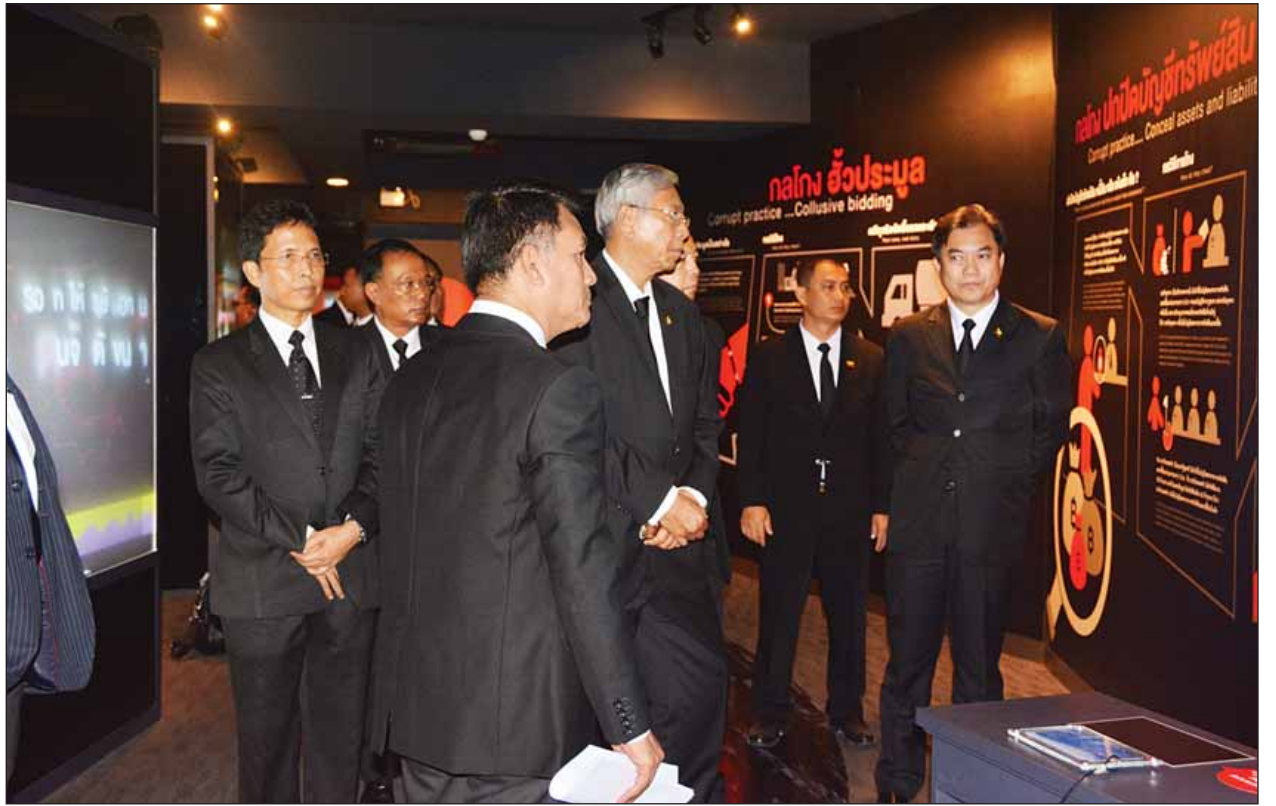
နိုင်ငံတော်သမ္မတ ဦးထင်ကျော် ထိုင်းနိုင်ငံ ဘန်ကောက်မြို့ရှိ အဂတိလိုက်စားမှုတိုက်ဖျက်ရေးပြတိုက်၌ ကြည့်ရှုလေ့လာစဉ်။ (သတင်းစဉ်)