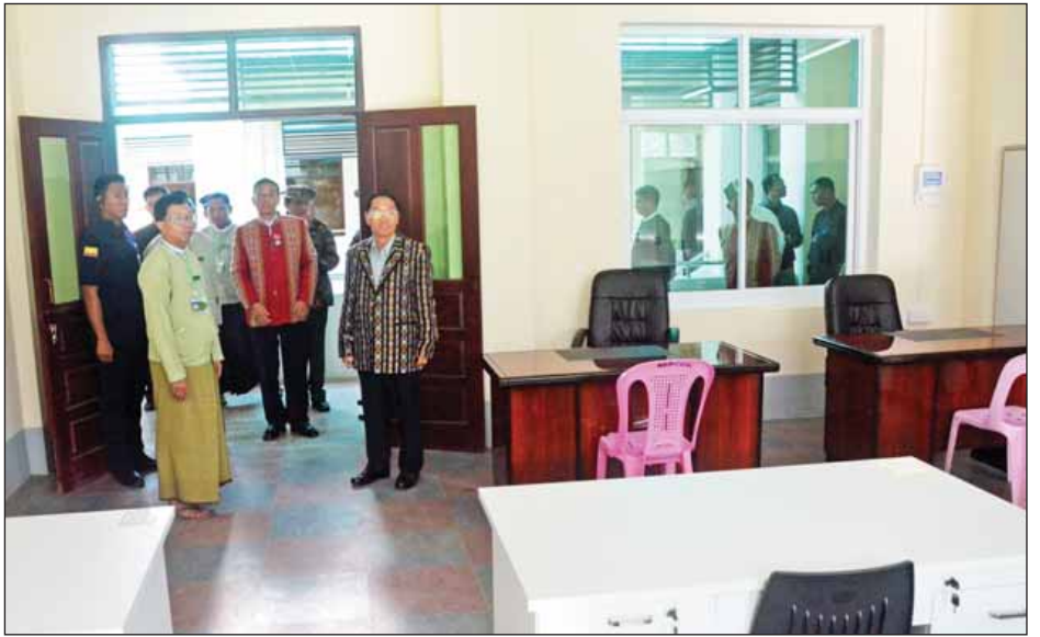
ဟားခါးမြို့စုပေါင်းရုံးအတွင်း ဒုတိယသမ္မတ ဦးမြင့်ဆွေ လှည့်လည်ကြည့်ရှုစဉ်။ (သတင်းစဉ်)

ဦးမြို့ချိုတို့က စုပေါင်းရုံးကို ဖဲကြီးမြတ်ဖွင့်လှစ်ပေးကြသည်။ ထို့နောက် ဒုတိယသမ္မတက စုပေါင်းရုံးဆိုင်းဘုတ်ကို စက်ခလုတ်နှိပ်ဖွင့်လှစ်ပေးပြီး ရုံးအတွင်း လှည့်လည်ကြည့်ရှုကြသည်။ ဆက်လက်၍ ဒုတိယသမ္မတနှင့်အဖွဲ့သည် ဟားခါးကောလိပ်ဖွင့်ပွဲအခမ်းအနားသို့ တက်ရောက်ကြသည်။ အခမ်းအနားတွင် ပြည်ထောင်စုဝန်ကြီး ဒေါက်တာမျိုးသိမ်းကြီး၊ ပြည်နယ်ဝန်ကြီးချုပ် ဆလင်းလျန်လွယ်နှင့် စာမျက်နှာ ၈ ကော်လံ ၁ သို့ *