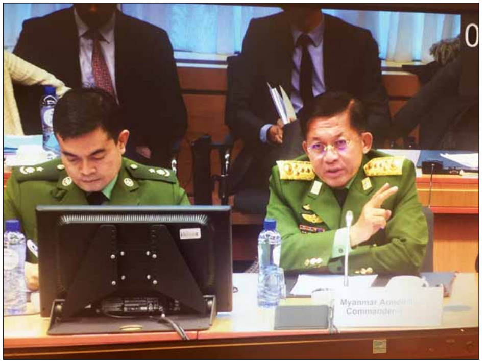
တပ်မတော်ကာကွယ်ရေးဦးစီးချုပ် ဗိုလ်ချုပ်မှူးကြီးမင်းအောင်လှိုင် ဥရောပသမဂ္ဂ စစ်ဘက်ကောင်စီအစည်း အဝေးသို့ တက်ရောက်မိန့်ခွန်းပြောကြားစဉ်။ (သတင်းစဉ်)