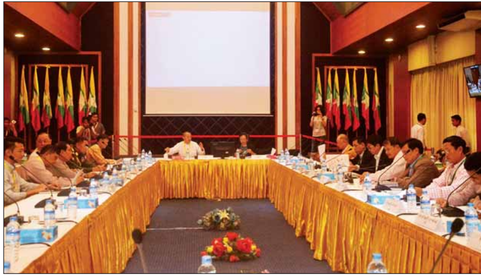
တစ်ဖက်သတ်ရေးလို့မရသလို အားလုံးစုပေါင်းပြီး သဘော တူညီမှုနဲ့ ရေးသားပြီးတော့ အကောင်အထည်ဖော်ရတာ ဖြစ်တယ်ဆိုတာကို ရှင်းပြရတာပါ။ ကျွန်တော်တို့ JMC

“လက်ရှိ JMC ရဲ့လုပ်ဆောင်နေတဲ့ လုပ်ငန်းပိုင်း အပေါ်မှာ သူတို့အနေနဲ့ မရှင်းလင်းတာတွေကို မေးမြန်းကြ တယ်။ အဓိကအနေနဲ့ ကျွန်တော်တို့ပြန်ရှင်းပြရတာက တော့ JMC လုပ်ငန်းတွေအားလုံးဟာ အစိုးရအနေနဲ့