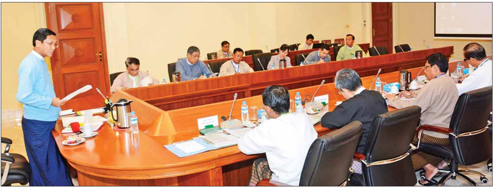
ဒုတိယသမ္မတ ဦးဟင်နရီဗန်ထီးယူ ဒေသအလိုက် ဖြစ်ပေါ်နေသည့် လယ်ယာထုတ်ကုန်ဈေးနှုန်းကြောင့် တောင်သူလယ်သမားများ ထိခိုက်နစ်နာမှုနည်းပါးစေရေး ညှိနှိုင်းအစည်းအဝေးတွင် အမှာစကားပြောကြားစဉ်။ (သတင်းစဉ်)

နေပြည်တော် နိုဝင်ဘာ ၉ ဒေသအလိုက် ဖြစ်ပေါ်နေသည့် လယ်ယာထုတ်ကုန်ဈေးနှုန်းကြောင့် တောင်သူလယ်သမားများ ထိခိုက်နစ်နာမှုနည်းပါးစေရေး ညှိနှိုင်းအစည်းအဝေးကို ယနေ့မွန်းလွဲ ၂ နာရီတွင် နိုင်ငံတော်သမ္မတရုံး အစည်းအဝေးခန်းမ၌ ကျင်းပရာ တောင်သူလယ်သမား အခွင့်အရေး ကာကွယ်ရေးနှင့် အကျိုးစီးပွားမြှင့်တင်ရေး ဦးဆောင်အဖွဲ့ အဖွဲ့ခေါင်းဆောင် ဒုတိယသမ္မတ ဦးဟင်နရီဗန်ထီးယူ တက်ရောက်အမှာစကား ပြောကြားသည်။