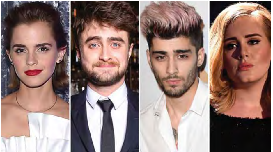
နိုင်ငံတကာအနုပညာရှင်များစာရင်းမှာတော့ အမေရိကန် ပေါ့ပ်အဆိုတော် တေးလာဆွစ်က ထိပ်ဆုံးမှ ရပ်တည်ခဲ့ကာ သူ့ရဲ့ဝင်ငွေဟာ အဲဒီလိုဝင်ငွေထက် နှစ်ဆကျော်များပြီး ဝင်ငွေ ပေါင် ၁၉၂ သန်းခန့် ရရှိခဲ့တာလို့လည်း သိရပါတယ်။

မင်းသား ဒန်နီရယ်ရက်ဒ်ကလစ်ဖ်ဖြစ်ကာ သူကတော့ ဝင်ငွေပေါင် ၇၄ သန်းခန့် ရရှိခဲ့တာဖြစ်ပါတယ်။ တတိယနေရာကို ပိုင်ဆိုင်ထားနိုင်ခဲ့တဲ့အနုပညာရှင် ကတော့ ပြိုင်နိုပေါ့ပ်အဆိုတော် အက်ဒီရီနိုဖြစ်ပြီး ပေါင် ၄၅ သန်းခန့် ဝင်ငွေရရှိခဲ့တာဖြစ်ပါတယ်။