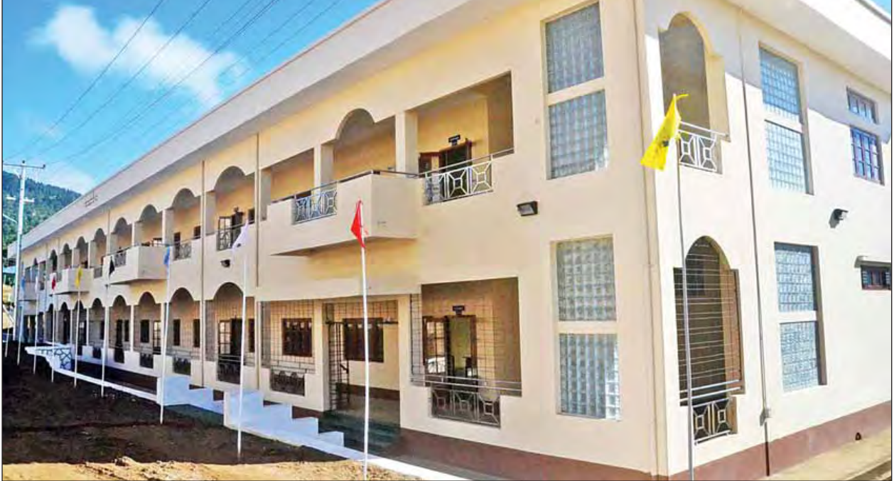
ဟားခါးကောလိပ်အဆောင်(၁)ကို တွေ့ရစဉ်။ (သတင်းစဉ်)